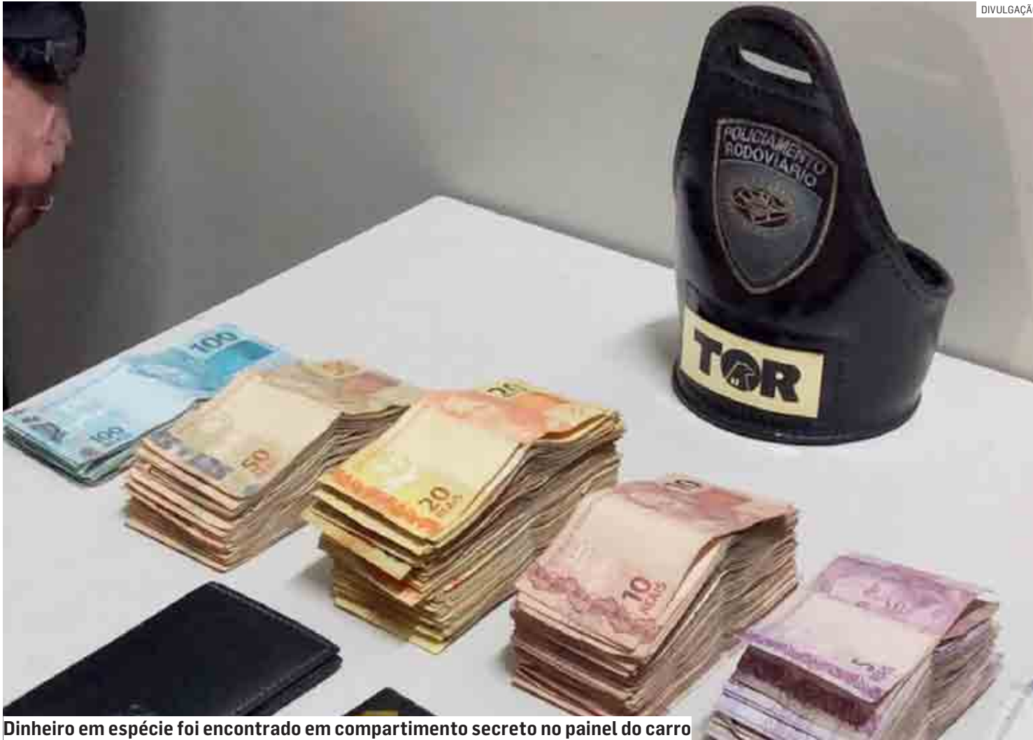
Dinheiro em espécie foi encontrado em compartimento secreto no painel do carro

Acusado foi abordado quando se dirigia para Hortolândia; ele ofereceu R$ 3 mil aos policiais para não ser preso