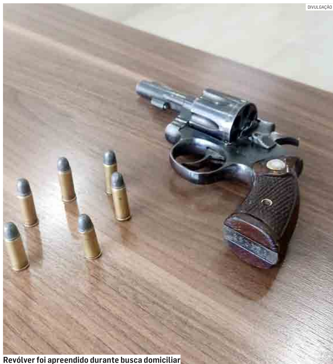
Revólver foi apreendido durante busca domiciliar

O homem foi conduzido ao 2º Distrito Policial de Sumaré, onde foi preso pelo crime de posse irregular de arma de fogo. Ele foi recolhido à carceragem, permanecendo à disposição da Justiça.