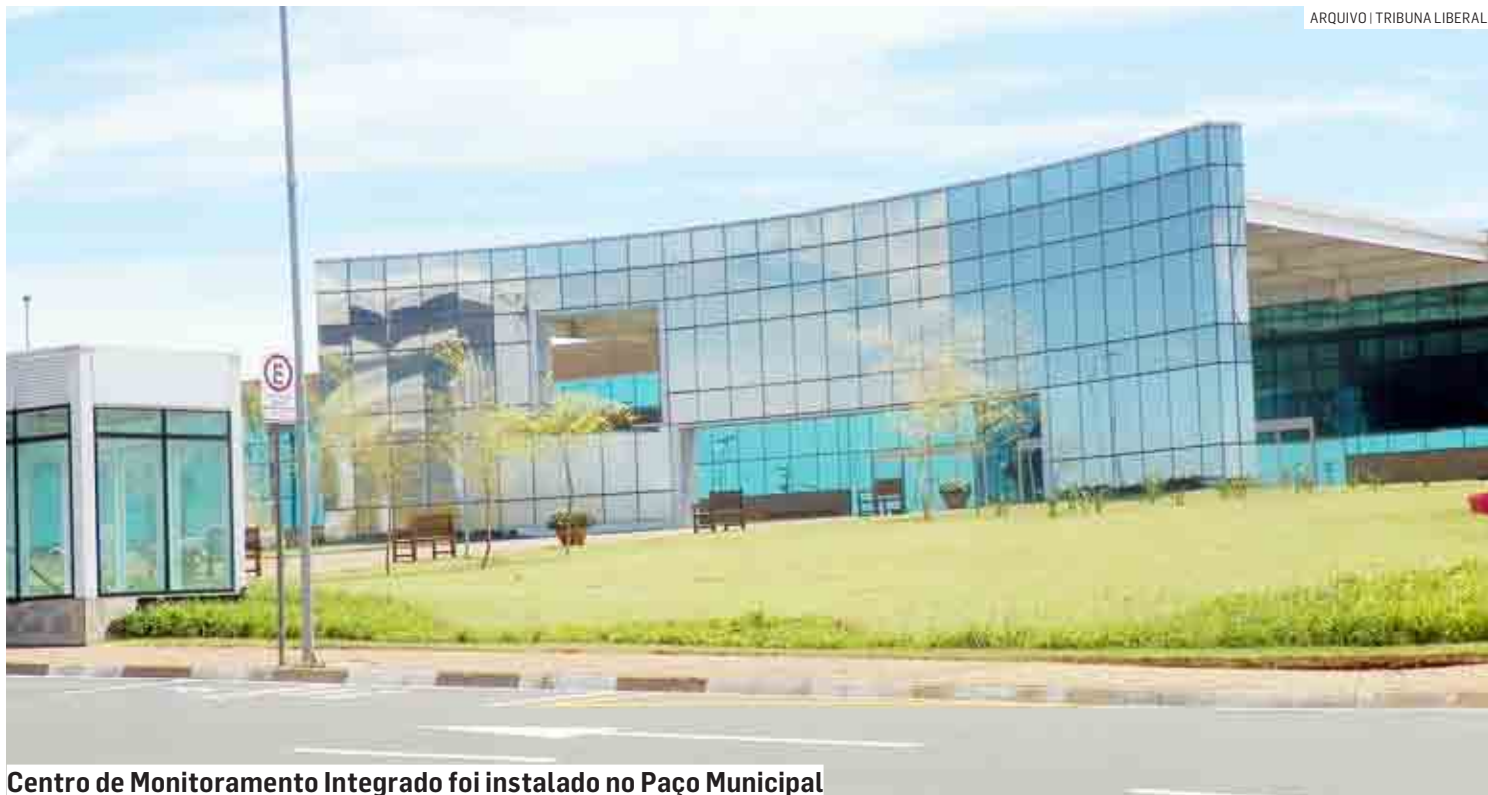
Centro de Monitoramento Integrado foi instalado no Paço Municipal

utilização de câmeras de vigilância é possível reduzir, em média, 70% dos índices de criminalidade referentes a ocorrências de furtos e roubos. Esta média pode sofrer variações conforme a quantidade de câmeras de vigilância que são instaladas nos municípios”, afirmou o secretário.