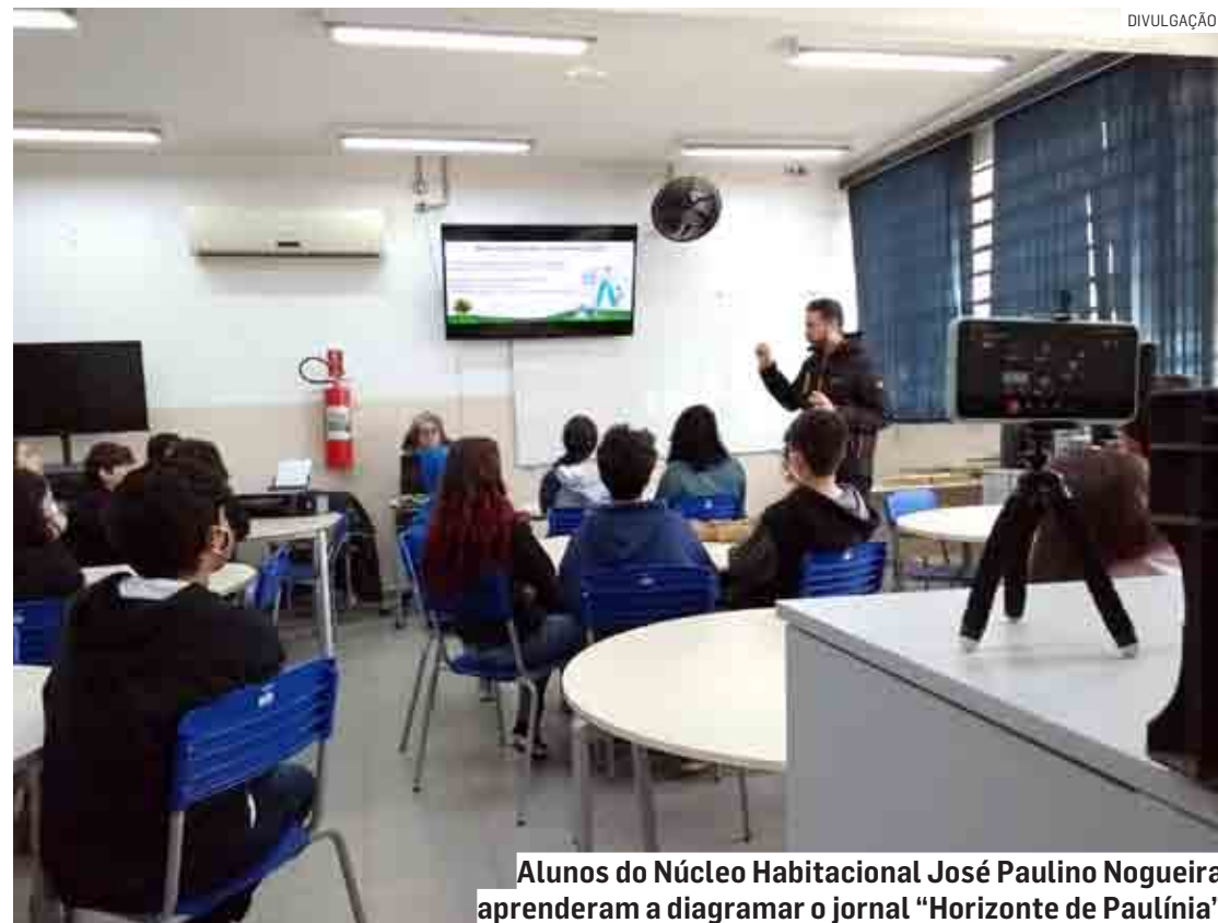
Alunos do Núcleo Habitacional José Paulino Nogueira aprenderam a diagramar o jornal “Horizonte de Paulínia”

Inspirado nos ODS (Objetivos de Desenvolvimento Sustentável) da ONU, o projeto Caminhos da Sustentabilidade busca estimular alunos e professores de escolas públicas a propor soluções de desenvolvimento sustentável por meio da produção de ma-