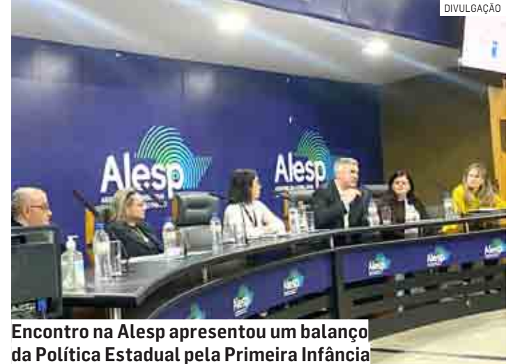
Encontro na Alesp apresentou um balanço da Política Estadual pela Primeira Infância