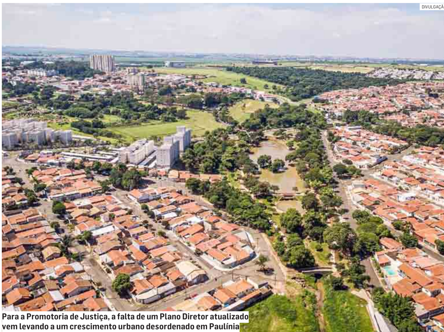
Para a Promotoria de Justiça, a falta de um Plano Diretor atualizado vem levando a um crescimento urbano desordenado em Paulínia

Decisão atinge loteamentos, condomínios e indústrias; multa diária em caso de descumprimento é de R$ 20 mil, até o limite de R$ 20 milhões