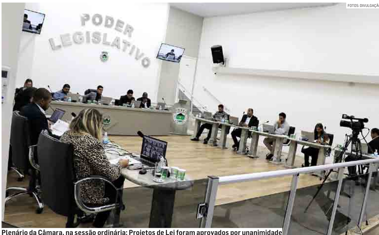
Plenário da Câmara, na sessão ordinária: Projetos de Lei foram aprovados por unanimidade

O Projeto 104, que inclusive havia passado por uma audiência pública, garante verba de R$ 2,45 milhões; o 121, R$ 3,1 milhões; e o 123, R$ 4,29 milhões, a partir da abertura de créditos adicionais para a secretaria de Saúde.