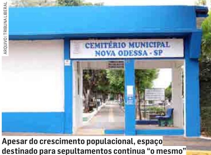
Apesar do crescimento populacional, espaço destinado para sepultamentos continua “o mesmo”

No requerimento de instauração os autores informam que Nova Odessa dispõe de apenas um cemitério municipal, “muito antigo” e que está ins-