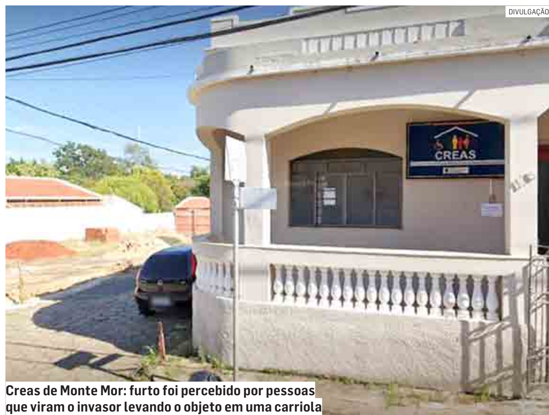
Creas de Monte Mor: furto foi percebido por pessoas que viram o invasor levando o objeto em uma carriola