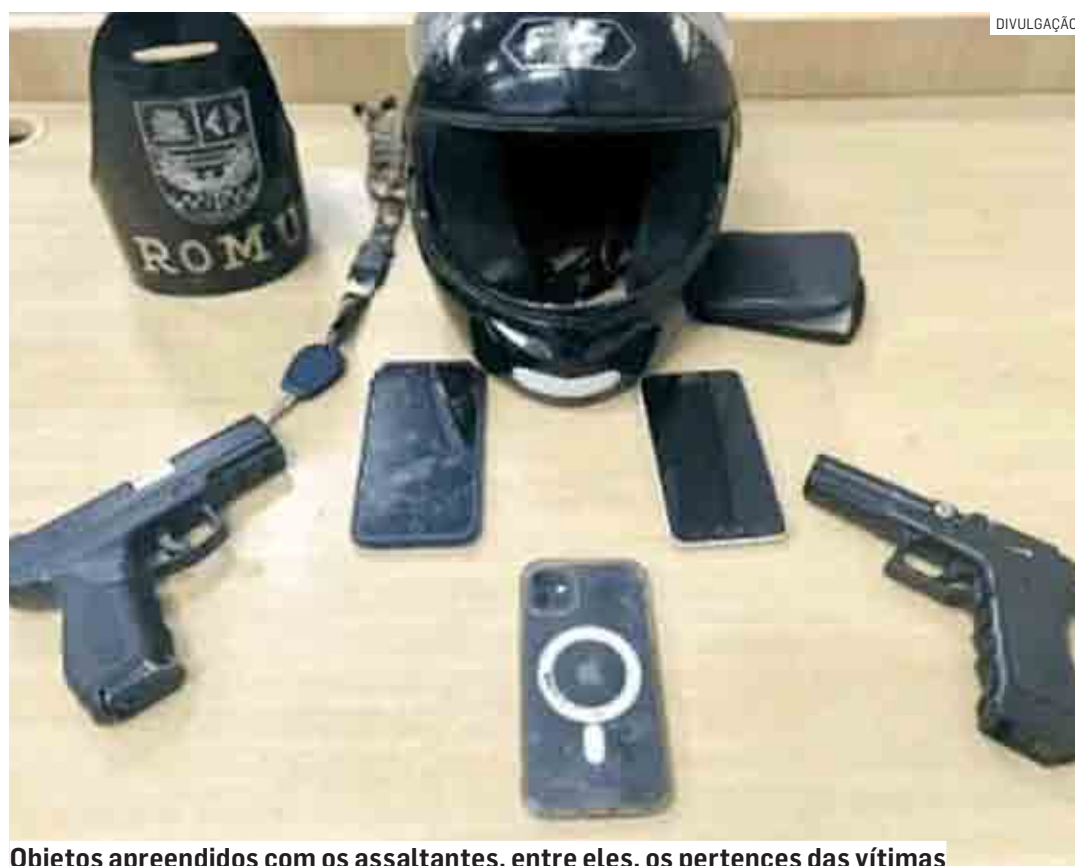
Objetos apreendidos com os assaltantes, entre eles, os pertences das vítimas

A vítima relatou a violência do grupo durante a ação criminosa. "O assaltante já desceu do veículo apontando a arma em direção da cara e chutando, exigindo o celular e dinheiro. Daí passei meu celular e ele foi até minha namorada e pediu a carteira. Ela pediu para dei-