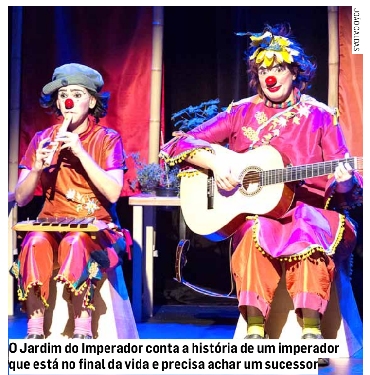
O Jardim do Imperador conta a história de um imperador que está no final da vida e precisa achar um sucessor

No final do espetáculo, as crianças são convidadas a visitar o jardim do imperador, para tocar e cheirar essas plantas, estimuladas pela fantasia da história. Nessa hora inicia-se uma rica conversa das palhaças com as crianças e adultos do público, que trocam seus conhecimentos e lembranças, herdados das avós, das receitas caseiras, adormecidos na memória. E por fim, as personagens oferecem uma semente para cada criança para que ela cultive em sua própria casa o seu jardim.