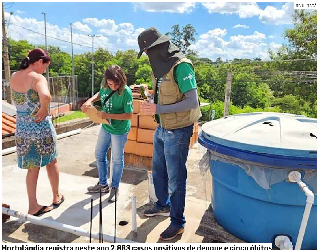
Hortolândia registra neste ano 2.883 casos positivos de dengue e cinco óbitos

Nas visitas, os agentes também dão orientações aos moradores sobre como evitar a reprodução do mosquito. Eles ainda questionam se algum ocupante da casa apresentou ou está com algum sintoma de uma das doenças transmitidas pelo vetor. Em ca-