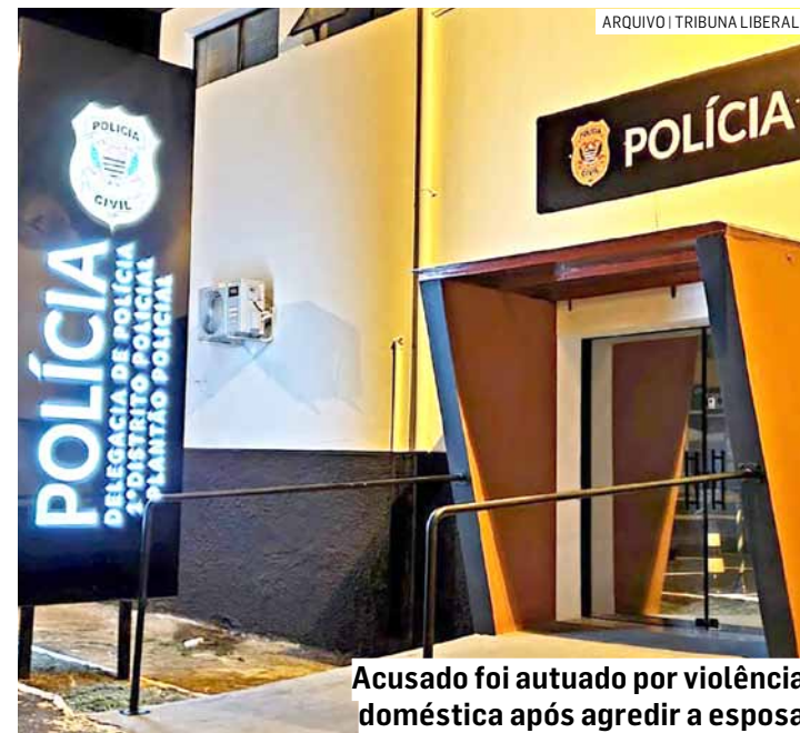
Acusado foi autuado por violência doméstica após agredir a esposa

Em contato com a vítima, ela contou que tinha sido agredida pelo seu marido e mostrou as marcas da violência no