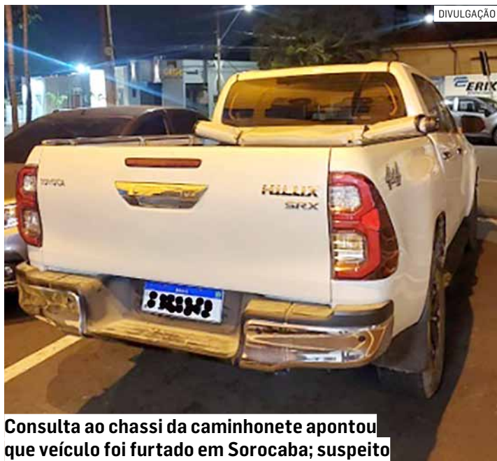
Consulta ao chassi da caminhonete apontou que veículo foi furtado em Sorocaba; suspeito

A equipe, ao consultar o emplacamento, constou veículo regular, porém ao consultar o chassi foi constatado que a Hilux era produto de furto pela cidade