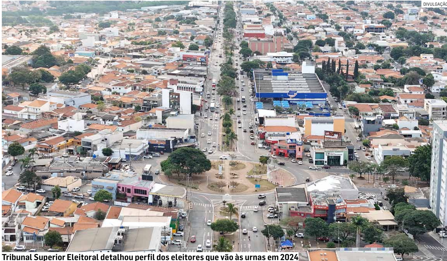
Tribunal Superior Eleitoral detalhou perfil dos eleitores que vão às urnas em 2024

Contudo, um dos grandes desafios para Sumaré é o alto percentual de eleitores analfabetos e aqueles que apenas lêem e escrevem. Dados do TSE (Tribunal Superior Eleitoral) revelam que 3,5% dos eleitores, ou cerca de 7,2 mil pessoas, são analfabetos, enquanto 5,7%, ou aproximadamente 11,7 mil votantes, possuem