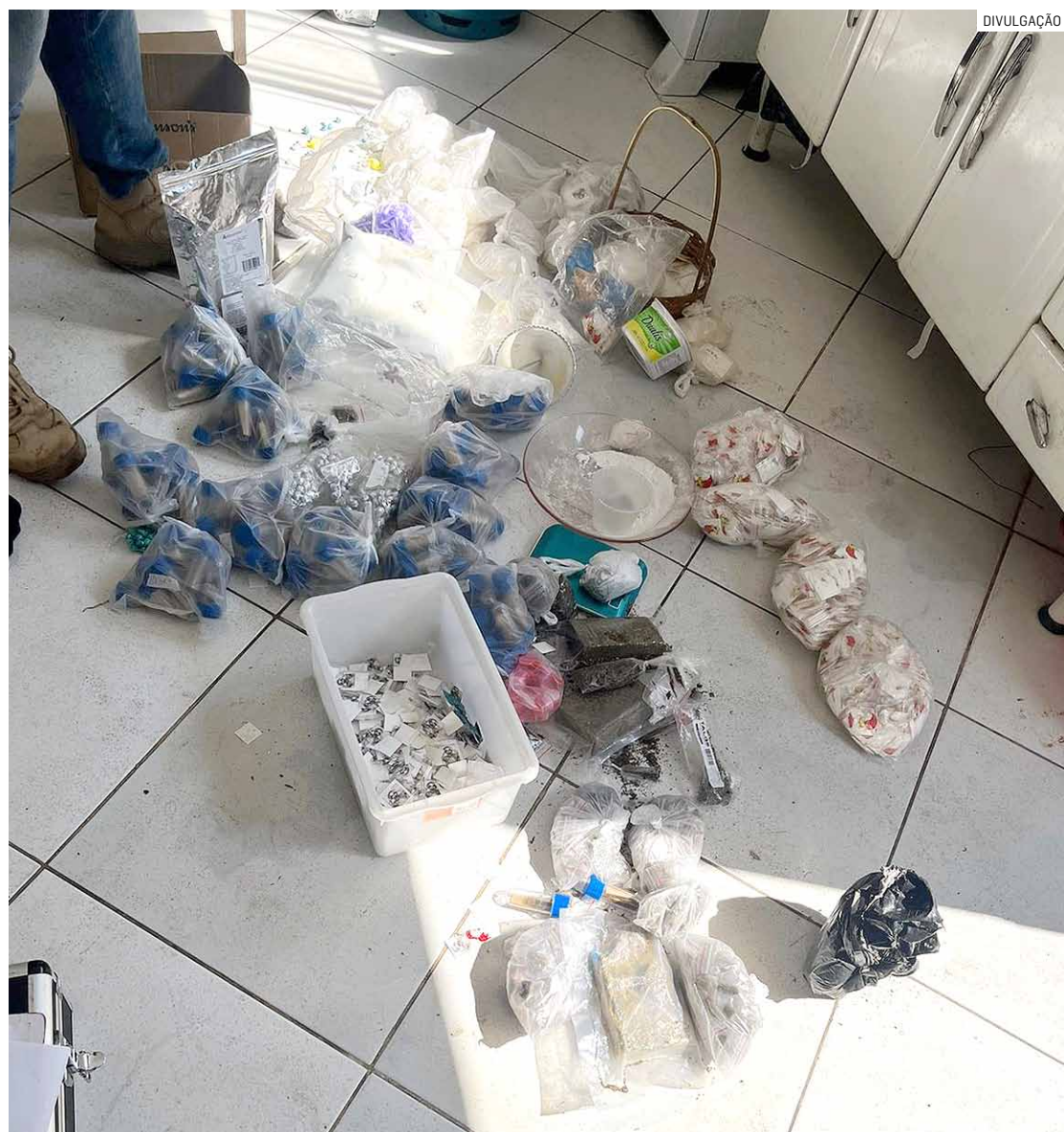
Na residência do acusado, polícia encontrou mais de 20 quilos de variadas drogas

Policiais militares receberam denúncia de que um suspeito estaria oferecendo entorpecentes pelas ruas do bairro; no imóvel do acusado, estavam a droga, arma e um adolescente