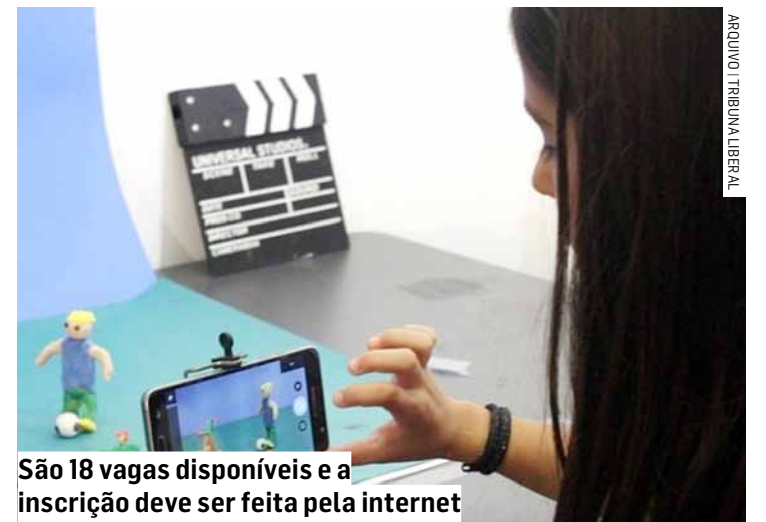
São 18 vagas disponíveis e a inscrição deve ser feita pela internet