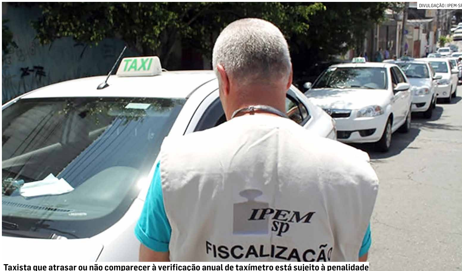
Taxista que atrasar ou não comparecer à verificação anual de taxímetro está sujeito à penalidade

O taxista está sujeito à penalidade em caso de