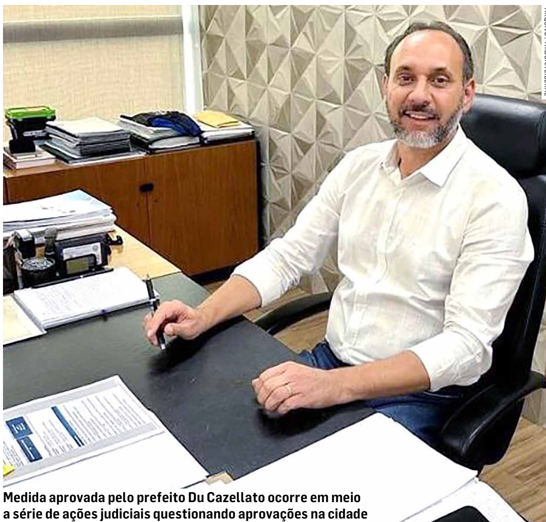
Medida aprovada pelo prefeito Du Cazellato ocorre em meio a série de ações judiciais questionando aprovações na cidade

Os decretos municipais 8699 e 8700, publicados em 12 de julho, autorizaram a construção de um empreendimento residencial vertical no bairro Alto de Pinheiros e um loteamento de acesso controlado na Gleba A1a. Estas aprovações ocorrem em um momento de crescente preocupação na cidade, marcada por ações civis públicas e ações populares movidas pelo Ministério Público e moradores, respectivamente, que questionam a série de aprovações sem a devida consideração dos impactos ambientais, de vizinhança e de infraestrutura necessários para atender a população, como escolas, Unidades de Saúde e medidas de trânsito.