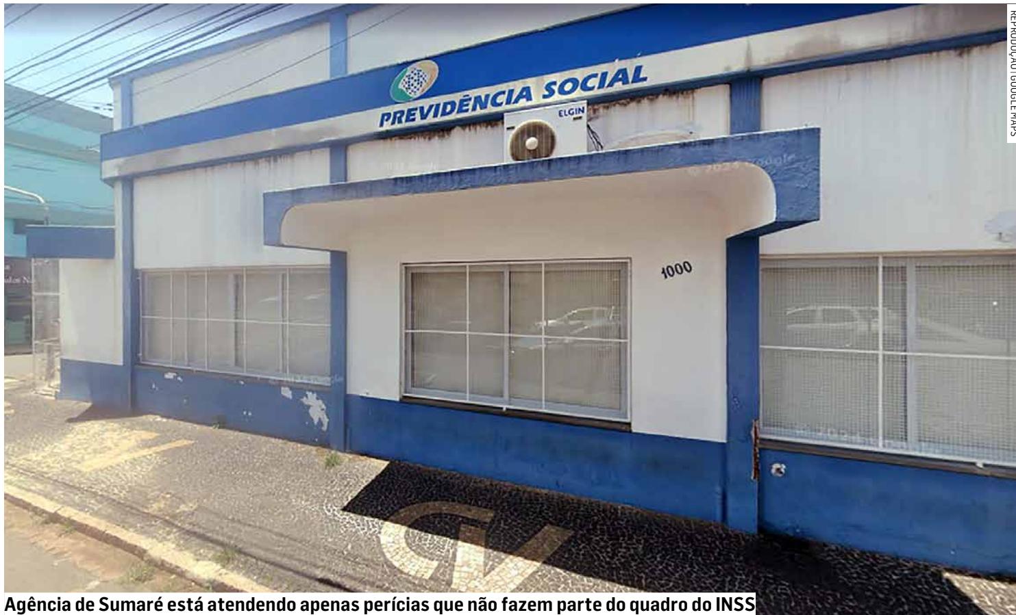
Agência de Sumaré está atendendo apenas perícias que não fazem parte do quadro do INSS

Na região, a agência do INSS em Sumaré está atendendo apenas perícias, que não fazem parte do quadro do INSS, em Hortolândia o atendimento se mantém parcial. Segundo