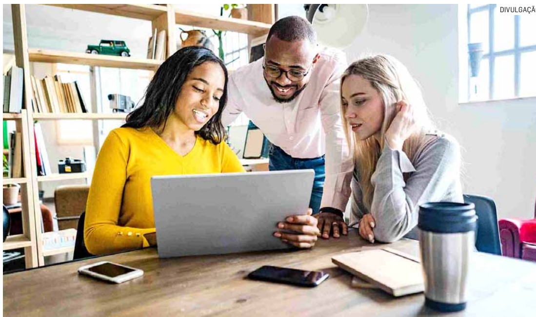
Programa tem duração de até dois anos e vagas são para estudantes de nível universitário

“Estagiar na Braskem tem sido uma experiência