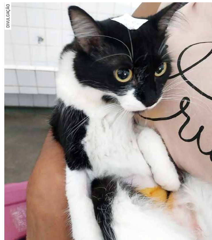
Programa é voltado para cães e gatos de famílias vulneráveis e tutores voluntários da causa animal na cidade

Nas mais recentes etapas, por exemplo, foi utilizado um Castramóvel - um ônibus adaptado como ambulatório conta com a infraestrutura necessária, incluindo sala de preparo, paramentação, centro cirúrgico, esterilização de materiais e local apropriado para o pós-operatório.