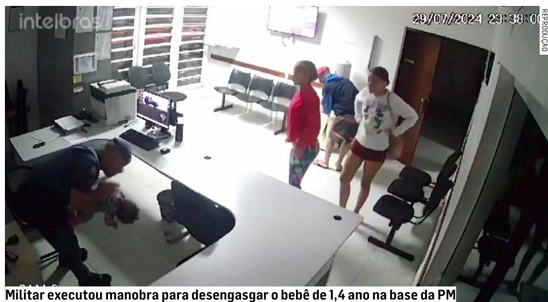
Militar executou manobra para desengasgar o bebê de 1,4 ano na base da PM

A criança recebeu atendimento e foi avaliada, sendo liberada e entregue aos cuidados da família.