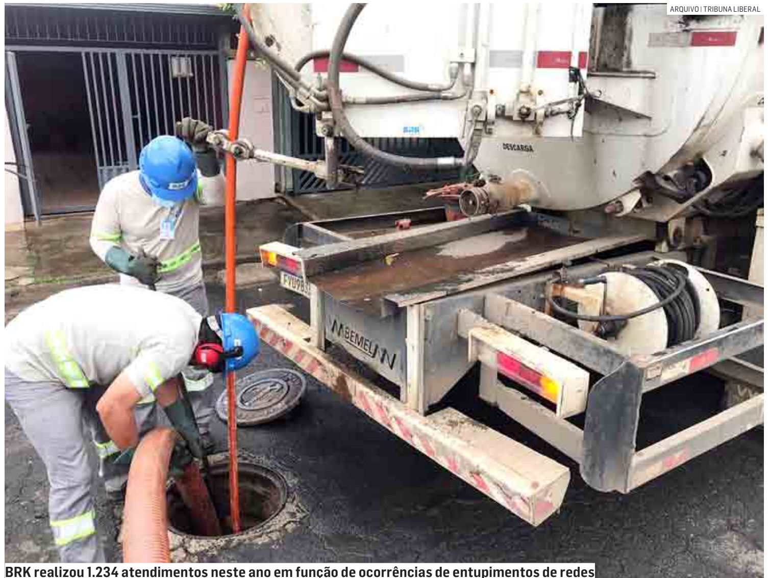
BRK realizou 1.234 atendimentos neste ano em função de ocorrências de entupimentos de redes

“Os entupimentos das redes e ligações de esgoto, além de causarem prejuízos como transbordamento em vias públicas e riscos ao meio ambiente, também podem contribuir para a proliferação