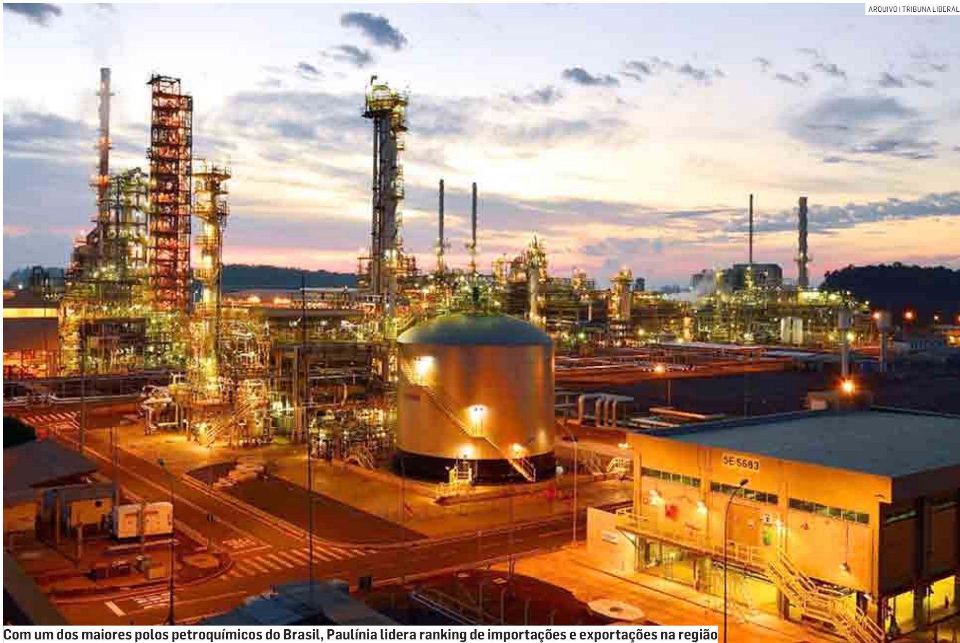
Com um dos maiores polos petroquímicos do Brasil, Paulínia lidera ranking de importações e exportações na região