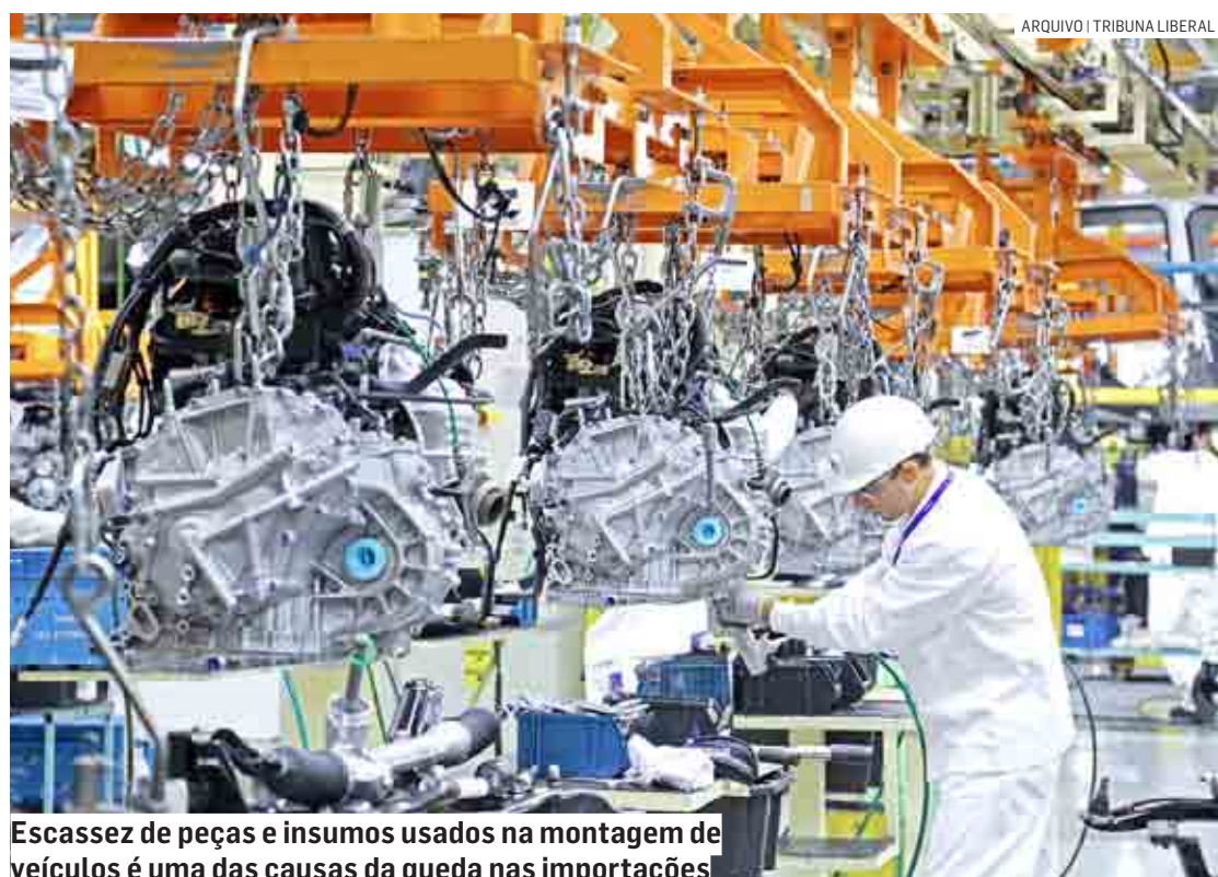
Escassez de peças e insumos usados na montagem de veículos é uma das causas da queda nas importações

Efeito da pandemia de Covid-19, a escassez de peças e insumos como semicondutores [componentes eletrônicos usados na montagem de veículos] no mercado internacional é uma das causas da queda nas importações feitas por empresas de Hortolândia, Nova Odessa e Sumaré. A avaliação é do economista Nelson Luís de Souza Corrêa.