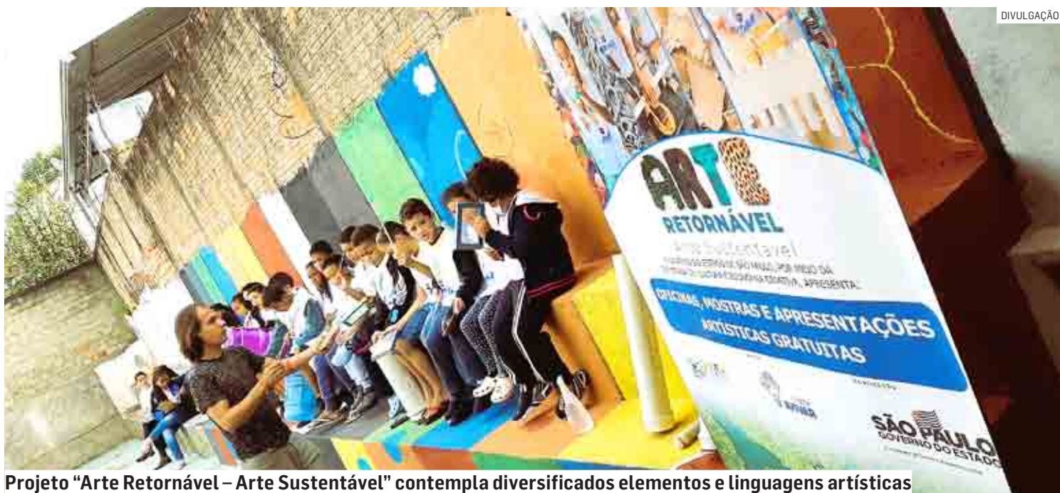
Projeto “Arte Retornável – Arte Sustentável” contempla diversificados elementos e linguagens artísticas

No ato da Inscrição, o participante informa qual a manifestação artística de seu interesse e é direcionado para turmas conforme faixa etária. “O programa das oficinas contempla diversificados elementos e linguagens artísticas, como as artes visuais, manuais, sonoras, literais, performáticas e cênicas”, explicam os envolvidos no projeto. “São práticas e técnicas nas áreas de música, audiovisual, fotografia, cinema, artesanato (utilizando materiais recicláveis), teatro, circo, coreografia/dança, capoeira, literatura/poe-