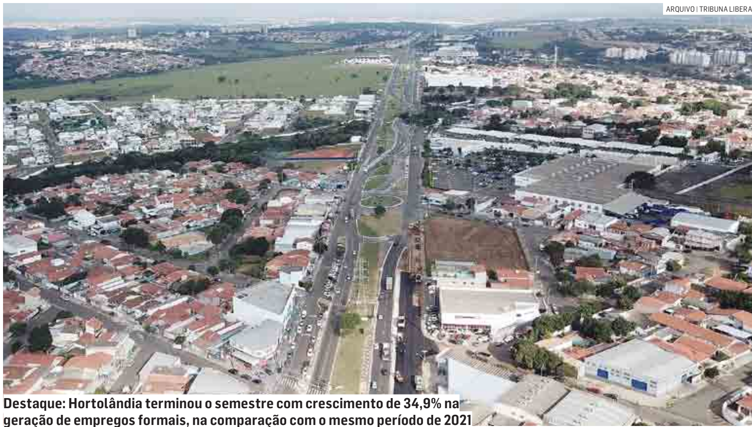
Destaque: Hortolândia terminou o semestre com crescimento de 34,9% na geração de empregos formais, na comparação com o mesmo período de 2021

Segundo o Caged, saldo de empregos no mês foi 6% maior que o de junho do ano anterior; nos primeiros seis meses de 2022, foram criados 7.223 postos de trabalho, 341 a menos que no ano passado