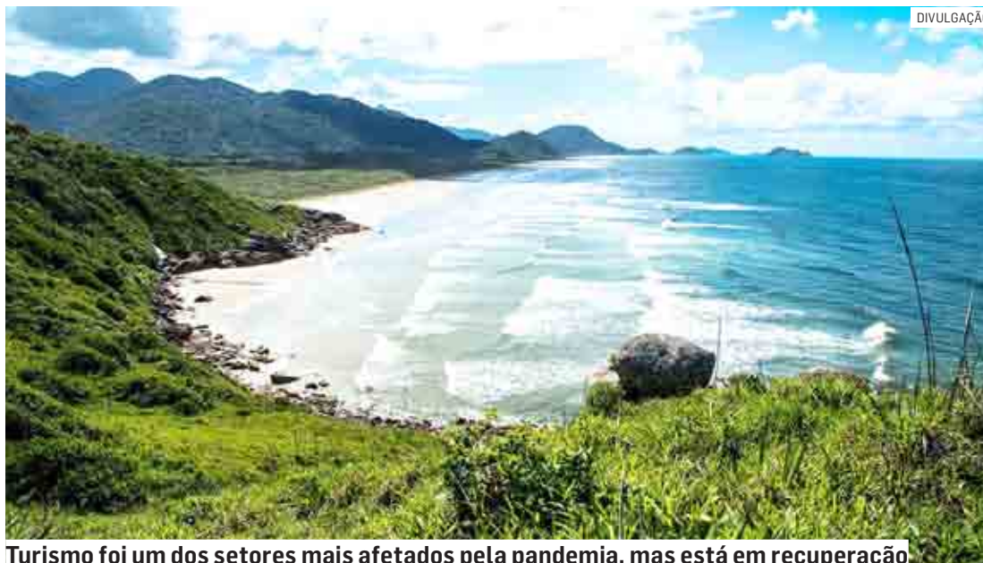
Turismo foi um dos setores mais afetados pela pandemia, mas está em recuperação

Centro de Inteligência da Economia do Turismo, vinculado à Secretaria de Turismo e Viagens do Estado de São Paulo. Foram utilizados dados da Junta Comercial e da Secretaria de Desenvolvimento Econômico. O levantamento analisou dados de 11 atividades: alojamento, alimentação, transportes rodoviário, ferroviário, aquaviário, aéreo, locação de veículos, agências de turismo, organização de eventos e ati-