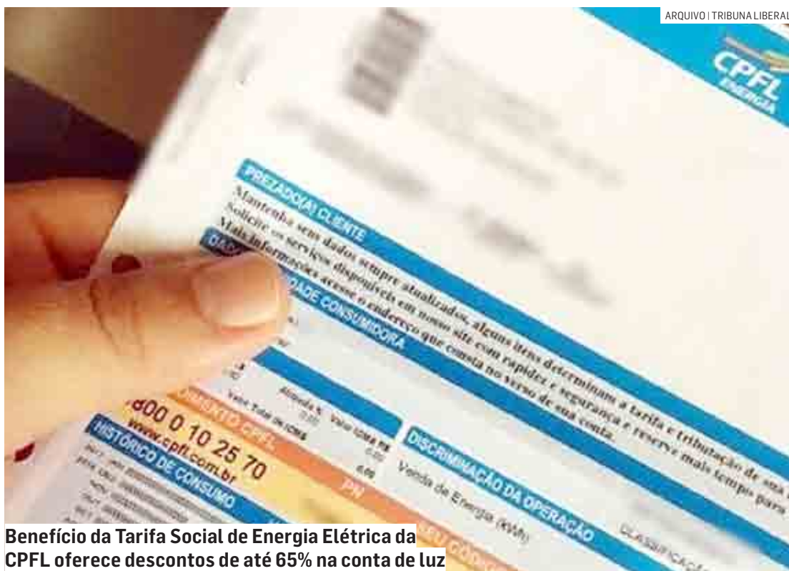
Benefício da Tarifa Social de Energia Elétrica da CPFL oferece descontos de até 65% na conta de luz