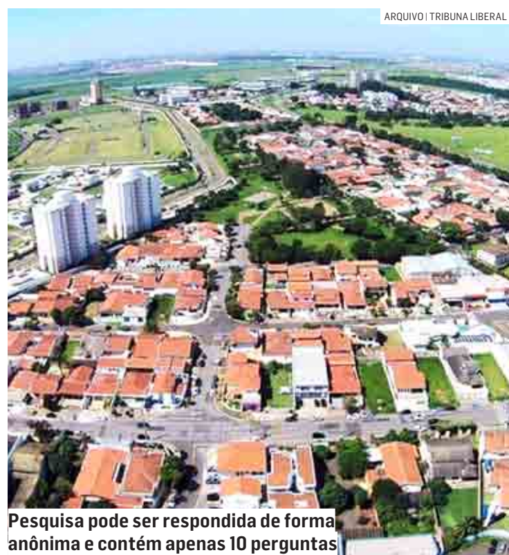
Pesquisa pode ser respondida de forma anônima e contém apenas 10 perguntas