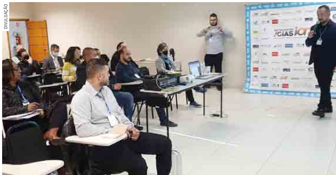
Encontro é aberto a empresários, comerciantes, empreendedores e profissionais liberais

Mais informações pelo e-mail: acias@acias.com.br