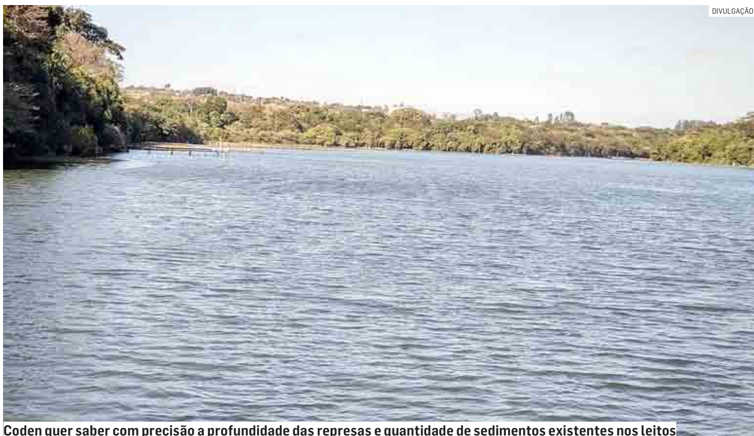
Coden quer saber com precisão a profundidade das represas e quantidade de sedimentos existentes nos leitos

Sobrinho evidencia o problema das represas. “Com o passar do tempo, um volume expressivo de sedimentos vem sendo depositado no fundo, trazido pelas enxurradas e o manejo indevido do solo nas áreas vizi-