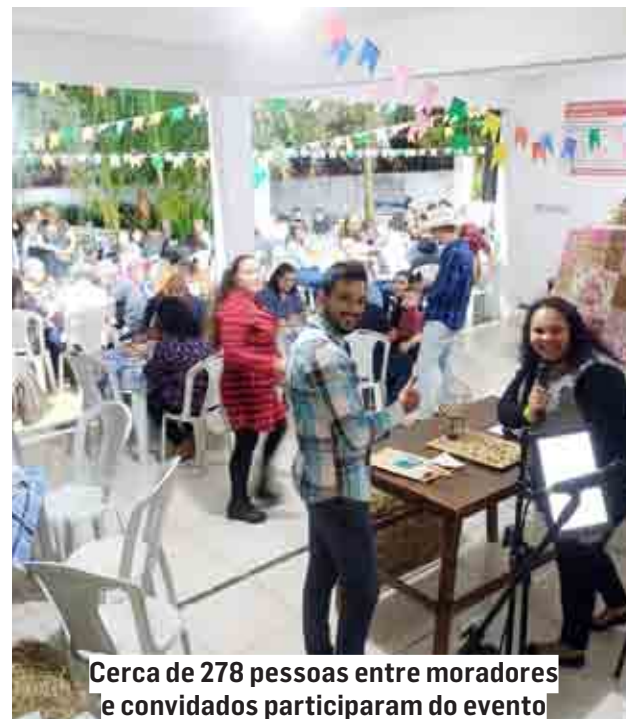
Cerca de 278 pessoas entre moradores e convidados participaram do evento

A população de Nova Odessa pagou por este anúncio: R$ 2.808,00