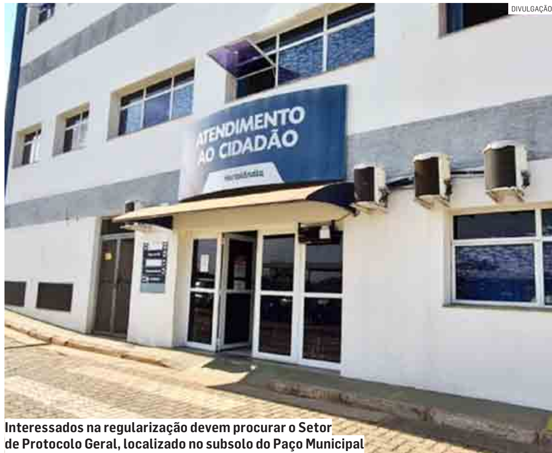
Interessados na regularização devem procurar o Setor de Protocolo Geral, localizado no subsolo do Paço Municipal

Programa oferece anistia temporária a proprietários que estão em desacordo com a legislação municipal