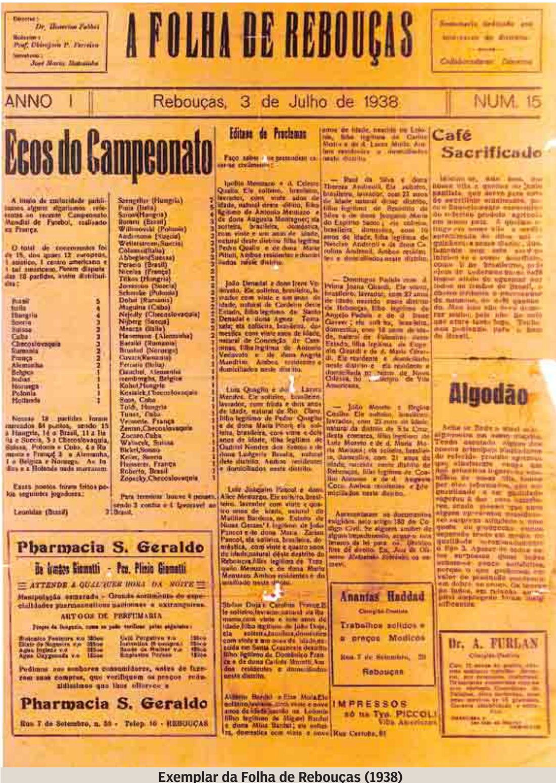
Exemplar da Folha de Rebouças (1938)