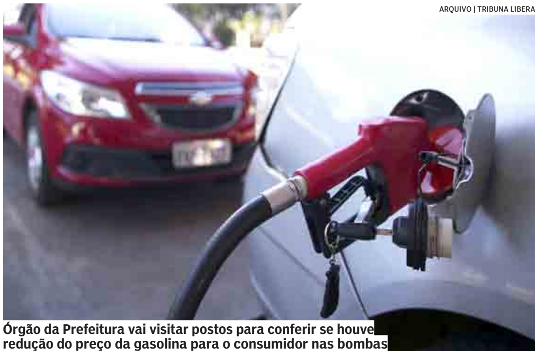
Órgão da Prefeitura vai visitar postos para conferir se houve redução do preço da gasolina para o consumidor nas bombas

“Considerando que no Brasil não existe um tabelamento de preços, cabe aos postos a decisão de repassar a diminuição