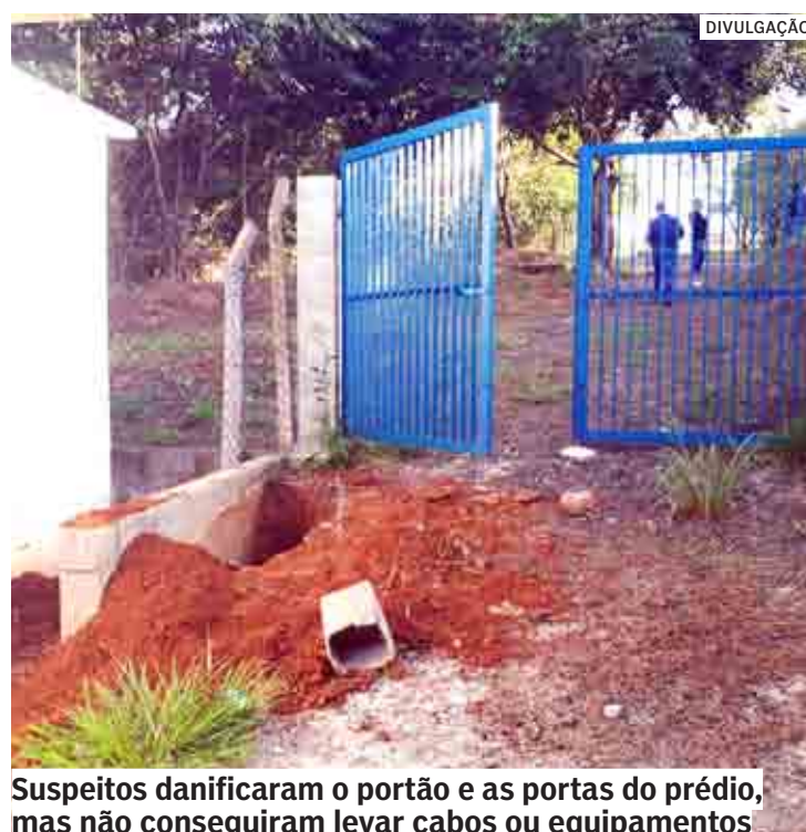
Suspeitos danificaram o portão e as portas do prédio, mas não conseguiram levar cabos ou equipamentos

O Córrego Palmital forma, junto com o Córrego Recanto e o Córrego Lopes, o conjunto de mananciais utilizados pelo sistema de captação da água bruta da cidade. Desde outubro do ano passado, quando foi concluí-