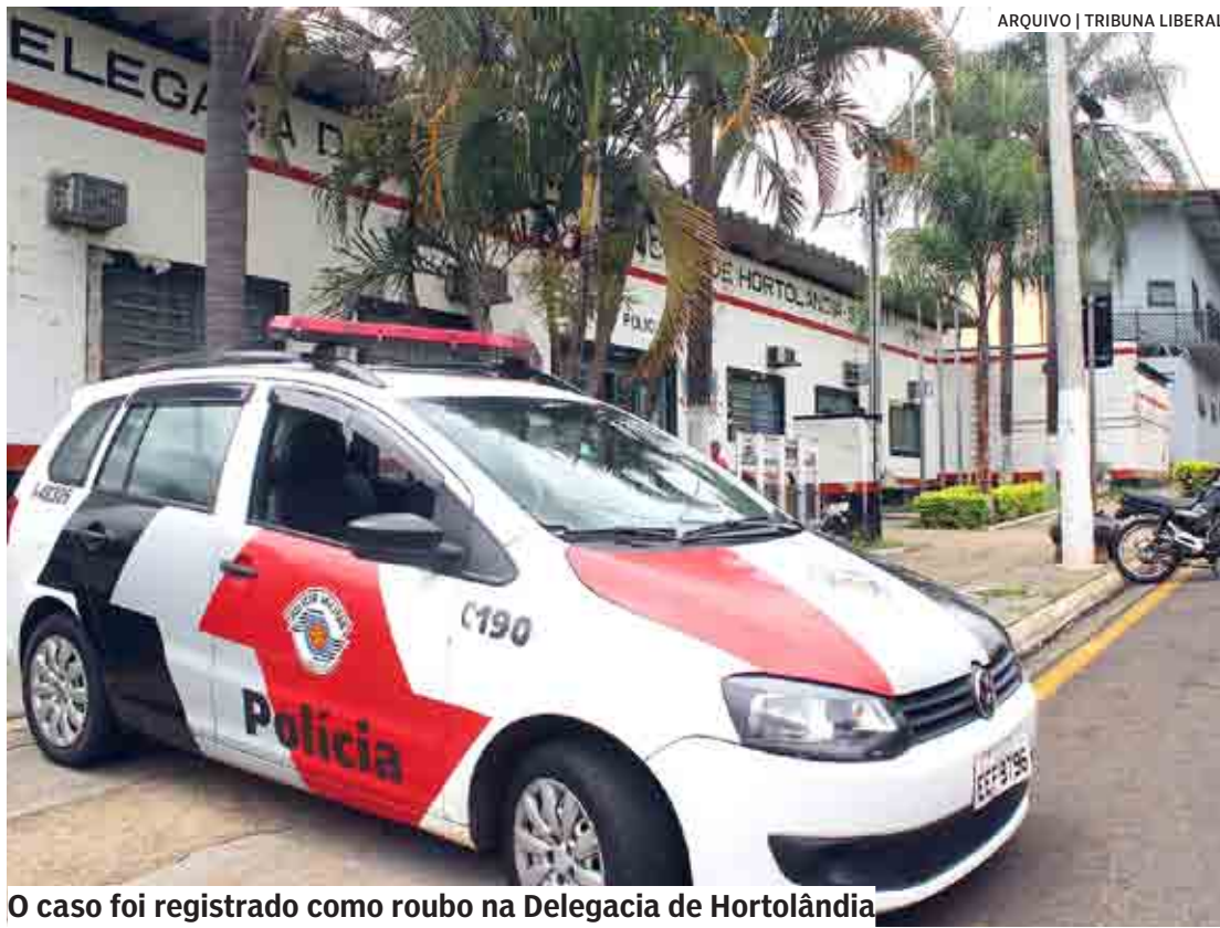
O caso foi registrado como roubo na Delegacia de Hortolândia

Até o encerramento da edição, os autores do crime não haviam sido presos. A investigação ficará a cargo da equipe do 1º Distrito Policial. Não há informações se os criminosos conseguiram sacar valores da conta bancária da vítima.