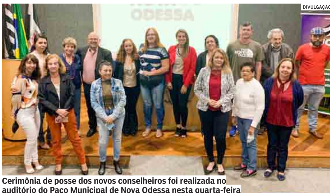
Cerimônia de posse dos novos conselheiros foi realizada no auditório do Paço Municipal de Nova Odessa nesta quarta-feira

“Quero dizer que esse Conselho que toma posse hoje delibera, participa de ações voltadas à proteção da criança e do adolescente. Sinto-me muito honrado de estar aqui, fui comissário de menores em Sumaré na época que não