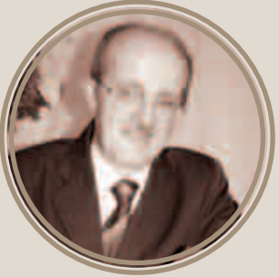
Francisco Antonio de Toledo