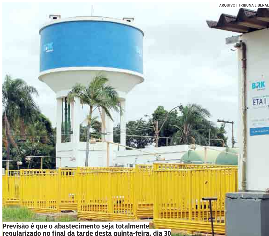
Previsão é que o abastecimento seja totalmente regularizado no final da tarde desta quinta-feira, dia 30

Assim como a concessionária realiza a limpeza e desinfecção dos reservatórios de água tratada para manter a qualidade da água distribuída à população, é importante que os clientes também façam a limpeza periódica, de seis em seis meses, de seus reservatórios individuais, ou se-