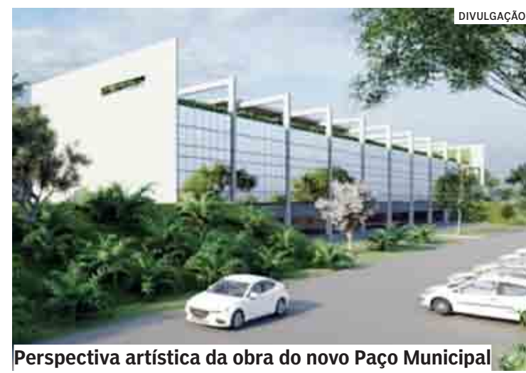
Perspectiva artística da obra do novo Paço Municipal

Na última sexta-feira (24/06), o resultado da licitação, na modalidade Concorrência Pública 03/2022, foi publicada no Diário Oficial Eletrônico do Município, disponível neste link. ( https://publicacoesmunicipais.com.br:8443/api/acts/hortolandia/1574 )