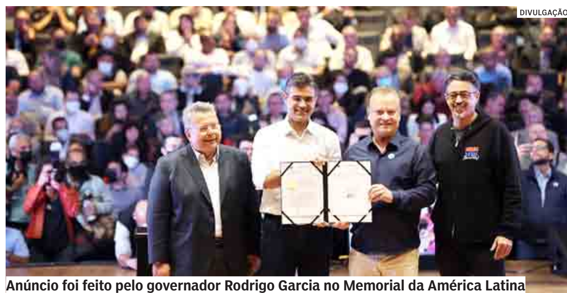
Anúncio foi feito pelo governador Rodrigo Garcia no Memorial da América Latina

Em todo o Estado, serão investidos R$ 2,9 bilhões, que irão modernizar e recuperar 184 estradas, somando 1.323,3 km em 170 municípios. A manutenção e recuperação de estradas vicinais são responsabilidades dos municípios, no entanto, o Estado auxilia as Prefeituras com um amplo programa de melhorias para que possam manter as vias em boas condições. Haverá obras para recuperação da pista, pavimentação de estra-