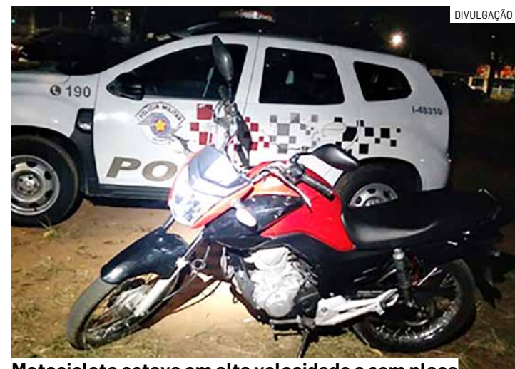
Motocicleta estava em alta velocidade e sem placa

Os policiais conseguiram abordar o condutor com apoio do Policiamento Rodoviário. Em busca