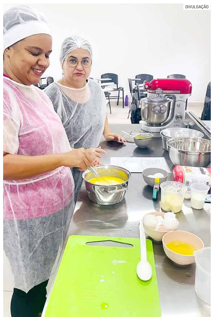
Como fazer e vender bolos, aproveitar alimentos e montar saladas de potes foram temas dos cinco cursos

Da Redação • NOVA ODESSA tribunaliberal@tribunaliberal.com.br