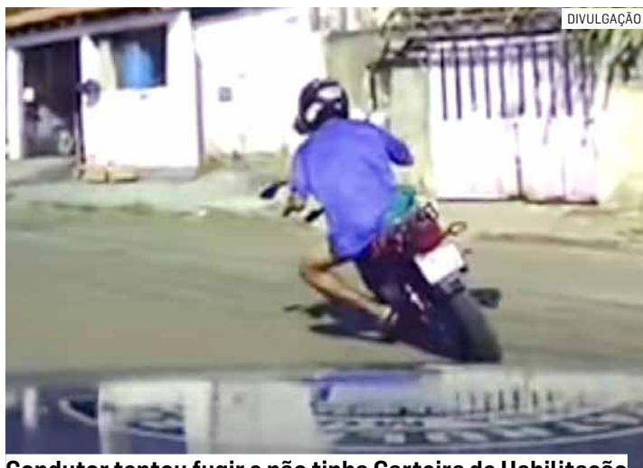
Condutor tentou fugir e não tinha Carteira de Habilitação

O condutor da motocicleta se evadiu em alta ve-