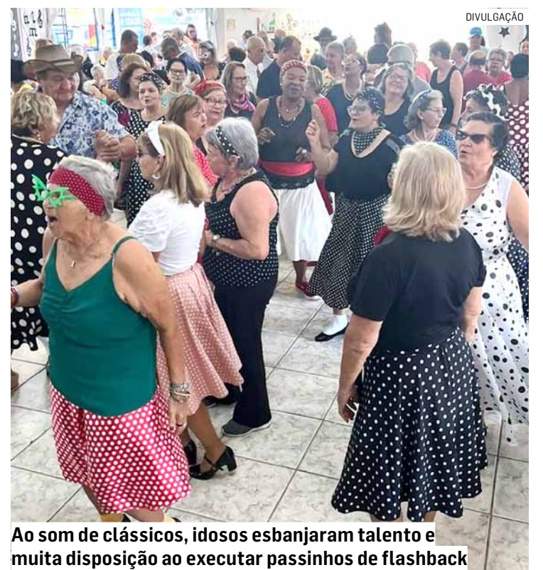
Ao som de clássicos, idosos esbanjaram talento e muita disposição ao executar passinhos de flashback

Além de se divertirem e dançarem ao som de “YMCA”, de Village People, e “Girls Just Wanna Have Fun”, de Cyndi Lauper, o baile dos anos 60 também foi uma oportunidade para os idosos do CCMi colocarem a criatividade para fora no quesito moda. Os idosos se caracterizaram para o baile usando roupas com estampas florais e geo-