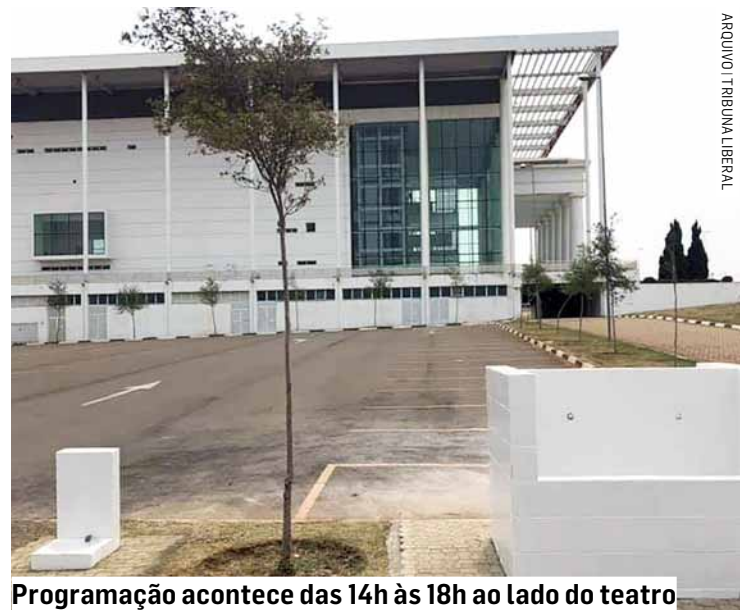
Programação acontece das 14h às 18h ao lado do teatro