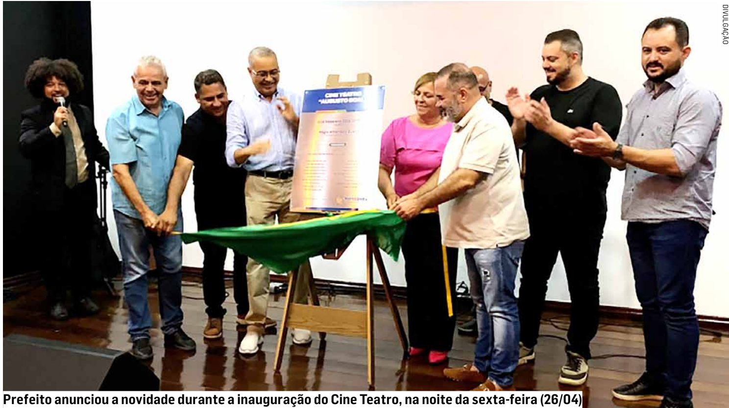
Prefeito anunciou a novidade durante a inauguração do Cine Teatro, na noite da sexta-feira (26/04)