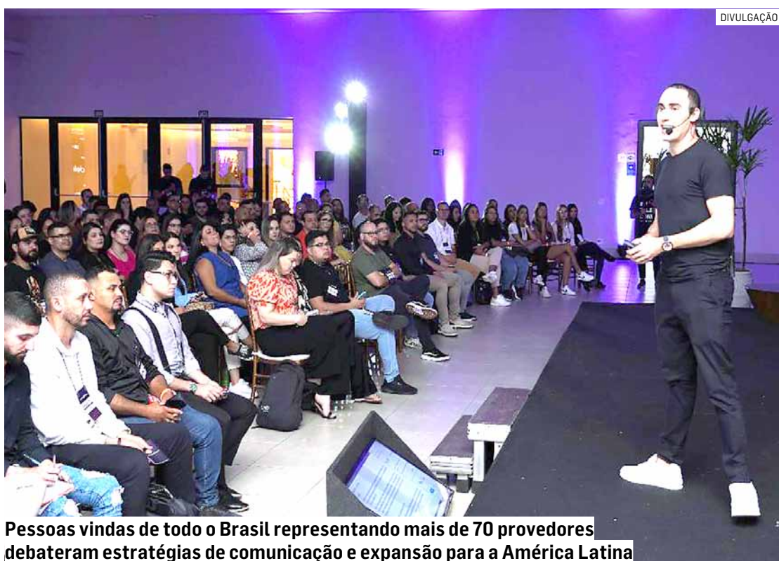
Pessoas vindas de todo o Brasil representando mais de 70 provedores debateram estratégias de comunicação e expansão para a América Latina

A Delipe é uma empresa de marketing e vendas nichada no mercado de provedores de internet, com estratégias que elevam a presença digital e comercial de nossos clientes. Sua equipe de especialistas oferece soluções completas, desde o desenvolvimento de identidade visual e sites