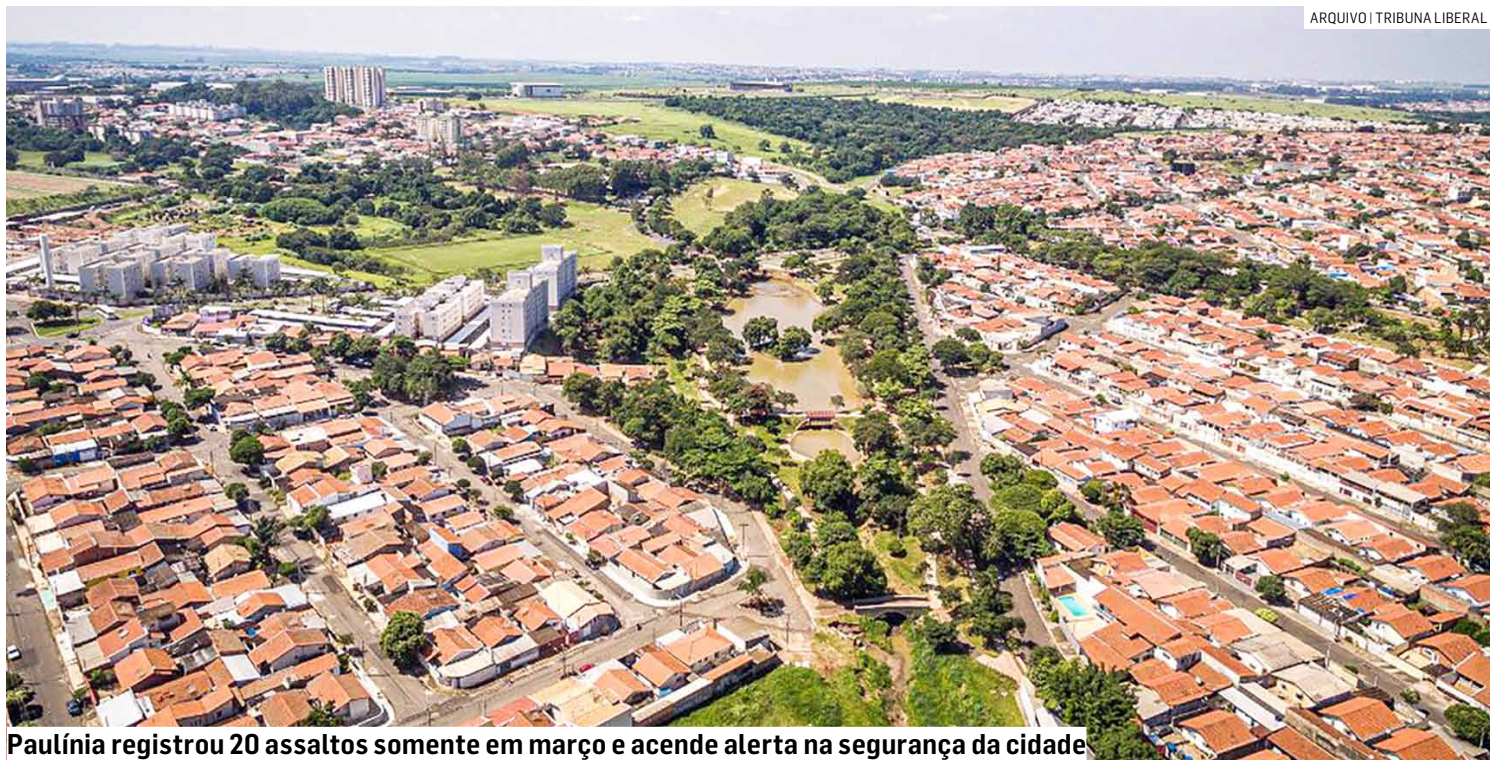
Paulínia registrou 20 assaltos somente em março e acende alerta na segurança da cidade

Por outro lado, segundo a SSP, as cidades do interior