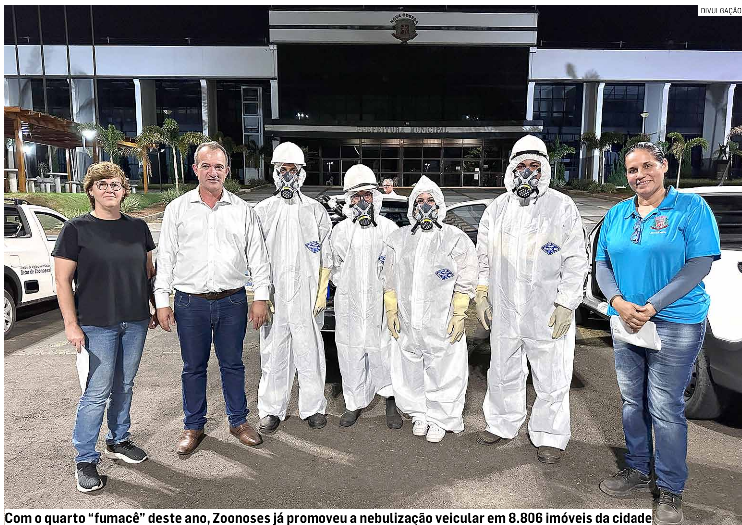
Com o quarto “fumacê” deste ano, Zoonoses já promoveu a nebulização veicular em 8.806 imóveis da cidade

Como sempre, a Sucen (Superintendência Estadual de Controle de Endemias) só autoriza a realização da nebulização veicular em localidades com dois ou mais casos positivos de dengue num raio de três quadras a partir da residência do primeiro caso. O próprio inseticida é fornecido pelo órgão estadual