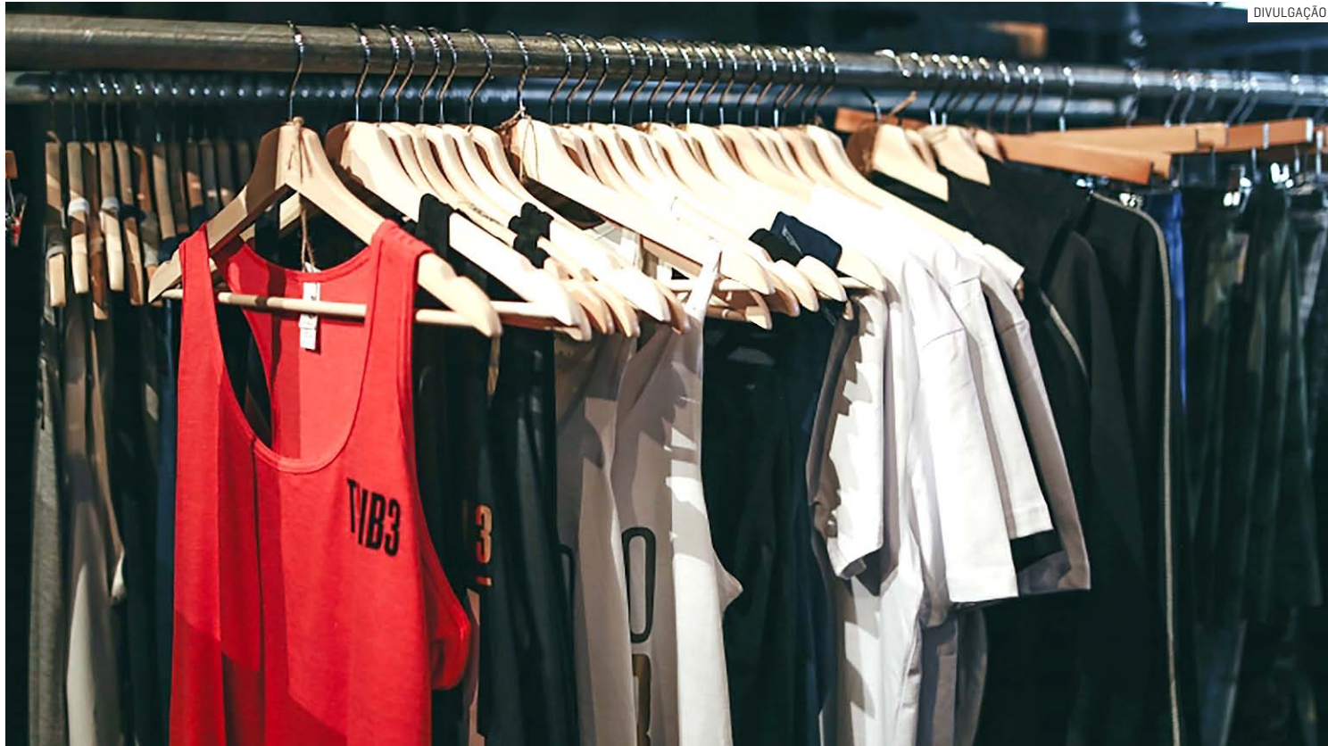
Ação será realizada no CCMI do Remanso Campineiro entre sexta e domingo; pagamento poderá ser feito em dinheiro ou via Pix

O bazar da solidariedade será formado por uma variedade de peças de roupas novas masculinas, tanto para o público infantil quanto para o público adulto. De acordo com o Fun-