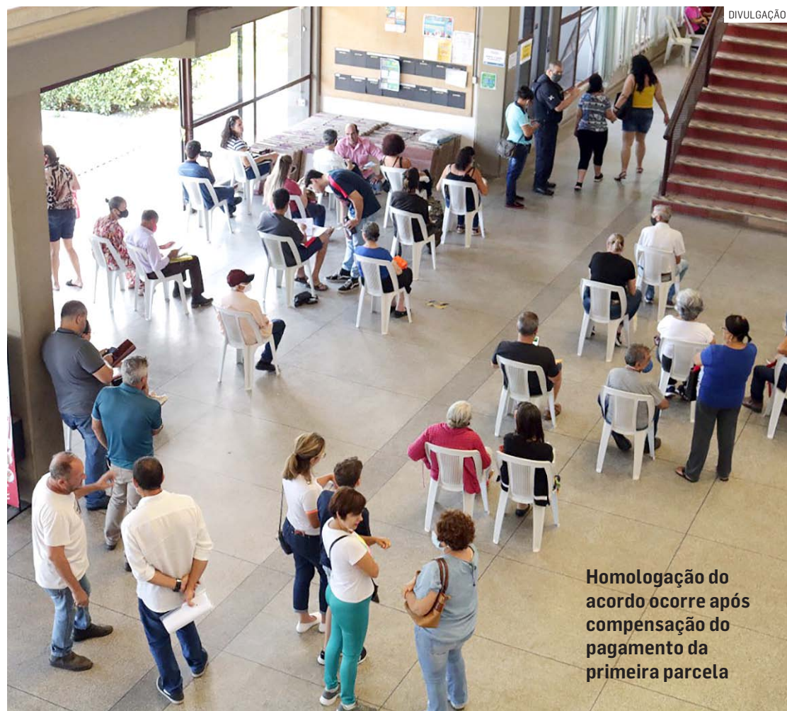
Homologação do acordo ocorre após compensação do pagamento da primeira parcela

Cerca de 83% das renegociações são de IPTU em atraso, mas praticamente qualquer débito em atraso com a Prefeitura pode ser renegociado. Além do IPTU, também podem ser renegociados ISSQN e outras taxas, impostos, débitos e multas municipais vencidas e não pagos até o final de 2022. Quem se beneficiou em 2022 não pode entrar novamente no RefisNO.