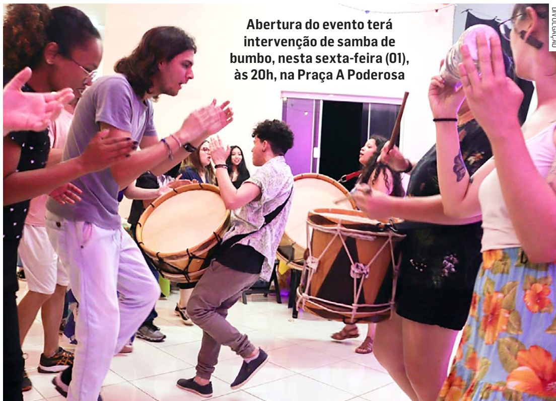
Abertura do evento terá intervenção de samba de bumbo, nesta sexta-feira (01), às 20h, na Praça A Poderosa

De acordo com o coletivo, o encontro promoverá uma imersão, na qual os participantes terão a oportunidade de criar cenas e esquetes. A criação será feita