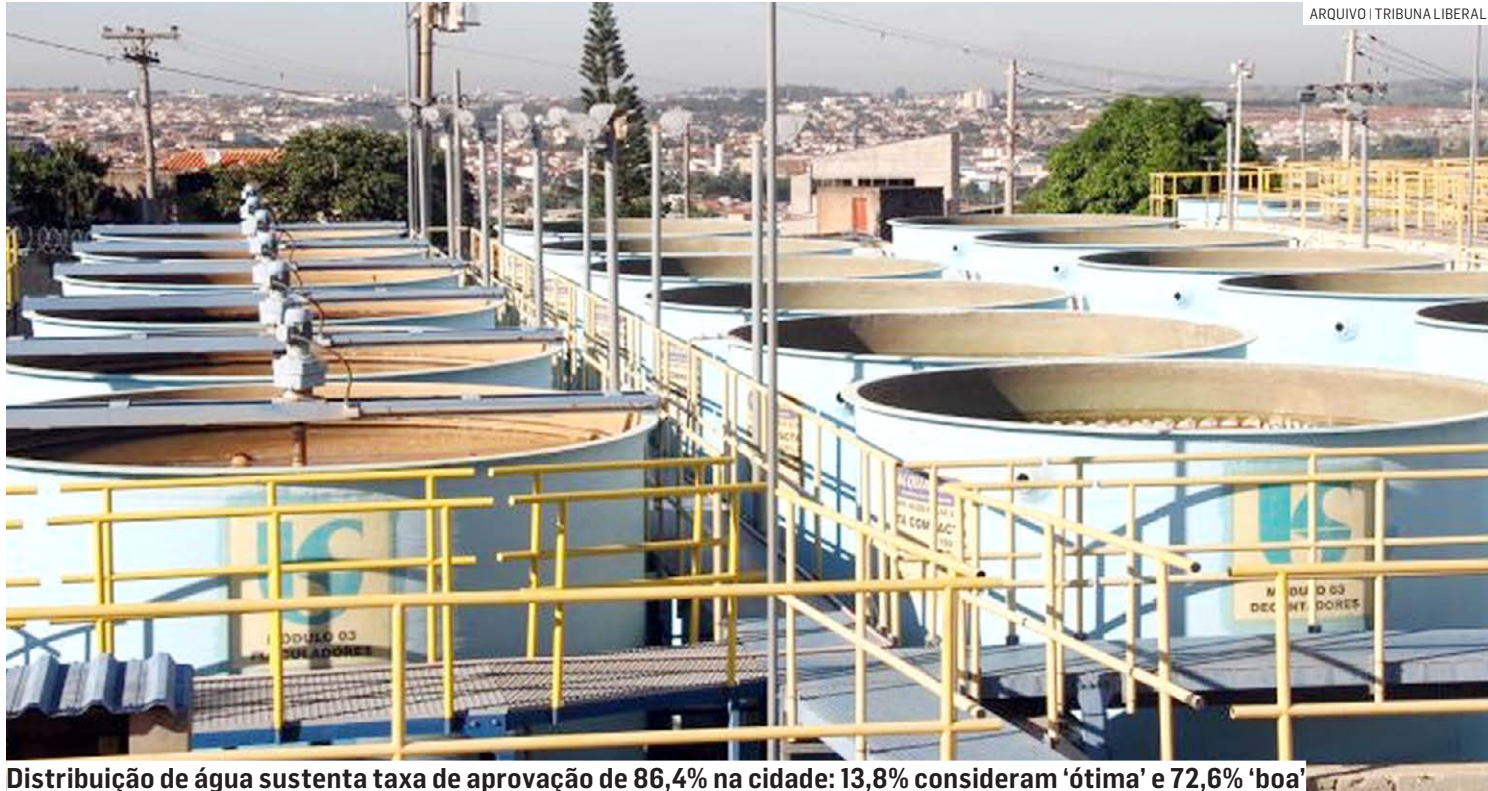
Distribuição de água sustenta taxa de aprovação de 86,4% na cidade: 13,8% consideram 'ótima' e 72,6% 'boa'

Com 790 pontos atribuídos ao setor, o desempenho do abastecimento supera a média dos municípios médios, que é de 749 pontos. Tal resultado representa um crescimento em relação ao ano anterior, quando o serviço alcançou 773 pontos na avaliação INDSAT. Na análise global, considerando 16 serviços públicos, o abastecimento de água se destaca como um dos principais