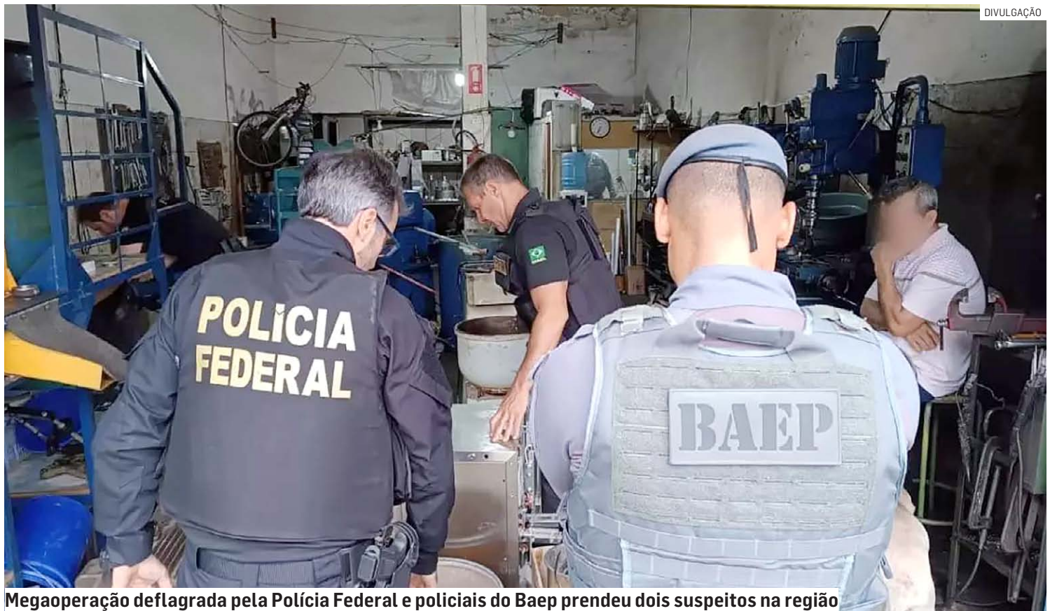
Megaoperação deflagrada pela Polícia Federal e policiais do Baep prendeu dois suspeitos na região

No bairro Campos Verdes, em Nova Odessa, foi cumprido um mandado de prisão e busca e apreensão, onde um indivíduo poderia estar escondido na residência de sua irmã. A equipe se