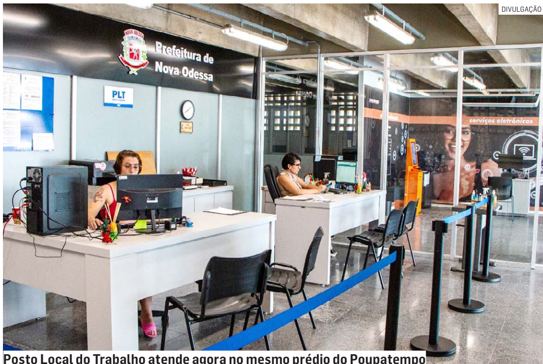
Posto Local do Trabalho atende agora no mesmo prédio do Poupatempo

Da Redação • NOVA ODESSA tribunaliberal@tribunaliberal.com.br