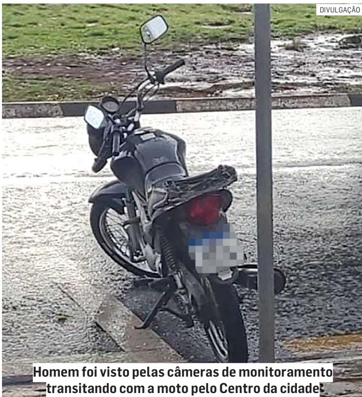
Homem foi visto pelas câmeras de monitoramento transitando com a moto pelo Centro da cidade