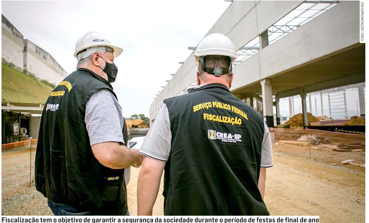
Fiscalização tem o objetivo de garantir a segurança da sociedade durante o período de festas de final de ano

O Crea-SP já realizou 526.367 ações fiscalizatórias nos 645 municípios paulistas entre janeiro e setembro de 2023. O número é um recorde histórico no Conselho, resultado da inovação de processos de fiscalização. Em 2022, foram cerca de 462 mil operações