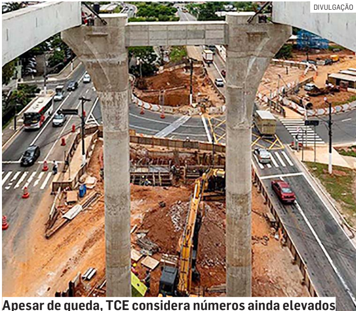
Apesar de queda, TCE considera números ainda elevados

O TCE-SP (Tribunal de Contas do Estado de São Paulo) contabiliza 726 obras paralisadas ou atrasadas sob responsabilidade do Governo Estadual ou dos municípios paulistas. Os valores iniciais dos contratos passam de R$ 20 bilhões. As informações, que têm como data base o dia 11 de outubro de 2023, fazem parte do painel sobre o tema, que acaba de ser atualizado pelo TCE.