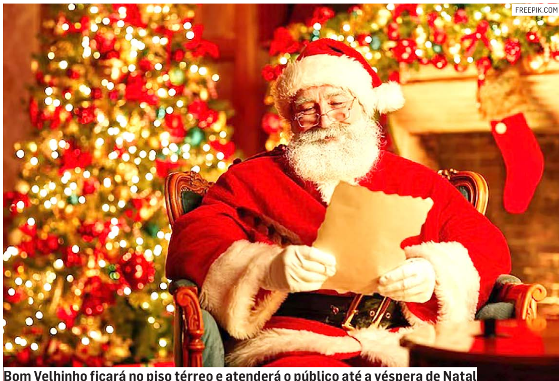
Bom Velhinho ficará no piso térreo e atenderá o público até a véspera de Natal

Durante o "Natal do Coração", todo o shopping estará decorado com o tema natalino, criando uma atmosfera acolhedora. O cenário estará enfeitado com festões, laços, guirlandas e