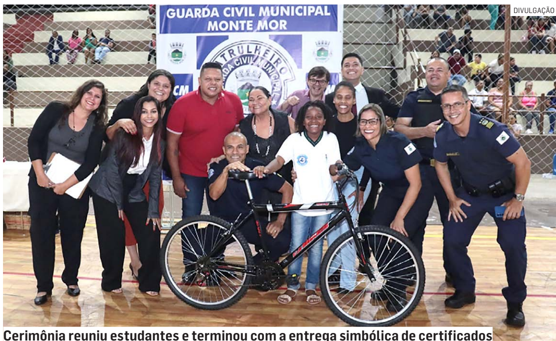
Cerimônia reuniu estudantes e terminou com a entrega simbólica de certificados

Da Redação • MONTE MOR tribunaliberal@tribunaliberal.com.br