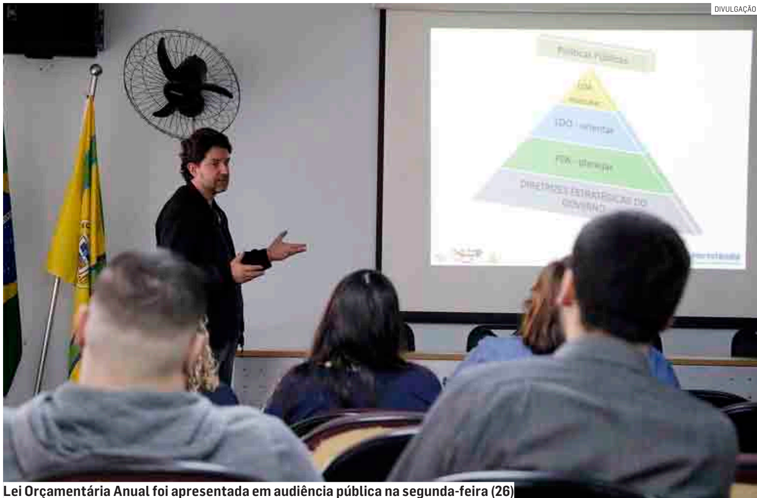
Lei Orçamentária Anual foi apresentada em audiência pública na segunda-feira (26)

De acordo com informações da Secretaria de Finanças, a LOA detalha as despesas e receitas do município por fonte de recurso e faz a projeção de arrecadação de cada receita, que inclui impostos como IPTU (Imposto Predial e Territorial Urbano), ICMS (Imposto sobre Circulação de Mercadorias e Serviços) e IPVA (Imposto sobre a Propriedade