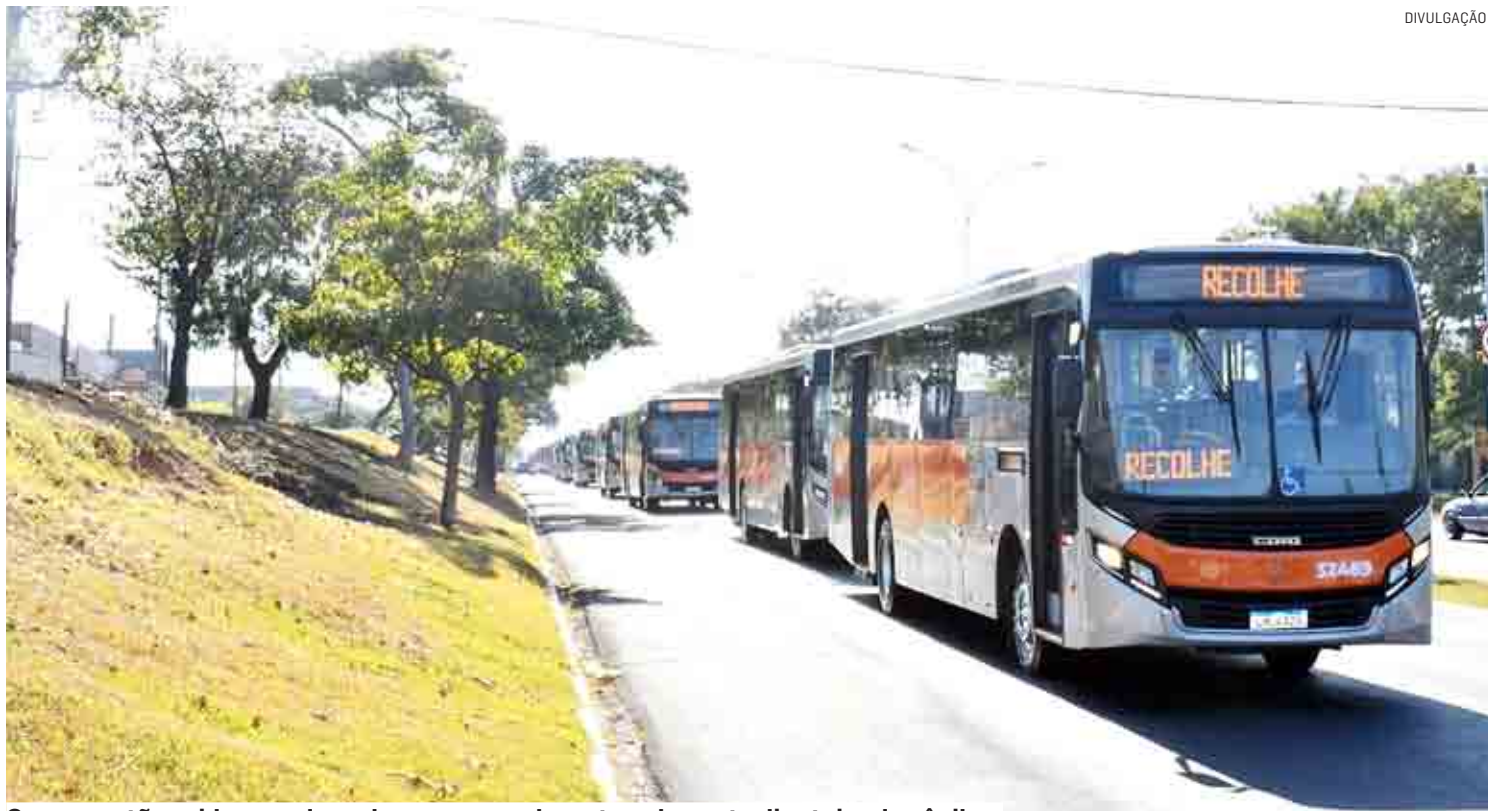
Com o cartão, o idoso pode embarcar normalmente pela porta dianteira dos ônibus

O Cartão Sênior 65+ não tem custo e é impor-