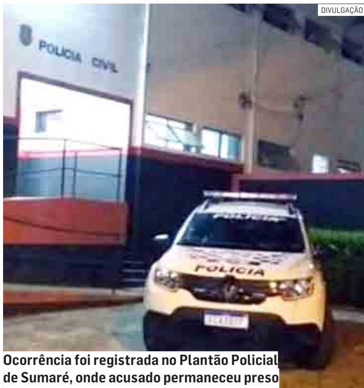
Ocorrência foi registrada no Plantão Policial de Sumaré, onde acusado permaneceu preso

Um homem foi preso após furtar uma escada de alumínio de uma residência na noite desta terça-feira (27), no Jardim Maria Antonia, em Sumaré. Os policiais militares foram acionados via 190 e se deslocaram ao bairro. No local, as vítimas informaram aos PMs que um indivíduo pulou em seu quintal e furtou a escada de alumínio de sete degraus. A equipe passou a fazer patrulhamento com vistas ao criminoso e o localizou pela Rua 29 do bairro, onde ele foi flagrado com o objeto do furto. Uma viatura retornou até a residência com a escada, e questionou a vítima, que reconheceu