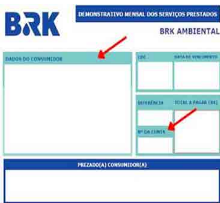
Mudanças foram pensadas para facilitar entendimento

A partir de 1º de outubro, as faturas da BRK chegarão aos imóveis de Sumaré, com algumas alterações no seu layout e disposição de informações. O novo modelo não altera a forma de entrega da conta, os dados dos clientes e os canais de pagamento. Segundo a concessionária, a mudança no formato foi pensada para que os clientes possam acompanhar de forma mais fácil e prática, as leituras, avisos e informações gerais.