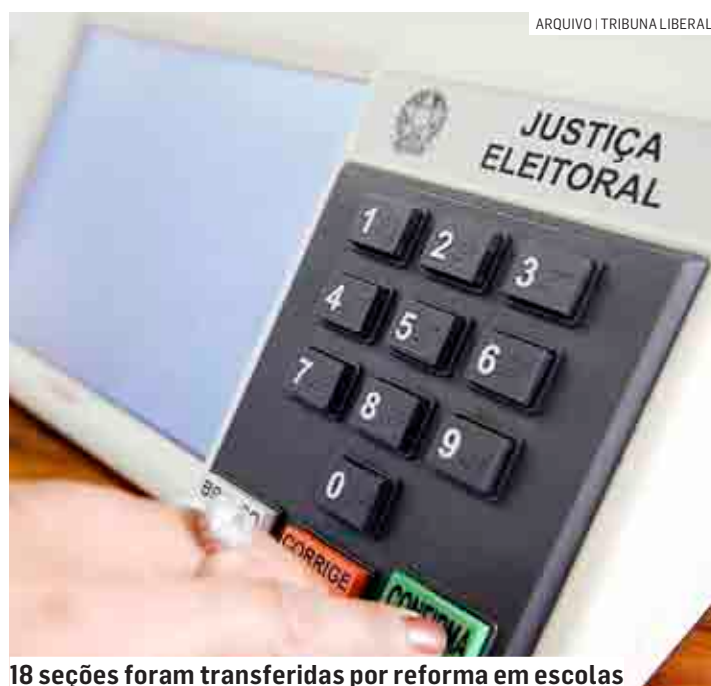
18 seções foram transferidas por reforma em escolas

Na região, 18 seções eleitorais, 16 em Sumaré e duas em Nova Odessa, foram realocadas temporariamente por motivo de reforma em escolas. Em Sumaré, 16 seções da escola Alice Antenor de Souza foram alocadas na escola Residencial Bordon. Em Nova Odessa, eleitores de duas sessões que ficam na Emefei Professora Theresinha Antonia Malaguetta Merenda vão votar na escola Profª Dorti Zambello Calil.