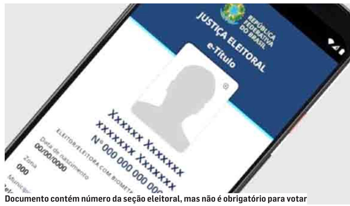
Documento contém número da seção eleitoral, mas não é obrigatório para votar