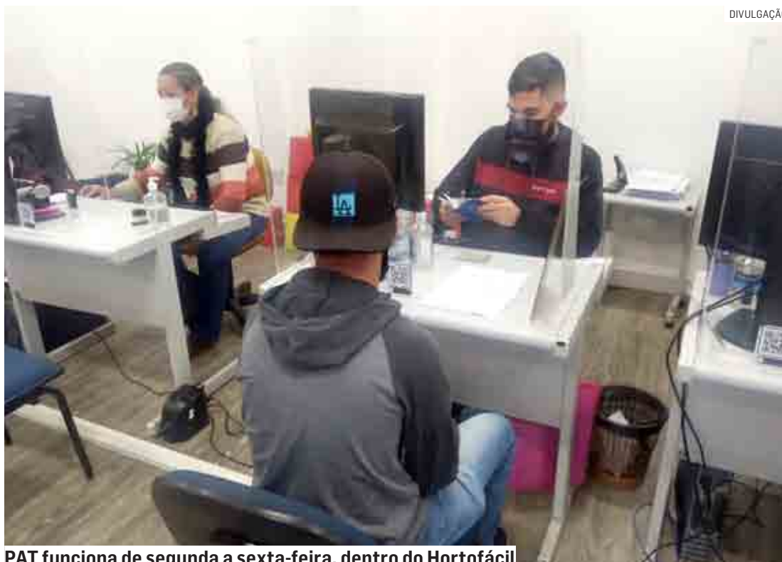
PAT funciona de segunda a sexta-feira, dentro do Hortofácil

PCDs também podem concorrer a uma vaga de