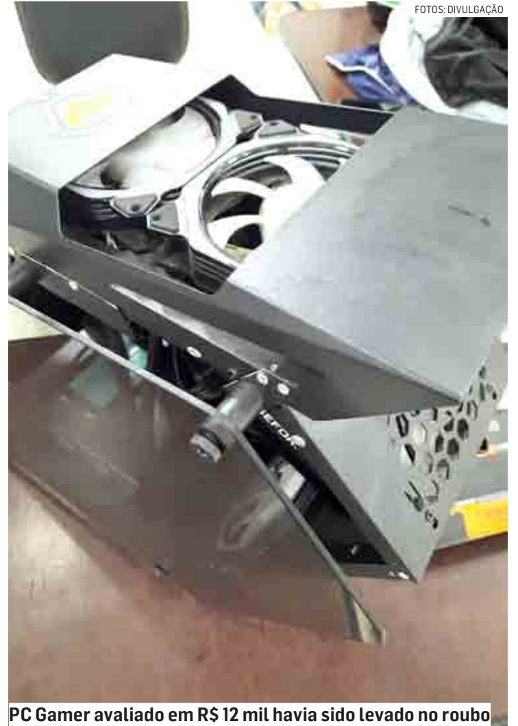
PC Gamer avaliado em R$ 12 mil havia sido levado no roubo

Policial de Sumaré, onde ambos ficaram presos em flagrante por roubo consumado, permanecendo à disposição da Justiça. Todos os bens foram restituídos à vítima.