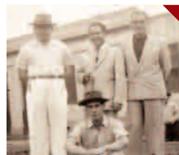
A Foto e o Texto: Quatro personagens de Sumaré PÁG. 09