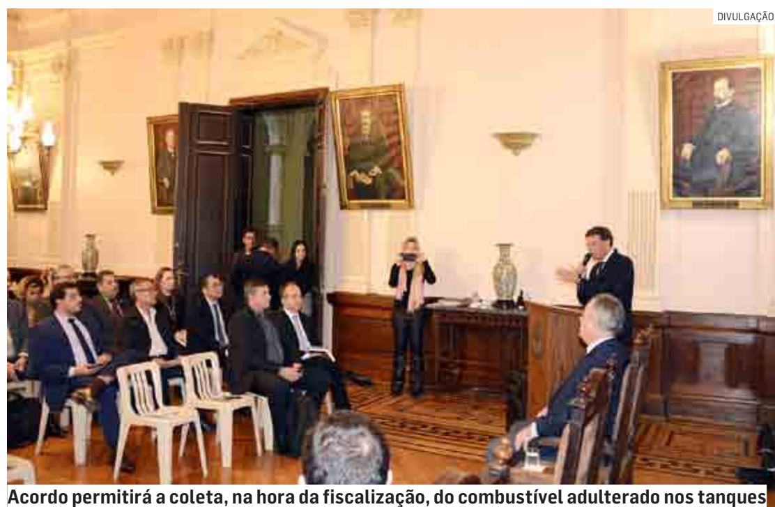
Acordo permitirá a coleta, na hora da fiscalização, do combustível adulterado nos tanques

Operação Combustível Limpo fez 28 operações. As equipes do Ipem-SP fiscalizaram 129 postos nas cidades de São Paulo, Araçatuba, Campinas, Guarujá, Jundiaí, Santos, Osasco, Praia Grande, Registro, Santo André, São Bernardo do Campo, São José dos Campos, São José do Rio Preto e Taboão da Serra. Destes, 66 estabelecimentos apresentaram irregularidades e foram autuados pelos fiscais do instituto.