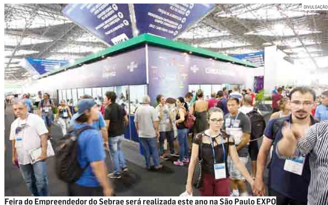
Feira do Empreendedor do Sebrae será realizada este ano na São Paulo EXPO