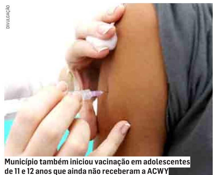
Município também iniciou vacinação em adolescentes de 11 e 12 anos que ainda não receberam a ACWY

A vacina meningocócica ACWY também integra o Programa Nacional de Imunização (PNI). A Vigilância Epidemiológica alerta que adolescentes de 11 a 14 anos devem receber uma dose da vacina.