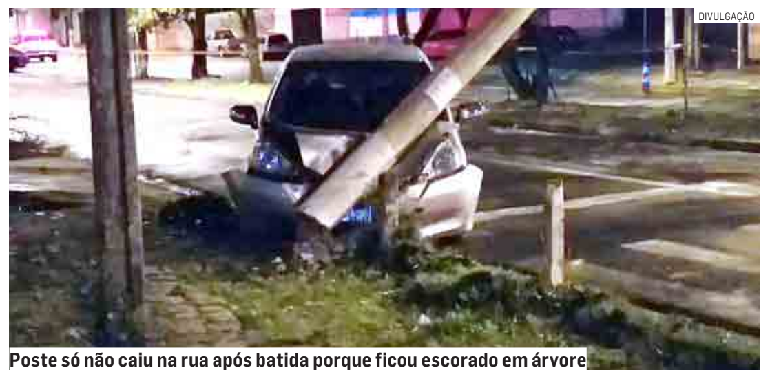
Poste só não caiu na rua após batida porque ficou escorado em árvore

O proprietário do carro foi localizado e afirmou que não estava dirigindo o automóvel. Ele afirmou que emprestou o veículo para um cunhado, que estaria alcoolizado.