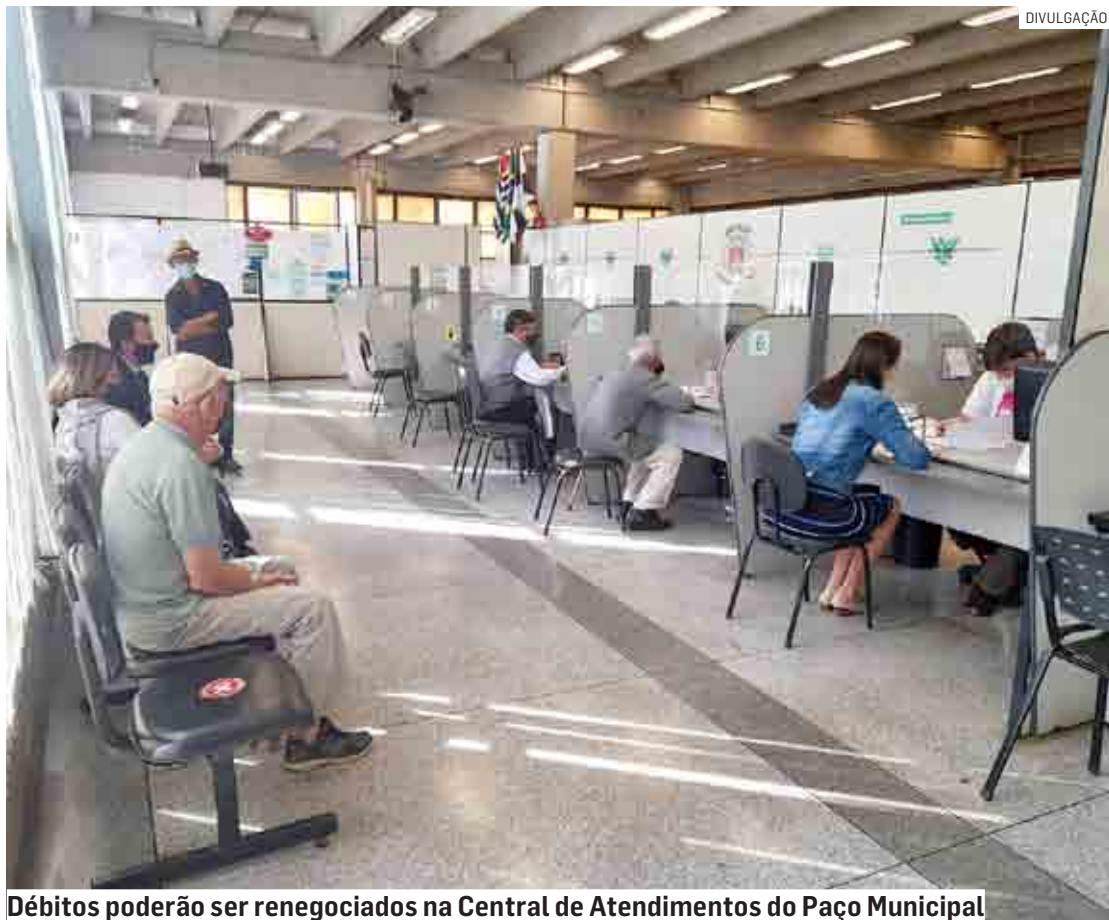
Débitos poderão ser renegociados na Central de Atendimento do Paço Municipal

“Todos os débitos com o município até 2021 podem ser objeto do parcelamento do RefisNO, exceto as multas punitivas. É sempre importante lembrarmos também que o reajuste de IPTU deste ano foi zero, o que já foi uma medida tomada pelo prefeito para auxiliar as famílias de Nova Odessa neste momento em que muitas tiveram perda ou queda de renda. E ainda assim ele está reeditando