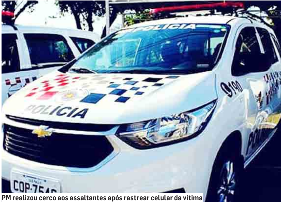
PM realizou cerco aos assaltantes após rastrear celular da vítima

Dois homens foram presos em flagrante por praticarem um roubo nesta terça-feira (27) no Parque Bandeirantes II, em Sumaré. O helicóptero Águia da Polícia Militar apoiou as equipes de terra. A Polícia Militar foi acionada via Copom (190) para atendimento a ocorrência de roubo. No local, a vítima passou as características dos autores e através do rastreamento do aparelho de celular da vítima que havia sido levada pelos assaltantes, indicava a localização pela Rua Júlia Teodoro da Silva Correa. Os policiais foram até o local e, ao chegarem, visualizaram, através do portão, a roupa do autor do roubo bem como o PC Gamer que também tinha sido subtraído, avaliado em R$ 12