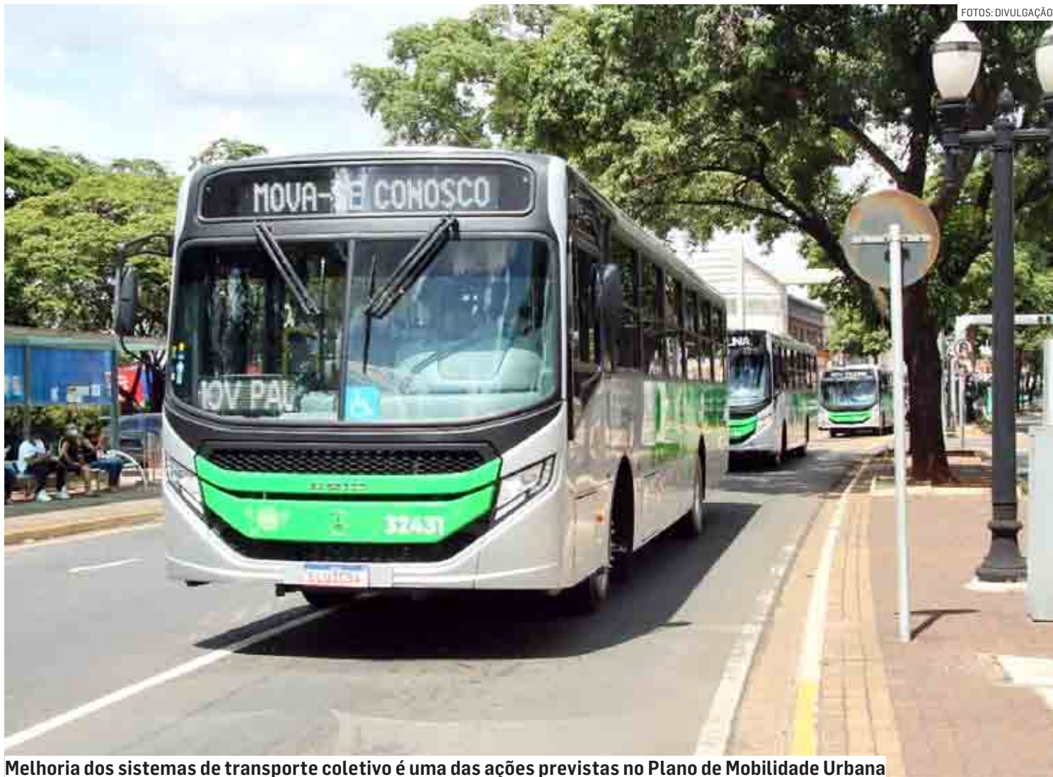
Melhoria dos sistemas de transporte coletivo é uma das ações previstas no Plano de Mobilidade Urbana

A execução do Plano de Mobilidade Urbana conta com assessoria técnica da Fipe (Fundação Instituto de Pesquisas Econômicas).