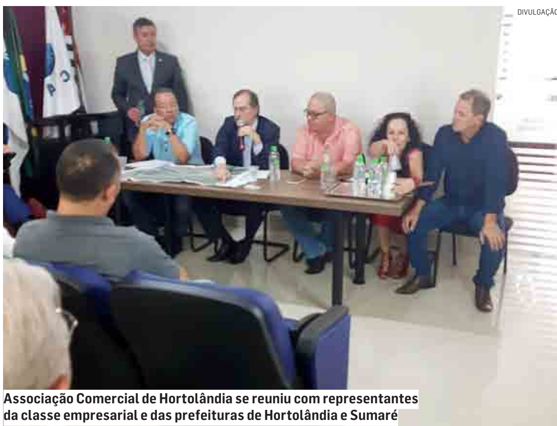
Associação Comercial de Hortolândia se reuniu com representantes da classe empresarial e das prefeituras de Hortolândia e Sumaré

As obras previstas para a região são o Viaduto sobre os trilhos da linha férrea no Vila Real; a duplicação da estrada Municipal Valêncio Callegari em Sumaré, do trecho do Portal de Hortolândia até a empresa Aderé; e a construção da ponte sobre a Bandeirantes na região do Jardim Amanda. A duplicação da Avenida Santana do terminal Rodoviário até a cabeceira da ponte também esteve em pauta na reunião.