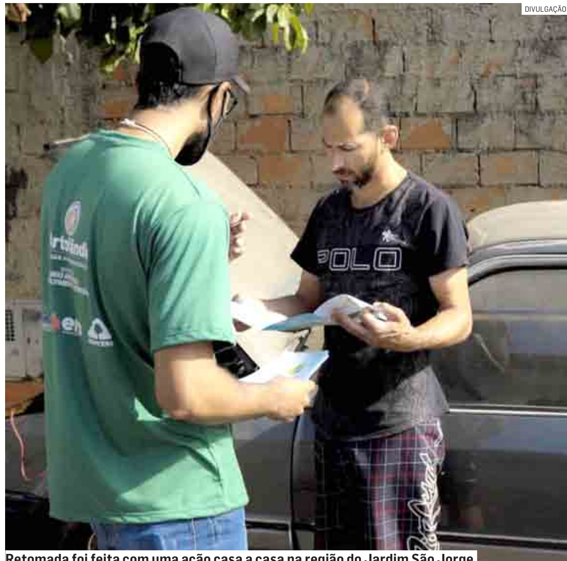
Retomada foi feita com uma ação casa a casa na região do Jardim São Jorge.

O programa "Agenda Verde" foi instituído em 2017, na gestão do falecido prefeito Angelo Perugini. Nessa primeira fase, o programa executou ações de enfrentamento às demandas ambientais, com ênfase nas questões da destinação correta dos resíduos, limpeza e zeladoria da cidade.