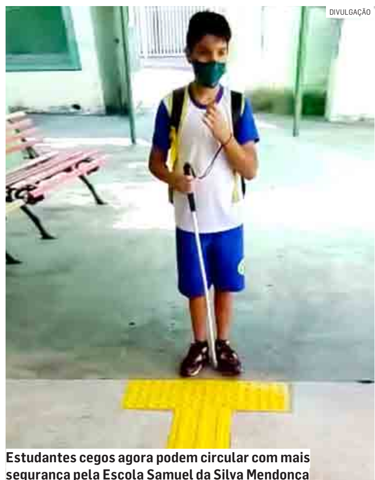
Estudantes cegos agora podem circular com mais segurança pela Escola Samuel da Silva Mendonça