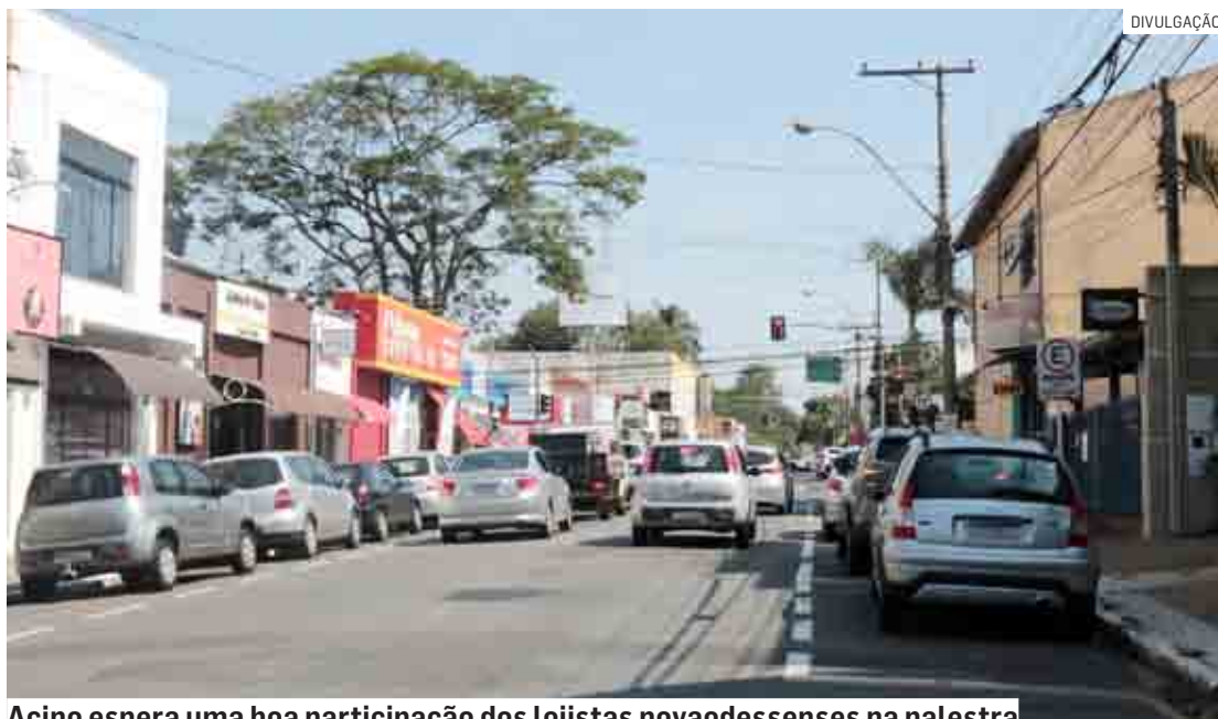
Acino espera uma boa participação dos lojistas novaodessenses na palestra

“Essa palestra foi pensada em atender o lojista de nossa cidade, porque a vitrine é o cartão de visitas da loja, ou seja, é o primeiro contato que o cliente tem com a loja”, frisou o secretário