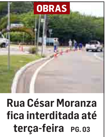
Rua César Moranza fica interditada até terça-feira PG. 03

◆ SUMARÉ (CENTRO) | NOVA VENEZA | PICERNO | MARIA ANTONIA | ÁREA CURA | MATÃO ◆ HORTOLÂNDIA ◆ NOVA ODESSA ◆ MONTE MOR ◆ ELIAS FAUSTO ◆ PAULÍNIA ◆