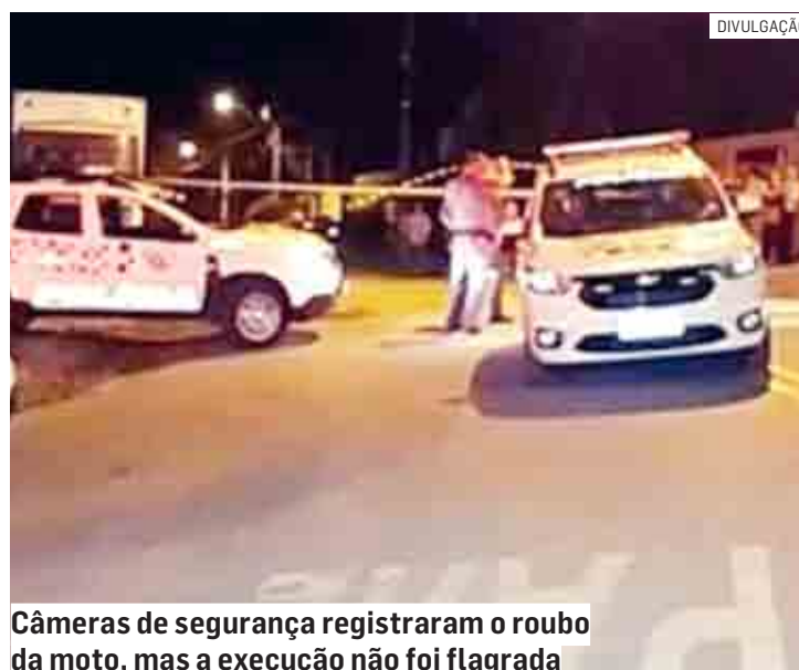
Câmeras de segurança registraram o roubo da moto, mas a execução não foi flagrada

gacia e liberado por falta de provas, segundo informações da Secretaria de Segurança Pública do Estado (SSP/SP).