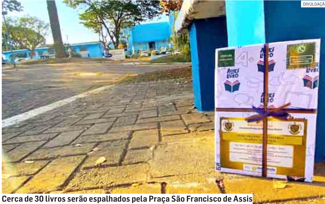
Cerca de 30 livros serão espalhados pela Praça São Francisco de Assis

Os livros estarão em embrulho de presente com identificação da Biblioteca Municipal. Cada embrulho terá um adesivo que informa qual é o gênero do livro. As peças serão deixadas em locais públicos, como bancos, mesas e árvores.