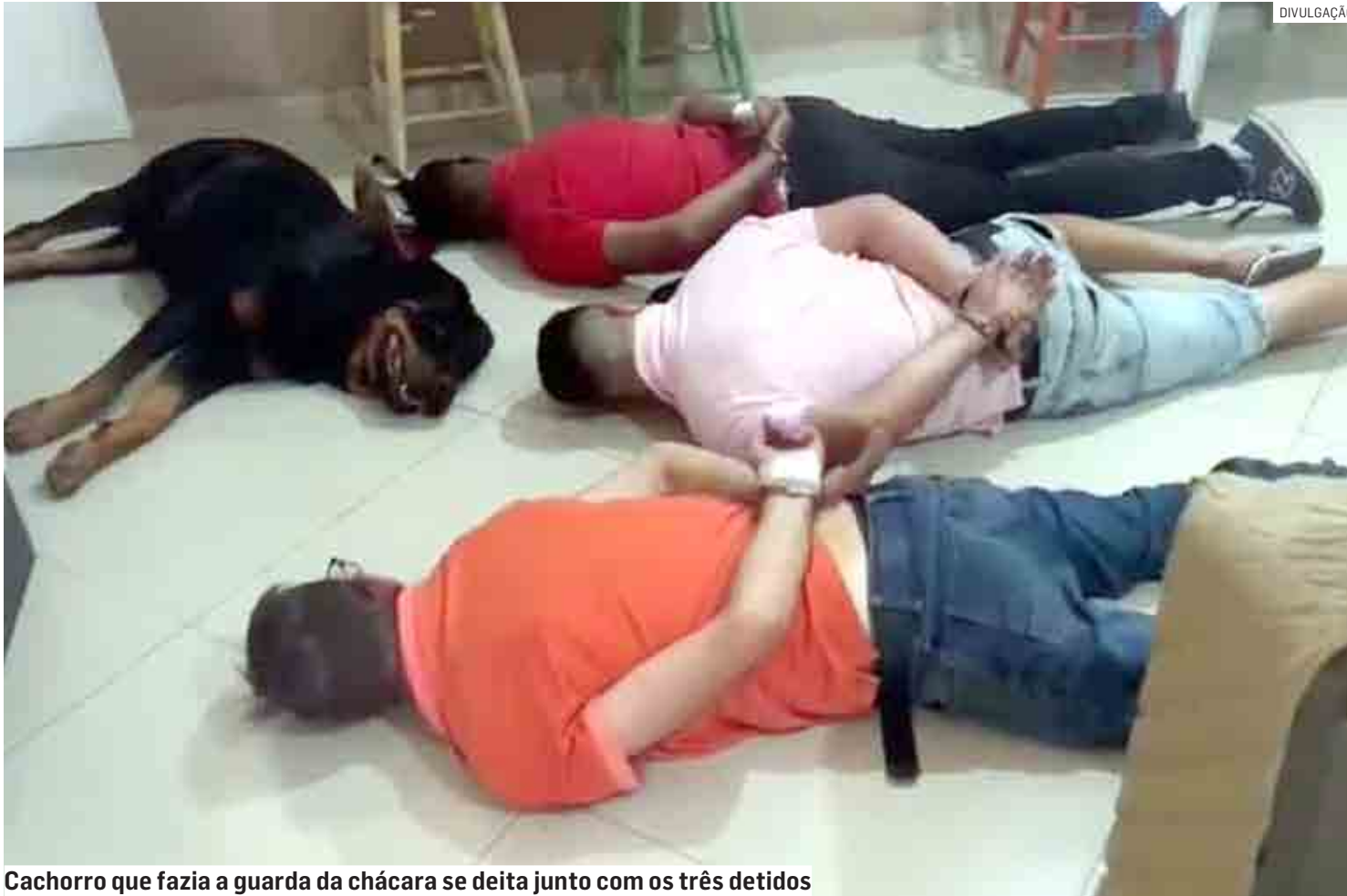
Cachorro que fazia a guarda da chácara se deita junto com os três detidos

Cerco aborda carreta que vinha de Campo Grande/MS e iniciava descarregamento de 1.141 quilos de drogas em chácara de Hortolândia