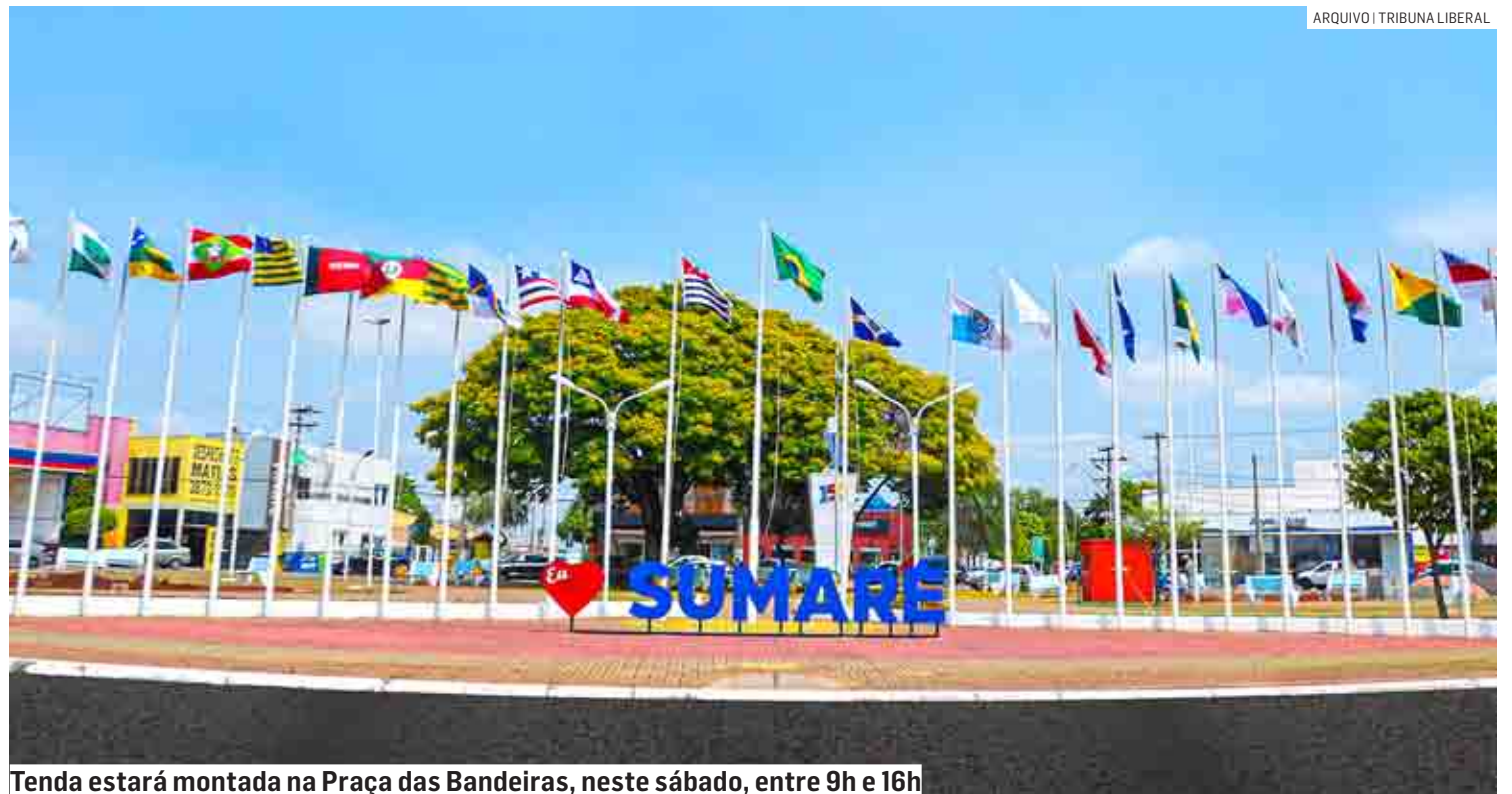
Tenda estará montada na Praça das Bandeiras, neste sábado, entre 9h e 16h

so, a ação tem como objetivo conscientizar os consumidores sobre a necessidade de descartar corretamente produtos eletrônicos e eletrônicos, de maneira a não impactar o meio ambiente, colaborando para a conservação da natureza.