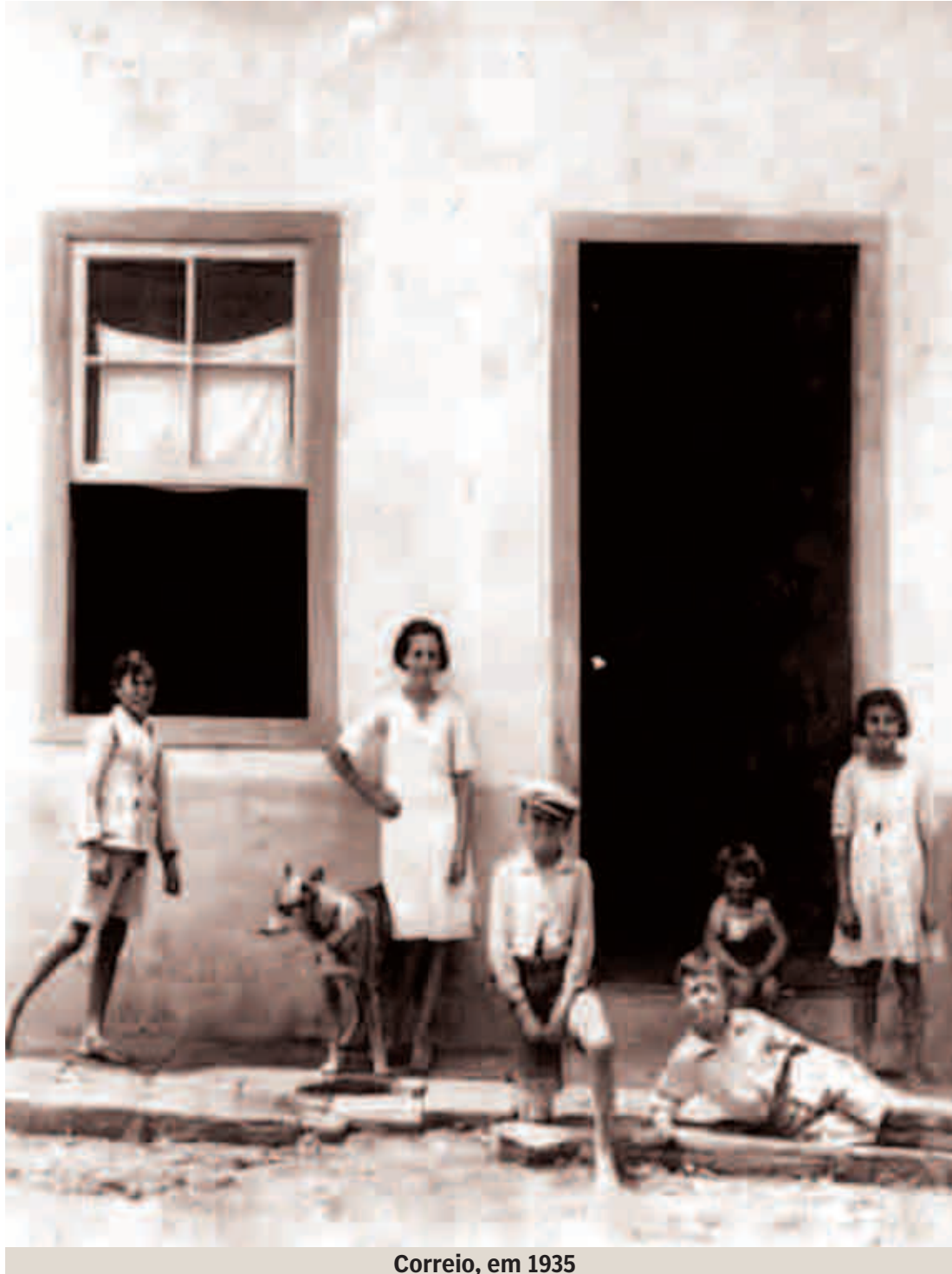
Correio, em 1935

Do final do século XIX, mais precisamente de 1891 até 1940 circulava um almanaque editado no Rio de Janeiro que trazia informações sobre muitas cidades brasileiras localizadas em diversos estados da união. Na edição de 2015 encontramos muitas referências sobre Monte Mor e destacamos algumas dessas informações que consideramos interessantes.