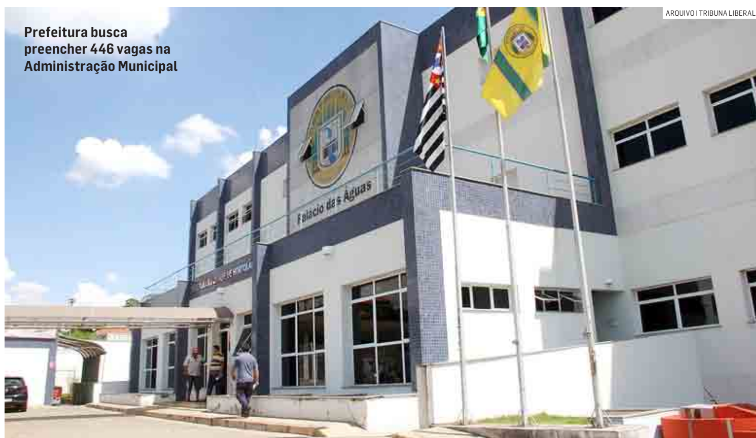
Prefeitura busca preencher 446 vagas na Administração Municipal

✓ A fim de evitar aglomerações e contratemplos, procure chegar ao local de prova com antecedência, de modo a estacionar o veículo com tranquilidade nas proximida-