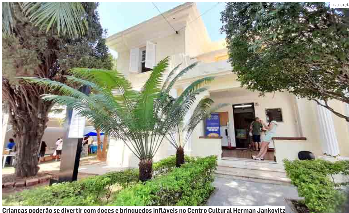
Crianças poderão se divertir com doces e brinquedos infláveis no Centro Cultural Herman Jankovitz

Atrações fazem parte da edição do “Casarão de Portas Abertas”; gastronomia e barracas de artesanato também estão na programação