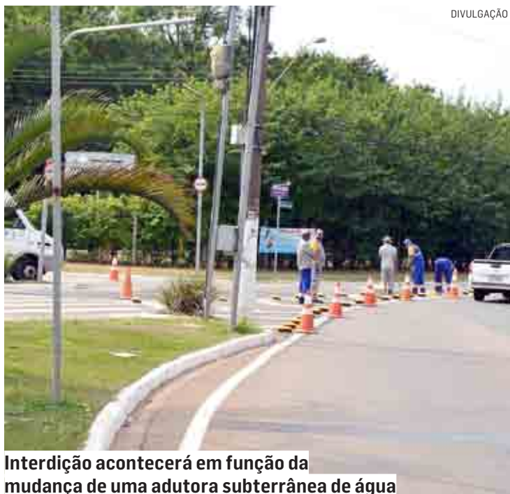
Interdição acontecerá em função da mudança de uma adutora subterrânea de água

A interdição é necessária para obras de mudança de uma adutora subterrânea de água com traçado que passa pela via, realizada pela concessionária responsável pelo serviço de água e esgoto no município. A orientação da pasta é que os motoristas evitem o trecho