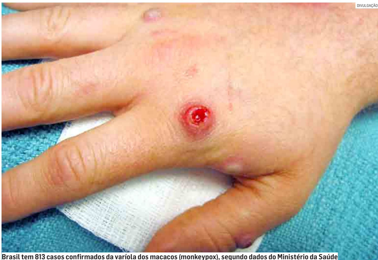
Brasil tem 813 casos confirmados da varíola dos macacos (monkeypox), segundo dados do Ministério da Saúde

em dois dias. A vice-diretora da Opas, Mary Lou Valdez, disse que quase todos os casos continuam sendo relatados entre homens que fazem sexo com homens, entre 25 e 45 anos, mas alertou que qualquer pessoa pode contrair a doença, independentemente de gênero ou orientação se-