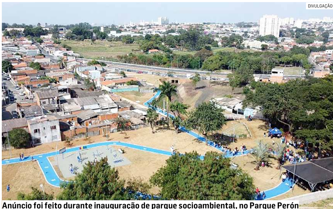
Anúncio foi feito durante inauguração de parque socioambiental, no Parque Perón

“Aqui era o presídio, todo mundo falava a cidade do presídio e aí foi feita