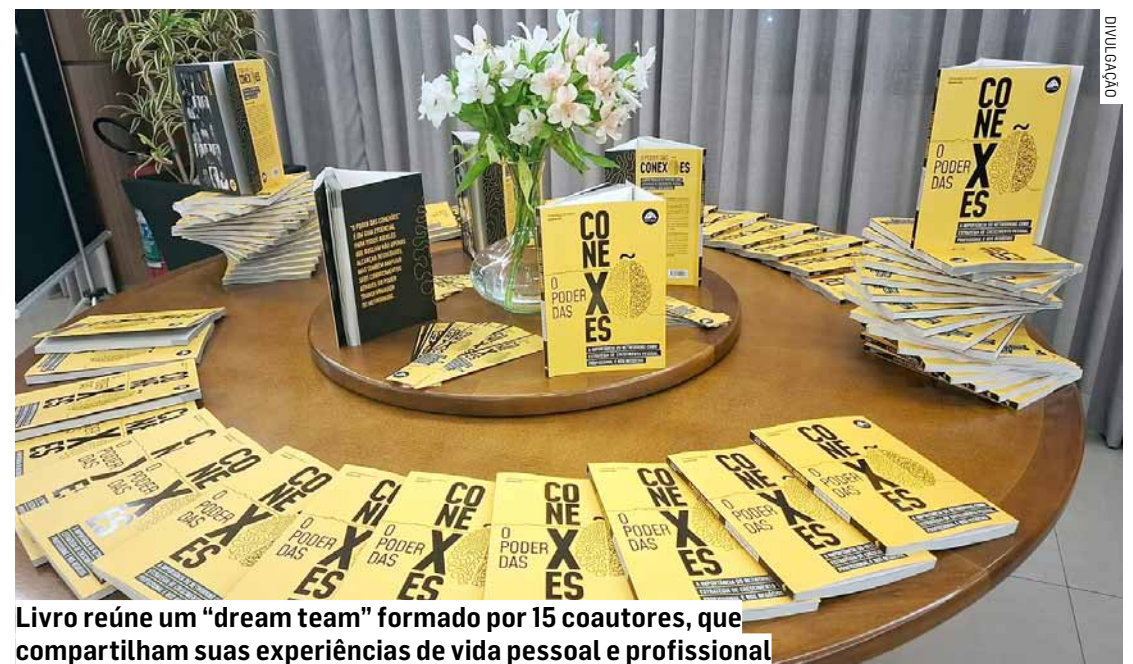
Livro reúne um “dream team” formado por 15 coautores, que compartilham suas experiências de vida pessoal e profissional

O livro “O Poder das Conexões” reúne um “dream team” formado por 15 coautores, que compartilham as suas experiências de vida pessoal e profissional, além de conceitos e técnicas, explorando a dificuldade que cada um enfrentou para se