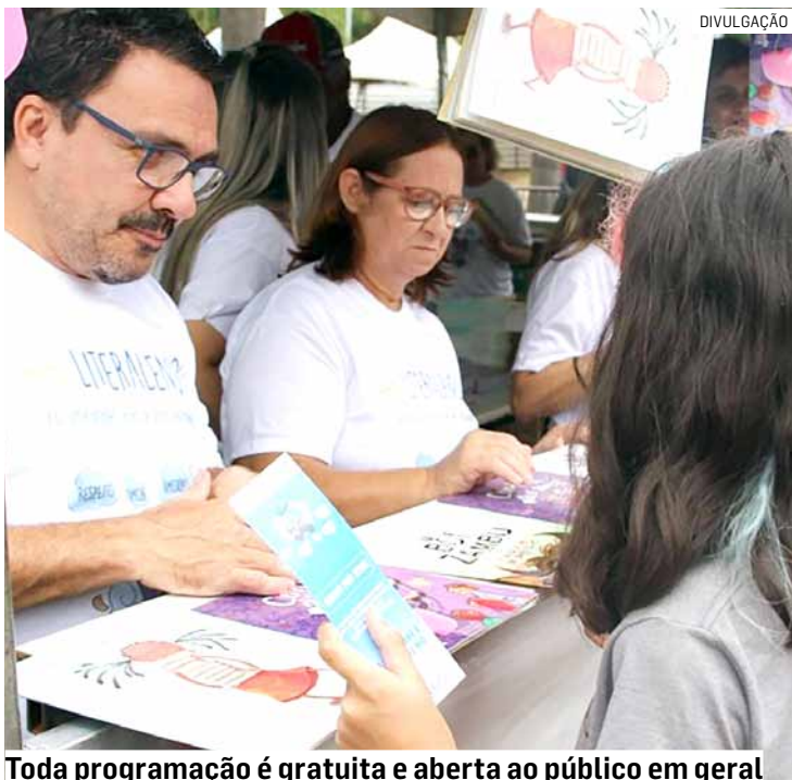
Toda programação é gratuita e aberta ao público em geral

Da Redação • HORTOLÂNDIA tribunaliberal@tribunaliberal.com.br