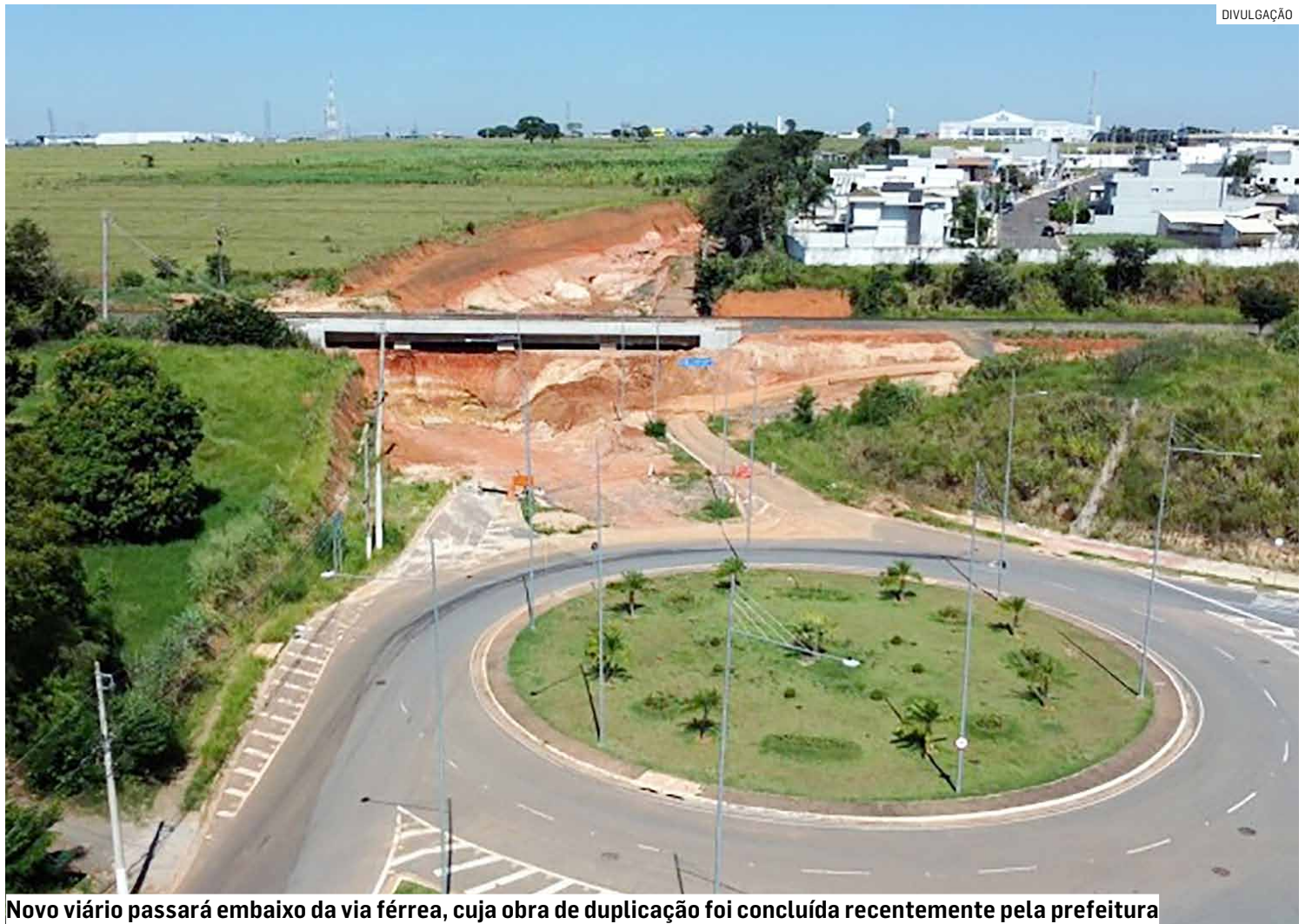
Novo viário passará embaixo da via férrea, cuja obra de duplicação foi concluída recentemente pela prefeitura

O novo viário passará embaixo da via férrea, cuja obra de duplicação foi concluída recentemente pela Administração Municipal. Ainda segundo a Secretaria de Obras, o consórcio já iniciou a elaboração do projeto da obra, cuja data de início ainda não está definida, mas que deve ocorrer ainda este ano. A licitação prevê, também, que o consórcio realize a obra do parque no entorno do novo Paço Municipal, que já está em andamento. Também estão previstas as obras do parque Santa Emília, do viário que ligará a Estrada Municipal Sabina Baptista de Camargo ao Jardim Nova Europa e de um viário na região da Vila Inema. Segundo a Secretaria de Obras, a duração total prevista de todas essas obras é de 14 meses e serão feitas com recurso do Fonplata (Fundo Financeiro para Desenvolvimento da Bacia do Prata).