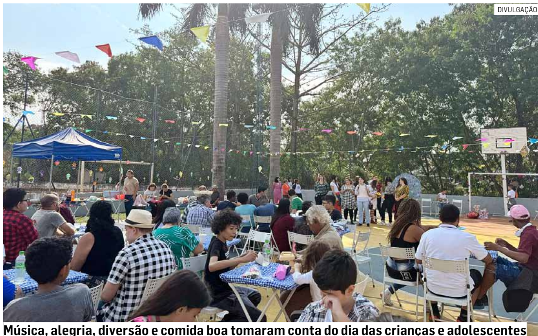
Música, alegria, diversão e comida boa tomaram conta do dia das crianças e adolescentes

O diagnóstico é clínico e realizado através da observação com base nos sinais e sintomas específicos. Também são avaliados sintomas comórbidos, história do desenvolvimento neuropsicomotor e anormalidades, antecedentes gestacionais e neonatais, comorbidades, comportamento de sono e alimentar, história familiar, aplicação de escalas, relato de professores e cuidadores. Além disso, há observação direta e entrevista com a