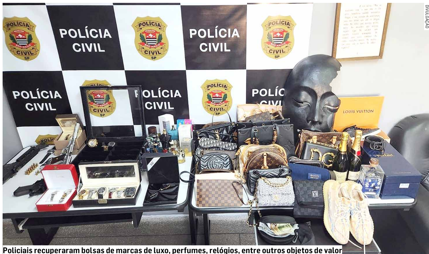
Policiais recuperaram bolsas de marcas de luxo, perfumes, relógios, entre outros objetos de valor