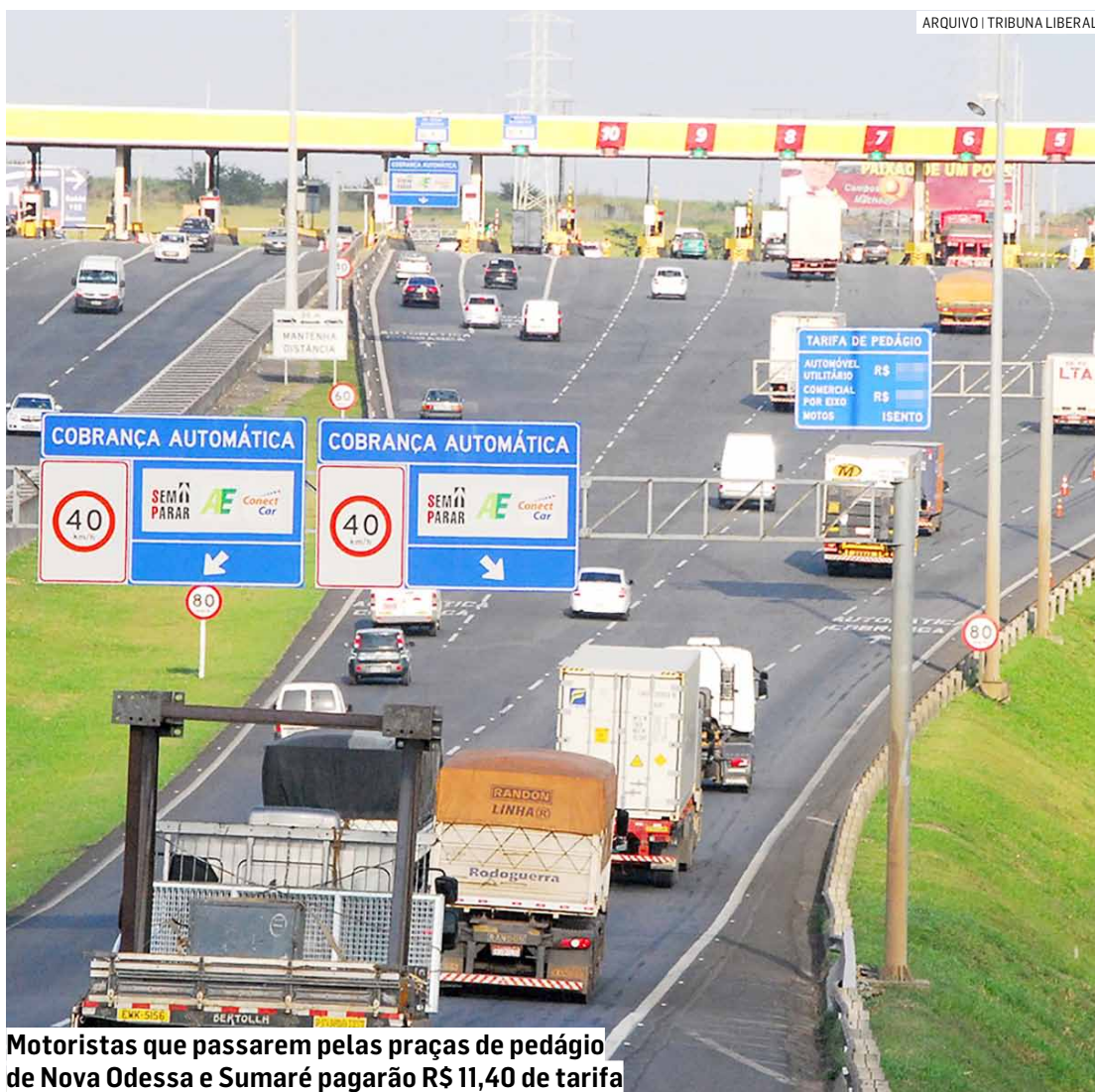
Motoristas que passarem pelas praças de pedágio de Nova Odessa e Sumaré pagarão R$ 11,40 de tarifa

Foi publicada no Diário Oficial do Estado, na quinta-feira (27), a tabela com os novos valores de reajuste anual das tarifas de pe-