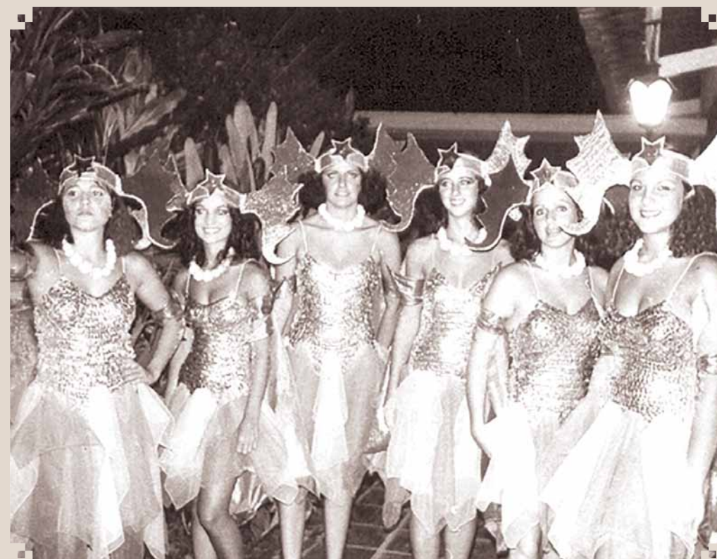
Foto de um Carnaval acontecido na sede social do Recreativo, na Avenida Rebouças, provavelmente na década de 1980. O local tinha sido adaptado pelo clube para ser sede social; nesse lugar existia uma cancha de bochas e malhas. Na época eram comuns os blocos de jovens nos carnavais, como os da fotografia.