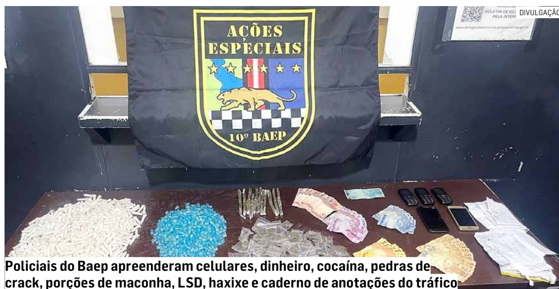
Policiais do Baep apreenderam celulares, dinheiro, cocaína, pedras de crack, porções de maconha, LSD, haxixe e caderno de anotações do tráfico

No imóvel os militares encontraram quatro kits de droga na sala de estar. Foi dada voz de prisão à suspeita pelo crime de tráfico de drogas, sendo que nesse instante, a suspeita investiu contra os policiais na tentativa de se evadir da equipe, gritando por socorro, arranhando um policial e mordendo o antebraço de outro policial. A mulher foi contida e imobilizada.