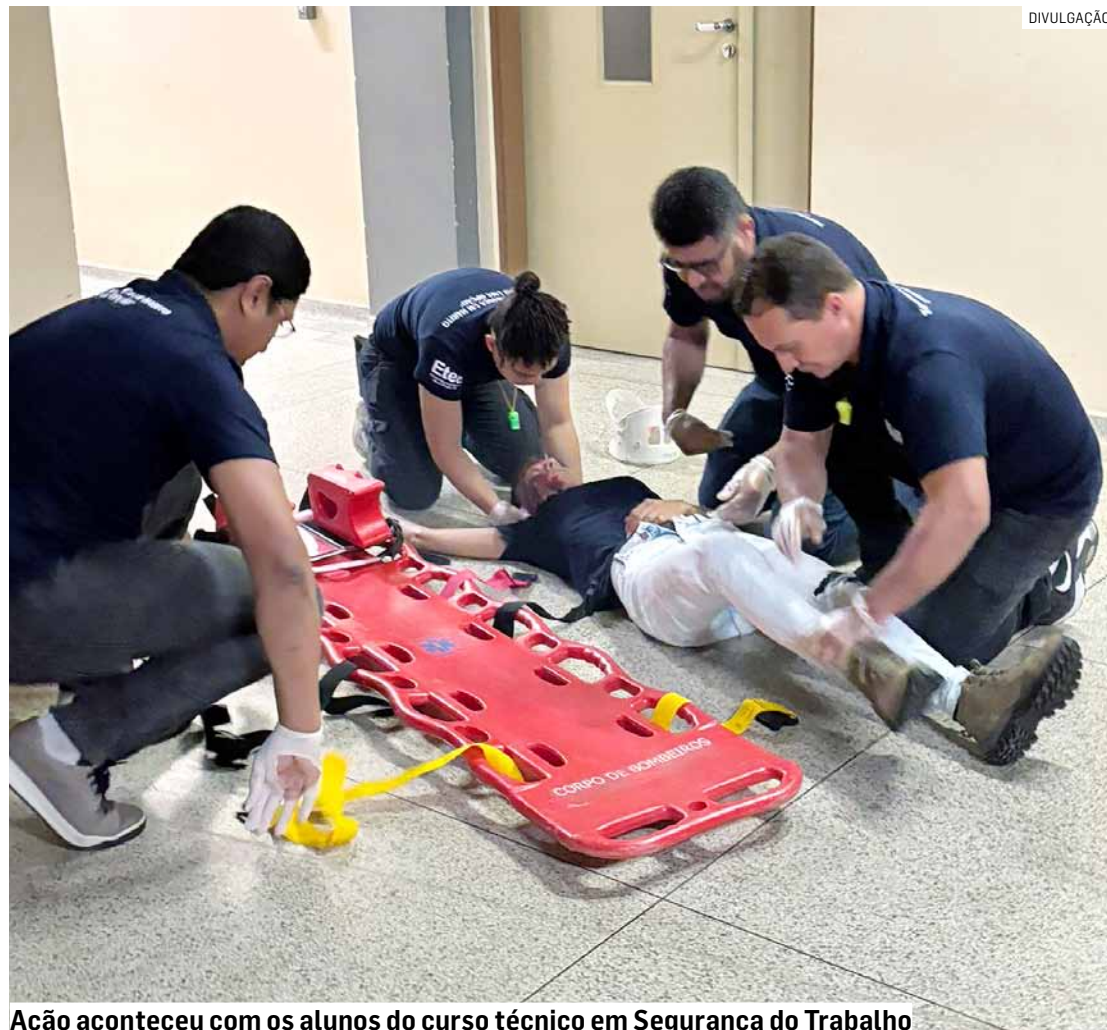
Ação aconteceu com os alunos do curso técnico em Segurança do Trabalho

Para o simulado, houve duas explosões de bombas com fumaça, simulando que nesta área estava pegando fogo com uma vítima. Os alunos usaram ex-