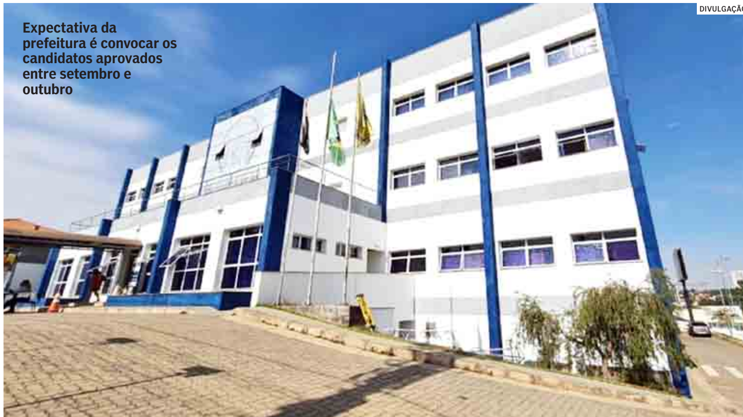
Expectativa da prefeitura é convocar os candidatos aprovados entre setembro e outubro

De acordo com os dados enviados pela empresa responsável pela aplicação das provas, a SH-Dias Consultoria e Assessoria ( www.shdias.com.br ), os cargos mais disputados estão na área