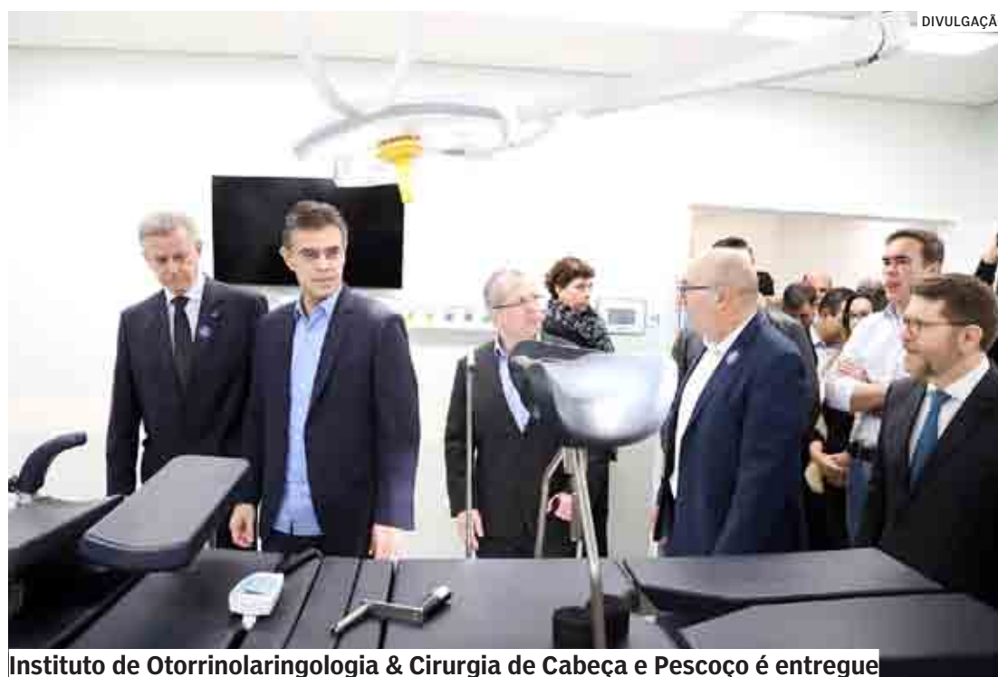
Instituto de Otorrinolaringologia & Cirurgia de Cabeça e Pescoço é entregue

Os atendimentos serão realizados para pacientes encaminhados pela Cross (Central de Regulação de Vagas e Ofertas e Serviços de Saúde). O Governo do