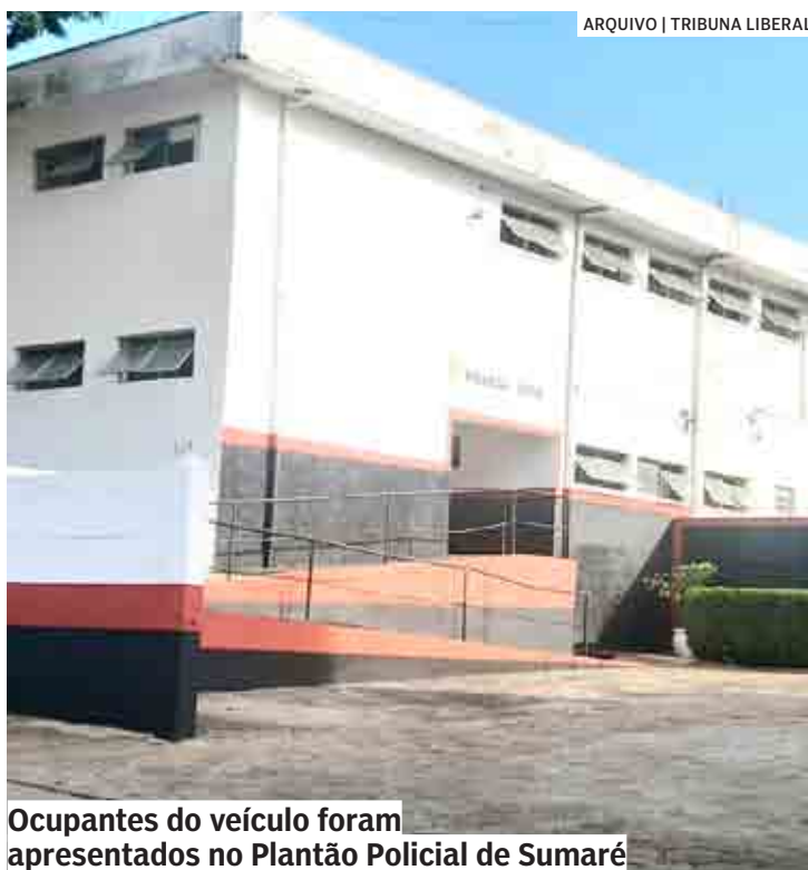
Ocupantes do veículo foram apresentados no Plantão Policial de Sumaré

A equipe de força tática foi checar denúncia de que um veículo Toyo-