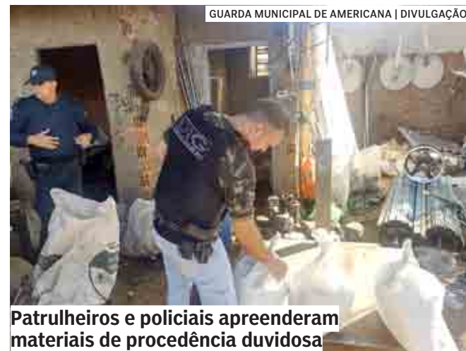
Patrulheiros e policiais apreenderam materiais de procedência duvidosa

Foram expedidos mandados a comércios de sucatas nas ruas dos Cactos, Rua das Petúnias, Rua dos Colibris, Rua Luiz Braga, Rua Mário Barbosa, Rua Maranhão, Rua Rio Claro, Rua Tarquinio Benencasse, Rua Japurá, Av. Tietê, Rua Guaíba, Av. Prefeito Abdo Najar, além de um depósito localizado na Rua do Magnésio, em Santa Bárbara d'Oeste.