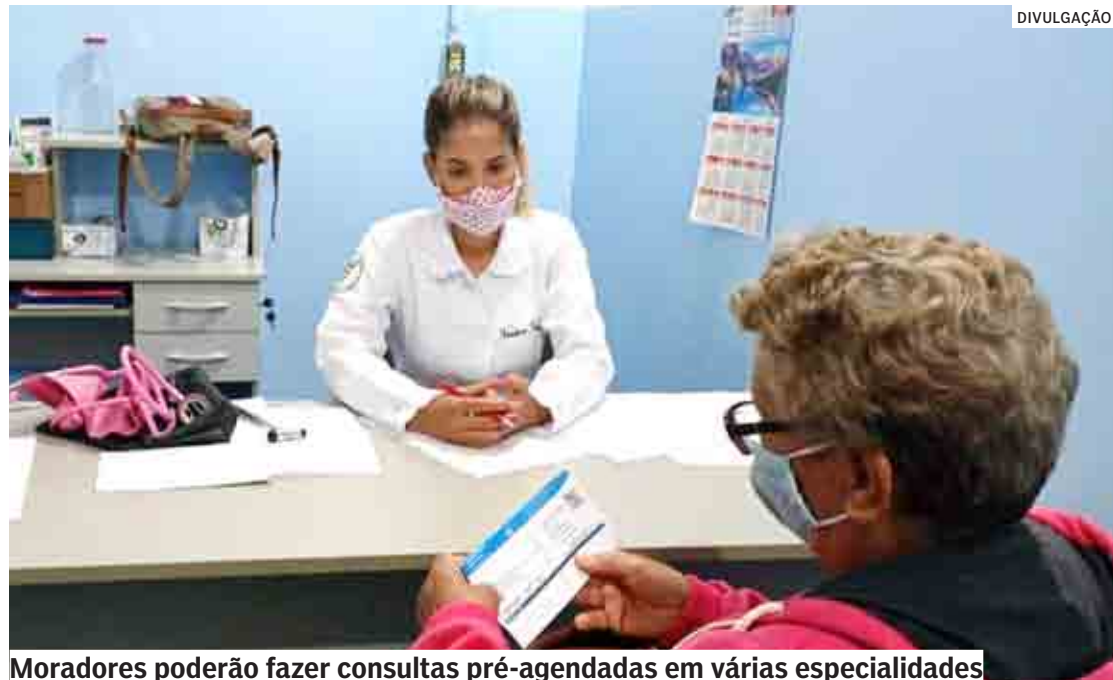
Moradores poderão fazer consultas pré-agendadas em várias especialidades

Serão ofertadas consultas pré-agendadas em diversas especialidades e mais de 2.500 exames preventivos