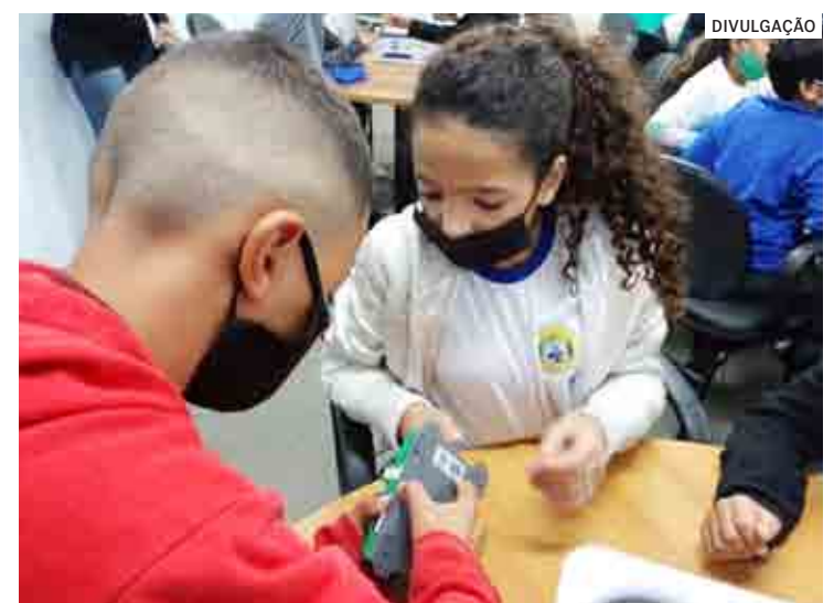
Aula foi ministrada a alunos do 4º e 5º anos do Ensino Fundamental, na Emeb Richard Chibim Naumann.

Iniciativa da própria Prefeitura, o projeto é coordenado pela Diretoria de Ciência e Tecnologia e busca promover nos estudantes habilidades como criatividade, experimentação, trabalho em equipe, dentre outros. Desde abril deste ano, profissionais da educação passam por formação específica para trabalhar os novos conteúdos e práticas em sala de aula. Na disciplina, são usados kits da empresa Alpha Mecatrônica, composto por peças e placas de alumínio recicláveis, rodas de plástico com pneus emborrachados, motores, baterias e sensores de luz, tempera-