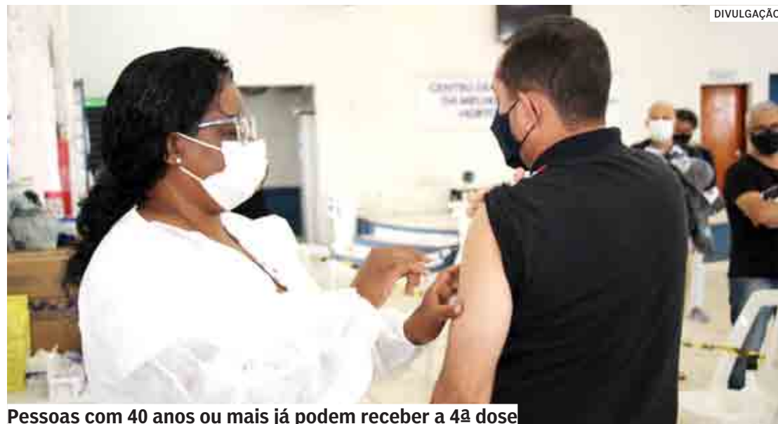
Pessoas com 40 anos ou mais já podem receber a 4ª dose

A Prefeitura ainda ressalta que a campanha de