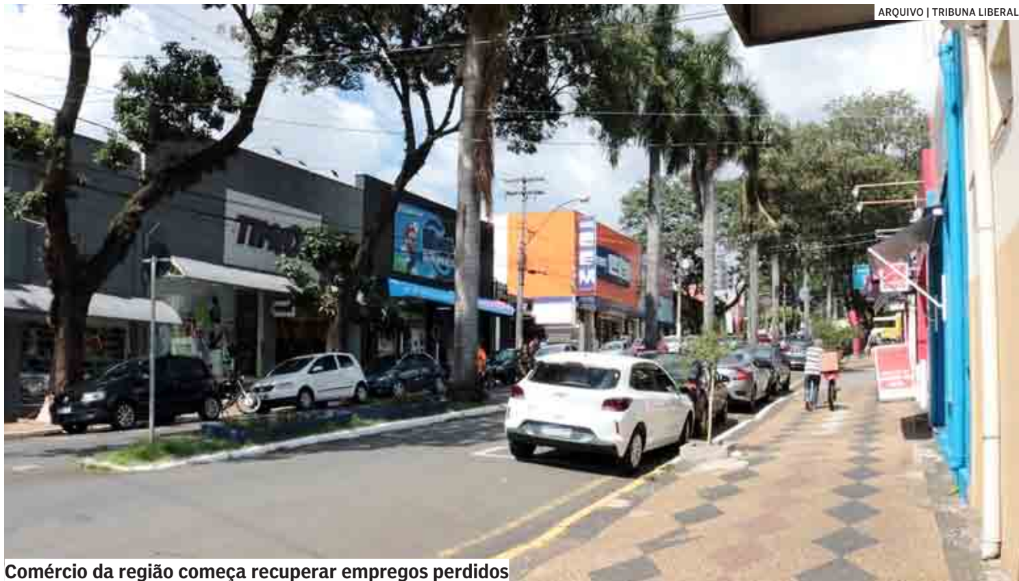
Comércio da região começa recuperar empregos perdidos

“No comportamento da região, nos cinco municípios, foi relativamente fraco, se considerar que na Região Metropolitana foram gerados em torno de 6, 4 mil vagas. Os municípios geraram menos postos de trabalho. Seria legal se esses municípios tivessem um comportamento mais dinâmico no emprego industrial, sendo comandado pelas empresas que estão situadas nesse espaço. Isso corrobora para dificuldade dos segmentos mais dinâmicos da economia estarem puxando o crescimento, que seriam os segmentos industriais, por conta da demanda por consumo que não está crescendo tão fortemente, porque os salários estão baixando e a inflação está alta, porque isso tira o poder de compra. Ao mesmo tempo, tem uma certa desorganização das cadeias produ-