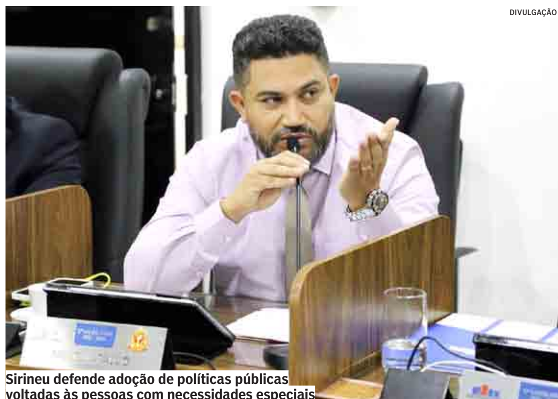
Sirineu defende adoção de políticas públicas voltadas às pessoas com necessidades especiais

Da Redação | SUMARÉ tribunaliberal@tribunaliberal.com.br