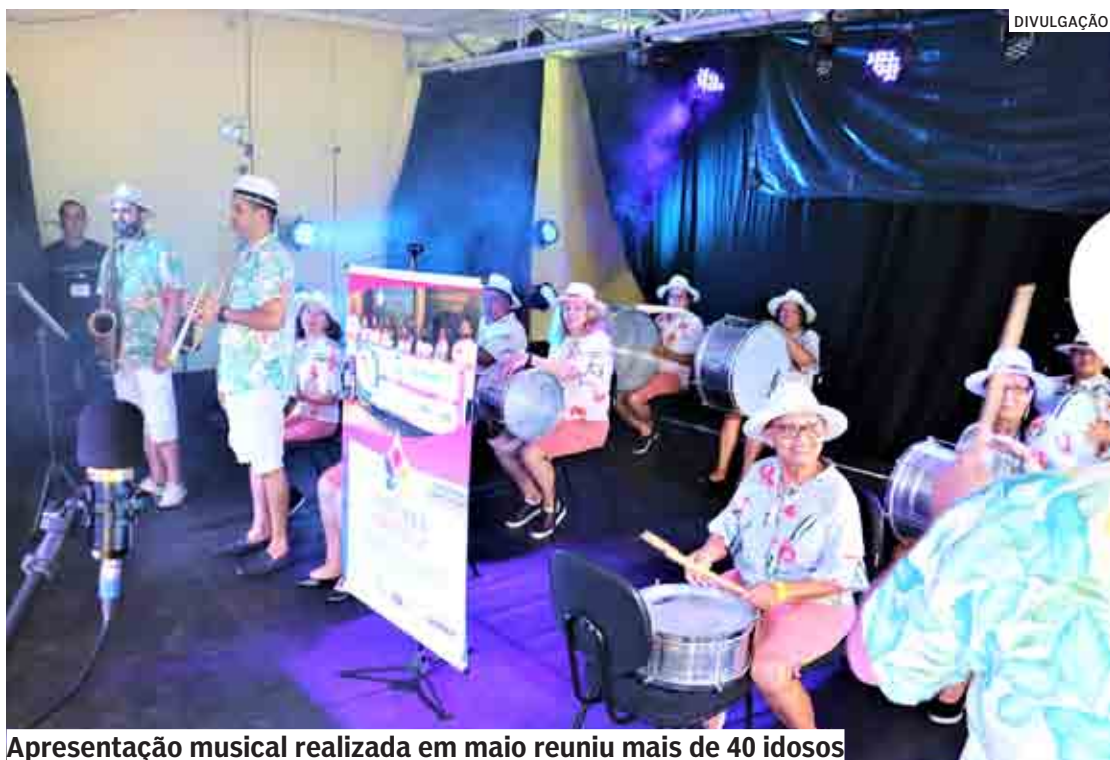
Apresentação musical realizada em maio reuniu mais de 40 idosos

Iniciativa do Instituto Saber Social mostra histórias de superação e resiliência; aulas presenciais retornaram em 2022 após interrupção por causa da pandemia