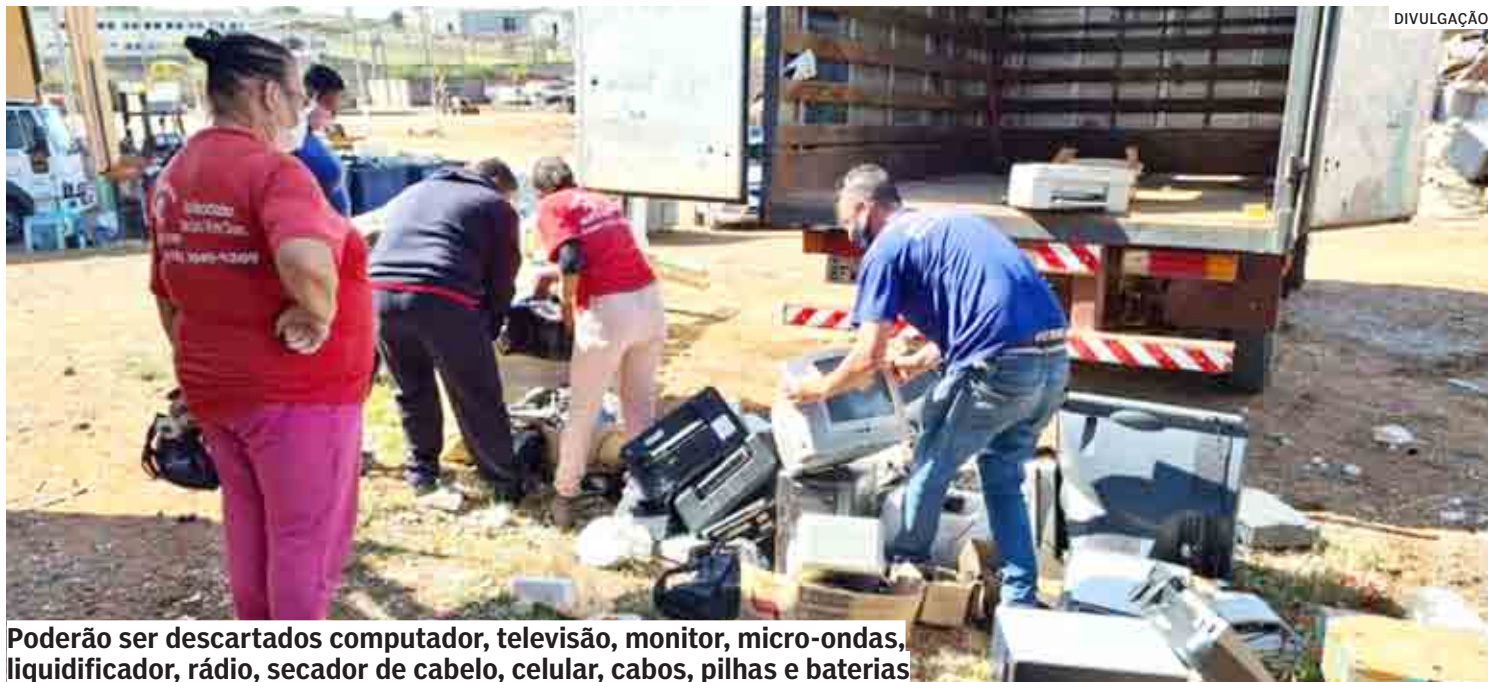
Poderão ser descartados computador, televisão, monitor, micro-ondas, liquidificador, rádio, secador de cabelo, celular, cabos, pilhas e baterias