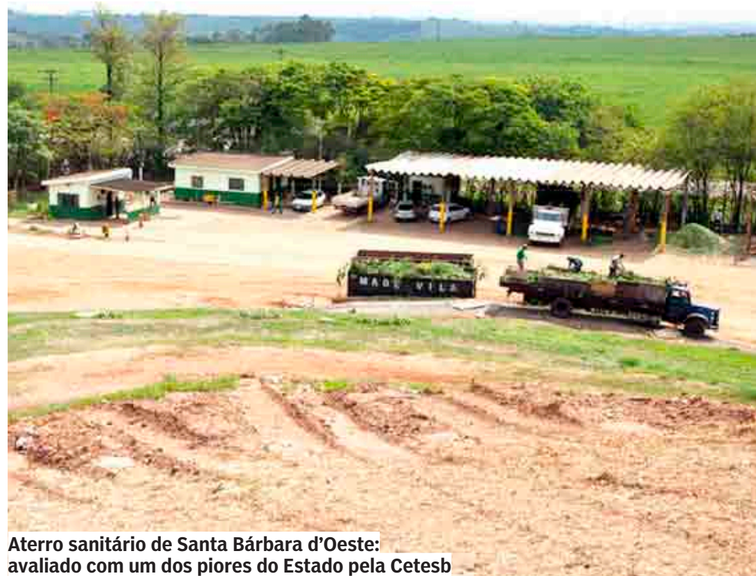
Aterro sanitário de Santa Bárbara d’Oeste: avaliado com um dos piores do Estado pela Cetesb

De acordo com o Consimares, a ideia da usina surgiu diante da necessidade de se buscar um destino mais sustentável para os resíduos sólidos, “que crescem exponencialmente, ao mesmo tempo em que os aterros sanitários da região estão próximos do fim de sua vida útil”.