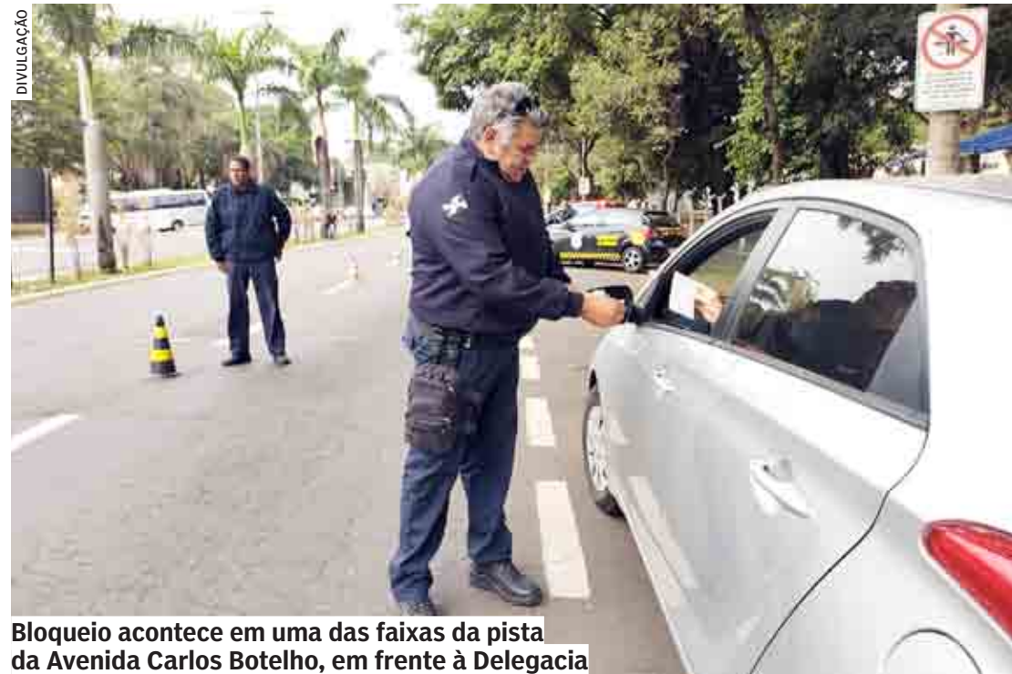
Bloqueio acontece em uma das faixas da pista da Avenida Carlos Botelho, em frente à Delegacia

A exemplo da edição realizada no último dia 19/05, além da blitz educativa, a atividade do "Maio Amarelo" vai contar com ações da Saúde Municipal, como aferição de pressão arterial e teste de glicemia. Será feito o bloqueio em uma via da