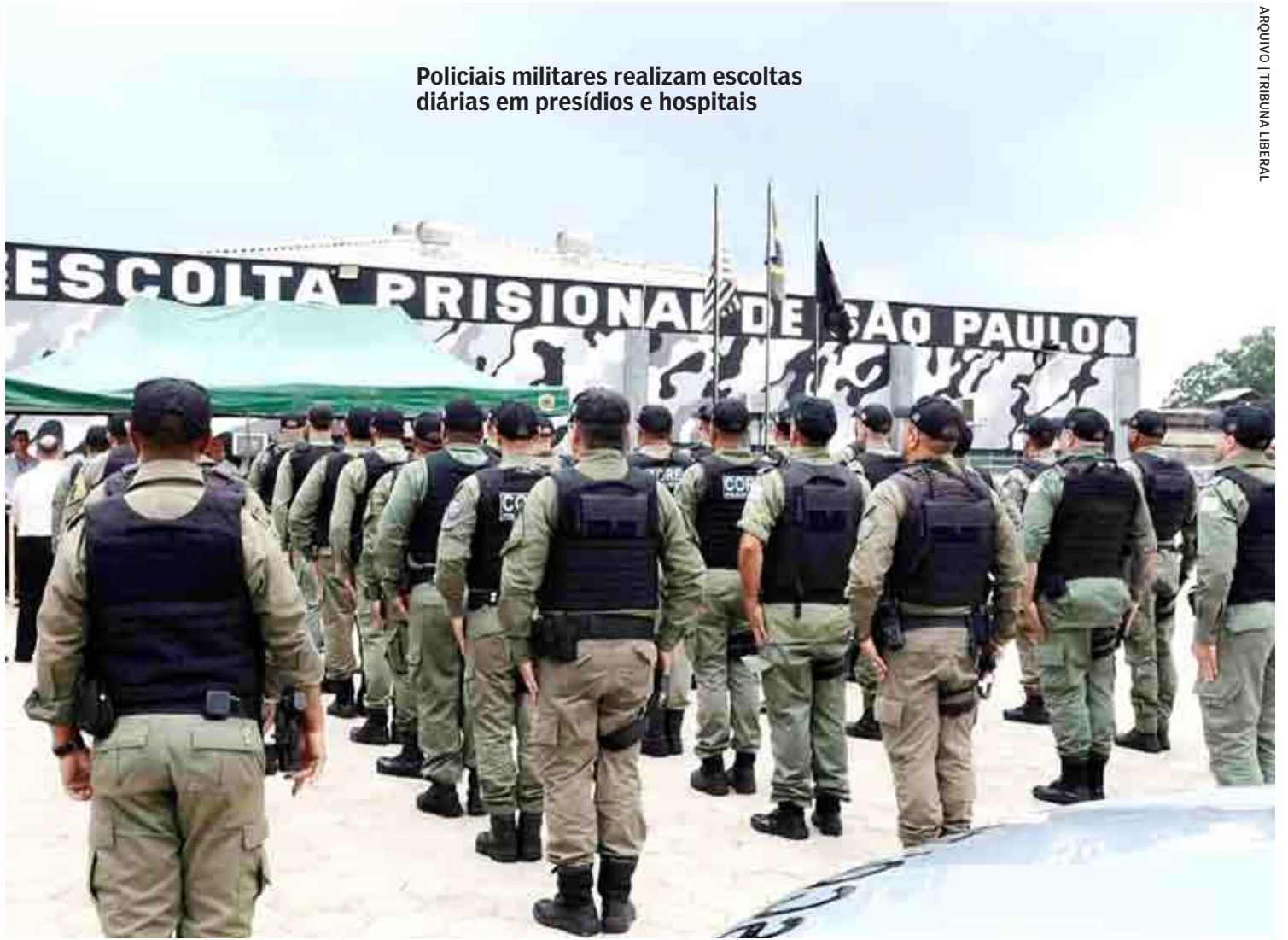
Policiais militares realizam escoltas diárias em presídios e hospitais