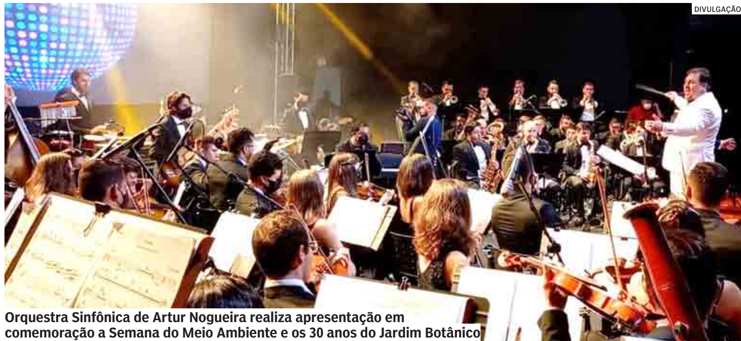
Orquestra Sinfônica de Artur Nogueira realiza apresentação em comemoração a Semana do Meio Ambiente e os 30 anos do Jardim Botânico

O Botânico também faz doação de mudas de plantas aromáticas e na-