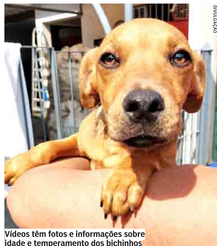
Vídeos têm fotos e informações sobre idade e temperamento dos bichinhos

Todos os vídeos têm fotos e informações sobre idade e temperamento dos bichinhos. O conteúdo é exibido nos vários pontos da cidade que já contam com a TV, além dos canais de comunicação da empresa. Quem