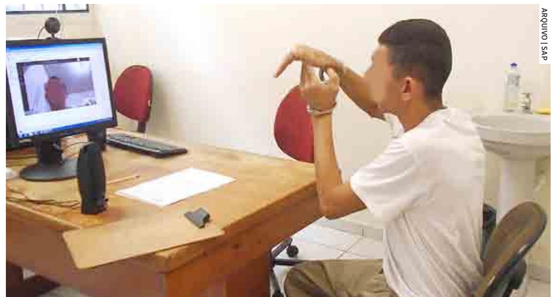
Salas de teleaudiências têm reduzido deslocamento de presos e gastos com transporte

Outra medida para aumentar o efetivo policial nas ruas foi a ampliação robusta do sistema de teleaudiências criminais no sistema prisional de São Paulo. Em 2019, eram apenas 39 salas de teleaudiência, e, atualmente, este número saltou para 731.