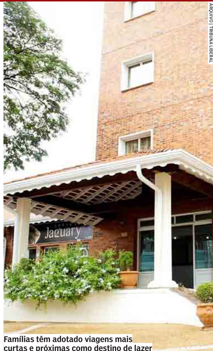
Famílias têm adotado viagens mais curtas e próximas como destino de lazer

"O setor de turismo na RMC vem se destacando, com Campinas aparecendo no painel criado pelo Centro de Inteligência da Economia do Turismo (CIET), da Secretaria de Turismo e Viagens do Estado, com 93,78% nas postagens positivas e interações de turistas e visitantes feitas no Google e TripAdvisor e monitoradas pela Reviewpro, sendo o maior índice entre as 10