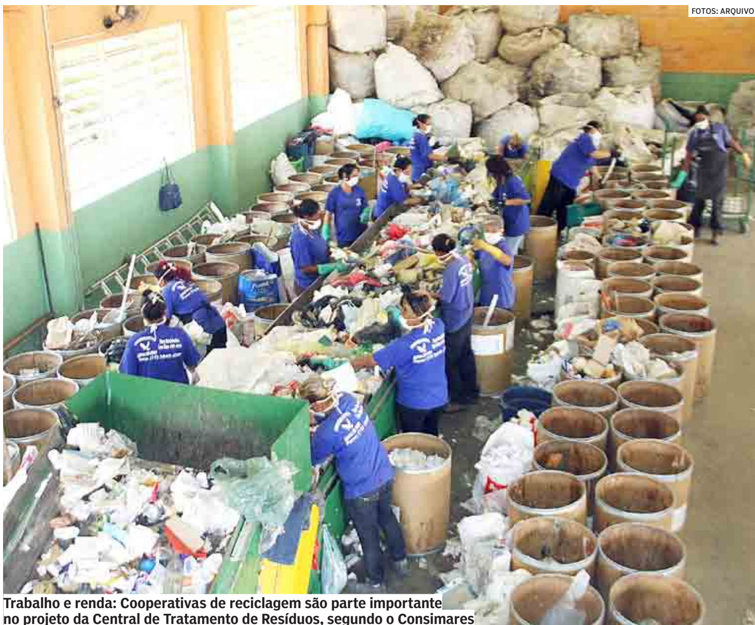
Trabalho e renda: Cooperativas de reciclagem são parte importante no projeto da Central de Tratamento de Resíduos, segundo o Consimares

Além disso, produzirá 160 mil MWH/ano de energia elétrica, o suficiente para abastecer 500 mil habitantes, metade da população da área de abrangência do Consórcio. O investimento estimado é de R$ 500 milhões, con-