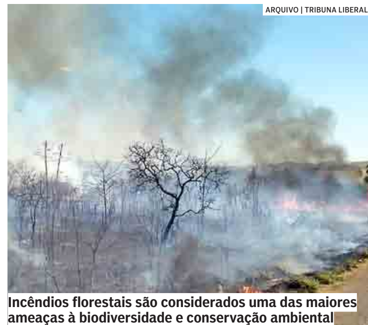
Incêndios florestais são considerados uma das maiores ameaças à biodiversidade e conservação ambiental

Antes do início da fase vermelha, a Defesa Civil do Estado realiza as Oficinas Preparatórias para a Operação Estiagem (OPOE) destinadas aos agentes municipais de Proteção e Defesa Civil,