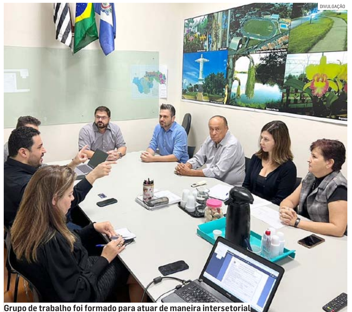
Grupo de trabalho foi formado para atuar de maneira intersetorial

A rede prepara a transferência das atividades