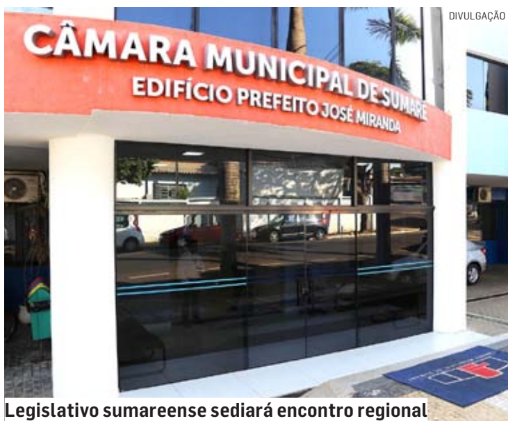
Legislativo sumareense sediará encontro regional

Da Redação • SUMARÉ tribunaliberal@tribunaliberal.com.br