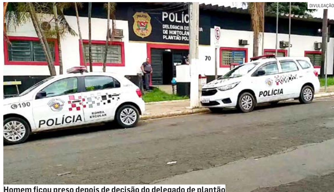
Homem ficou preso depois de decisão do delegado de plantão

Cézar Oliveira • HORTOLÂNDIA tribunaliberal@tribunaliberal.com.br