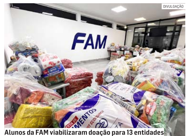
Alunos da FAM viabilizaram doação para 13 entidades

as arrecadações para 13 entidades assistenciais, que atendem pessoas em vulnerabilidade social.