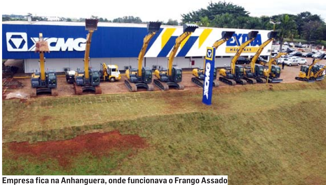
Empresa fica na Anhanguera, onde funcionava o Frango Assado

Localizada em um prédio de 16 mil metros quadrados, no quilômetro 111 da Rodovia Anhanguera (no prédio do antigo Frango Assado), a Extra Máquinas SA é a revendedora exclusiva da XCMG, terceira maior fabricante mundial, com