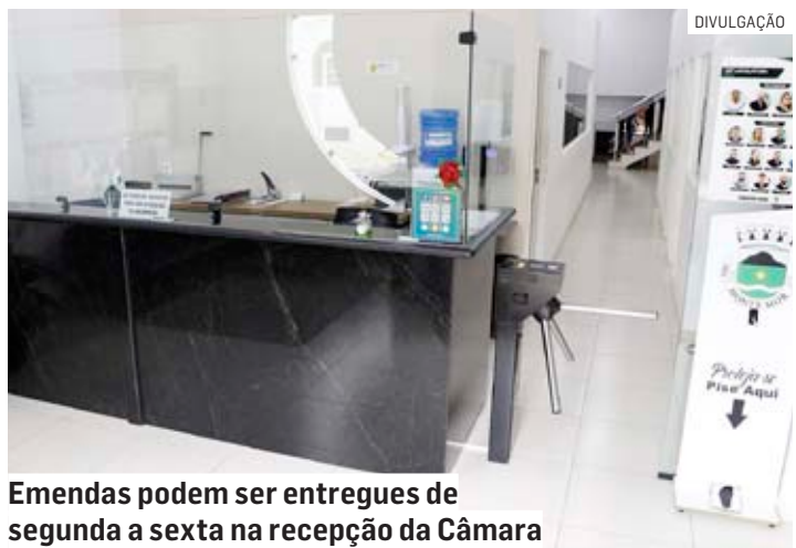
Emendas podem ser entregues de segunda a sexta na recepção da Câmara

A apresentação das emendas precisa ser feita de maneira presencial, na recepção da Câmara, de segunda a sexta-feira, das 08h às 17h. O documento deverá ser assinado por, no mínimo, 5% do eleitorado municipal, conforme o artigo 256 da Resolução nº 02/2012 (Regimento Interno), esclarece o presidente do