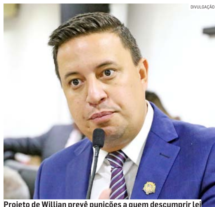
Projeto de Willian prevê punições a quem descumprir lei

Caso a lei seja aprovada, a proibição da venda de bebidas alcoólicas valerá inclusive para eventos promovidos pela escola dentro ou fora de suas dependências. Ao servidor que infringir a regra, serão aplicadas as penalidades previstas no Regime Jurídico dos Servidores Pú-