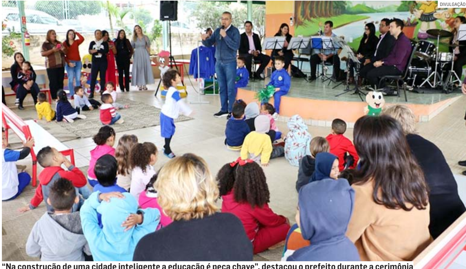
"Na construção de uma cidade inteligente a educação é peça chave", destacou o prefeito durante a cerimônia

"Neste ano, o uniforme de inverno dos alunos da rede municipal de ensino chegou no momento certo. Ao longo desta semana, entreguei kits em diversas escolas, localizadas nos quatro cantos de Hortolândia. A consolidação desse projeto me traz a sensação de dever cumprido. Na construção de uma cidade inteligente a educação é peça chave. Por isso, além de garantir o uniforme e material escolar, estamos investindo numa melhor infraestrutura de ensino, implantação da robótica, entre outros projetos