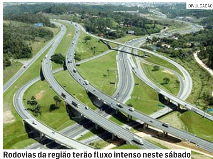
Rodovias da região terão fluxo intenso neste sábado