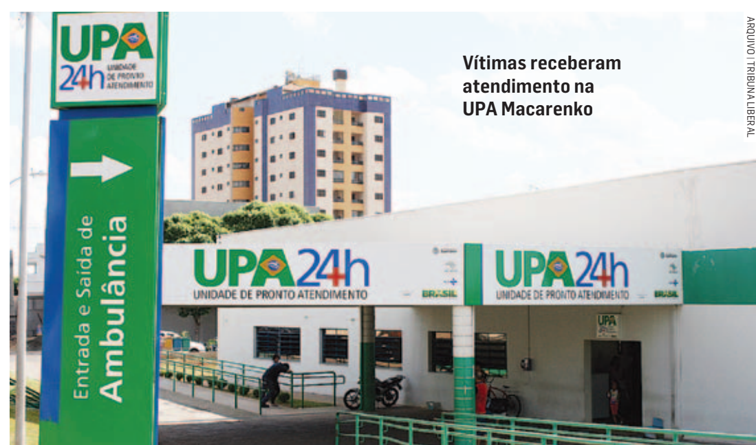
Vítimas receberam atendimento na UPA Macarenko