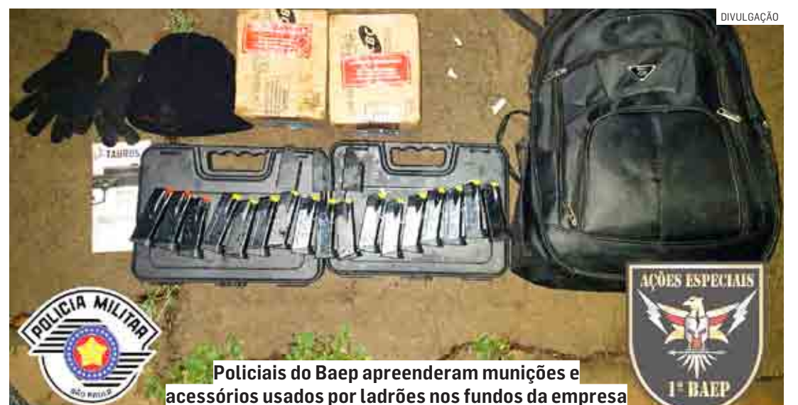
Policiais do Baep apreenderam munições e acessórios usados por ladrões nos fundos da empresa

Cézar Oliveira | REGIÃO tribunaliberal@tribunaliberal.com.br