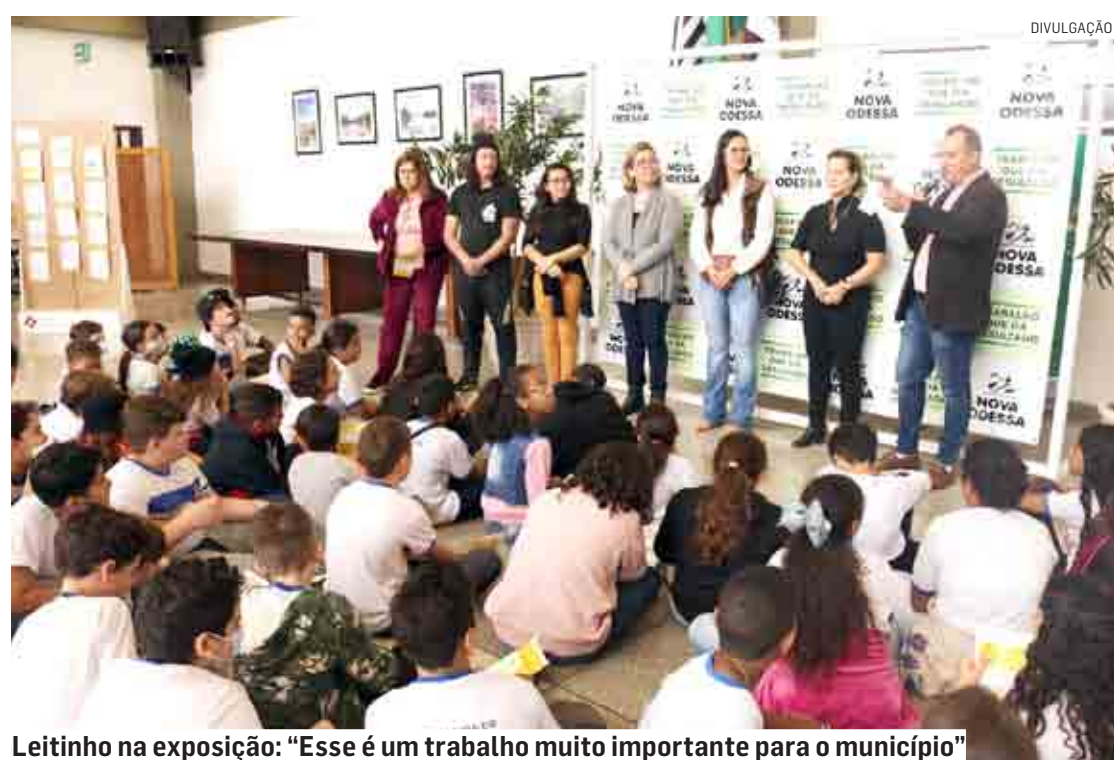
Leitininho na exposição: “Esse é um trabalho muito importante para o município”

A equipe da Secretaria de Obras trabalha há meses na elaboração do novo Plano Diretor Sustentável do município, realizou várias audiências públicas em quatro etapas, para a construção do documento, e – em parceria com a Educação –, envolveu os estudantes da Rede Municipal, trabalhando com os alunos dos 4º e 5º anos, que