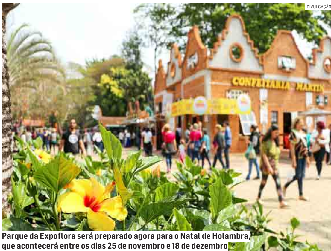
Parque da Expoflora será preparado agora para o Natal de Holambra, que acontecerá entre os dias 25 de novembro e 18 de dezembro

O Parque da Expoflora – de 250 mil m 2 - já começa a ser preparado para o Natal de Holambra, que acontecerá entre os dias 25 de novembro e 18 de dezembro, somente nos fins de semana, sendo às sextas-feiras e sábados das 16h à meia-noite e, aos domingos, das 16h às 23h. Os ingressos, com 50% de desconto (R$ 40 -