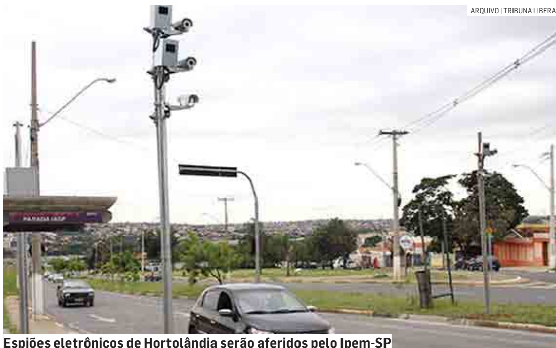
Espiões eletrônicos de Hortolândia serão aferidos pelo Ipem-SP

Diariamente, o Ipem-SP realiza a verificação metrológica dos radares, instrumentos utilizados para medir e registrar velocidade destinados ao monitoramento do trânsito, em todo o Estado de São Paulo. Conforme a Portaria Inmetro