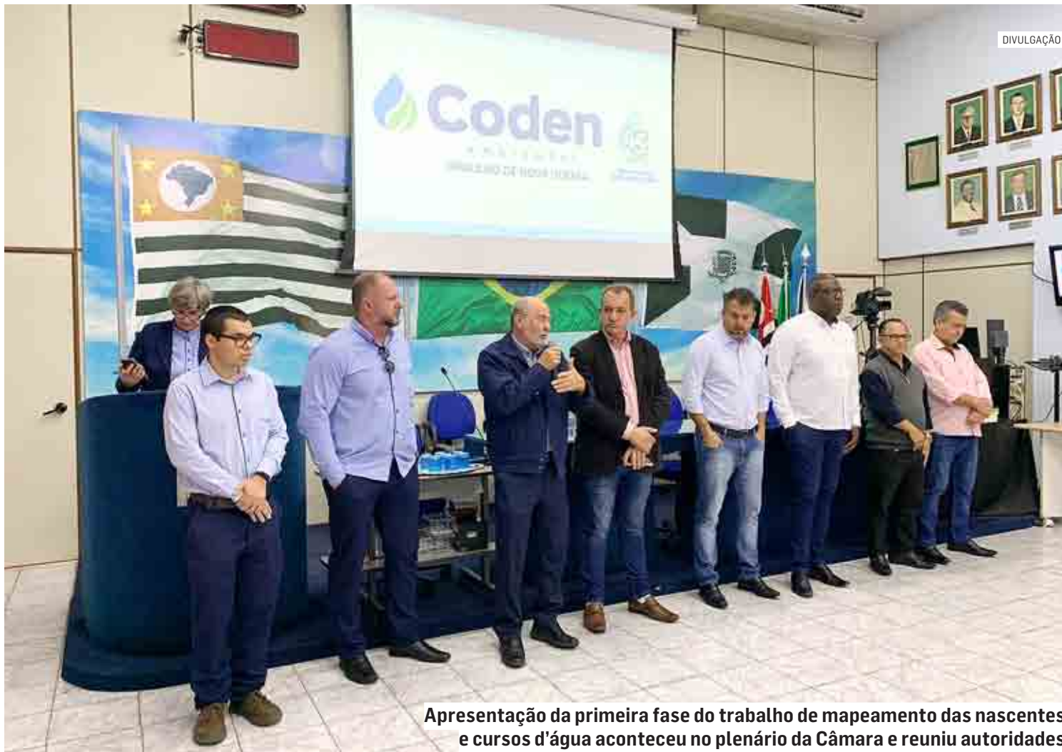
Apresentação da primeira fase do trabalho de mapeamento das nascentes e cursos d'água aconteceu no plenário da Câmara e reuniu autoridades

O mapeamento das nascentes teve início no final de julho e vem sendo