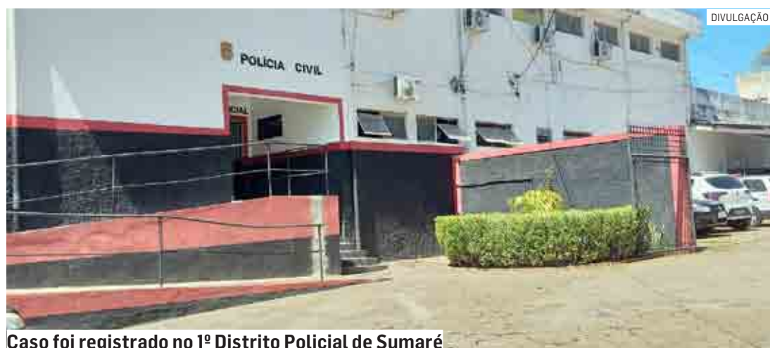
Caso foi registrado no 1º Distrito Policial de Sumaré

A ocorrência foi apresentada no Plantão do 1º Distrito Policial de Campinas, mas nenhum assaltante foi preso.