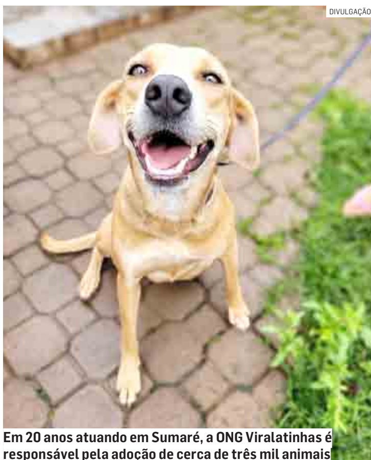
Em 20 anos atuando em Sumaré, a ONG Viralatinhas é responsável pela adoção de cerca de três mil animais

O 1º Viraboteco promete ser recheado de sabores, com diversas comidas típicas de boteco, como porções de mandioca frita, batata frita, salgadinho, pastel e espeti-