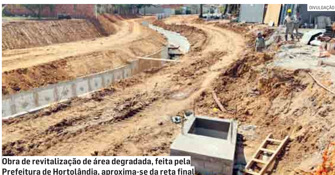
Obra de revitalização de área degradada, feita pela Prefeitura de Hortolândia, aproxima-se da reta final

A obra é realizada com recursos do Banco CAF (Banco de Desenvolvimento da América Latina), proveniente de financiamento internacional contratado pela Prefeitura em 2018 para realização de diversas obras de infraestrutura e mobilidade urbana, ações que garantirão a retomada do desenvolvimento econômico da cidade e qualidade de vida para a população.