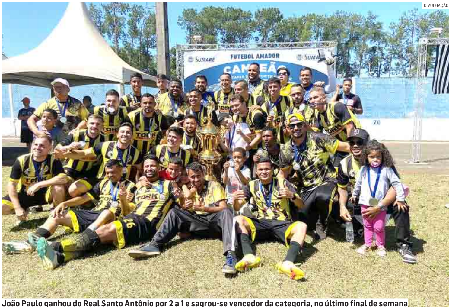
João Paulo ganhou do Real Santo Antônio por 2 a 1 e sagrou-se vencedor da categoria, no último final de semana