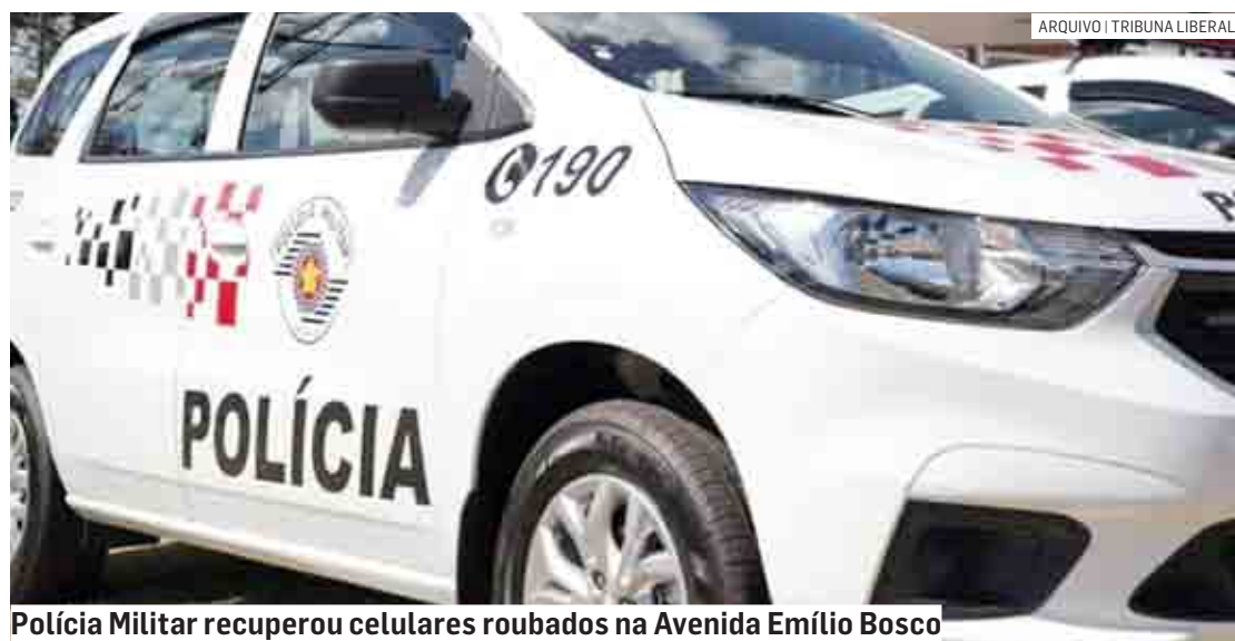
Polícia Militar recuperou celulares roubados na Avenida Emílio Bosco