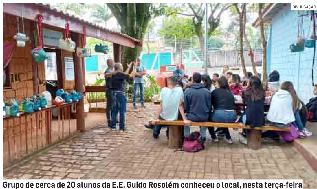
Grupo de cerca de 20 alunos da E.E. Guido Rosolém conheceu o local, nesta terça-feira

Da Redação | HORTOLÂNDIA tribunaliberal@tribunaliberal.com.br