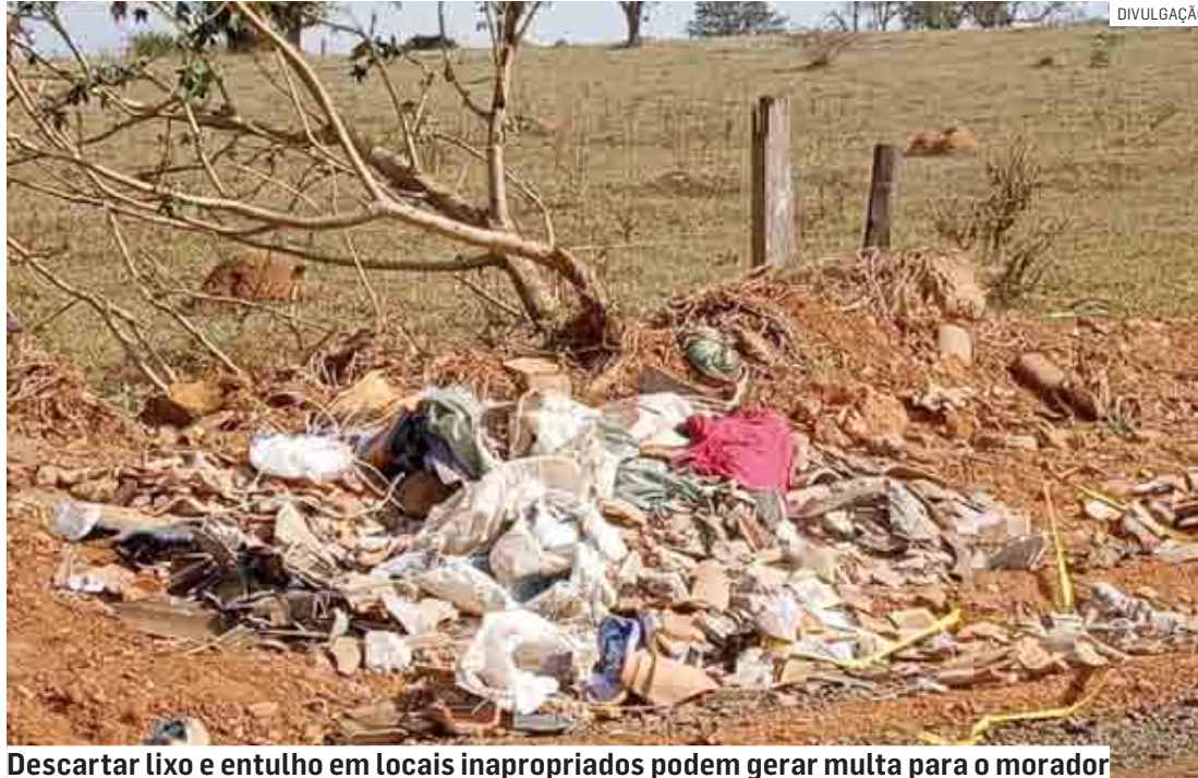
Descartar lixo e entulho em locais inapropriados podem gerar multa para o morador

Depois, encaminham esses objetos a um local de descarte apropriado –