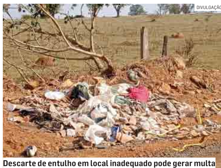
Descarte de entulho em local inadequado pode gerar multa

De janeiro a agosto de 2022, a equipe da Diretoria de Serviços Urbanos da Prefeitura de Nova Odessa retirou, das vias e áreas públicas da cidade, mais de 2 toneladas e meia de entulhos, lixo e materiais inservíveis em geral, galhos e móveis velhos. O serviço é realizado diariamente com a ajuda de máquinas pesadas e caminhões.