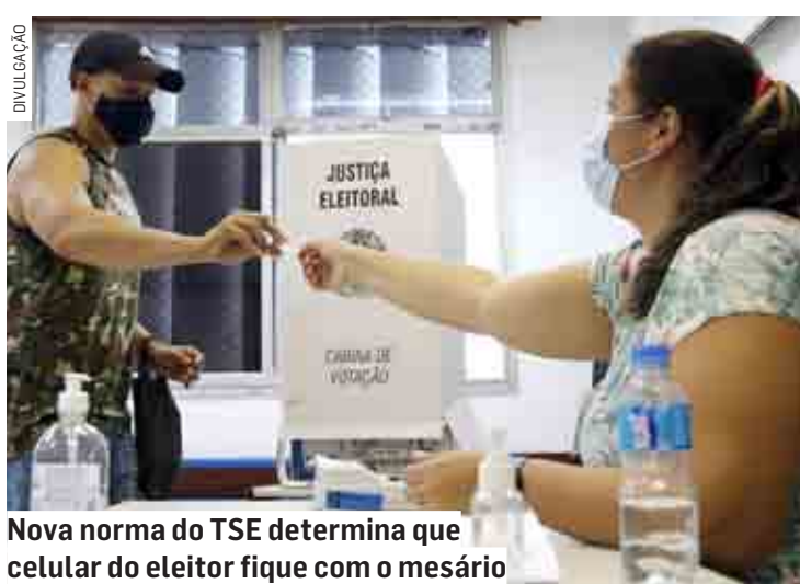
Nova norma do TSE determina que celular do eleitor fique com o mesário

O objetivo é complementar a determinação que já consta da Lei das Eleições (91-A da Lei 9.504/1997), que proíbe expressamente que os eleitores entrem na cabine de votação com o celular ou qualquer outro instrumento que possa comprometer o sigilo do voto. Ficou determinado ain-