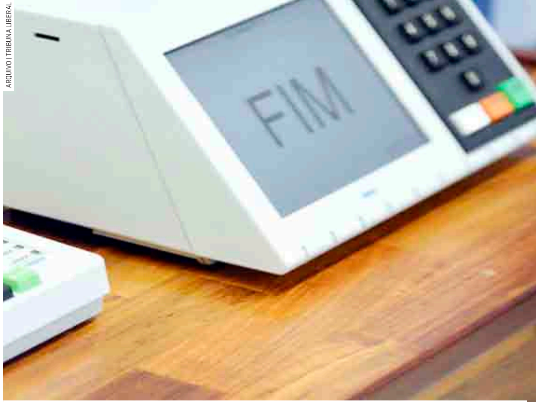
No voto em trânsito, dados do eleitor são transferidos temporariamente para outra seção

Sumaré, que tem o maior colégio eleitoral da região, com 198.403 eleitores aptos a votarem este ano, teve o maior número de pedidos, foram 186 em 2022. Em comparação com 2018, quando foram feitas 48 solicitações, o aumento foi de 279,5%. Proporcionalmente, Hortolândia, com 165.269 eleitores, é a cidade onde o número de pedidos mais cresceu este ano: 383,78%. A cidade teve 179 pedidos este ano e 37 em 2018. Em Nova Odessa, que tem 47.897 eleitores, o aumento foi de 13 em 2018 para 56 em