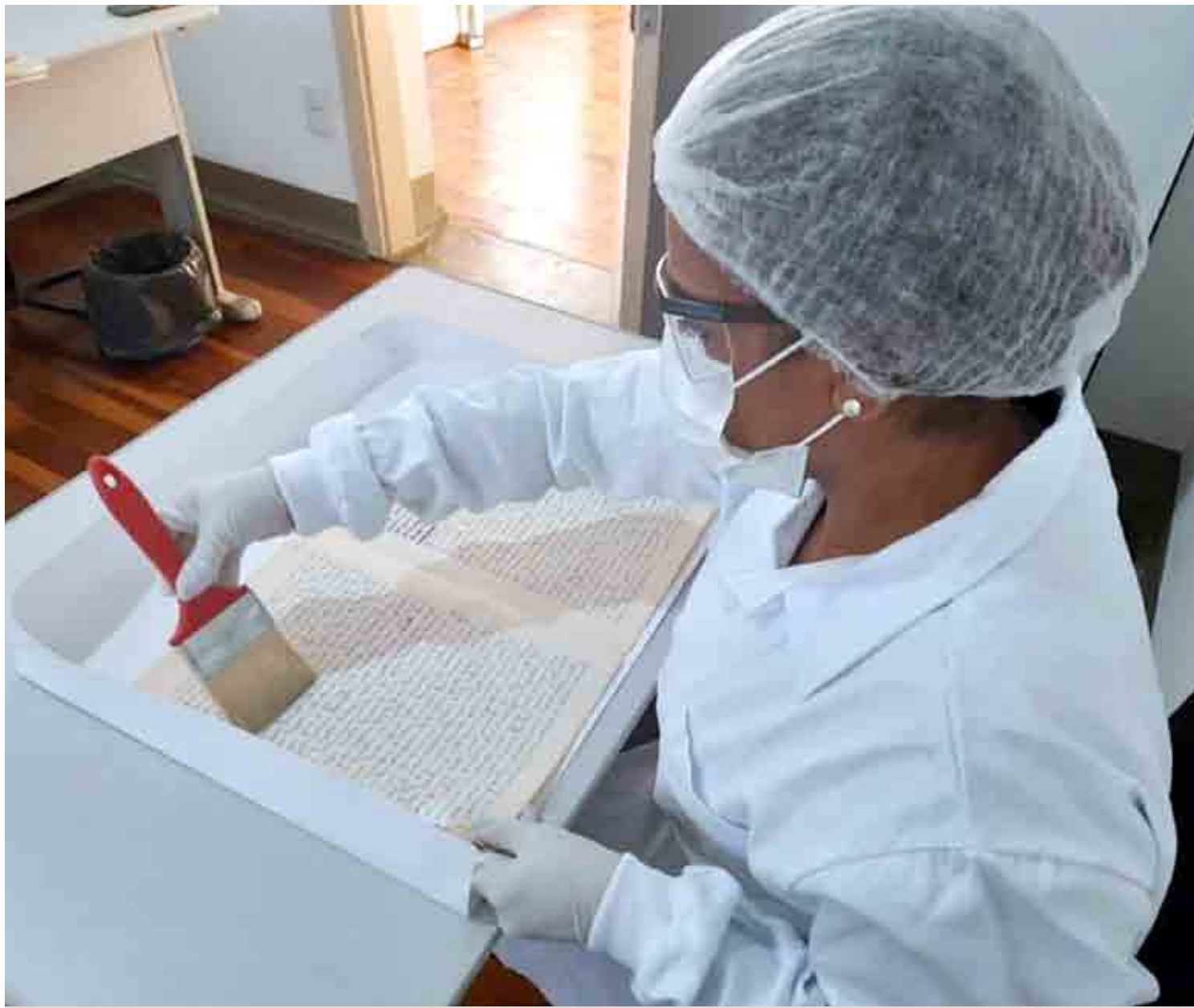
Funcionária da Pró-Memória no trabalho de higienização de documento

Nas imagens é possível observar o trabalho