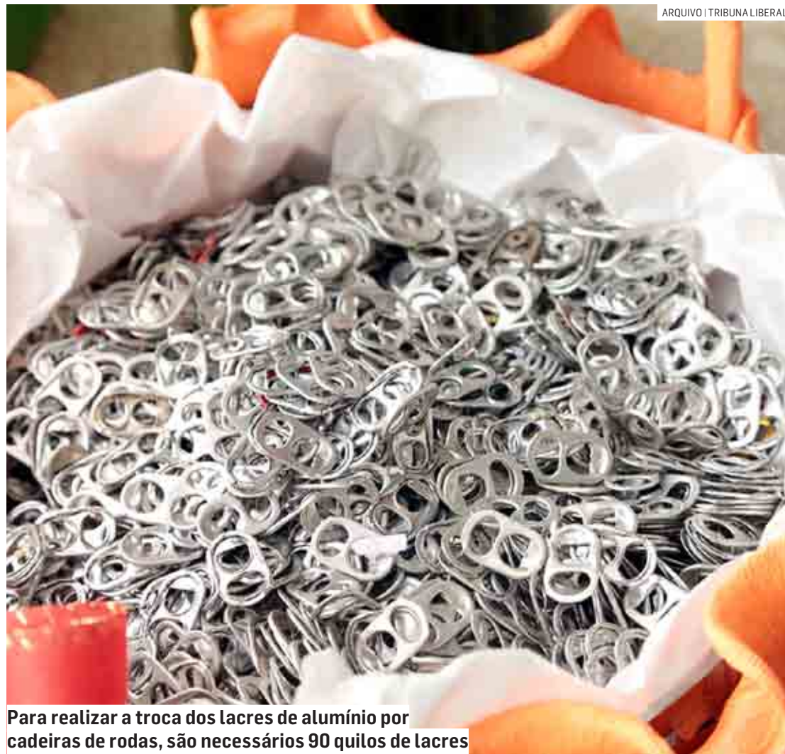
Para realizar a troca dos lacres de alumínio por cadeiras de rodas, são necessários 90 quilos de lacres

Para realizar a troca dos lacres de alumínio por cadeiras de rodas, são necessários 90 quilos de lacres,