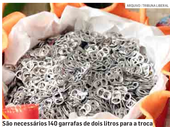
São necessários 140 garrafas de dois litros para a troca

Lacres de latinhas de alumínio poderão ser trocados por cadeiras de rodas em Hortolândia. A campanha "Lacre Solidário", iniciativa da prefeitura, busca junto à iniciativa privada e população a arrecadação de lacres para ajudar as pessoas que necessitam de uma cadeira de rodas. São necessários 90kg de lacres para a troca.