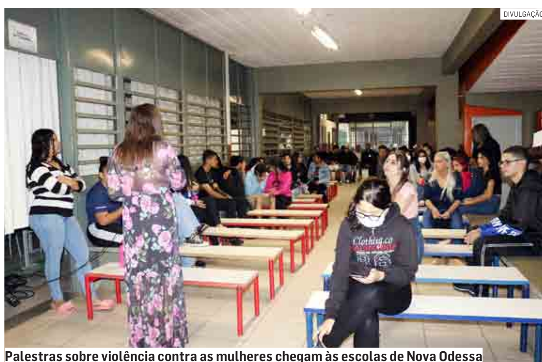
Palestras sobre violência contra as mulheres chegam às escolas de Nova Odessa