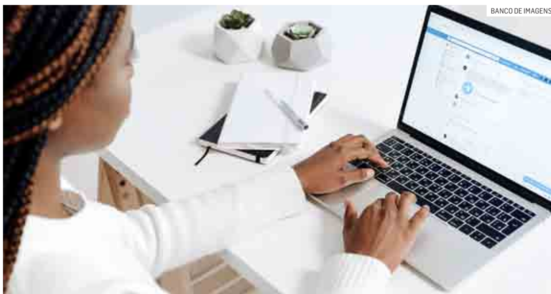
Paulínia oferece 95 vagas para cursos gratuitos na área de tecnologia da informação e outras 1.800 na área de gastronomia

De acordo com a prefeitura, para os dois cursos é necessário ter, no mínimo, 16 anos de idade completos. Os interessados devem procurar pela unidade do Senai, localizada na Avenida Engenheiro Roberto Mange, no Alto dos Pinheiros, para efetivarem suas matrículas, munidos dos documentos (original e cópia): RG e CPF, comprovante de endereço, comprovante de escolaridade e conhecimento na área de atuação (quando exigido). As vagas são limi-