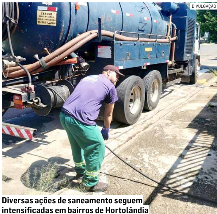
Diversas ações de saneamento seguem intensificadas em bairros de Hortolândia

A limpeza e a manutenção dos bueiros também são essenciais para a ampliação do saneamento básico. Os bueiros do Jardim Boa Esperança, Jardim Adelaide, Vila São Pedro, Jardim Mirante, Jardim Terras de Santo Antônio e Jardim Malta recebe-