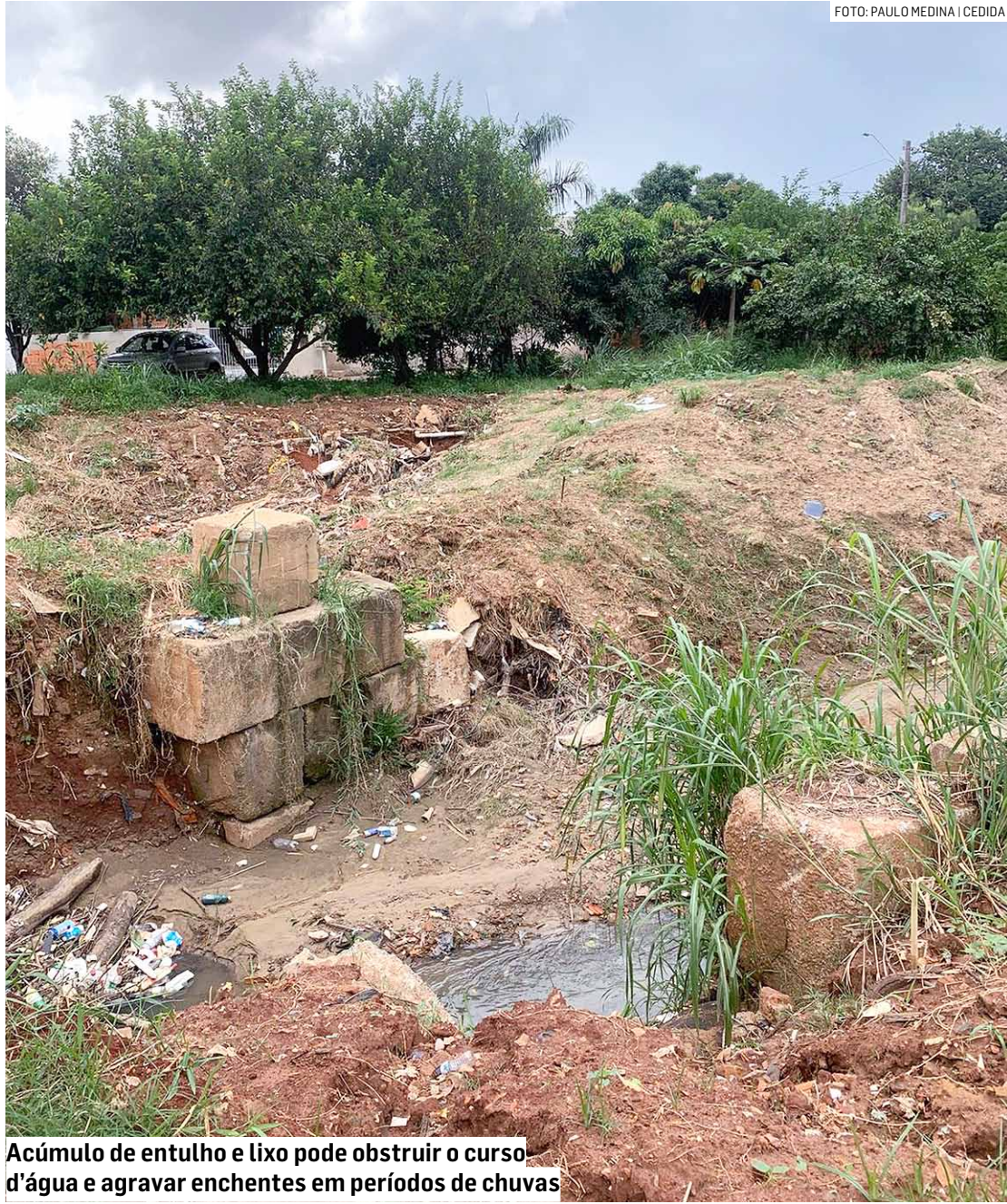
Acúmulo de entulho e lixo pode obstruir o curso d'água e agravar enchentes em períodos de chuvas