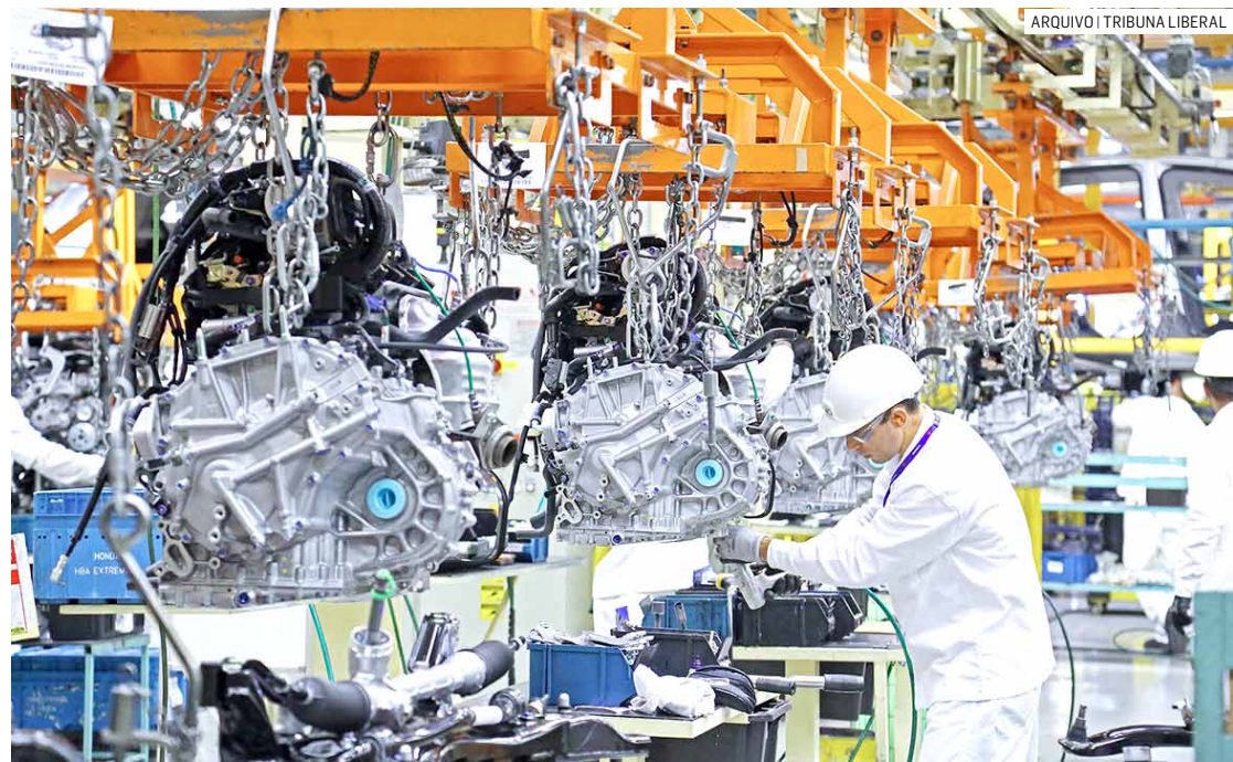
Jovens de 18 a 20 anos podem se inscrever até o dia 21 de fevereiro para processo de seleção

Os jovens selecionados na primeira etapa participarão de dinâmicas de grupo supervisionadas por uma psicóloga, seguidas de uma entrevista final.