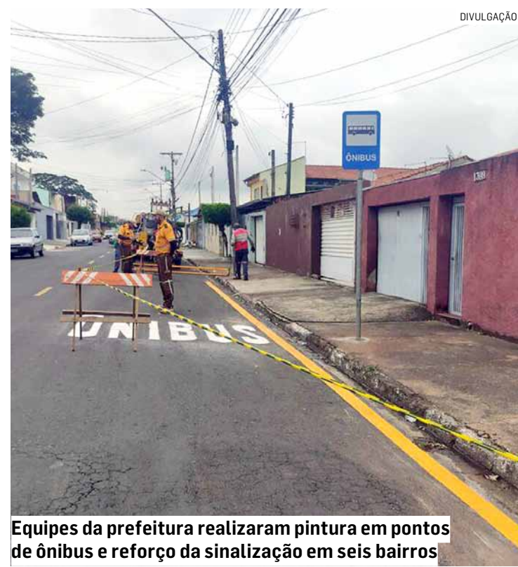
Equipes da prefeitura realizaram pintura em pontos de ônibus e reforço da sinalização em seis bairros.

Para salvar vidas no trânsito, a Prefeitura realiza uma série de ações, que vão de atividades educativas com motoristas e pedestres, reforço na sinalização, até a implantação de radares controladores de velocidade, principal medida adotada pela Administração Municipal para a redução de mortes no trânsito da cidade. Os dispositivos começaram a funcionar em janeiro de 2019.