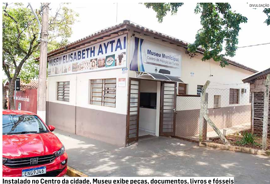
Instalado no Centro da cidade, Museu exhibe peças, documentos, livros e fósseis

A entrada é gratuita. Apenas grupos de mais de 10 pessoas com escolas devem fazer agendamento prévio pelo telefone (19) 3879-2174. O museu funciona de segunda a sexta-feira, das 8h às 17h.