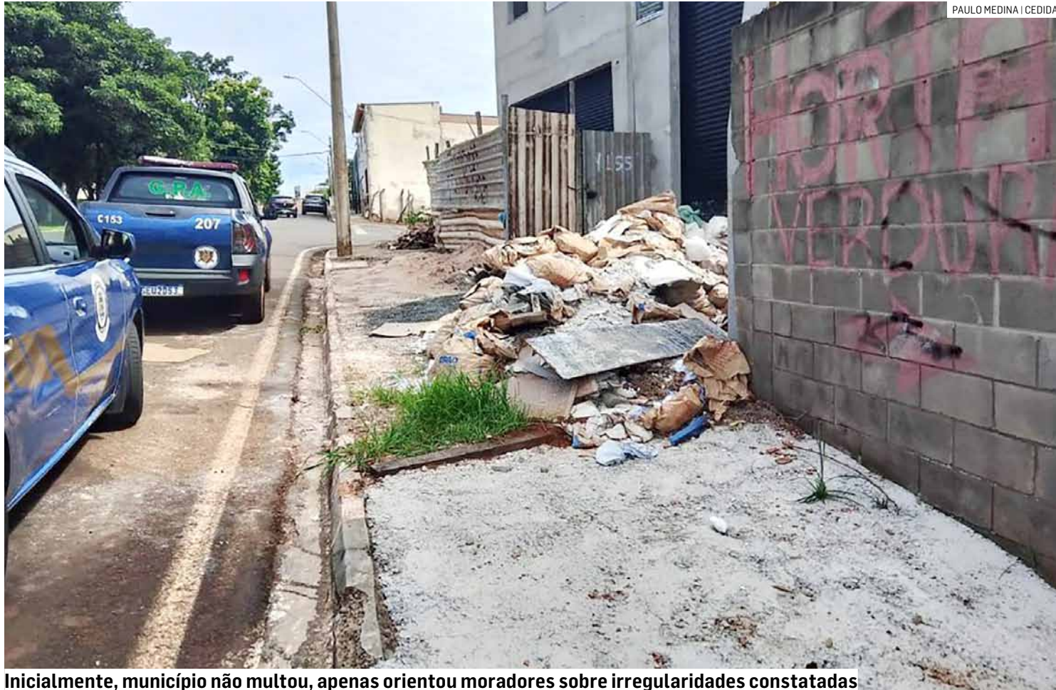
Inicialmente, município não multou, apenas orientou moradores sobre irregularidades constatadas

O objetivo é regularizar os calçamentos, contribuindo para a mobilidade dos munícipes, e manter a cidade mais limpa e adequada para moradia. A inspeção analisou se as calçadas estão em bom estado de conservação, se contêm lixo ou entulho e se estão dentro das regras estipuladas pela Secretaria de Obras, se existe manutenção preventiva e se permitem a passa-