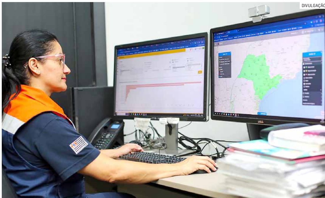
Frente fria traz chuva com intensidade de moderada a forte para as cidades da região

A Defesa Civil vai utilizar também os avisos de alerta Cell Broadcast, quando necessário. O gabinete de crise vai coordenar as ações relacionadas aos eventos climáticos previstos. Em-