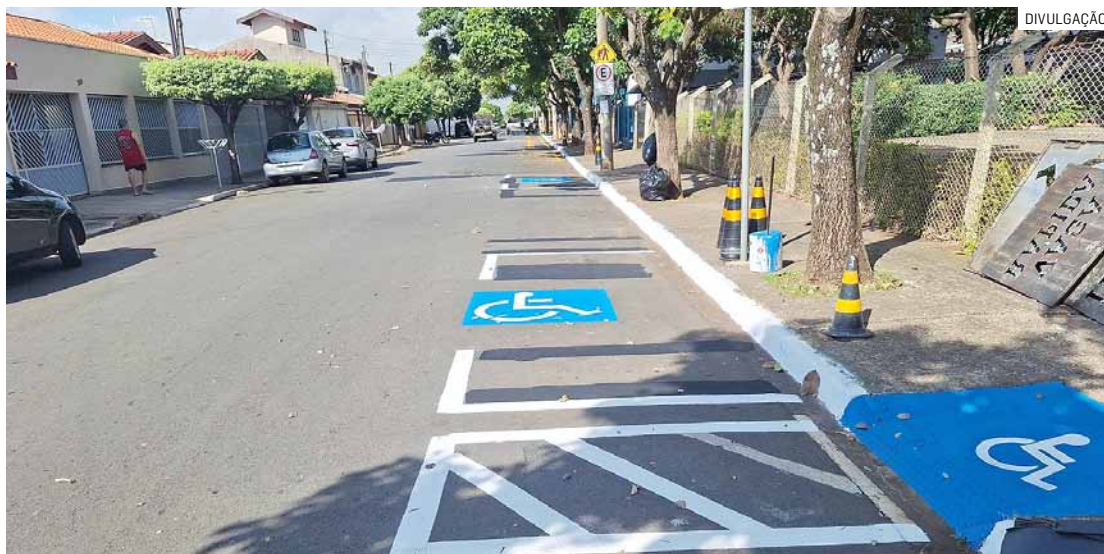
Município realizou convênio inédito e recebe verbas para investir no trânsito municipal