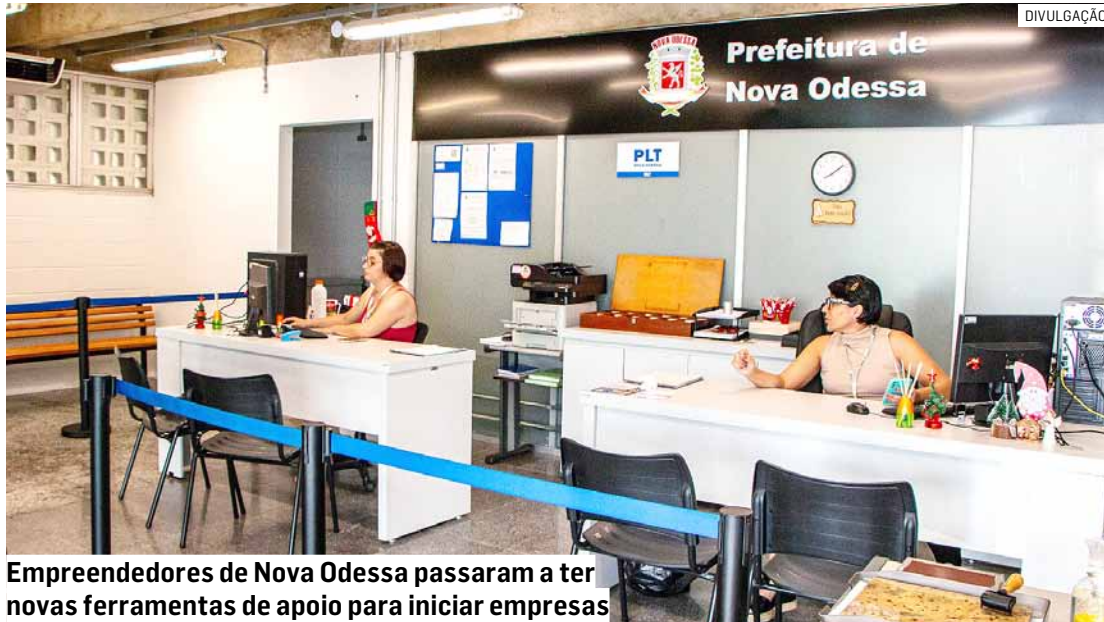
Empreendedores de Nova Odessa passaram a ter novas ferramentas de apoio para iniciar empresas