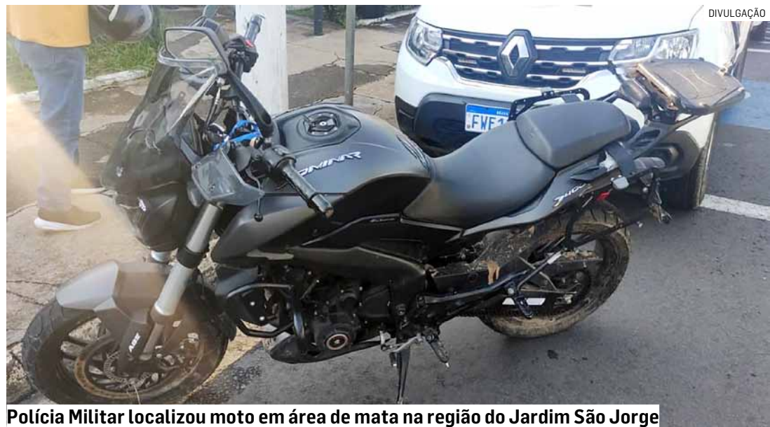
Polícia Militar localizou moto em área de mata na região do Jardim São Jorge

rua Ceará, onde foram abordados. Em busca pessoal, nada de ilícito localizado. Um dos homens confessou que ambos passavam pela rua quando visualizaram uma motocicleta no mato e tiveram a “curiosidade” de tentar ligá-la para andar. A moto foi encontrada, apreendida e devolvida ao dono.