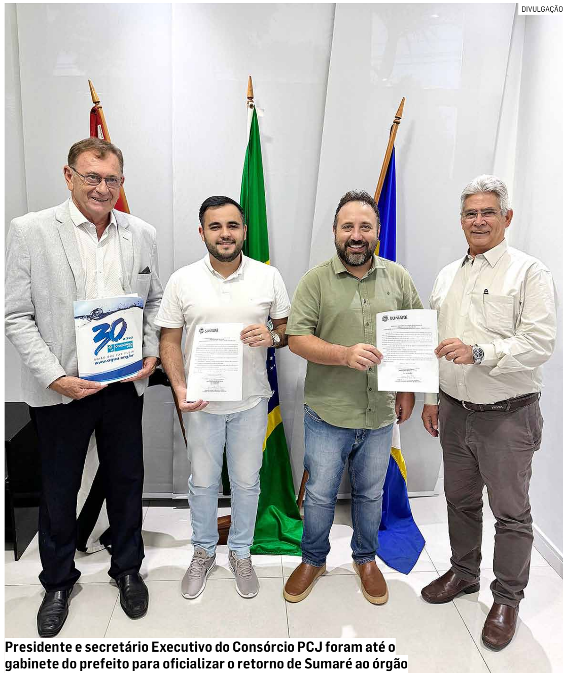
Presidente e secretário Executivo do Consórcio PCJ foram até o gabinete do prefeito para oficializar o retorno de Sumaré ao órgão

Após seis anos afastado, município retoma prioridade no tratamento de esgoto, recuperação do Ribeirão Quilombo e de matas ciliares, além da construção de cinco novos reservatórios que visam prevenir graves enchentes