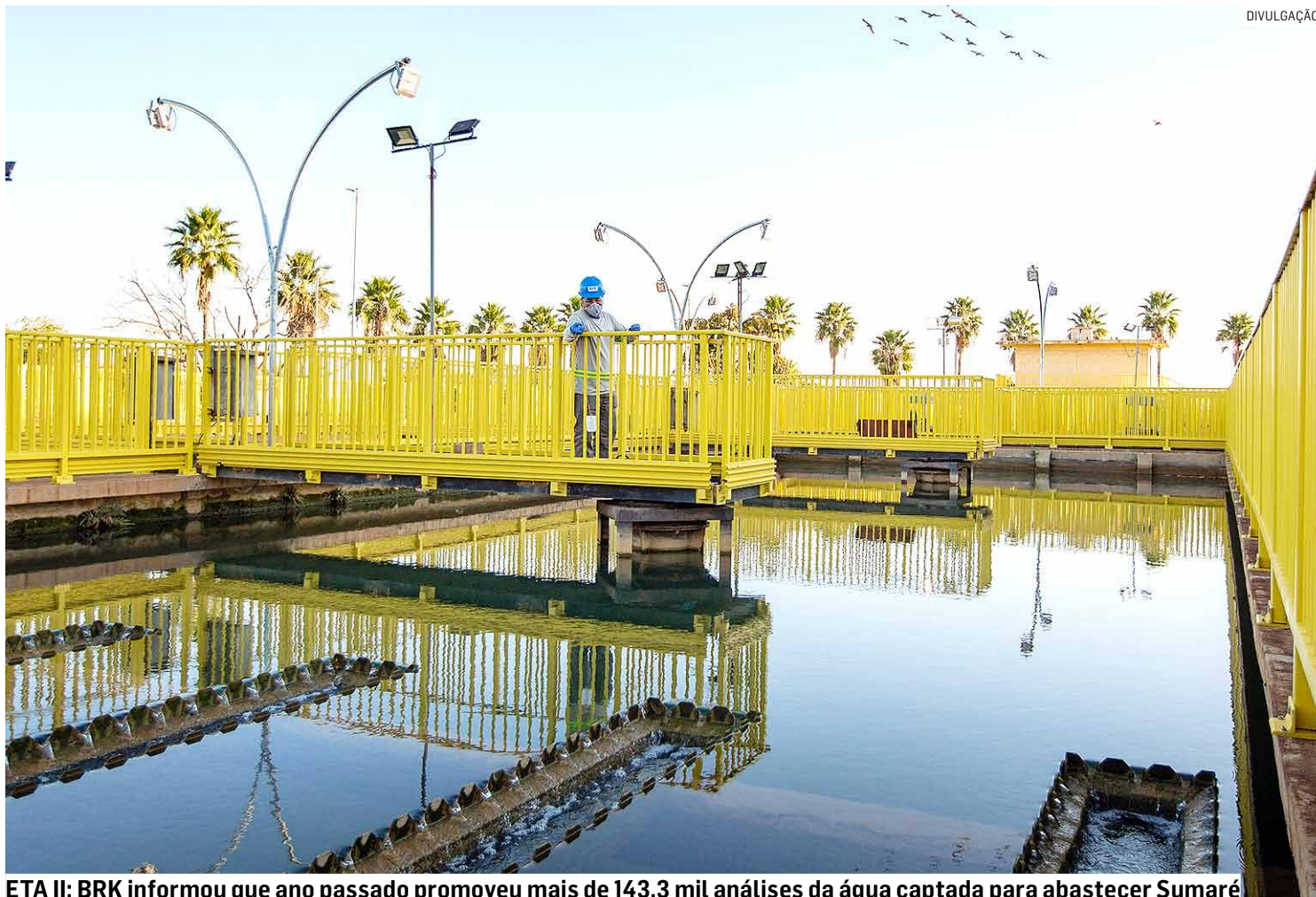
ETA II: BRK informou que ano passado promoveu mais de 143,3 mil análises da água captada para abastecer Sumaré

Ao chegar nas ETAs (Estação de Tratamento de Água), a água passa por quatro processos: floculação - etapa na qual a água é submetida à agitação mecânica para que as impurezas formem flocos maiores e mais pesados; decantação - nos tanques, os flocos de impureza afundam