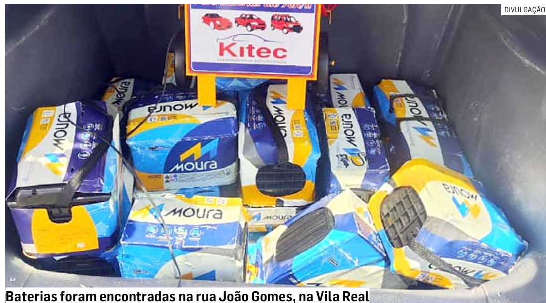
Baterias foram encontradas na rua João Gomes, na Vila Real

Cézar Oliveira • HORTOLÂNDIA tribunaliberal@tribunaliberal.com.br