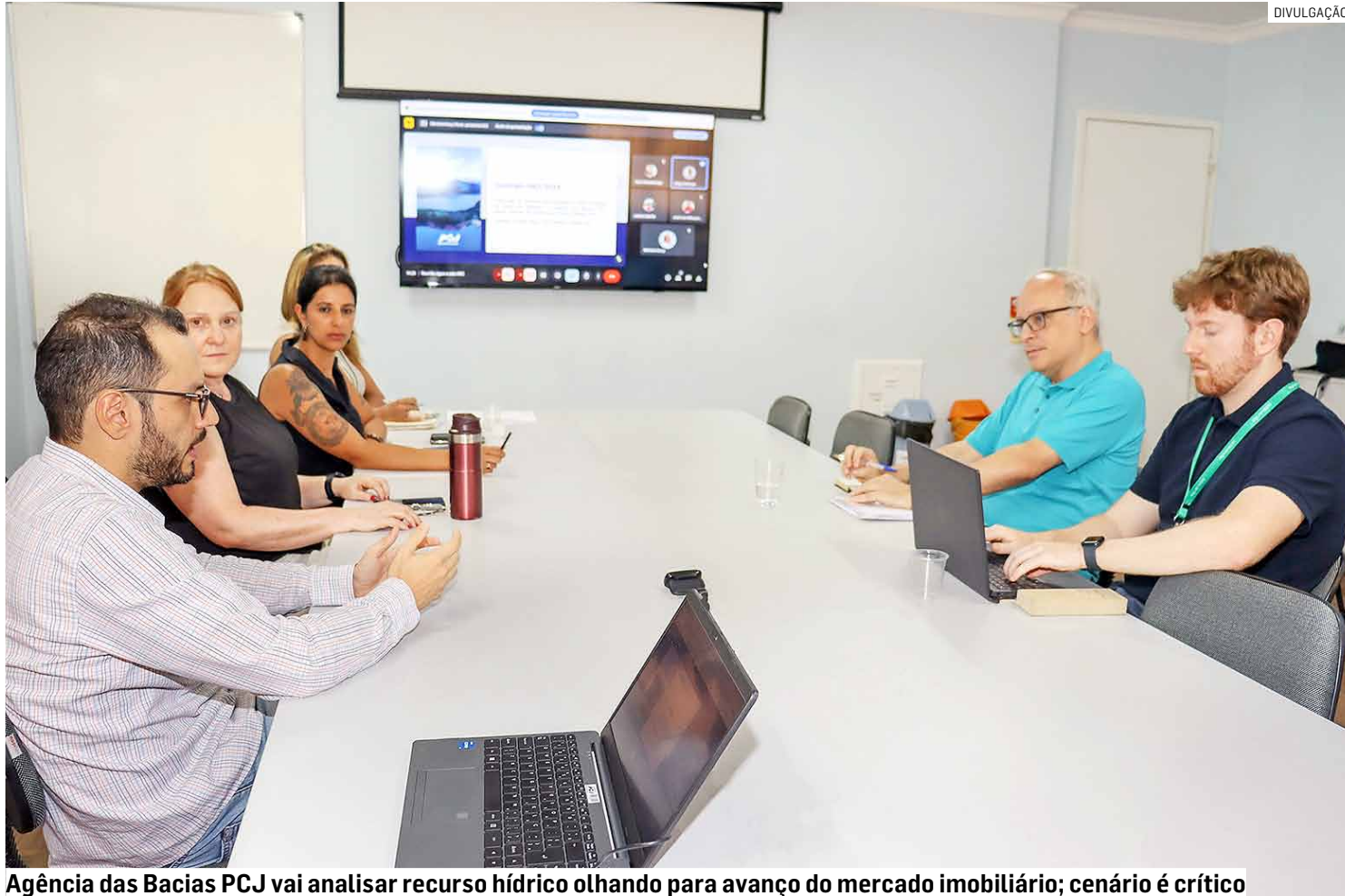
Agência das Bacias PCJ vai analisar recurso hídrico olhando para avanço do mercado imobiliário; cenário é crítico

Americana e Nova Odessa, municípios das Bacias