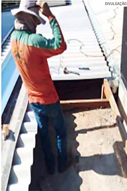
Vendaval provocou danos ao imóvel de morador do Loteamento Jardim Baldiotti, em Monte Mor

tipo “plafon”, limpeza de um aparelho de ar-condicionado, pinturas nas paredes dos ambientes atingidos e reparação da parte elétrica do lavabo”, afirmou