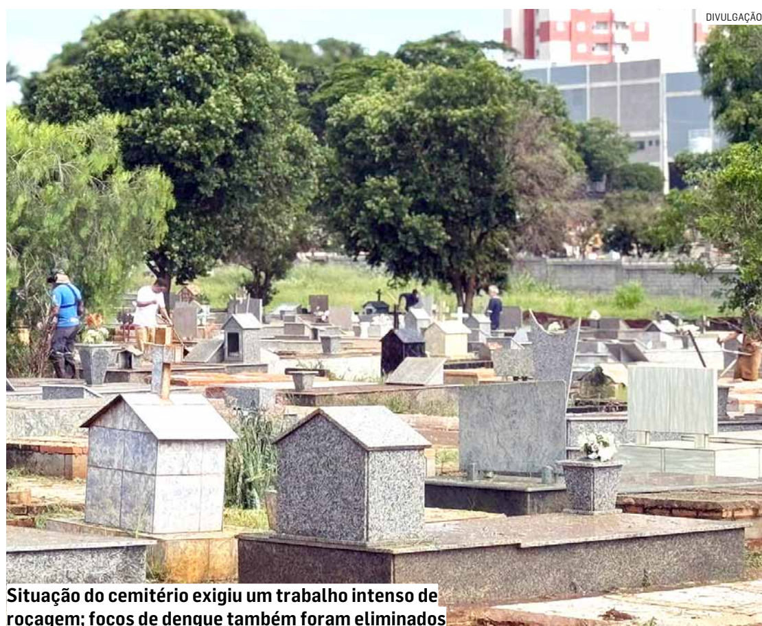
Situação do cemitério exigiu um trabalho intenso de roçagem; focos de dengue também foram eliminados