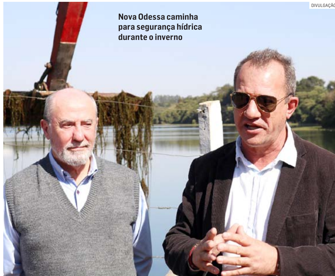
Nova Odessa caminha para segurança hídrica durante o inverno

“Estamos em situação bem melhor que no mesmo período de 2021 e 2022. Tivemos um período de boas chuvas, mas também licenciamos e melhoramos a captação e adução na bacia do Córrego Palmital, que pôde ser utilizada durante todo o ano passado. Isso também gerou um reflexo positivo nos volumes. E nosso histórico mostra que os níveis continuam subindo até o final de março, início de abril”, explicou o diretor