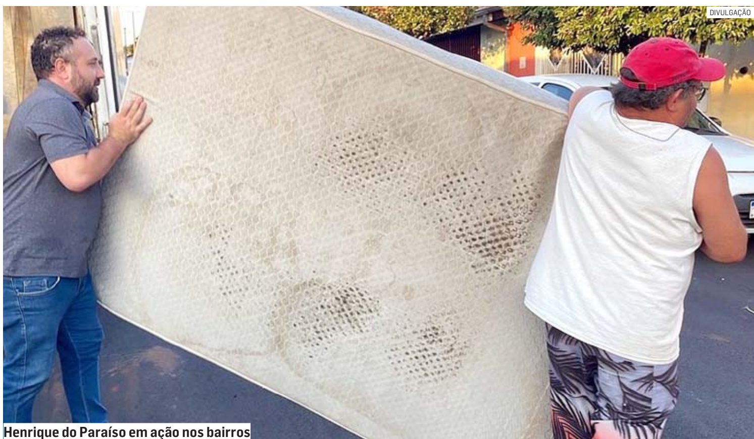
Henrique do Paraíso em ação nos bairros

Paulo Medina | SUMARÉ paulo.medina@tribunaliberal.com.br