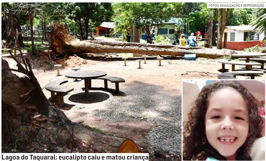
Lagoa do Taquaral: eucalipto caiu e matou criança