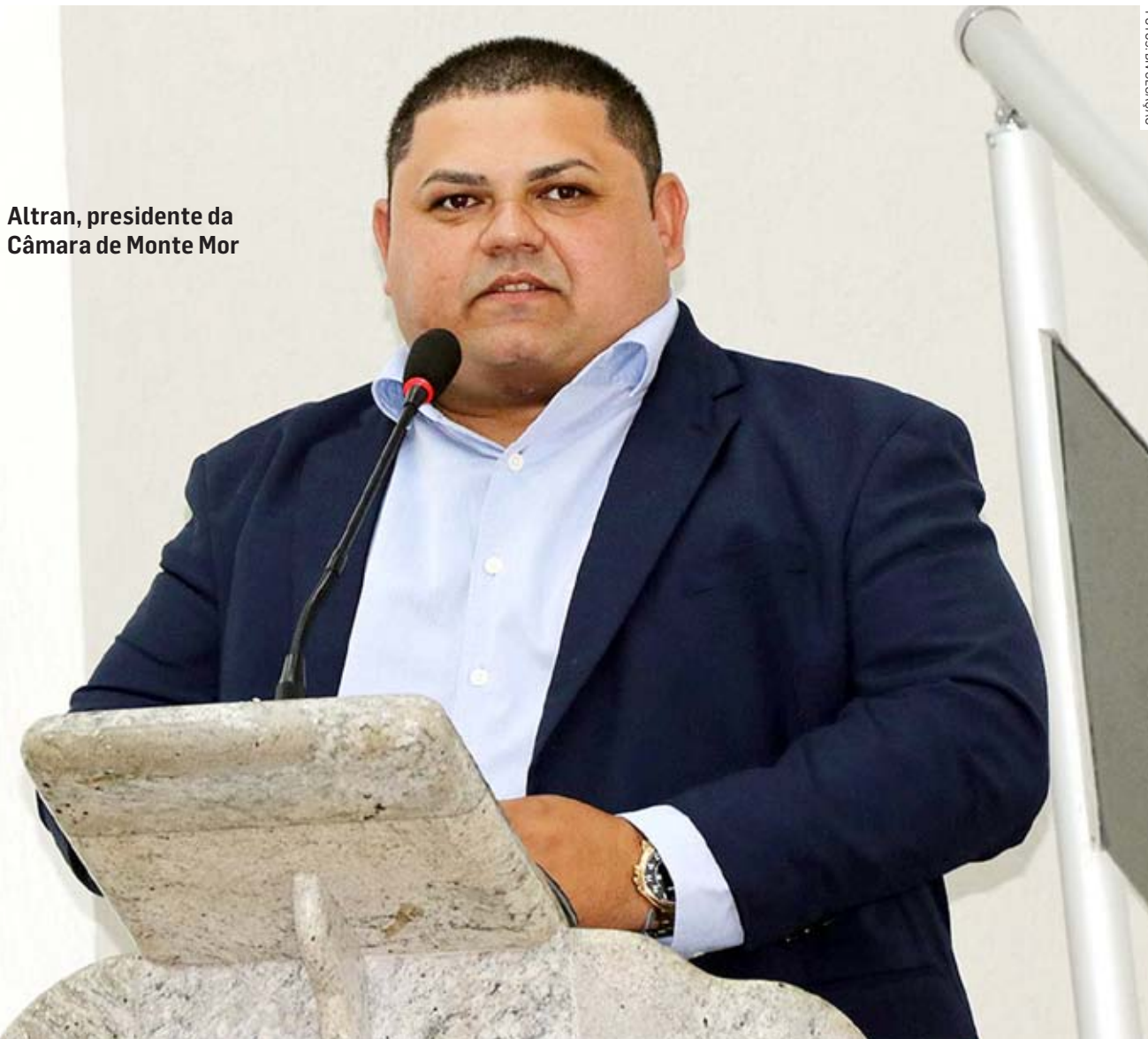
Altran, presidente da Câmara de Monte Mor

Novo presidente da Câmara afirma que pretende garantir melhorias na infraestrutura do Legislativo, como estacionamento para servidores