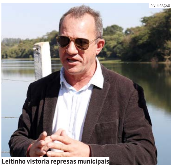
Leitinho vistoria represas municipais

O MPE (Ministério Público Estadual) entrou no caso e agora investiga a queda da árvore na Lagoa do Taquaral, na última terça-feira (24), em Cam-