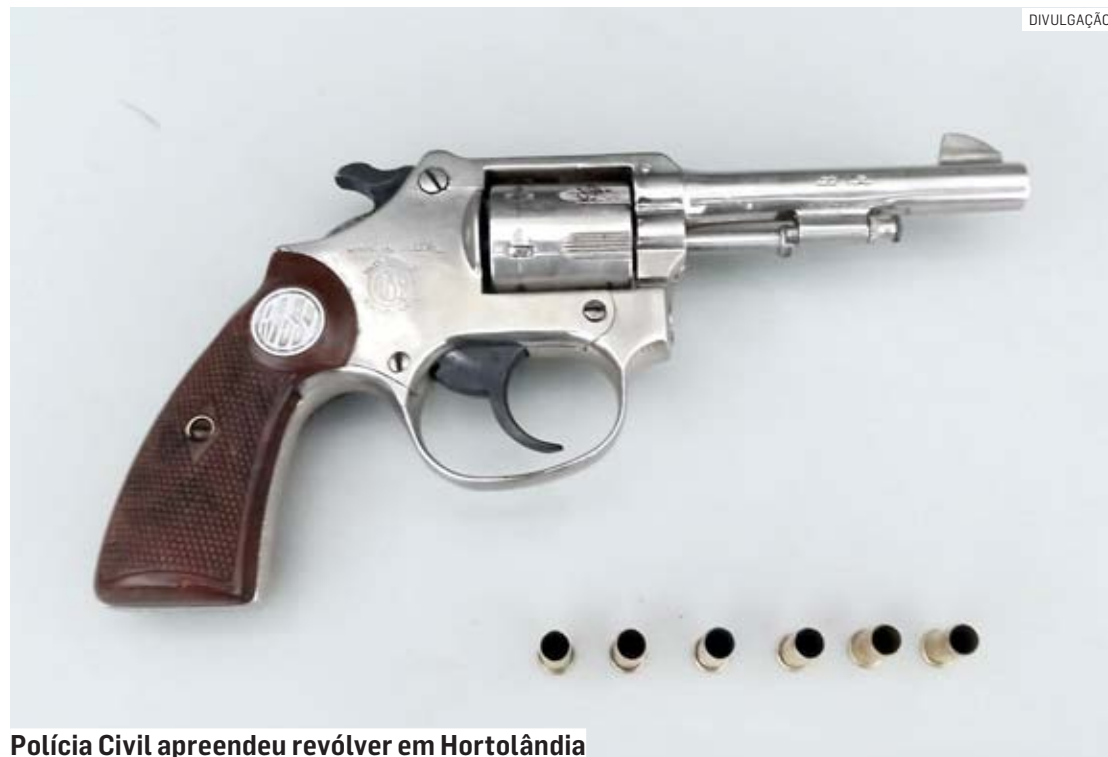
Polícia Civil apreendeu revólver em Hortolândia

Segundo os policiais, eles estavam em patrulhamento quando receberam informações via rádio de uma ocorrência envolvendo um indivíduo portando arma de fogo em meio a um desentendimento em um estabelecimento chamado “Bar do Beto”. Após as equipes de rádio se dirigirem ao local, constataram que o homem já havia fugido. Testemunhas informaram as características físicas do suspei-