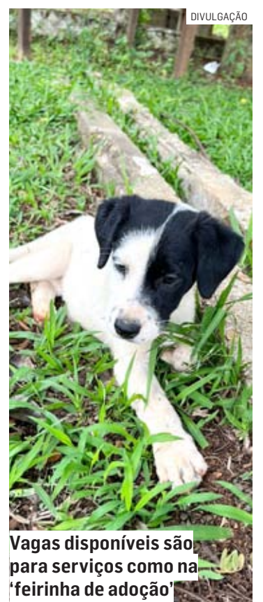
Vagas disponíveis são para serviços como na 'feirinha de adoção'

A entidade cuida dos animais, que recebem tratamento no abrigo até ficarem saudáveis e serem levados para a castração, para posteriormente, estarem disponíveis para a adoção, tanto no abrigo, quanto nas feirinhas de adoção, realizadas todos os sábados na praça central da cidade. Para saber mais sobre a ONG, acesse a página da AAANO no Facebook ( www.facebook.com/aaanovaodessa ), no Instagram (@aaanovaodessa), no site www.aaano.com.br .