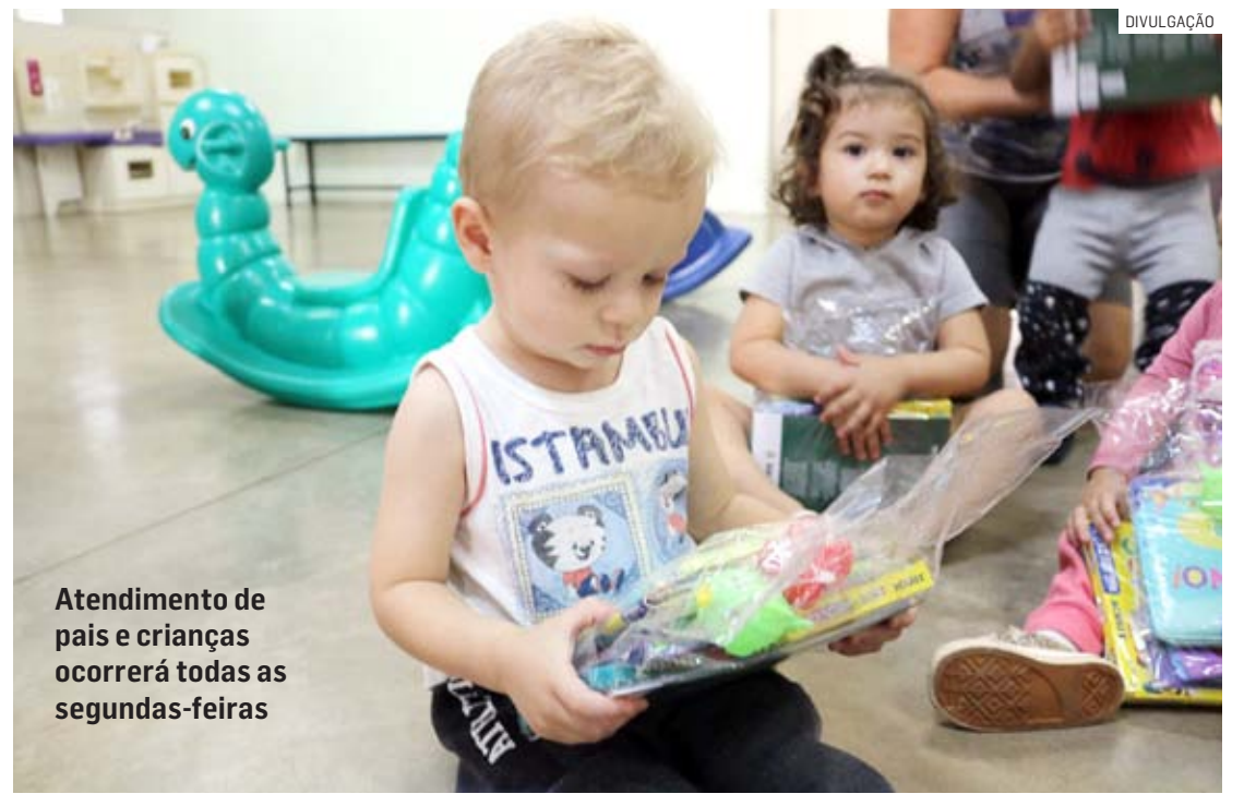
Atendimento de pais e crianças ocorrerá todas as segundas-feiras

Da Redação | SUMARÉ tribunaliberal@tribunaliberal.com.br