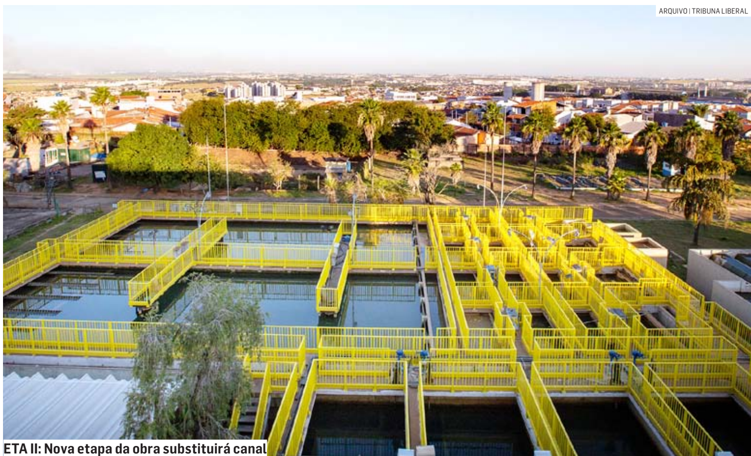
ETA II: Nova etapa da obra substituirá canal

Nesta segunda etapa, que ocorre na segunda (30), será feita a instalação da caixa metálica e a interligação da nova tubulação de ferro fundido que irá substituir o canal atual. Por conta desse trabalho, os bairros da região do Maria Antônia, Carlota, Nova Veneza e parte dos bairros da região de Área Cura podem