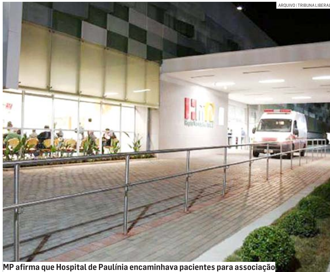
MP afirma que Hospital de Paulínia encaminhava pacientes para associação

O juiz acolheu também pedido da Promotoria para a Prefeitura remanejar residentes com demandas de saúde mental e uma pessoa com deficiência física a