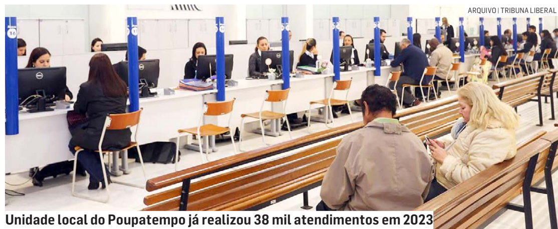
Unidade local do Poupatempo já realizou 38 mil atendimentos em 2023

e pontos na CNH, licenciamento de veículos, consulta de IPVA, carteira de trabalho digital, seguro-desemprego, atestado de antecedentes criminais, entre outros. O Poupatempo em Sumaré está localizado na avenida Rebouças, 3.400. O horário de funcionamento é de segunda a sexta, das 9h às 17h, e aos sábados, das 9h às 13h.