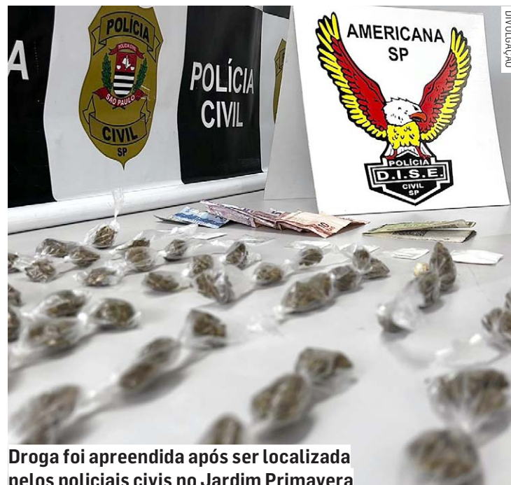
Droga foi apreendida após ser localizada pelos policiais civis no Jardim Primavera

Ao ser questionado a respeito das drogas localizadas, o investigado acabou confessando aos policiais que realmente estava na prática de tráfico no local.