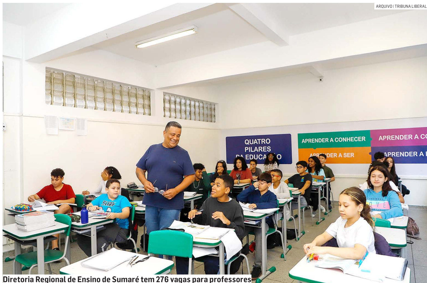
Diretoria Regional de Ensino de Sumaré tem 276 vagas para professores