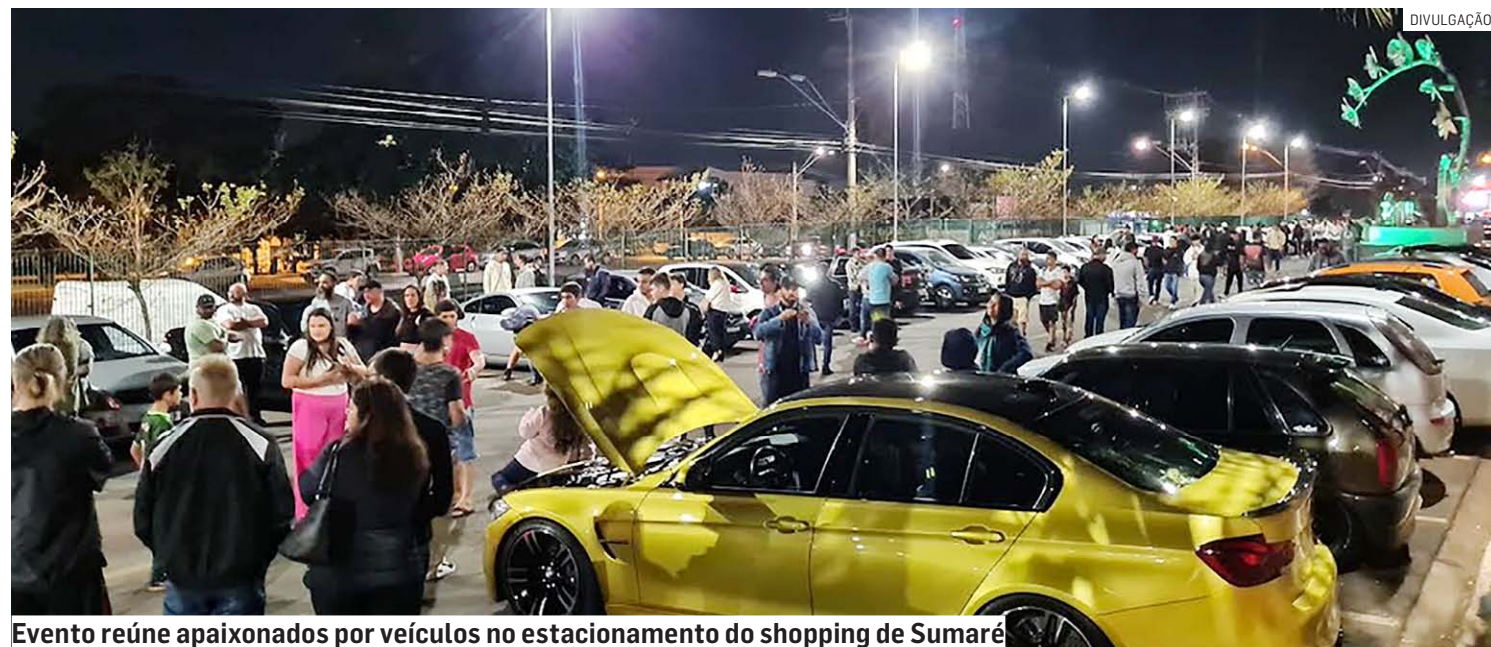
Evento reúne apaixonados por veículos no estacionamento do shopping de Sumaré

Da Redação • SUMARÉ tribunaliberal@tribunaliberal.com.br