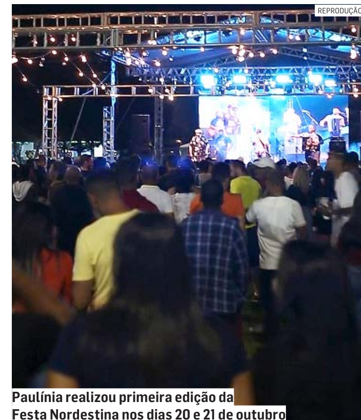
Paulínia realizou primeira edição da Festa Nordestina nos dias 20 e 21 de outubro

O evento foi realizado na Praça da UBS São José nos dias 20 e 21, em homenagem ao Dia do Nordeste, celebrado em 8 de outubro e que faz parte do calendário oficial de Paulínia.