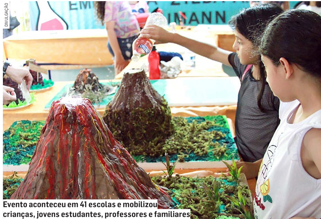
Evento aconteceu em 41 escolas e mobilizou crianças, jovens estudantes, professores e familiares

Segundo a Secretaria de Educação, Ciência e Tecnologia, o objetivo da Semana C&T, que se encerrou nesta quarta-feira (25), é proporcionar ações de criatividade e inovação científica, bem como de saber investigativo, por meio de palestras formativas e atividades nas unidades escolares. Cada escola ficou responsável por organizar projetos e atividades desenvolvidas pelos profissionais de educação com os alunos ao longo deste ano letivo. A mostra reuniu apresentações de trabalhos, protótipos e experiências, sobre temas como robótica, reutilização