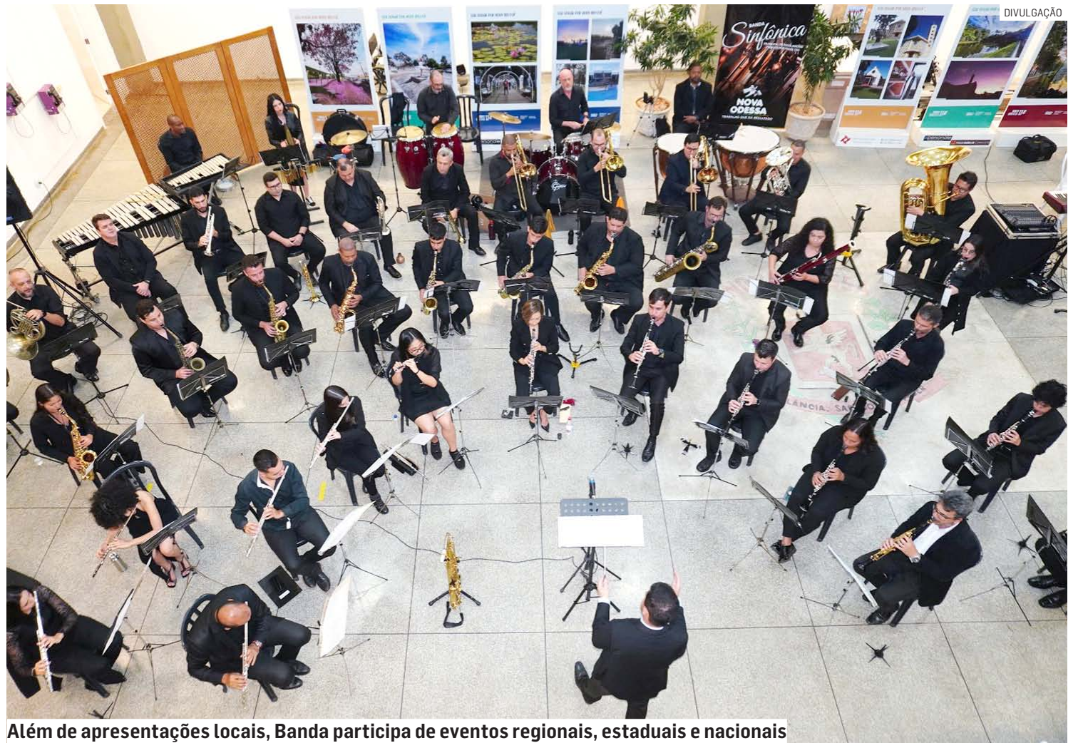
Além de apresentações locais, Banda participa de eventos regionais, estaduais e nacionais