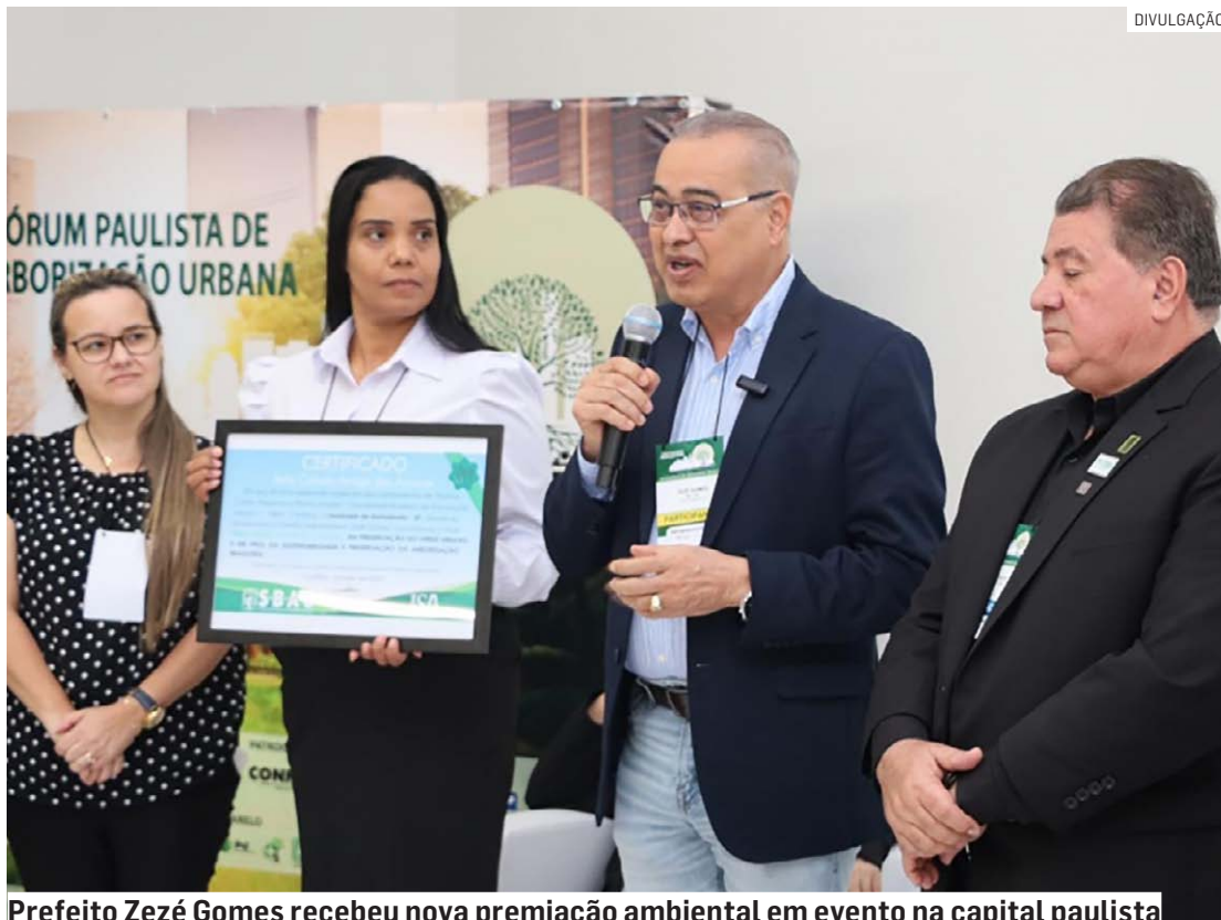
Prefeito Zezé Gomes recebeu nova premiação ambiental em evento na capital paulista

O prefeito de Hortolândia destacou o reconhecimento recebido pelo município no âmbito ambiental. "Fico extremamente feliz de ver o nosso trabalho, desenvolvido junto a Prefeitura de Hortolândia, sendo reconhecido pelos mais diversos órgãos ambientais pelo mundo. Essa conquista