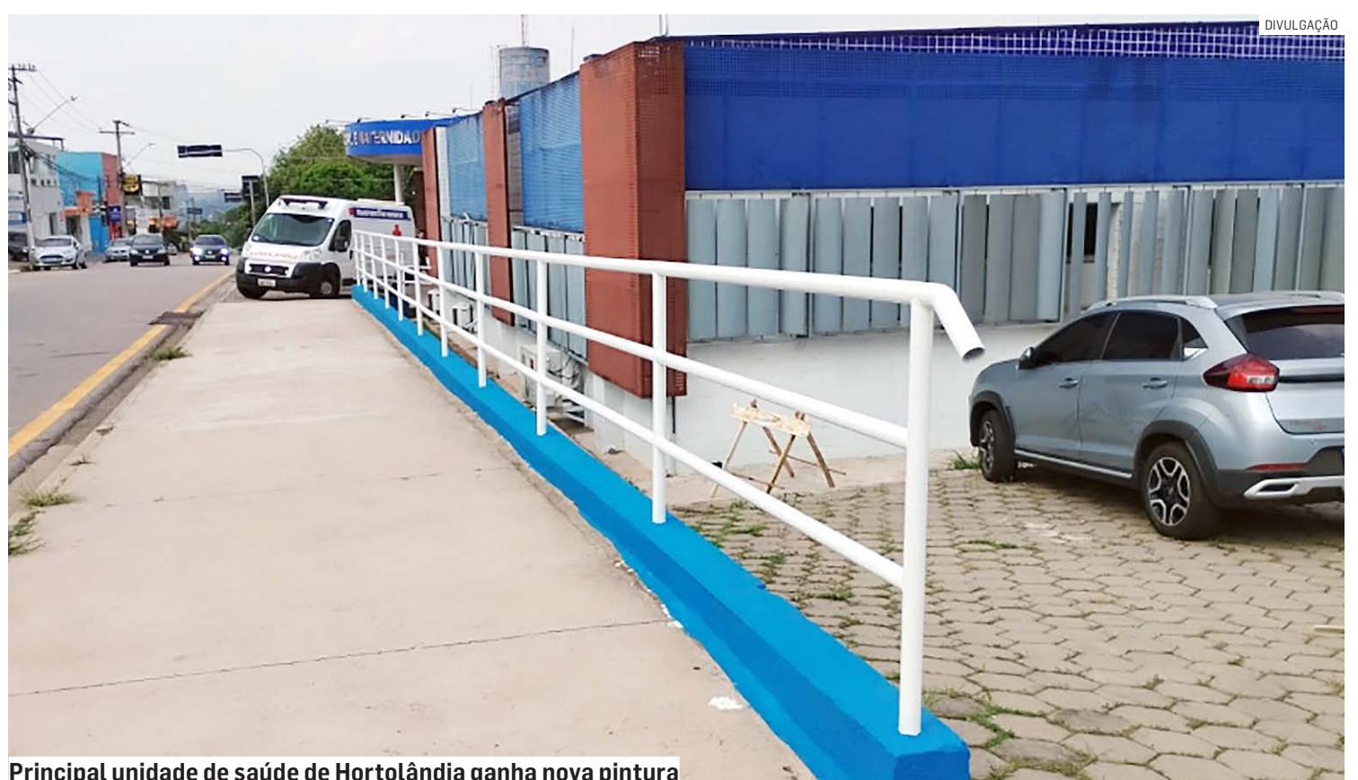
Principal unidade de saúde de Hortolândia ganha nova pintura