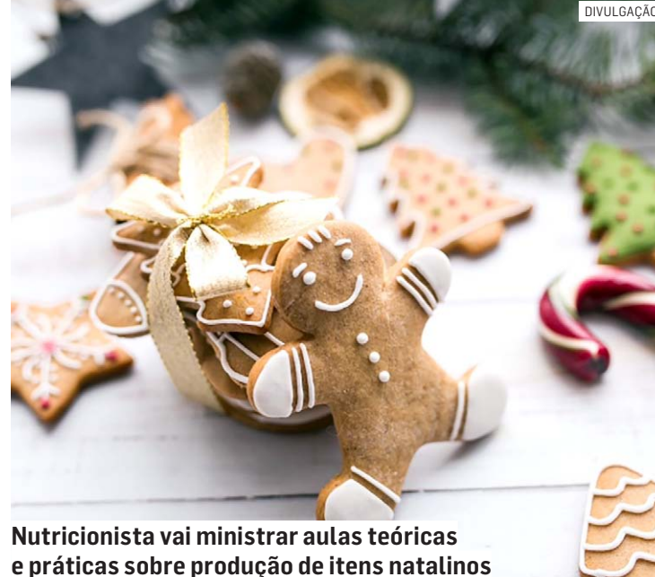
Nutricionista vai ministrar aulas teóricas e práticas sobre produção de itens natalinos

A ação acontecerá em parceria com o Senai (Ser-