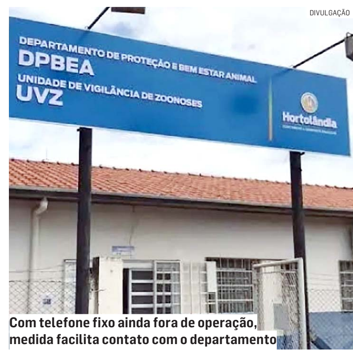
Com telefone fixo ainda fora de operação, medida facilita contato com o departamento

A Prefeitura já solicitou reparo das linhas para a companhia telefônica. Esta, por sua vez, informa que os telefones estão fora de operação em razão das fortes chuvas nos últimos dias na região. Ainda de acordo com a companhia telefônica, não há previsão para a normalização do funcionamento dos telefones.