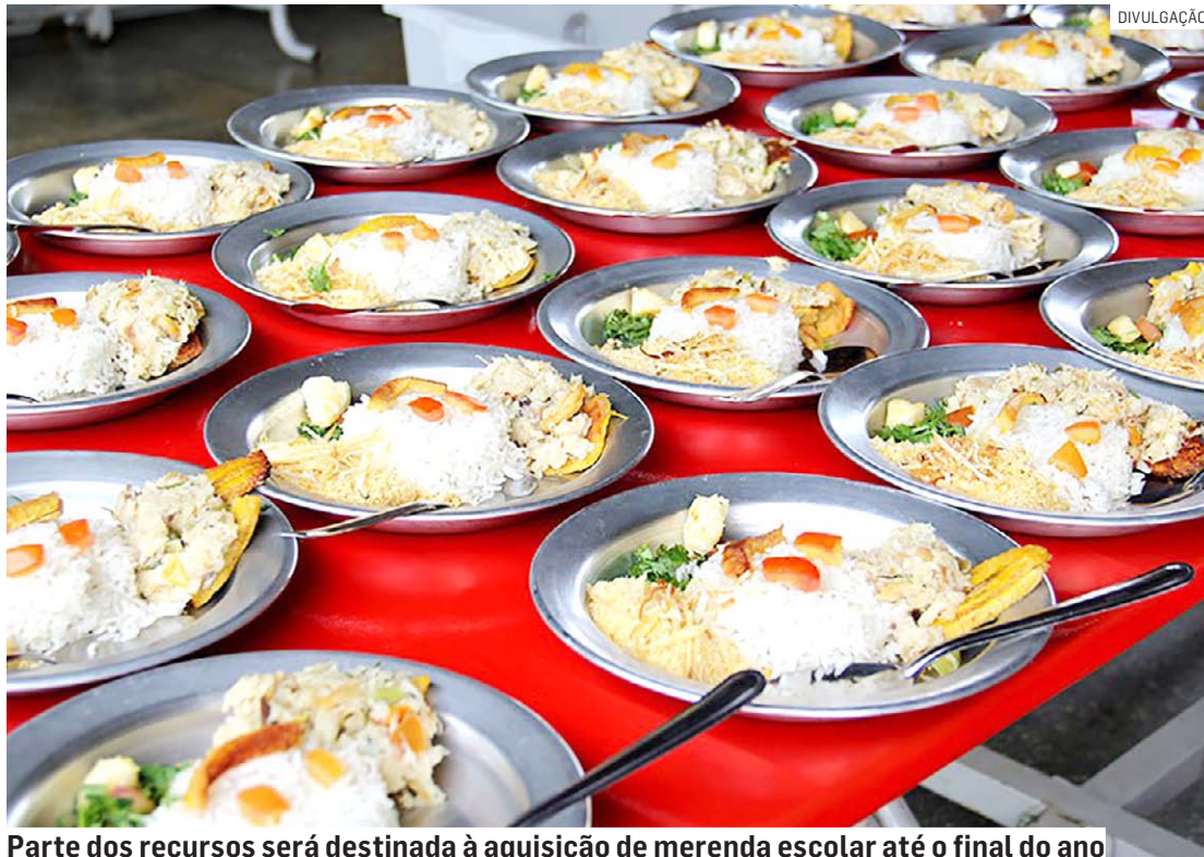
Parte dos recursos será destinada à aquisição de merenda escolar até o final do ano