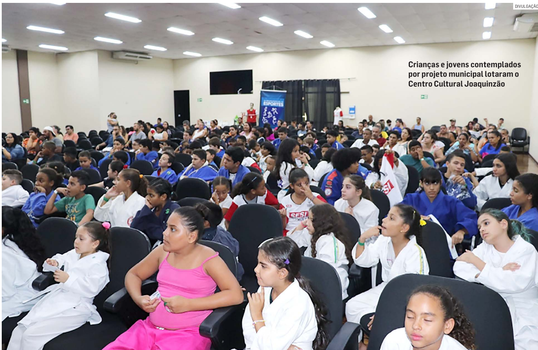
Crianças e jovens contemplados por projeto municipal lotaram o Centro Cultural Joaquinção

Segundo o secretário de Esportes de Monte Mor,