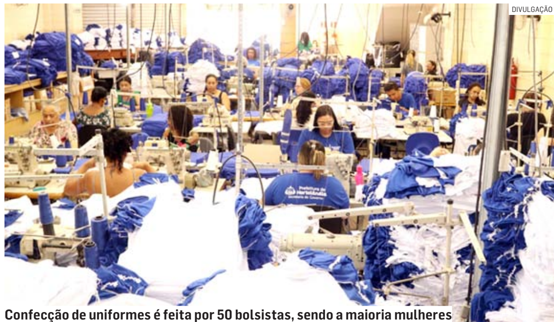
Confecção de uniformes é feita por 50 bolsistas, sendo a maioria mulheres

Da Redação • HORTOLÂNDIA tribunaliberal@tribunaliberal.com.br