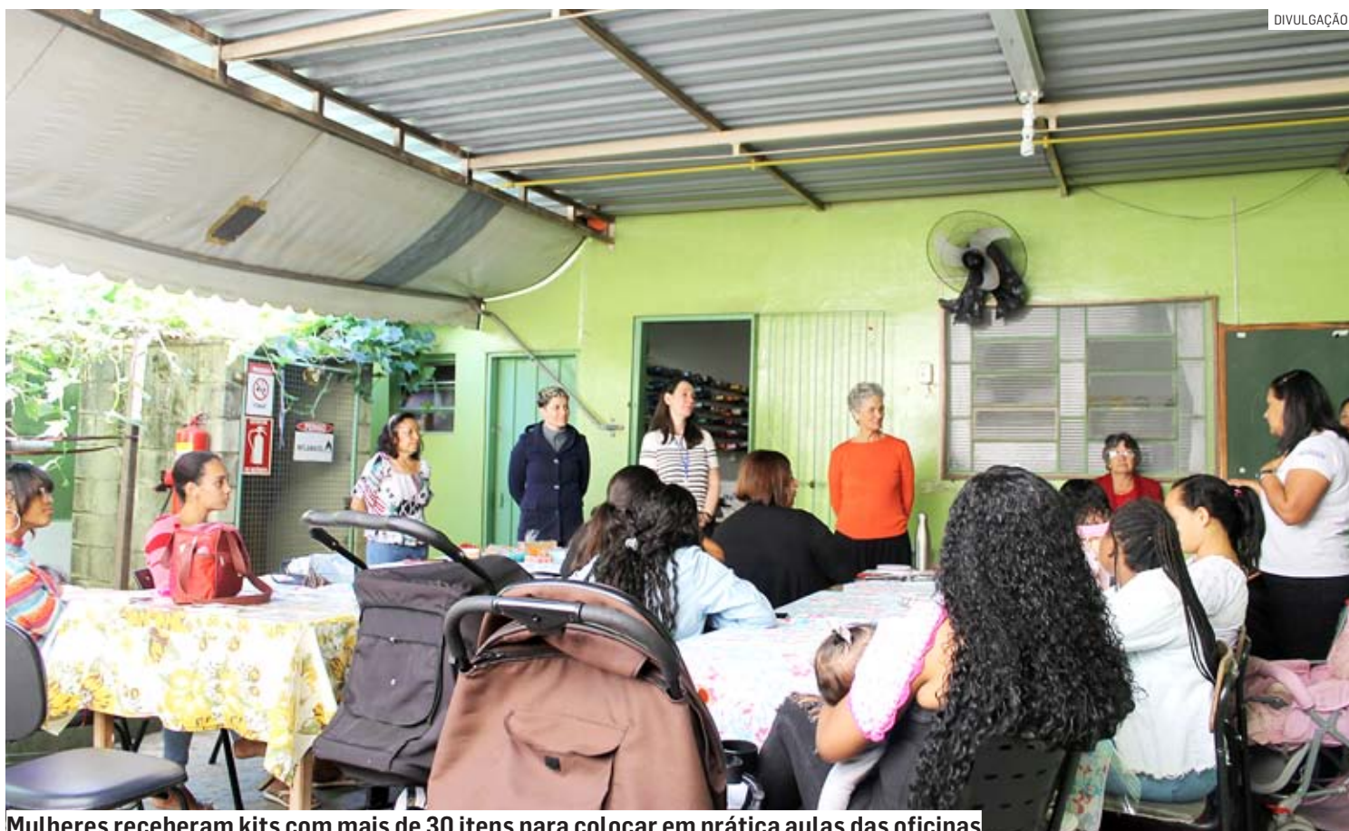
Mulheres receberam kits com mais de 30 itens para colocar em prática aulas das oficinas

“Durante as oficinas tivemos a oportunidade não só de aprender sobre os cosméticos naturais, mas também de saber como precificar o produto, qual o lucro, assim como entender a importância de comprar de fornecedores da região