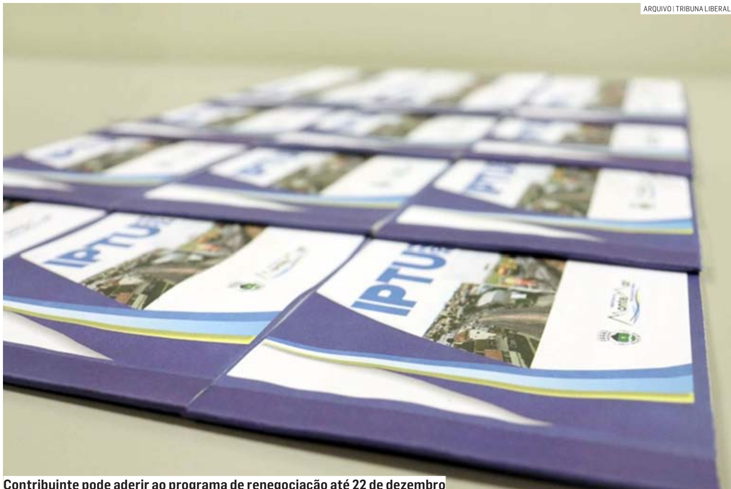
Contribuinte pode aderir ao programa de renegociação até 22 de dezembro

O principal objetivo do Refis é duplo: proporcionar alívio financeiro aos devedores e, ao mesmo tempo, fortalecer as finanças municipais para investimentos estratégicos. Com o aumento das receitas provenientes da regularização das dívidas, a Prefeitura de Monte Mor planeja investir substancialmente em áreas que impactam diretamente a vida dos moradores.