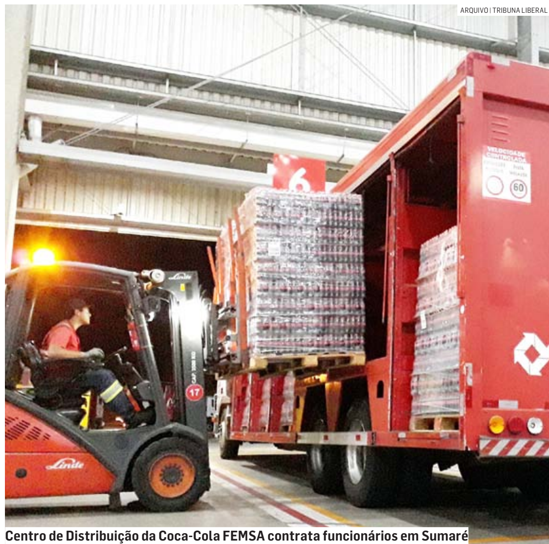
Centro de Distribuição da Coca-Cola FEMSA contrata funcionários em Sumaré

A Coca-Cola FEMSA Brasil alerta que todas as vagas de emprego são divulgadas nos canais oficiais: site de carreiras Coca-Cola FEMSA, site vagas.com.br/femsa e redes sociais Facebook e Instagram da empresa (perfis com si-