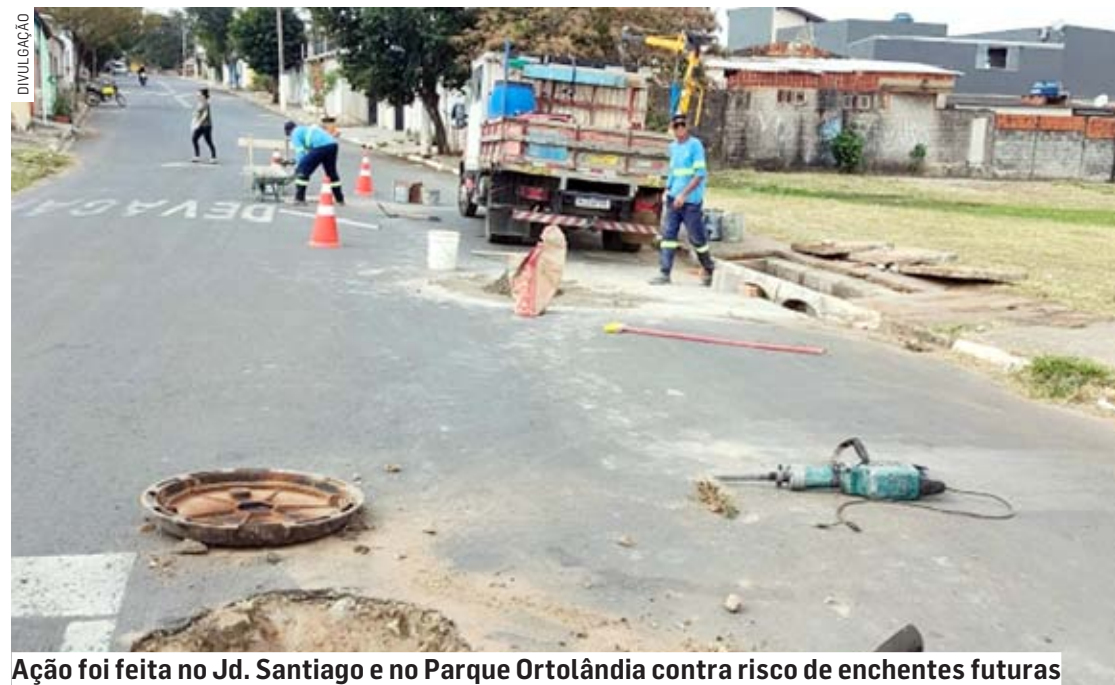
Ação foi feita no Jd. Santiago e no Parque Ortolândia contra risco de enchentes futuras