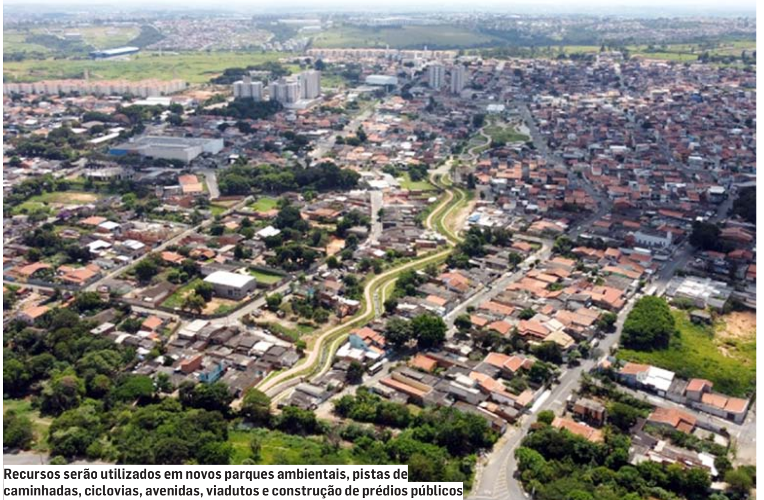
Recursos serão utilizados em novos parques ambientais, pistas de caminhadas, ciclovias, avenidas, viadutos e construção de prédios públicos

construção de prédios públicos e intervenções em arborização e paisagismo. A captação de recursos por meio de crédito financeiro junto ao Fonplata tem por objetivo antecipar obras de infraestrutura planejadas para os próximos 5 anos na cidade, tempo estimado do contrato. Entre os empreendimentos que serão contemplados pela operação de crédito internacional, a Prefeitura de Hortolândia planeja construir parques ambientais nos bairros Jd. Santiago, Jd. Boa Esperança (em frente ao Condomínio Residencial Esperança) e no Jd. Amanda, sendo que este último se tornará o maior parque linear da cidade. Além dos investimentos em revitalização ambiental, o Executivo Municipal usará a carta de crédito para otimizar a malha viária de Hortolândia, ao ligar a avenida Pa-