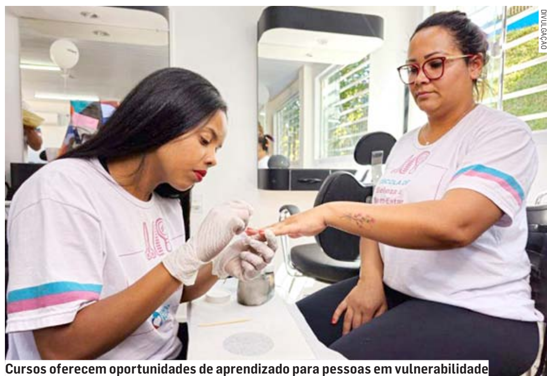
Cursos oferecem oportunidades de aprendizado para pessoas em vulnerabilidade

Beth Soares • REGIÃO tribunaliberal@tribunaliberal.com.br