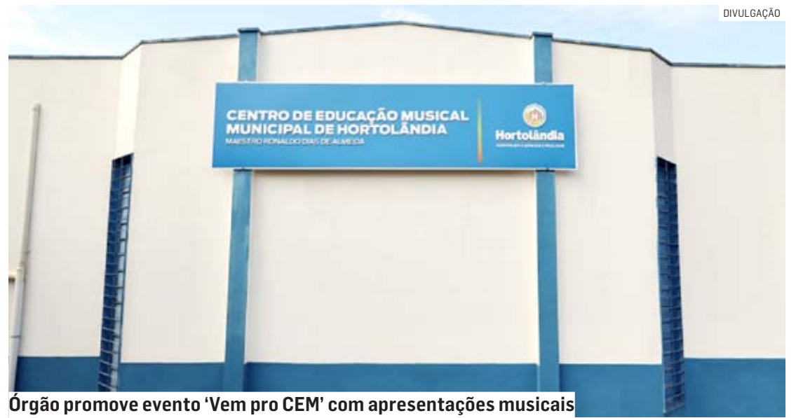
Órgão promove evento 'Vem pro CEM' com apresentações musicais

Da Redação • HORTOLÂNDIA tribunaliberal@tribunaliberal.com.br