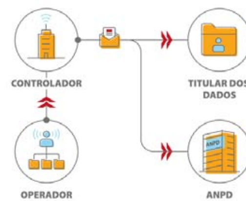
Figura 1 Para preservar os direitos dos titulares e tentar diminuir os possíveis prejuízos que um incidente de segurança possa causar, recomenda-se que a comunicação seja feita o mais breve possível, em até 2 (dois) dias úteis da ciência do fato.

• Normas: A ISO 27001 determina os requisitos do Sistema de Gestão de Segurança da Informação, incluindo a avaliação e tratamento de riscos de segurança da informação. Já a ISO 27002 estabelece o Código de Prática para controles de segurança da informação. A ISO 27701 determina requisitos dos sistemas de gestão da privacidade da informação, que é uma extensão das normas ISO 27001 e ISO 27002