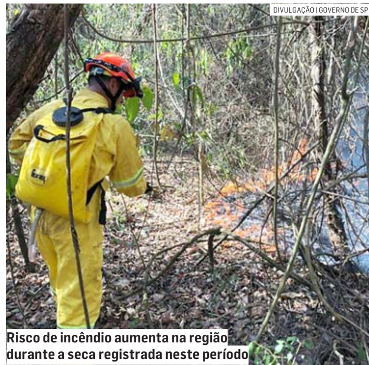
Risco de incêndio aumenta na região durante a seca registrada neste período

Diante disso, a Defesa Civil estadual pede atenção