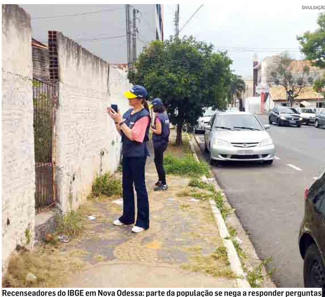
Recenseadores do IBGE em Nova Odessa: parte da população se nega a responder perguntas

O problema é que em caso de baixa adesão ge-