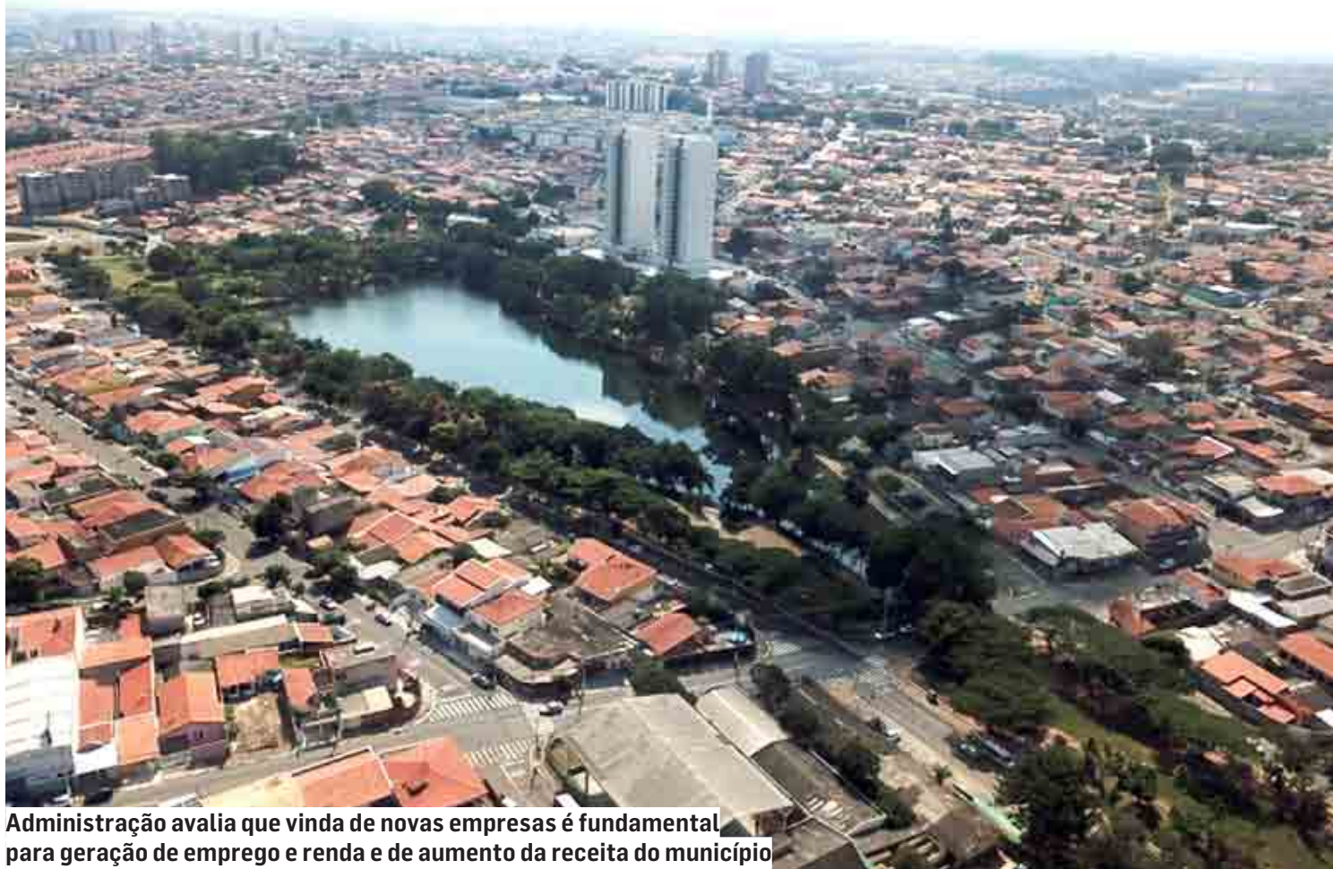
Administração avalia que vinda de novas empresas é fundamental para geração de emprego e renda e de aumento da receita do município

Outro dado importante que impacta na economia do município é o total de investimentos. De acordo com o secretário adjunto Dimas Corrêa Pádua, a estimativa é que, somando os investimentos realizados por essas novas empresas, o valor total seja em torno de R$ 350 milhões. “Neste momento de retomada pós-pandemia, a vinda dessas novas empresas é fundamental sob as perspectivas de geração de emprego e renda e de au-