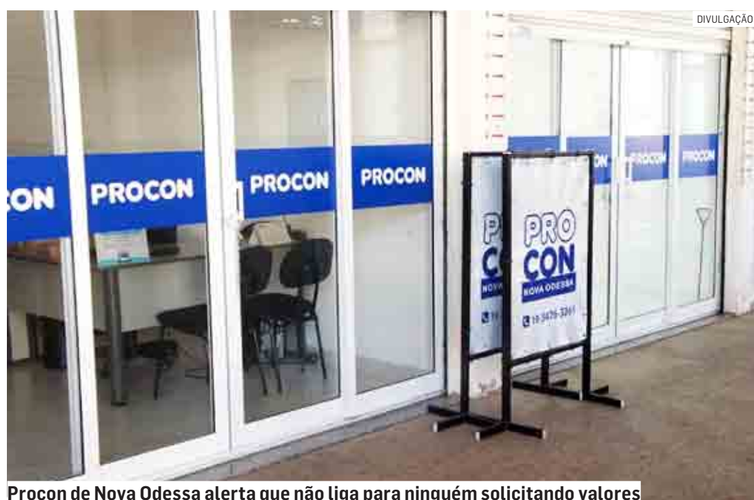
Procon de Nova Odessa alerta que não liga para ninguém solicitando valores

Da Redação | NOVA ODESSA tribunaliberal@tribunaliberal.com.br