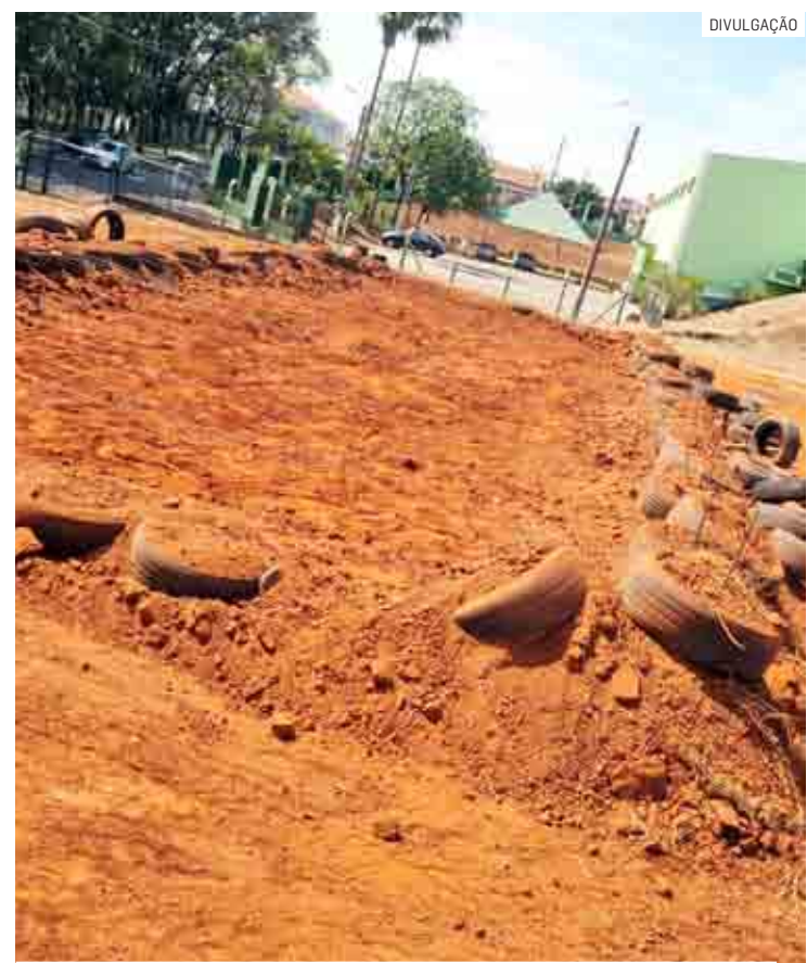
Percurso terá diversas dificuldades e foi instalado na área verde ao lado do Ginásio de Esportes do Jardim Santa Rosa