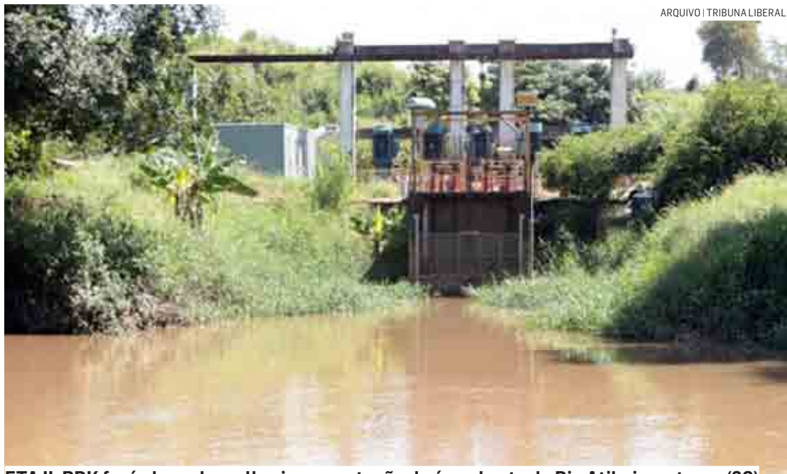
ETA II: BRK fará obras de melhoria na captação de água bruta do Rio Atibaia na terça (30)

Na adutora, também será realizada a substi-