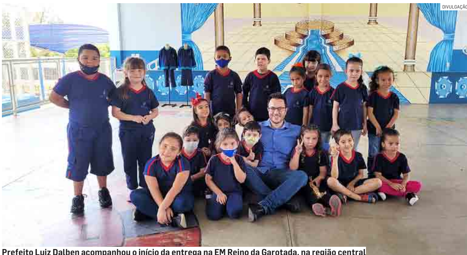
Prefeito Luiz Dalben acompanhou o início da entrega na EM Reino da Garotada, na região central

“Os investimentos na educação de Sumaré não param! As unidades escolares foram reformadas, receberam novos equipamentos e mobiliários, novas quadras, e todas as salas de aula agora possuem ar-condicionado e lousa digital. Também implantamos aulas de robótica e parquinhos inclusivos nas unidades. E para completar o ensino de qualidade, montamos os