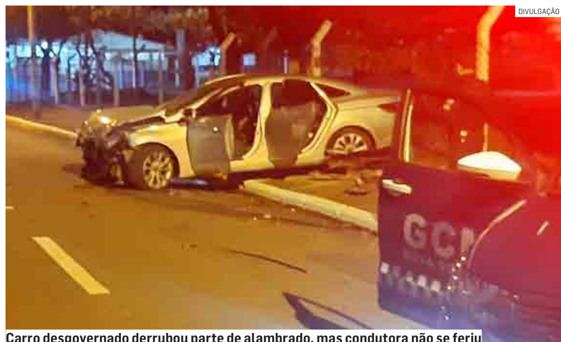
Carro descontrolado derrubou parte de alambrado, mas condutora não se feriu