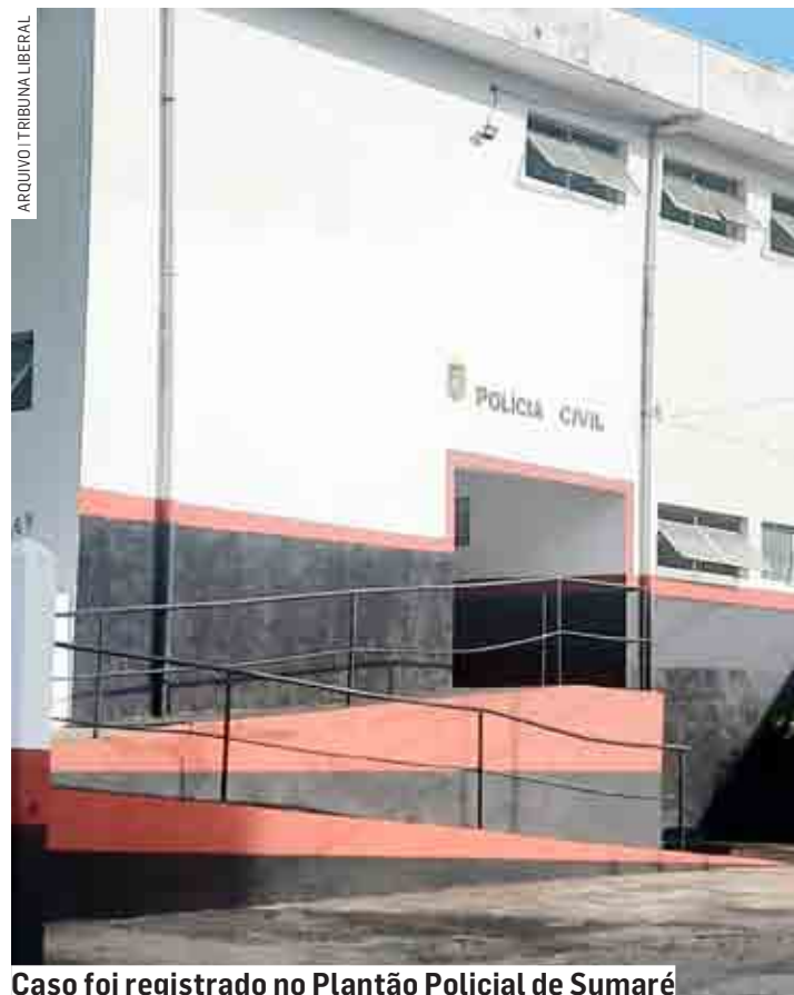
Caso foi registrado no Plantão Policial de Sumaré

Para sair da loja, a vítima precisou quebrar a porta de vidro. A Polícia Militar foi acionada e após tomar ciência