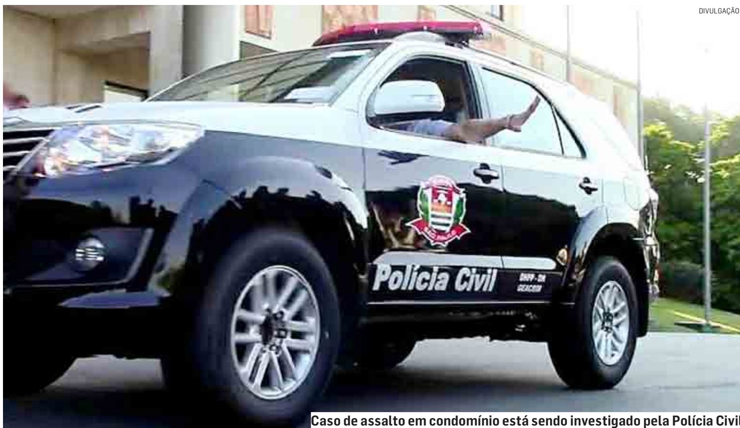
Caso de assalto em condomínio está sendo investigado pela Polícia Civil

Os bandidos amarraram o casal, e com um lençol, cobriram a cabeça de