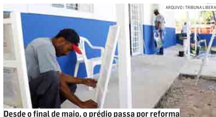
Desde o final de maio, o prédio passa por reforma

De acordo com a Secretaria de Inclusão e Desenvolvimento Social, responsável pela unidade de assistência, houve reestruturação interna do prédio, criação de novas salas para atividades em grupo e espaço para pequeno almoxarifado, ampliação de dois espaços já existentes e entrada com acessibilidade; reforma da parte elétrica e hidráulica; novo cabeamento para a rede de computadores e internet; manutenção da infraestrutura; paisagismo e pintura completa. Os recursos, da ordem de R$ 276 mil, são oriundos do município (R$ 126 mil) e