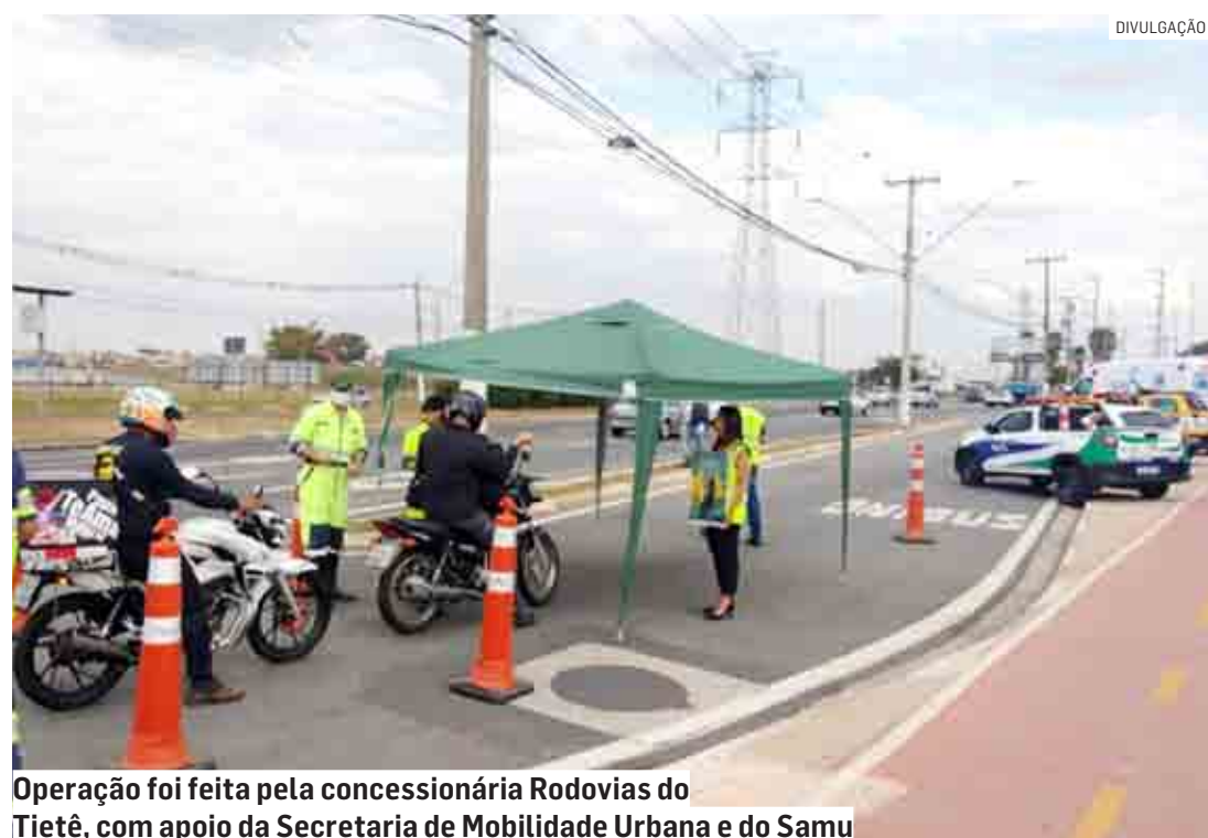
Operação foi feita pela concessionária Rodovias do Tietê, com apoio da Secretaria de Mobilidade Urbana e do Samu

motoristas e pedestres, reforço na sinalização, até a implantação de radares controladores de velocidade, principal medida adotada pela Administração Municipal para a redução de mortes no trânsito da cidade. Os dispositivos começaram a funcionar em janeiro de 2019. Além disso, a cidade recebe, periodicamente, um mutirão de Tapa-Buraco em todas as regiões. Outra medida importante é a instalação dos painéis eletrônicos informativos nos portais de entrada e saída da cidade e investimentos na malha cicloviária.