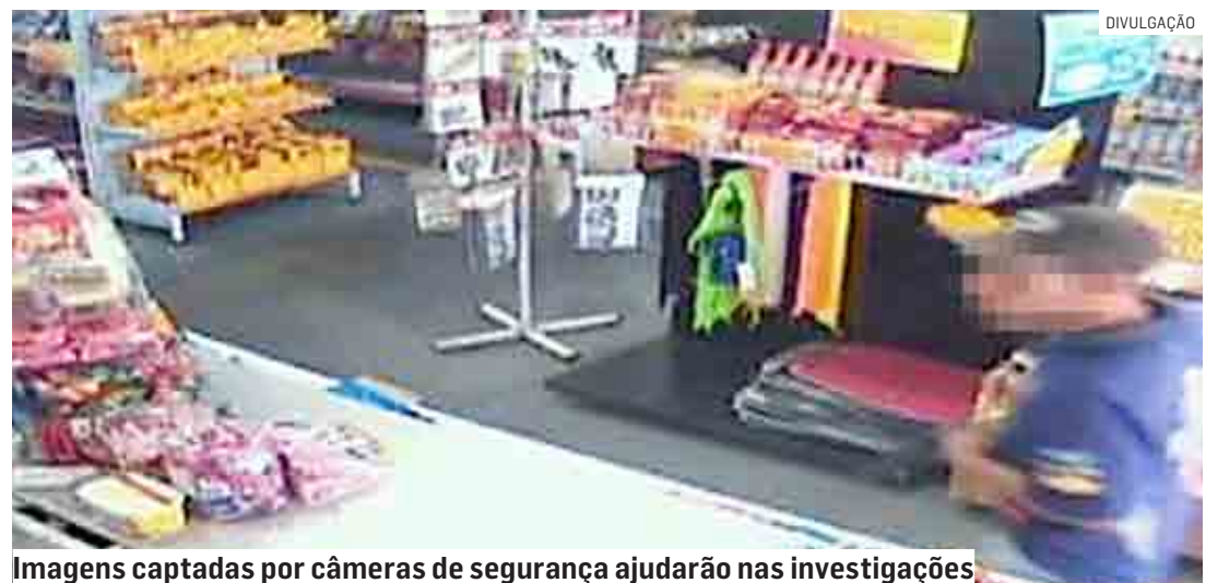
Imagens captadas por câmeras de segurança ajudarão nas investigações

Ela contou que o homem, usando boné e camiseta azul, entrou no estabelecimento e, armado, anunciou o assalto, exigindo que fosse entregue todo o dinheiro. A vítima entregou o que tinha no caixa. A quantia não foi informada.