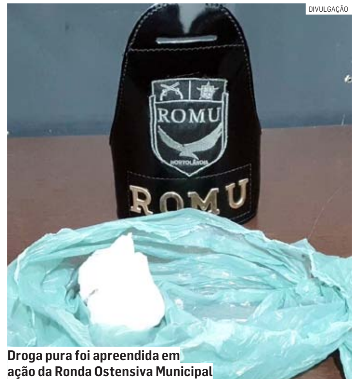
Droga pura foi apreendida em ação da Ronda Ostensiva Municipal

Ao ser questionado, o homem assumiu a posse da droga e informou que