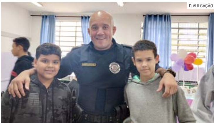
Patrulheiros acompanharam apresentação de defesa pessoal

Da Redação • NOVA ODESSA tribunaliberal@tribunaliberal.com.br