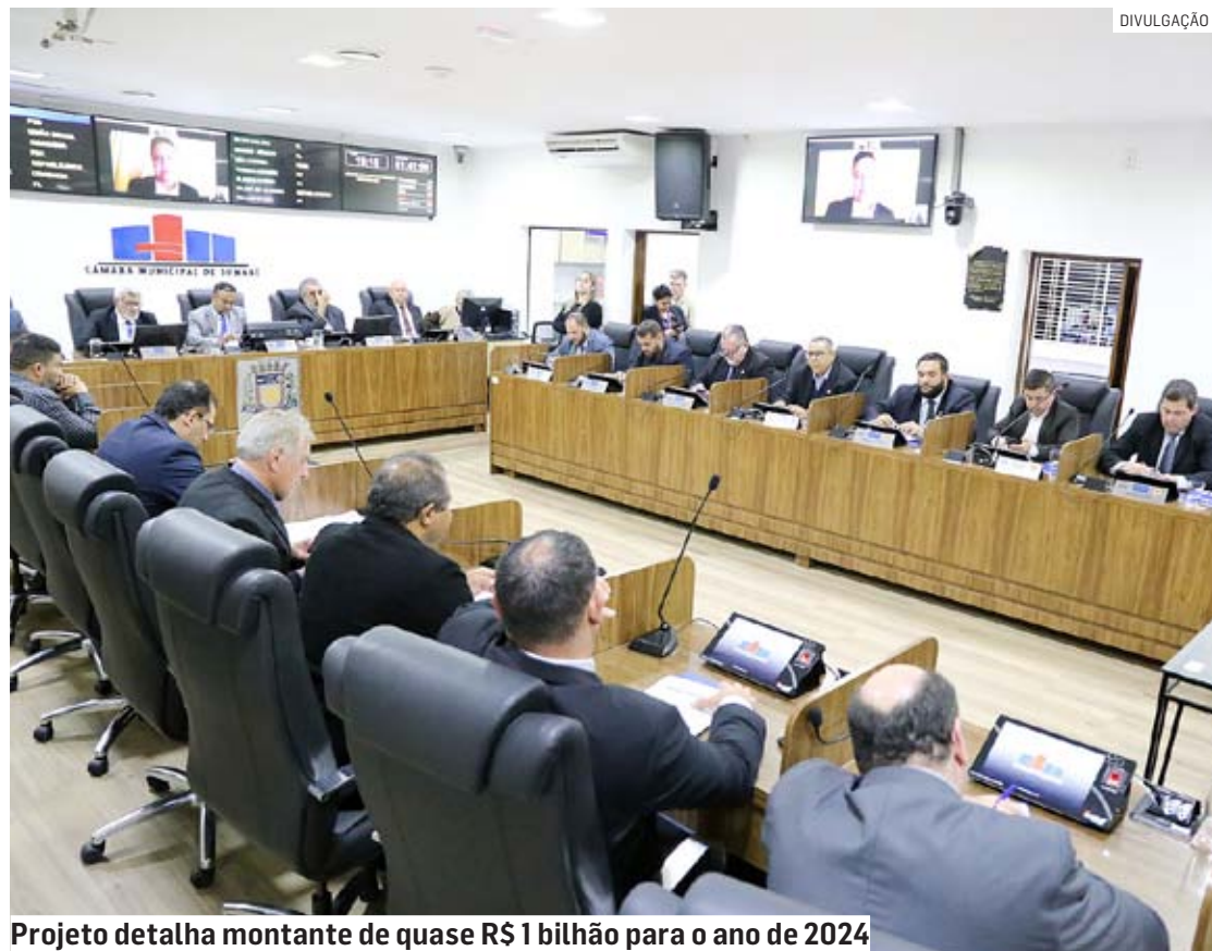
Projeto detalha montante de quase R$ 1 bilhão para o ano de 2024