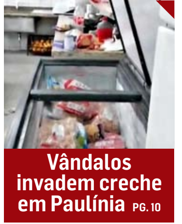
Vândalos invadem creche em Paulínia PG. 10