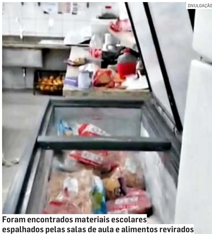
Foram encontrados materiais escolares espalhados pelas salas de aula e alimentos revirados

A Prefeitura de Paulínia informou que as aulas seriam retomadas no período da tarde e que a administração municipal já tomou "todas as medi-