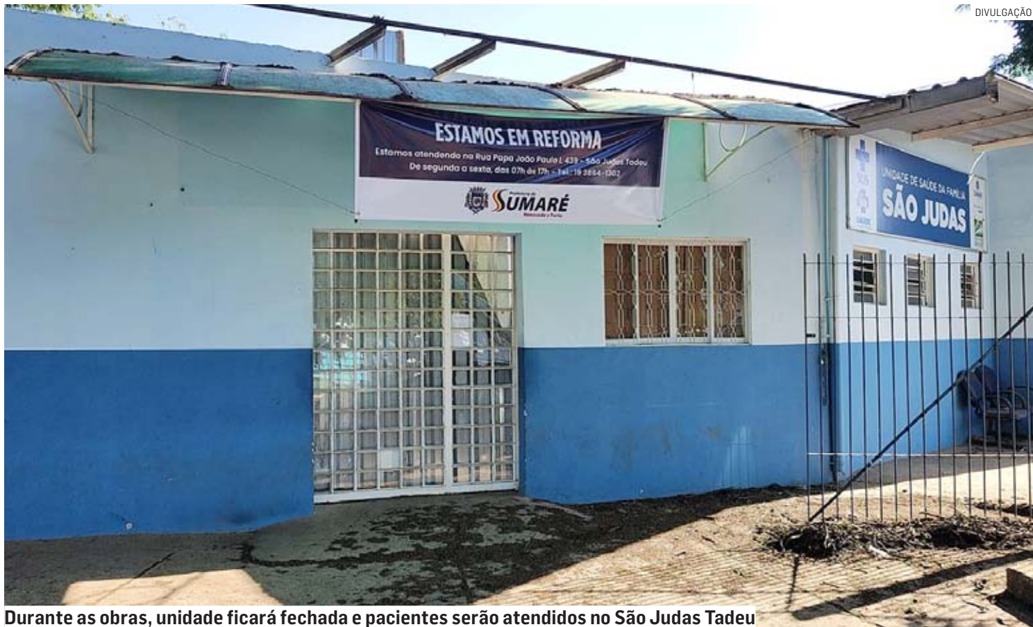
Durante as obras, unidade ficará fechada e pacientes serão atendidos no São Judas Tadeu

“O aperfeiçoamento do atendimento, tanto estrutural quanto pessoal, são um dos nossos gran-