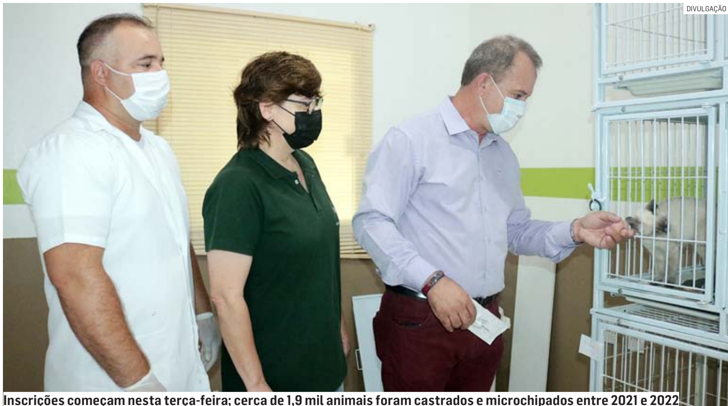
Inscrições começam nesta terça-feira; cerca de 1,9 mil animais foram castrados e microchipados entre 2021 e 2022

“Como médico veterinário e defensor da causa animal, entendo que promover a castração de cães e gatos é a melhor forma de evitarmos os maus-tratos e o abandono. Por isso, desde o início, a nossa gestão tem dado prioridade para esse programa de castração, já castramos quase 2 mil animais e vamos ampliar essa conta agora, com esta nova etapa do programa”,