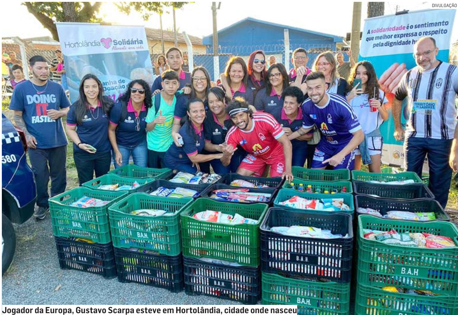
Jogador da Europa, Gustavo Scarpa esteve em Hortolândia, cidade onde nasceu