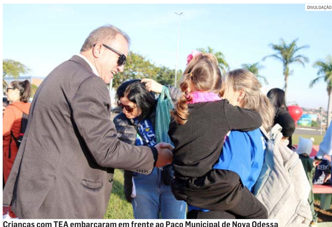
Crianças com TEA embarcaram em frente ao Paço Municipal de Nova Odessa

nica. “Foi um dia maravilhoso, as crianças amaram, porque é um parque inclusivo. Assim que chegamos já recebemos o apoio. Tivemos a participação de três terapeutas da APAE de Americana, caso alguma criança entrasse em crise, porque as crianças saem da roti-