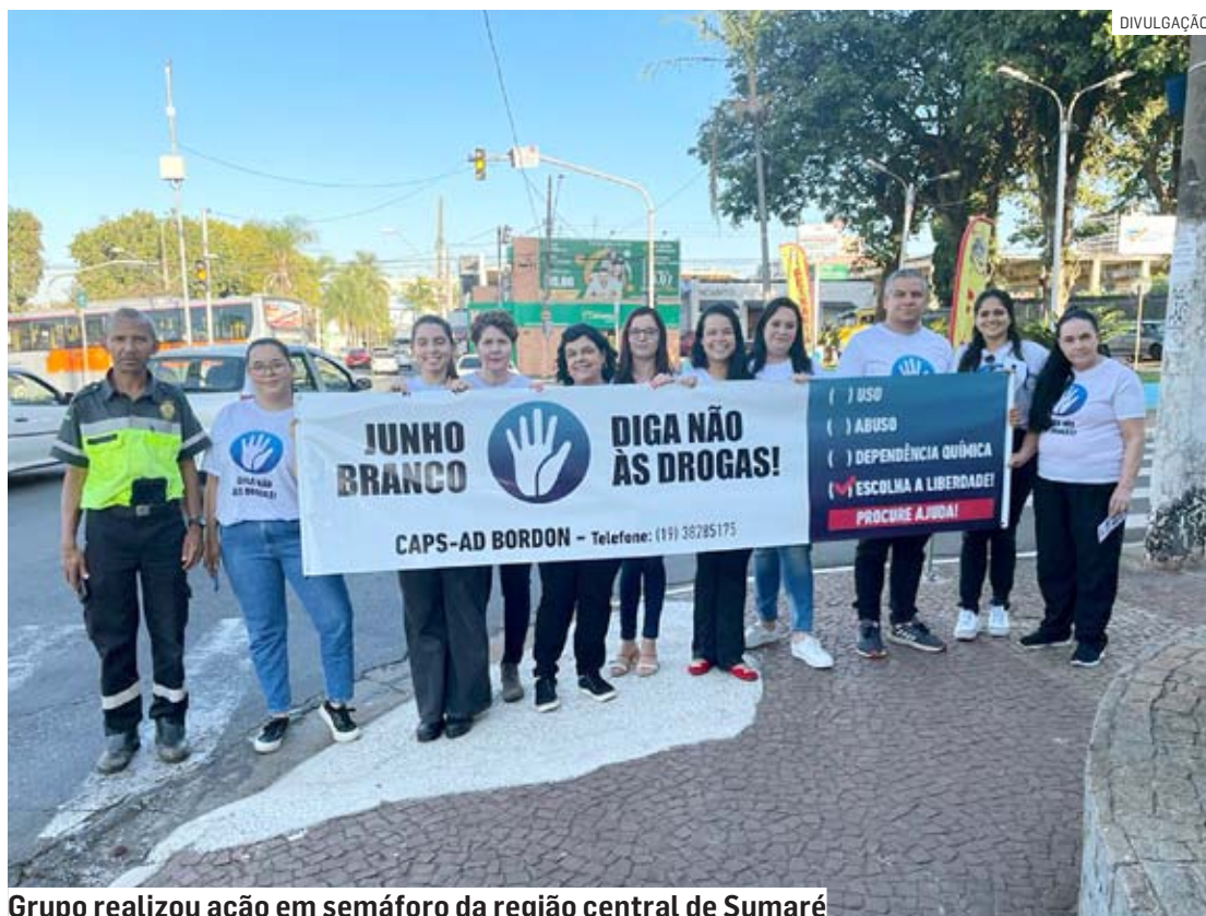
Grupo realizou ação em semáforo da região central de Sumaré

Ao longo do mês, a Prefeitura promove a campanha Junho Branco na rede municipal de saúde. São realizadas palestras em escolas e entidades, atividades de orientação e um arraiá com os pacientes do CAPS AD.