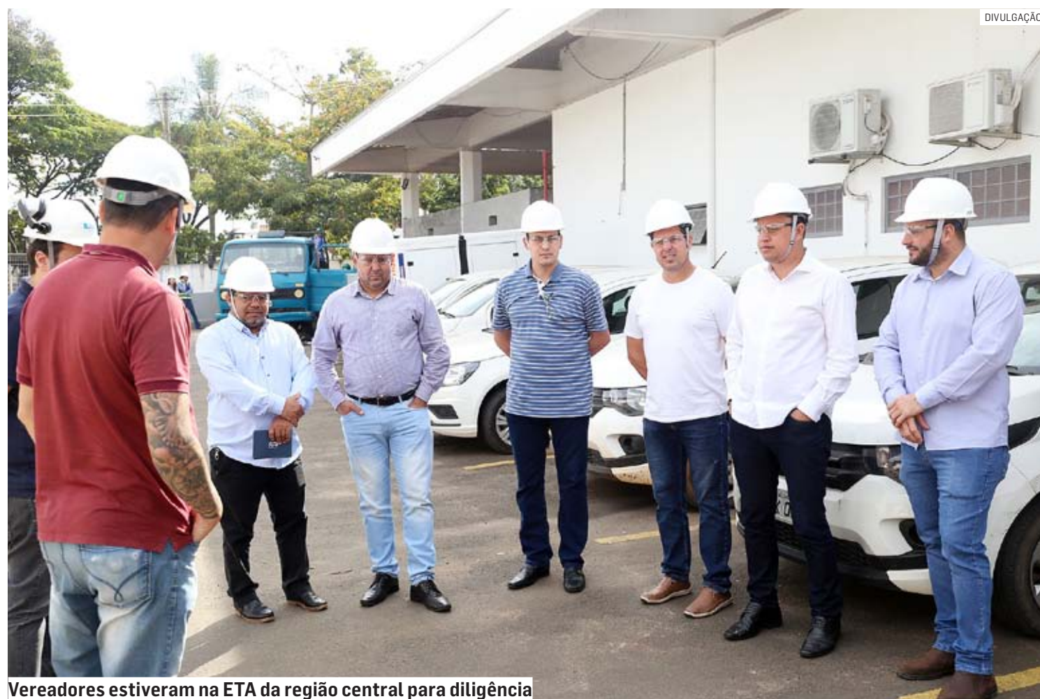
Vereadores estiveram na ETA da região central para diligência

Da Redação • SUMARÉ tribunaliberal@tribunaliberal.com.br