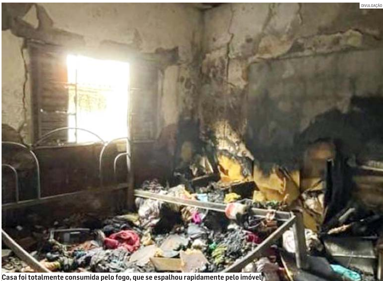
Casa foi totalmente consumida pelo fogo, que se espalhou rapidamente pelo imóvel

Arlindo Franco Zorzanello, de 72 anos, e Cleoni-