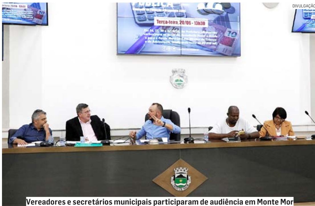
Vereadores e secretários municipais participaram de audiência em Monte Mor

veis pelas áreas detalharam a destinação das verbas. Do total, aproximadamente R$ 100 mil são para a área da Saúde, e R$ 290 mil para o Fundo Municipal dos Direitos da Criança e do Adolescente. Também foi destacado, no encontro, a importância de se fortalecer as Organizações da Sociedade Civil, visando à efetivação de políticas públicas de atendimento à população.