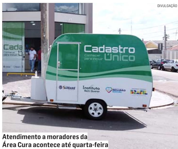
Atendimento a moradores da Área Cura acontece até quarta-feira