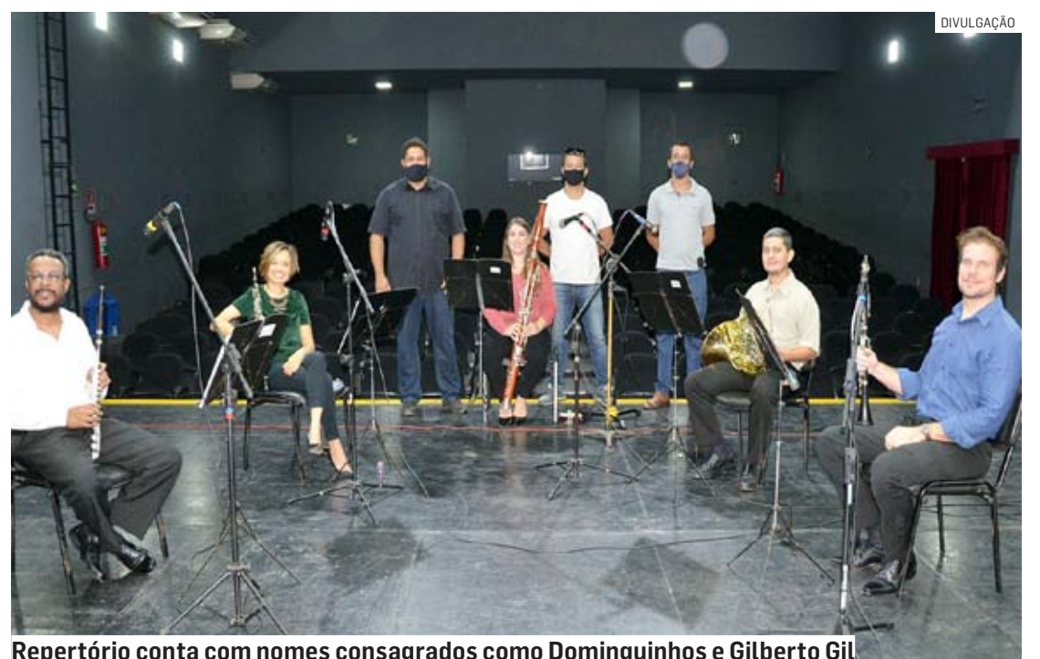
Repertório conta com nomes consagrados como Dominginhos e Gilberto Gil