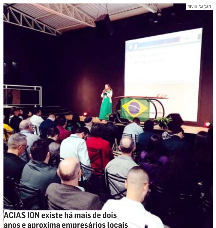
ACIAS ION existe há mais de dois anos e aproxima empresários locais