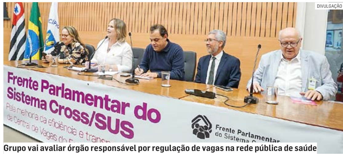
Grupo vai avaliar órgão responsável por regulação de vagas na rede pública de saúde

Da Redação • HORTOLÂNDIA tribunaliberal@tribunaliberal.com.br