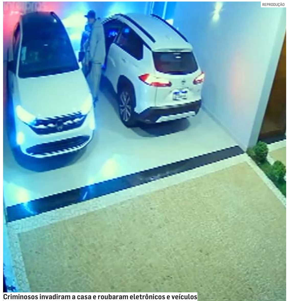
Criminosos invadiram a casa e roubaram eletrônicos e veículos

O condomínio enviou uma mensagem aos condôminos informando que reforçou a segurança no local e que deve estudar mais medidas de segurança.