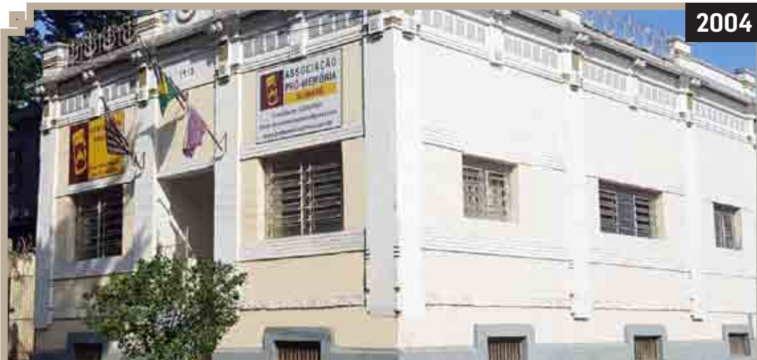
FUNDAÇÃO DA ASSOCIAÇÃO PRÓ-MEMÓRIA SUMARÉ