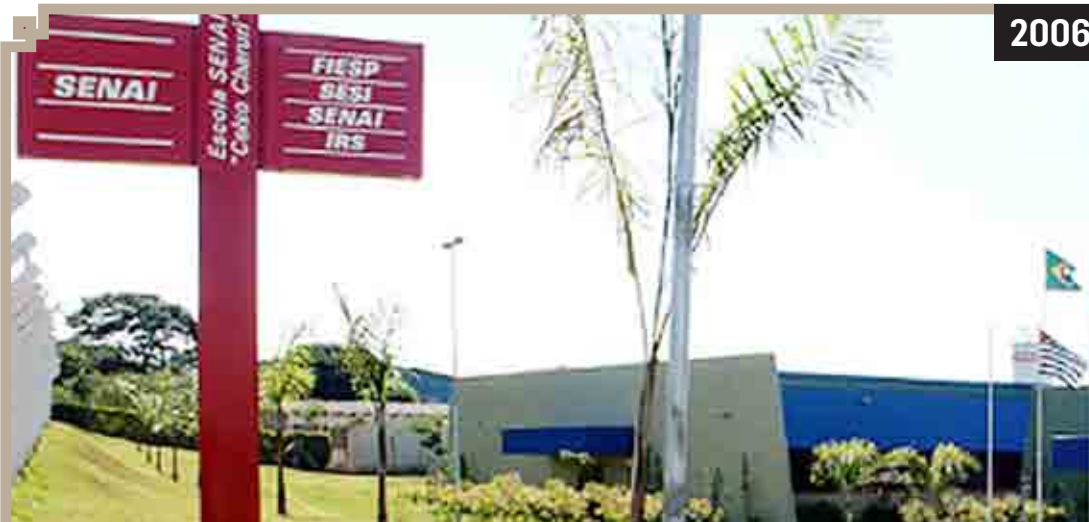
INSTALAÇÃO ESCOLA CELSO CHARURI - SENAI