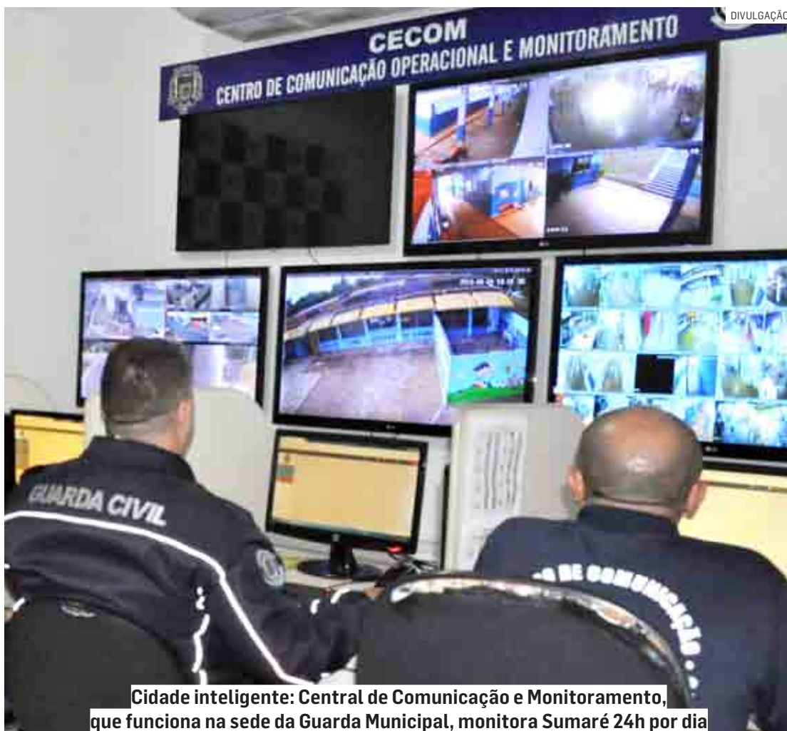
Cidade inteligente: Central de Comunicação e Monitoramento, que funciona na sede da Guarda Municipal, monitora Sumaré 24h por dia

De acordo com a Prefeitura, a Guarda Municipal também passou a operar com tablets e rádios digitais criptografados, agilizando as ocorrências e