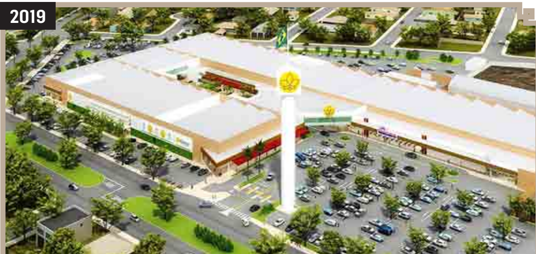
INSTALAÇÃO DO SHOPPING PARK CITY SUMARÉ