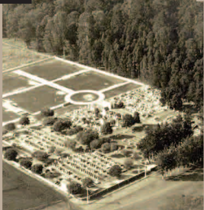
CRIAÇÃO DO CEMITÉRIO MUNICIPAL DA SAUDE