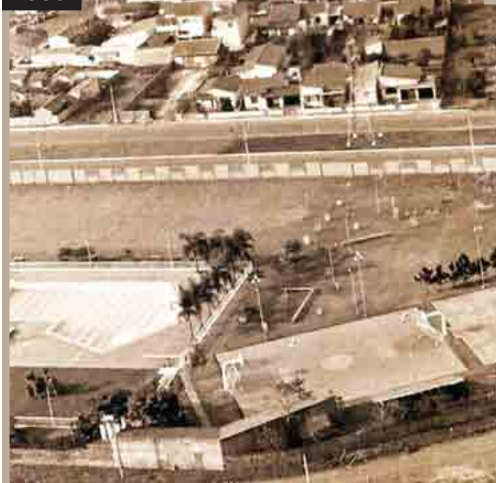
FUNDAÇÃO DO CLUBE RECREATIVO SUMARÉ