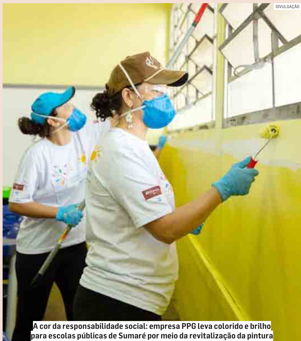
A cor da responsabilidade social: empresa PPG leva colorido e brilho para escolas públicas de Sumaré por meio da revitalização da pintura

Ação tem o objetivo de reduzir a desigualdade de gênero na área tecnológica e científica, além de proporcionar capacitação técnica para que as jovens possam seguir carreira no setor