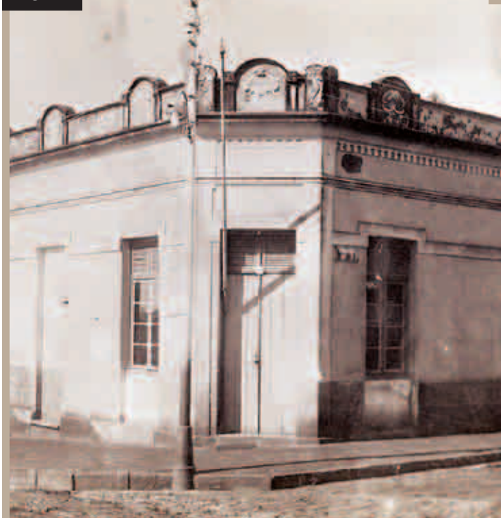
CRIAÇÃO DAS ESCOLAS REUNIDAS DE REBOUCAS - DEPOIS GRUPO ESCOLAR