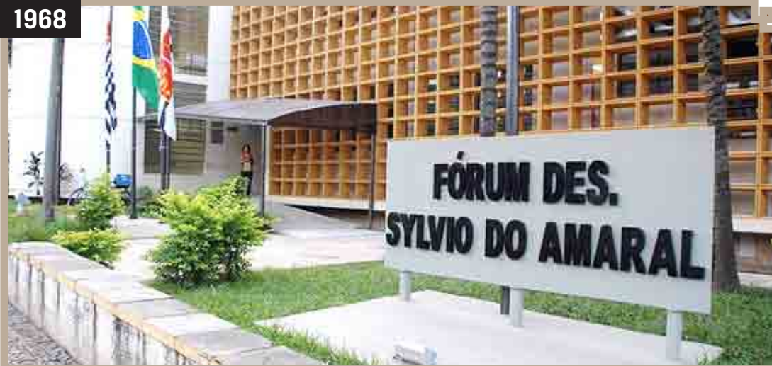
INSTALAÇÃO DA COMARCA DE SUMARÉ