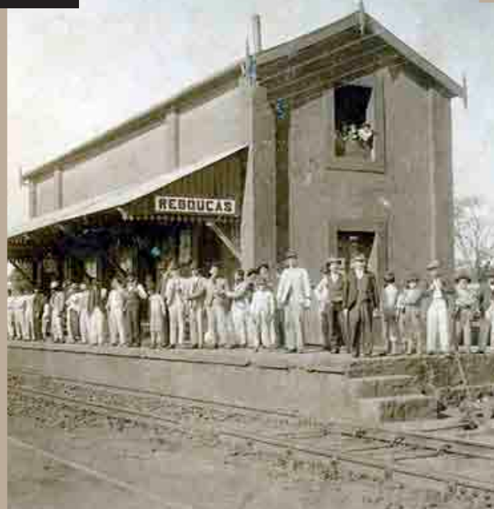
INAUGURAÇÃO ESTAÇÃO DE REBOUCAS