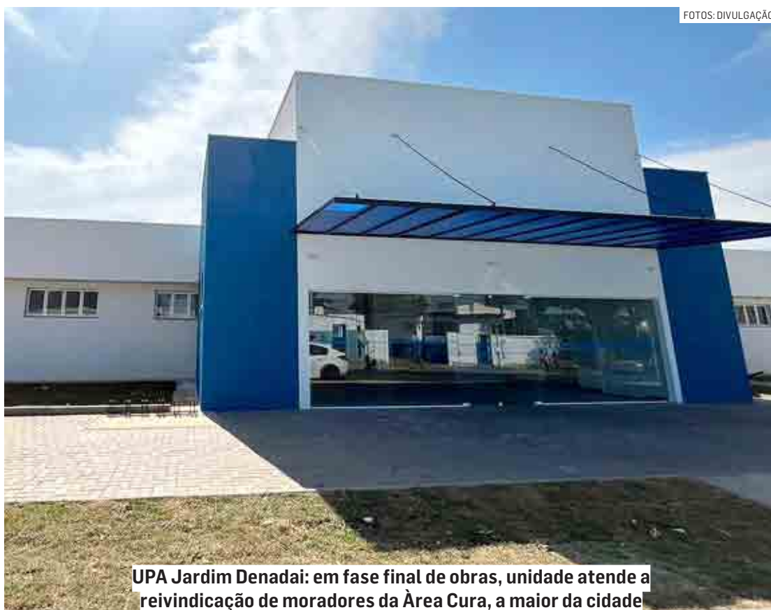
UPA Jardim Denadai: em fase final de obras, unidade atende a reivindicação de moradores da Área Cura, a maior da cidade

“Também já foi iniciado o projeto de implantação da UPA Maria Antonia, a quarta UPA da cidade”, diz nota da assessoria de imprensa.