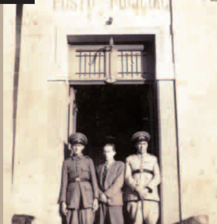
CRIAÇÃO DO DISTRITO POLICIAL E DA CADEIA