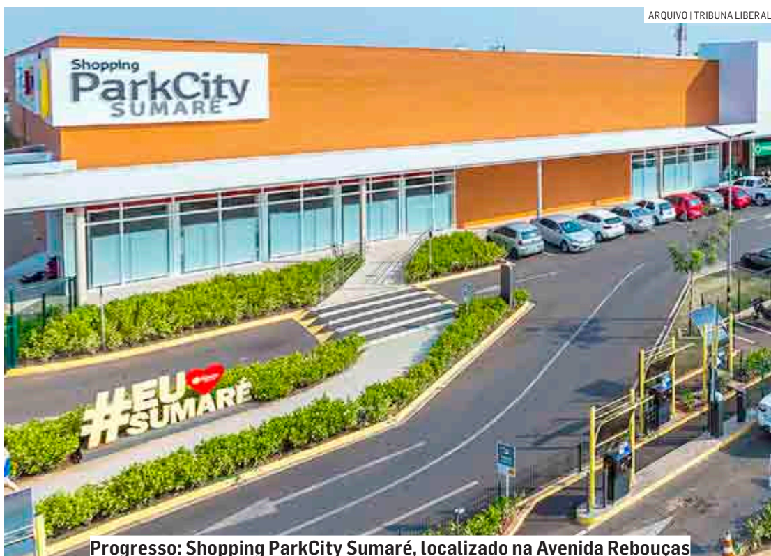
Progresso: Shopping ParkCity Sumaré, localizado na Avenida Rebouças

“Nesses mais de dois anos de funcionamento, o Shopping ParkCity Sumaré