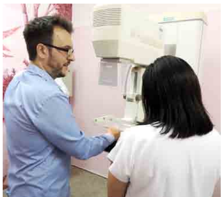
Ambulatório de Especialidades conta com Central de Atendimento para agendamento de consultas por telefone

Agora, o Ambulatório de Especialidades de Sumaré conta com uma Central de Atendimento para o agendamento de consultas por telefone. Antes, usuários tinham que se deslocar até a unidade para marcar os procedimentos.