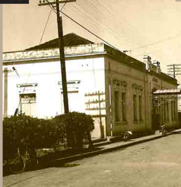
CONSTRUÇÃO DO NOVO PRÉDIO DA ESTAÇÃO FERROVIÁRIA DE REBOUCAS