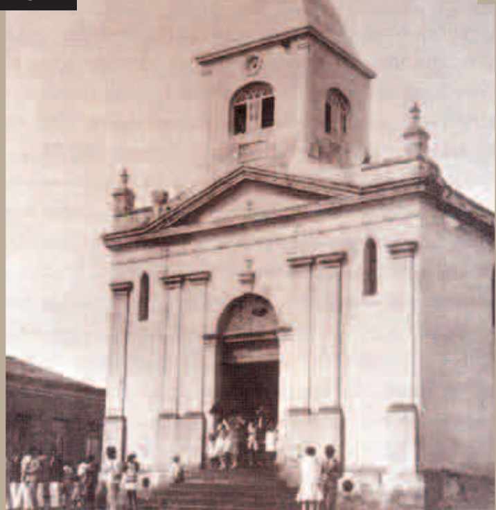
CRIAÇÃO DA PARÓQUIA DE SANT'ANA