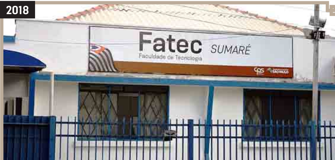
INSTALAÇÃO FACULDADE DE TECNOLOGIA DE SUMARÉ - FATEC