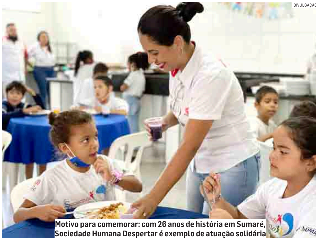
Motivo para comemorar: com 26 anos de história em Sumaré, Sociedade Humana Despertar é exemplo de atuação solidária

A linha do tempo da instituição acompanha o crescimento de Sumaré com marcos de conquistas sociais reconhecidos pela comunidade. Com foco na formação profissional de mulheres em segmentos como gastronomia, moda e