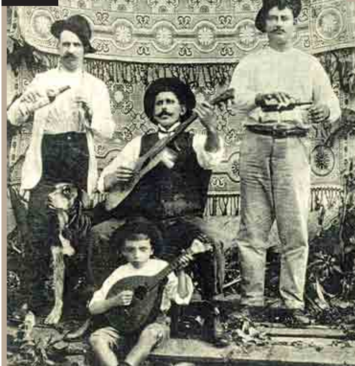
FUNDAÇÃO SOCIEDADE MUSICAL REBOUCENSE