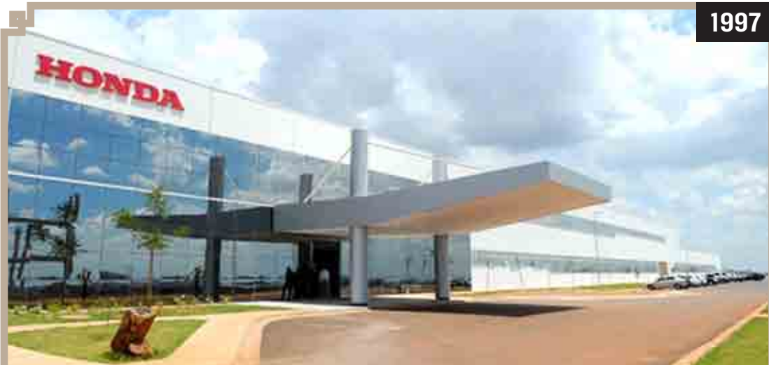
INAUGURAÇÃO DA HONDA SUMARÉ