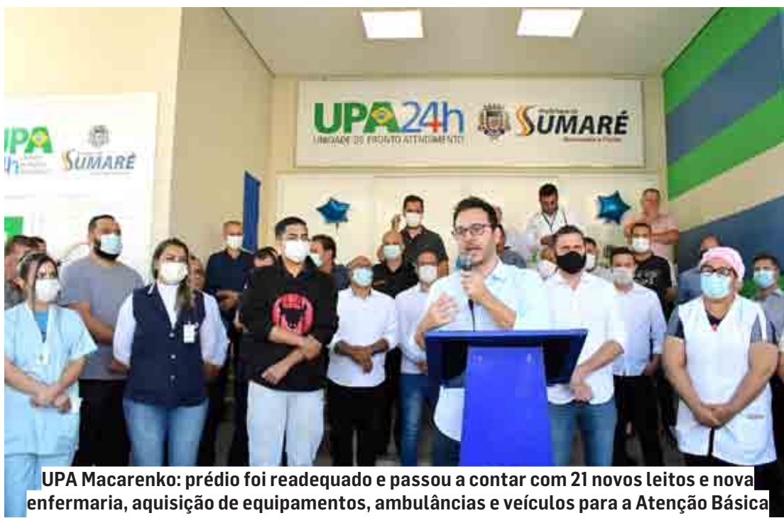
UPA Macarenko: prédio foi readequado e passou a contar com 21 novos leitos e nova enfermaria, aquisição de equipamentos, ambulâncias e veículos para a Atenção Básica