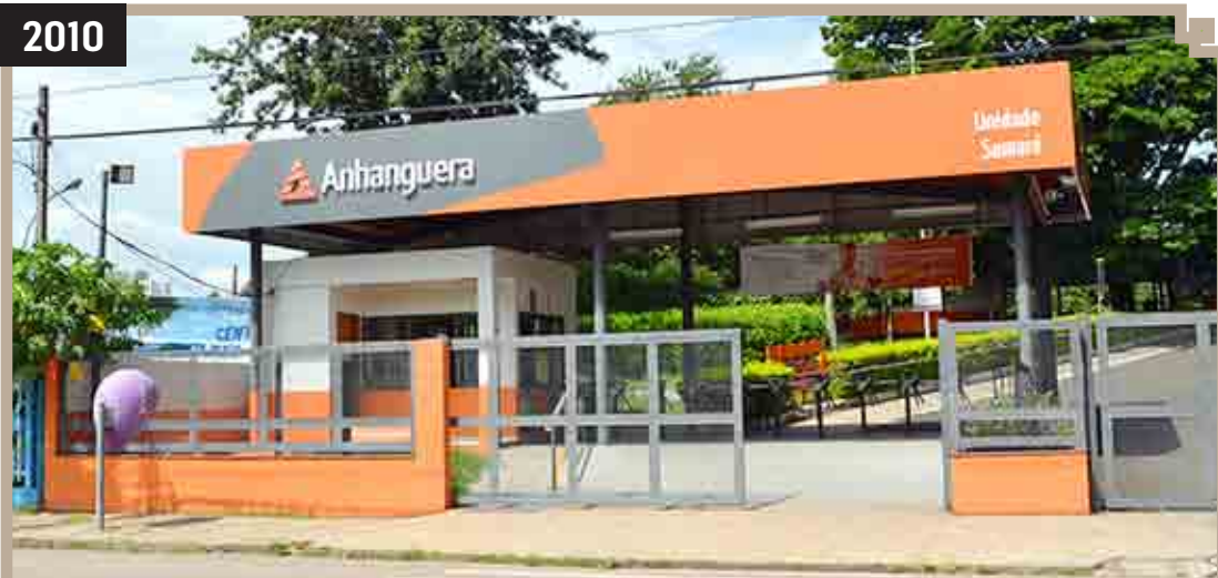
INÍCIO DAS ATIVIDADES DA FACULDADE ANHANGUERA SUMARÉ