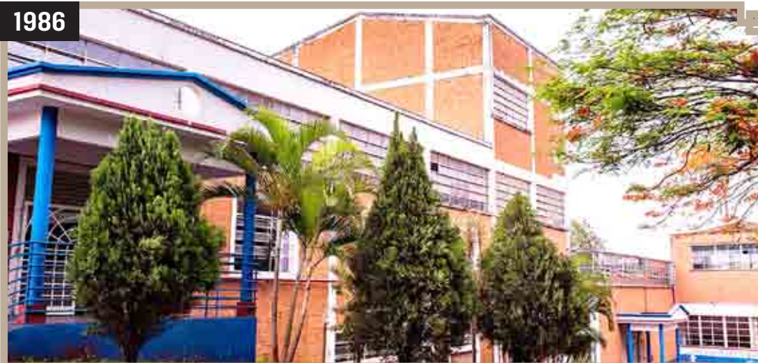
INSTALAÇÃO DA ESCOLA E FACULDADES NETWORK