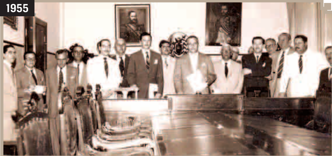
SUMARÉ SE TORNA MUNICÍPIO INDEPENDENTE - COMISSÃO DE EMANCIPAÇÃO