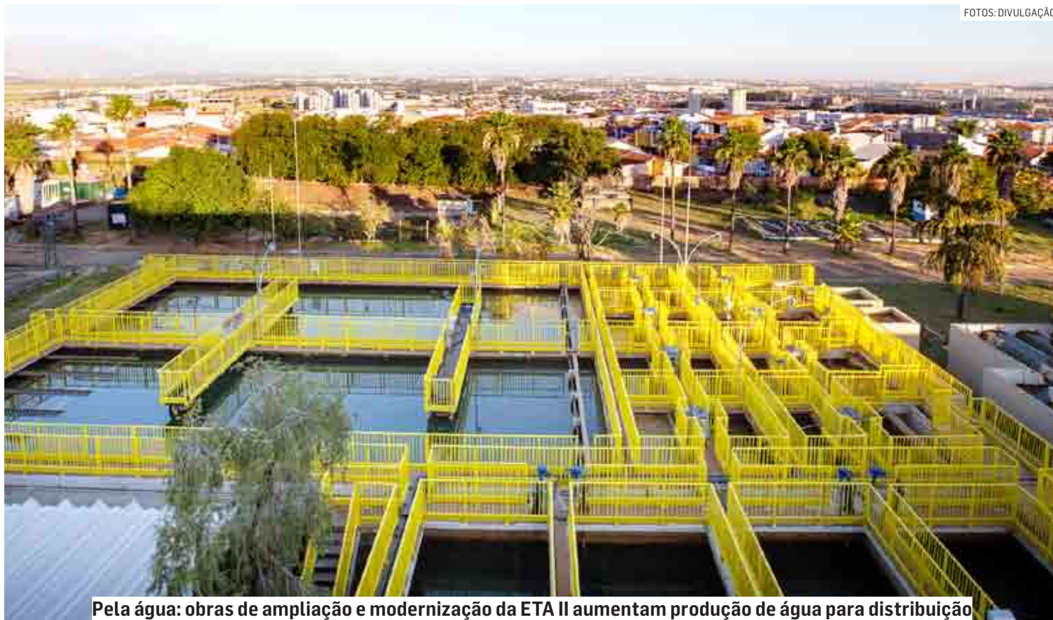
Pela água: obras de ampliação e modernização da ETA II aumentam produção de água para distribuição

Esses equipamentos monitoram 24h por dia a qualidade da água no canal de entrada da capta-