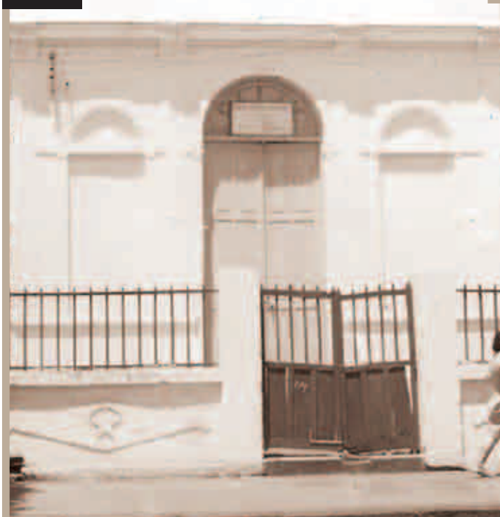
FUNDAÇÃO DA SOCIEDADE ITALIANA DE REBOUCAS