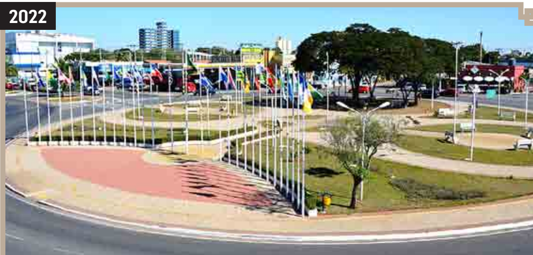
154 ANOS DE SUMARÉ - PRAÇA DAS BANDEIRAS