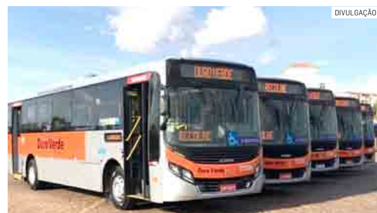
Viagem com conforto: ônibus do transporte coletivo são equipados com ar-condicionado, sistema de Wi-fi e elevador

“Pagamos caro na passagem, então é justo e respeitoso andarmos em ônibus decentes, com segu-