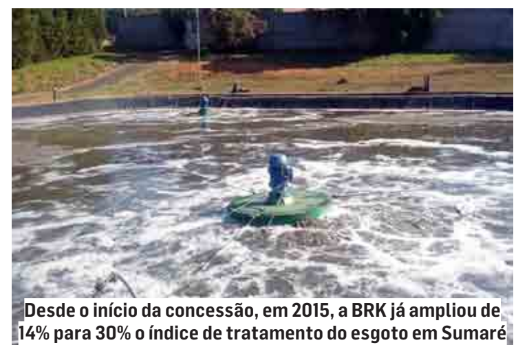
Desde o início da concessão, em 2015, a BRK já ampliou de 14% para 30% o índice de tratamento do esgoto em Sumaré

A concessionária já concluiu a etapa de terraplanagem e se prepara para o início da construção da estação, o que ocorrerá em paralelo à implantação das redes de coleta de esgoto responsáveis por levar o efluente para tratamento na nova ETE.