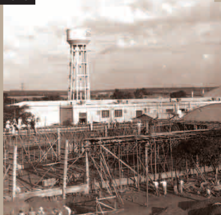
INSTALAÇÃO DA 3M - PRIMEIRA INDÚSTRIA MULTINACIONAL DO MUNICÍPIO