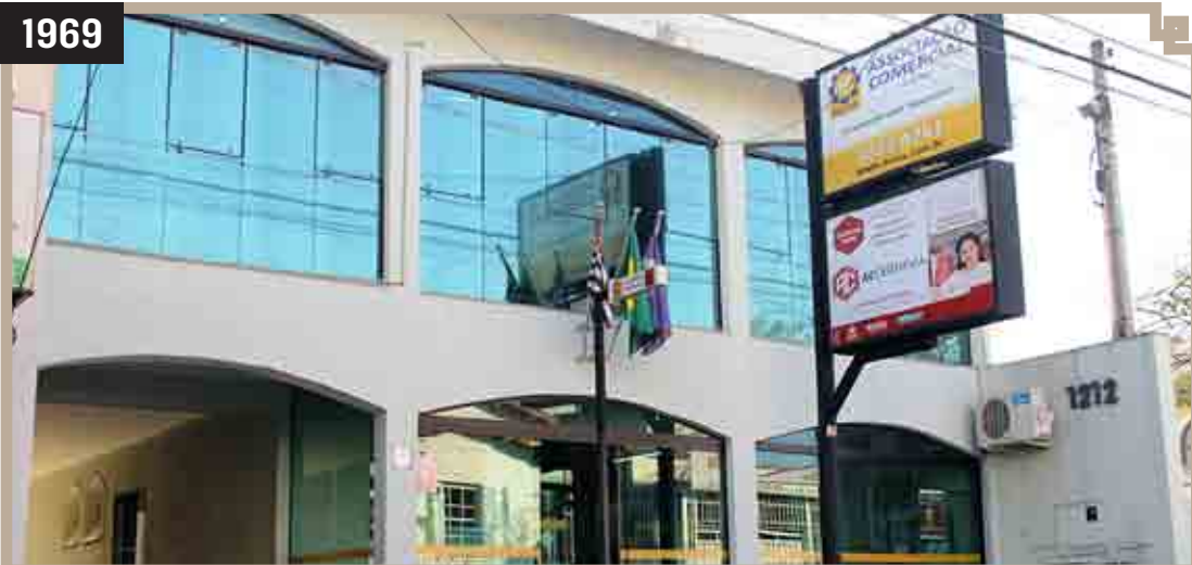
INAGURAÇÃO DA ACIAS