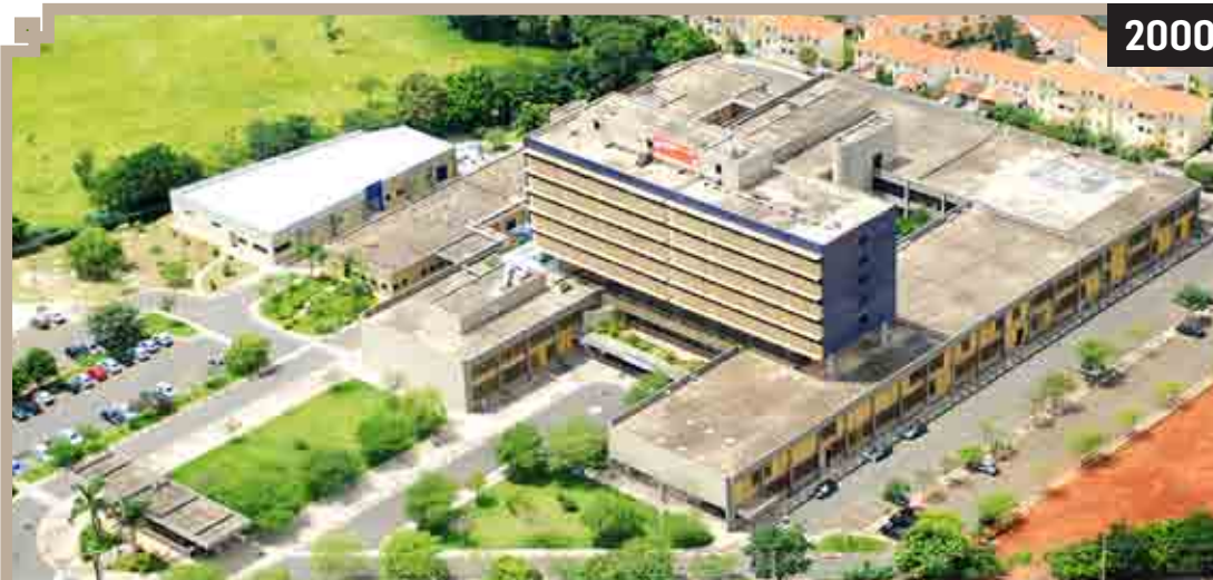
INAGURAÇÃO HOSPITAL ESTADUAL DR. LEANDRO FRANCESCHINI