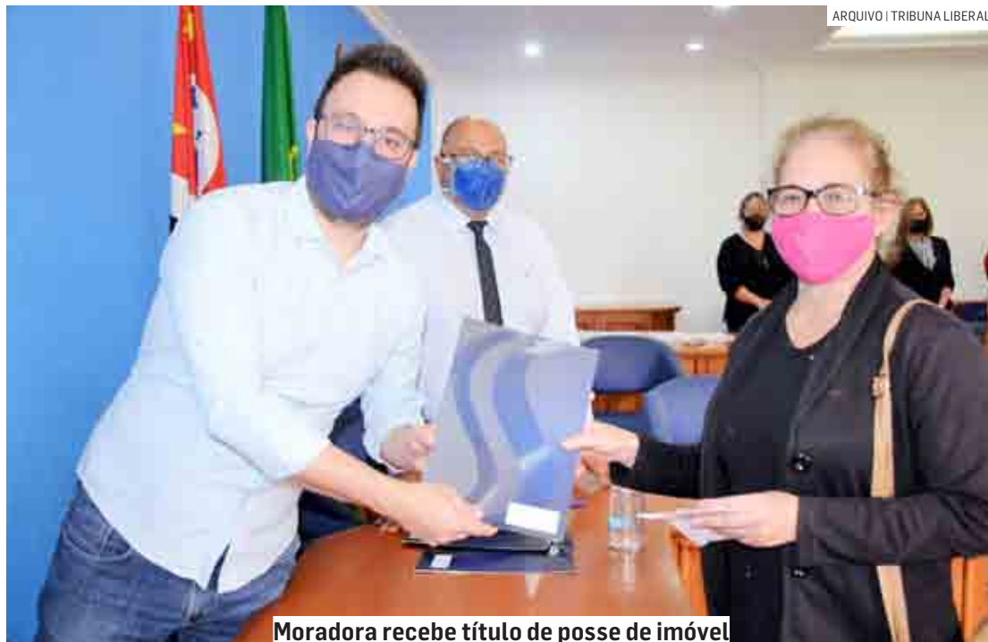
Moradora recebe título de posse de imóvel

Segundo o secretário, ainda há um déficit de cerca de 60 núcleos para regularização, fruto de ocupações ocorridas em décadas passadas, onde