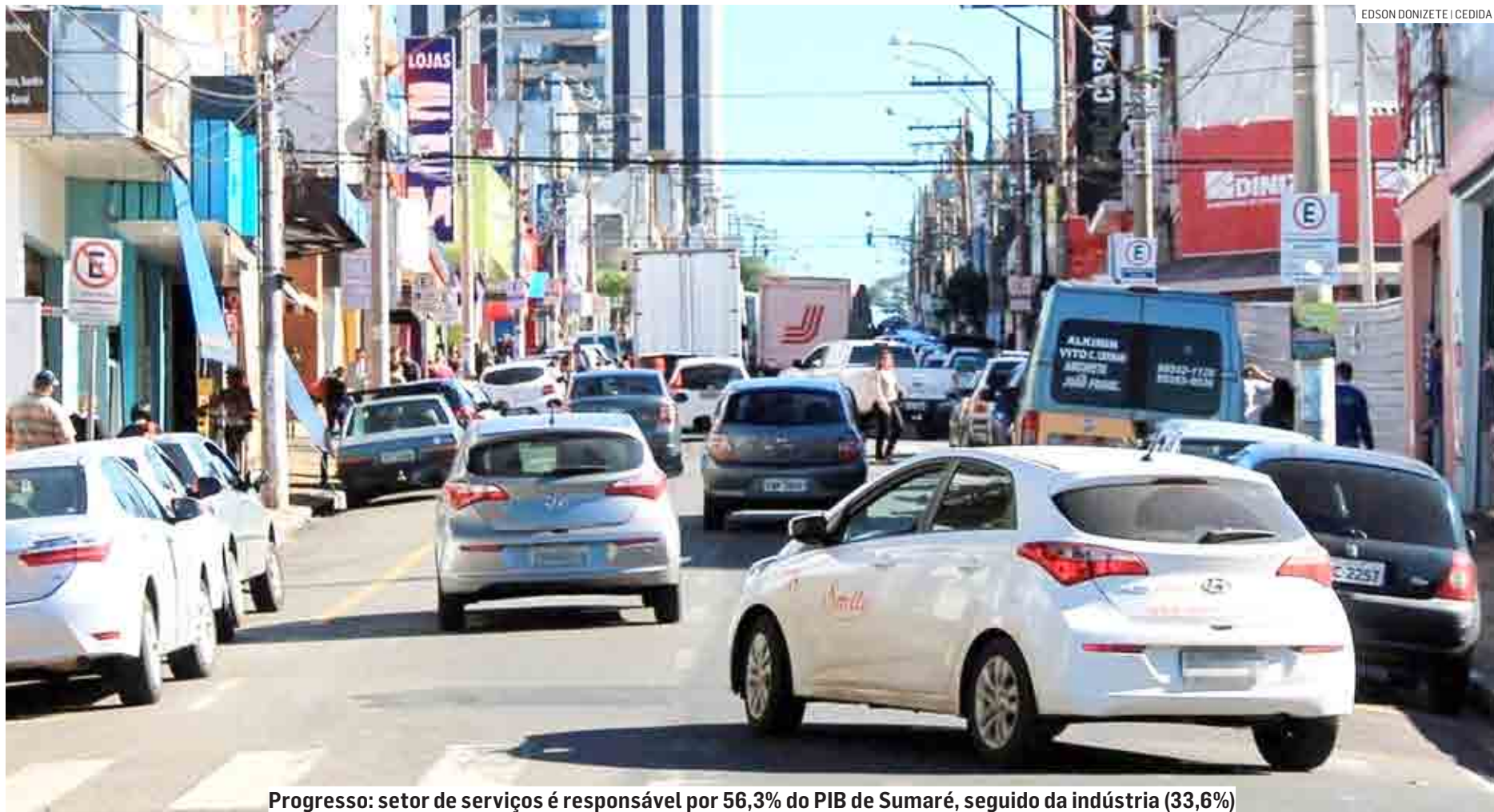
Progresso: setor de serviços é responsável por 56,3% do PIB de Sumaré, seguido da indústria (33,6%)

Para Rogério Araújo, especialista em finanças e investimentos, o aumento da produção de riqueza em Sumaré é resultado da chegada de