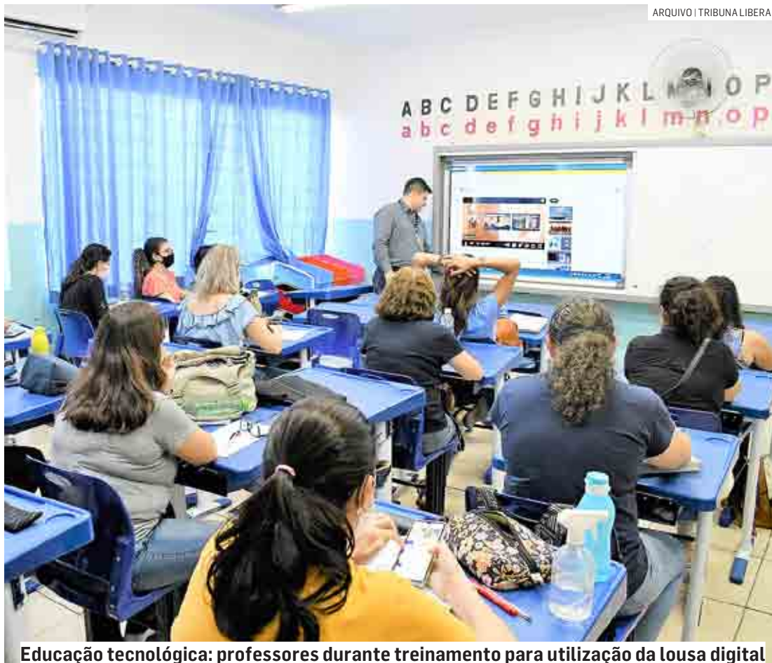
Educação tecnológica: professores durante treinamento para utilização da lousa digital

Além disso, os alunos da rede municipal já contam com aulas de robótica. Para isso, foram adquiridos kits voltados à edu-