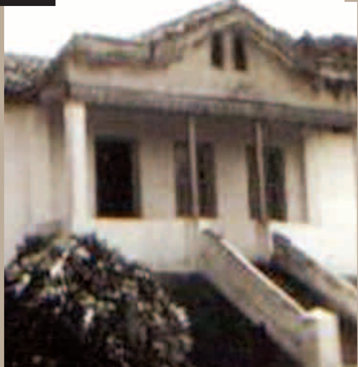
FUNDAÇÃO OFICIAL DE SUMARÉ - O CASARÃO SERTÃOZINHO É O PRÉDIO MAIS ANTIGO DA CIDADE