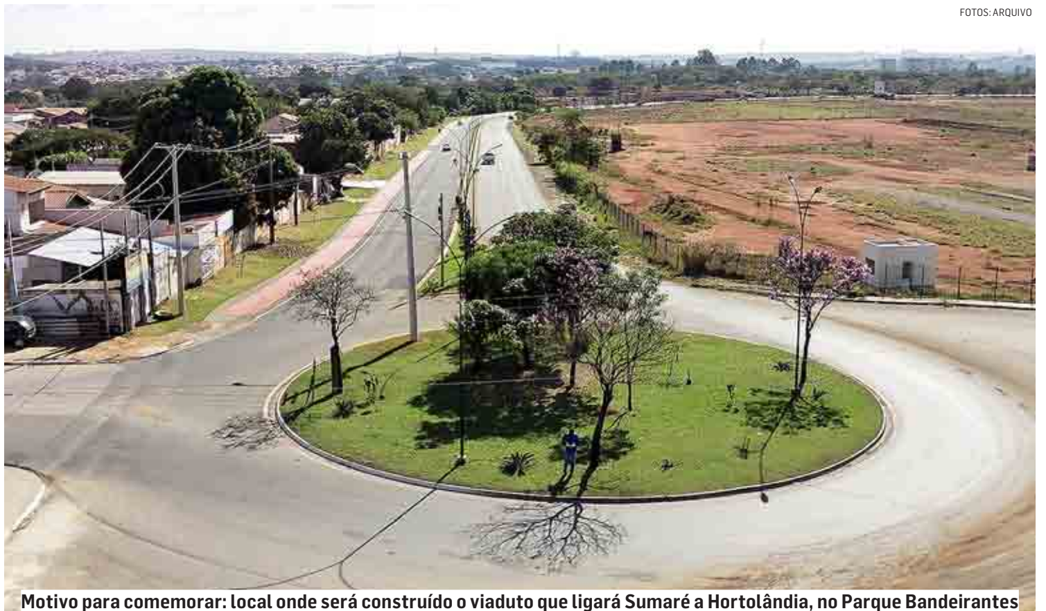
Motivo para comemorar: local onde será construído o viaduto que ligará Sumaré a Hortolândia, no Parque Bandeirantes

De acordo com o governador, no evento de lançamento da obra, a previsão é de que a construção do viaduto seja concluída até fevereiro de 2024. “A gente sabe que vai ligar o Parque Bandeirantes, de Sumaré com o Jardim Europa, ali em Hortolândia e vai mudar a realidade do trânsito da região”, disse Rodrigo.