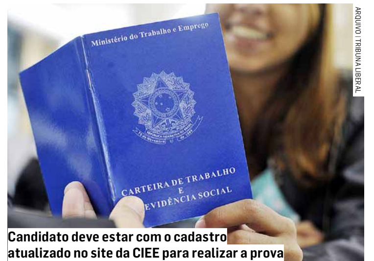
Candidato deve estar com o cadastro atualizado no site da CIEE para realizar a prova

A publicação da lista definitiva dos classificados será realizada no dia 17 de setembro. Os candidatos serão convocados de acordo com a classificação e a oferta de vagas disponíveis pela CDHU. A recomendação é que os interessados em participar do processo leiam todo o edital, disponível no Diário Oficial do Estado (DOE) de segunda-feira (22/07) ou no próprio site da CIEE.