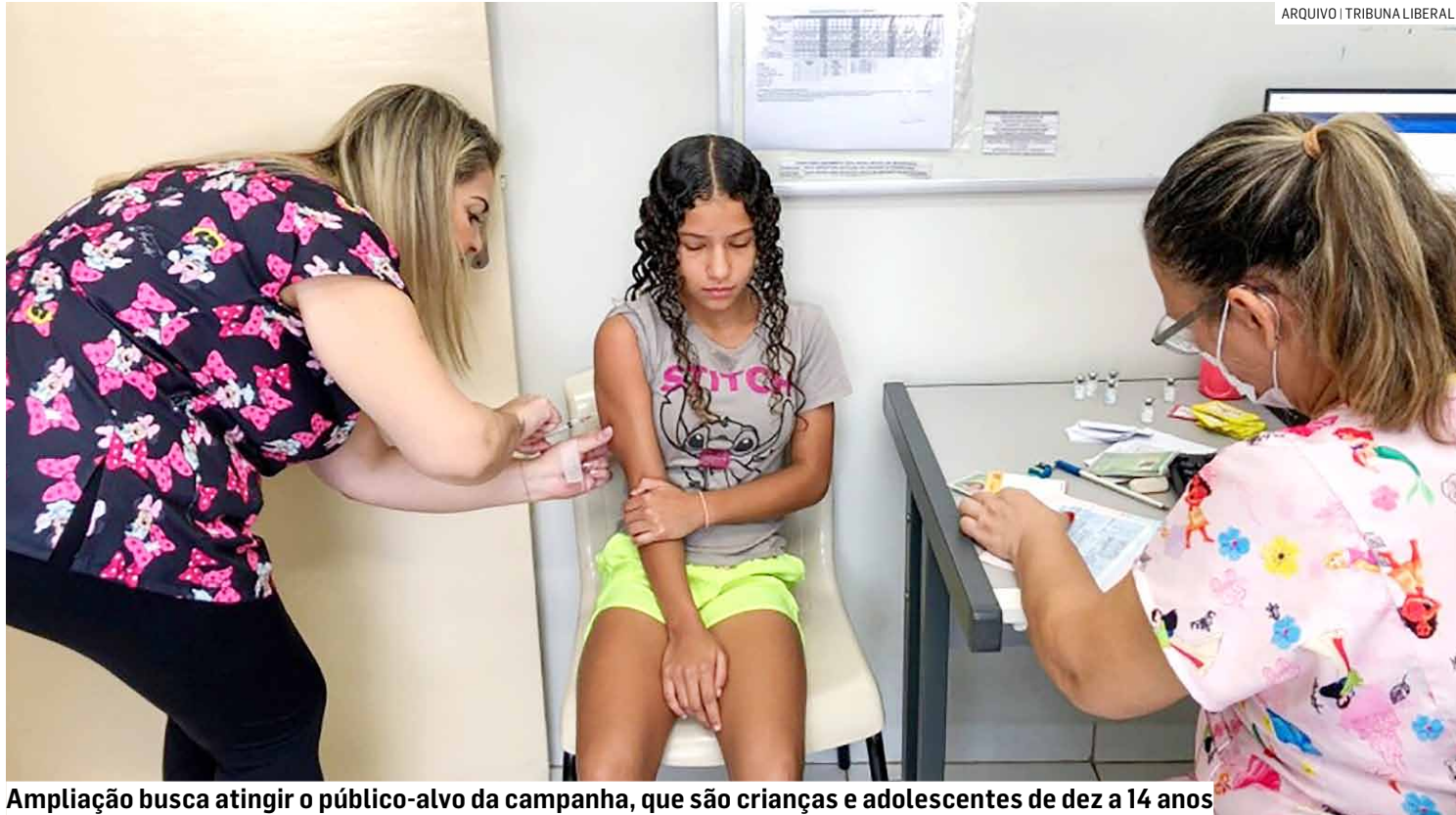
Ampliação busca atingir o público-alvo da campanha, que são crianças e adolescentes de dez a 14 anos

Com isso, o imunizante está disponível em nove unidades, das 8h às 15h30. A vacinação acontece em dias diferentes da semana nas UBSs. Para receber a vacina é necessário apresentar algum documento com foto e CPF (Cadastro de Pessoas Físicas). A meta