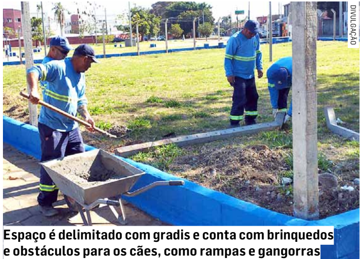
Espaço é delimitado com gradis e conta com brinquedos e obstáculos para os cães, como rampas e gangorras