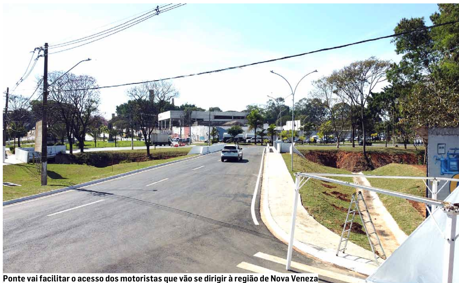
Ponte vai facilitar o acesso dos motoristas que vão se dirigir à região de Nova Veneza

Beto Silva • SUMARÉ tribunaliberal@tribunaliberal.com.br