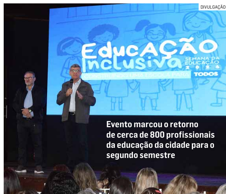
Evento marcou o retorno de cerca de 800 profissionais da educação da cidade para o segundo semestre

No primeiro dia de evento, toda a equipe participativa de palestras e vivên-