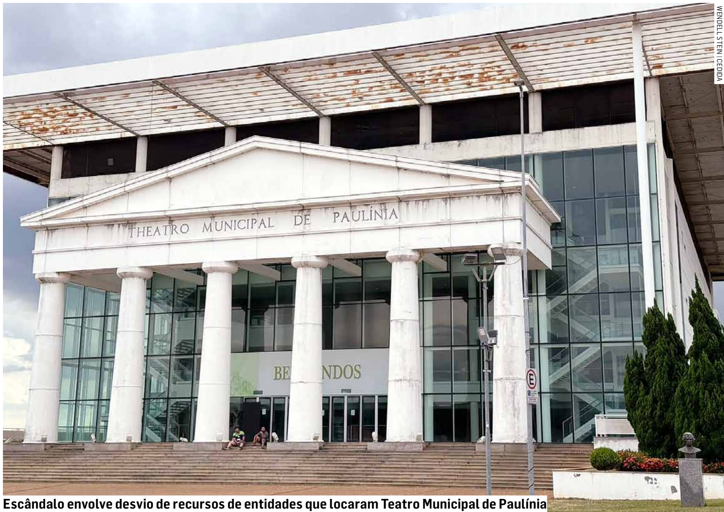
Escândalo envolve desvio de recursos de entidades que locaram Teatro Municipal de Paulínia