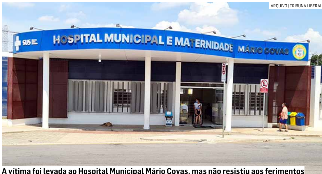
A vítima foi levada ao Hospital Municipal Mário Covas, mas não resistiu aos ferimentos

O resgate do Samu (Serviço de Atendimento Mó-