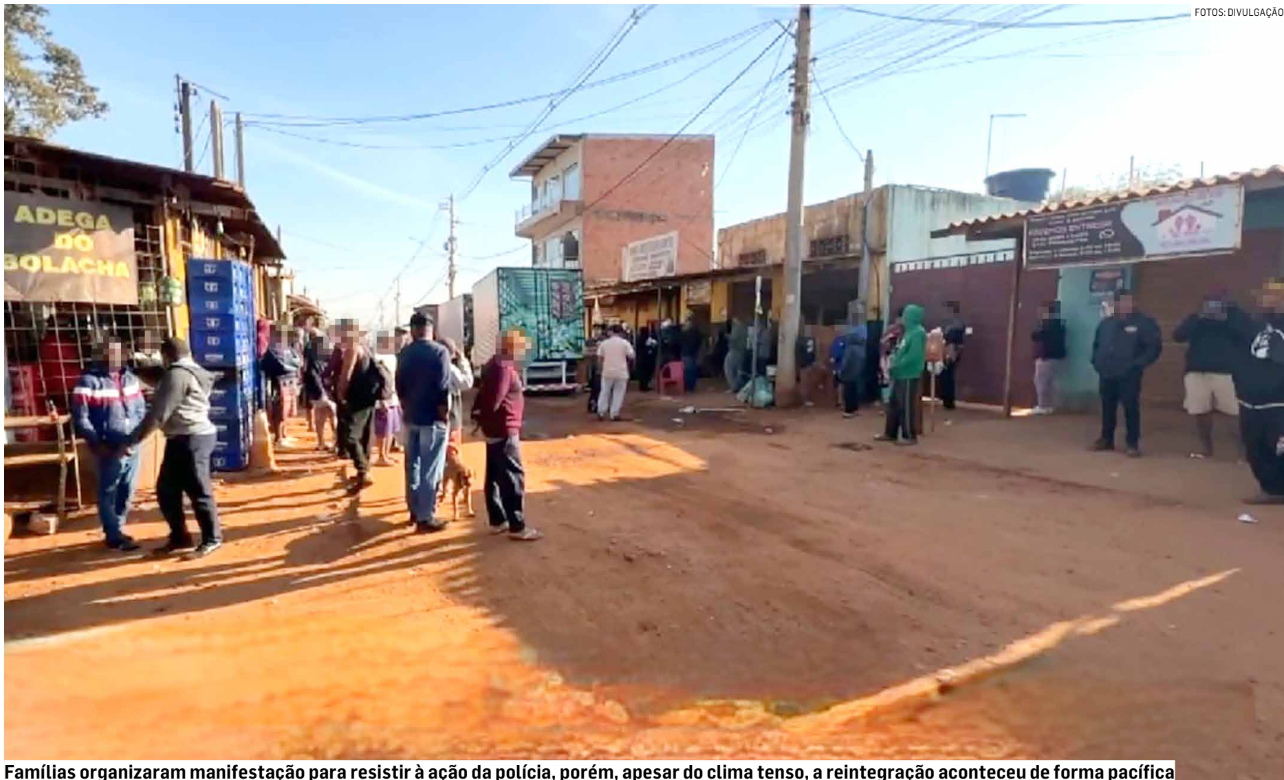
Famílias organizaram manifestação para resistir à ação da polícia, porém, apesar do clima tenso, a reintegração aconteceu de forma pacífica

“Foi assim que 17 reintegrações de posse foram derrubadas ao longo dos anos, cujo desfecho foi a permanência definitiva das famílias no local. Hoje, mais de mil famílias já resolveram sua situação”, informou a associação.