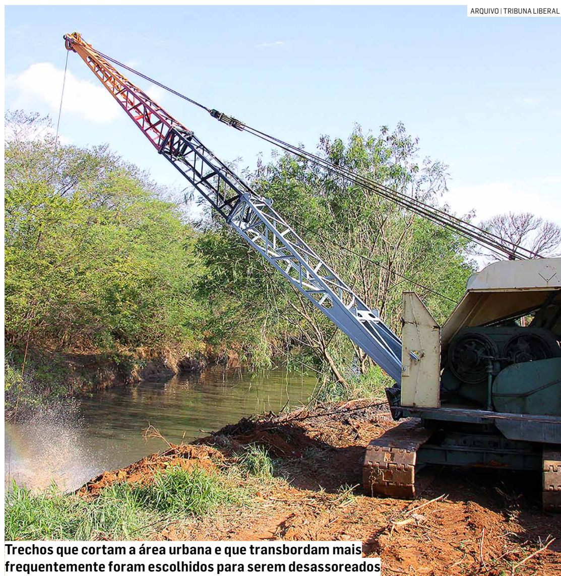
Trechos que cortam a área urbana e que transbordam mais frequentemente foram escolhidos para serem desassoreados

Com a licença prévia emitida pela Cetesb, próximo passo para começar a limpeza dos trechos mais críticos do ribeirão é a emissão da licença de instalação e operação; serviço vai ser executado através do Programa Rios Vivos, do DAEE