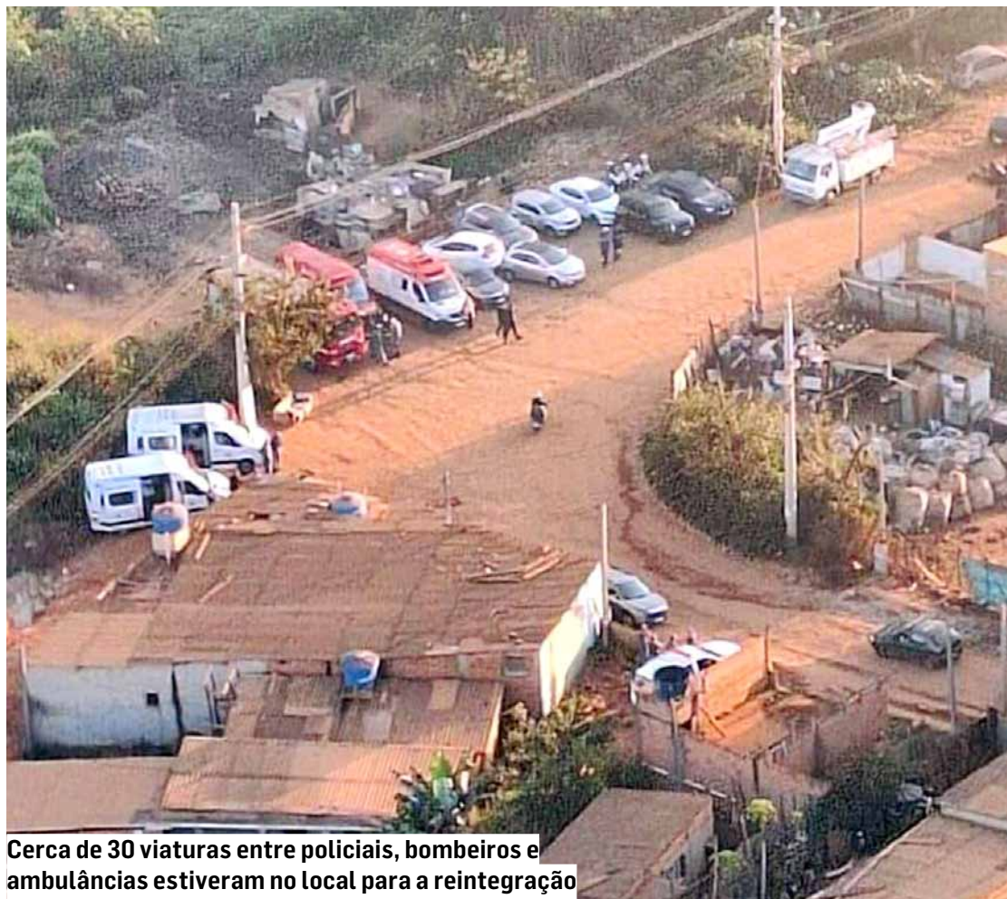
Cerca de 30 viaturas entre policiais, bombeiros e ambulâncias estiveram no local para a reintegração

“Foram, na data de hoje, reintegrados cinco lotes, que estavam em posse de famílias que não quiseram assinar contrato de compra dos lotes junto à empresa detentora dos direitos da área”, informou a administração acrescentando que, mesmo não fazendo parte do processo, prestará auxílio às famílias que necessitarem, por intermédio da Secretaria de Habitação.