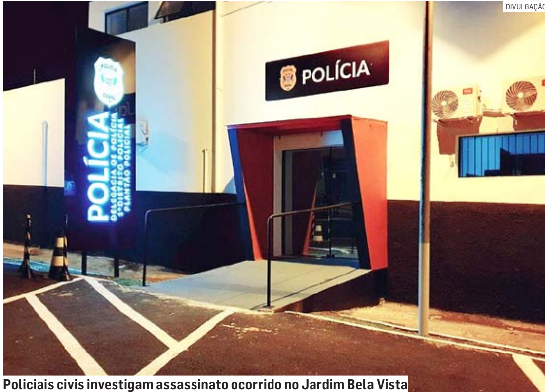
Policiais civis investigam assassinato ocorrido no Jardim Bela Vista

A equipe do Corpo de Bombeiros foi a primeira a chegar ao local e tentou manobras de reanimação cardiopulmonar. No entanto, o adolescente não resistiu aos ferimentos e morreu no local.