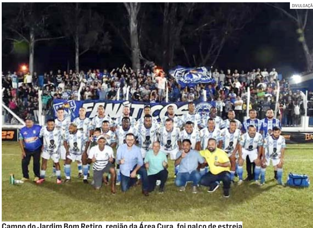
Campo do Jardim Bom Retiro, região da Área Cura, foi palco de estreia

Na ocasião, também foi entregue a revitalização do campo, que recebeu uma nova iluminação e o