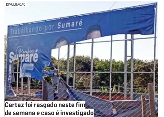
Cartaz foi rasgado neste fim de semana e caso é investigado