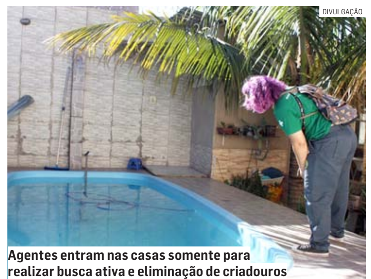
Agentes entram nas casas somente para realizar busca ativa e eliminação de criadouros

De acordo com a Secretaria de Saúde, os principais sintomas da dengue são dores no corpo, de cabeça e na parte atrás dos olhos, febre, manchas e/ou pontos vermelhos no corpo, náusea e vômito. Já o sintoma principal de chikungunya são dores nas articulações que persistem durante dias. Os sintomas da zika são febre, mas não tão elevada, vermelhidão no corpo e nos olhos, neste último sem formação de pus.