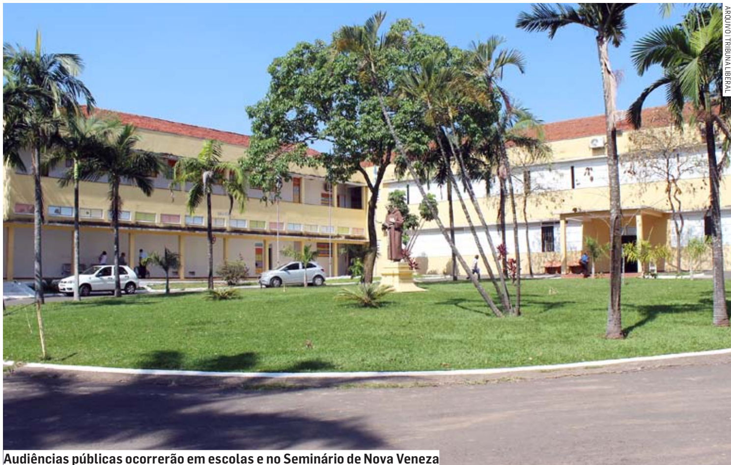
Audiências públicas ocorrerão em escolas e no Seminário de Nova Veneza

Os interessados em participar devem registrar presença preenchendo o formulário próprio disponibilizado na entrada da sala onde ocorrerá a au-