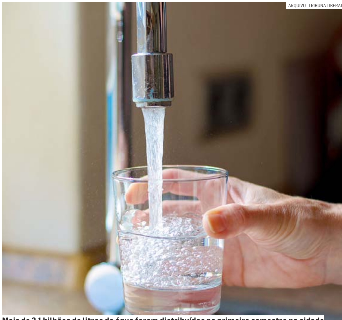
Mais de 2,1 bilhões de litros de água foram distribuídos no primeiro semestre na cidade

duzimos nossos processos de certificação da qualidade de visa sempre a excelência do produto final entregue à população. Assegu-