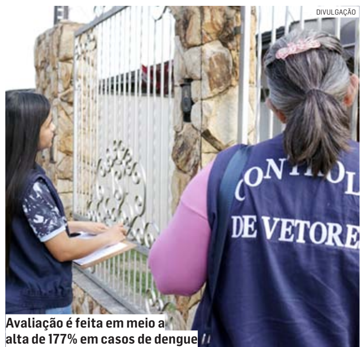
Avaliação é feita em meio a alta de 177% em casos de dengue

Paulo Medina • MONTE MOR paulo.medina@tribunaliberal.com.br