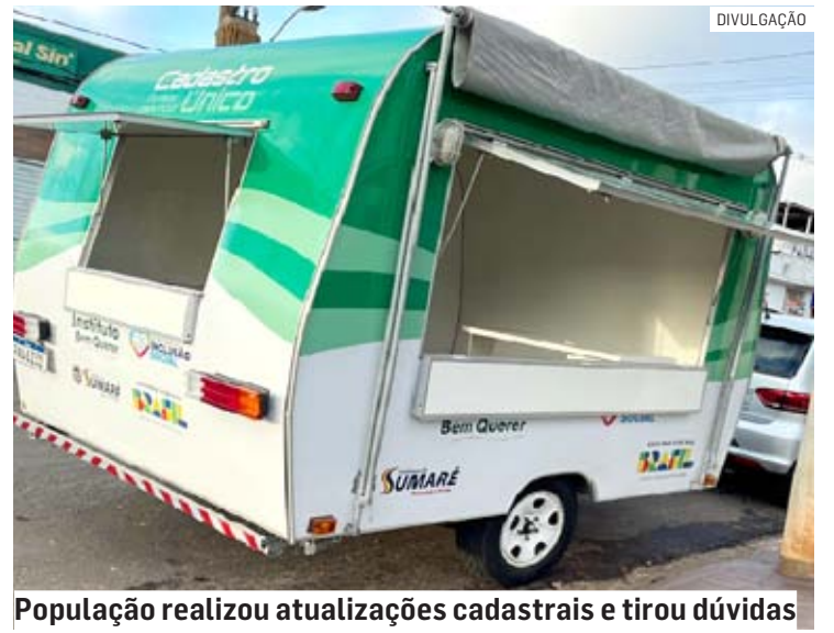
População realizou atualizações cadastrais e tirou dúvidas

Com a nova sede, a inserção de novas informações ou atualização dos cadastros de famílias já inseridas no sistema de assistência social do município foram otimizados. Os formulários físicos, por exemplo, foram substituídos pelo preenchimento informatizado e digitalização de documentos direto no sistema do CadÚnico.