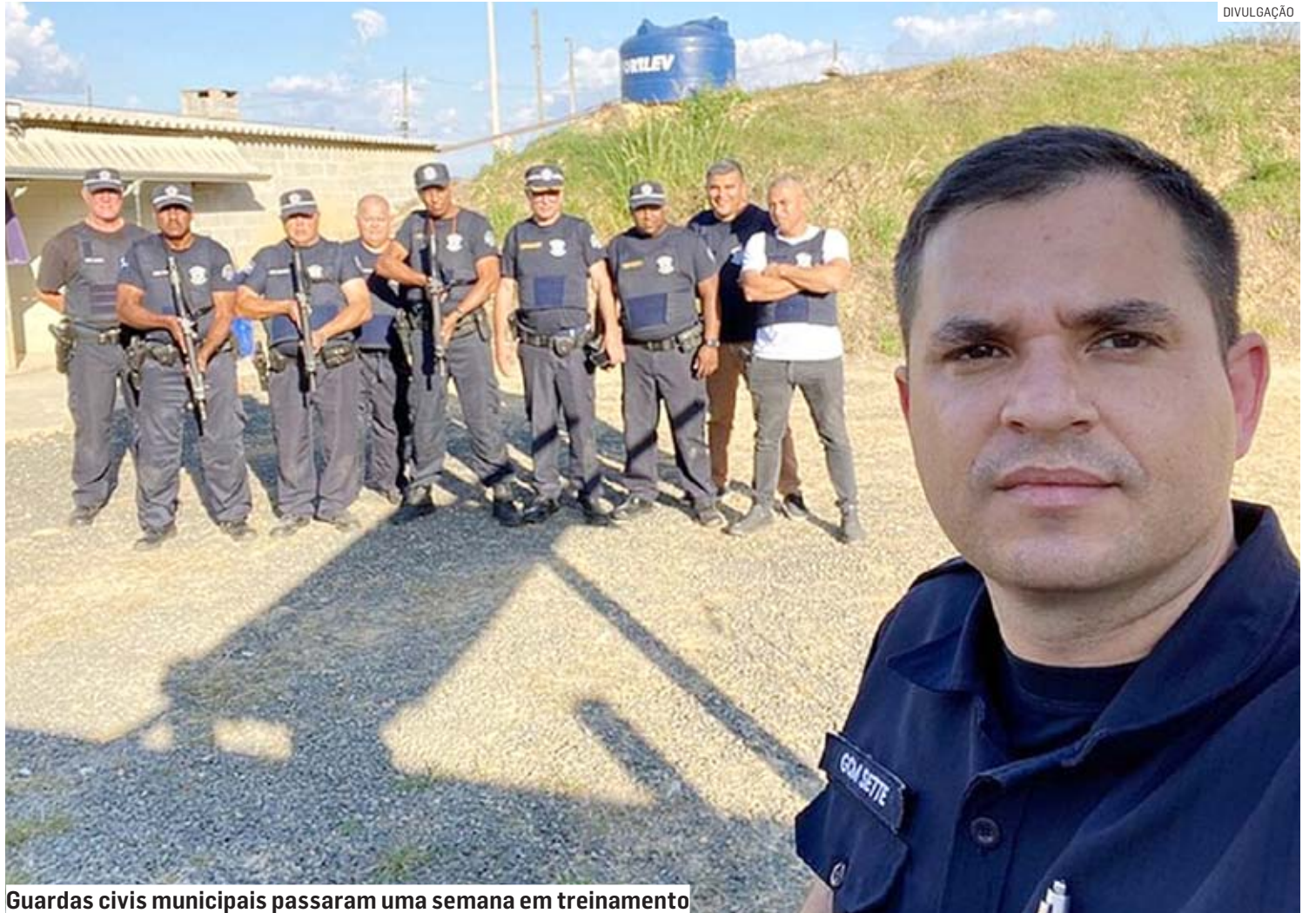
Guardas civis municipais passaram uma semana em treinamento

No dia 11 de julho, o prefeito Luiz Dalben (Cidadania) anunciou a conquista de 50 pistolas e duas carabinas para a Guarda Civil Municipal. O anúncio foi feito pelo secretário estadual de Segurança Pública, Guilherme Derrite, durante solenidade de entrega da Estação do Corpo de Bom-