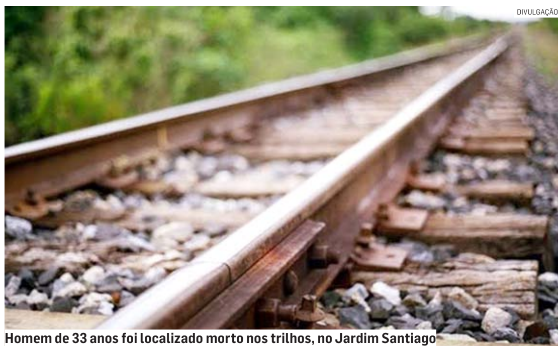
Homem de 33 anos foi localizado morto nos trilhos, no Jardim Santiago