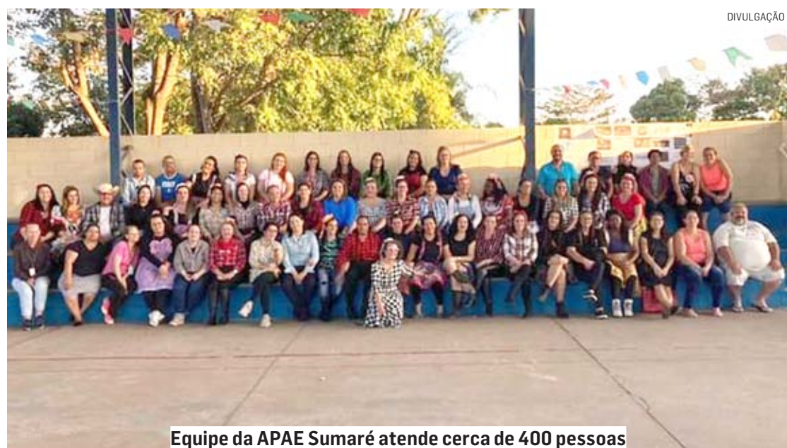
Equipe da APAE Sumaré atende cerca de 400 pessoas

A APAE de Sumaré tem como pilar central a inclusão da pessoa com deficiência na sociedade, buscando garantir seus direitos e promover sua participação ativa na comuni-