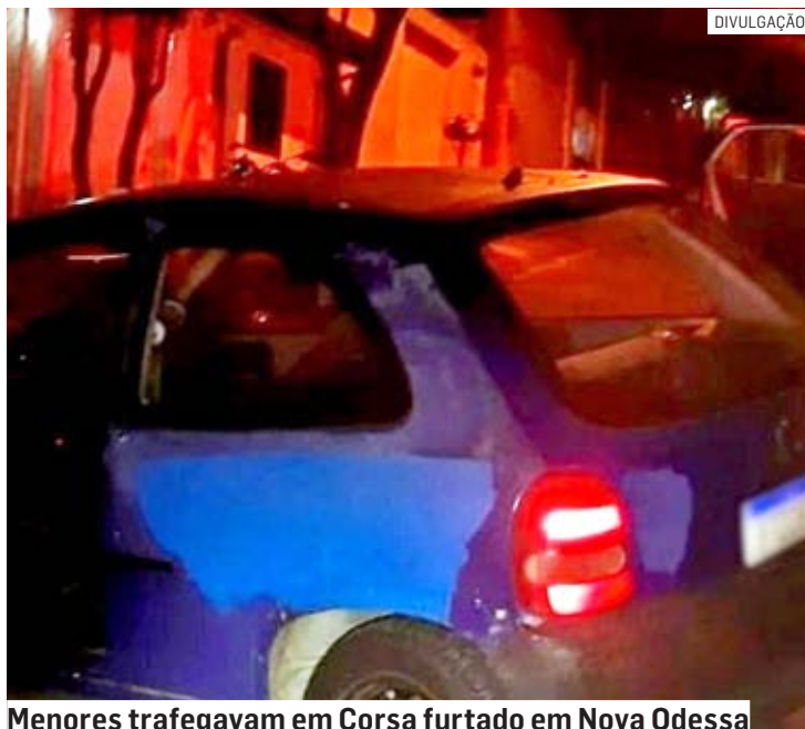
Menores trafegavam em Corsa furtado em Nova Odessa

De acordo com informações da corporação, por volta das 22h, criminosos furtaram um Chevrolet Corsa, no Jardim Éden. Cerca de uma hora depois,