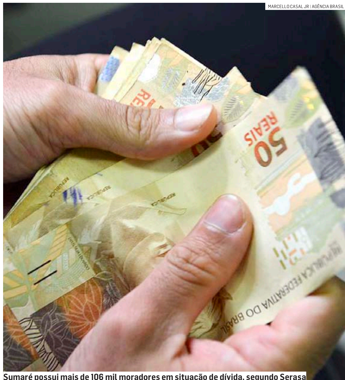
Sumaré possui mais de 106 mil moradores em situação de dívida, segundo Serasa

A Faixa 2 do programa atende à população com renda mensal de dois salários mínimos (R$2.640) a R$ 20 mil. O governo destacou que a medida vai beneficiar 70 milhões de brasileiros que possuem dívidas. As dívidas poderão ser quitadas nos canais indicados pelos agentes financeiros e poderão ser parceladas em, no mínimo, 12 prestações. Também é necessário ter sido incluído no cadastro de inadimplente até 31 de dezembro de 2022. Nesta etapa do programa, também serão perdoadas as dívidas bancárias de até R$ 100. Nesse caso, o nome da pessoa será retirado dos cadastros de devedores automaticamente pelas instituições financeiras. Segun-