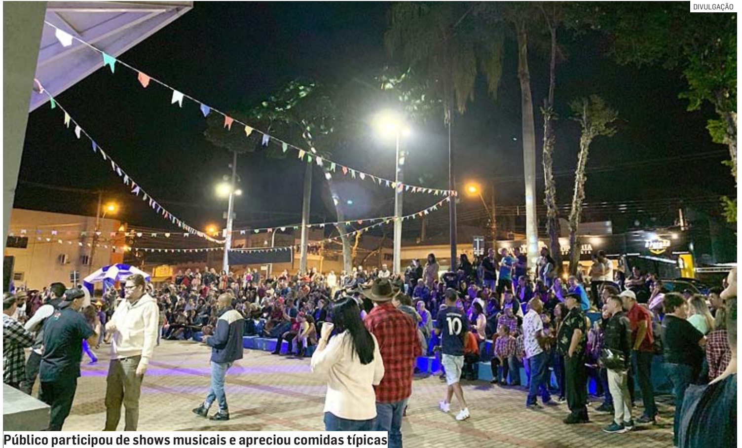
Público participou de shows musicais e apreciou comidas típicas

“A praça de alimentação foi realizada pelas paróquias. Como foi a primeira edição deste evento, elas não tinham a exata dimensão do público que poderia comparecer. Mas o fato de ter acabado tudo que as paróquias trouxeram é