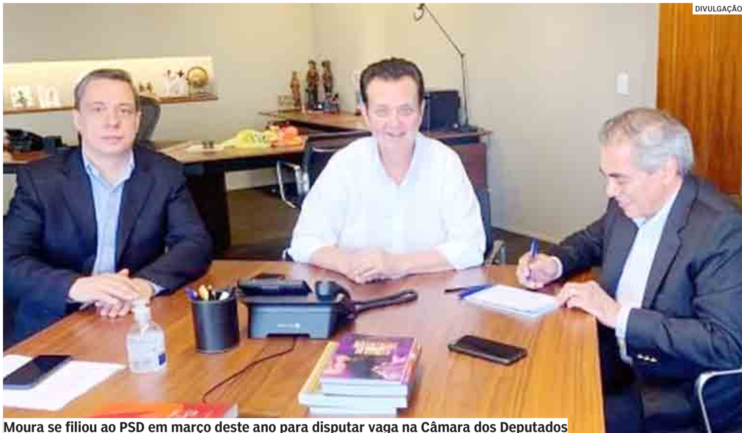
Moura se filiou ao PSD em março deste ano para disputar vaga na Câmara dos Deputados

Em março deste ano, Moura se filiou ao PSD. O anúncio foi feito por ele em seu perfil em uma rede social. “Olá, amigos e amigas. Desejo encontrá-los felizes e com muita saúde. Gostaria de compartilhar com vocês que