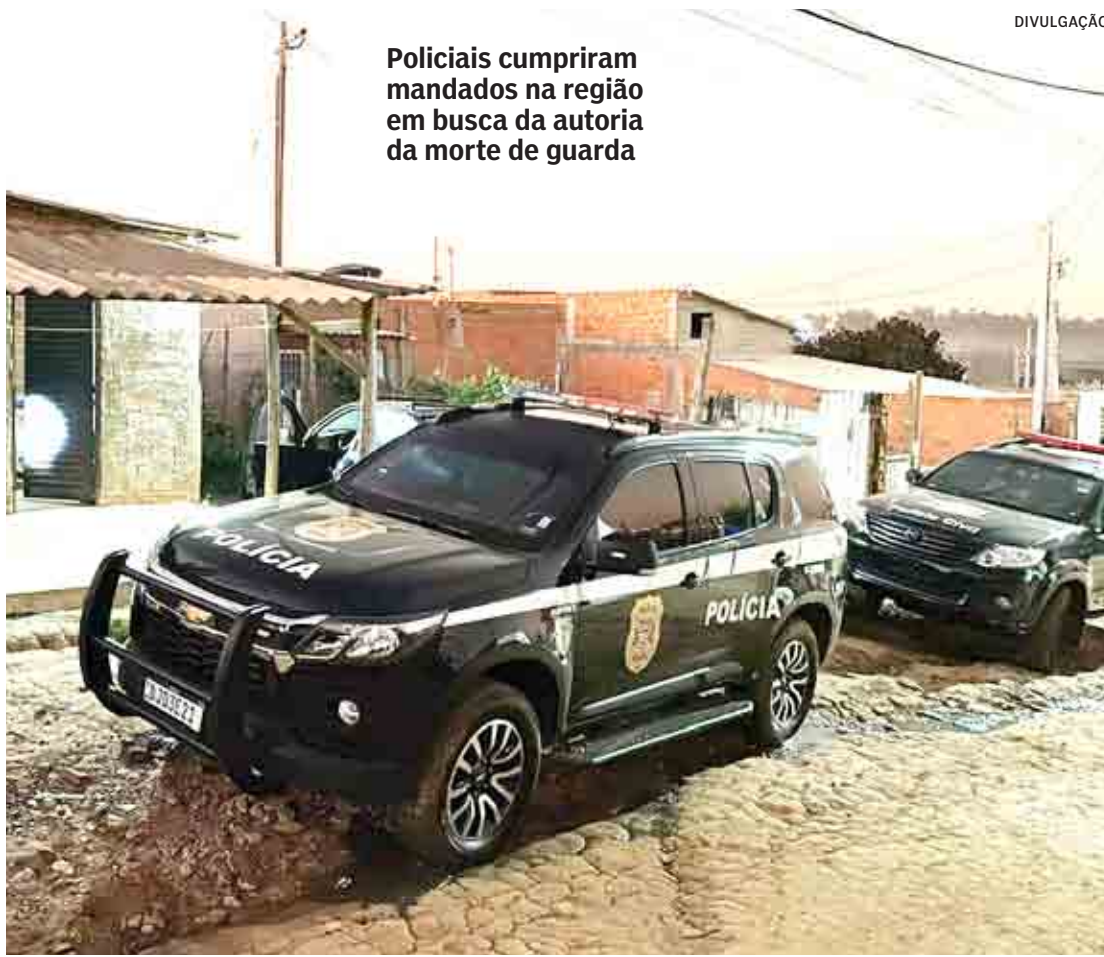
Policiais cumpriram mandados na região em busca da autoria da morte de guarda