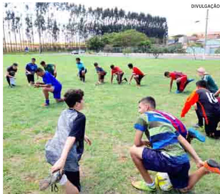
Treinamento será realizado no campo do Orestes Ôngaro

Durante os treinamentos, os voluntários do Águia ensinam sobre as técnicas e táticas do futebol, condicionamento físico, além de ensinar aos jovens sobre disciplina, educação e socialização. O Projeto Águia não é só futebol, é muito mais. É se envolver na realidade de cada jovem e oferecer