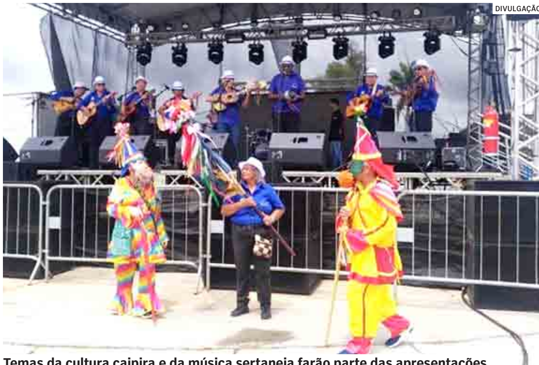
Temas da cultura caipira e da música sertaneja farão parte das apresentações

Depois, às 9h, quem gosta dos modões e clássicos sertanejos irá se deleitar com a apresentação da Orquestra de