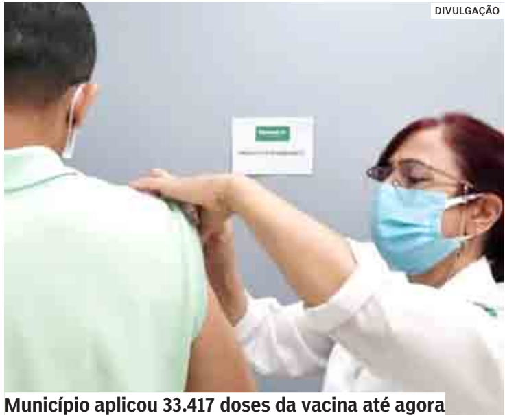
Município aplicou 33.417 doses da vacina até agora

Da Redação | SUMARÉ tribunaliberal@tribunaliberal.com.br