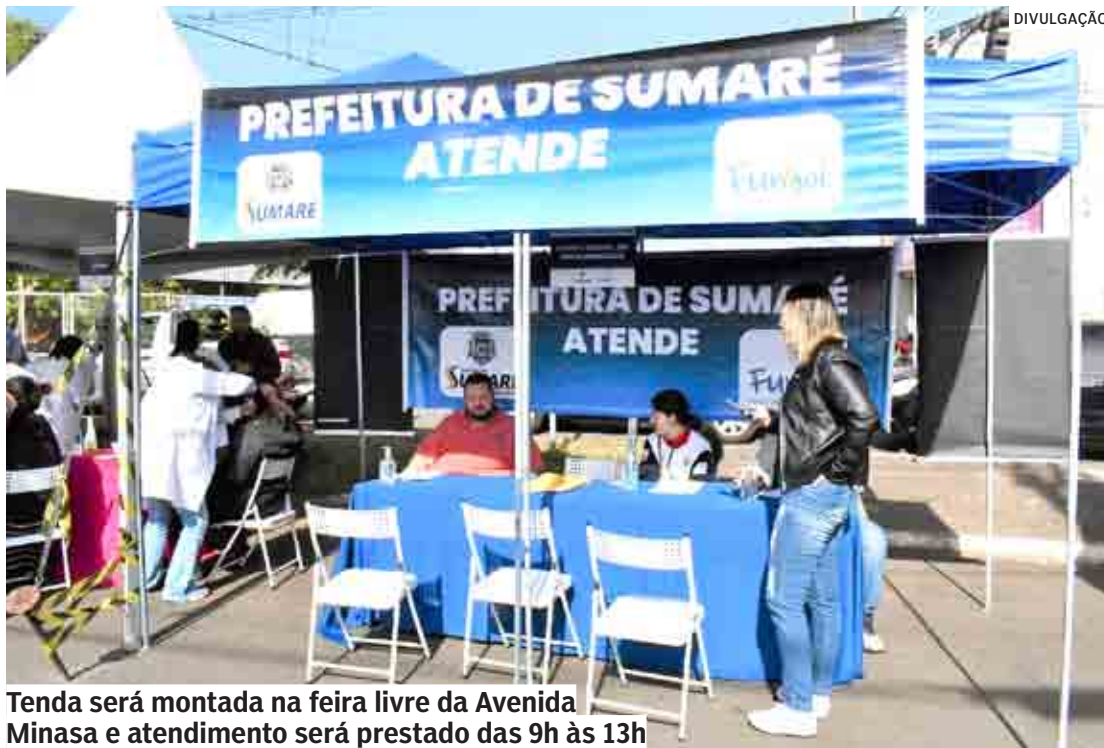
Tenda será montada na feira livre da Avenida Minasa e atendimento será prestado das 9h às 13h

O projeto faz parte do formato participativo da atual administração, que visa se aproximar cada vez mais da população e dar voz aos moradores. “O projeto é uma parceria de todas as nossas secretarias e Fundo Social, que busca a humanização do atendimento. Queremos aproximar a população dos nossos serviços e ouvir nossos moradores, conhecer suas demandas. Queremos dar voz aos munícipes e continuar construindo em conjunto uma cidade digna e em constante desenvolvimento”, comentou a presidente do Fun-