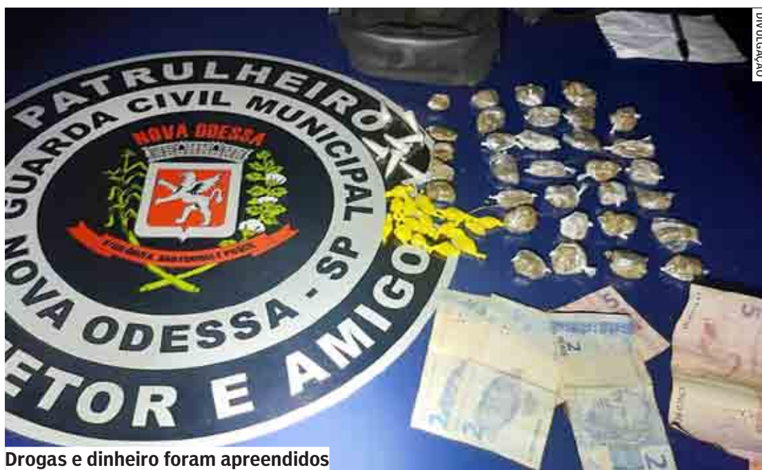
Drogas e dinheiro foram apreendidos

Então, os guardas fizeram o caminho pelo interior da mata e localizaram maconha, cocaína e crack. Com apoio