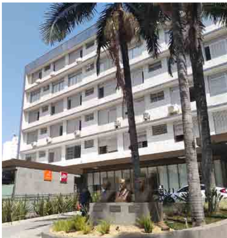
Fachada atual e antiga da Maternidade de Campinas, que fazem parte do acervo da exposição: 109 anos de história

A exposição de fotos traz imagens da construção do hospital, na esqui-