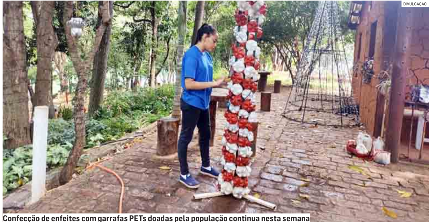
Confecção de enfeites com garrafas PETs doadas pela população continua nesta semana

A Prefeitura disponibiliza sete pontos de coleta na cidade (confira abaixo quais são os locais). A Secretaria de Meio Ambiente e Desenvolvimento Sustentável solicita para que as pessoas levem o material já higienizado e, preferencialmente, garrafas de 1,5 litros e/ou de 2 litros. Com a campanha de doação de garrafas PET, a Prefeitura de Hortolândia estimula a popu-