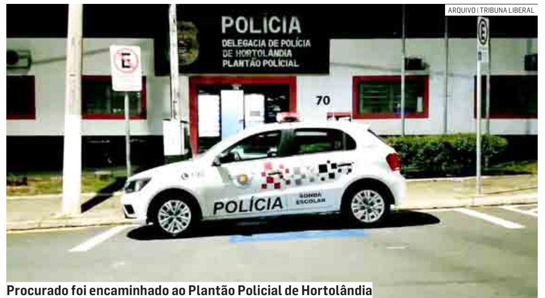
Procurado foi encaminhado ao Plantão Policial de Hortolândia

como vistoria veicular, nada de ilícito foi encontrado, porém ao pesquisar os dados do condutor foi constatado que havia um mandado de prisão contra ele. O veículo foi recolhido por meios administrativos e o indivíduo encaminhado ao Plantão Policial, onde permaneceu à disposição da Justiça.