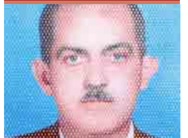
Sumaré – parcela viva e progressista do município de Campinas PG. 09

◆ SUMARÉ (CENTRO) | NOVA VENEZA | PICERNO | MARIA ANTONIA | ÁREA CURA | MATÃO ◆ HORTOLÂNDIA ◆ NOVA ODESSA ◆ MONTE MOR ◆ ELIAS FAUSTO ◆ PAULÍNIA ◆