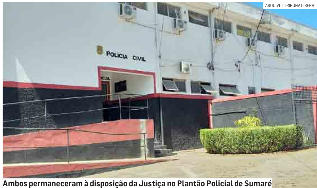
Ambos permaneceram à disposição da Justiça no Plantão Policial de Sumaré

Cézar Oliveira | SUMARÉ tribunaliberal@tribunaliberal.com.br