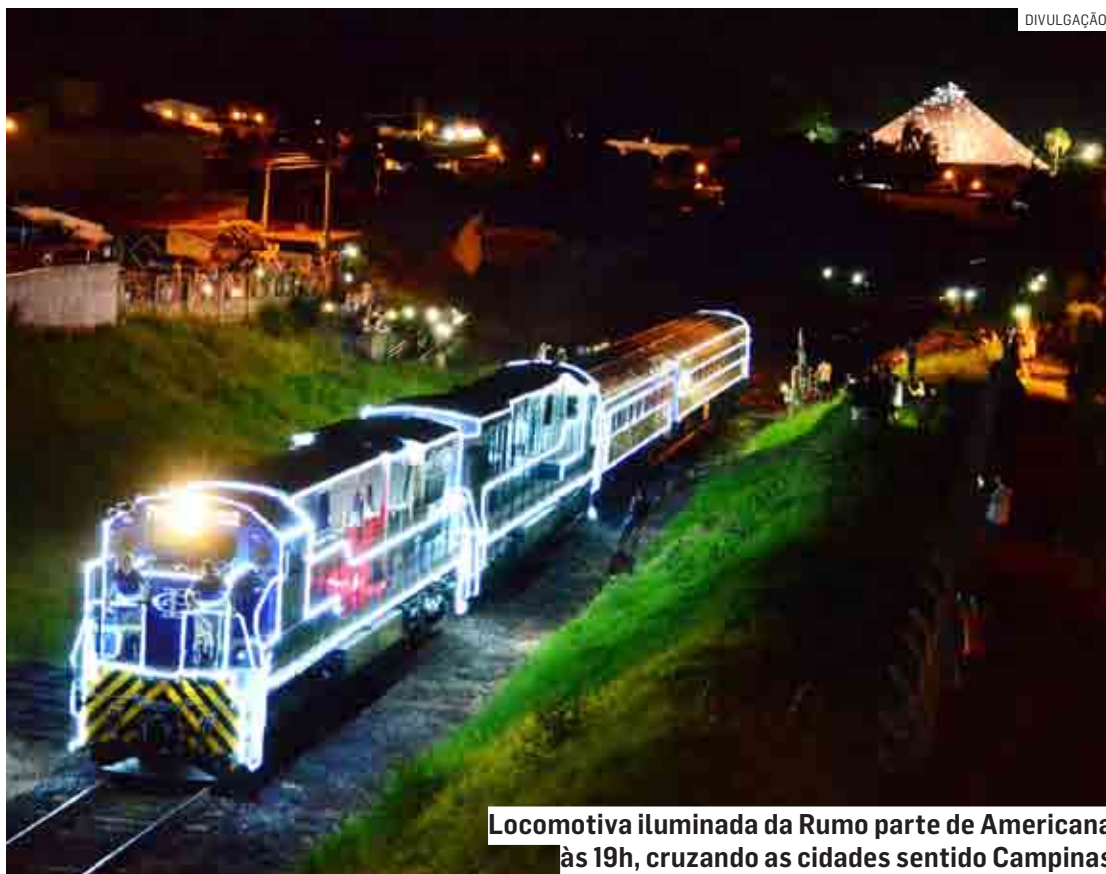
Locomotiva iluminada da Rumo parte de Americana às 19h, cruzando as cidades sentido Campinas

De acordo com o Centro de Memória, a partida do trem está programada para as 19h, de Americana. O horário previsto da passagem da composição no centro é às 20h. O centro estará aberto a partir das 18h30