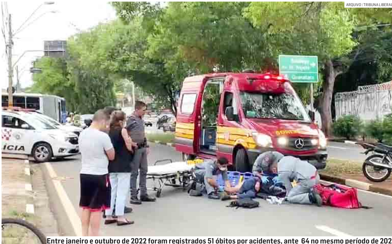
Entre janeiro e outubro de 2022 foram registrados 51 óbitos por acidentes, ante 64 no mesmo período de 2021

De acordo com os números disponibilizados pelo Detran-SP (Departamento de Trânsito de São Paulo), nos dez primeiros meses deste ano, houve 51 óbitos por acidentes de trânsito nas cidades de Hortolândia, Nova Odessa, Paulínia, Monte Mor e Sumaré. Em 2021, no mesmo período, foram registrados 64 nas cinco cidades. O número de acidentes com vítima de janeiro a outubro de 2022 nos cinco municípios foi de 1.738, ante