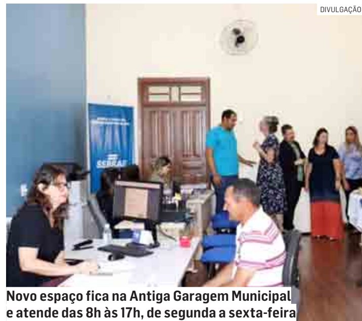
Novo espaço fica na Antiga Garagem Municipal e atende das 8h às 17h, de segunda a sexta-feira