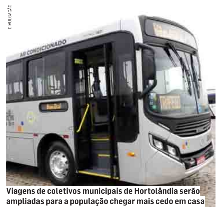
Viagens de coletivos municipais de Hortolândia serão ampliadas para a população chegar mais cedo em casa

Na segunda-feira (28), o jogo acontece às 13h. A programação segue com os horários normais mas o monitoramento da demanda será realizado com eventuais ajustes, se necessário. O objetivo da ação é contribuir com maior agilidade na viagem da população para acompanhar os jogos do Brasil com familiares e amigos, já que nos dias das partidas, expedientes de comércios, órgão públicos e empresas da cidade serão encerrados mais cedo. A cidade contabiliza 22 linhas de ônibus.