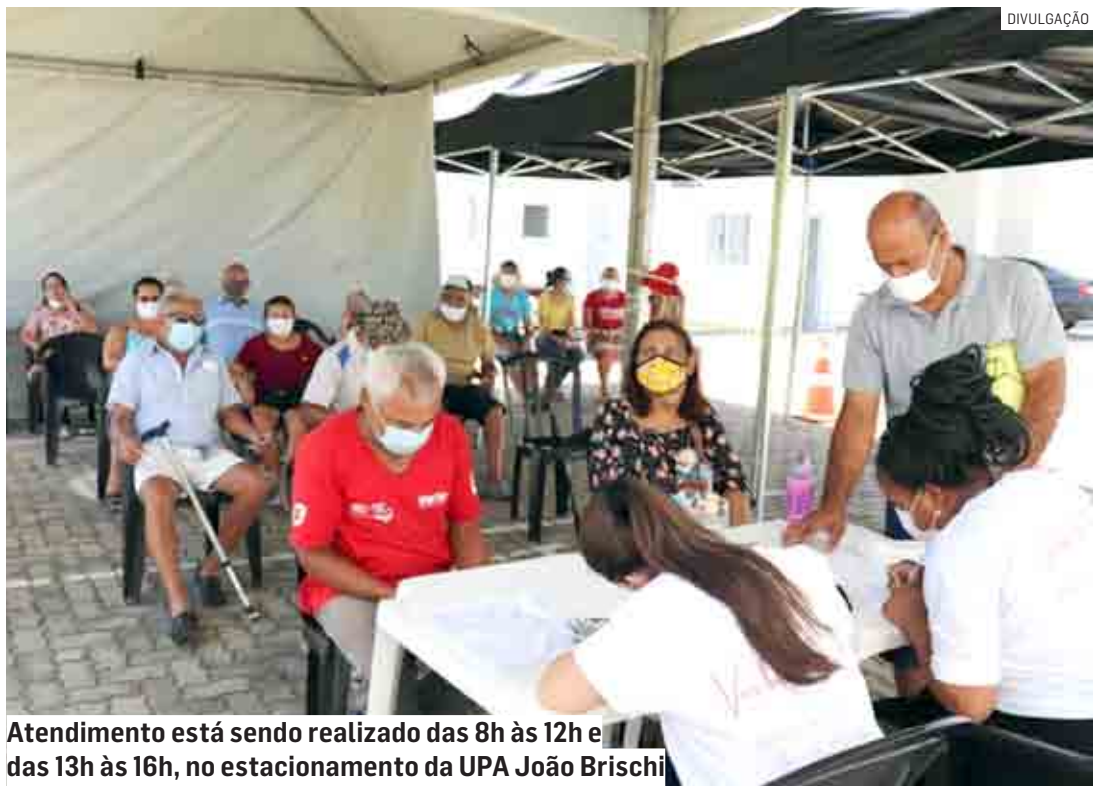
Atendimento está sendo realizado das 8h às 12h e das 13h às 16h, no estacionamento da UPA João Brischi

Da Redação | MONTE MOR tribunaliberal@tribunaliberal.com.br