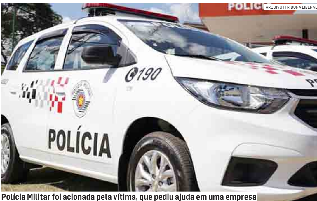
Polícia Militar foi acionada pela vítima, que pediu ajuda em uma empresa

culo e correu até uma empresa próxima para pedir ajuda. A Polícia Militar foi acionada e orientou a jovem fazer um boletim de ocorrência. O caso foi registrado no Plantão Policial de Sumaré e o caso deve ser encaminhado à DDM (Delegacia de Defesa da Mulher).