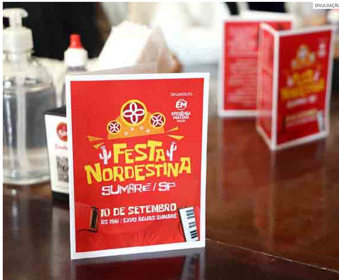
Festa, que já está na 10ª edição, tem o objetivo de promover e divulgar a cultura nordestina

Nascida em Assaré (CE) e radicada em Sumaré há quase 40 anos, Efigênia ressalta que a festa também é uma forma de preservar a memória de seu conterrâneo Patativa do Assaré (1909-2002) co-