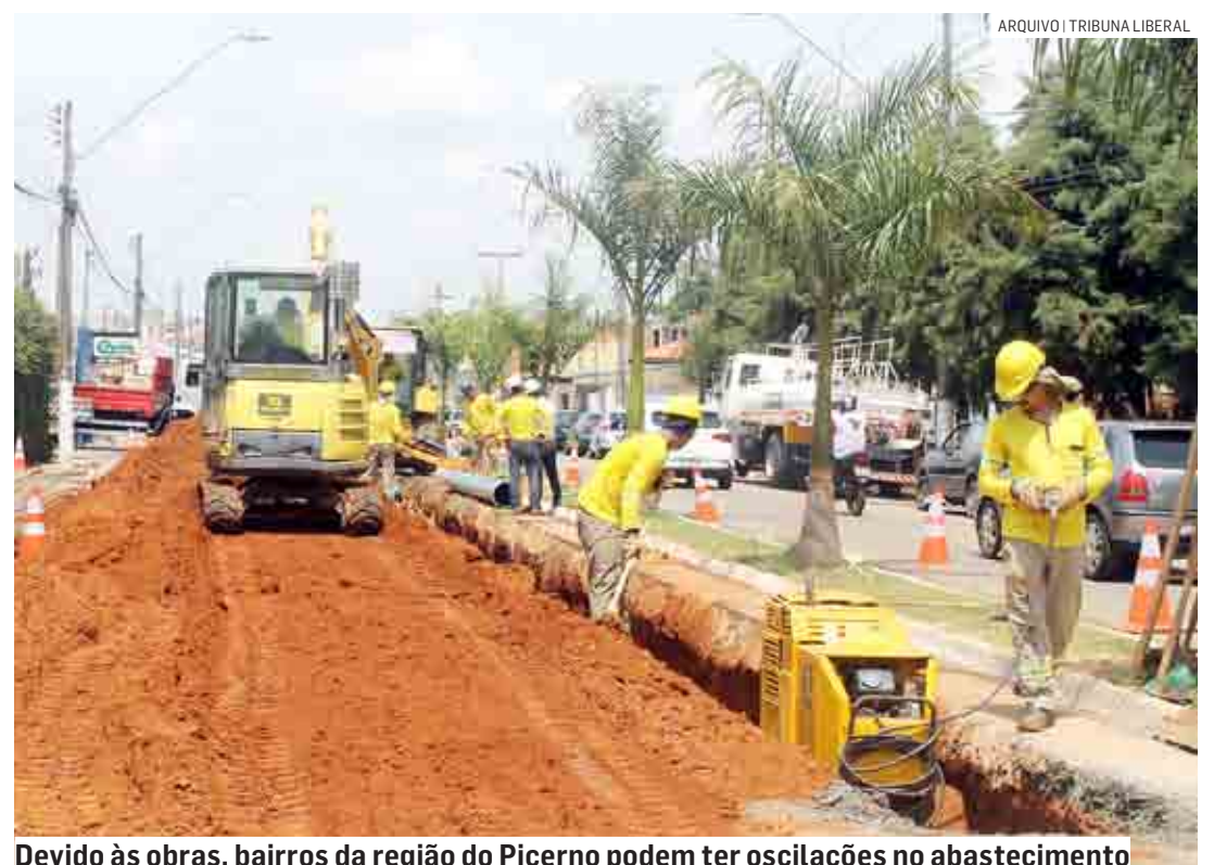
Devido às obras, bairros da região do Picerno podem ter oscilações no abastecimento

Em caso de dúvidas, os clientes podem entrar em contato pelo telefone 0800 771 0001. O atendimento é gratuito e funciona 24h por dia.