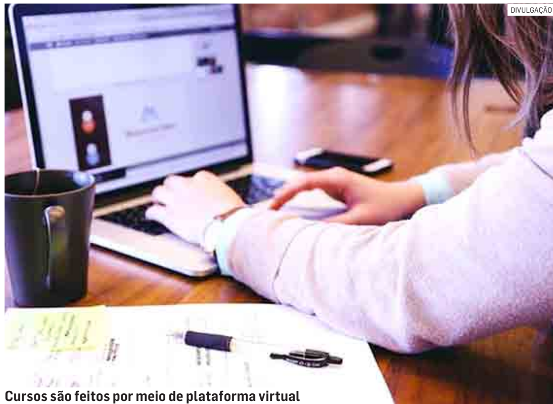
Cursos são feitos por meio de plataforma virtual

Da Redação | SUMARÉ tribunaliberal@tribunaliberal.com.br