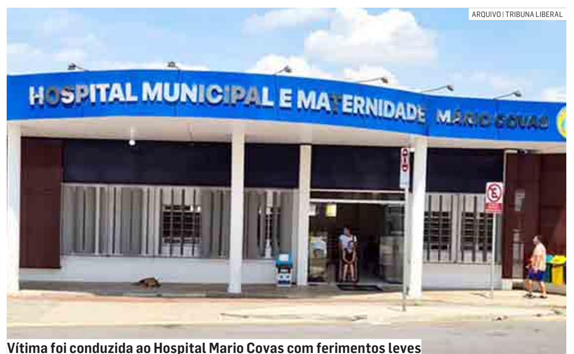
Vítima foi conduzida ao Hospital Mario Covas com ferimentos leves

Cézar Oliveira | HORTOLÂNDIA tribunaliberal@tribunaliberal.com.br