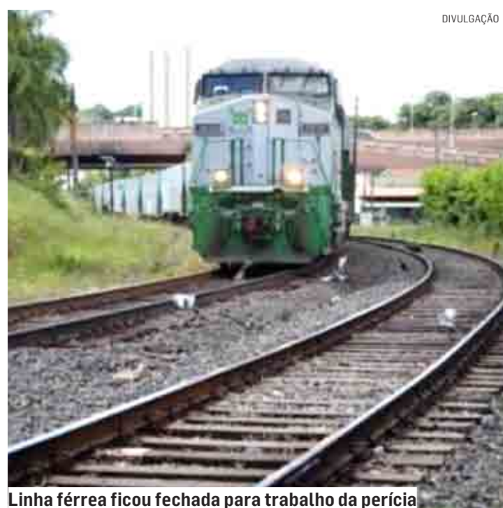
Linha férrea ficou fechada para trabalho da perícia