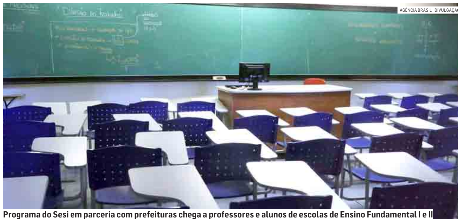
Programa do Sesi em parceria com prefeituras chega a professores e alunos de escolas de Ensino Fundamental I e II

ram ao programa. Também fecharam parceria com o Sesi-SP as prefeituras de Paulínia e Cosmópolis. Juntos, os seis municípios somam mais de 59 mil alunos potencialmente beneficiados. São cerca de 150 escolas de Ensino Fundamental I e II e mais de 450 professores.