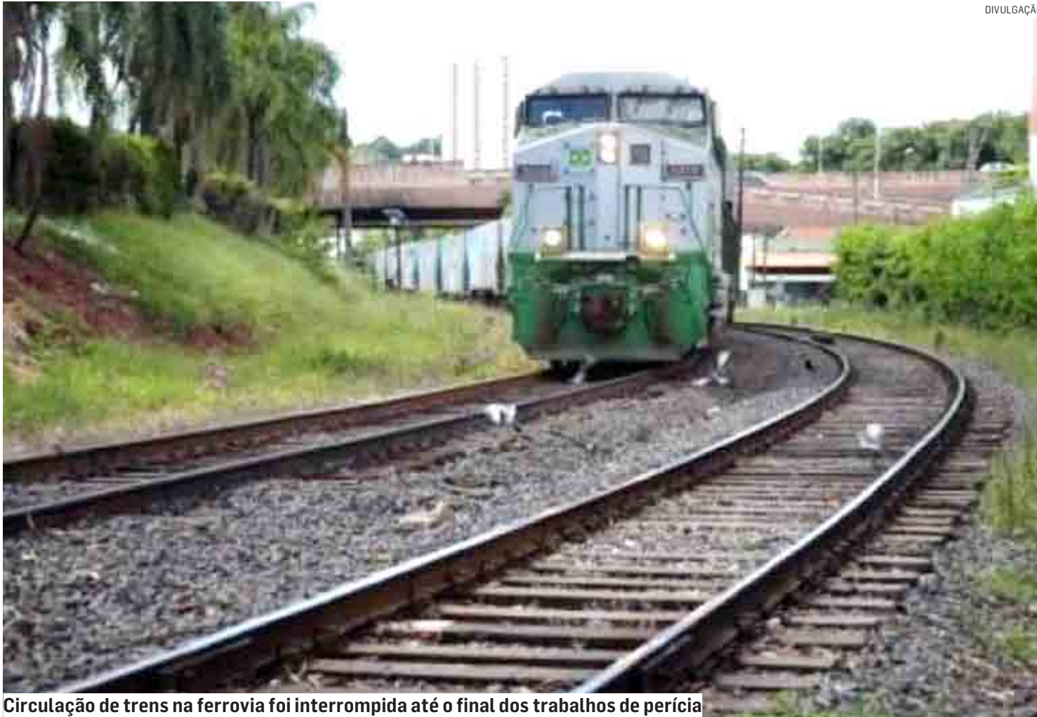
Circulação de trens na ferrovia foi interrompida até o final dos trabalhos de perícia