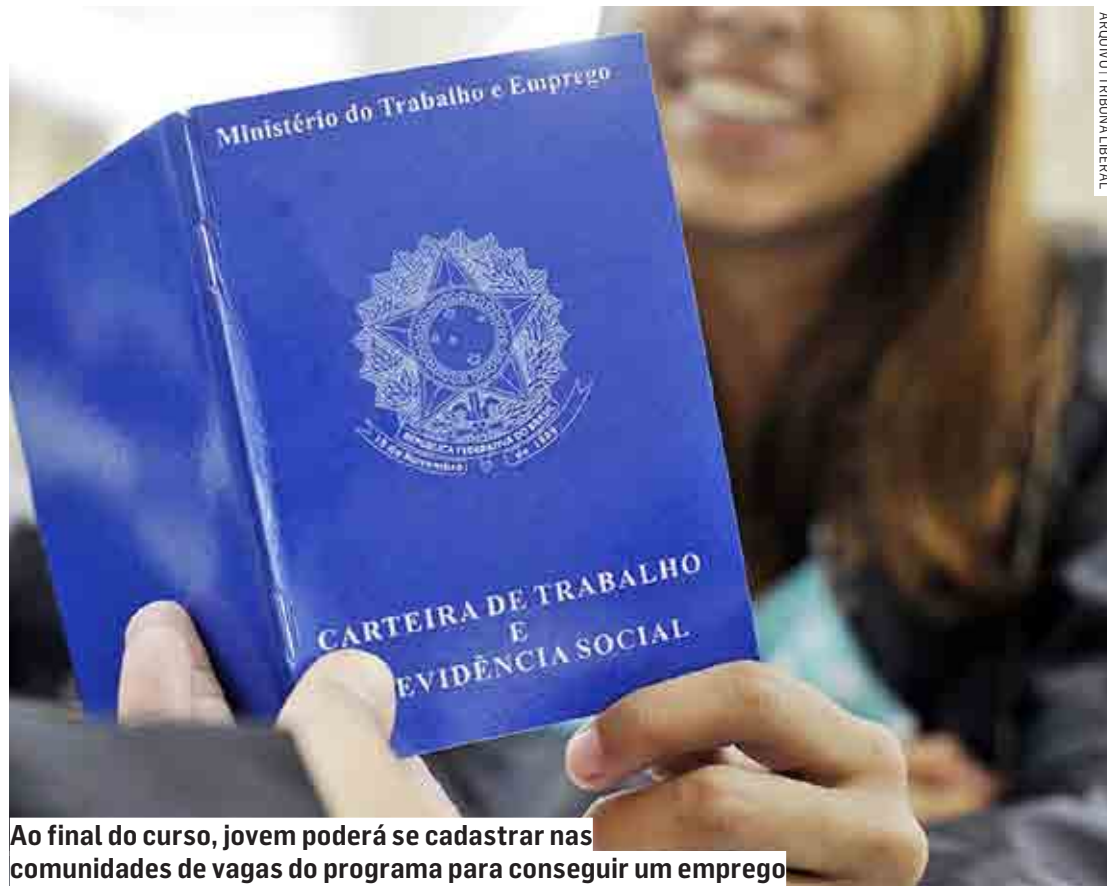
Ao final do curso, jovem poderá se cadastrar nas comunidades de vagas do programa para conseguir um emprego

O conteúdo do Coletivo Online conta com 11 videoaulas curtas e objetivas, focadas em temas do mundo do trabalho, elaboração de um plano de vida, planejamento financeiro, construção de currículo e como se preparar para en-