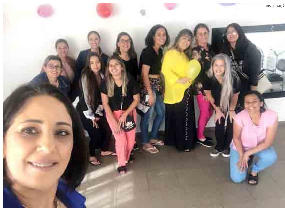
Iniciativa pretende beneficiar com uma profissão as mulheres menos favorecidas

A iniciativa pretende beneficiar com uma profi-