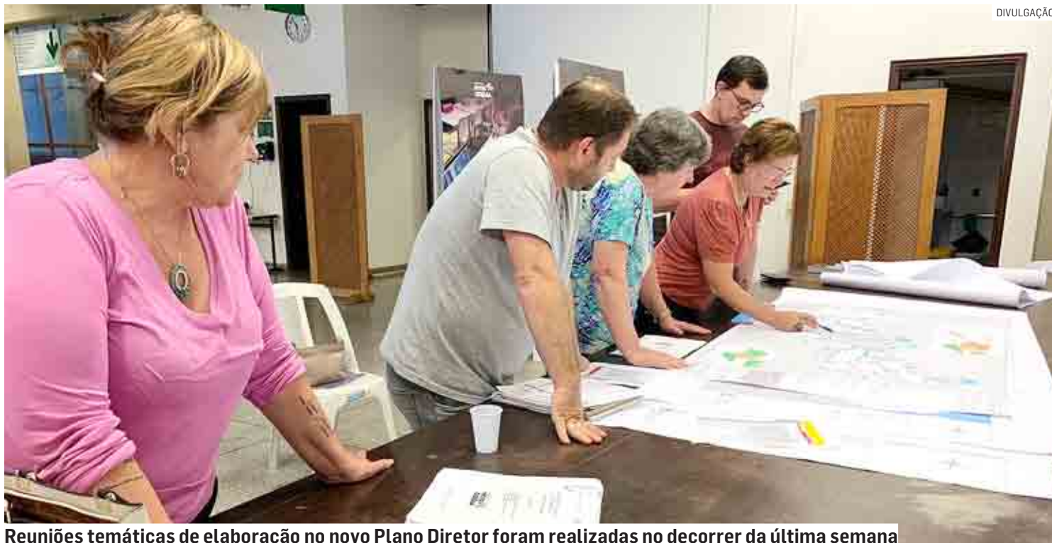
Reuniões temáticas de elaboração no novo Plano Diretor foram realizadas no decorrer da última semana

A intenção das Oficinas Temáticas foi exatamente garantir a maior participação popular possível, colher novas propos-