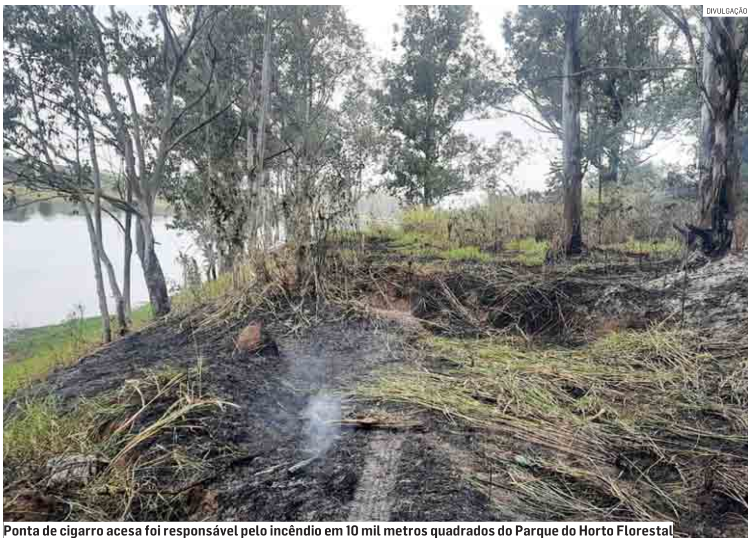
Ponta de cigarro acesa foi responsável pelo incêndio em 10 mil metros quadrados do Parque do Horto Florestal

O superintendente da Defesa Civil, Demétrio Matheus Moreira, afirma que a população pode fazer a sua parte para evitar focos de incêndio. De acordo com ele, deve-se evitar o descarte irregular de lixo e, principalmente, não colocar fogo em resíduos. A prática, além de proibida, pode sair do controle e gerar um incêndio de grandes proporções.