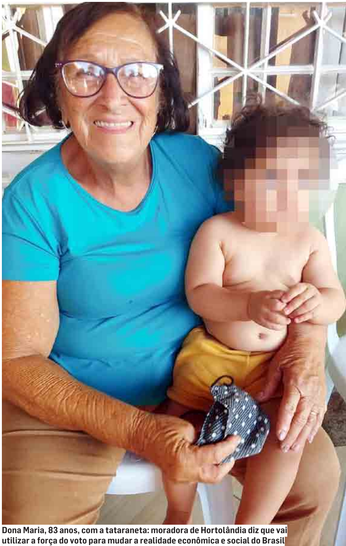
Dona Maria, 83 anos, com a tataraneta: moradora de Hortolândia diz que vai utilizar a força do voto para mudar a realidade econômica e social do Brasil.

Dados do TSE (Tribunal Superior Eleitoral) mostram que o eleitorado está cada vez mais velho em todo o País. Nestas eleições, a faixa etária superior a 60 anos de idade representa 21% do eleitorado. Em 1994, primeira eleição presidencial em que o órgão contabilizou dados do eleitorado por faixa etária, o percentual era de 11,6%.