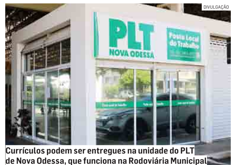
Currículos podem ser entregues na unidade do PLT de Nova Odessa, que funciona na Rodoviária Municipal

A entrega do currículo também pode ser fei-