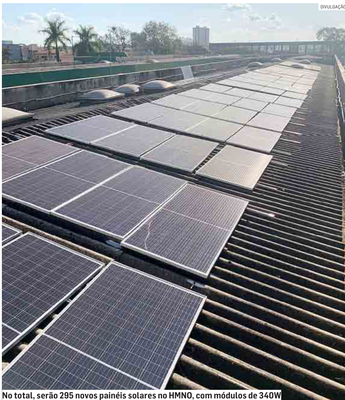
No total, serão 295 novos painéis solares no HMNO, com módulos de 340W