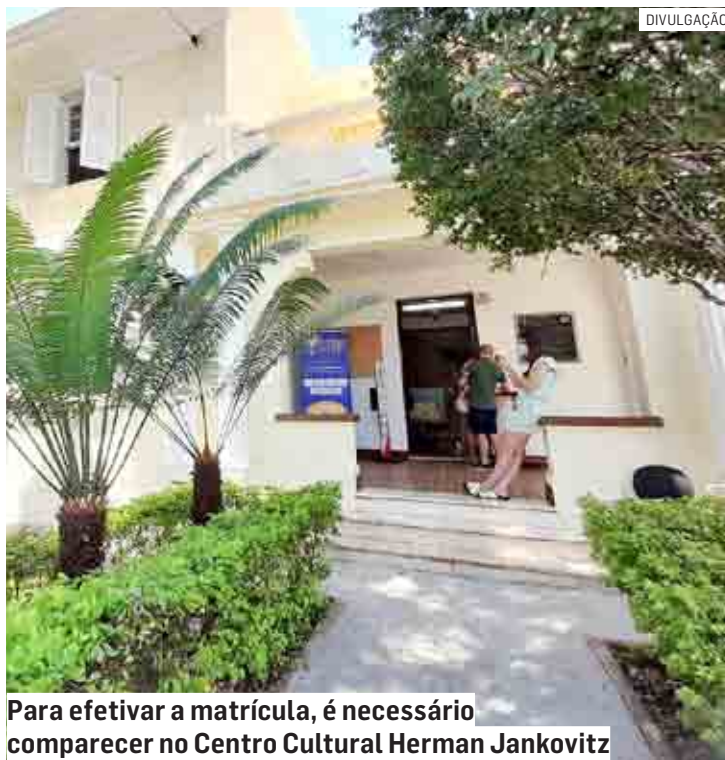
Para efetivar a matrícula, é necessário comparecer no Centro Cultural Herman Jankovitz

São oferecidas 200 vagas para o curso de dança, para crianças de 5 anos ou mais, e 60 para as turmas de desenho, para crianças de 12 anos ou mais. A seleção obedece a ordem cronológica de preenchimento dos formulários de inscrição. Os critérios mínimos para atendimento pelo programa municipal incluem ter renda mensal familiar até 3 salários mínimos e ser morador de Nova Odessa.