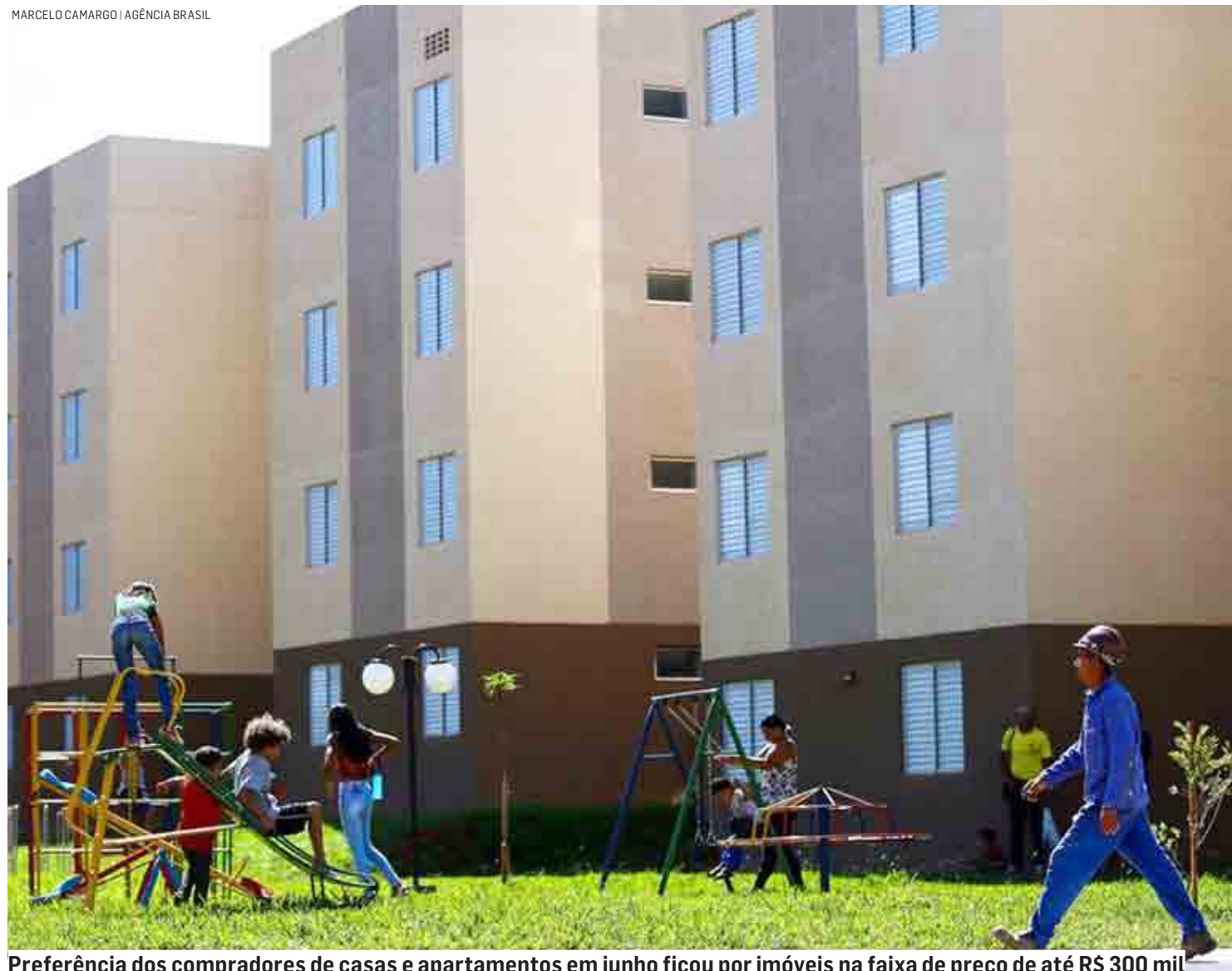
Preferência dos compradores de casas e apartamentos em junho ficou por imóveis na faixa de preço de até R$ 300 mil

Da Redação | REGIÃO tribunaliberal@tribunaliberal.com.br