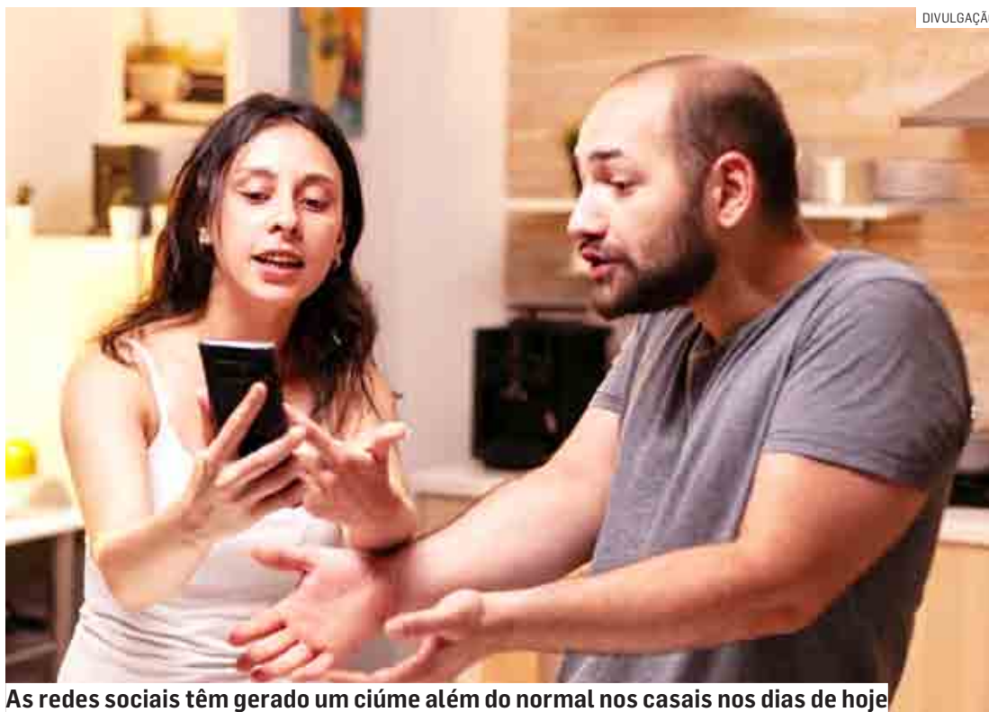
As redes sociais têm gerado um ciúme além do normal nos casais nos dias de hoje