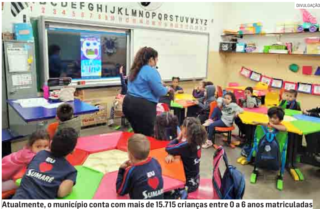
Atualmente, o município conta com mais de 15.715 crianças entre 0 a 6 anos matriculadas