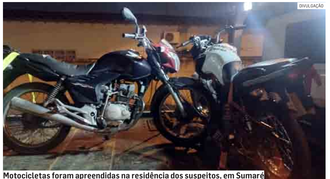
Motocicletas foram apreendidas na residência dos suspeitos, em Sumaré

Cézar Oliveira | SUMARÉ tribunaliberal@tribunaliberal.com.br