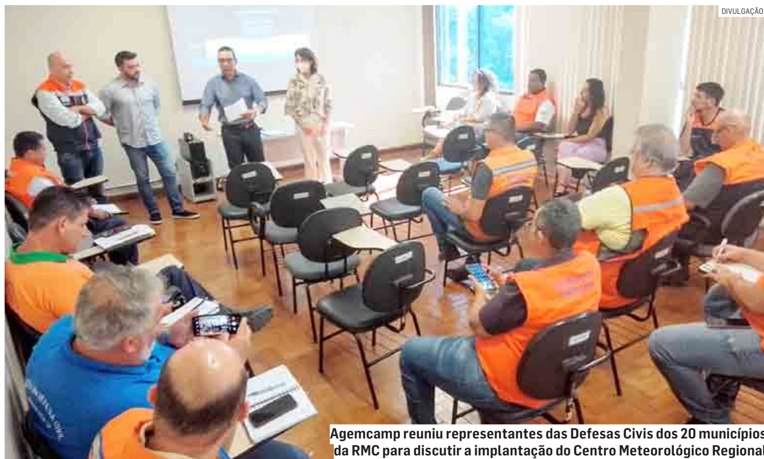
Agemcamp reuniu representantes das Defesas Civis dos 20 municípios da RMC para discutir a implantação do Centro Meteorológico Regional

“Prever eventos climáticos extremos é de grande relevância para a Região Metropolitana de Campinas, tanto em re-