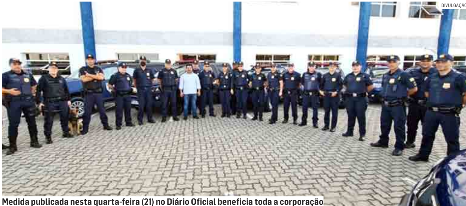
Medida publicada nesta quarta-feira (21) no Diário Oficial beneficia toda a corporação

Segundo a Secretaria de Administração e Gestão de Pessoal, a partir