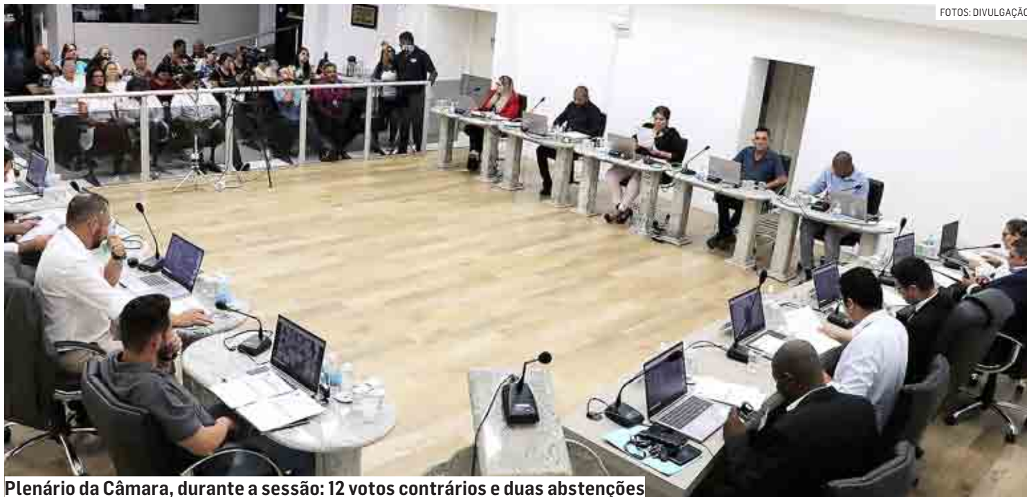
Plenário da Câmara, durante a sessão: 12 votos contrários e duas abstenções