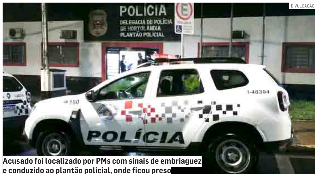
Acusado foi localizado por PMs com sinais de embriaguez e conduzido ao plantão policial, onde ficou preso

do pelos policiais militares em frente ao imóvel, apresentava sinais de embriaguez e um ferimento no pé. Ele foi levado até uma UPA (Unidade de Pronto Atendimento) e depois encaminhado ao Plantão Policial de Hortolândia. Ele foi preso em flagrante e autuado pelo crime de importunação sexual.