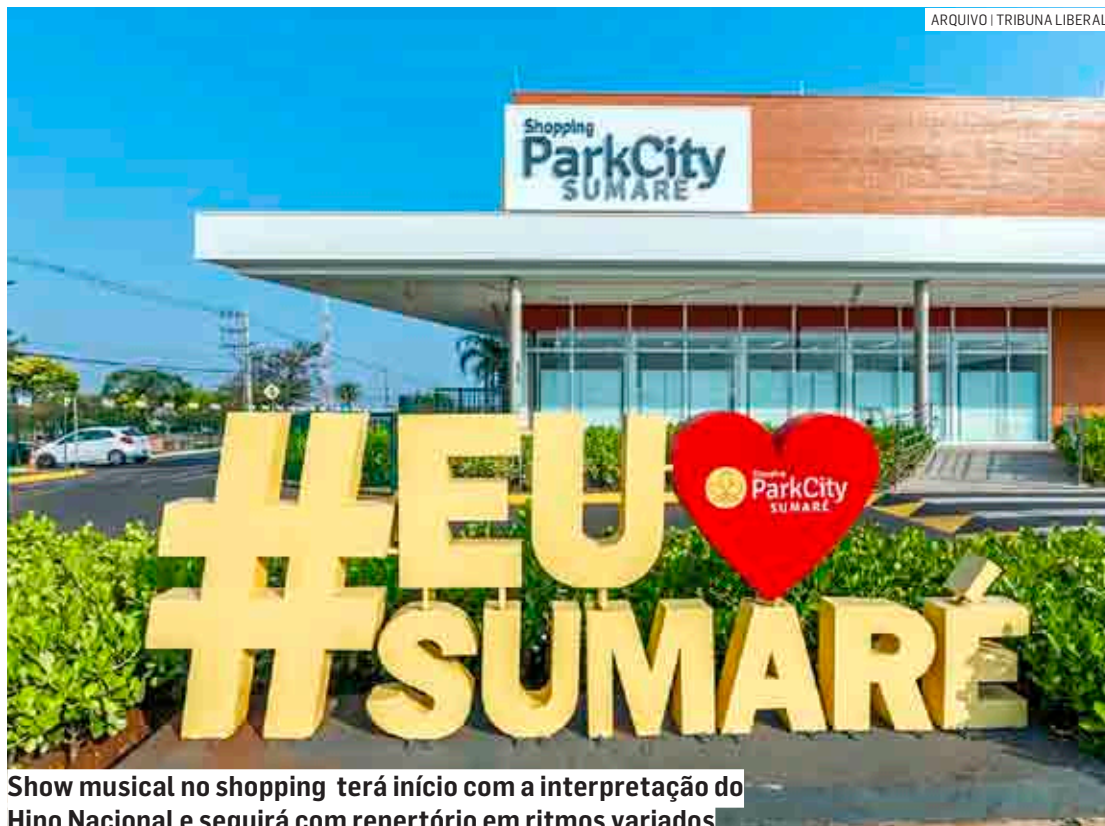
Show musical no shopping terá início com a interpretação do Hino Nacional e seguirá com repertório em ritmos variados

O show musical terá início com a interpretação do Hino Nacional e seguirá com um repertório em ritmos variados. Durante aproximadamente uma hora e meia serão tocadas canções gravadas e os intérpretes farão a tradução em Libras com movimentos e expressões faciais que fazem parte da comunicação do surdo.