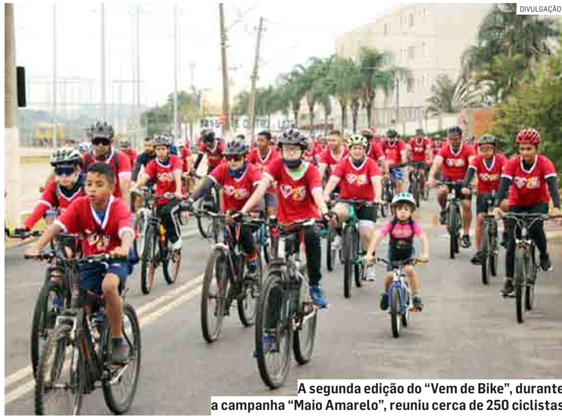
A segunda edição do "Vem de Bike", durante a campanha "Maio Amarelo", reuniu cerca de 250 ciclistas

"O passeio ciclístico segue a tendência de outras ações, de diversos países, com o objetivo de contribuir com o meio ambiente e a saúde das pessoas, além de promover a conscientização por um trânsito mais seguro e ecologicamente correto, com menos uso de veículos particulares e incentivo a caronas", explica o secretário