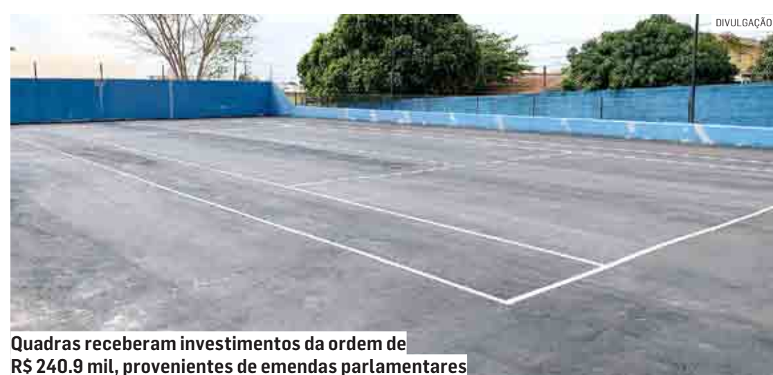
Quadras receberam investimentos da ordem de R$ 240.9 mil, provenientes de emendas parlamentares

“Nosso compromisso com as crianças e jovens de Nova Odessa é garantir esporte de qualidade para todos, com uma maior diversificação. Muitas pessoas me cobravam dizendo que a Prefeitura só tinha olhos para o futebol. Estamos mudando isso, aumentando as opções de modalidades esportivas em nossa cidade, principalmente nas Escoli-