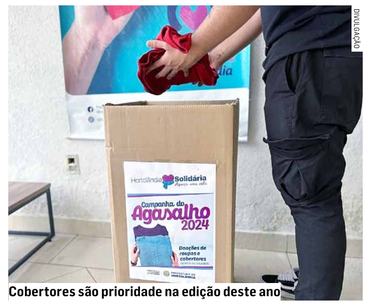
Cobertores são prioridade na edição deste ano

O Dia D da Campanha do Agasalho do ano passado foi um sucesso, registrando a arrecadação de mais de 4.500 peças. Durante todo o ano de 2023, a Campanha do Agasalho foi responsável pela arrecadação de 101 peças de roupas e 3.500 cobertores.