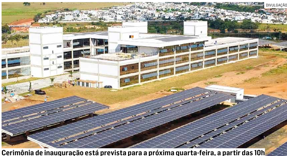
Cerimônia de inauguração está prevista para a próxima quarta-feira, a partir das 10h

A Prefeitura de Hortolândia alterou a data de inauguração do Novo Paço Municipal “Palácio dos Migrantes - Prefeito Ângelo Augusto Perugini” para o dia 29 de maio. A cerimônia de inauguração da nova sede do Poder Executivo está prevista para as 10h, na Estrada Municipal Sabina Baptista de Camargo, próximo à Ponte da Esperança (Ponte Estaiada) e ao Corredor Metropolitano, na região do Jardim Novo Ângulo. A inauguração integra a programação em celebração ao aniversário de 33 anos de Hortolândia.