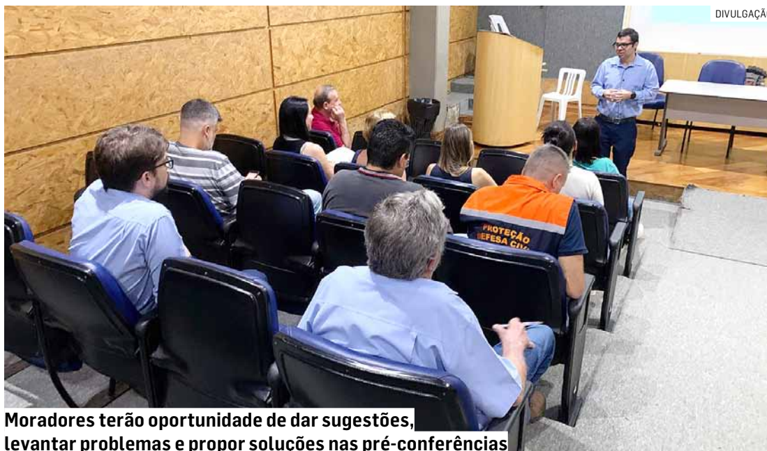
Moradores terão oportunidade de dar sugestões, levantar problemas e propor soluções nas pré-conferências

As pré-conferências têm a finalidade de apresentar à população a proposta de revisão do Plano Municipal de Saneamento Básico, no que se refere à Gestão dos Resíduos Sólidos Urbanos.