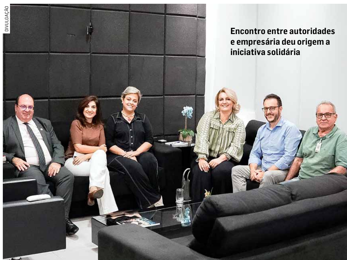
Encontro entre autoridades e empresária deu origem a iniciativa solidária

Da Redação • SUMARÉ tribunaliberal@tribunaliberal.com.br