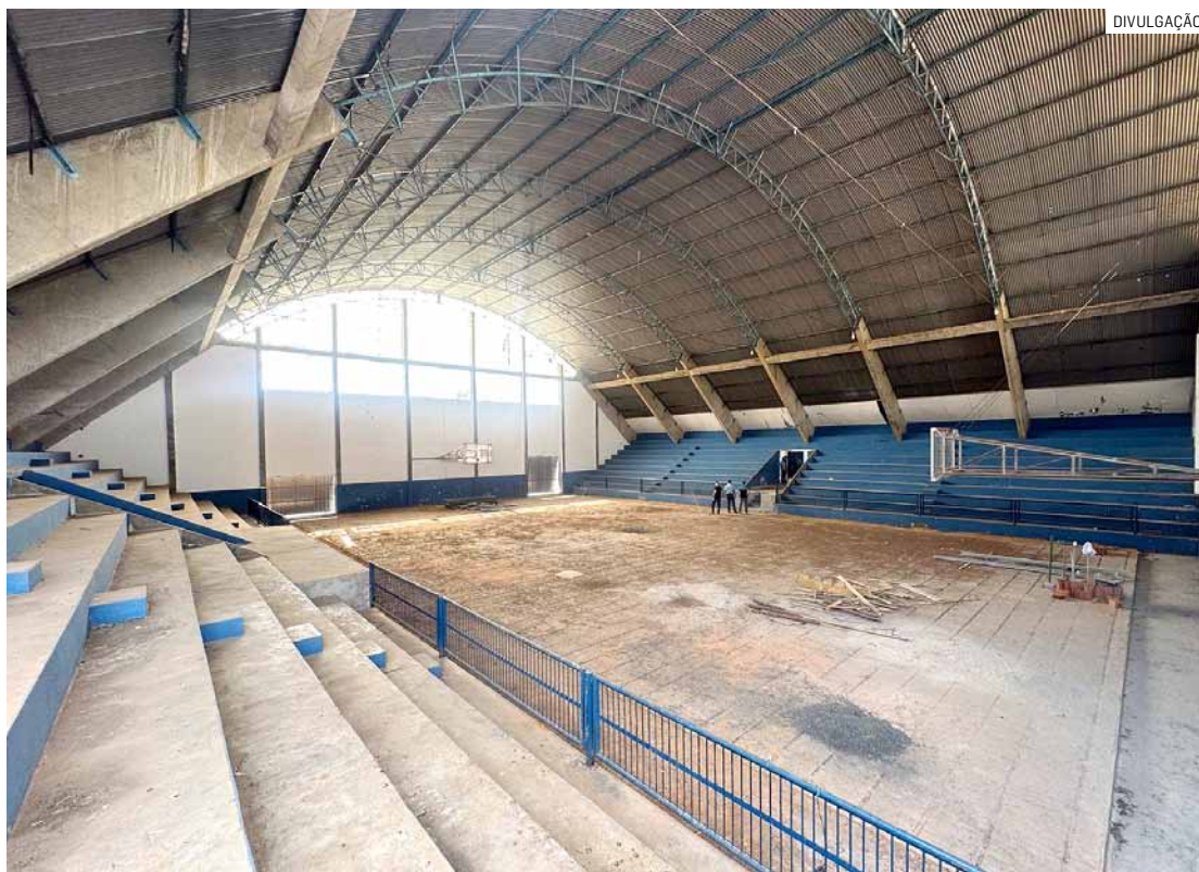
Além de modernizar, obras de melhorias tornam Centro Esportivo mais funcional e acessível

As obras abrangem uma série de melhorias para modernizar e tornar o Centro Esportivo mais funcional e acessível. Entre as intervenções estão a troca do telhado, a construção de uma quadra poliesportiva, a instalação de novos banheiros e vestiários, a renovação da fachada, a implementação de acessibilidade para PCD (Pessoas Com Deficiência), banheiro adaptado, reestruturação do sistema de drenagem, iluminação em LED, rampa para ambulância e novo portão de acesso.