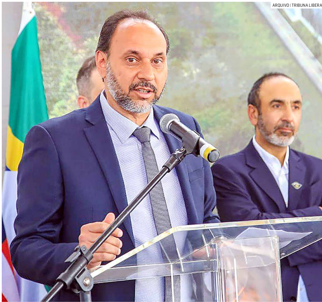
Moradores criticaram prefeito de Paulínia pelo gasto considerado elevado com sinalização

A sinalização viária é realizada pelas cidades visando a organização do tráfego, prevenção de acidentes e melhoria da mobilidade urbana. No entanto, o montante de R$ 12.177.976,25 foi criticado por moradores. “O valor é alto, R$12 milhões para pintar rua e lombada? Só