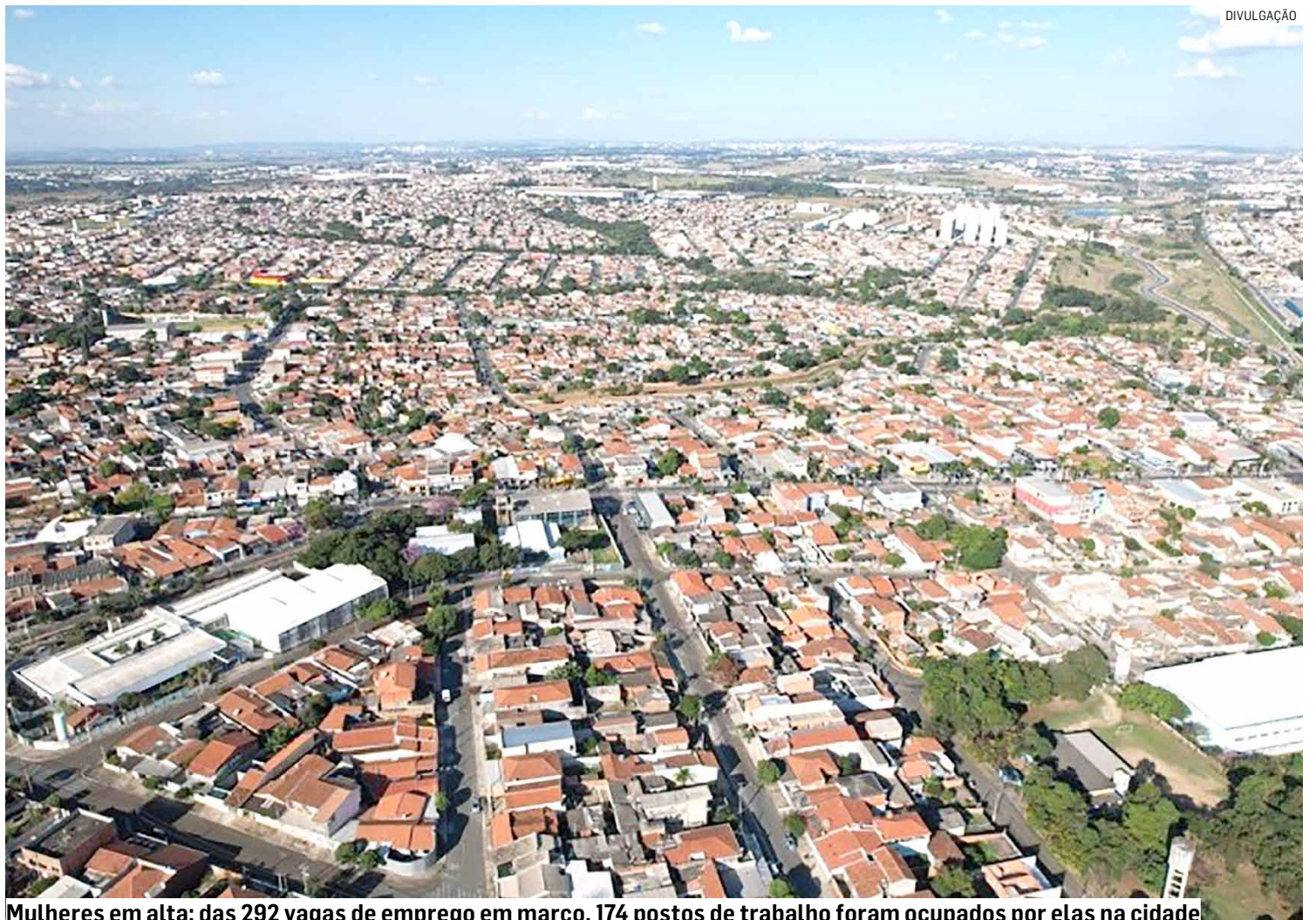
Mulheres em alta: das 292 vagas de emprego em março, 174 postos de trabalho foram ocupados por elas na cidade

Em fevereiro deste ano, o município teve saldo positivo de 177 vagas. Já em janeiro, segundo os dados do Caged, o saldo foi de 412 vagas de emprego.