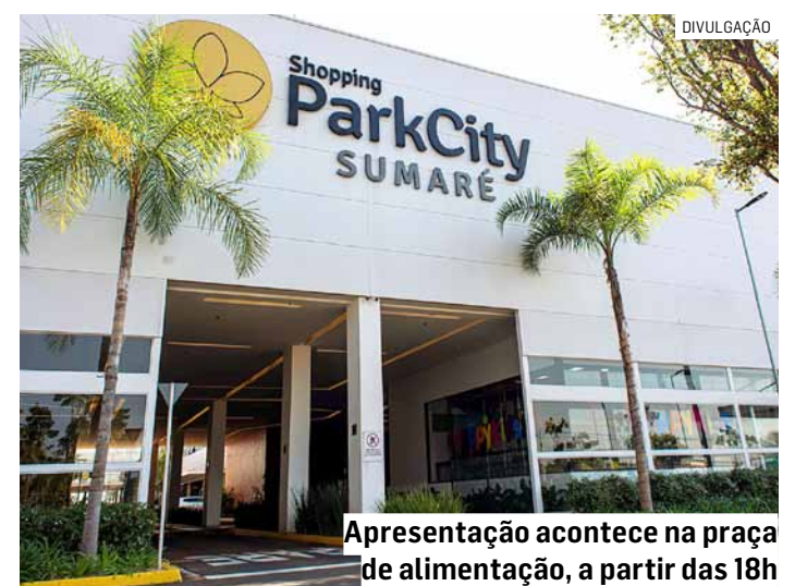
Apresentação acontece na praça de alimentação, a partir das 18h