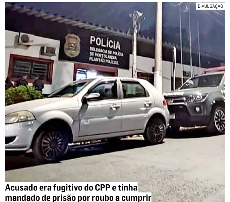
Acusado era fugitivo do CPP e tinha mandado de prisão por roubo a cumprir

Durante busca pessoal foram encontrados em seu bolso a chave do veículo,