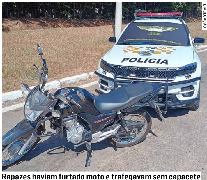
Rapazes haviam furtado moto e trafegavam sem capacete

O garupa, de 19 anos, tentou fugir a pé, porém, foi alcançado e detido. Questionados sobre a propriedade da motocicleta, os dois