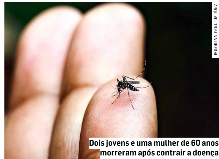
Dois jovens e uma mulher de 60 anos morreram após contrair a doença

Monte Mor confirmou nesta terça-feira (21) o primeiro óbito por dengue neste ano. Segundo Painel de Monitoramento a vítima fatal é um idoso com idade entre 65 a 79 anos, que morreu no dia 9 deste mês. Em Sumaré, duas pessoas morreram pela doença, dois homens, de 44 e de 63 anos. Já em Nova Odessa, uma mulher de 42 anos é a primeira morte pela doença na cidade.