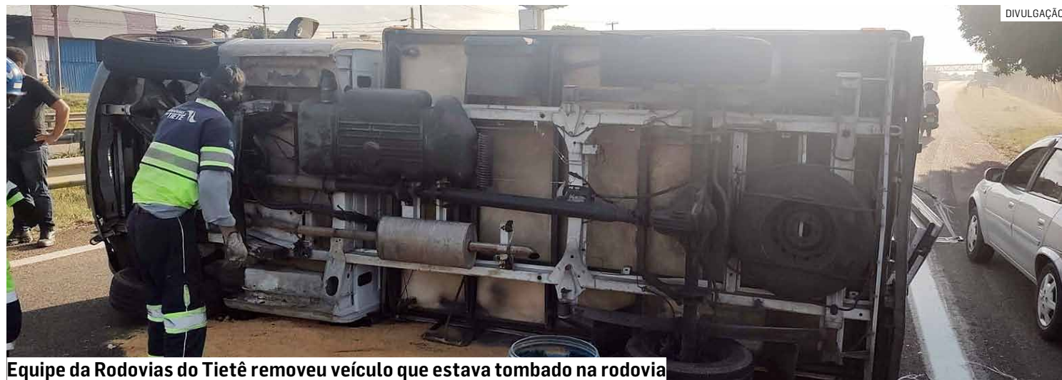
Equipe da Rodovias do Tietê removeu veículo que estava tombado na rodovia

Cézar Oliveira • HORTOLÂNDIA tribunaliberal@tribunaliberal.com.br