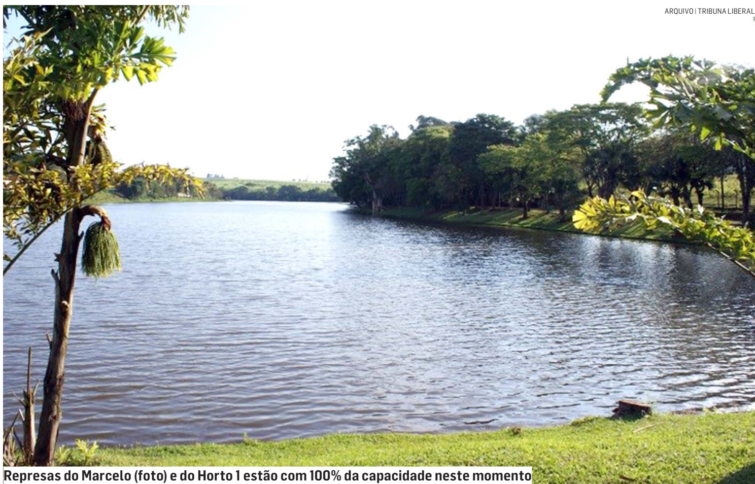
Represas do Marcelo (foto) e do Horto 1 estão com 100% da capacidade neste momento

Os mananciais da cidade suportaram bem o período mais crítico do ano. O resultado deste início de mês chuvoso reflete diretamente nas condições dos mananciais que abastecem o município. O Rio Atibaia está com 1,90 metro de nível apurado nesta semana; as represas do Marcelo e do