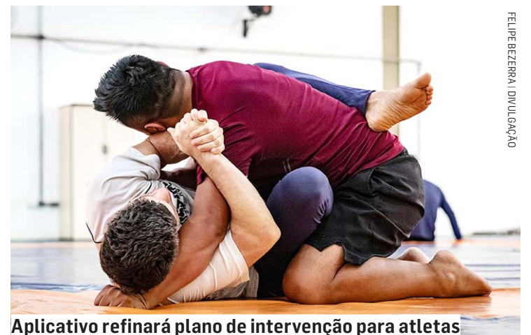
Aplicativo refinará plano de intervenção para atletas

A ideia do software surgiu a partir de um trabalho iniciado ainda em 2013, quando Piedade - que coordena a área de Medicina do Exercício e do Esporte da universidade - começou a estudar o Prom, acrônimo de patient reported outcome measures, ou desfechos relatados pelos pacientes. Trata-se de um questionário que identifica a avaliação do paciente sobre seu próprio tratamento antes da resposta de um especialista. Até cerca de 20 anos atrás, os resultados dos procedimentos médicos eram avaliados a par-