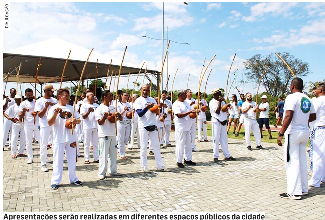
Apresentações serão realizadas em diferentes espaços públicos da cidade

Da Redação • HORTOLÂNDIA tribunaliberal@tribunaliberal.com.br