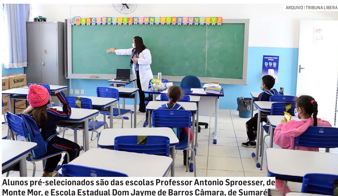
Alunos pré-selecionados são das escolas Professor Antonio Sproesser, de Monte Mor, e Escola Estadual Dom Jayme de Barros Câmara, de Sumaré

A seletiva online, composta por três exames (P1, P2 e P3), aconteceu no dia