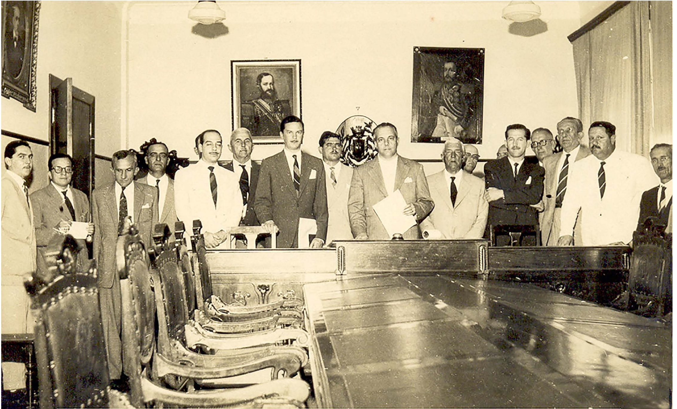
Comissão de Emancipação Política no Palácio 9 de Julho - 27/04/53

Sumaré emancipou-se oficialmente de Campinas no dia 30 de dezembro de 1953, através da Lei Estadual nº. 2456. Para chegar a esse termo, houve um movimento popular, com reuniões, abaixo-assinado de moradores e contatos com autoridades estaduais. Para a Assembleia Legislativa do Estado de São Paulo foi elaborado um memorial, pleitando a emancipação, acompanhado de documentos e o abaixo-assinado, com os seguintes moradores: