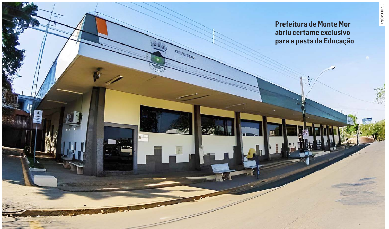
Prefeitura de Monte Mor abriu certame exclusivo para a pasta da Educação

Já para candidatos com Ensino Superior Completo, há vagas para Professor de Educação Básica I, Professor de Educação Básica II nas áreas de Artes, Ciências, Educação Física, Geografia, História, Língua Inglesa, Matemática, Língua Portuguesa, Língua Brasileira de Sinais (Libras), e também para Professor de Educação Especial/Deficiência Intelectual, Diretor de Escola, Nutricionista, Psicólogo, Terapeuta Ocupacional, Psicopedagogo (todos em cadastro reserva), com salários entre R$ 3.507,10 e R$ 6.695,56, e carga horária de 20 a 40 horas semanais.