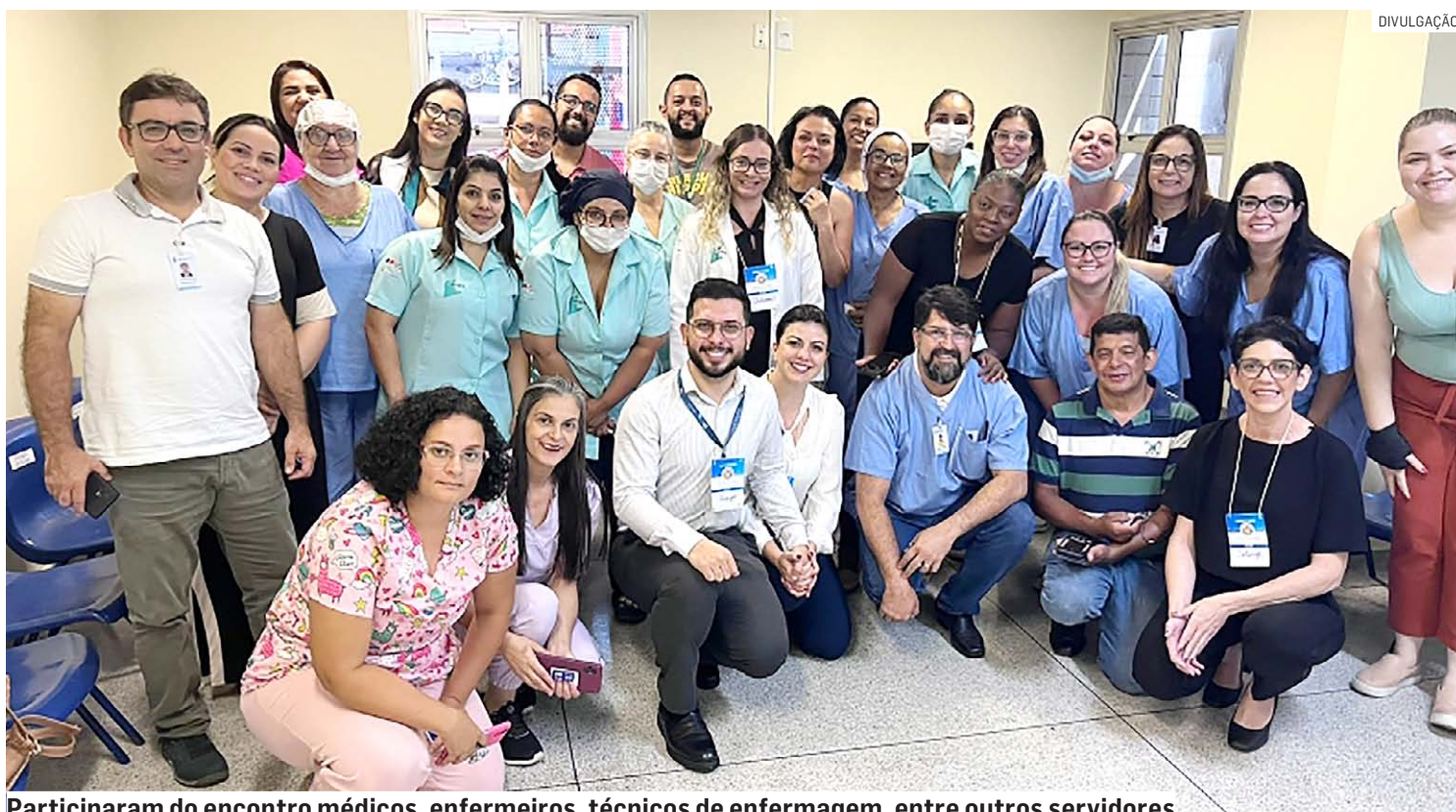
Participaram do encontro médicos, enfermeiros, técnicos de enfermagem, entre outros servidores

Capacitação foi ministrada por empresa especializada em assessoria hospitalar e visa atender uma das metas internacionais de segurança da Organização Mundial da Saúde; objetivo é capacitar unidade para receber certificação