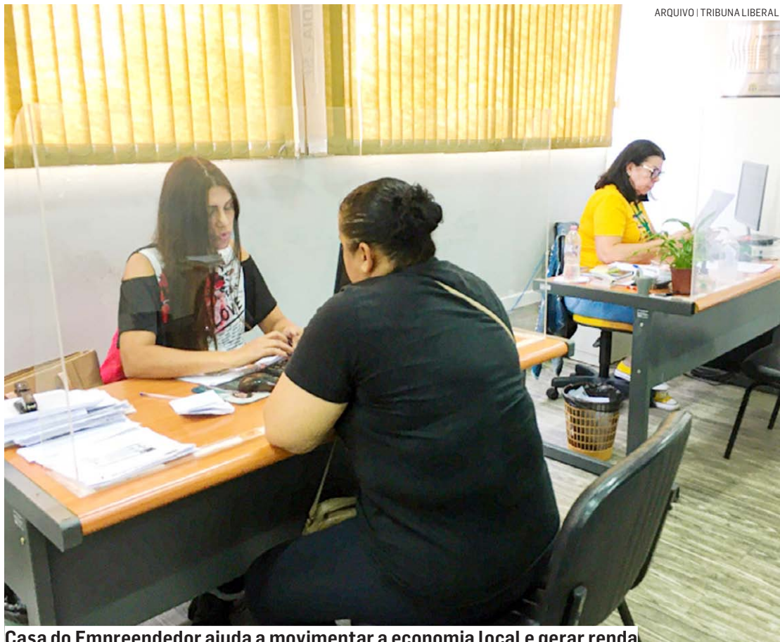
Casa do Empreendedor ajuda a movimentar a economia local e gerar renda

Para a Casa, apoiar quem empreende no município