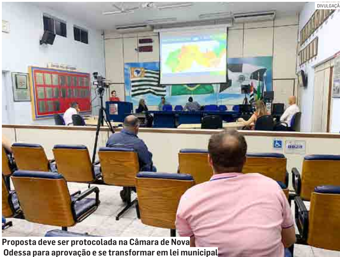
Proposta deve ser protocolada na Câmara de Nova Odessa para aprovação e se transformar em lei municipal

Serão admitidos comprovantes em que conste o endereço de residência e ou domicílio, mediante apresentação de documento comprobatório (contas de água, luz, telefone fixo etc), para comprovar a residência ou