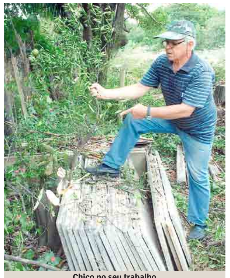
Chico no seu trabalho

exemplo de vida, uma esperança em dias melhores. Diríamos que tudo isso era coisa de artista. De artista com alma, com muito sentimento cristão, sempre pronto para dar isso ao próximo.