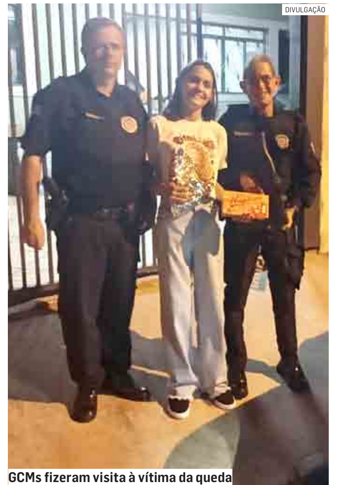
GCMs fizeram visita à vítima da queda