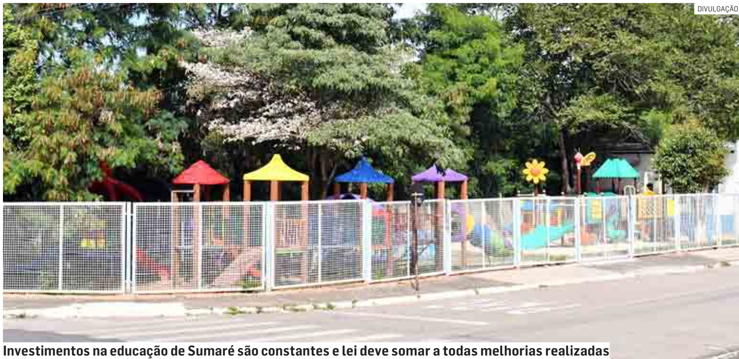
Investimentos na educação de Sumaré são constantes e lei deve somar a todas melhorias realizadas

De acordo com a norma, a administração municipal, por meio da Secretaria de Segurança passará a realizar campanhas, palestras e se-