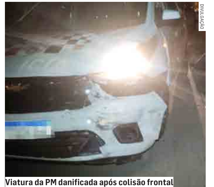
Viatura da PM danificada após colisão frontal

O homem que causou o acidente foi levado para a delegacia, onde foi preso por embriaguez ao volante. Já o motociclista que estava com a droga também foi alcançado e detido, mas liberado após prestar depoimento.