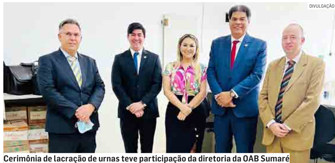
Cerimônia de lacração de urnas teve participação da diretoria da OAB Sumaré

Da Redação | REGIÃO tribunaliberal@tribunaliberal.com.br