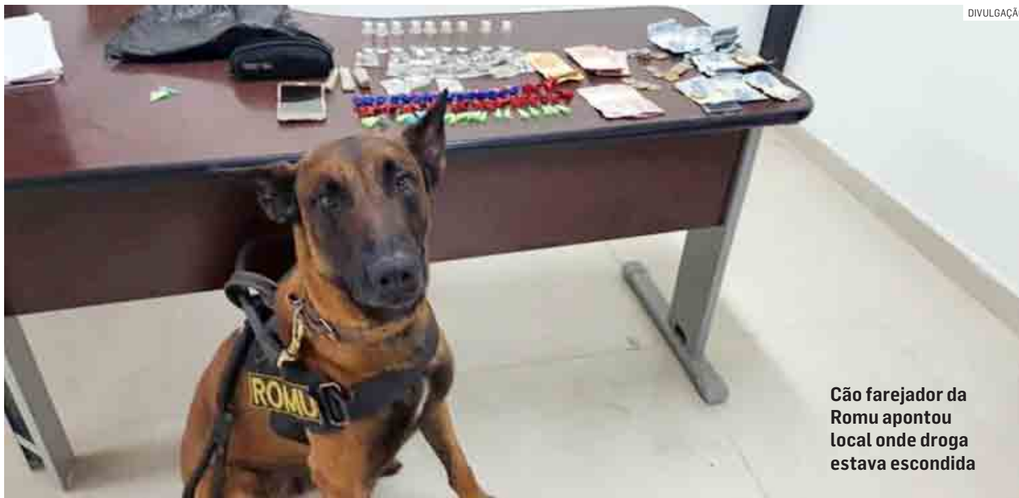
Cão farejador da Romu apontou local onde droga estava escondida

Entre os entorpecentes escondidos embaixo de um pedaço de tábua estavam skank, considerada a “super maconha”, cocaína e lança-perfume; apreensão aconteceu no Jardim dos Ipês durante patrulhamento no bairro