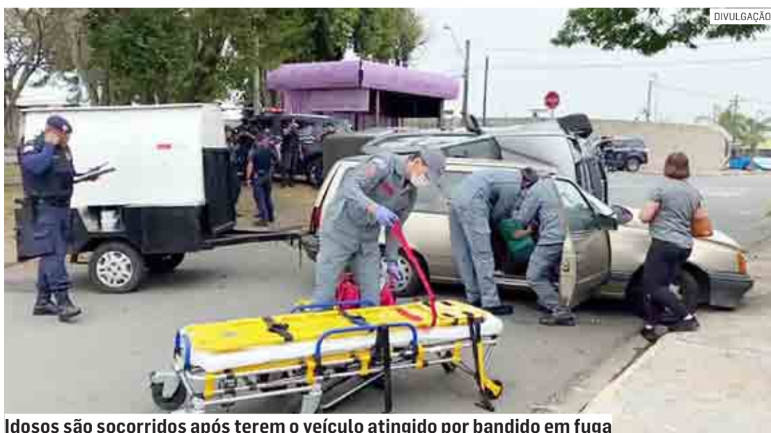
Idosos são socorridos após terem o veículo atingido por bandido em fuga

Cézar Oliveira | REGIÃO tribunaliberal@tribunaliberal.com.br