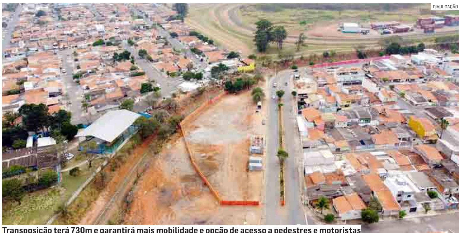
Transposição terá 730m e garantirá mais mobilidade e opção de acesso a pedestres e motoristas

Desde 2019, foram diversas reuniões realizadas pelo parlamentar com representantes do Governo do Estado, para que essa obra saísse do papel. A última delas aconteceu em junho de 2021, com re-