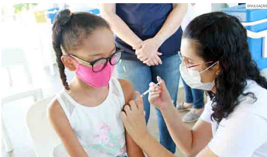
Crianças de 3 e 4 anos com comorbidades que já receberam a primeira dose há pelo menos 28 dias podem ser vacinadas com a segunda dose