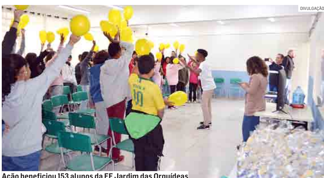
Ação beneficiou 153 alunos da EE Jardim das Orquídeas