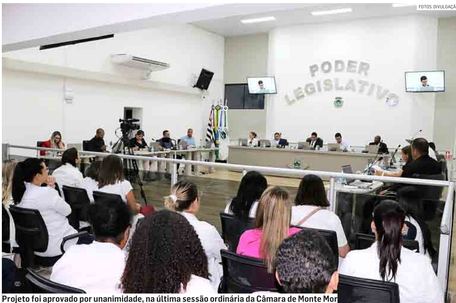
Projeto foi aprovado por unanimidade, na última sessão ordinária da Câmara de Monte Mor

Proposta da Prefeitura de Monte Mor referendada pela Câmara soma-se a outra resolução já homologada, que visa combater a perturbação do sossego em locais públicos e privados