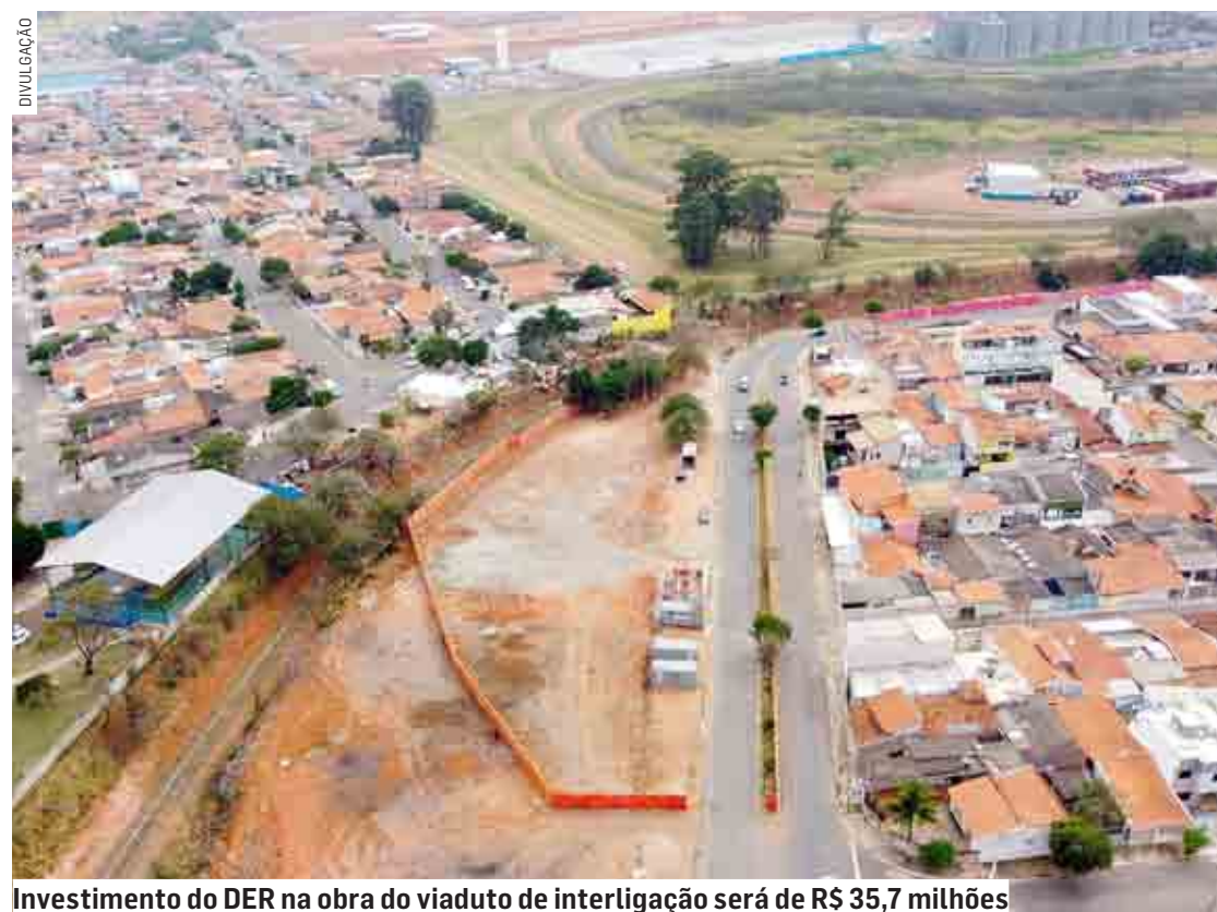
Investimento do DER na obra do viaduto de interligação será de R$ 35,7 milhões

SUMARÉ [CENTRO | NOVA VENEZA | PICERNO | MARIA ANTONIA | ÁREA CURA | MATÃO] ♦ HORTOLÂNDIA ♦ NOVA ODESSA ♦ MONTE MOR ♦ ELIAS FAUSTO ♦ PAULÍNIA ♦