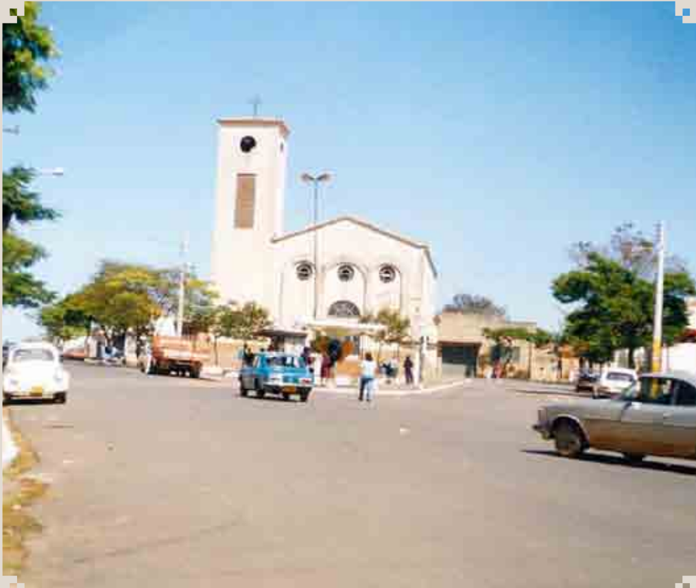
Igreja de São Francisco de Assis, em Nova Veneza. No lado esquerdo vemos uma das principais vias daquela comunidade: a Avenida Brasil. O registro é da década de 1970.