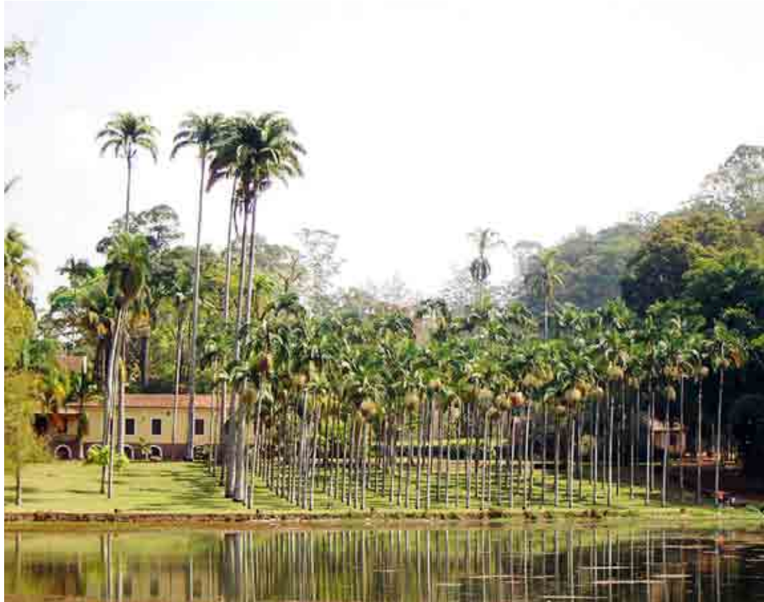
Floresta Estadual Edmundo Navarro de Andrade em Rio Claro

O Horto de Rio Claro foi o escolhido por ele para ser o seu centro de pesquisas. Esse Horto ocupava uma área de 986