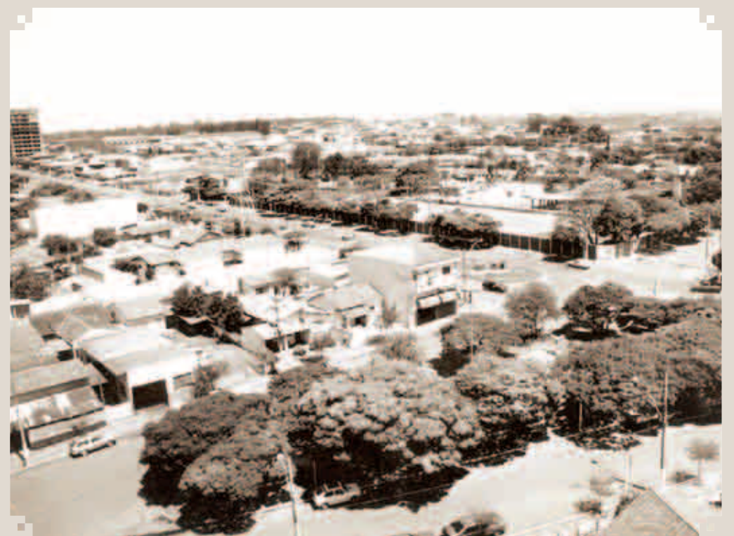
Fotografia tirada do alto do Edifício Caravelle, mostrando a Avenida Rebouças no cruzamento com a Avenida 7 de Setembro. Na esquina das duas avenidas vemos o conjunto poliesportivo do Clube Recreativo Sumaré. Mais ao fundo, à esquerda, um dos primeiros espigões de Sumaré: o Condomínio Silvino Ongaro.