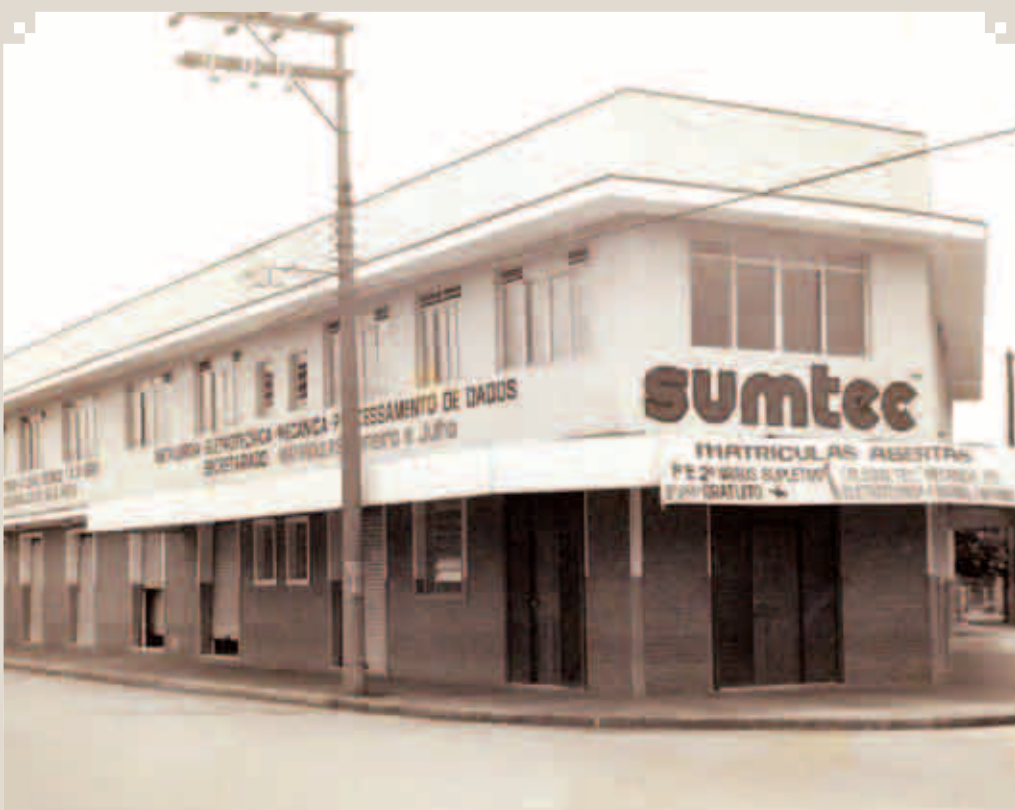
Foto da segunda escola técnica profissionalizante de Sumaré: a SUMTEC. Ficava na esquina da Avenida 7 de Setembro com a Rua Tranquillo Menuzzo. Foi criada e mantida pela professora Edy Madalena Bocchi Mazer.