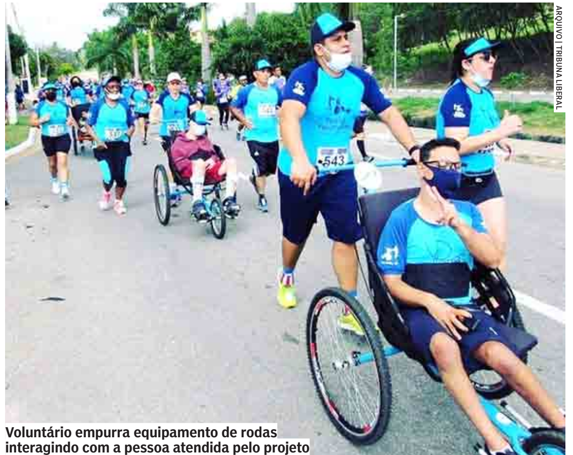
Voluntário empurra equipamento de rodas interagindo com a pessoa atendida pelo projeto