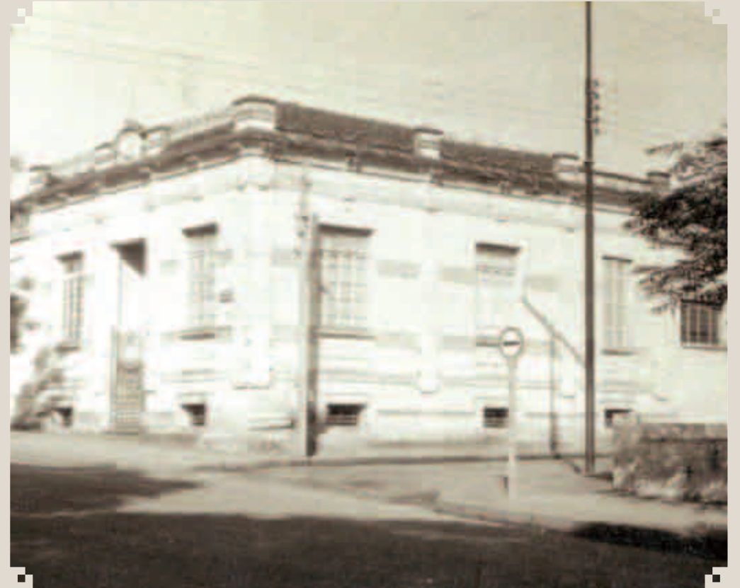
Foto da década de 1950, da Subprefeitura de Sumaré. Nessa década Sumaré emancipou-se do município de Campinas. Esse prédio foi utilizado como Prefeitura e Câmara Municipal. Hoje abriga o Centro de Memória "Thomaz Didona".