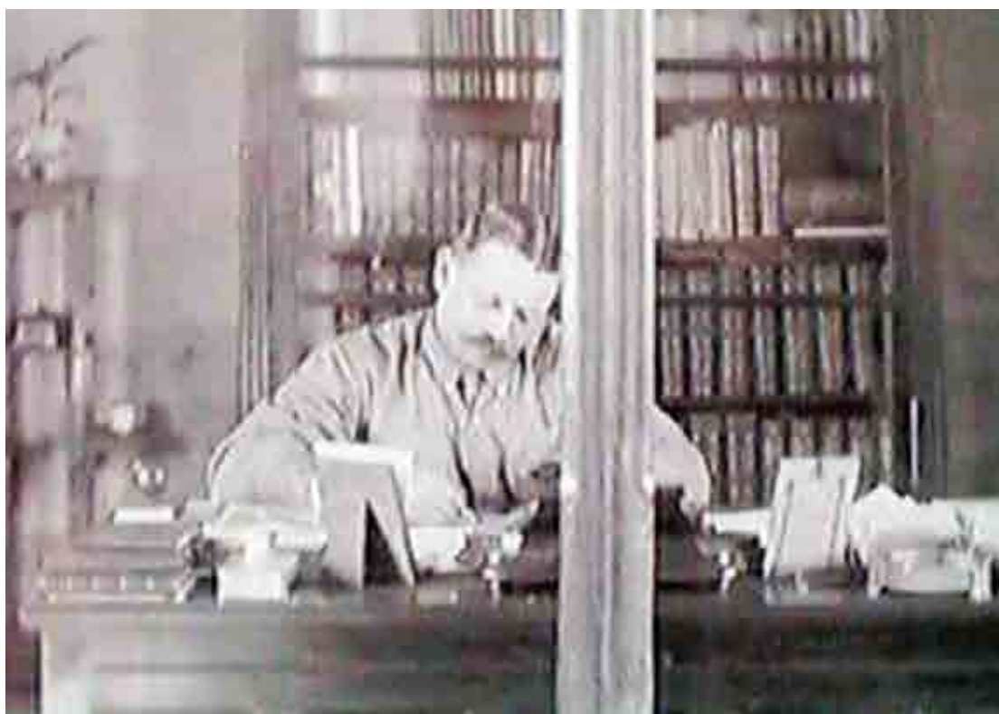
Edmundo Navarro de Andrade no Horto de Rio Claro

alqueires. Edmundo Navarro trabalhou na aclimação e no reflorestamento de várias espécies de eucalipto, distribuídos majoritariamente no município de Rio Claro e o restante no município de Santa Gertrudes. O local é aberto à visitação e possui atrações como as trilhas que passam pelos vários eucaliptos que se encontram na Floresta. Há ainda o Museu do Eucalipto, que reúne em seu acervo 39 anos de pesquisa do engenheiro agrônomo. Também há o SOLAR NAVARRO de ANDRADE, residência do pesquisador Navarro de Andrade tombado pelo patrimônio Histórico.