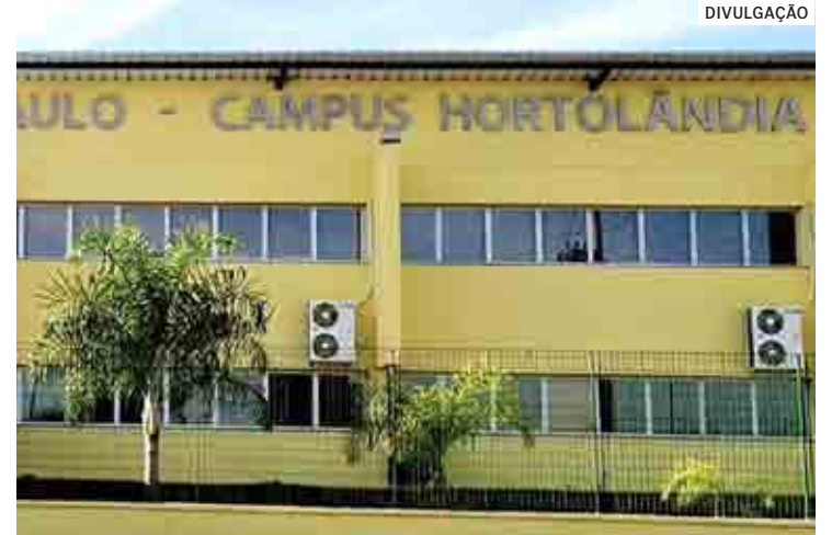
Inscrições poderão ser feitas através do site da instituição.

Para efetivar a inscrição, o candidato deve ler o Edital n.º 225/2022 na íntegra, realizar o cadastro, preencher o formulário eletrônico de inscrição e o questionário socioeconômico no Portal do Can-