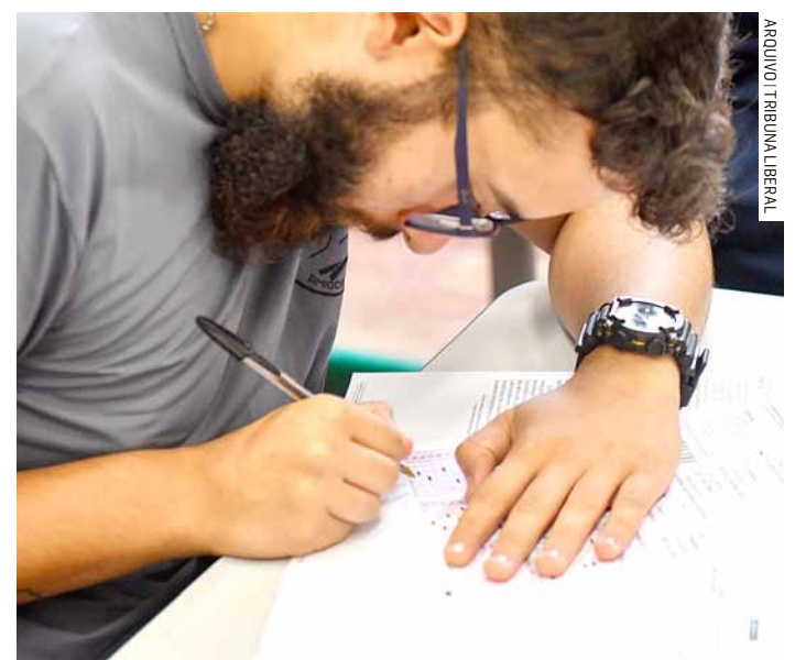
Vagas não preenchidas serão destinadas a novos estudantes para segunda chamada

As vagas não preenchidas serão destinadas a novos estudantes para a segunda chamada do Provão Paulista. Essa nova lista será divulgada no dia 27 de janeiro, próxima segunda-feira, a partir das 14h.