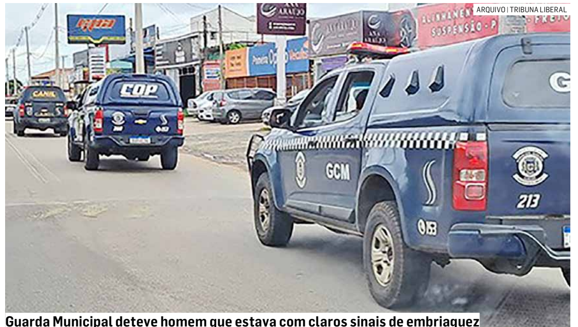
Guarda Municipal deteve homem que estava com claros sinais de embriaguez

O motorista foi conduzido até o Plantão Policial, onde concordou em ceder amostra de sangue para os procedimentos legais. Após ser ouvido, ele foi liberado, mas responderá pelas infrações cometidas.