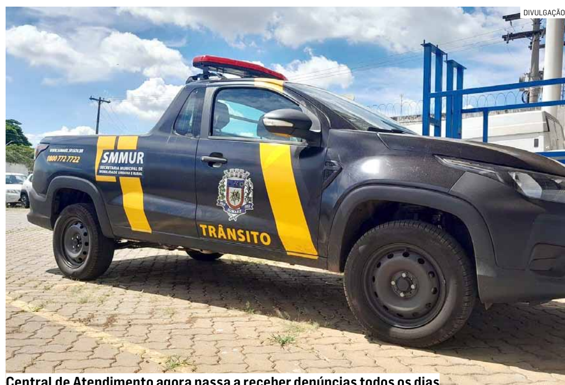
Central de Atendimento agora passa a receber denúncias todos os dias

Da Redação • SUMARÉ tribunaliberal@tribunaliberal.com.br