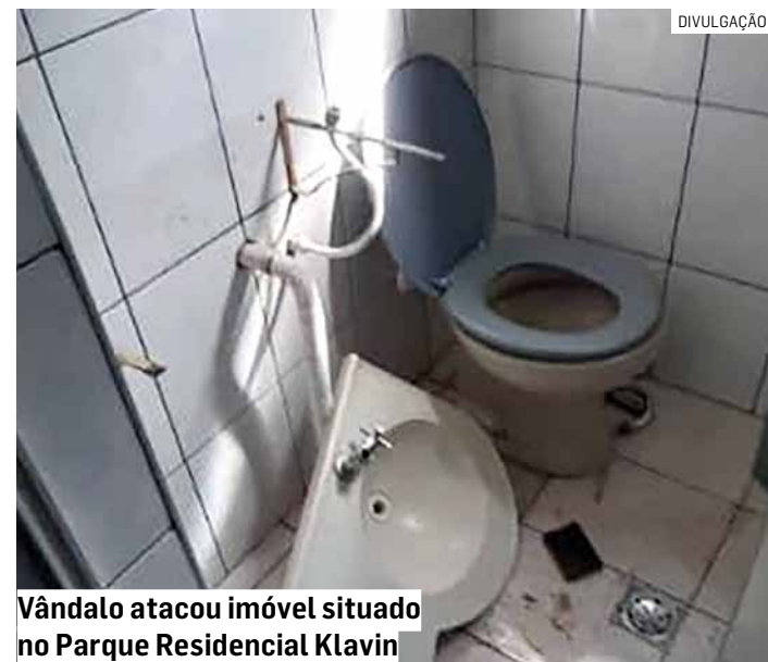
Vândalo atacou imóvel situado no Parque Residencial Klavin

A proprietária procurou a Delegacia de Nova Odessa, onde registrou o caso e agora a Polícia Civil seguirá com as investigações para identificar o autor.