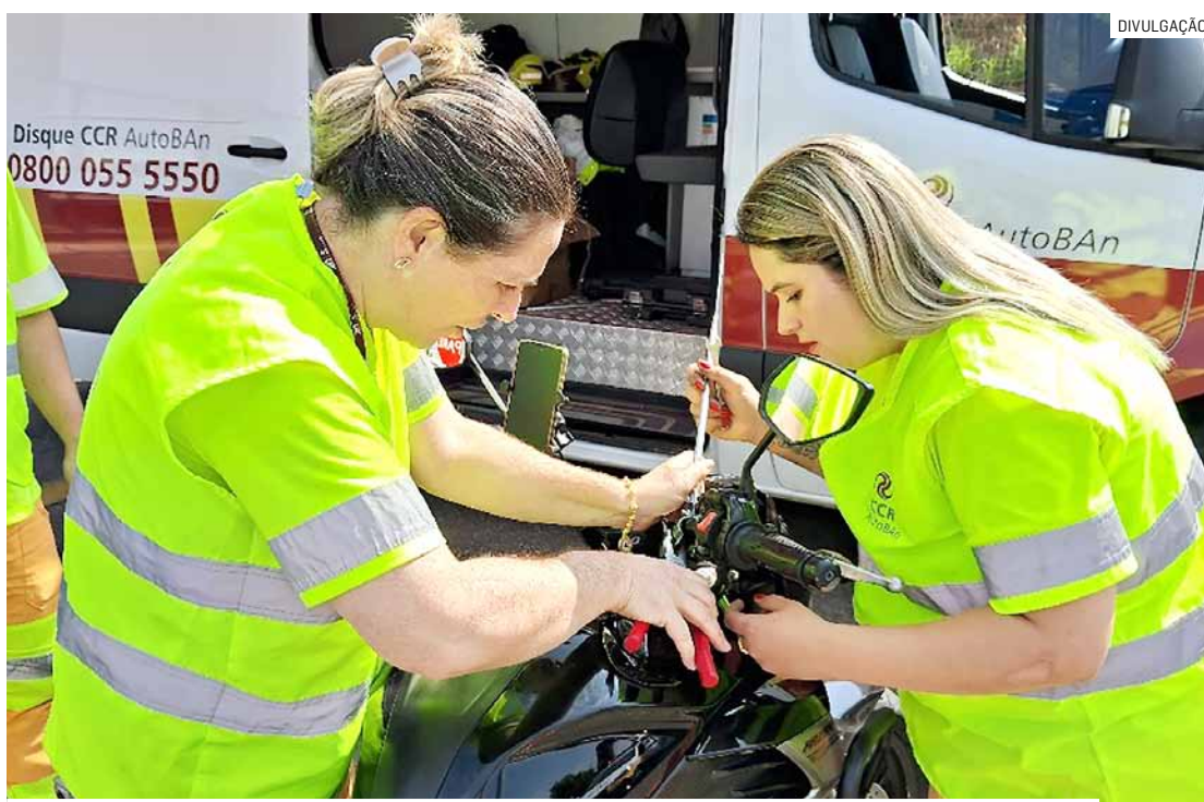
Campanha educativa será promovida nesta quarta-feira, no km 118, sentido interior

A ação visa reforçar os cuidados que os motociclistas devem ter ao trafe-