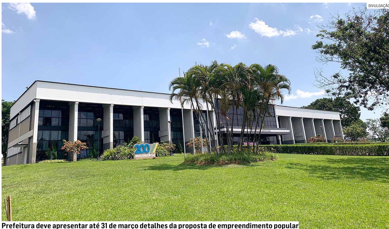
Prefeitura deve apresentar até 31 de março detalhes da proposta de empreendimento popular

Os imóveis serão construídos com recursos do FAR (Fundo de Arrendamento Residencial), ou seja, serão voltadas para famílias vulneráveis e de baixíssima renda, com renda bruta mensal familiar de até R$ 2.850,00. Tanto que as regras dos empreendimentos do FAR preveem subsídios de até 90% do valor do imóvel, com prestação mínima de R$ 80,00 e máxima de R$ 356,90.