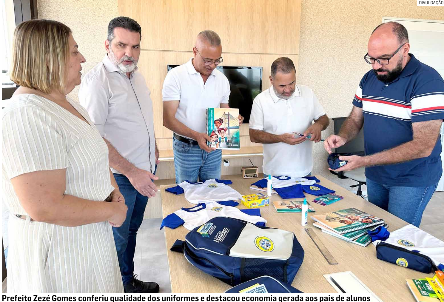
Prefeito Zezé Gomes conferiu qualidade dos uniformes e destacou economia gerada aos pais de alunos

O prefeito de Hortolândia, José Nazareno Zezé Gomes (Republicanos), celebrou a confecção dos uniformes escolares de verão. "Fico extremamente feliz de poder entregar os kits logo no início do ano letivo. O uniforme e o material democratizam a edu-