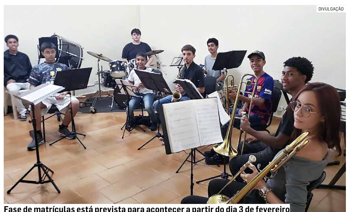
Fase de matrículas está prevista para acontecer a partir do dia 3 de fevereiro

Mais informações podem ser obtidas pelo e-mail polo.montemor@santamarcelinacultura.org.br, ou pelo telefone (19) 3879-6041.