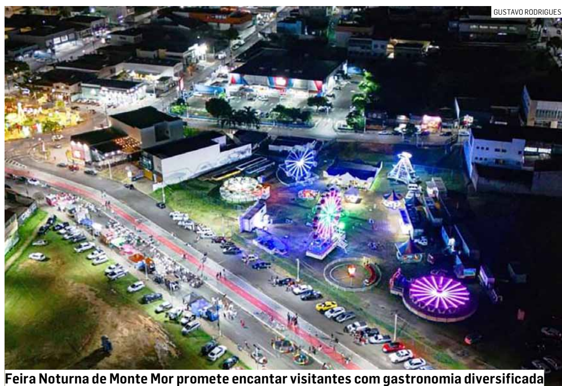
Feira Noturna de Monte Mor promete encantar visitantes com gastronomia diversificada