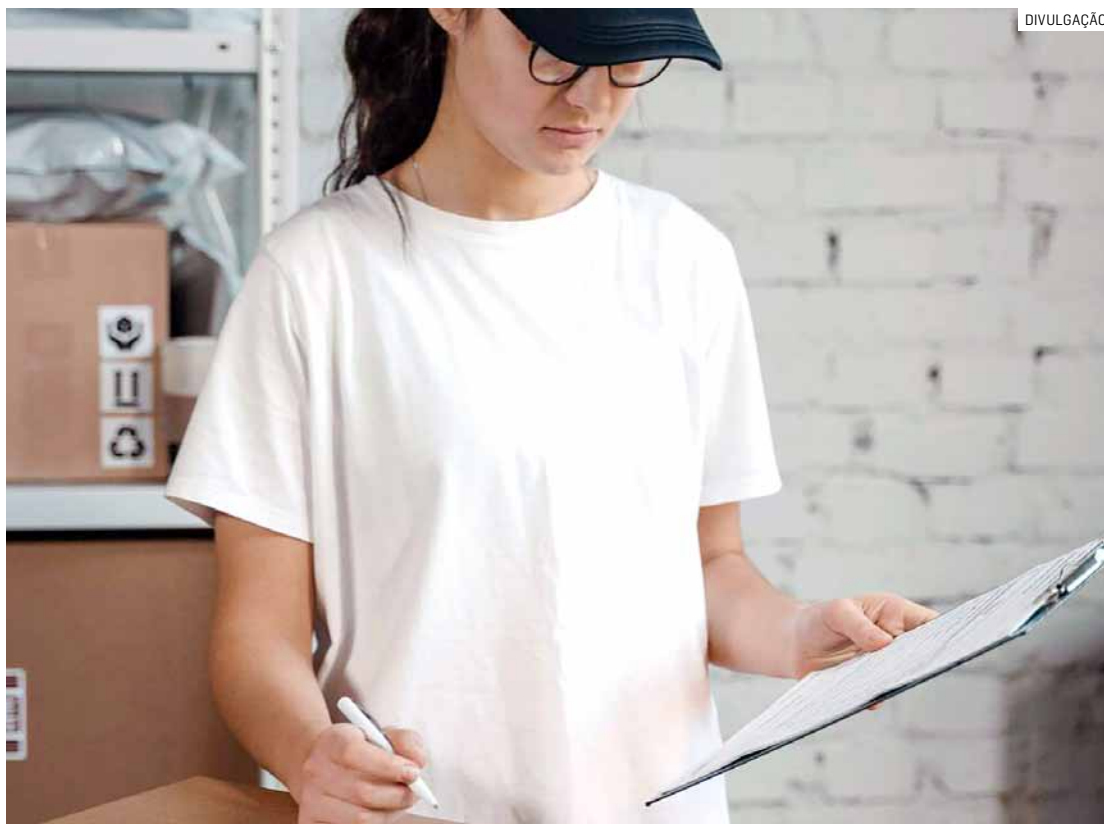
Formações em Assistente de Recursos Humanos e Auxiliar de Produção aceitam inscrições

A formação em Assistente de Recursos Humanos tem por objetivo desenvolver conhecimentos sobre atividades administrativas na área. Durante as aulas, os alunos aprendem