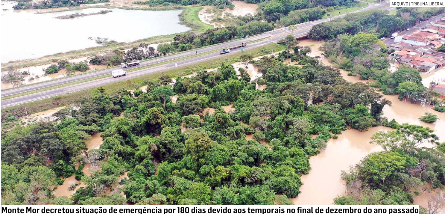
Monte Mor decretou situação de emergência por 180 dias devido aos temporais no final de dezembro do ano passado

Caixa autorizou que beneficiários do Bolsa Família saquem valores sem necessidade de seguir calendário escalonado de pagamentos; cidade está entre as mais prejudicadas por chuvas e eventos climáticos