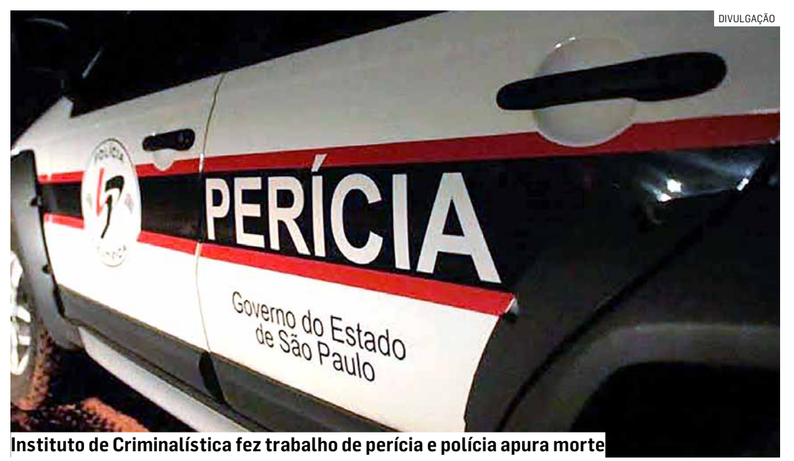
Instituto de Criminalística fez trabalho de perícia e polícia apura morte

O caso foi registrado no Plantão Policial de Hortolândia. As investigações devem ser conduzidas pelos investigadores do 1º DP (Distrito Policial).