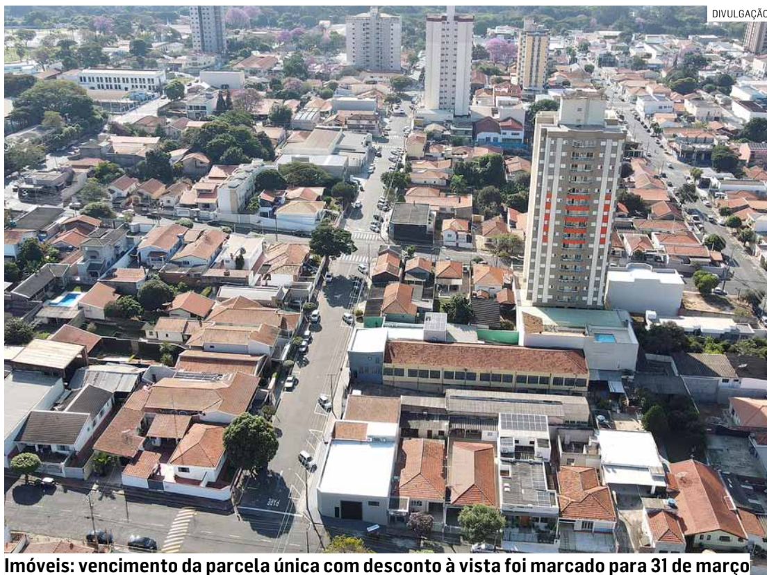
Imóveis: vencimento da parcela única com desconto à vista foi marcado para 31 de março

O decreto reajustando apenas pela inflação a Ta-