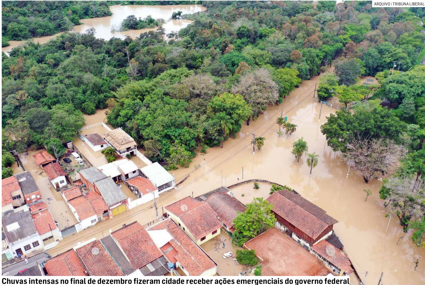
Chuvas intensas no final de dezembro fizeram cidade receber ações emergenciais do governo federal

Os beneficiários têm diversas opções para movimentar o valor do Bolsa Família. Pelo aplicativo CAIXA Tem, é possível realizar compras em estabelecimentos comerciais, pagar contas, fazer Pix e gerar token