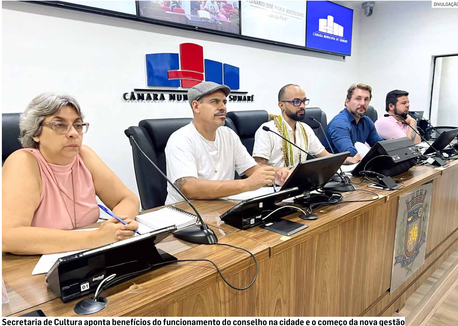
Secretaria de Cultura aponta benefícios do funcionamento do conselho na cidade e o começo da nova gestão

As discussões também incluíram políticas públicas de incentivo à cultura, como as Leis Aldir Blanc e