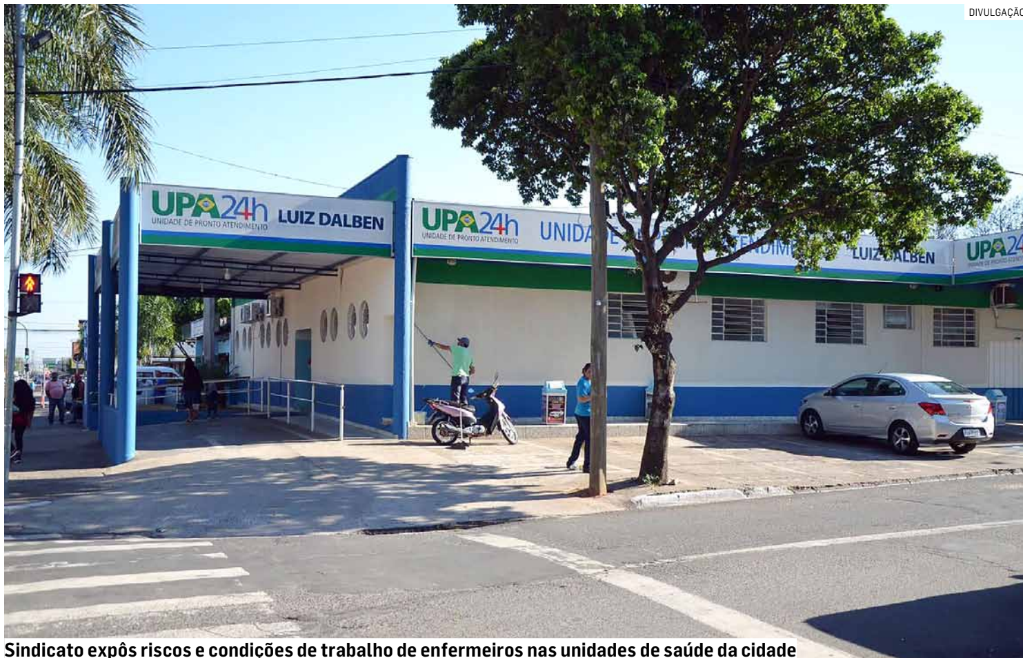
Sindicato expôs riscos e condições de trabalho de enfermeiros nas unidades de saúde da cidade

Esses números, segundo o sindicato, mostram a exposição enfrentada pelos trabalhadores, agravada pela superlotação de