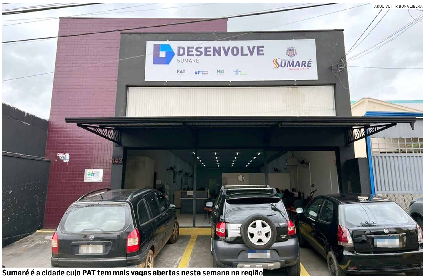
Sumaré é a cidade cujo PAT tem mais vagas abertas nesta semana na região

Em Sumaré, o PAT, vinculado à Secretaria de Desenvolvimento Econômico, disponibiliza 587 vagas em diferentes áreas. Os interessados devem comparecer ao posto, localizado na rua Justino França, 143, no Centro, portando documentos pessoais, comprovante de endereço e carteira de trabalho. O atendimento ocorre de segunda a sexta-feira, das 8h às 16h. Mais informações podem ser obtidas pelo telefone (19) 3803-3003. Entre as oportunidades disponíveis estão 130 vagas para Jovem Aprendiz (Produção), 300 vagas para Auxiliar de Logística (com diferentes níveis de esco-