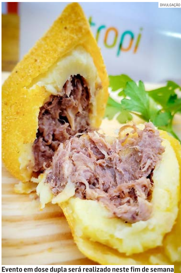
Evento em dose dupla será realizado neste fim de semana

Além disso, o Bier Brasil e o Festival da Coxinha têm como atrativos um amplo espaço kids para a diversão das crianças. No Shopping ParkCity Sumaré haverá jump, tiro ao alvo, pesca, brinquedos infláveis