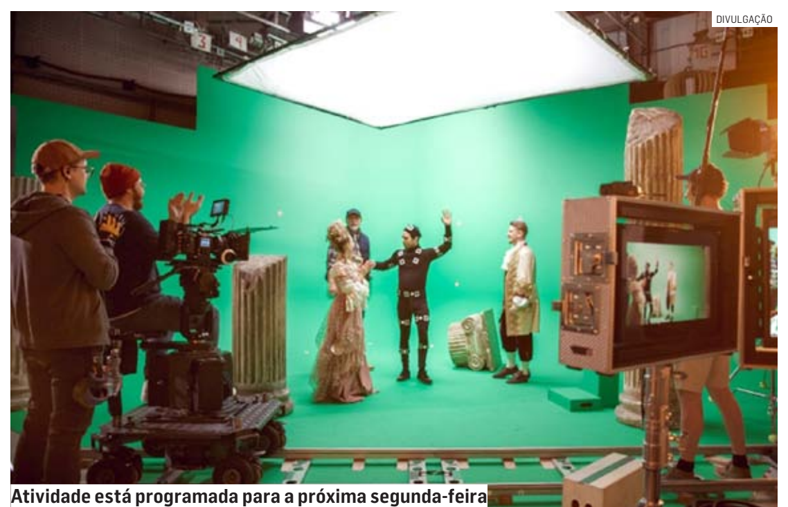
Atividade está programada para a próxima segunda-feira