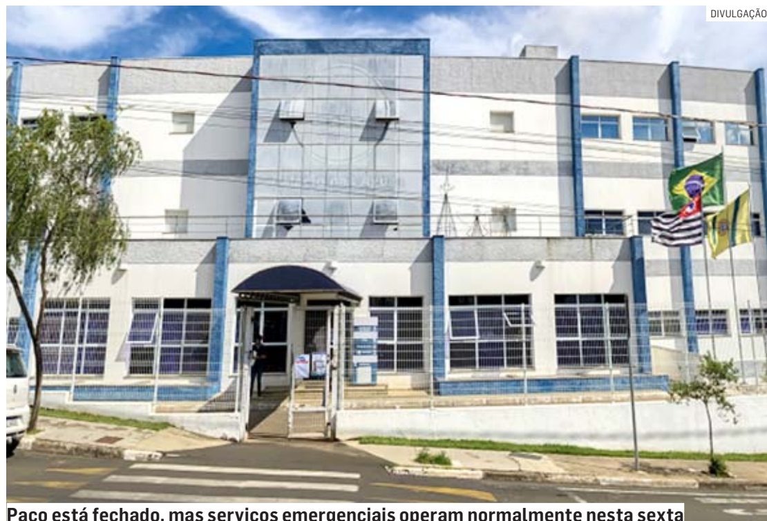
Paço está fechado, mas serviços emergenciais operam normalmente nesta sexta

Da Redação • HORTOLÂNDIA tribunaliberal@tribunaliberal.com.br