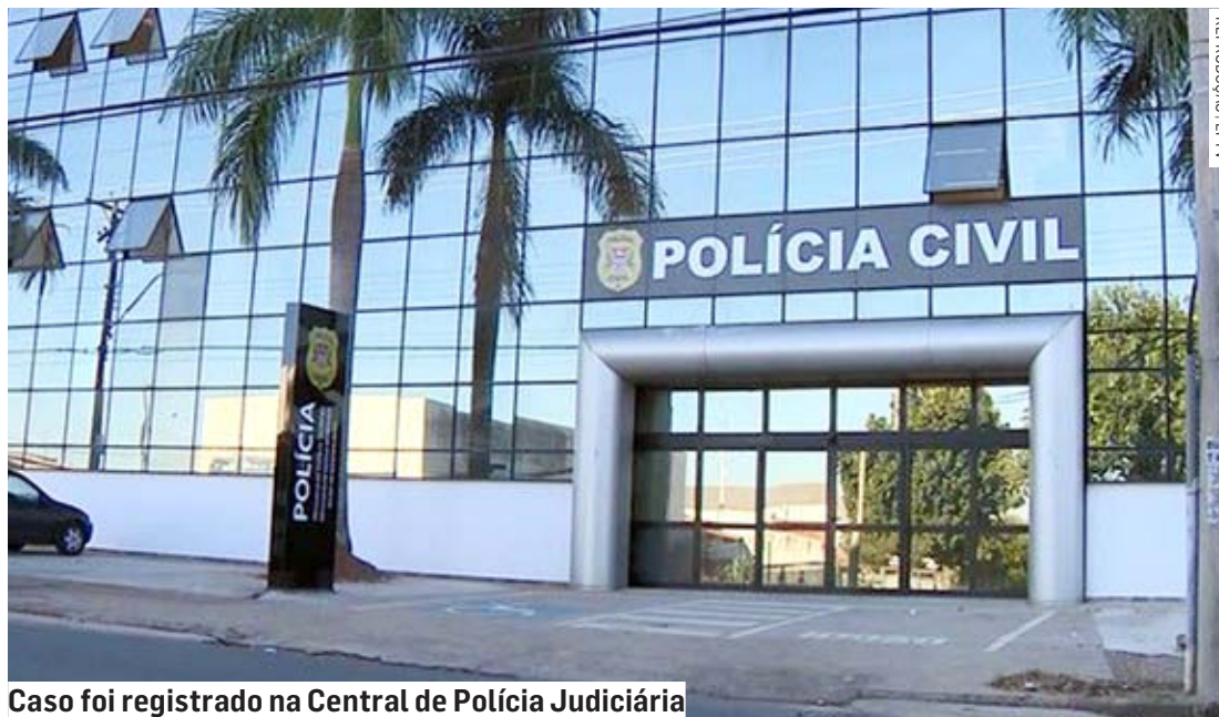
Caso foi registrado na Central de Polícia Judiciária

A mãe da criança relatou aos policiais que o vizinho tinha o hábito de abraçar e beijar a menina. A mãe disse