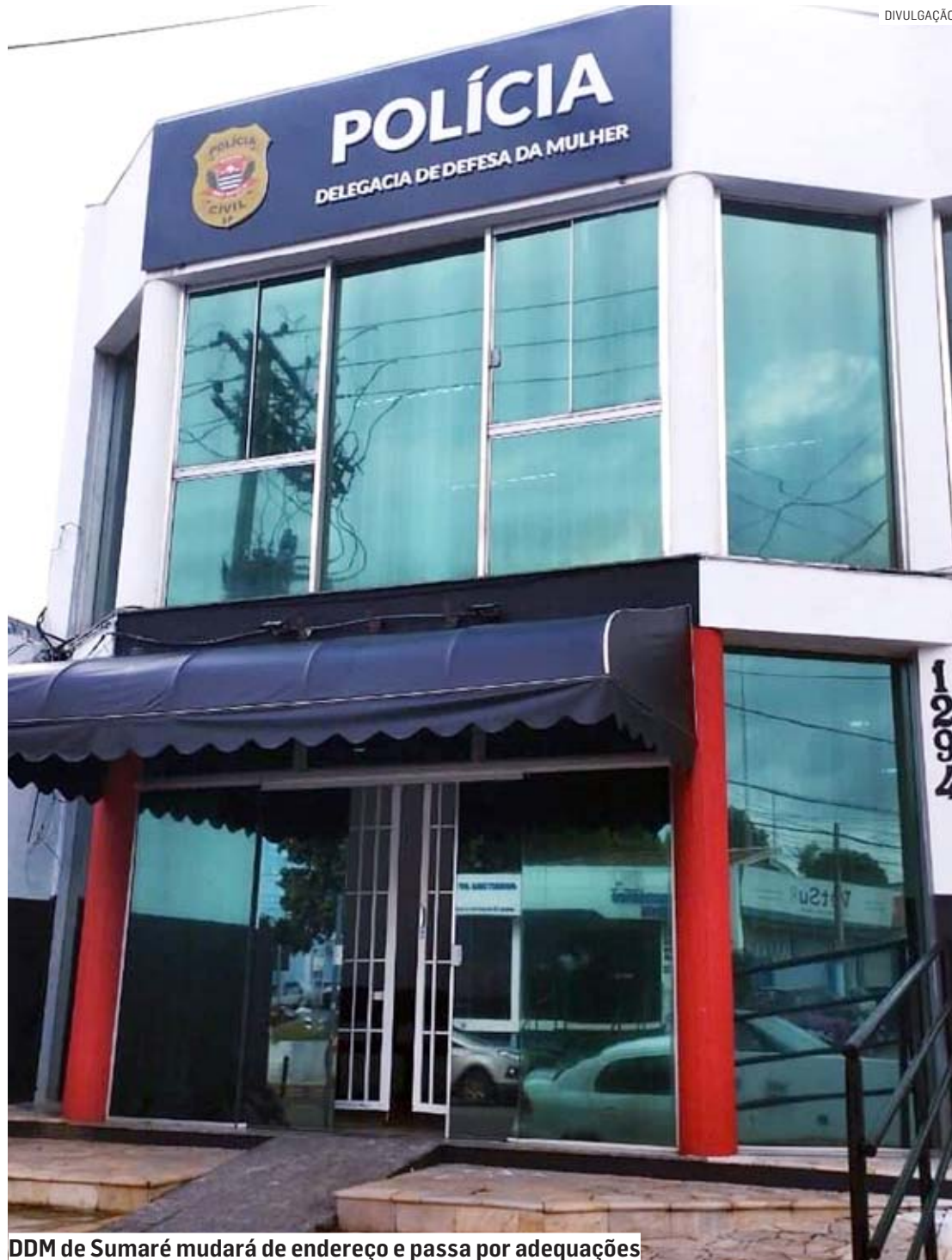
DDM de Sumaré mudará de endereço e passa por adequações

"O Estado de São Paulo é pioneiro na criação e aplicação de políticas públicas de combate à violência contra a mulher. A Secretaria de Segurança Pública de São Paulo oferece suporte físico e online a todas as vítimas de violência. São 140 unidades territoriais de Delegacia de Defesa da Mulher – sendo 11 24 horas –, além das DDMs on-line e das 77 salas DDM estrategicamente instaladas em plantões policiais nas quais as vítimas são atendidas por uma delegada mulher via video-