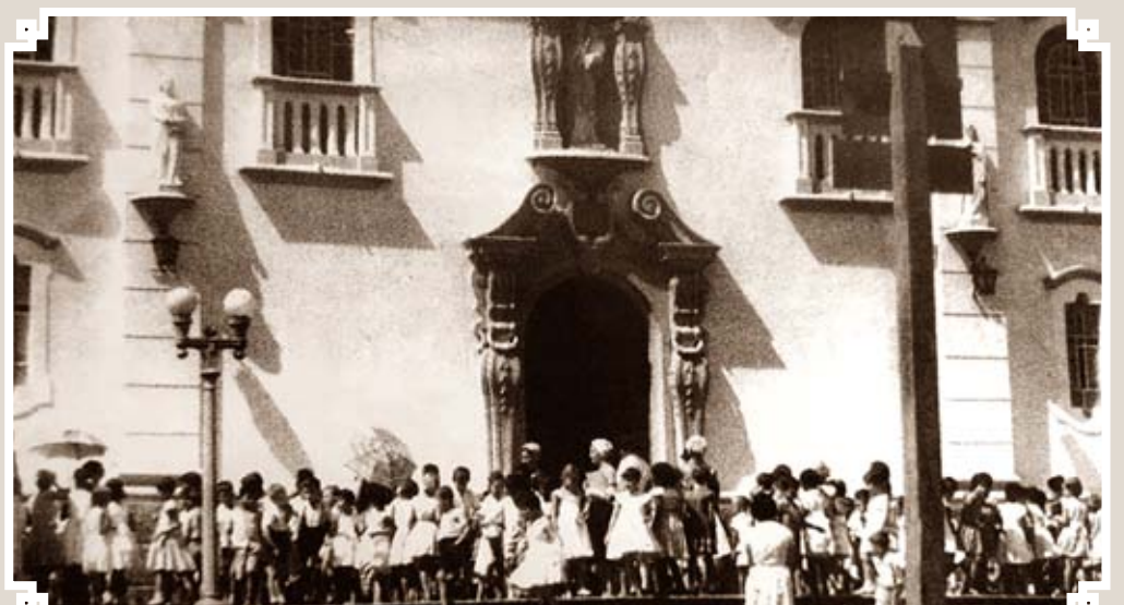
Foto de um domingo de 1959 mostrando crianças reunidas à frente da Igreja Matriz quando participavam das aulas de catecismo que sempre eram realizadas aos domingos e no recinto do prédio da igreja. Com podemos observar, as crianças estavam acompanhadas de suas professoras. Naquele ano o pároco da matriz era o Cônego Cyriaco Scaranello Pires, que valorizava muito essas atividades com crianças.