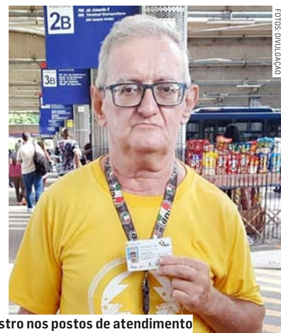
Passageiros devem fazer cadastro nos postos de atendimento