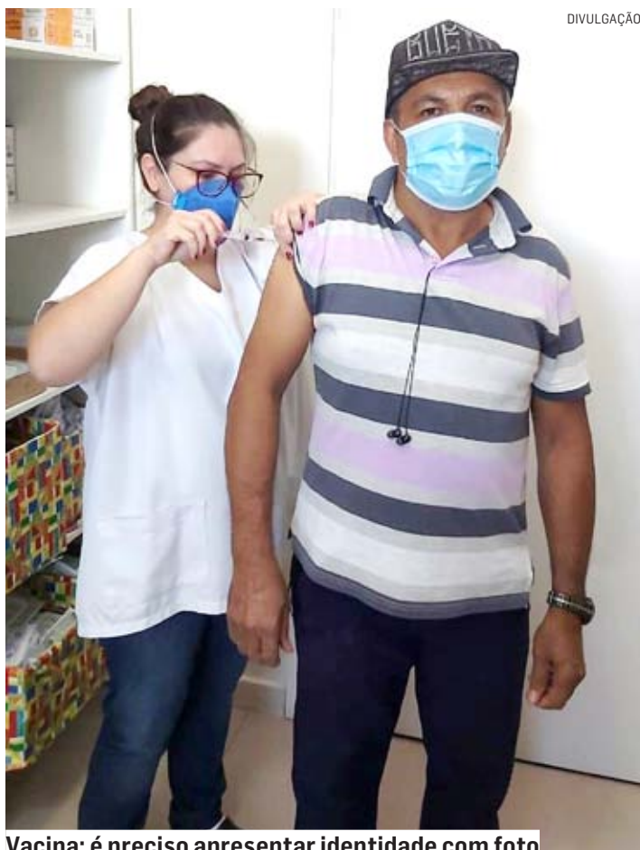
Vacina: é preciso apresentar identidade com foto

Nesta fase, estão incluídas crianças de seis meses até seis anos, gestantes, puérperas, trabalhadores da saúde, idosos com 60 anos ou mais, professores das escolas públicas e privadas, pessoas com doenças crônicas não transmissíveis e outras condições clíni-