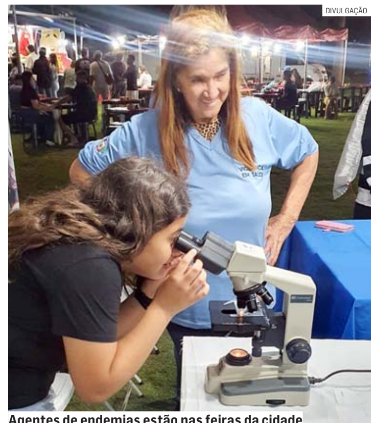
Agentes de endemias estão nas feiras da cidade

Até a próxima sexta-feira (28), os agentes de endemias estarão nas feiras livres, promovendo orientações preventivas, demonstração de larvas vivas, distribuição de informativos, maquete explicativa de uma casa com criadouros e oficinas in-