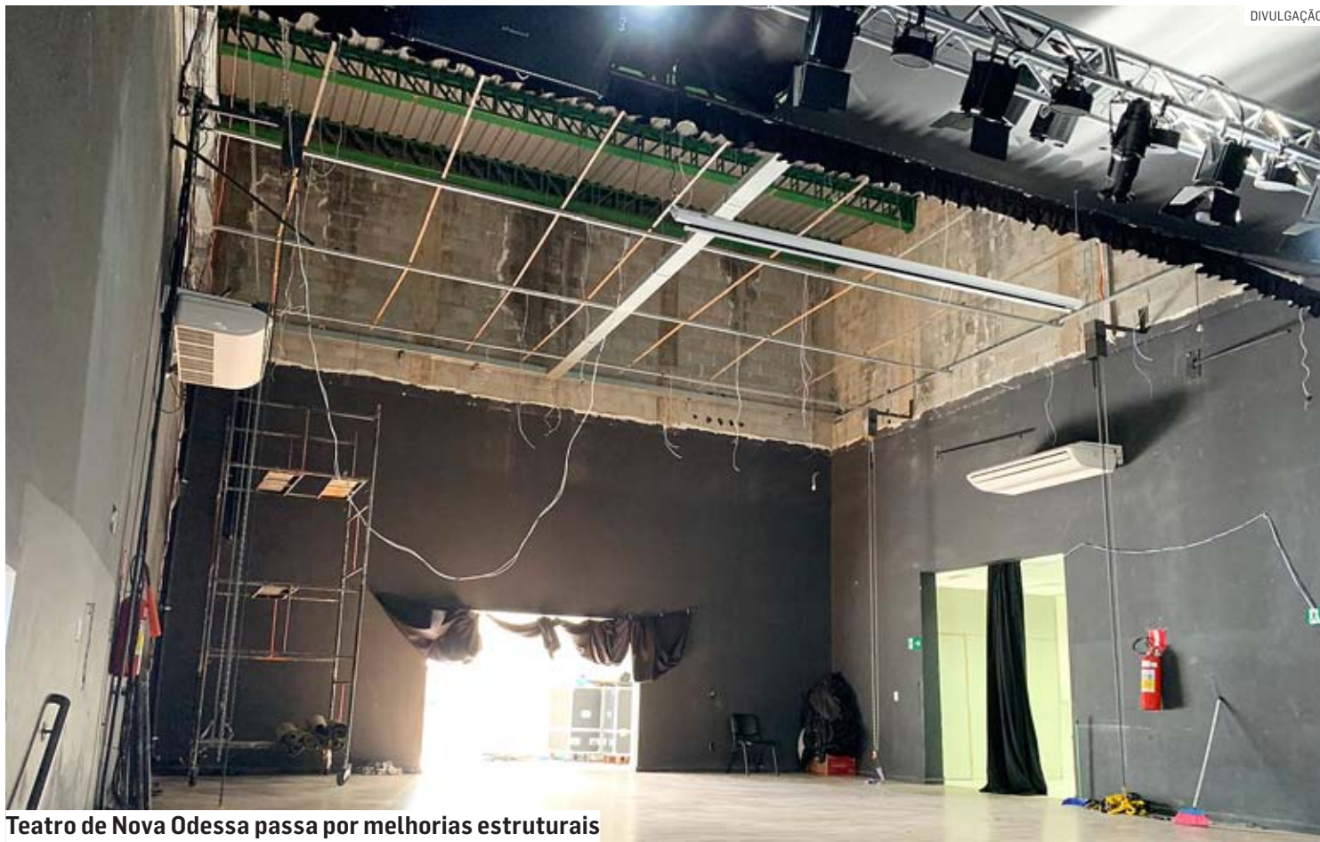
Teatro de Nova Odessa passa por melhorias estruturais

Inaugurado em junho de 2016, o Teatro Municipal recebe anualmente dezenas de peças, apresentações artísticas e eventos oficiais. A reforma atualmente visa readaptar as instalações e corrigir alguns problemas internos e externos da estrutura, identificados pelos engenheiros da Secretaria de Obras. O prédio jamais havia passado por uma reforma.