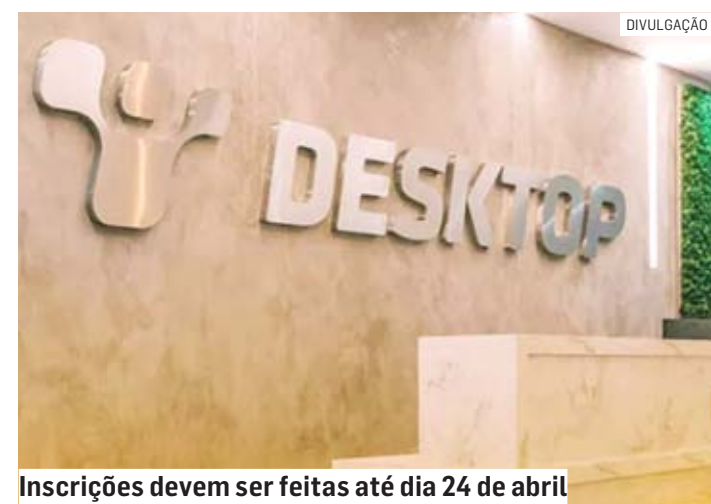
Inscrições devem ser feitas até dia 24 de abril

Os interessados em se candidatar devem acessar o seguinte link: https://prd-pc1.lg.com.br/Vagas . O prazo para realizar a inscrição encerra na próxima segunda-feira (24).