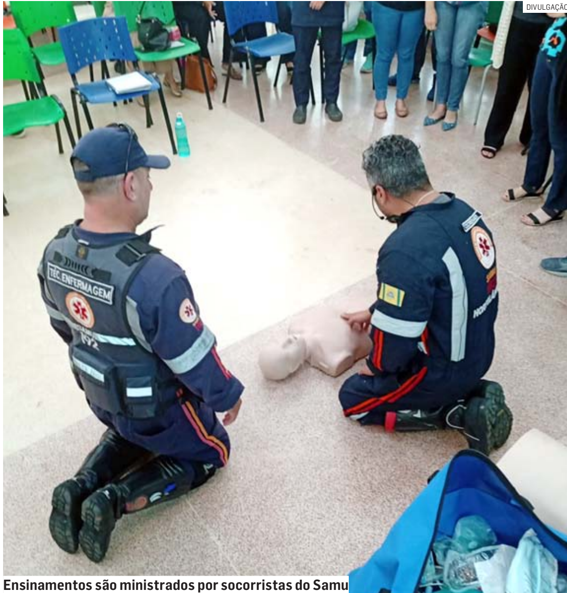
Ensinos são ministrados por socorristas do Samu

Ao perceber a situação, ela executou a Manobra