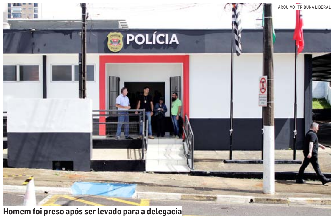
Homem foi preso após ser levado para a delegacia

Foi dada voz de prisão ao homem, que acabou conduzido para a Delegacia de Polícia de Monte Mor. Ele foi preso e ficou à disposição da justiça.