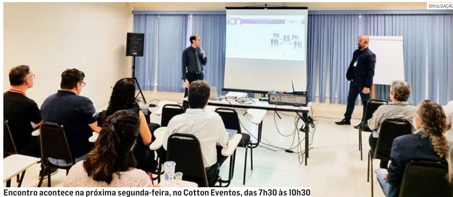
Encontro acontece na próxima segunda-feira, no Cotton Eventos, das 7h30 às 10h30

Paulo Medina • SUMARÉ paulo.medina@tribunaliberal.com.br