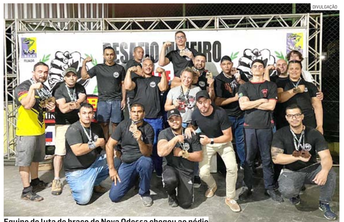
Equipe de luta de braço de Nova Odessa chegou ao pódio