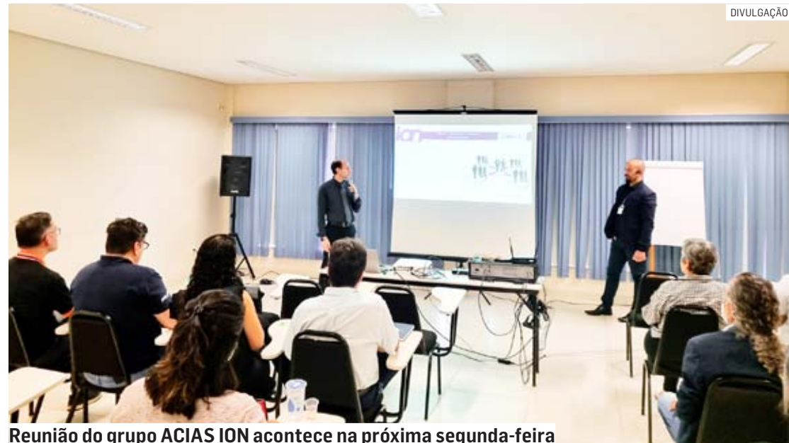
Reunião do grupo ACIAS ION acontece na próxima segunda-feira