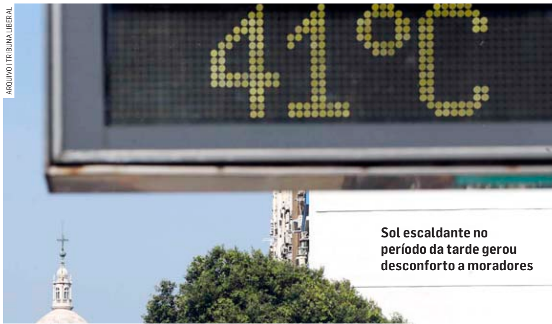
Sol escaldante no período da tarde gerou desconforto a moradores