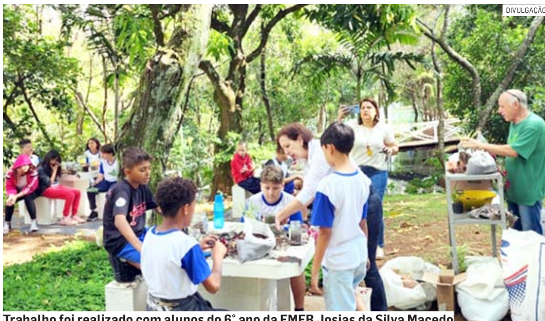
Trabalho foi realizado com alunos do 6º ano da EMEB Josias da Silva Macedo