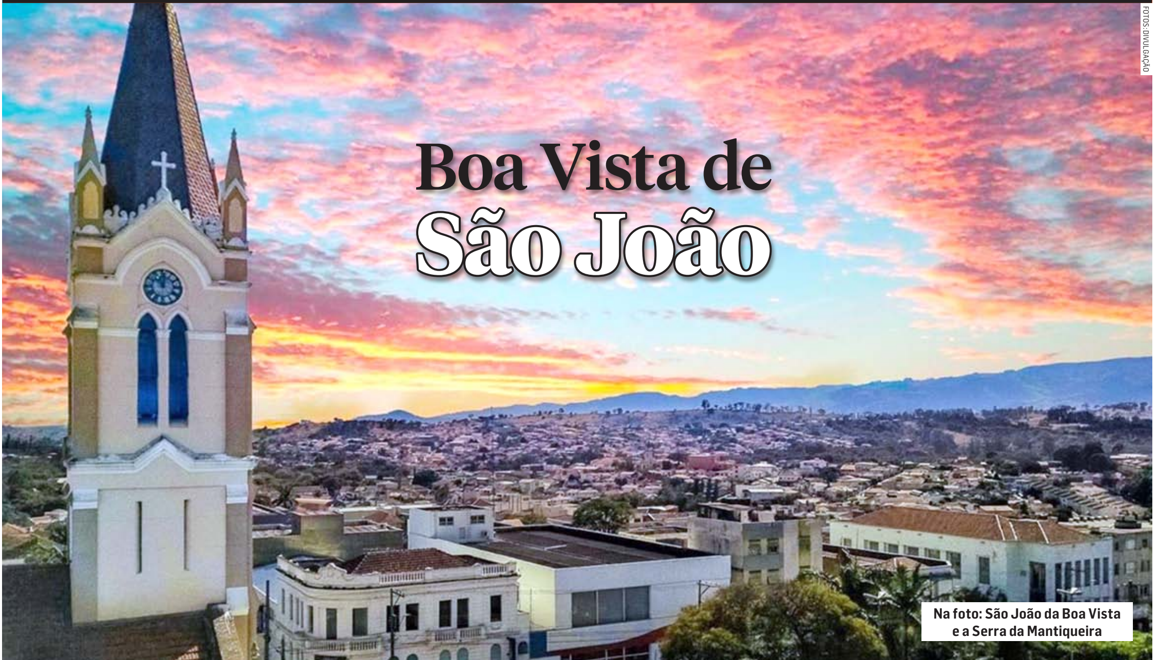
Na foto: São João da Boa Vista e a Serra da Mantiqueira

Para se distinguir de outras cidades com nome semelhante, foram buscar algo que condiz com a ci-