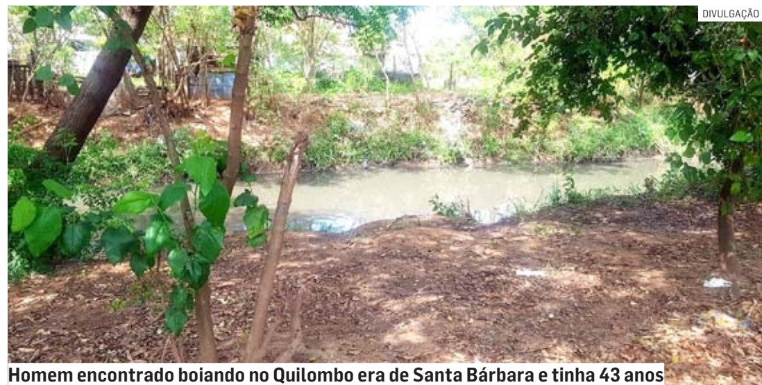
Homem encontrado boiando no Quilombo era de Santa Bárbara e tinha 43 anos

A polícia agora apura a causa da morte que ainda é desconhecida. Exames periciais deverão apontar as causas do óbito. Foi constatado que a vítima tinha um ferimento na cabeça, que ainda está sendo averiguado. As investigações prosseguem com a Polícia Civil.