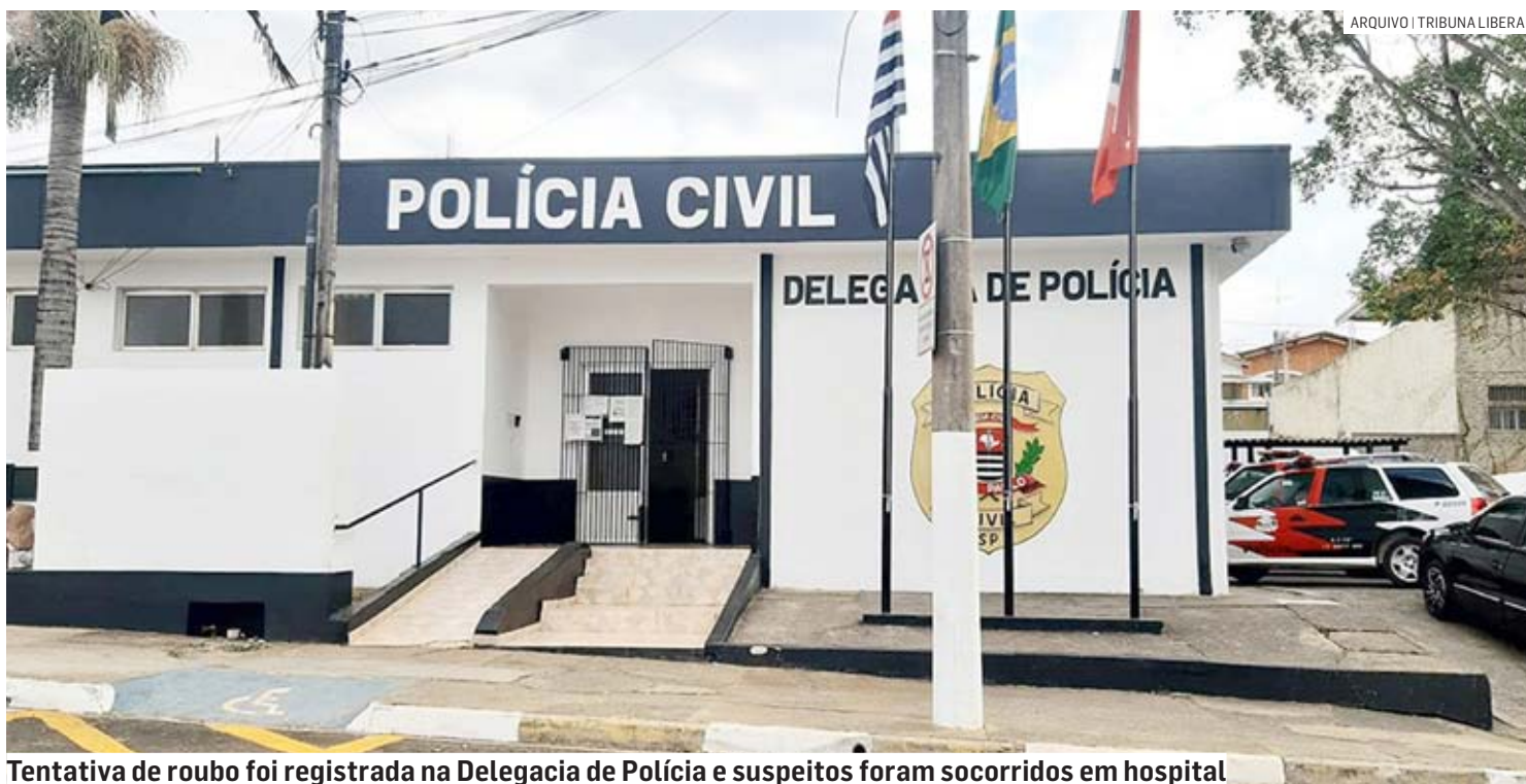
Tentativa de roubo foi registrada na Delegacia de Polícia e suspeitos foram socorridos em hospital

De acordo com a ocorrência, a Polícia Militar foi acionada para atender ao roubo de uma motocicleta. No local, a vítima e familiares haviam imobilizado os bandidos que estavam com ferimentos ocasionados por disparo de arma de fogo. Aos policiais, a vítima informou que estava na chácara comemorando o aniversário do pai, e quando estava indo embo-