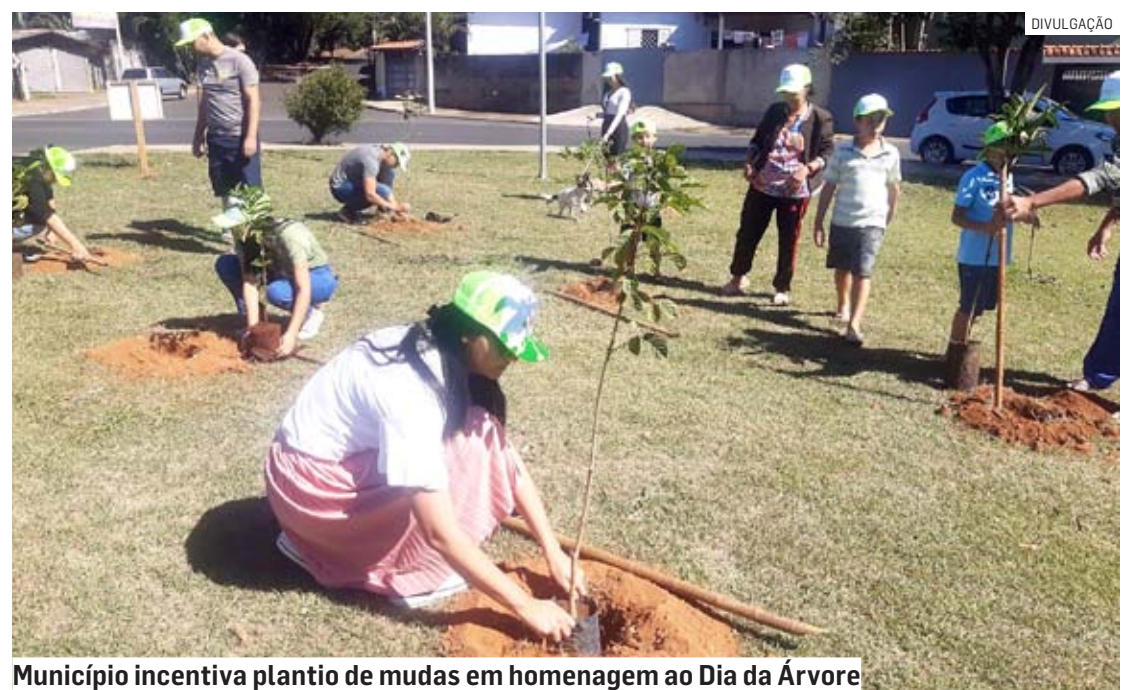
Município incentiva plantio de mudas em homenagem ao Dia da Árvore

Outra ação para celebrar o Dia da Árvore em Nova Odessa está prevista para esta quarta-feira (20). A Secretaria Municipal de Meio Ambiente fará o plantio de diversas mudas atrás da Igreja Matriz, no Centro da cidade.