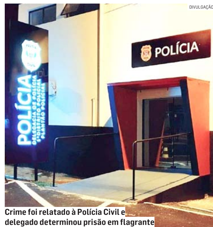
Crime foi relatado à Polícia Civil e delegado determinou prisão em flagrante

Segundo informações, a equipe da PM foi acionada para atender uma ocorrência de violência doméstica pelo bairro Portal Bordon I. Já no local, os policiais se depararam com a mulher agredida. Ela estava sentada no meio fio com panos cobrindo dois cortes, um na cabeça e outro no braço direito. Ao ser questionada, a vítima informou que foi agredida pelo namorado dela com uma faca, e que ele havia fugido e estava em um bar.