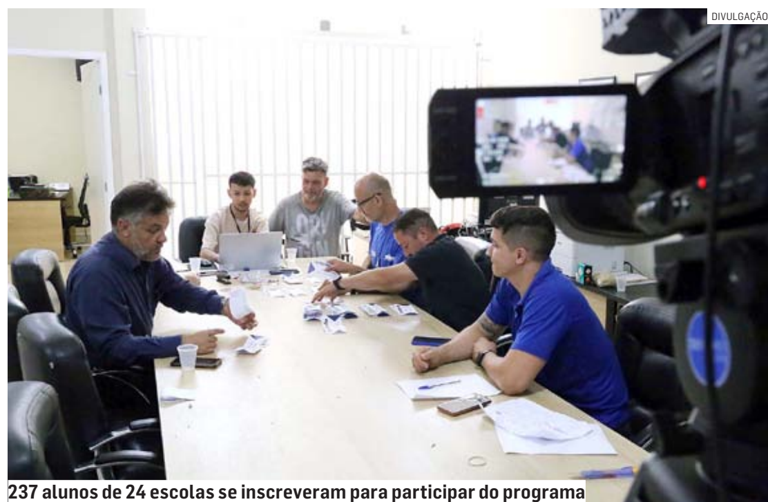
237 alunos de 24 escolas se inscreveram para participar do programa

Da Redação • SUMARÉ tribunaliberal@tribunaliberal.com.br