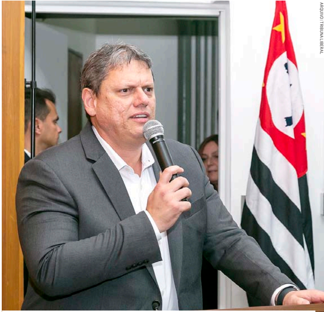
Tarcísio de Freitas aprovou a realização de estudo para parcerias com a iniciativa privada

Após qualificação, Governo do Estado fará levantamentos a serem contratados para avaliar viabilidade da medida e pesquisará modelos de negócio para estruturação; ao todo, são 146 unidades em SP, sendo que 111 estão ativas