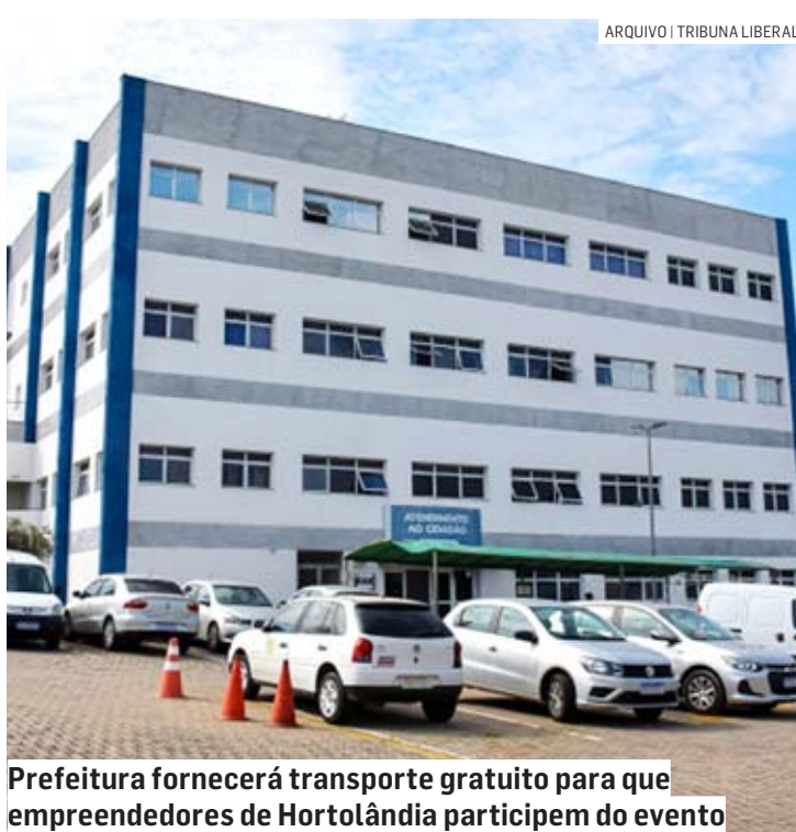
Prefeitura fornecerá transporte gratuito para que empreendedores de Hortolândia participem do evento

A Feira acontecerá no São Paulo Expo, em São Paulo, entre os dias 16 e 19