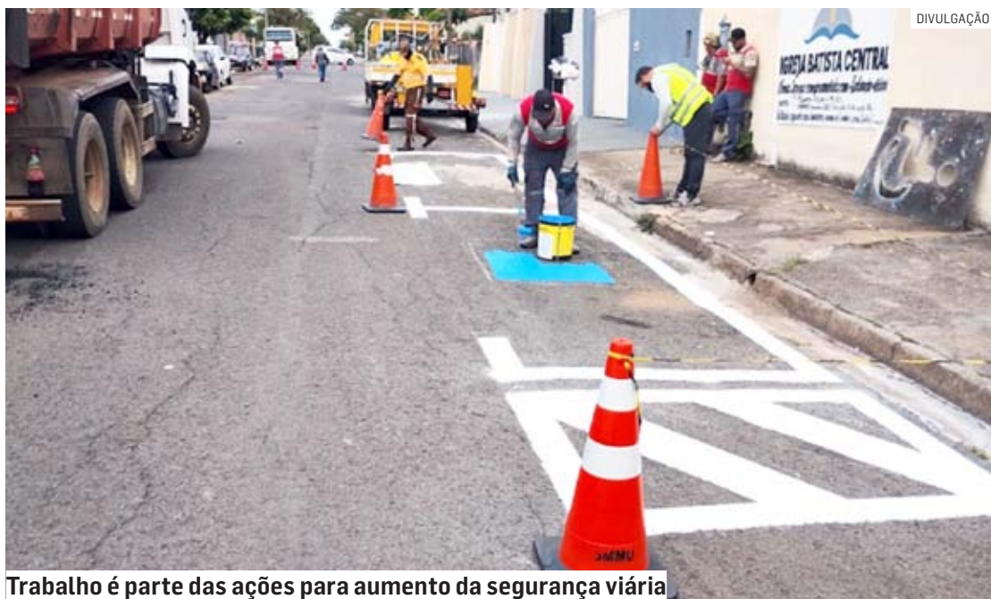
Trabalho é parte das ações para aumento da segurança viária

De acordo com a Secretaria de Mobilidade Urbana, mais de 18 mil quilômetros quadrados de sinalização de solo já foram implantados ou repintados. O serviço também é