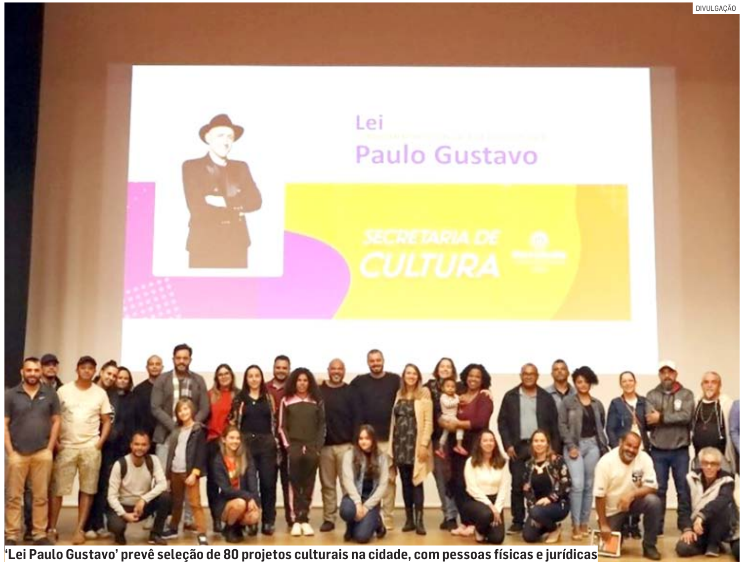
'Lei Paulo Gustavo' prevê seleção de 80 projetos culturais na cidade, com pessoas físicas e jurídicas

versos. Nesta categoria, poderão concorrer 32 projetos da área musical, teatro, arte circense, danças, artes plásticas e visuais, arte urbana, literatura, além de manifestações culturais tradicionais e populares, como a cultura caipira, regional, dos povos indígenas ou para valorização da matriz africana e da população quilombola. Os projetos culturais deste segmento deverão ser apresentados com descrição das atividades, destinação do público-alvo, título, cronograma das ações, planilha dos custos previstos, além de uma ficha técnica dos integrantes do projeto.