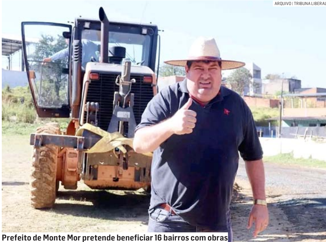
Prefeito de Monte Mor pretende beneficiar 16 bairros com obras

O projeto que tramita na Câmara de Vereadores autoriza o Poder Executivo a contratar um empréstimo de até R$ 40 milhões com o Banco do Brasil S.A. O objetivo desse financiamento é impulsionar projetos de infraestrutura viária em diversos bairros, bem como modernizar a frota de veículos municipais e adquirir máquinas e equipamentos para melhorias na cidade.