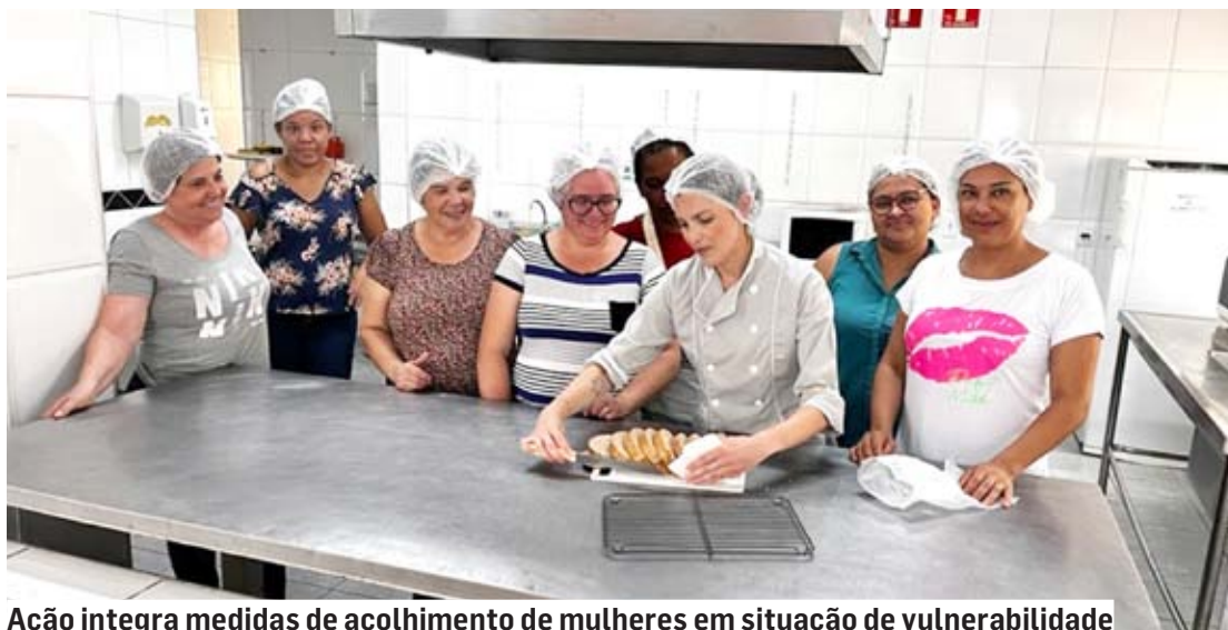
Ação integra medidas de acolhimento de mulheres em situação de vulnerabilidade

A formação para produção dos produtos fitness de panificadora teve início no dia 11 de setembro. Realizado pela manhã, o curso foi