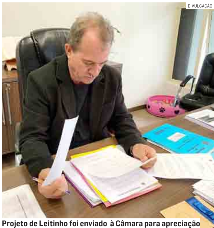
Projeto de Leitinho foi enviado à Câmara para apreciação

O prefeito Cláudio José Schooder, o Leitinho, anunciou nesta sexta-feira (19) uma nova edição do RefisNO (Programa de Recuperação Fiscal de Nova Odessa). Projeto de Lei de autoria do prefeito com as regras do programa foi protocolado na Câmara de Vereadores, para apreciação e aprovação dos parlamentares. A previsão do PL é que o prazo de adesão comece em 03 de outubro e prossiga até o final de novembro, com descontos de até 95% em juros e multas.