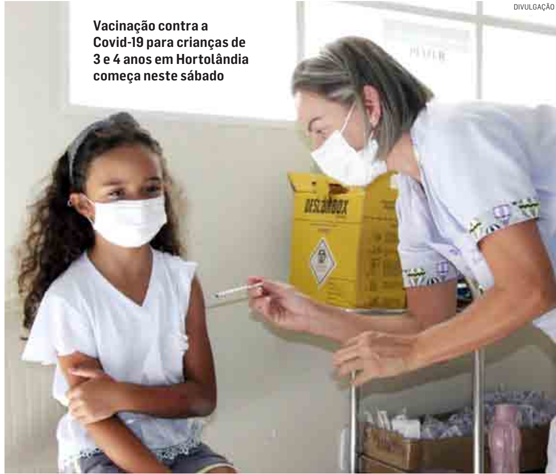
Vacinação contra a Covid-19 para crianças de 3 e 4 anos em Hortolândia começa neste sábado

Doses foram disponibilizadas nesta sexta-feira pela Diretoria Regional de Saúde; Hortolândia e Paulínia iniciam a imunização hoje, Sumaré começa na segunda-feira e Monte Mor toda quinta a partir do dia 25