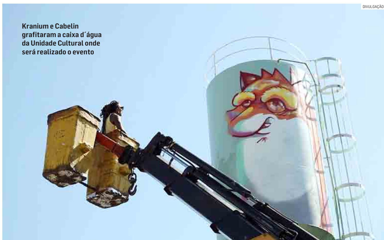
Kranium e Cabelin grafitarão a caixa d'água da Unidade Cultural onde será realizado o evento

Nesta semana, Kranium e Cabelin grafitarão a caixa d'água da Unidade Cultural onde será realizado o evento. Agora, os desenhos de uma arara e uma raposa dão vida ao topo do reser-