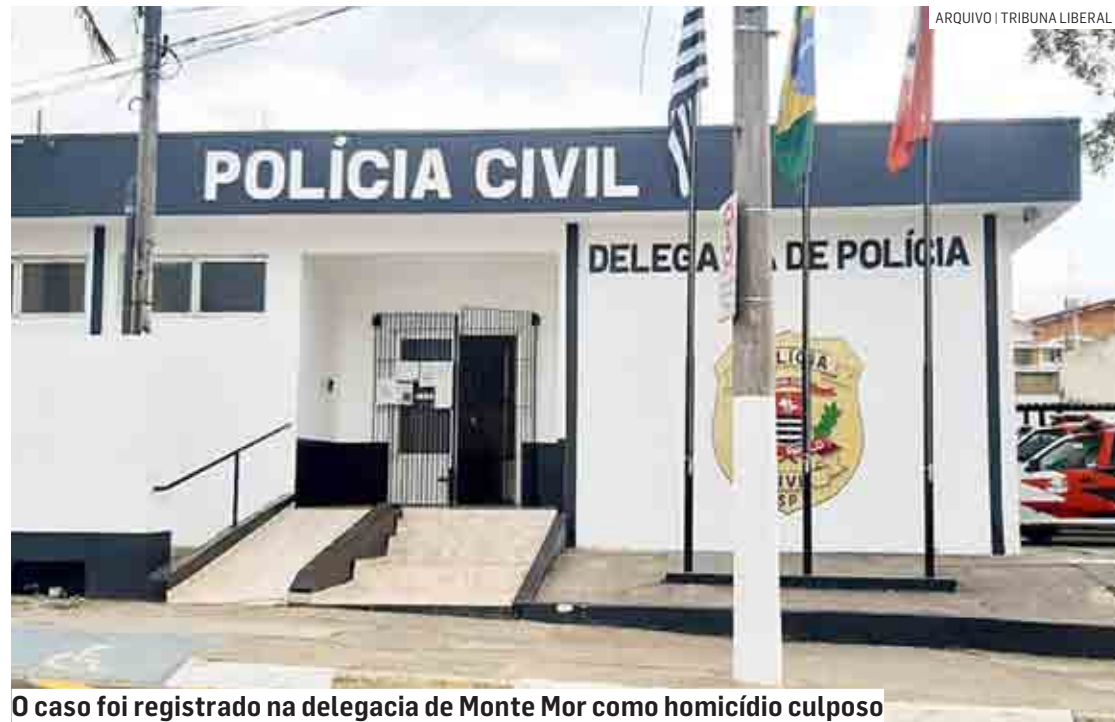
O caso foi registrado na delegacia de Monte Mor como homicídio culposo

Acidente aconteceu na manhã de sexta-feira, na altura do Km 22, sentido Oeste; motorista do veículo que atingiu a vítima fugiu sem prestar socorro