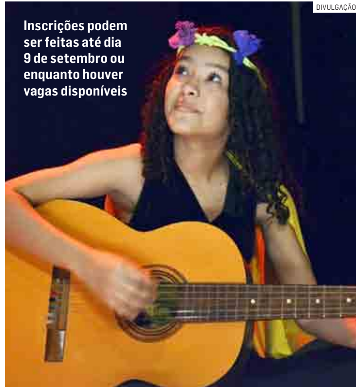
Inscrições podem ser feitas até dia 9 de setembro ou enquanto houver vagas disponíveis

Os cursos são ministrados em quatro unidades culturais e em sete ór-