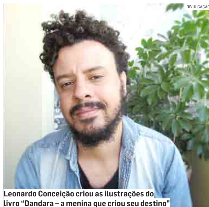
Leonardo Conceição criou as ilustrações do livro "Dandara – a menina que criou seu destino"

O livro "Dandara – a menina que criou seu destino", lançado no final de 2021 tem o patrocínio da PPG pela Lei de Incentivo à Cultura, do Ministério do Turismo através da Secretaria Especial da Cultura, Programa Nacional de Apoio à Cultura (PRONAC).