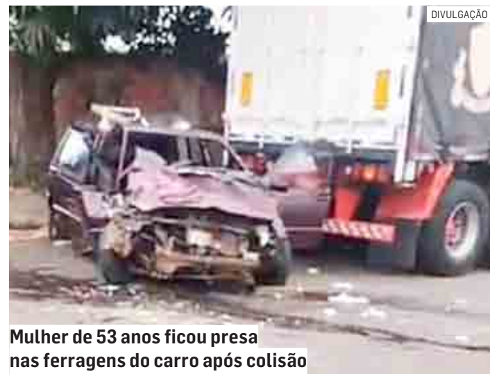
Mulher de 53 anos ficou presa nas ferragens do carro após colisão

O Samu (Serviço de Atendimento Móvel de Urgência) e a Polícia Militar também estiveram no local. A ocorrência foi registrada na delegacia da cidade.