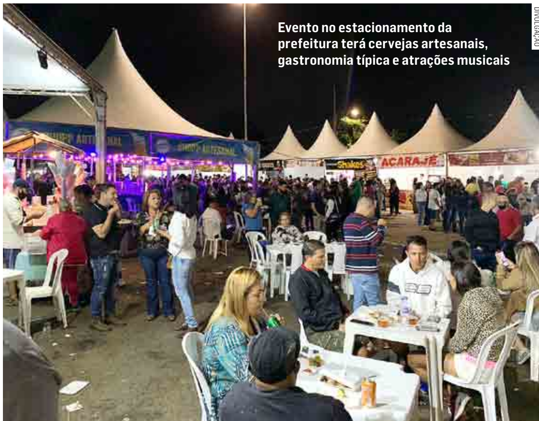
Evento no estacionamento da prefeitura terá cervejas artesanais, gastronomia típica e atrações musicais

“Nossa ideia é, através de encontros e outros eventos como esse, trazer para a cidade a oportunidade de entretenimento e o fomento ao Turismo, com oportunidades para que as pessoas tenham