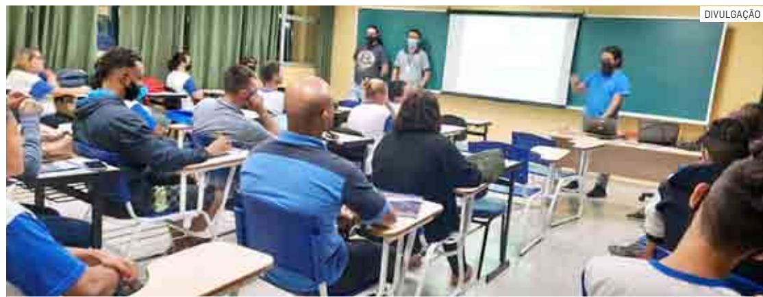
Projeto-piloto beneficia 25 alunos do polo existente na Emef Caio Fernando Gomes Pereira

A aula inaugural aconteceu na noite de segunda-feira (15), no campus Hortolândia. Dos participantes, 17 estão matriculados no curso de Usinagem - Torneiro Mecânico e 8 no de Informática. Os alunos contarão com toda a estrutura e benefícios do Instituto Federal, incluindo a utilização dos espaços e materiais, bem como a retira-