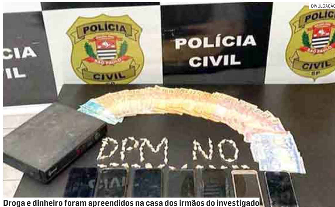
Droga e dinheiro foram apreendidos na casa dos irmãos do investigado

O canil da Guarda Civil Municipal apoiou a operação, e com o auxílio do cão, foram localizados 69