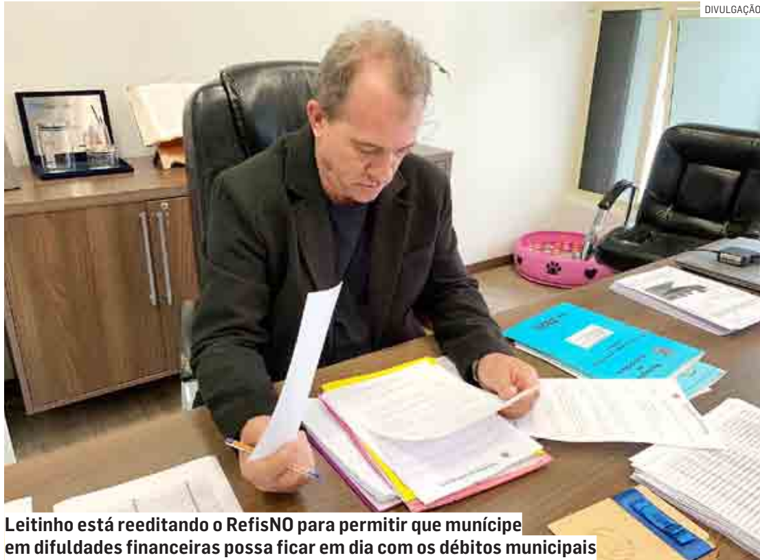
Leitinho está reeditando o RefisNO para permitir que município em dificuldades financeiras possa ficar em dia com os débitos municipais

Através do RefisNO 2022, pessoas físicas ou pessoas jurídicas (empresas) poderão ter até 95%