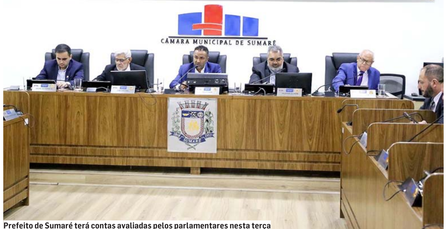
Prefeito de Sumaré terá contas avaliadas pelos parlamentares nesta terça