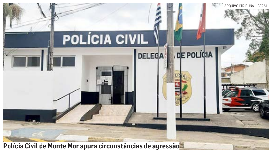
Polícia Civil de Monte Mor apura circunstâncias de agressão

A ocorrência foi registrada no Plantão Policial de Monte Mor, onde as circunstâncias que levaram à agressão serão investigadas.