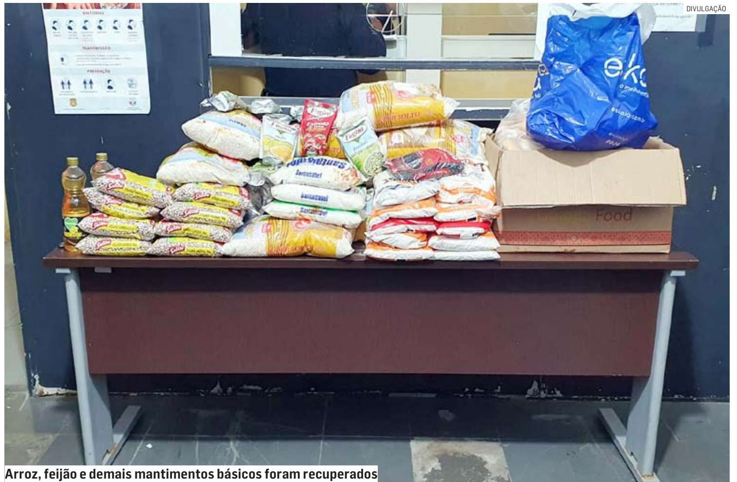
Arroz, feijão e demais mantimentos básicos foram recuperados

Todos os alimentos apreendidos foram entregues para a representante da escola, que esteve na delegacia.