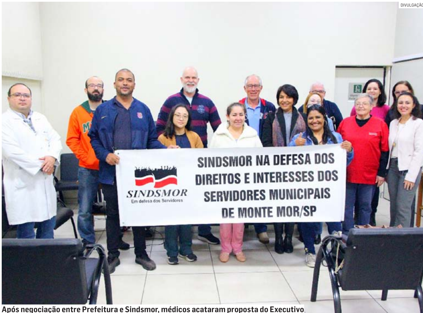
Após negociação entre Prefeitura e Sindsmor, médicos acataram proposta do Executivo

“Assembleia acabou neste momento e por unanimidade dos presentes aceitaram a proposta da Prefeitura que reajusta o salário base dos médicos em 50% em duas vezes, 30% agora, e 20% em outubro. Uma conquista sem precedentes para a categoria e que eleva o salário à média paga na re-