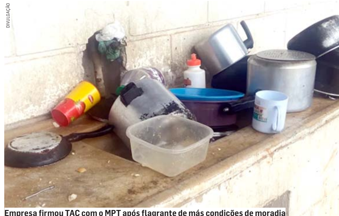
Empresa firmou TAC com o MPT após flagrante de más condições de moradia

Da Redação • ELIAS FAUSTO tribunaliberal@tribunaliberal.com.br