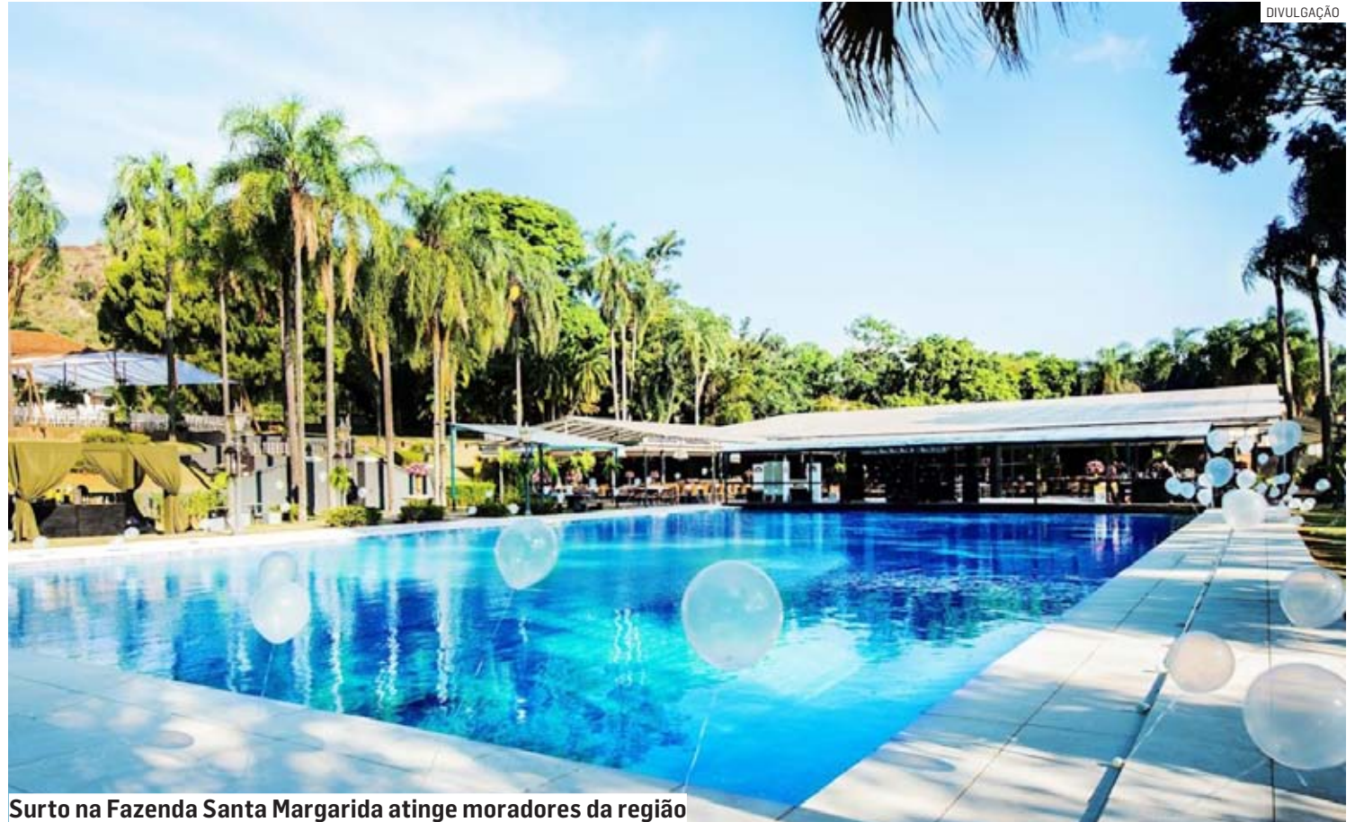
Surto na Fazenda Santa Margarida atinge moradores da região

As medidas incluem publicação de decreto com regras para estabelecimentos que realizam eventos para grandes públicos em áreas de risco; reforço nas informações para médicos e outros profissionais de saúde; vídeos educativos para ampla publicação; reforço nas ações de comunicação, informação e mobilização contra a fe-