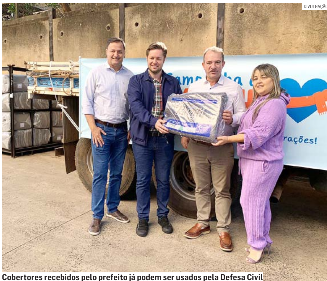
Cobertores recebidos pelo prefeito já podem ser usados pela Defesa Civil

“É uma alegria receber esses itens, ainda mais produzidos por uma empresa que é da nossa cidade. O Estado nos presenteou com estes 200 cobertores para aquecermos quem tem frio