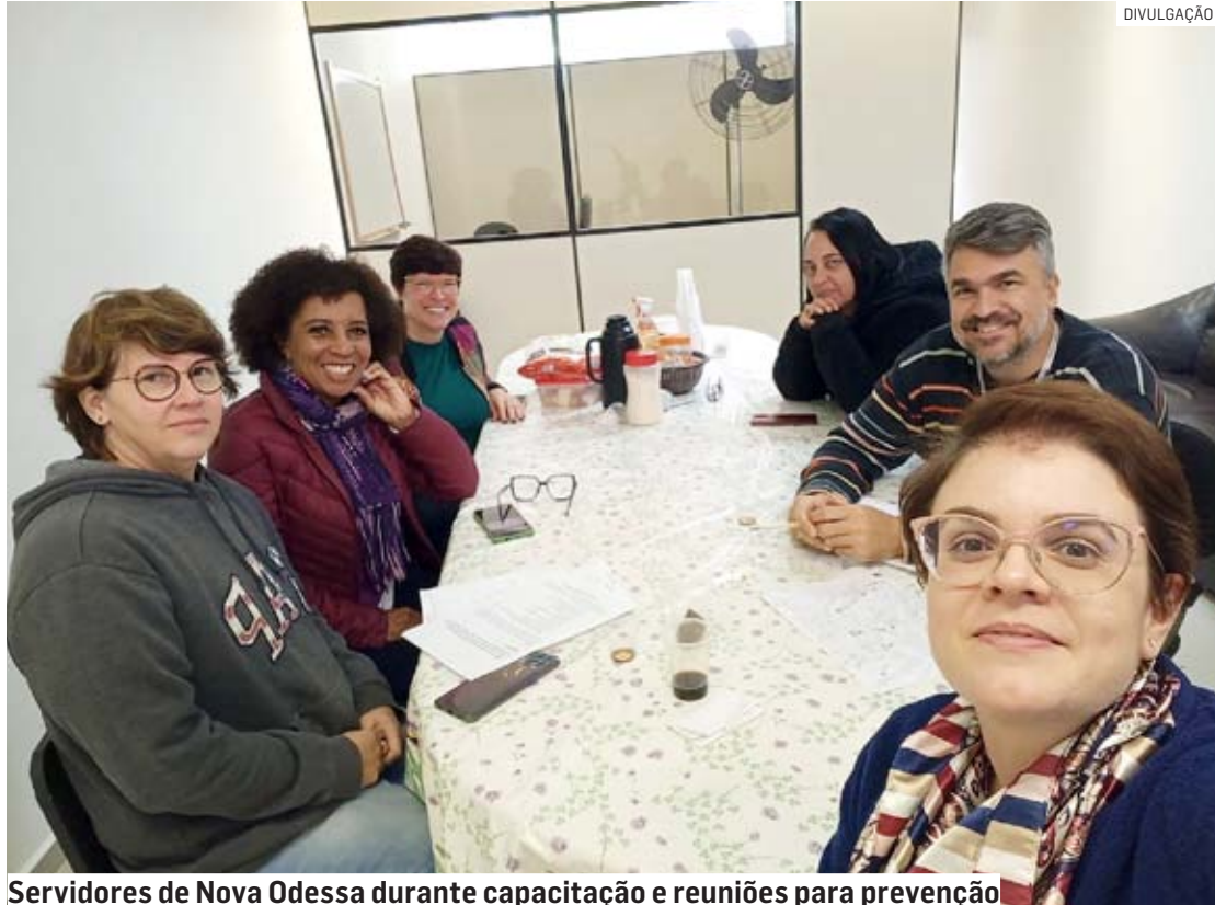
Servidores de Nova Odessa durante capacitação e reuniões para prevenção

“Além do reforço na sinalização das áreas de risco, estamos reforçando também o treinamento das equipes médica e de enfermagem da rede, quanto à atenção aos sintomas e, principalmente, para questionar o paciente febril para saber se ele esteve em uma área de risco