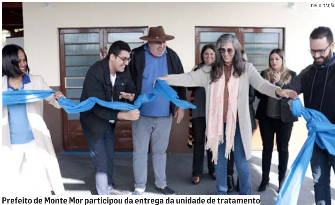
Prefeito de Monte Mor participou da entrega da unidade de tratamento

“O complemento da atuação da AMAAH-SP, para Monte Mor, para as pessoas que tanto precisam