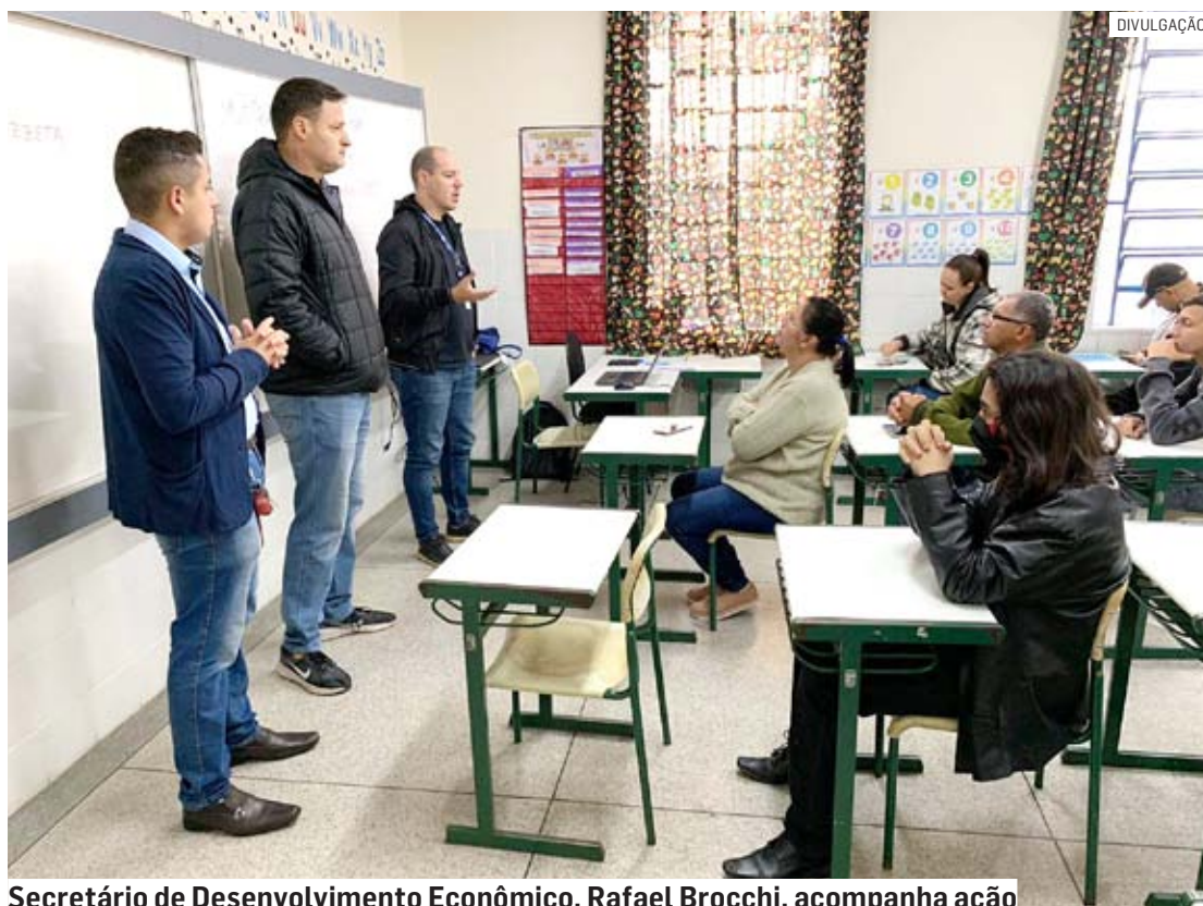
Secretário de Desenvolvimento Econômico, Rafael Brocchi, acompanha ação

Estão sendo oferecidas oportunidades de estágio para jovens de 14 a 24 anos que cursam ou tenham o Ensino Médio concluído. O evento é promovido pe-