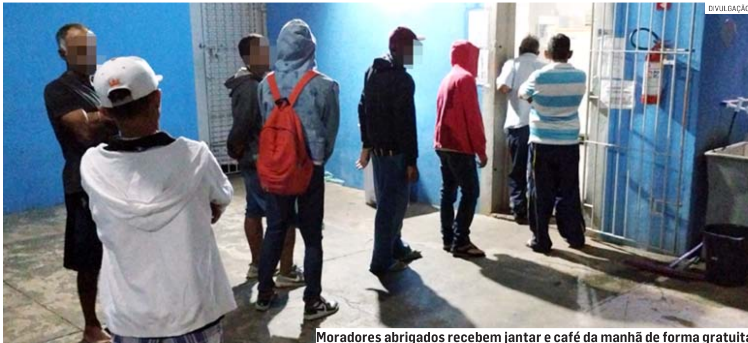
Moradores abrigados recebem jantar e café da manhã de forma gratuita

A Casa de Passagem é um abrigo localizado na