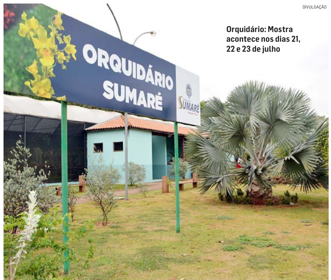
Orquidário: Mostra acontece nos dias 21, 22 e 23 de julho

No ano passado, o Orquidário passou por uma ampla reforma, promovida pela Prefeitura, com a pintura geral do prédio, manutenção da cobertura e adequações na estrutura que serve de apoio para a exposição das orquídeas, como mesas e prateleiras, além do replantio de alguns exemplares. Além disso, houve a retomada das atividades no local, que estava com as açoes suspensas devido à pandemia.