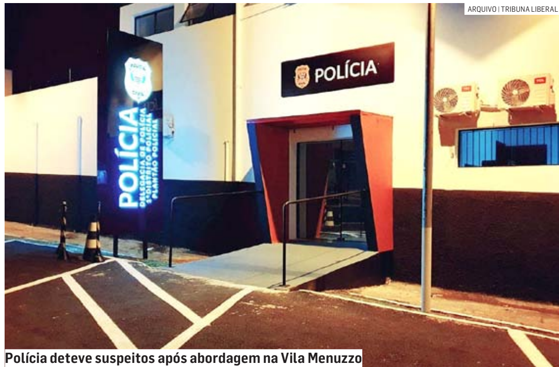
Polícia deteve suspeitos após abordagem na Vila Menuzzo

Cézar Oliveira • SUMARÉ tribunaliberal@tribunaliberal.com.br