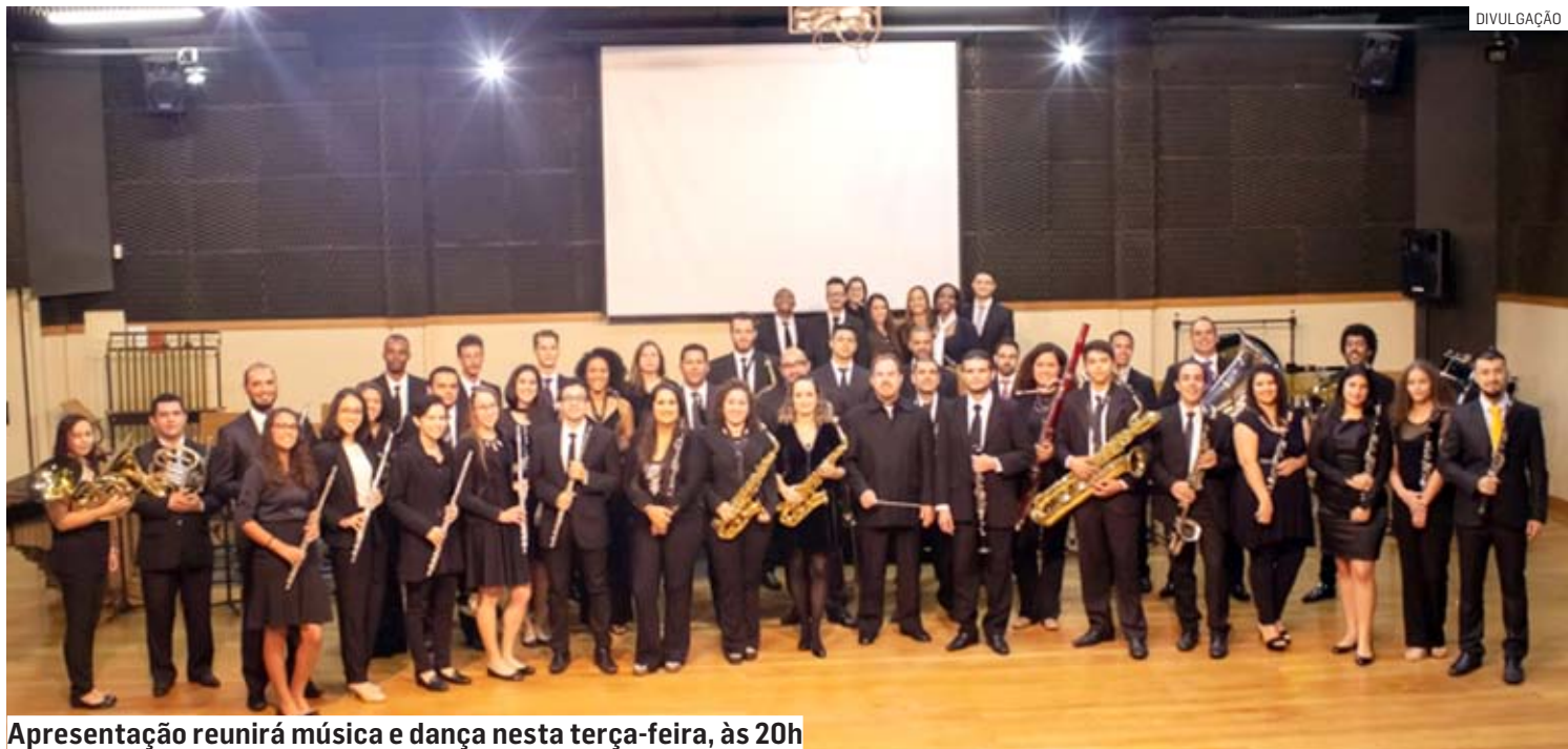
Apresentação reunirá música e dança nesta terça-feira, às 20h

O concerto terá ainda as participações dos grupos Pioneiros do Catira, dos grupos de dança dos CC-MIs (Centros de Convivência da Melhor Idade) Remanso Campineiro e Jardim Amanda, da escola particular Artes em Movimento e da Cia de Dança Humaniza, formada por pessoas com síndrome de down, de Campinas.