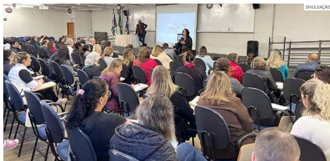
Objetivo da ação é aumentar sensibilidade das equipes da rede municipal contra a doença