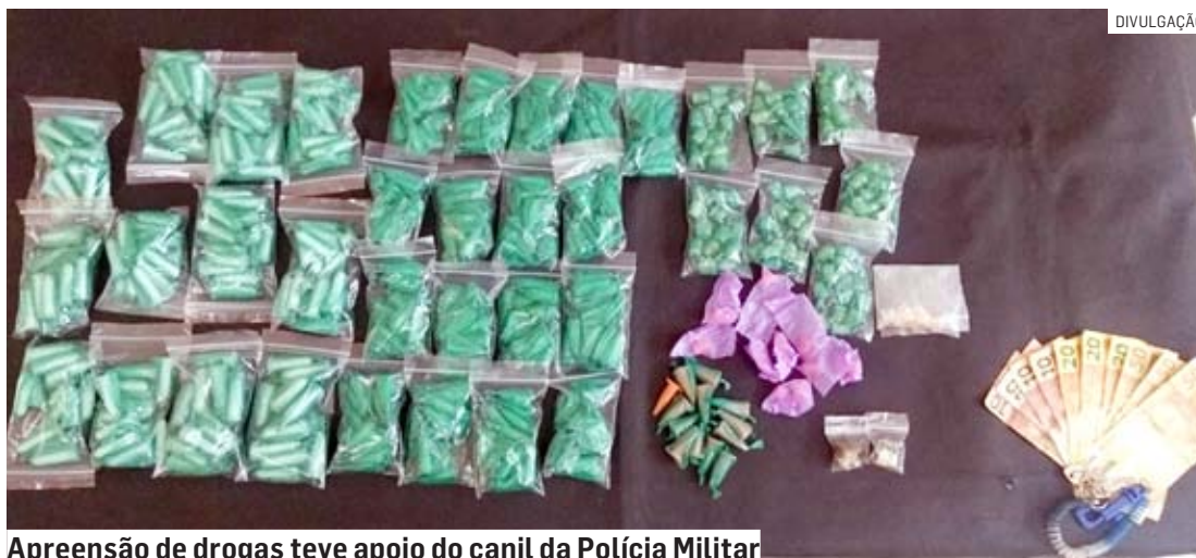
Apreensão de drogas teve apoio do canil da Polícia Militar

Policiais faziam patrulhamento por um local já conhecido como ponto de venda de drogas e visualizaram um indivíduo entrando em uma viela e guardando entorpecentes no muro de uma casa. Além da droga, foram lo-