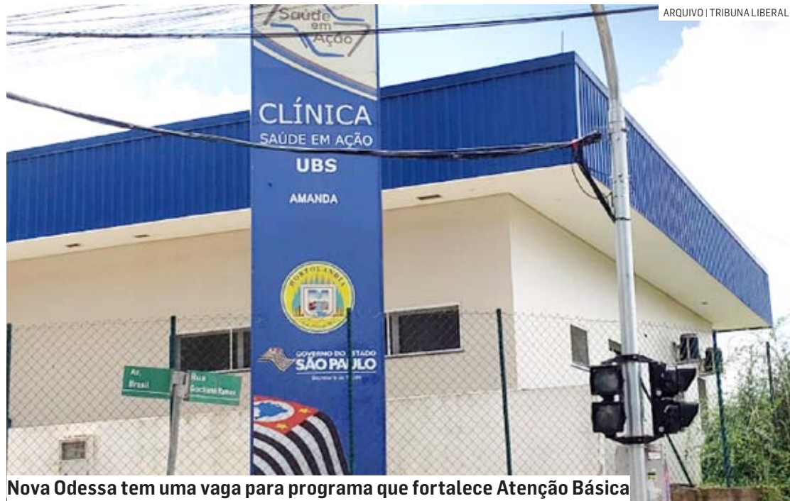
Nova Odessa tem uma vaga para programa que fortalece Atenção Básica

Como obrigações, as prefeituras devem garantir moradia ao profissional do projeto, alimentação e água potável, além de transporte adequado