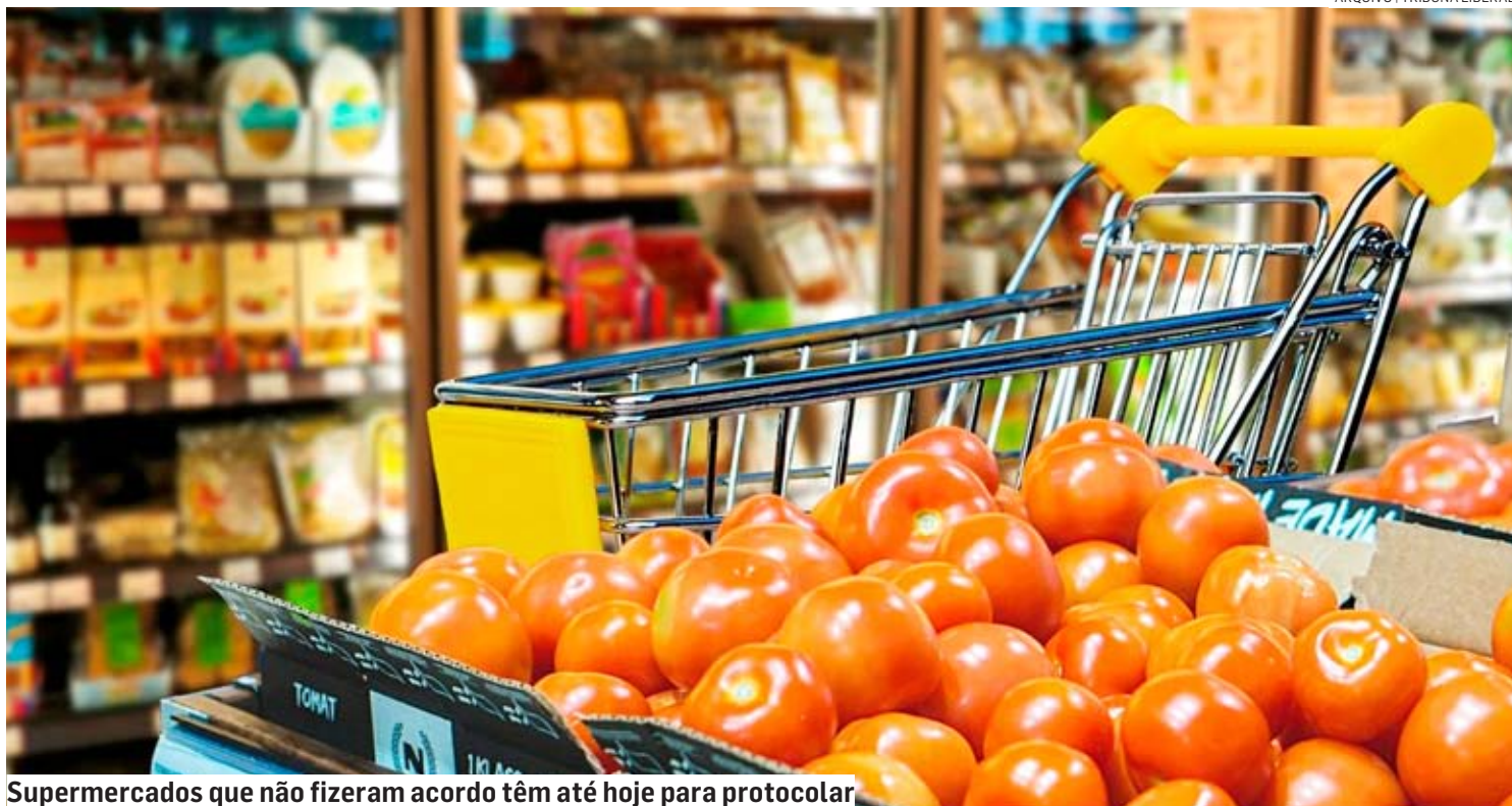
Supermercados que não fizeram acordo têm até hoje para protocolar

Motivo é o impasse entre sindicato que defende trabalhadores do comércio e o sindicato patronal; estabelecimento que abrir durante o feriado sem autorização vai pagar multa de R$ 1.807 por funcionário