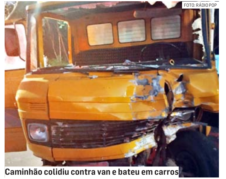
Caminhão colidiu contra van e bateu em carros

Equipes do Samu (Serviço de Atendimento Móvel de Urgência) foram acionadas e prestaram socorro às vítimas. Ao menos duas pessoas tiveram ferimentos leves. As causas do acidente serão investigadas.