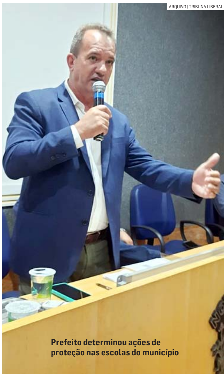
Prefeito determinou ações de proteção nas escolas do município