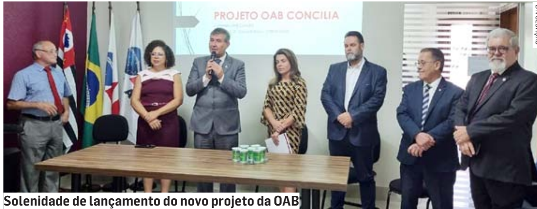
Solenidade de lançamento do novo projeto da OAB

Paulo Medina • HORTOLÂNDIA paulo.medina@tribunaliberal.com.br