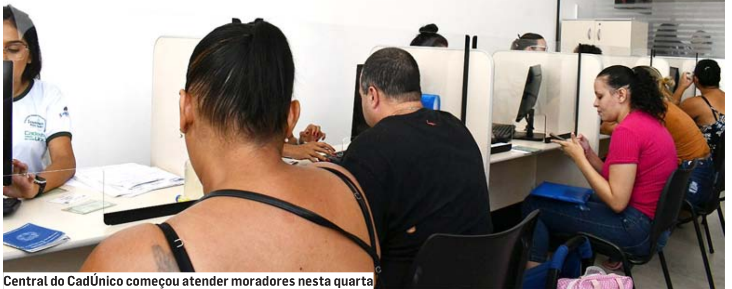
Central do CadÚnico começou atender moradores nesta quarta

pes volantes e uma equipe itinerante, que percorrerá os bairros de Sumaré em uma van adaptada para levar o serviço mais perto da população.