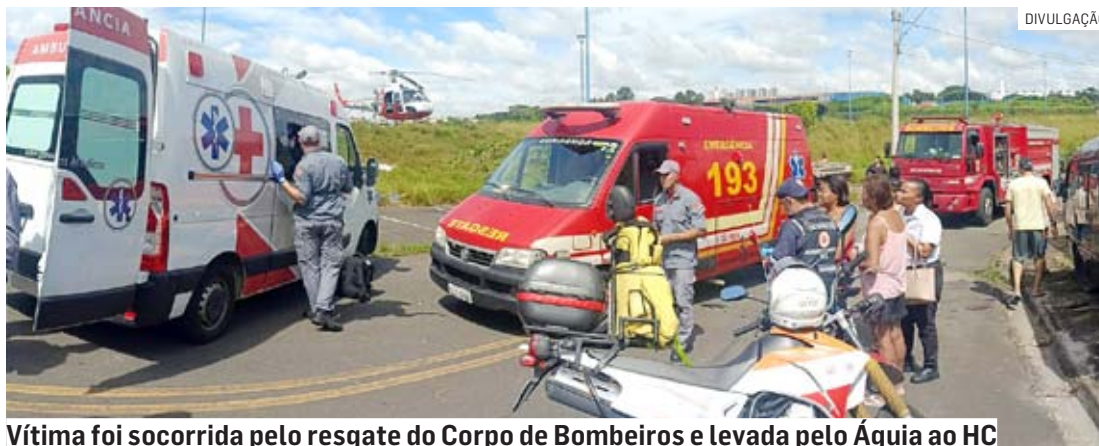
Vítima foi socorrida pelo resgate do Corpo de Bombeiros e levada pelo Águia ao HC

A Polícia Militar foi acionada para atender a ocorrência e informou que a vítima apresentava lesões graves na região do tórax. Ela foi atendida