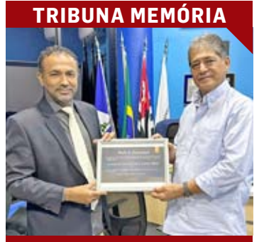
Homenagem à Ponte Preta PG. 09

◆ SUMARÉ | CENTRO | NOVA VENEZA | PICERNO | MARIA ANTONIA | ÁREA CURA | MATÃO ◆ HORTOLÂNDIA ◆ NOVA ODESSA ◆ MONTE MOR ◆ ELIAS FAUSTO ◆ PAULÍNIA ◆