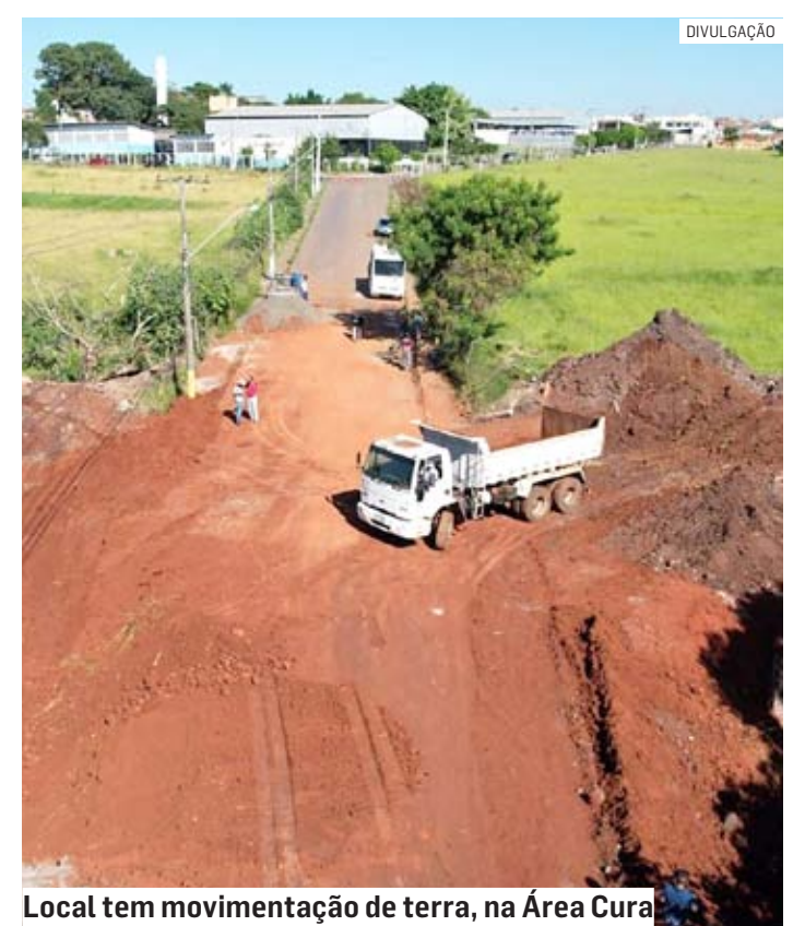
Local tem movimentação de terra, na Área Cura

cebendo melhorias. Esta semana, informou a Prefeitura, a Secretaria de Obras segue trabalhando na compactação do solo e movimentação de terra. A travessia já recebeu a instalação de novos tubos de concreto, com maior capacidade de vazão das águas das chuvas.