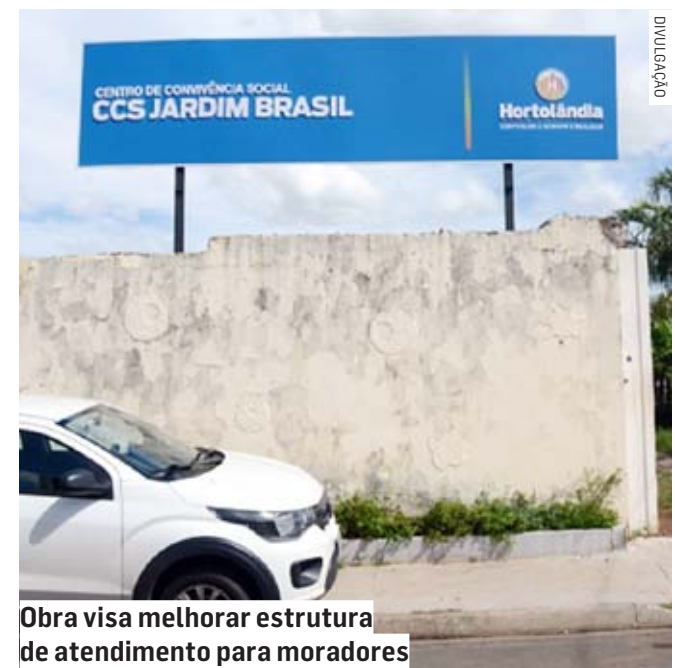
Obra visa melhorar estrutura de atendimento para moradores