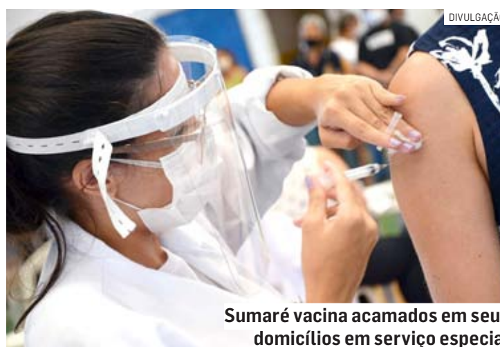
Sumaré vacina acamados em seus domicílios em serviço especial

Nesta fase, estão incluídas crianças de seis meses até seis anos, gestantes, puérperas, trabalhadores da saúde, idosos com 60 anos ou mais, professores das escolas públicas e privadas, pessoas com doenças crônicas não transmissíveis e outras condições clínicas especiais, pessoas com deficiência permanente, profissionais das forças de segurança e salvamento e das forças armadas, caminhoneiros, trabalhadores de transporte coletivo rodoviário de passageiros urbanos e de longo curso, trabalhadores portuários, funcionários do sistema prisional, adolescentes e