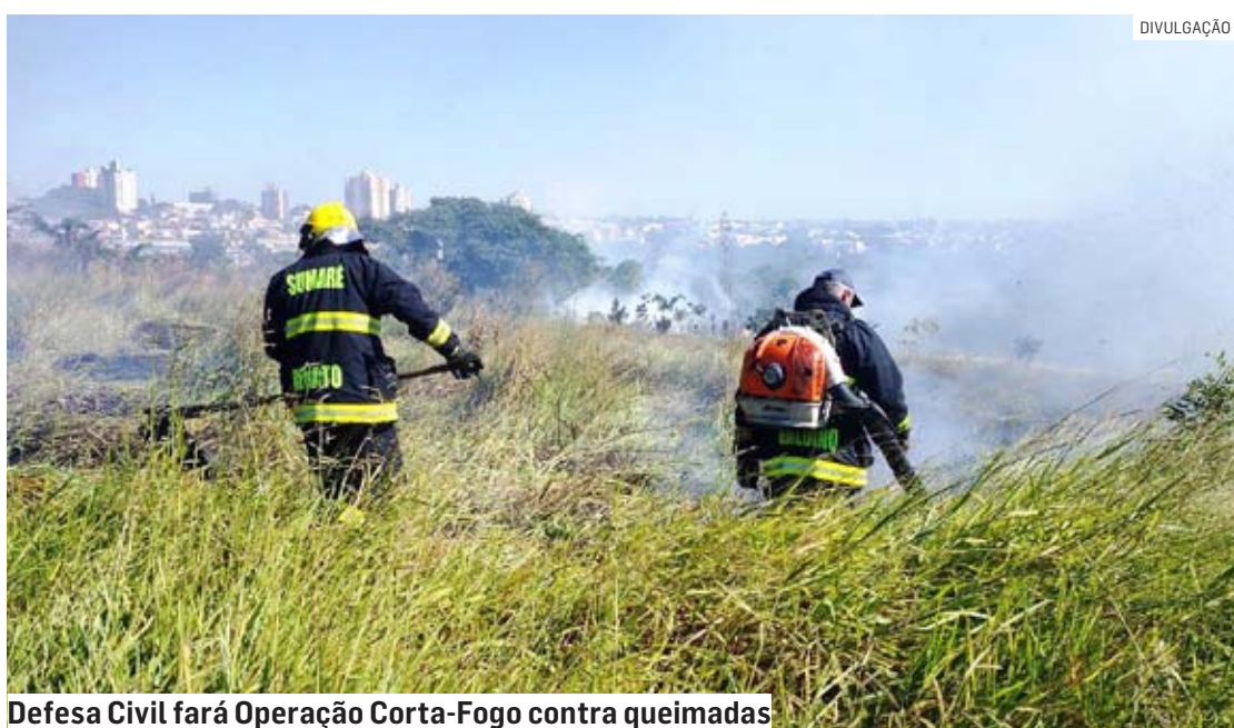
Defesa Civil fará Operação Corta-Fogo contra queimadas

Da Redação • SUMARÉ tribunaliberal@tribunaliberal.com.br