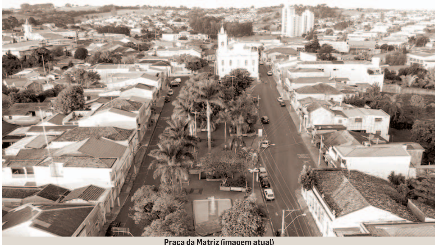
Praça da Matriz (imagem atual)

Lá pelas décadas de 40, 50 e 60 do século passado, em Monte Mor, assim como na maioria das cidades de nossa região e quiçá de todo o Brasil, especialmente nas pequenas cidades do interior, um dos divertimentos das famílias eram os passeios pelas praças centrais das cidades, que na sua grande maioria localizava-se em frente à Igreja Matriz. As cidades brasileiras, especialmente aquelas nascidas no período colonial, sofreram, em suas origens, a influência marcante do catolicismo e por isso mesmo era quase unanimidade a existência de uma capela marcando o ponto inicial do povoado, posteriormente cidade. E sempre uma praça estava ali, ou em todo o entorno ou só na frente da igreja.