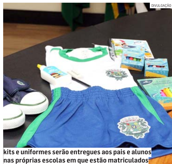
kits e uniformes serão entregues aos pais e alunos nas próprias escolas em que estão matriculados