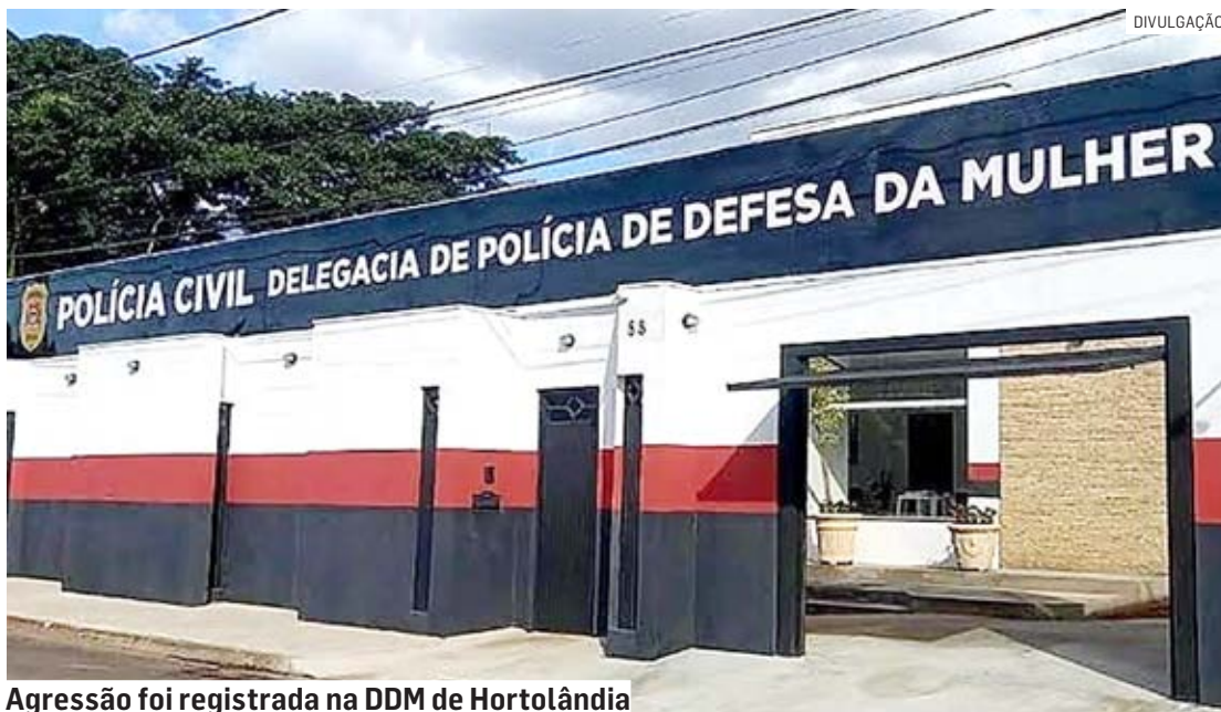
Agressão foi registrada na DDM de Hortolândia

Ele pegou a mulher pelo pescoço e falou que iria matá-la. O agressor jogou a mulher no chão e deu