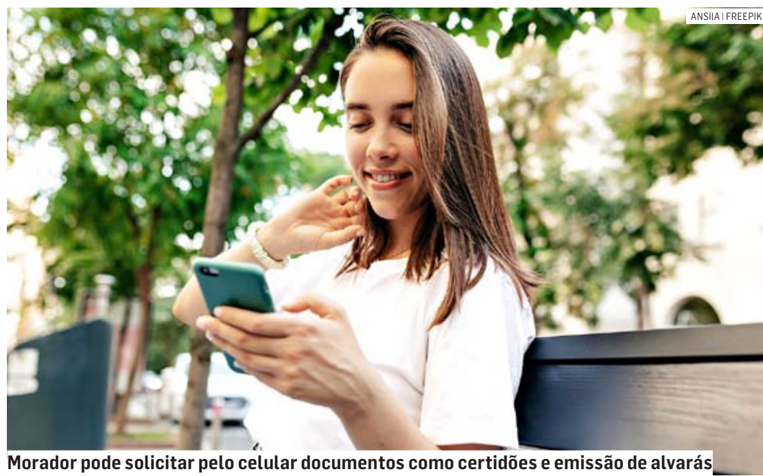
Morador pode solicitar pelo celular documentos como certidões e emissão de alvarás

A implantação do recurso digital no processo de solicitação de serviços busca oferecer uma alternativa que potencializa e aprimora o gerenciamento de documentos, diminuindo o uso de papel no decorrer dos procedimentos institucionais.