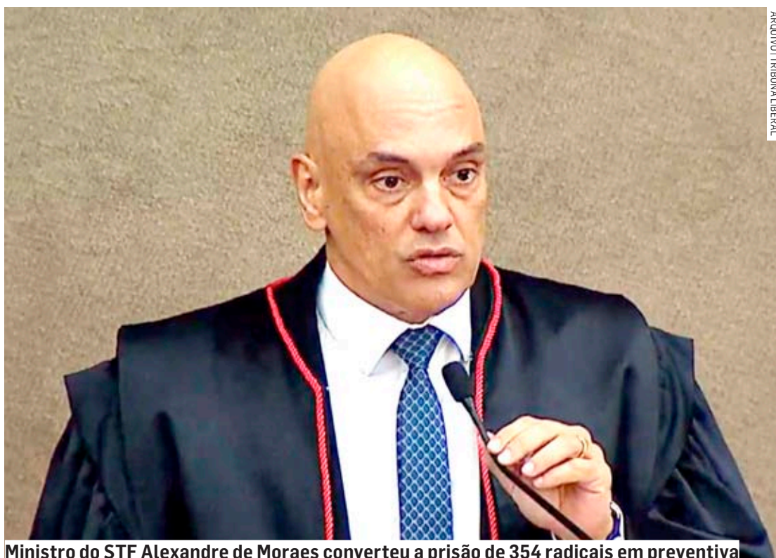
Ministro do STF Alexandre de Moraes converteu a prisão de 354 radicais em preventiva

Moraes prosseguiu na quarta-feira a análise sobre a situação dos presos por envolvimento em atos de terrorismo e na destruição de prédios públicos. Até agora, foram decididos os casos de 574