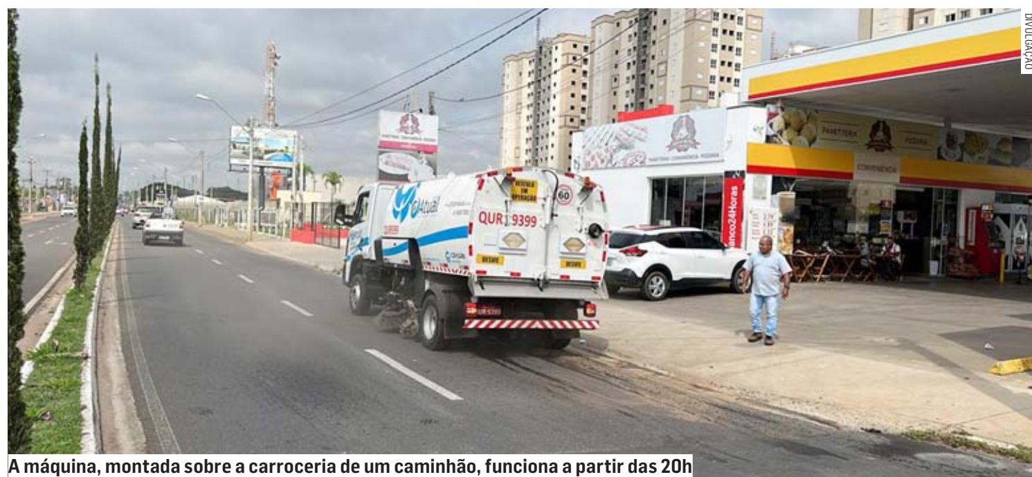
A máquina, montada sobre a carroceria de um caminhão, funciona a partir das 20h

Da Redação | NOVA ODESSA tribunaliberal@tribunaliberal.com.br