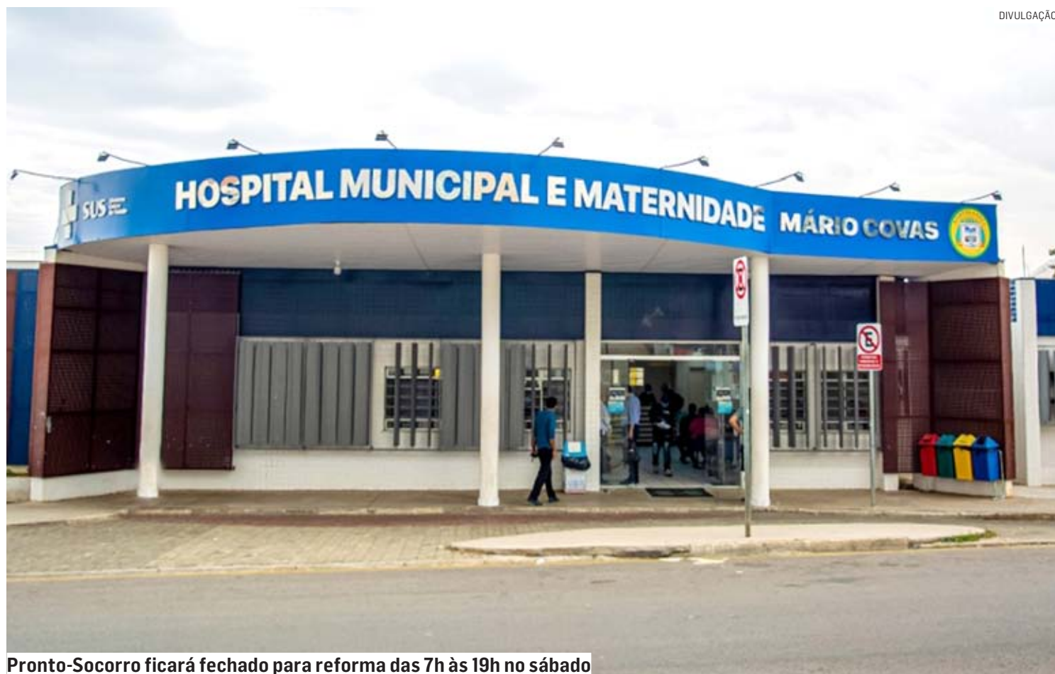
Pronto-Socorro ficará fechado para reforma das 7h às 19h no sábado

Intervenção em sistema elétrico da principal unidade de saúde da cidade irá interromper atendimento de pacientes, que devem se dirigir para UPAs