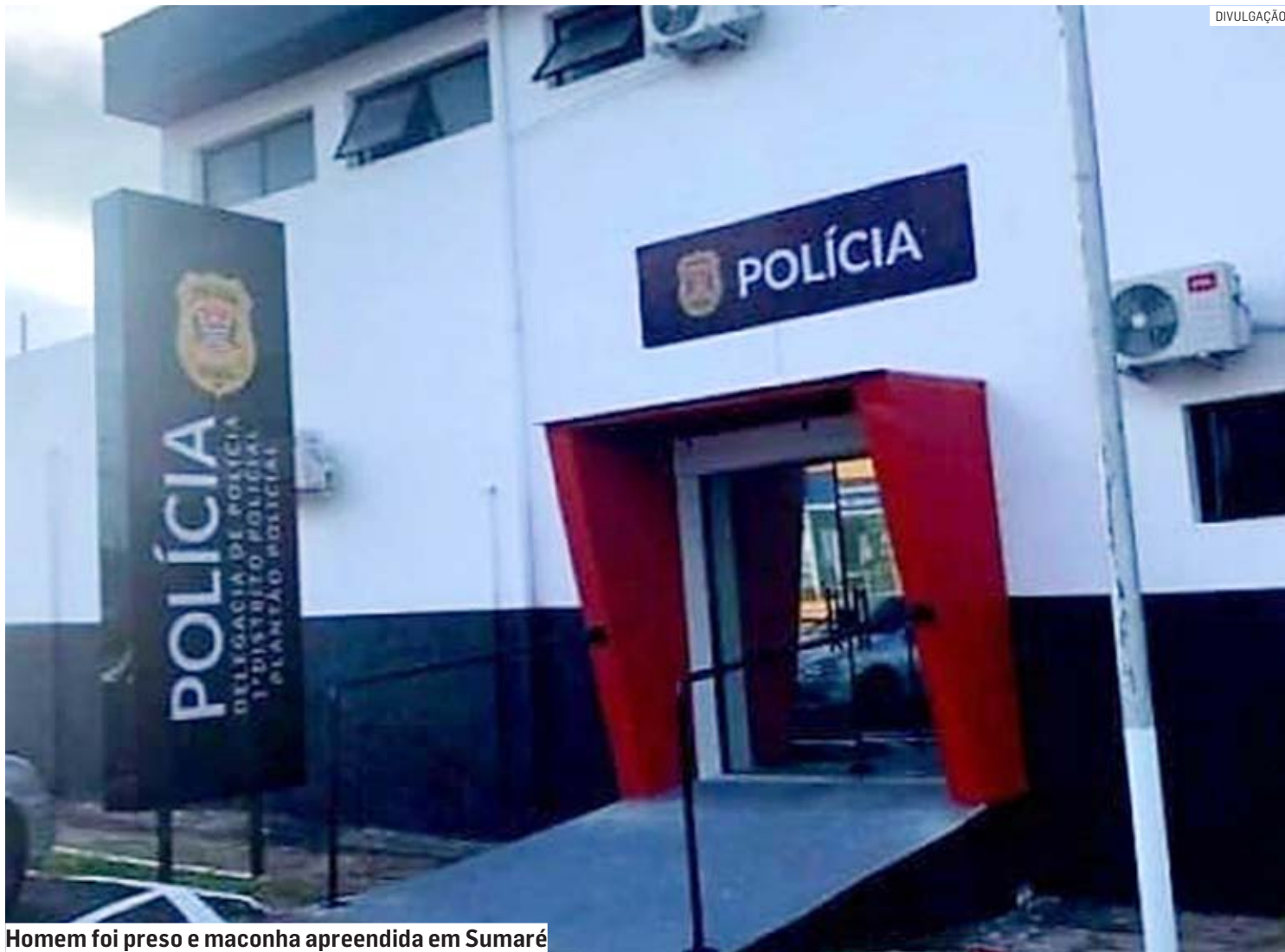
Homem foi preso e maconha apreendida em Sumaré

Segundo a polícia, uma equipe realizava o patrulhamento pela região quando recebeu informações pelo Copom sobre o roubo de uma motocicleta no bairro São Jorge. A equipe avistou um homem em uma moto parada na avenida José Vedovatto em atitude suspeita.