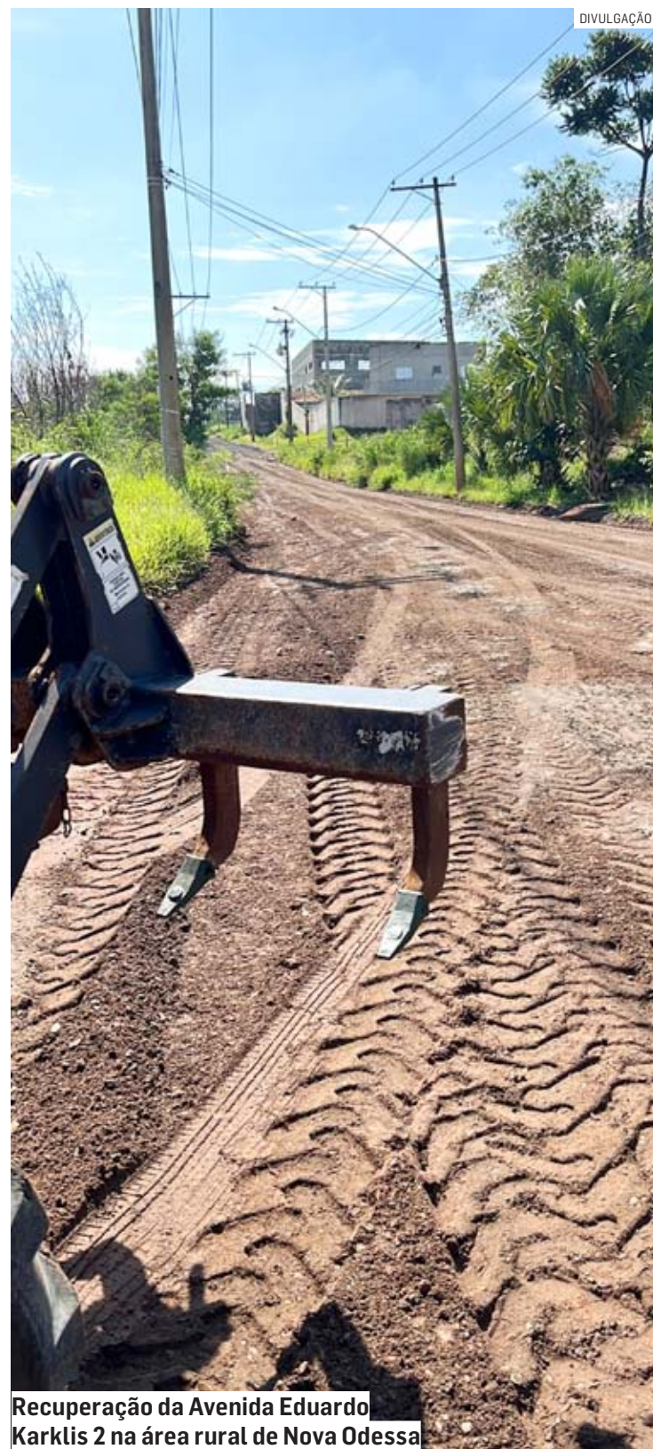
Recuperação da Avenida Eduardo Karklis 2 na área rural de Nova Odessa