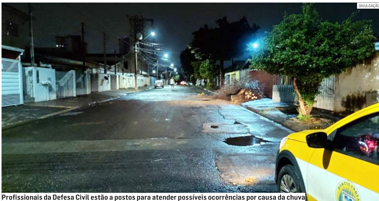
Profissionais da Defesa Civil estão a postos para atender possíveis ocorrências por causa da chuva

Em 72h, município registrou acúmulo de 55 mm e queda de 14 árvores; Defesa Civil afirma estar em alerta na tentativa de evitar mais estragos