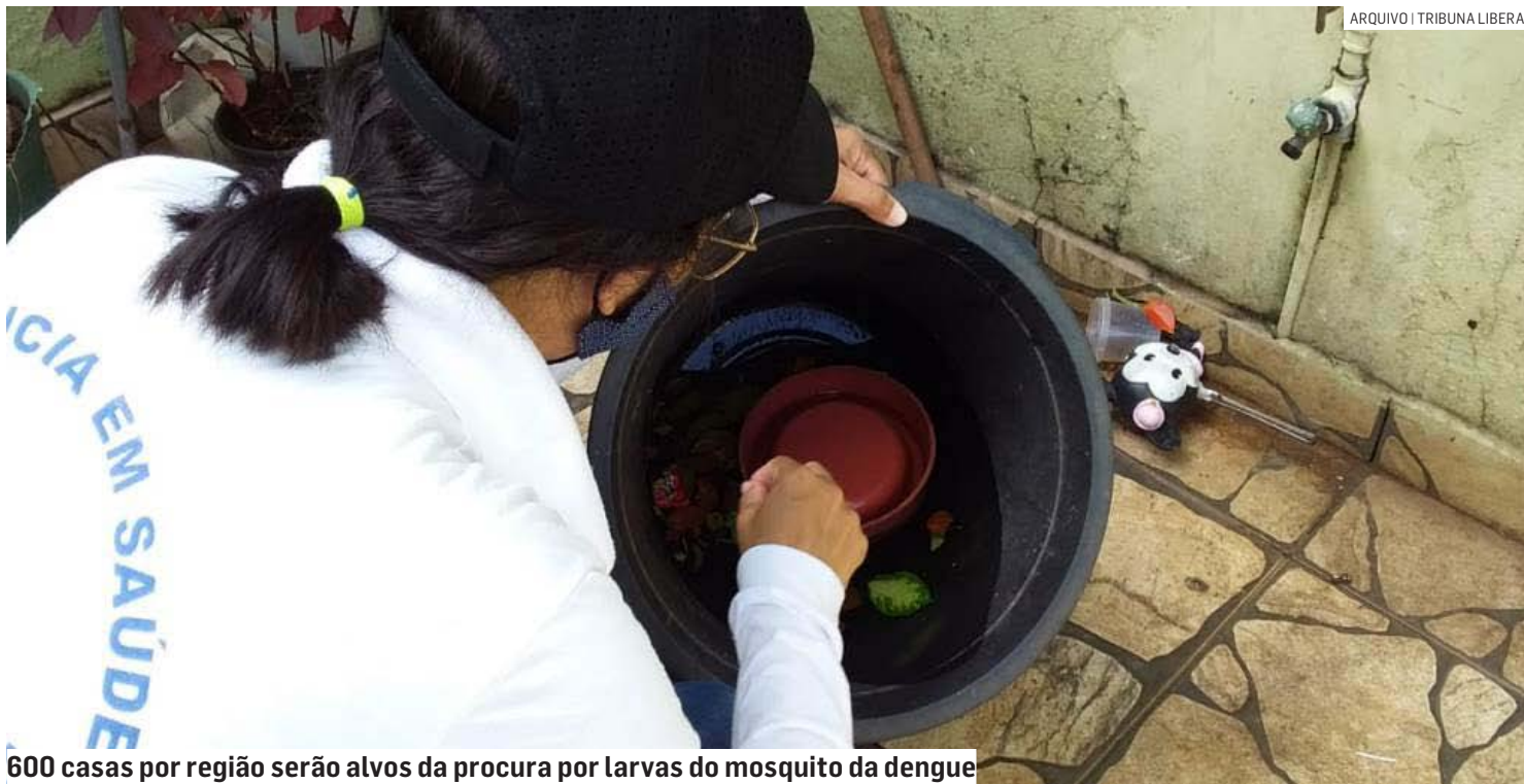
600 casas por região serão alvos da procura por larvas do mosquito da dengue

Agentes de endemias devem vistoriar cerca de 4 mil imóveis pedindo colaboração da população na eliminação de criadouros