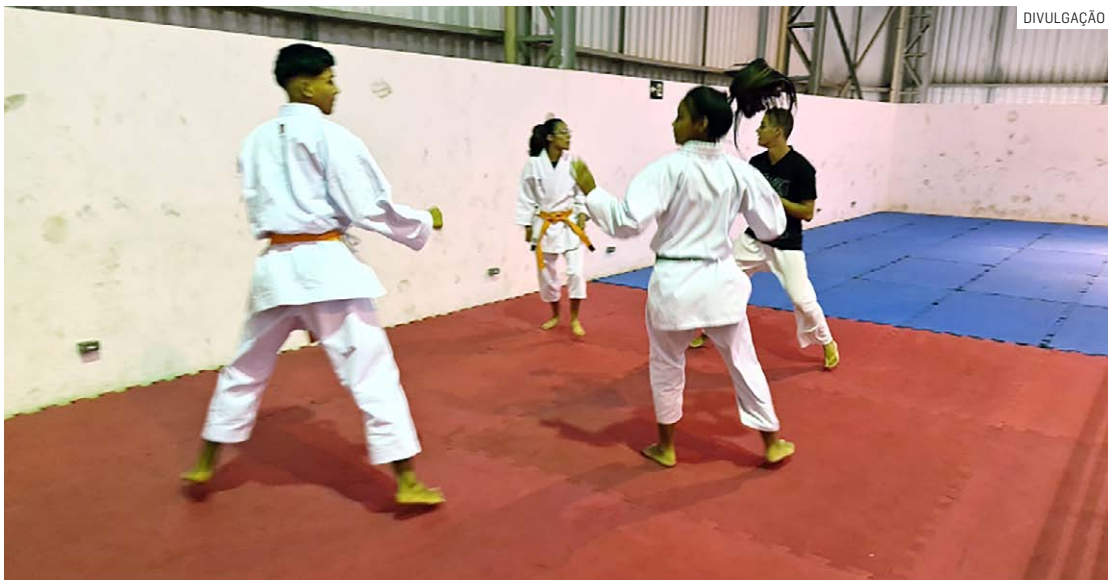
Projeto atende 6.500 pessoas de todas regiões da cidade e de diferentes faixas etárias

Da Redação • HORTOLÂNDIA tribunaliberal@tribunaliberal.com.br