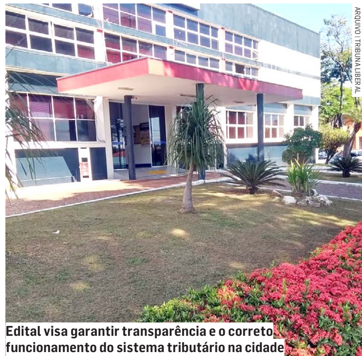
Edital visa garantir transparência e o correto funcionamento do sistema tributário na cidade

Paulo Medina • SUMARÉ paulo.medina@tribunoliberal.com.br