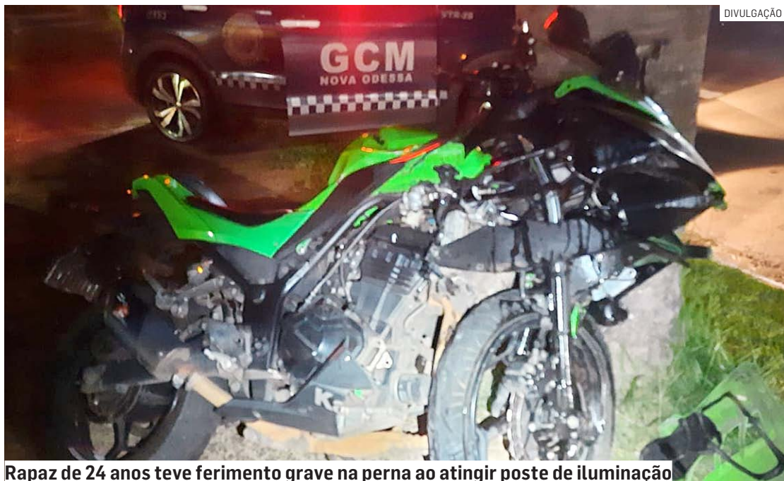
Rapaz de 24 anos teve ferimento grave na perna ao atingir poste de iluminação