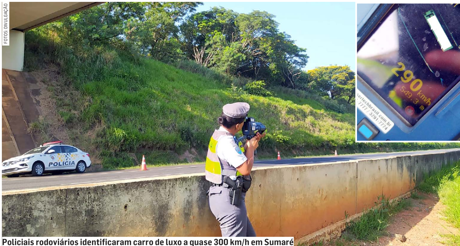
Policiais rodoviários identificaram carro de luxo a quase 300 km/h em Sumaré

capotou após um acidente com um caminhão na manhã desta segunda-feira (18), na Rodovia Anhanguera, em Sumaré. O acidente aconteceu na altura do quilômetro 112 da pis-