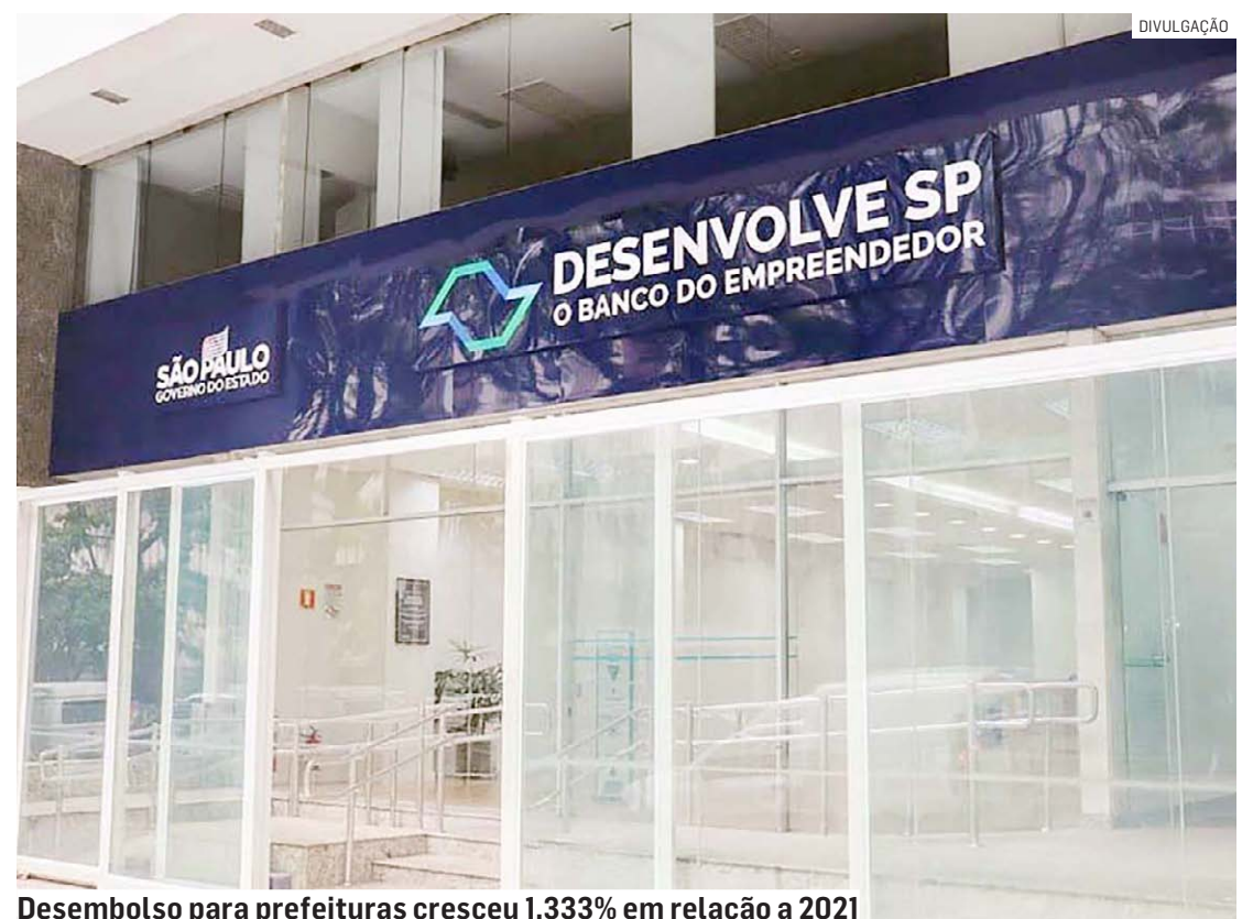
Desembolso para prefeituras cresceu 1.333% em relação a 2021