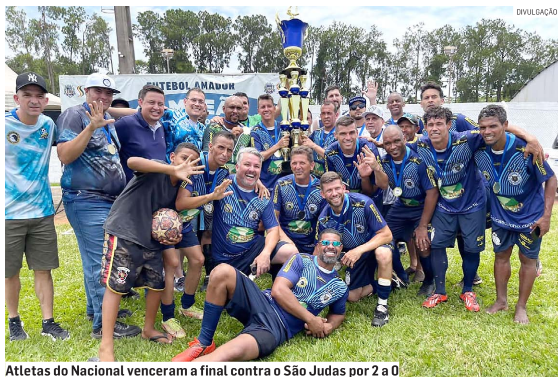
Atletas do Nacional venceram a final contra o São Judas por 2 a 0

Da Redação • SUMARÉ tribunaliberal@tribunaliberal.com.br