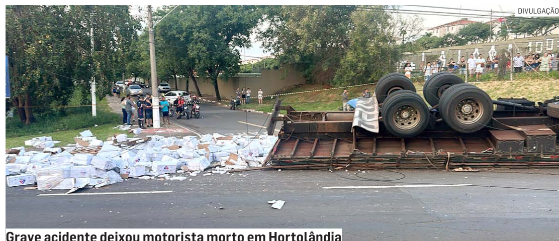
Grave acidente deixou motorista morto em Hortolândia

Cézar Oliveira e Paulo Medina HORTOLÂNDIA paulo.medina@tribunaliberal.com.br