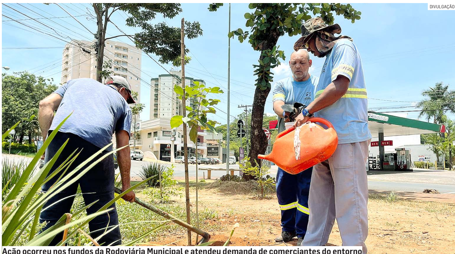
Ação ocorreu nos fundos da Rodoviária Municipal e atendeu demanda de comerciantes do entorno

“Estamos aqui atendendo a um pedido da própria população, com laudo do nosso biólogo. Eram cinco árvores comprometidas,