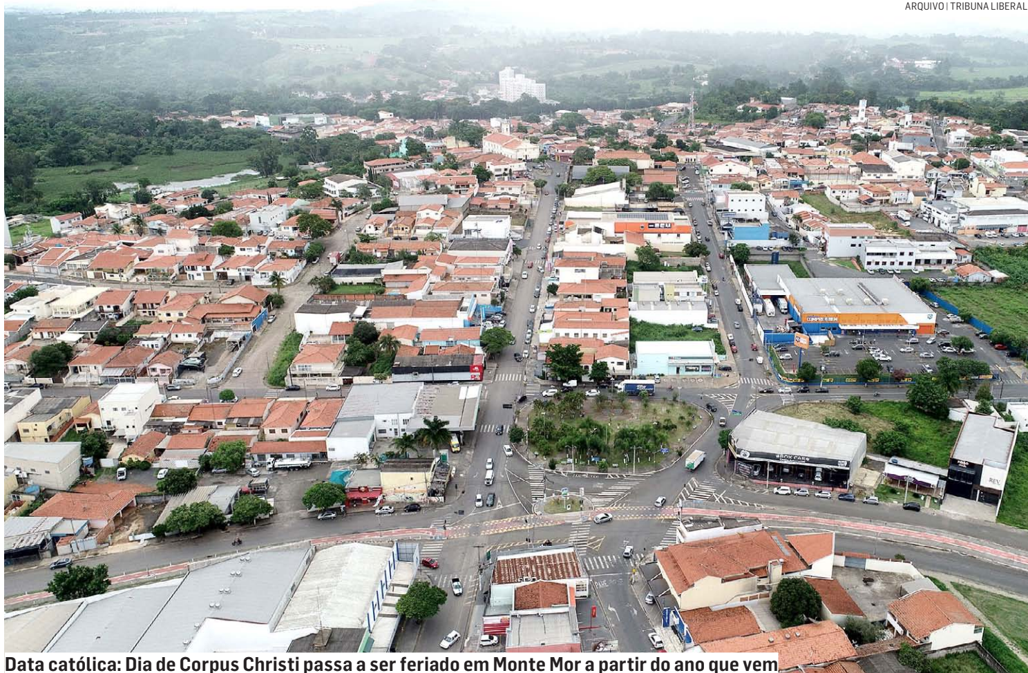
Data católica: Dia de Corpus Christi passa a ser feriado em Monte Mor a partir do ano que vem

“Com a instituição do feriado da Consciência Negra pelo estado de São