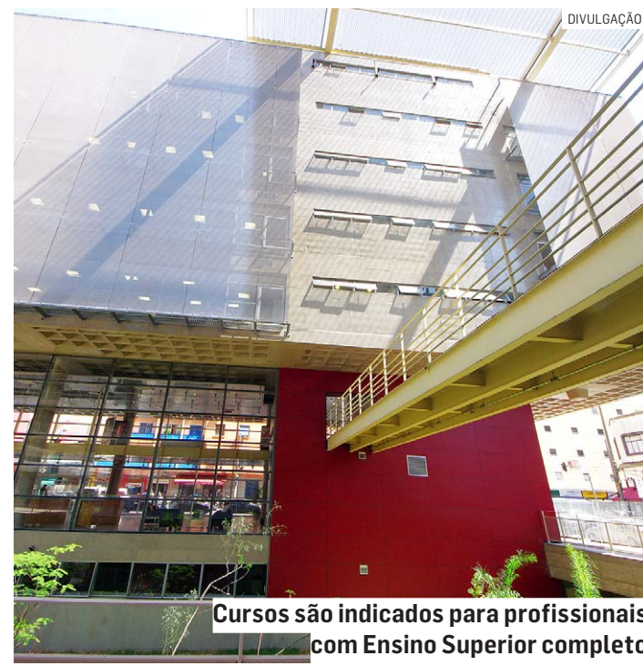
Cursos são indicados para profissionais com Ensino Superior completo

As aulas estão previstas para começar em março de 2024, de forma mista, com aulas presenciais e online síncronas, por meio da plataforma Microsoft Teams . Para concorrer a uma vaga, os interessados devem se inscrever pelo site da instituição.