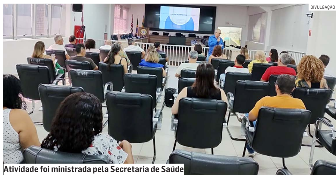
Atividade foi ministrada pela Secretaria de Saúde