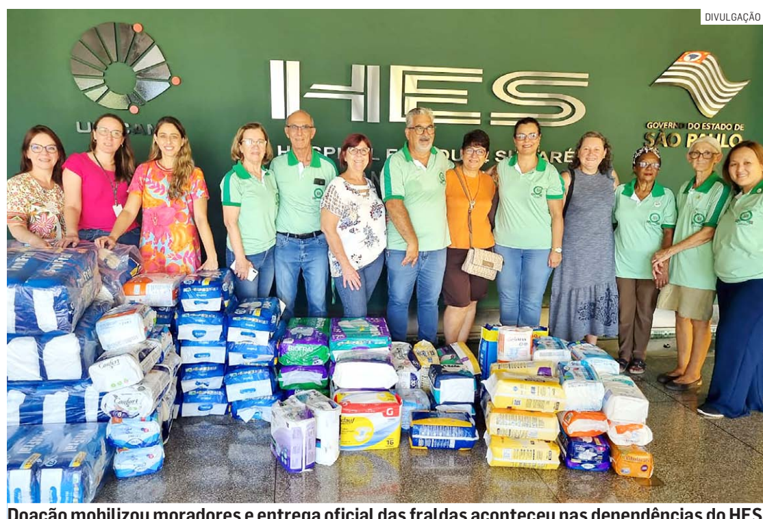
Doação mobilizou moradores e entrega oficial das fraldas aconteceu nas dependências do HES