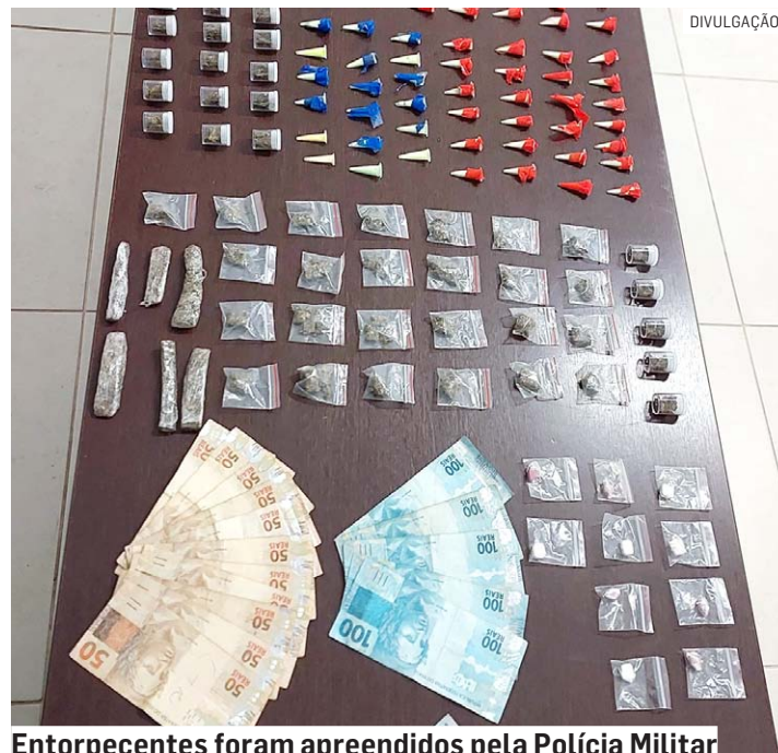
Entorpecentes foram apreendidos pela Polícia Militar

Foram apreendidos 251 microtubos de cocaína, 16 microtubos de mezcla-