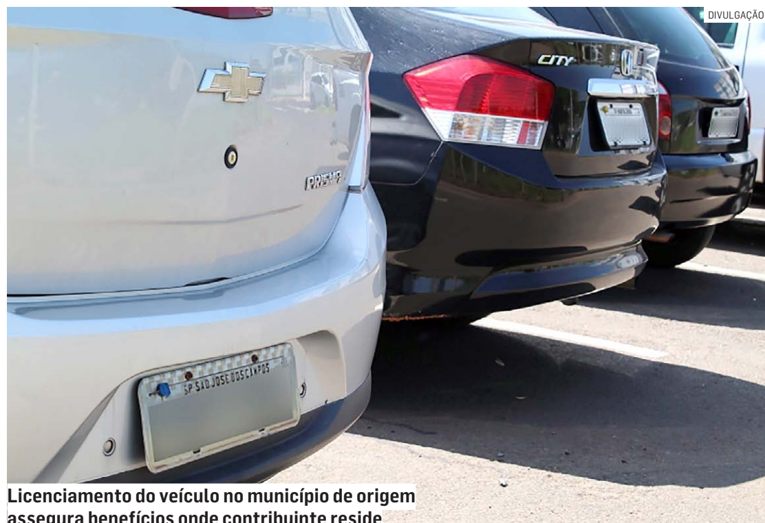
Licenciamento do veículo no município de origem assegura benefícios onde contribuinte reside

O incentivo valerá de janeiro de 2024 a dezembro de 2025. Para ter direito ao reembolso, o proprietário terá que protocolar, dentro do prazo de vigência da Lei Complementar, requerimento na Prefeitura, junto ao Setor de Atendimento ao Contribuinte, lo-