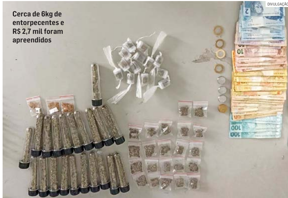
Cerca de 6kg de entorpecentes e R$ 2,7 mil foram apreendidos

Em diligência pela mata, a polícia localizou 36 pinos de cocaína, 59 por-