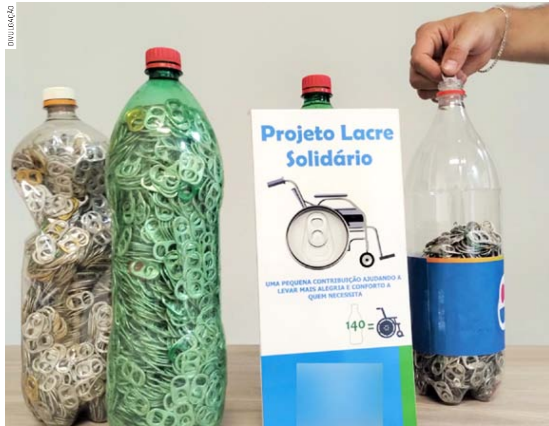
Lacres coletados pela campanha serão vendidos para aquisição de cadeiras de rodas

Relançada oficialmente em maio deste ano, a campanha "Lacre Solidário" chega à sua segunda edição. Em 2022, a campanha de cunho social foi responsável pela coleta de mais de 700 kg de lacres de alumínio, utilizados na aquisição de 8 cadeiras de rodas. Assim como no