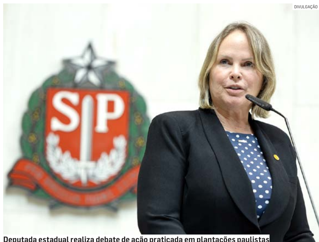
Deputada estadual realiza debate de ação praticada em plantações paulistas

Da Redação • REGIÃO tribunaliberal@tribunaliberal.com.br