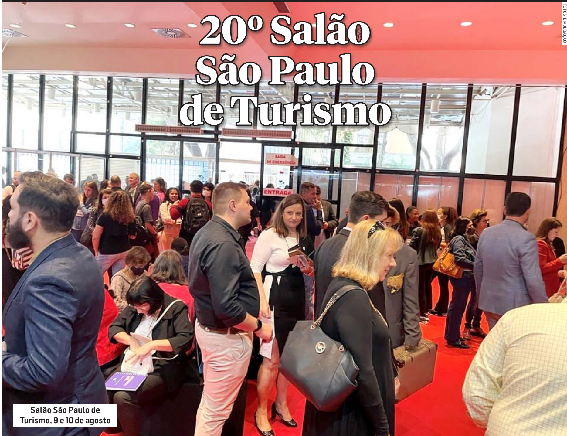
Salão São Paulo de Turismo, 9 e 10 de agosto

E estamos a um mês de mais uma edição que exibe as boas cidades do nosso Estado, destinos turísticos a qualquer dia e hora, com a maior facilidade através de nossas boas estradas.