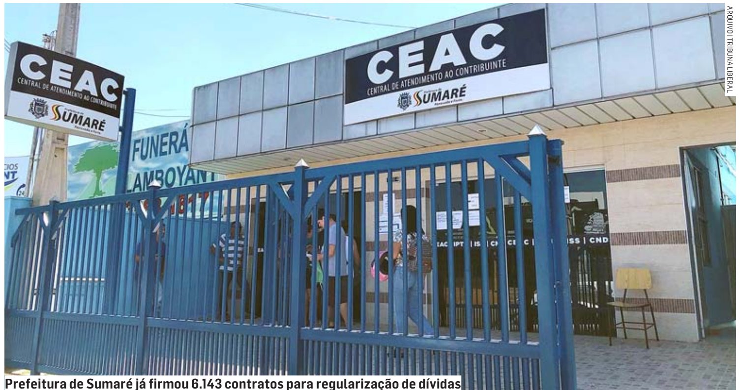
Prefeitura de Sumaré já firmou 6.143 contratos para regularização de dívidas

O benefício se estende aos débitos decorrentes de planos comunitários, valores das tarifas de água e esgotos referentes ao ativo assumido pela administração após a extinção do Departamento de Água e Esgoto, além de débitos referentes a planos comunitários e multas administrativas.