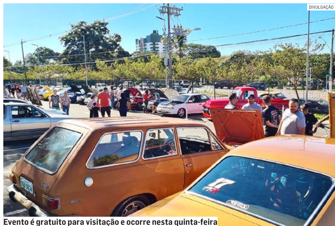
Evento é gratuito para visitação e ocorre nesta quinta-feira

Da Redação • SUMARÉ tribunaliberal@tribunaliberal.com.br