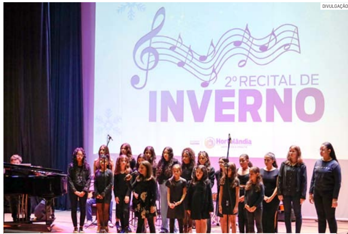
Adolescentes de 12 a 18 anos que tenham conhecimento do canto coral podem participar

Da Redação • HORTOLÂNDIA tribunaliberal@tribunaliberal.com.br