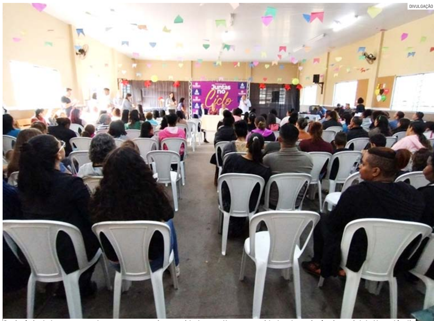
Cerimônia de lançamento do programa reuniu autoridades, mulheres e entidades de assistência social de Hortolândia

Entidades foram representadas na entrega simbólica dos kits durante a cerimônia de lançamento