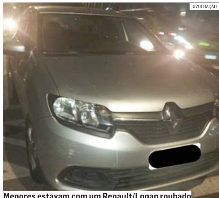
Menores estavam com um Renault/Logan roubado

Os adolescentes foram conduzidos ao Plantão Policial de Hortolândia. Após o registro do boletim de ocorrência, os menores foram liberados aos seus responsáveis. O veículo foi entregue ao proprietário.