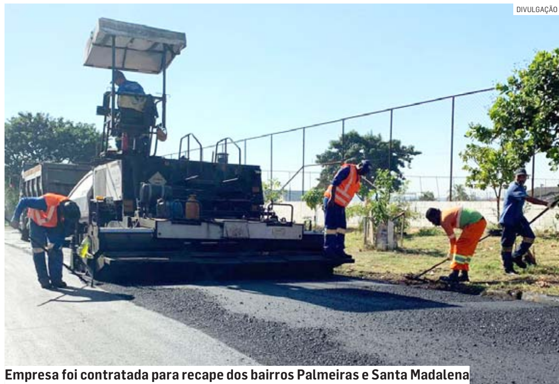
Empresa foi contratada para recape dos bairros Palmeiras e Santa Madalena