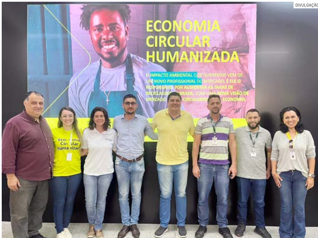
Representantes do Consimares e da Ambipar VirAser percorrem municípios para alinhar ações