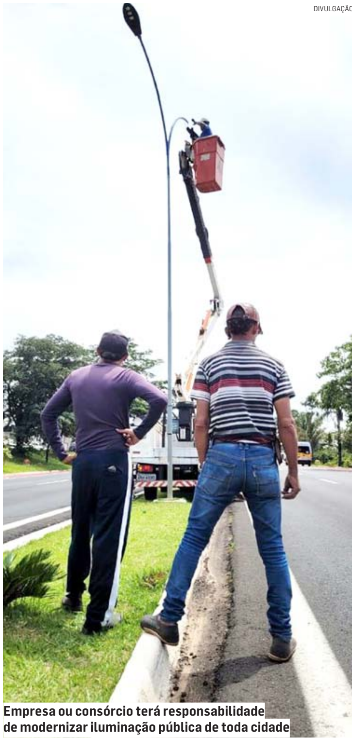
Empresa ou consórcio terá responsabilidade de modernizar iluminação pública de toda cidade