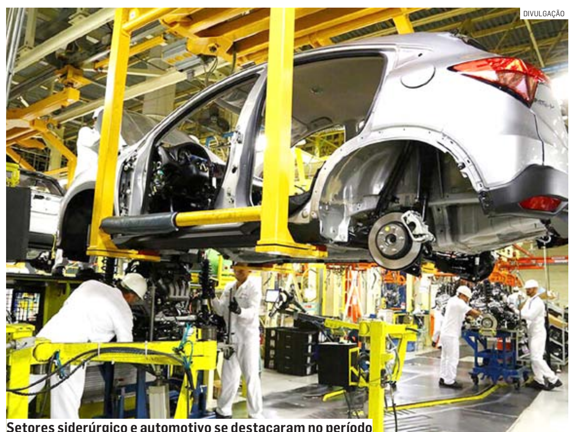
Setores siderúrgico e automotivo se destacaram no período

Os dados apontam ainda quais países são os principais parceiros nas exportações. São eles: Argentina, US$ 60,40 milhões (28% de participação), Estados Unidos com US$ 42 milhões (19%), Países Baixos (Holanda), com US$ 25,3 milhões (12%), México com US$ 11,20 milhões (5,1%), Peru com US$ 9,38 milhões (4,3%). Juntas, totalizam US$ 148,28 milhões e representam 68,4% de participação nas exportações.