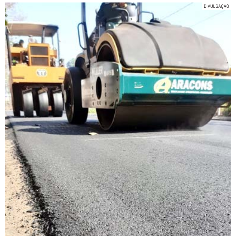
Ruas do Jardim Flórida estão recebendo recapeamento

“As ruas estavam em situação precária, com buracos que danificavam os veículos e comprometiam a segurança”, explicou o vereador.