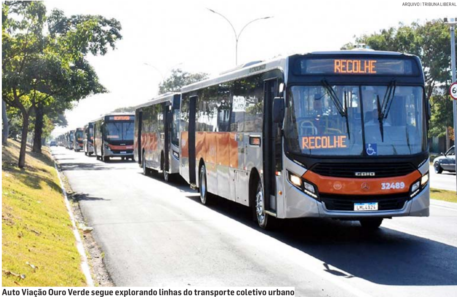
Auto Viação Ouro Verde segue explorando linhas do transporte coletivo urbano

A prorrogação do contrato permitirá que a Auto Viação Ouro Verde Ltda continue operando e prestando os serviços de transporte coletivo em Sumaré. No aditivo publicado, porém, não detalha o novo prazo da concessão.