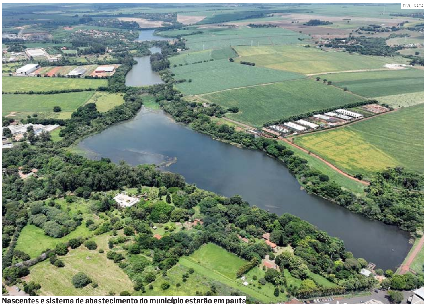
Nascentes e sistema de abastecimento do município estarão em pauta

Programação que chama a atenção da sociedade para o uso racional dos recursos hídricos será iniciada nesta segunda-feira (20) na cidade; estudantes das redes municipal e estadual de ensino farão atividades