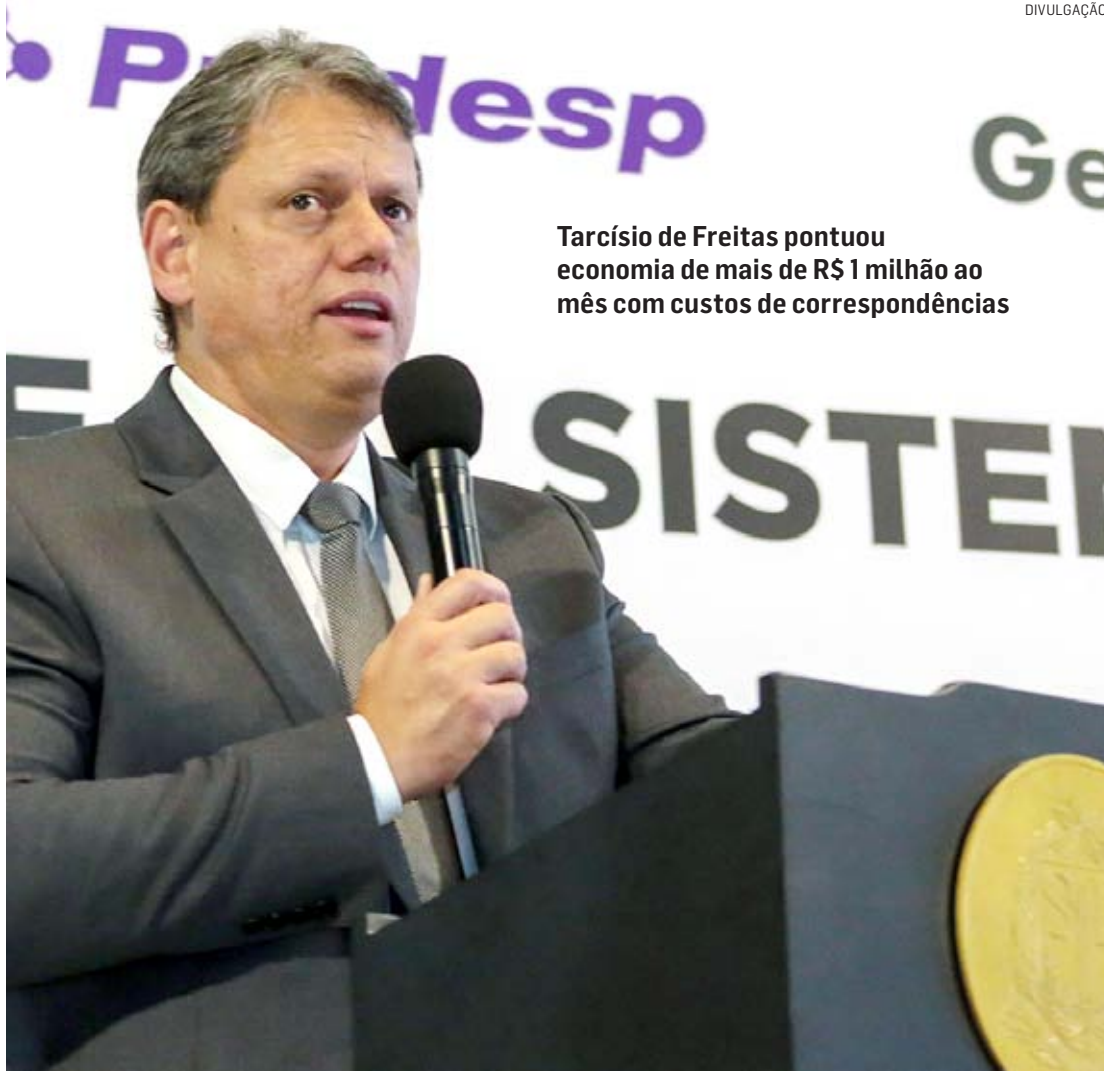
Tarcísio de Freitas pontuou economia de mais de R$ 1 milhão ao mês com custos de correspondências

“A digitalização é fundamental para economizarmos recursos e tempo, para tornar a vida do cidadão mais fácil e proporcionar transparência. Quanto mais digital, melhor vai ser a sensação da prestação do serviço. O nosso cidadão merece um serviço prestado com qualidade. Estamos dando um pequeno passo, mas daremos passos firmes e seguros na direção da digitalização. 40% de desconto é um dinheiro