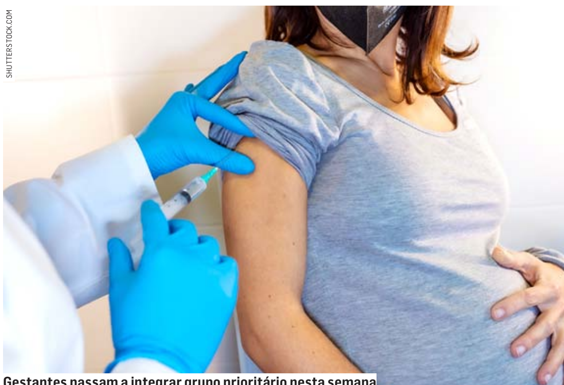
Gestantes passam a integrar grupo prioritário nesta semana

O grupo prioritário soma mais de 55 milhões de brasileiros. O Ministério