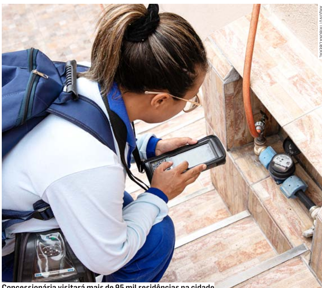
Concessionária visitará mais de 95 mil residências na cidade

“Manter o cadastro dos clientes atualizado é fundamental para que possamos garantir o me-