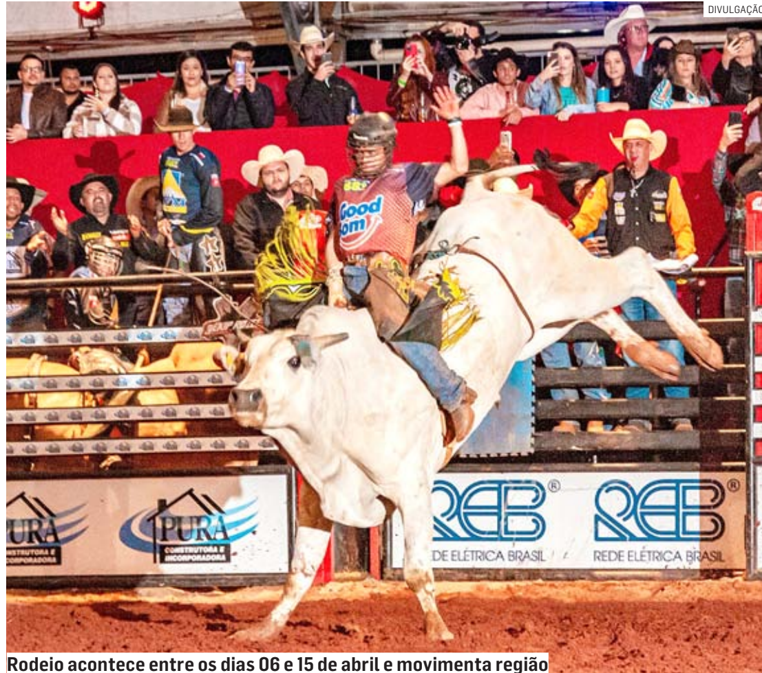
Rodeio acontece entre os dias 06 e 15 de abril e movimenta região