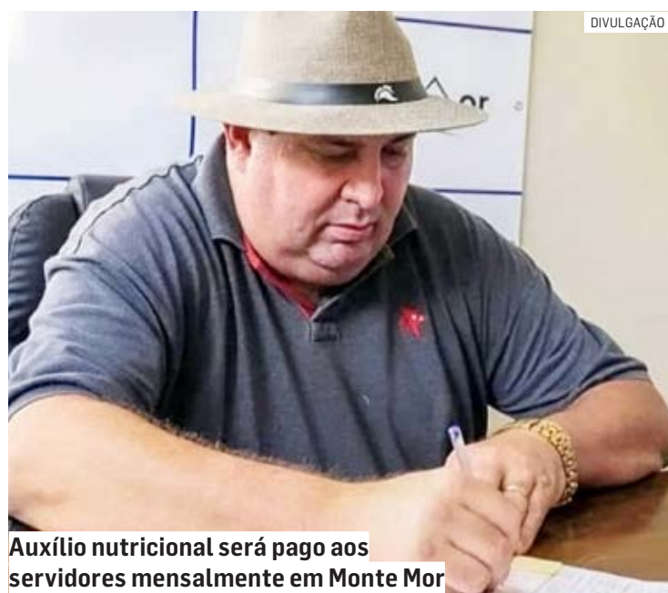
Auxílio nutricional será pago aos servidores mensalmente em Monte Mor

Da Redação | MONTE MOR tribunaliberal@tribunaliberal.com.br