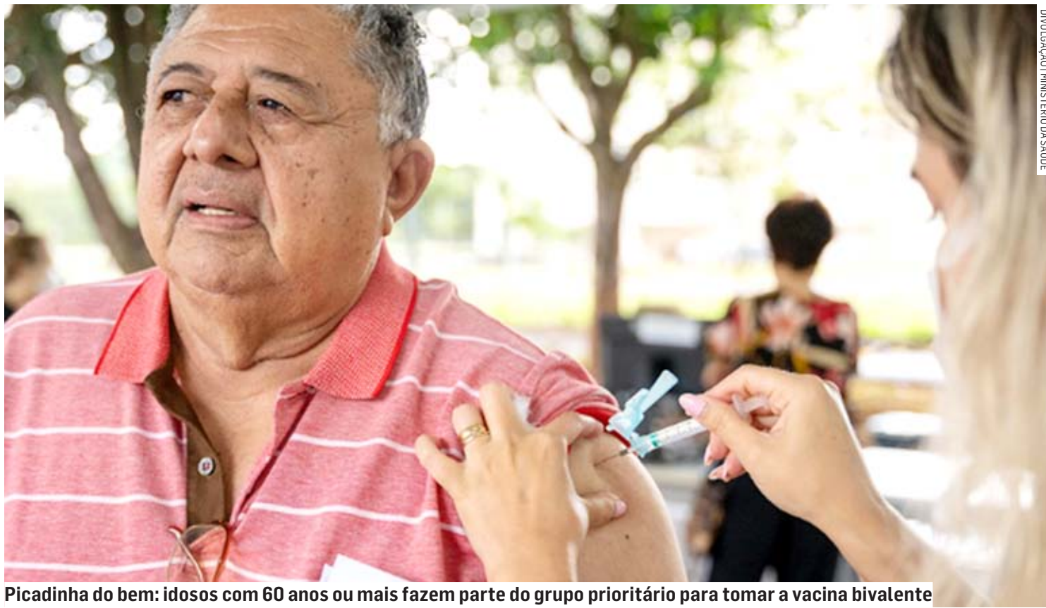
Picadinha do bem: idosos com 60 anos ou mais fazem parte do grupo prioritário para tomar a vacina bivalente

A vacina bivalente da Pfizer atua contra a cepa original do coronavírus e as variantes da ômicron. De acordo com o Ministério da Saúde, já podem tomar a vacina idosos com 60 anos de idade ou mais e pessoas imunocomprometidas. Em seguida, conforme o avanço da campanha e o cronograma de entrega de doses, outros grupos serão imunizados, como as pessoas com deficiência permanente, os trabalhadores da saúde, gestantes e puérperas e a população privada de liberdade.