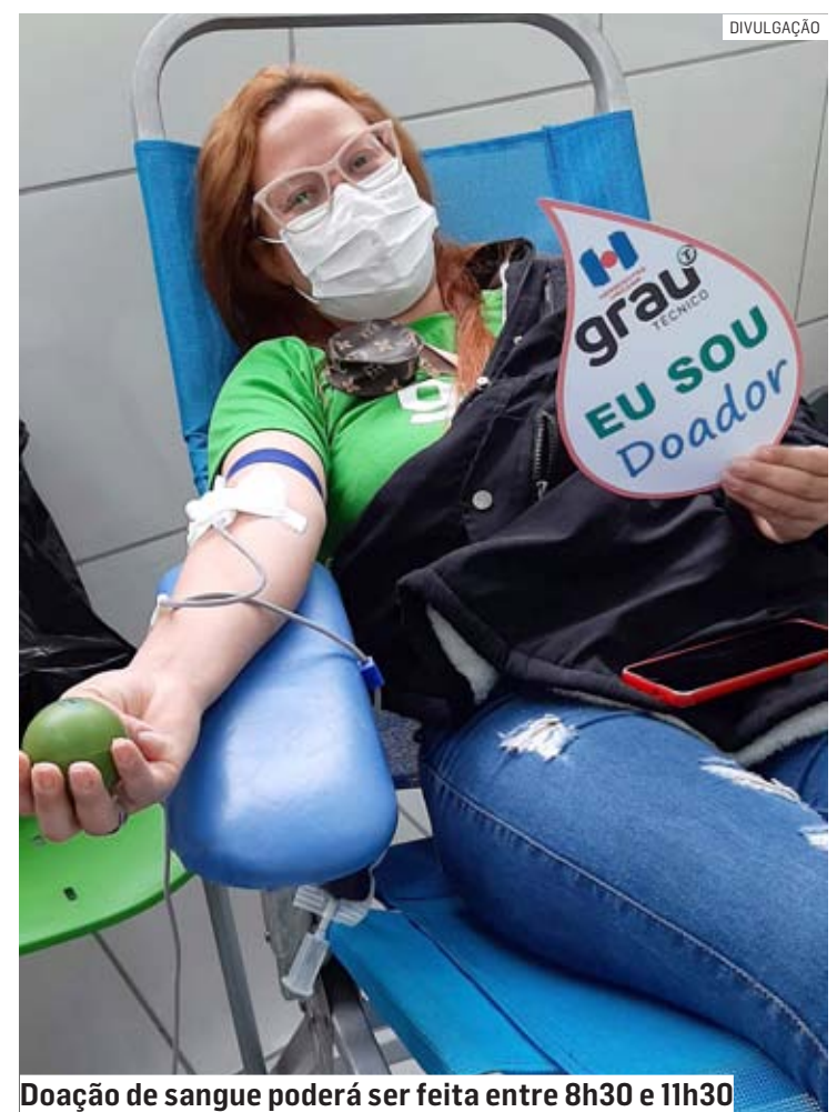
Doação de sangue poderá ser feita entre 8h30 e 11h30