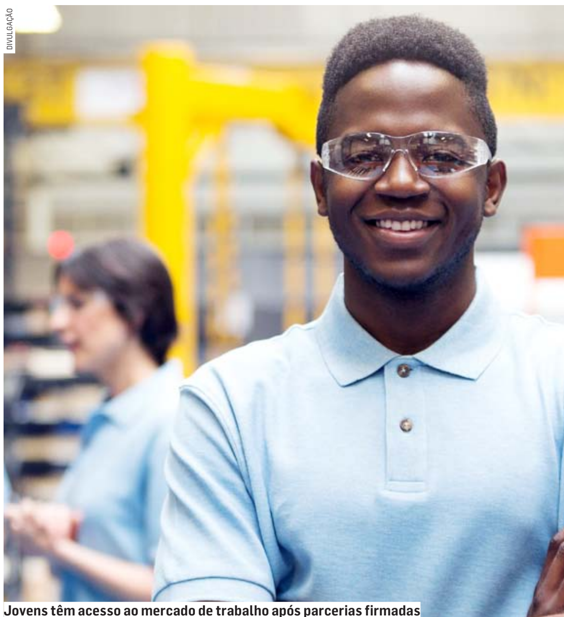
Jovens têm acesso ao mercado de trabalho após parcerias firmadas