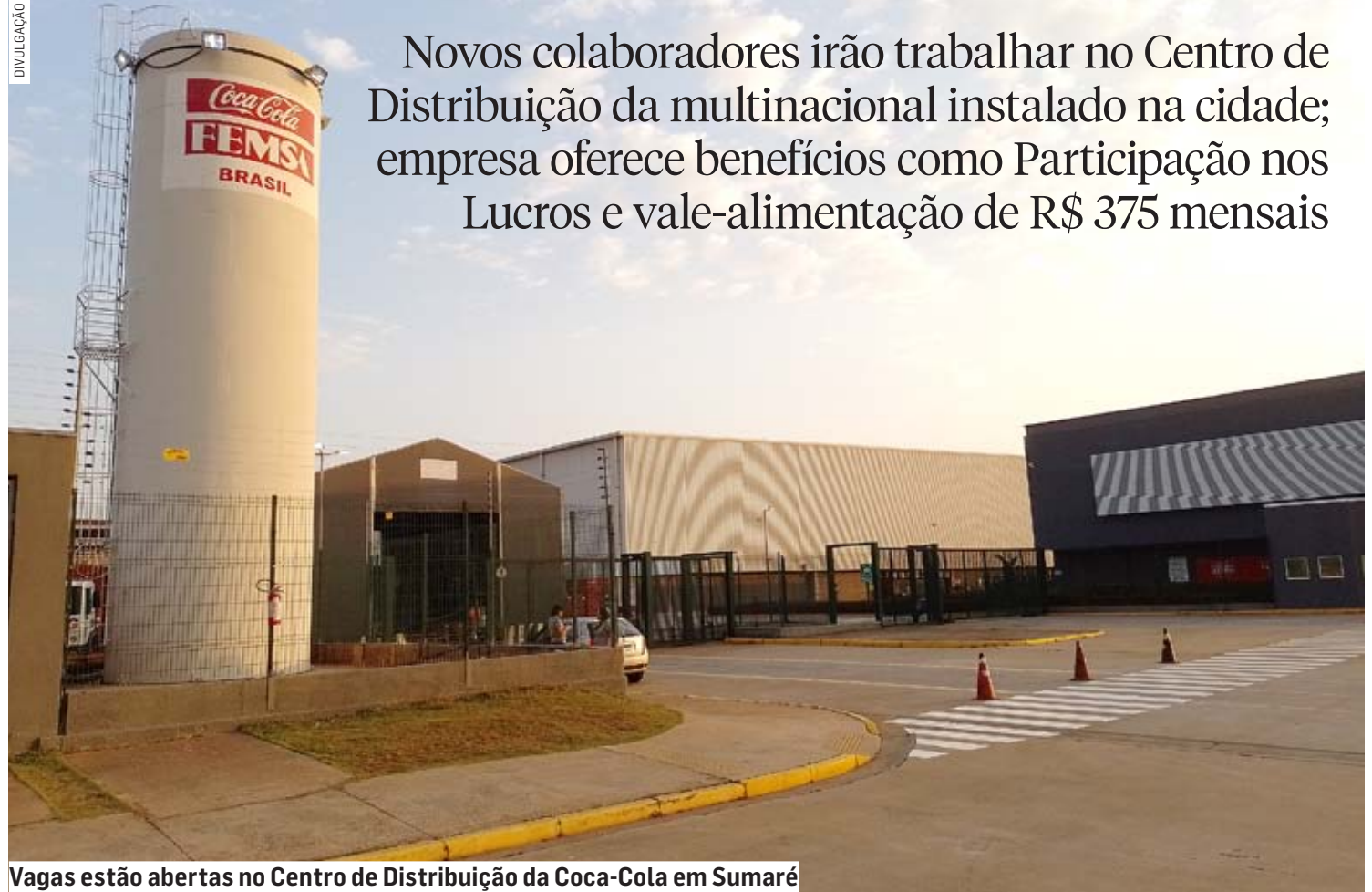
Vagas estão abertas no Centro de Distribuição da Coca-Cola em Sumaré

ra a área de Recursos Humanos da companhia por meio do endereço recrutamento.spinterior2@kof.com.mx ou para o WhatsApp (19) 3399-6533.