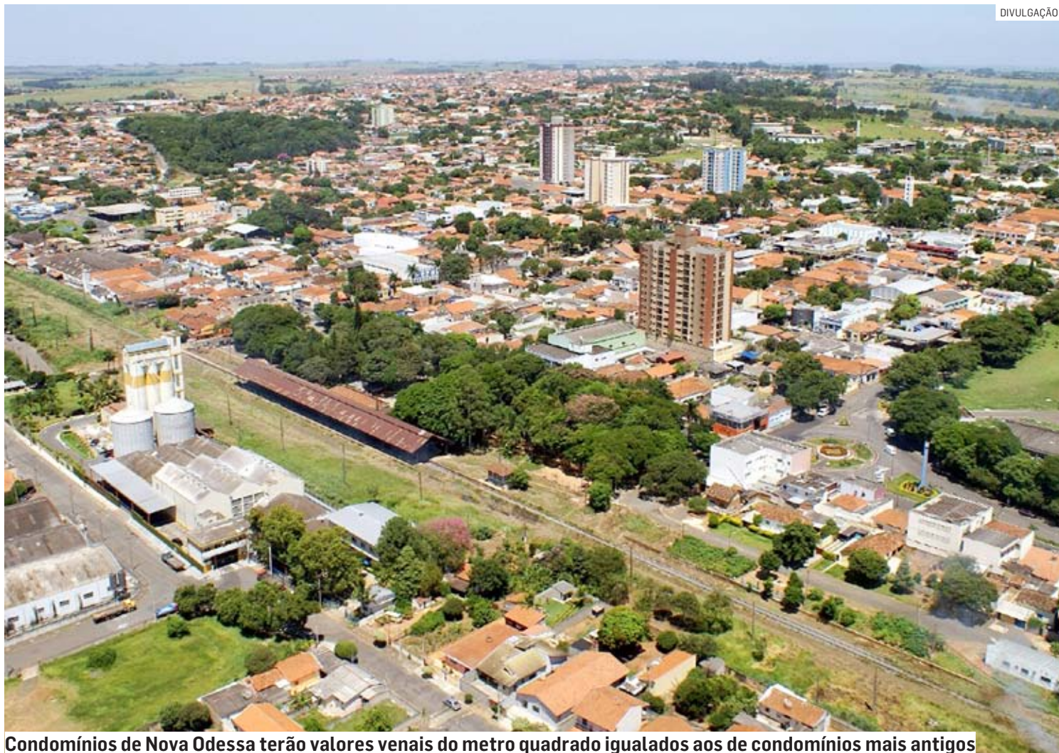
Condomínios de Nova Odessa terão valores venais do metro quadrado igualados aos de condomínios mais antigos

Como nos anos anteriores, o pagamento do imposto será feito em parcela única com 10% de desconto ou em dez prestações iguais, com