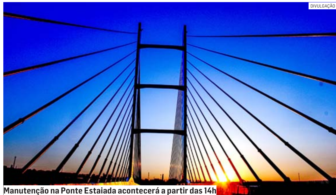
Manutenção na Ponte Estaiada acontecerá a partir das 14h