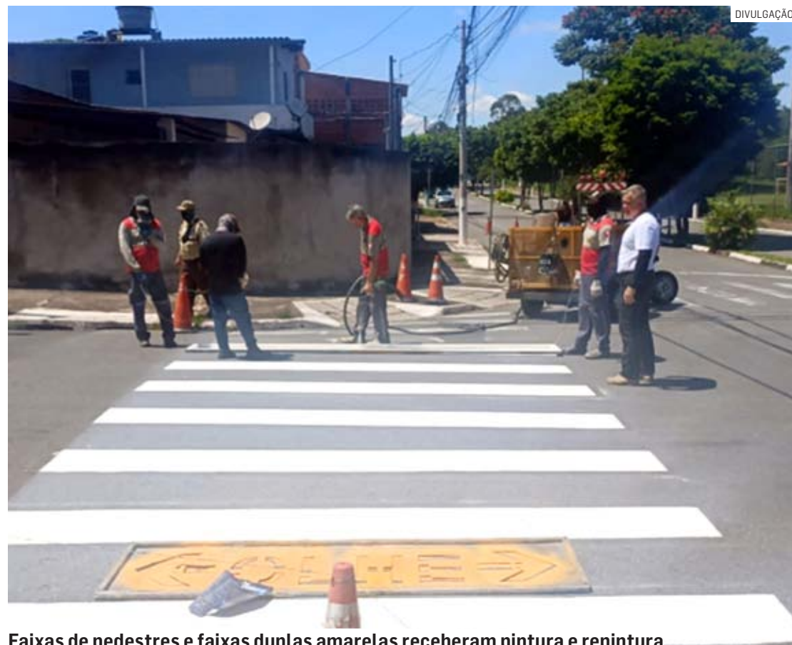
Faixas de pedestres e faixas duplas amarelas receberam pintura e repintura

Da Redação | HORTOLÂNDIA tribunaliberal@tribunaliberal.com.br