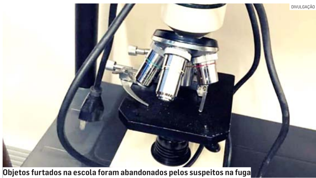
Objetos furtados na escola foram abandonados pelos suspeitos na fuga

Cézár Oliveira | HORTOLÂNDIA tribunaliberal@tribunaliberal.com.br