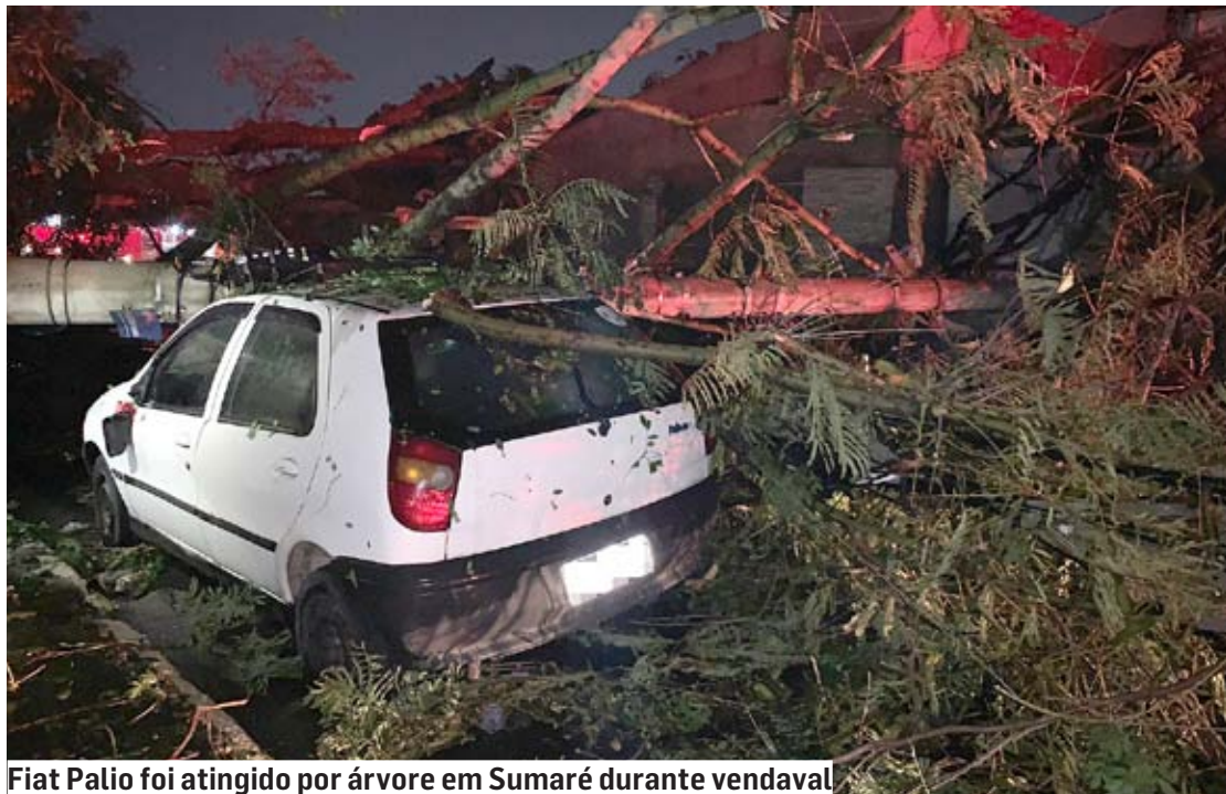
Fiat Palio foi atingido por árvore em Sumaré durante vendaval

Chuvas de 35 mm e ventos fortes também provocaram curto-circuito; carros foram atingidos por árvores