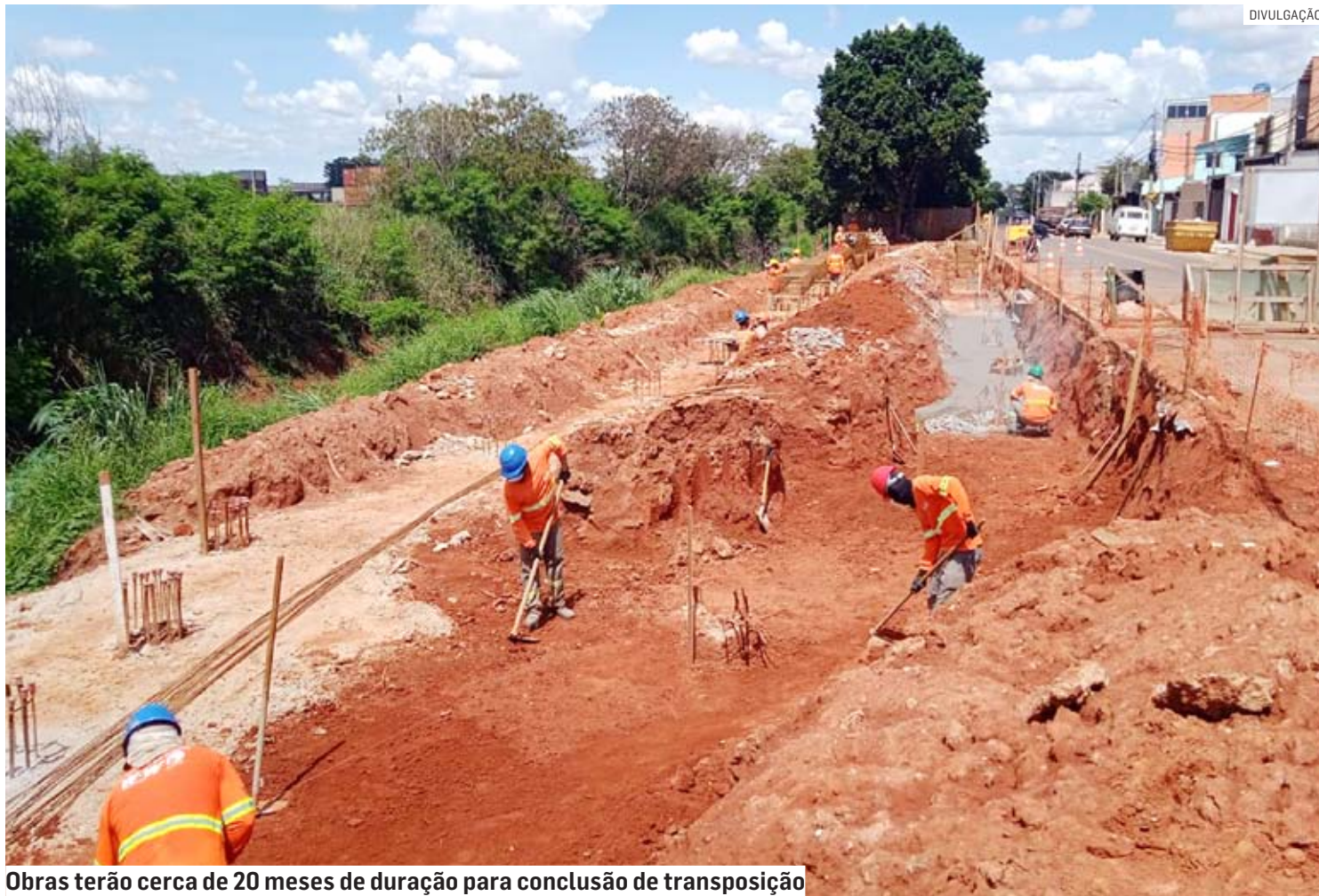
Obras terão cerca de 20 meses de duração para conclusão de transposição

“Esta é mais uma obra de grande importância para o desenvolvimento