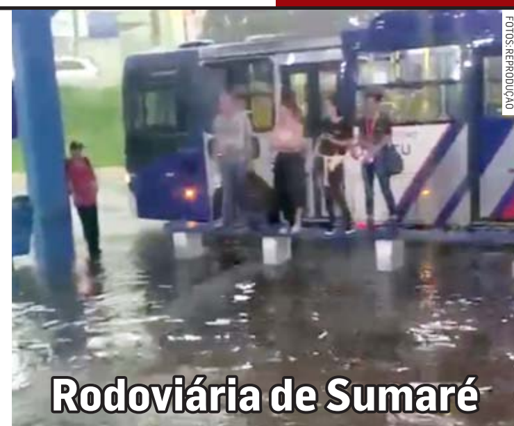
Rodoviária de Sumaré

As chuvas torrenciais que caíram sobre Sumaré na tarde desta quarta-feira (18) alagaram trecho entre a Rua Joaquim Ferreira Gomes e a Estrada Municipal Teodor Condiev, na saída para Hortolândia. Carros chegaram a ficar presos pela força da enxurrada no local. Pontos de alagamento também foram registrados na Avenida Rebouças. Em Nova Odessa, houve alagamento na Av. Ampélio Gazzetta. Na terça-feira, 14 árvores caíram em Sumaré e Hortolândia e carros foram atingidos. Não houve registro de feridos. Em Sumaré, a Rodoviária Municipal e a UPA Macarenko (fotos) também ficaram inundadas. PÁGINA 04