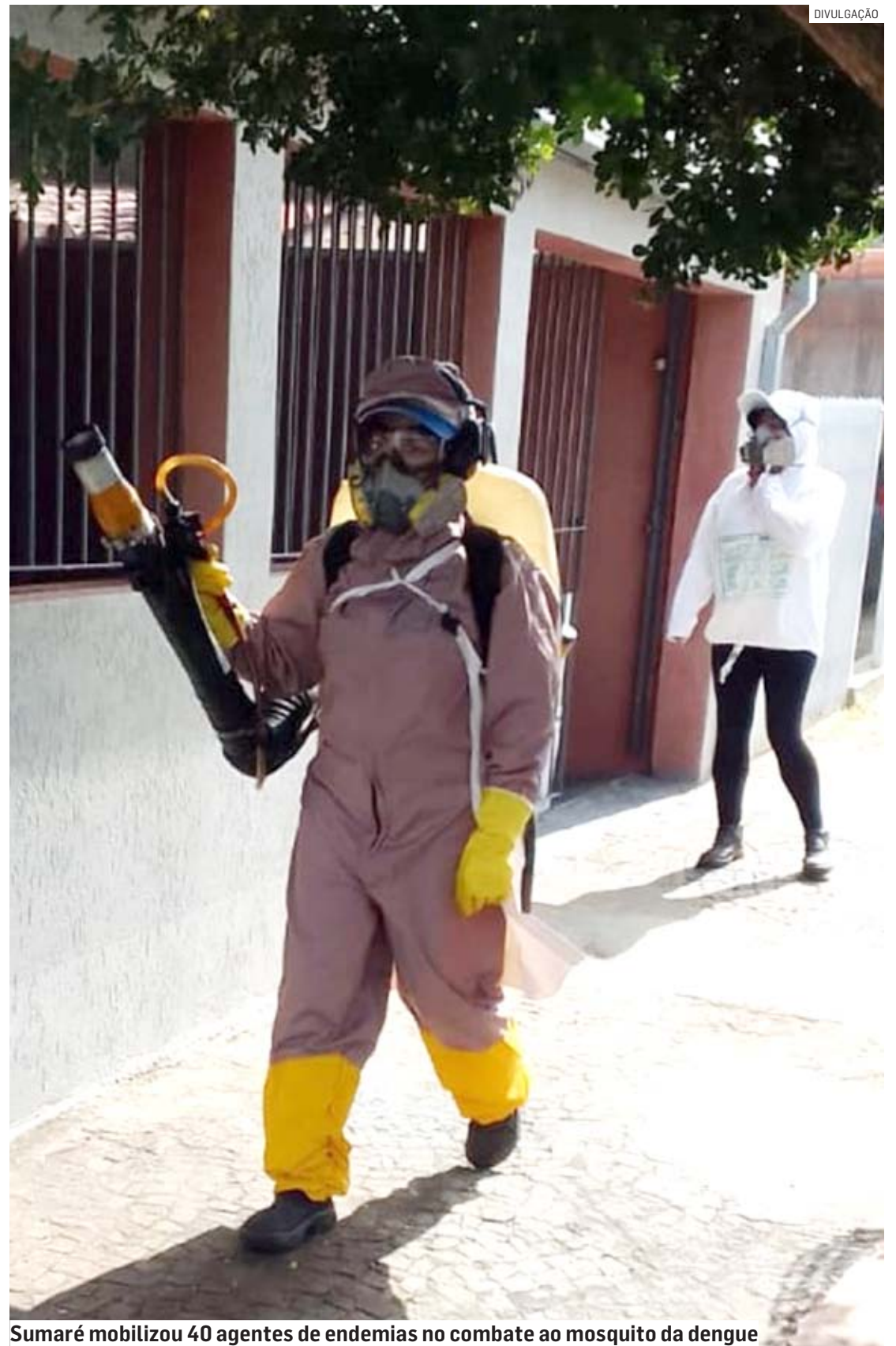
Sumaré mobilizou 40 agentes de endemias no combate ao mosquito da dengue

Os sintomas de dengue, chikungunya ou zika são bem parecidos. Eles incluem febre de início abrupto acompanhada de dor de cabeça, dores no corpo e articulações, prostração, fraqueza, dor atrás dos olhos, erupção e coceira na pele, manchas vermelhas pelo corpo, além de náuseas, vômitos e dores abdominais. A orientação de especialistas é para que a população procure a unidade de saúde mais próxima de sua residência assim que surgirem os primeiros sintomas.