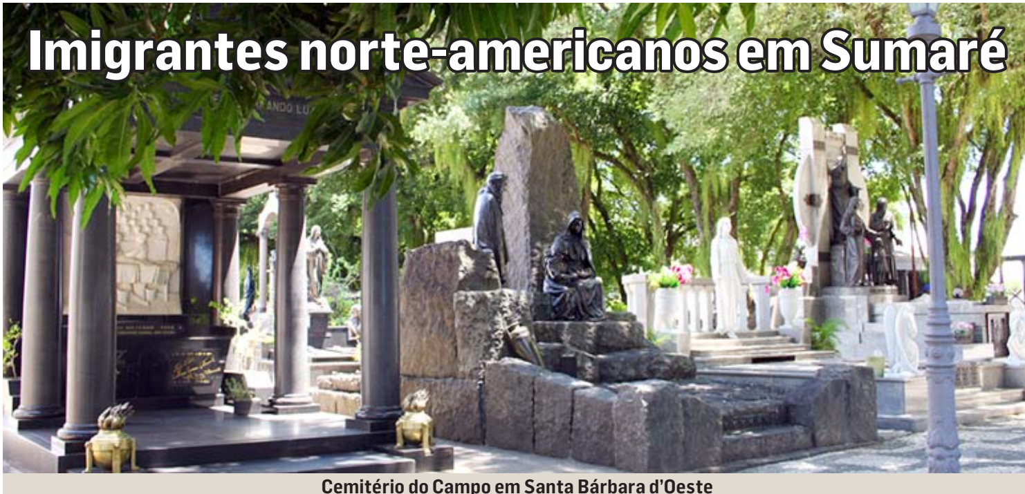
Cemitério do Campo em Santa Bárbara d'Oeste

Uma história detalhada da presença dos imigrantes norte-americanos em Rebouças-Sumaré ainda está por ser escrita.