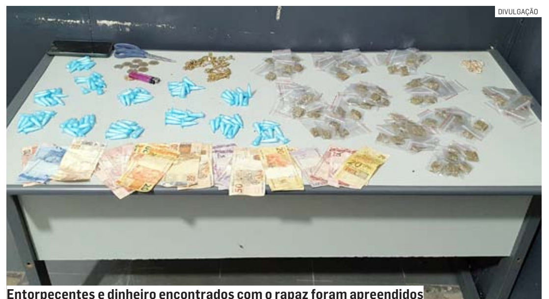
Entorpecentes e dinheiro encontrados com o rapaz foram apreendidos

Levado ao Plantão Policial de Hortolândia, o rapaz foi autuado em flagrante, permanecendo à disposição da justiça.