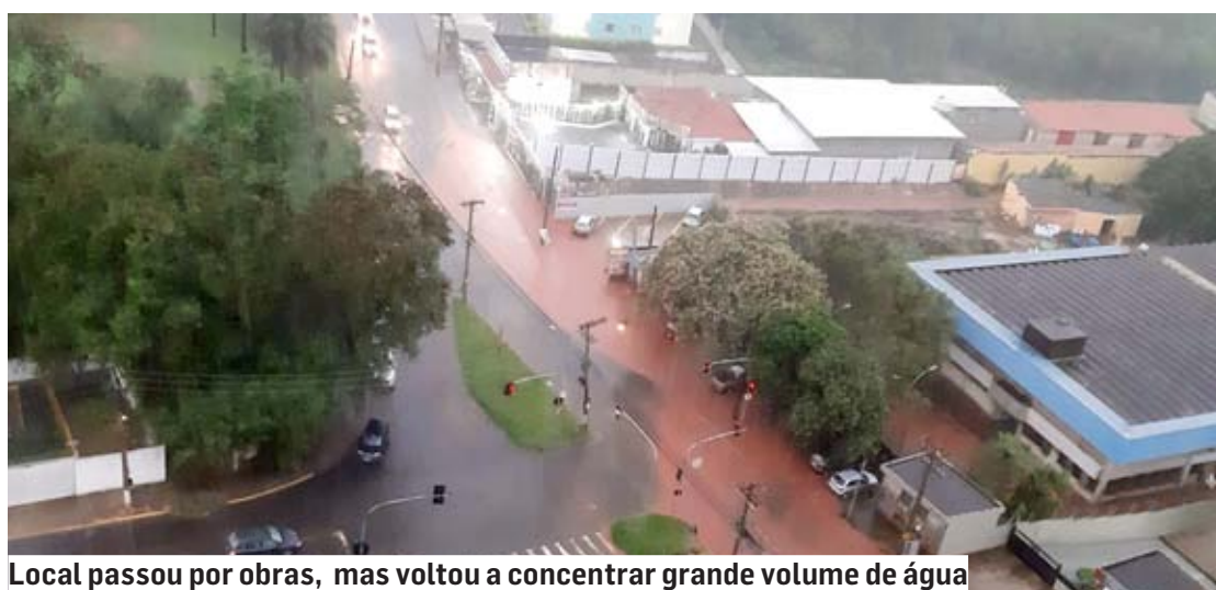
Local passou por obras, mas voltou a concentrar grande volume de água

As chuvas torrenciais que caíram sobre Sumaré na tarde desta quarta-feira (18) alagaram trecho entre a Rua Joaquim Ferreira Gomes e a Estrada Municipal Teodor Condiév, na saída para Hortolândia. Carros chegaram a ficar presos pela força da enxurrada no local.