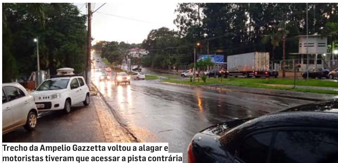
Trecho da Ampelio Gazzetta voltou a alagar e motoristas tiveram que acessar a pista contrária

Em Hortolândia, a Defesa Civil informou na noite desta quarta-feira que ainda não havia registrado ocorrências.