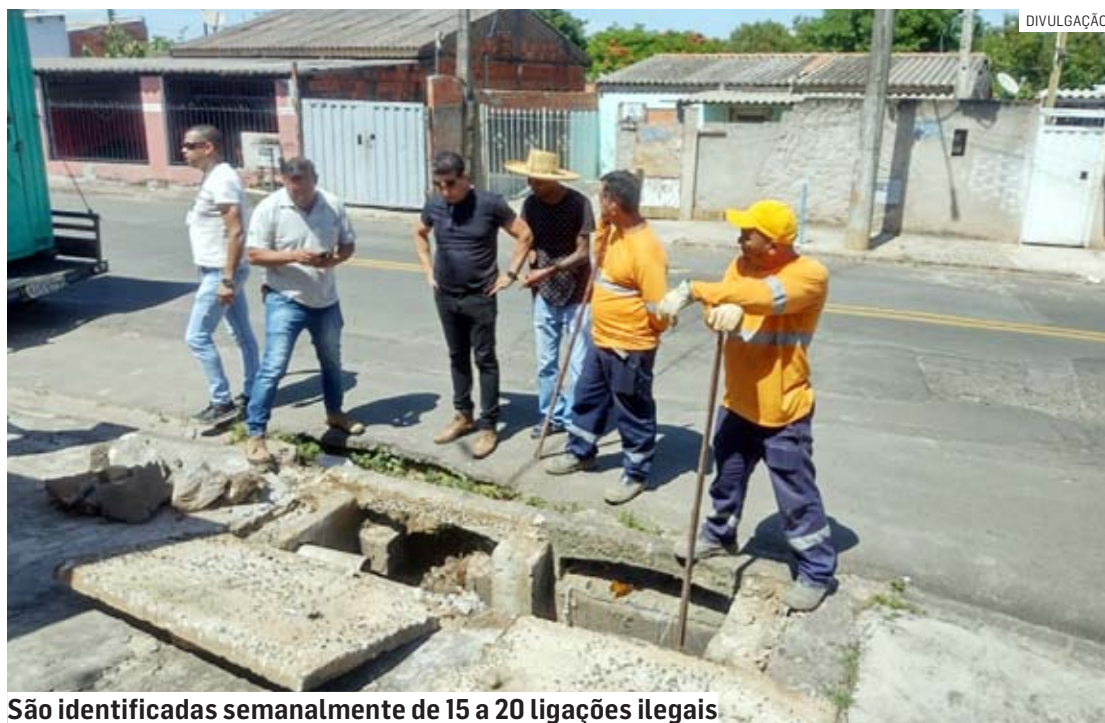
São identificadas semanalmente de 15 a 20 ligações ilegais

A Secretaria de Meio Ambiente e Desenvolvimento Sustentável explica que o descarte de resíduos na rede