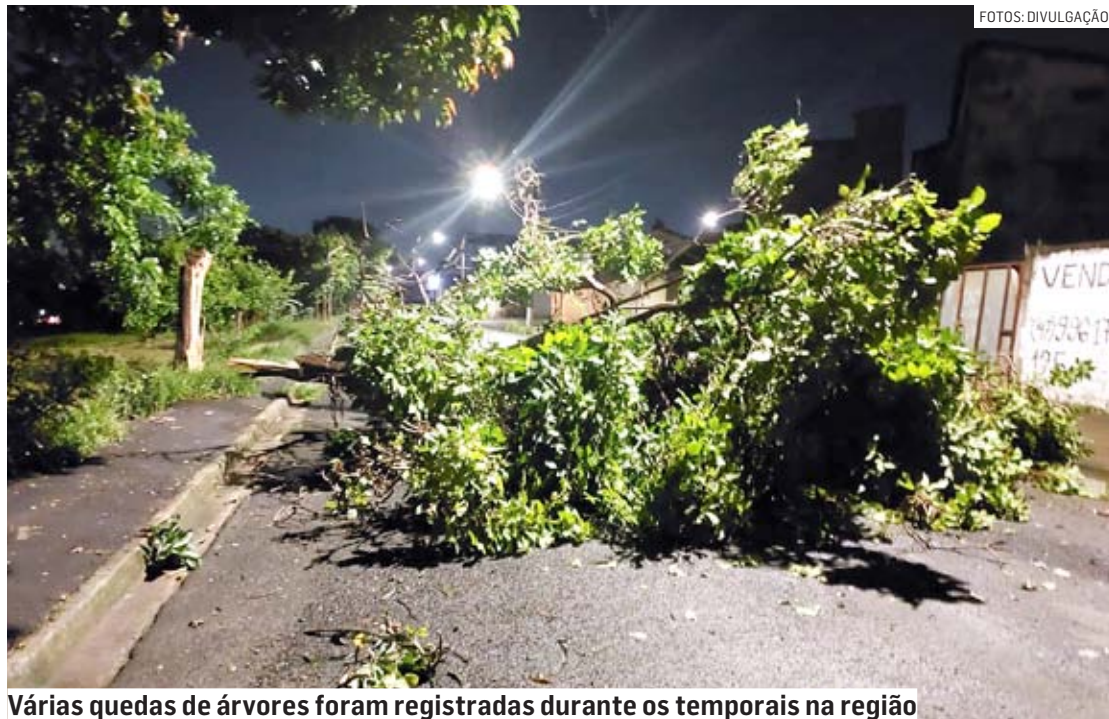
Várias quedas de árvores foram registradas durante os temporais na região

Paulo Medina | REGIÃO paulo.medina@tribunaliberal.com.br