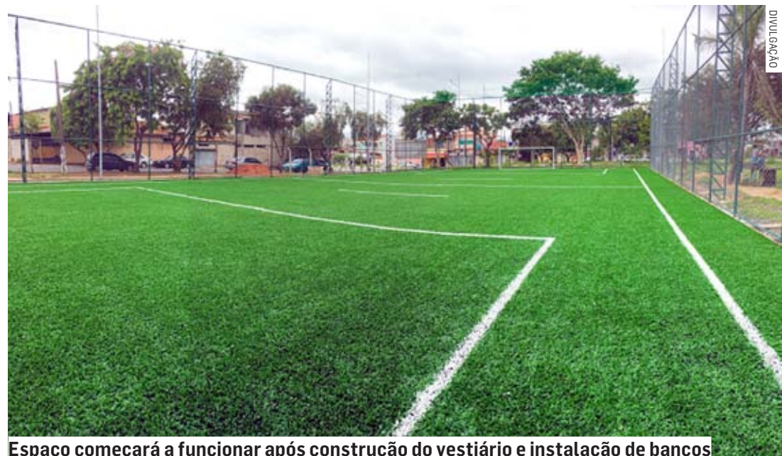
Espaço começará a funcionar após construção do vestiário e instalação de bancos

Da Redação | HORTOLÂNDIA tribunaliberal@tribunaliberal.com.br