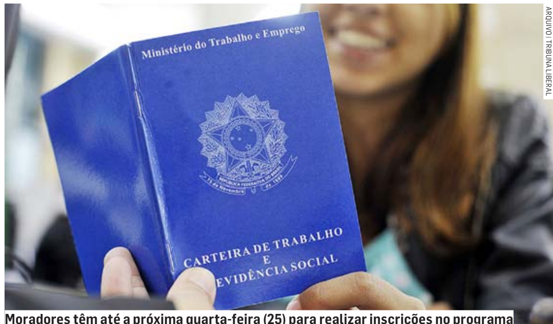
Moradores têm até a próxima quarta-feira (25) para realizar inscrições no programa

Da Redação | PAULÍNIA tribunaliberal@tribunaliberal.com.br