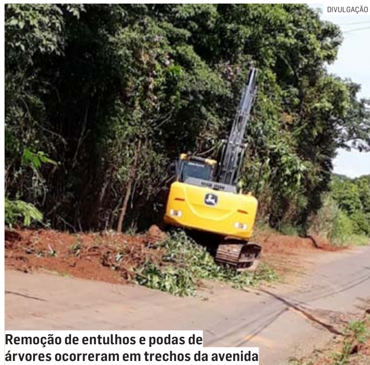
Remoção de entulhos e podas de árvores ocorreram em trechos da avenida