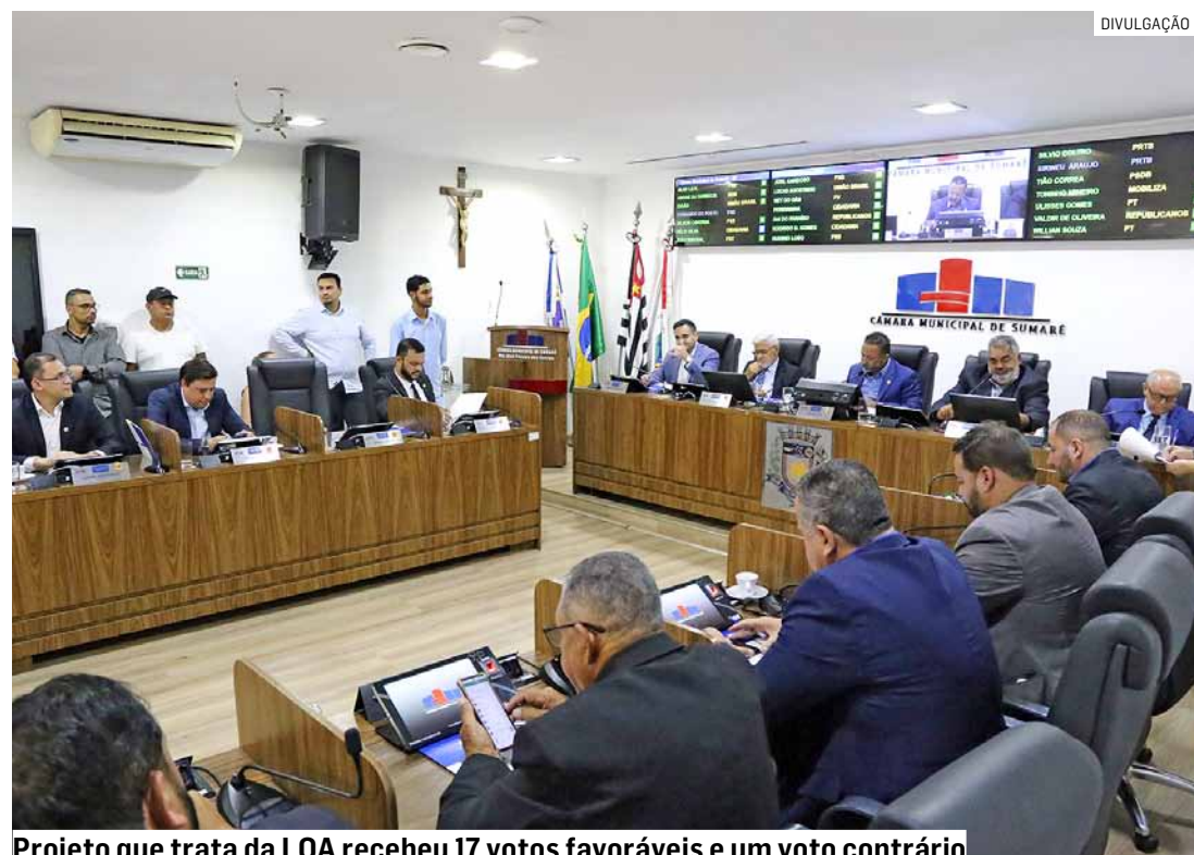
Projeto que trata da LOA recebeu 17 votos favoráveis e um voto contrário