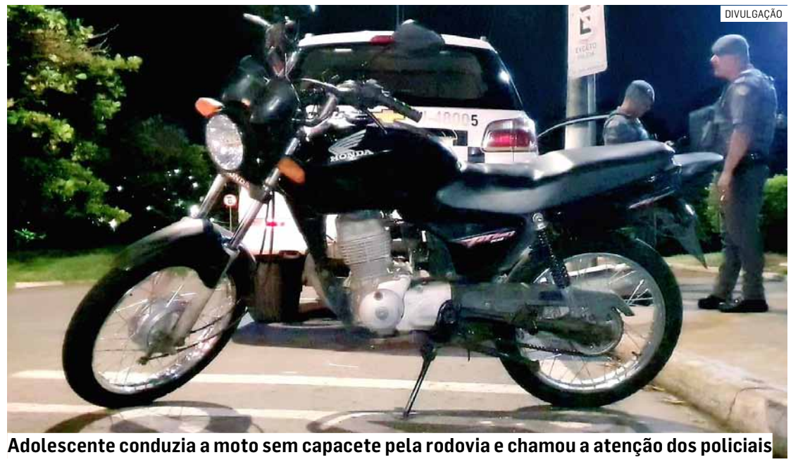
Adolescente conduzia a moto sem capacete pela rodovia e chamou a atenção dos policiais

Os policiais entraram em contato com o proprietário da motocicleta e ele informou que a veículo tinha sido furtado na rua em frente da empresa onde trabalhava. O adolescente e a motocicleta foram apresentados ao Plantão Policial de Hortolândia, onde o delegado determinou pelo registro do boletim de ocorrência de ato infracional análogo ao crime de furto e o adolescente permaneceu à disposição da Justiça.