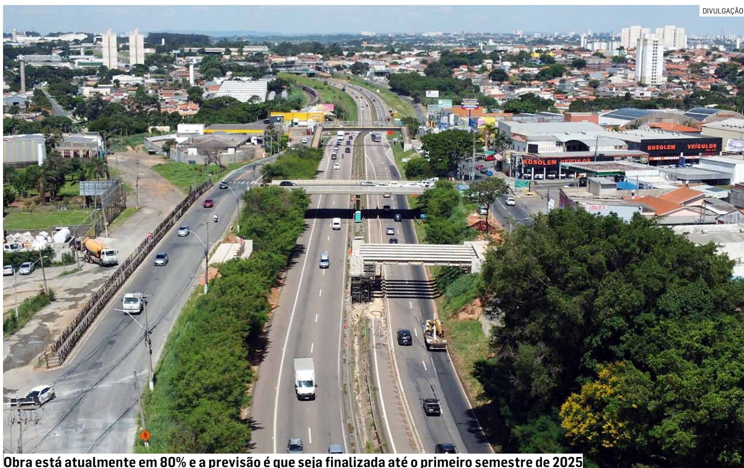
Obra está atualmente em 80% e a previsão é que seja finalizada até o primeiro semestre de 2025

Em razão do içamento das vigas, previsto para ser executado na noite desta terça-feira (17), houve bloqueio do tráfego na rodovia SP-101, no sentido Monte Mor. Os motoristas precisaram trafegar pela rua Waldiva Fernandes Duarte da Silva, no Jardim Sumarezinho. Agentes de trânsito permaneceram no local da operação para orientar os motoristas. O bloqueio do trânsito estava previsto para durar até às 5h desta quarta-feira (18).