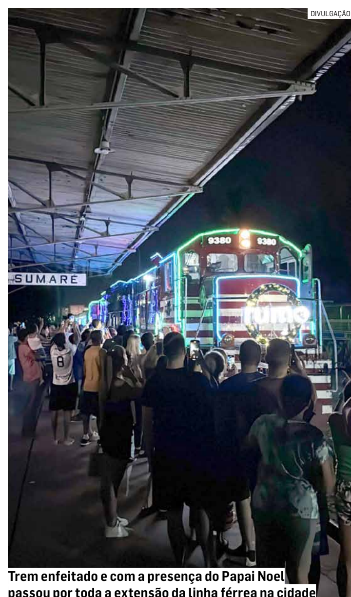
Trem enfeitado e com a presença do Papai Noel passou por toda a extensão da linha férrea na cidade

O trem iluminado da Rumo vai levar a magia do Natal a mais de 90 municípios de São Paulo. As locomotivas C30-7, General Electric Transportation, sendo uma da Rumo e outra da Associação Brasileira de Preservação Ferroviária, percorrerão mais de 1,9 mil quilômetros no interior, no litoral e na Capital. No total, foram utilizados mais de 1,5 mil metros de fitas led na decoração do trem.