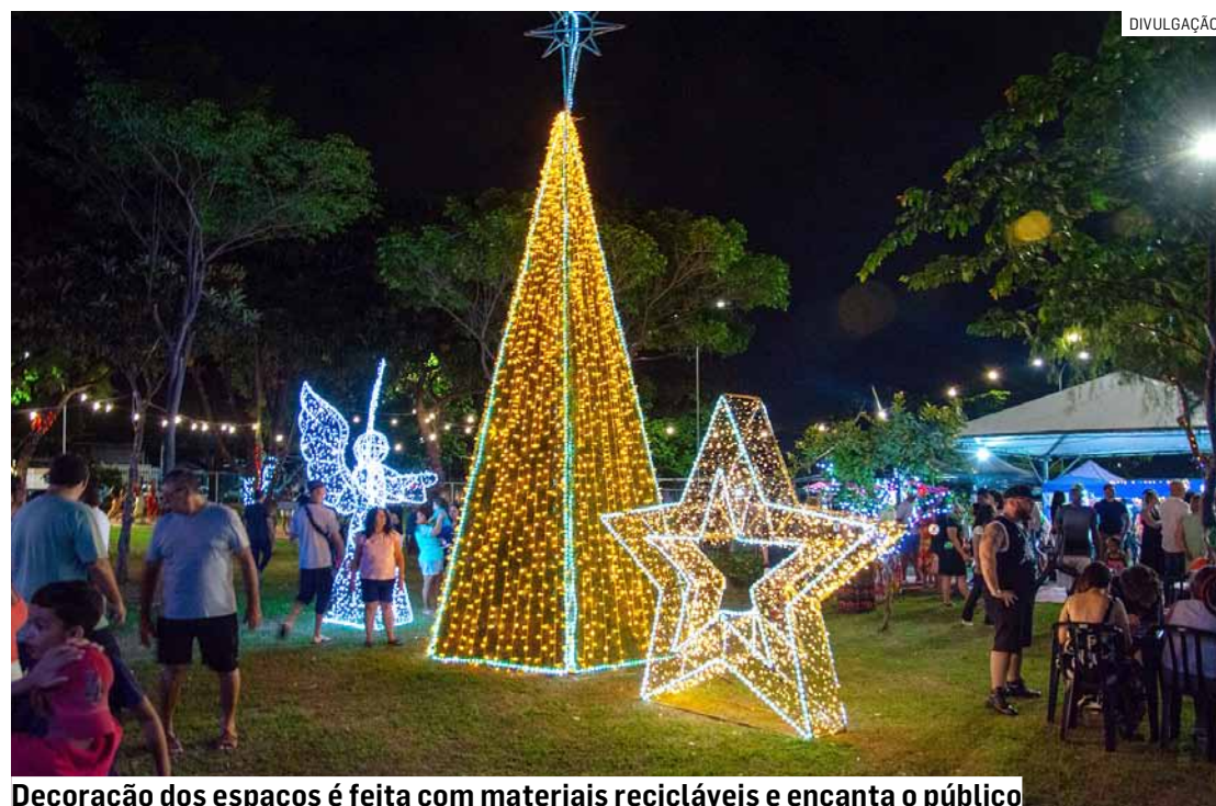
Decoração dos espaços é feita com materiais recicláveis e encanta o público

No Parque Socioambiental Irmã Dorothy Stang, no Jardim Nossa Senhora de Fátima, a programação natalina chega à 8ª edição neste ano. Já no OAPE (Observatório Ambiental Parque Escola), no Santa Clara do Lago, os festejos estão na segunda edição. Neste período especial, os dois par-