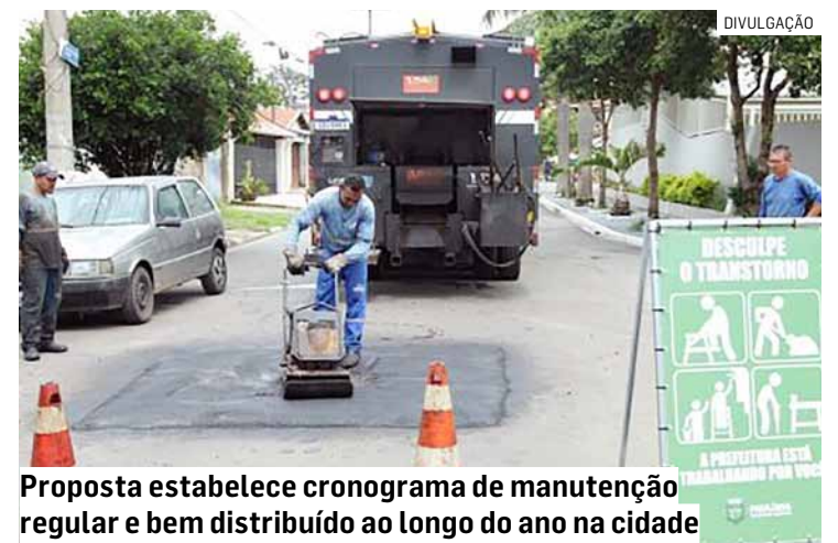
Proposta estabelece cronograma de manutenção regular e bem distribuído ao longo do ano na cidade

Outras propostas incluem ainda aumentar a quantidade de ônibus nas linhas que passam em frente à Replan, visando atender os trabalhadores daquele setor e construir uma unidade básica de saúde no Residencial Marieta Dian.