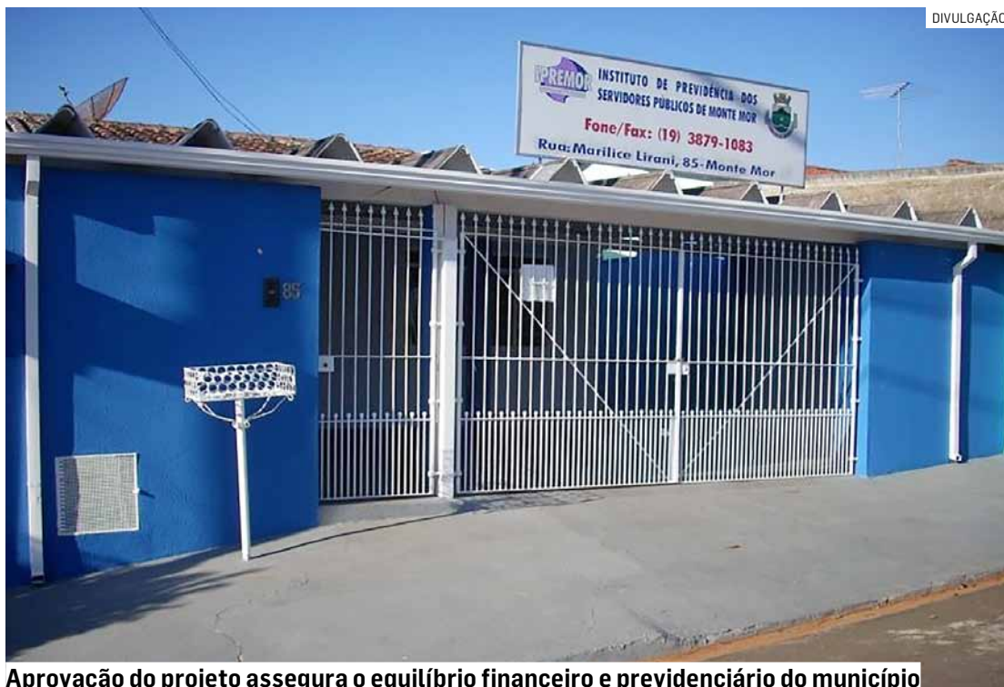
Aprovação do projeto assegura o equilíbrio financeiro e previdenciário do município

Com o texto, o Executivo fica autorizado a realizar "o parcelamento dos débitos oriundos das contribuições previdenciárias devidas e não repassadas pelo município (patronal) ao Regime Próprio de Previdência Social, das competências de janeiro a dezembro de 2024, inclusive 13º salários, em até 60 prestações mensais, iguais e consecutivas". O projeto também proíbe