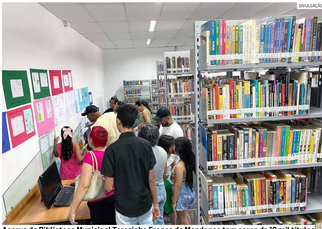
Acervo da Biblioteca Municipal Terezinha França de Mendonça tem cerca de 18 mil títulos