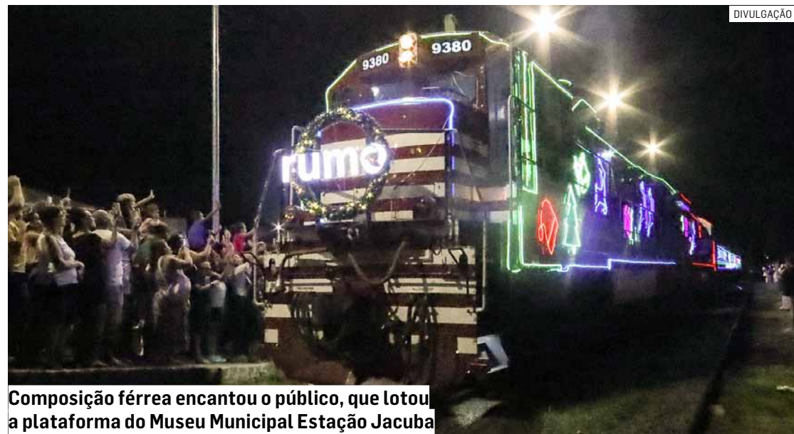
Composição férrea encantou o público, que lotou a plataforma do Museu Municipal Estação Jacuba

Da Redação • HORTOLÂNDIA tribunaliberal@tribunaliberal.com.br