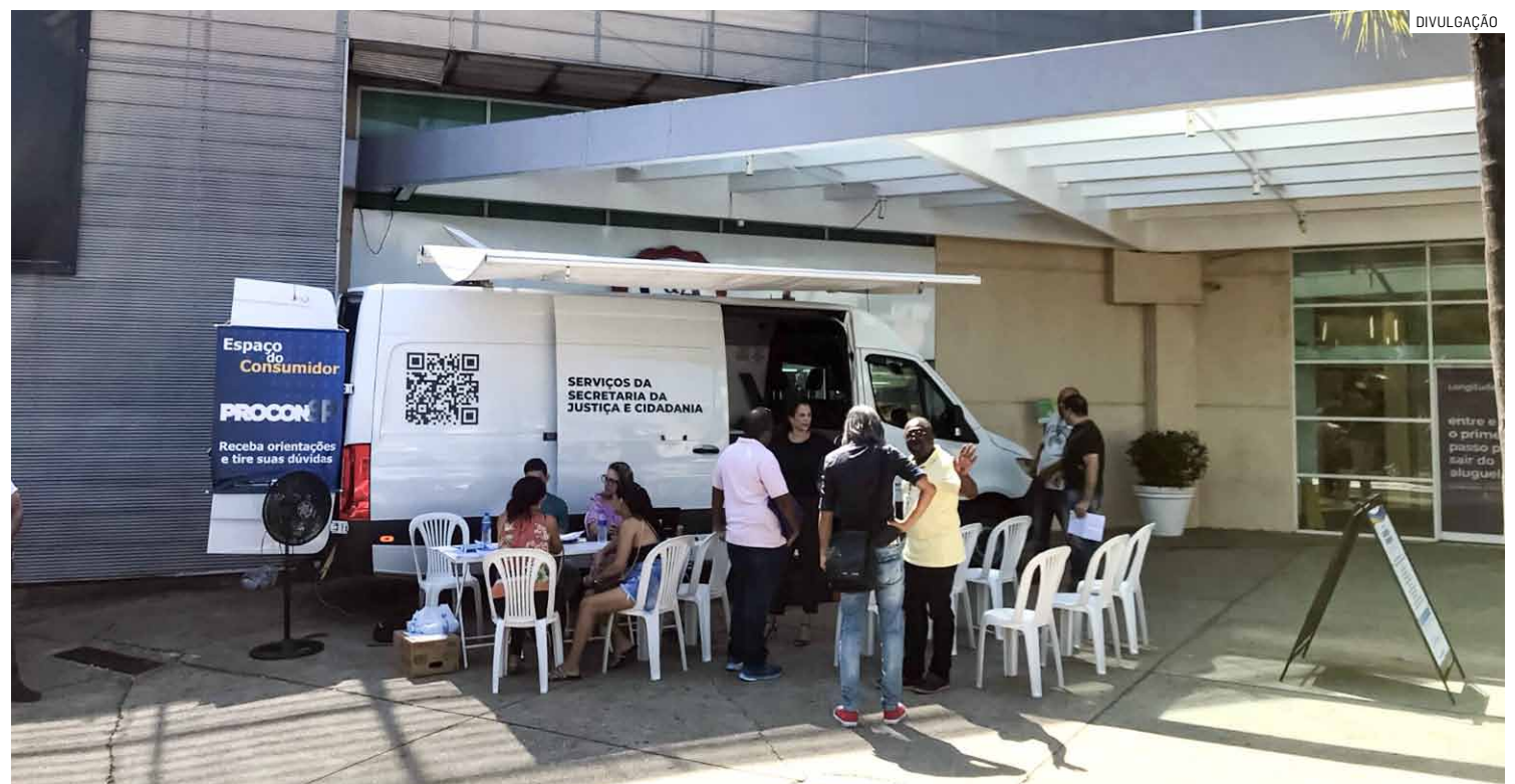
Consumidores devem ficar atentos a promoções atrativas oferecidas nessa época, alerta o Procon

O Código de Defesa do Consumidor estabelece