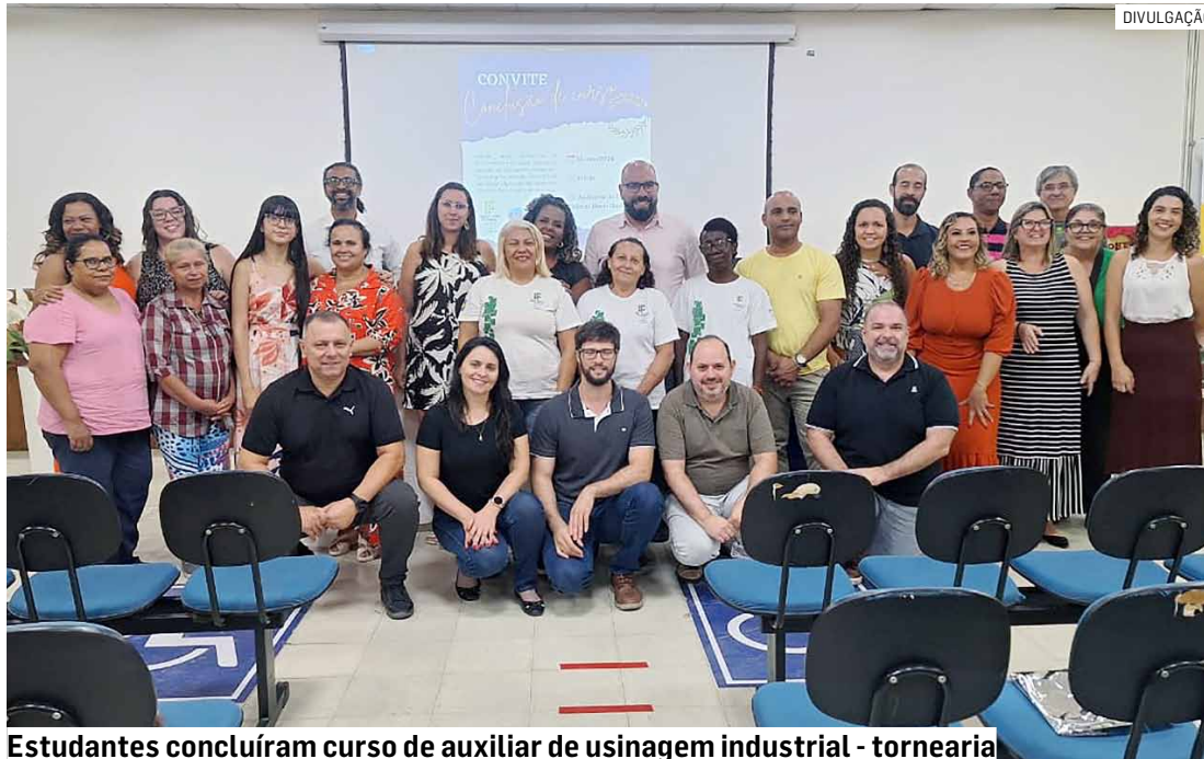
Estudantes concluíram curso de auxiliar de usinagem industrial - tornearia

Segundo a Secretária de Educação, Ciência e Tecnologia, a cerimônia festiva marcou mais uma importante etapa da cooperação entre a administração