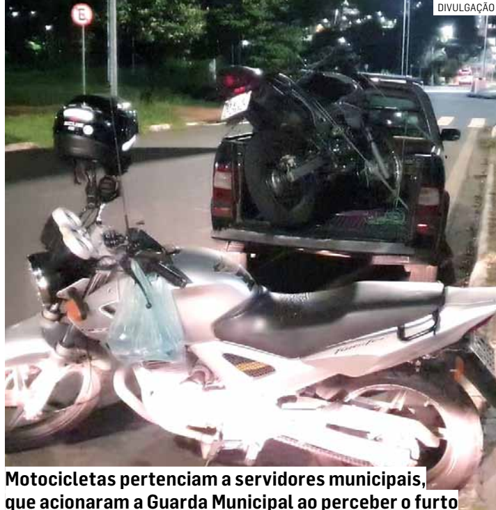
Motocicletas pertenciam a servidores municipais, que acionaram a Guarda Municipal ao perceber o furto

Durante a abordagem, nada de ilícito foi encontrado com os suspeitos. Ao verificar as motos das vítimas, os guardas municipais constataram que ambas estavam com os miolos da chave danificados.