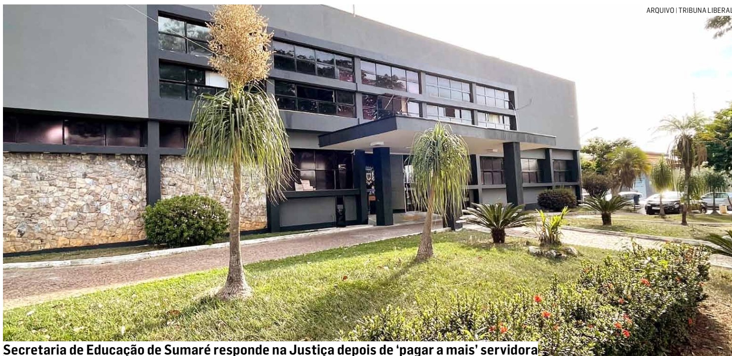
Secretaria de Educação de Sumaré responde na Justiça depois de 'pagar a mais' servidora

A professora alegou que os valores recebidos foram frutos de um erro exclusivo da administração, do qual não tinha ciência e que foram percebidos de boa-fé. Ela ainda argumentou que