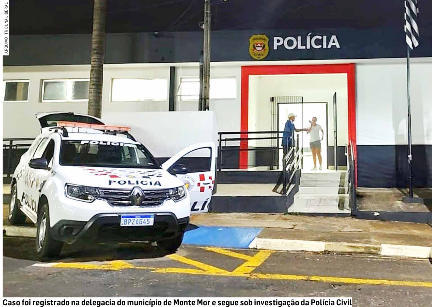
Caso foi registrado na delegacia do município de Monte Mor e segue sob investigação da Polícia Civil

Trabalhador tinha três perfurações de marcas de disparos de arma de fogo e trajava uniforme de empresa da cidade