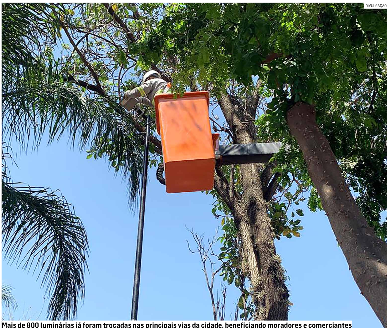
Mais de 800 luminárias já foram trocadas nas principais vias da cidade, beneficiando moradores e comerciantes

O magistrado entendeu a justificativa da prefeitura e