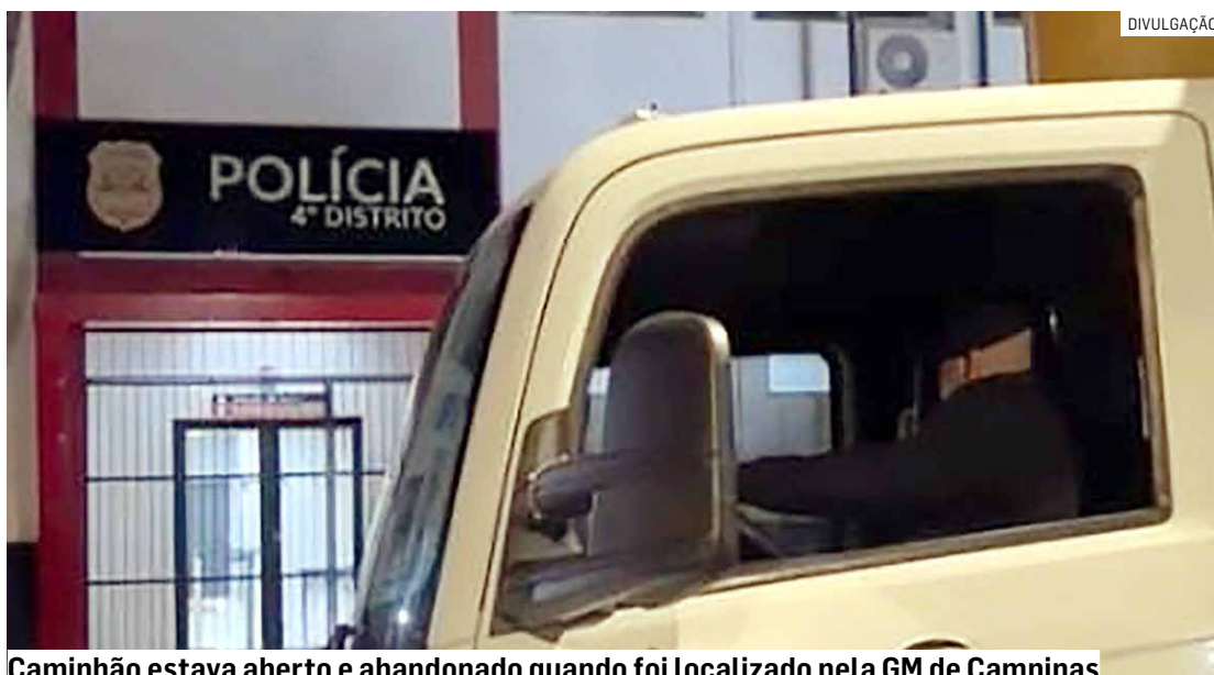
Caminhão estava aberto e abandonado quando foi localizado pela GM de Campinas

A equipe recebeu informações sobre o furto do veículo, e os dados do rastreador indicaram que ele estaria em Campinas. Assim, os guardas municipais iniciaram um patrulhamento e encontraram o caminhão. Até o fechamento desta edição ninguém foi preso.