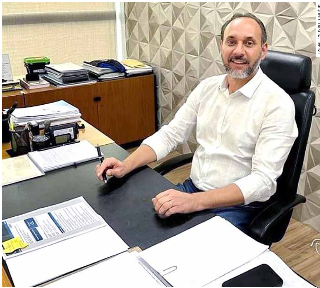
Prefeito de Paulínia paga mais de R$ 20 mil de aluguel do prédio da Farmácia de Alto Custo

O imóvel é utilizado para atender às necessidades da Farmácia de Alto Custo,