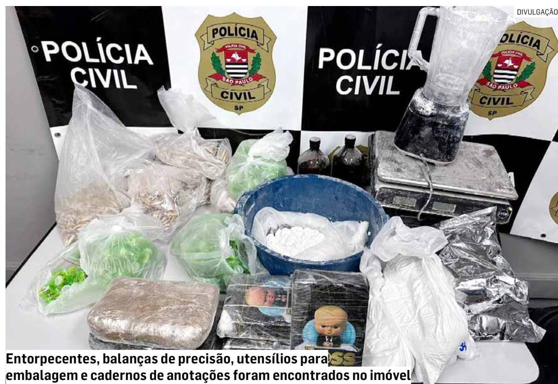
Entorpecentes, balanças de precisão, utensílios para embalagem e cadernos de anotações foram encontrados no imóvel