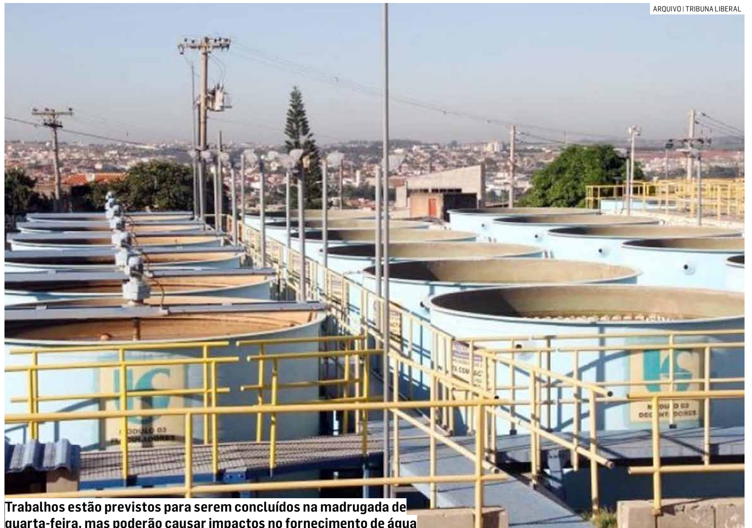
Trabalhos estão previstos para serem concluídos na madrugada de quarta-feira, mas poderão causar impactos no fornecimento de água

Em caso de dúvidas ou necessidade de notificação, os consumidores podem entrar em contato com a Sabesp através dos seguintes canais: o WhatsApp oficial da companhia, no número (11) 3388-8000, para envio de mensagens de texto, ou pela Central de Atendimento, no telefone