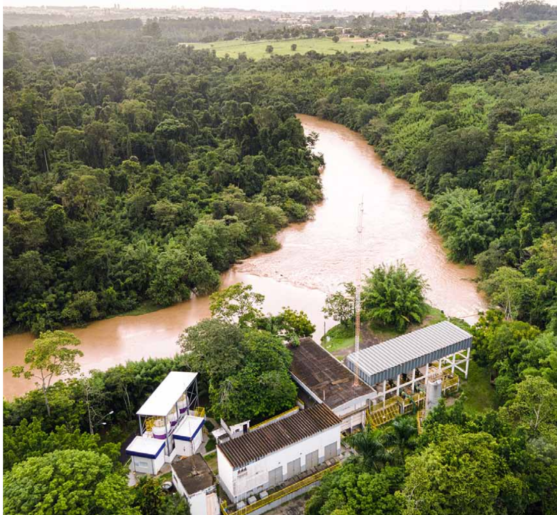
Rio Piracicaba está com a vazão abaixo da média histórica devido a estiagem prolongada