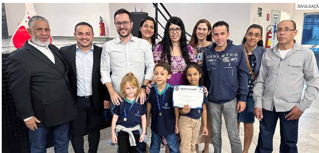
Luiz Dalben parabenizou todos os estudantes e professores que participaram do projeto

O prefeito de Sumaré Luiz Dalben (PSD) entregou nesta segunda-feira (16), a premiação para os melhores trabalhos apresentados na “5ª Mostra Científico-Cultural” da rede municipal de ensino. Foram premiados os alunos do Ensino Infantil, Fundamental I e Proeb de cada escola que mais se destacaram.