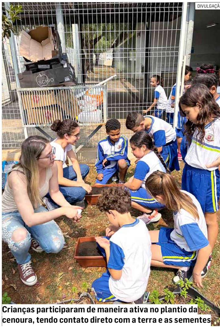
Crianças participaram de maneira ativa no plantio da cenoura, tendo contato direto com a terra e as sementes

"O objetivo das hortas escolares e oficinas é familiarizar os alunos com os alimentos ofertados na Merenda Escolar. Mostrar todo o processo do plantio até o