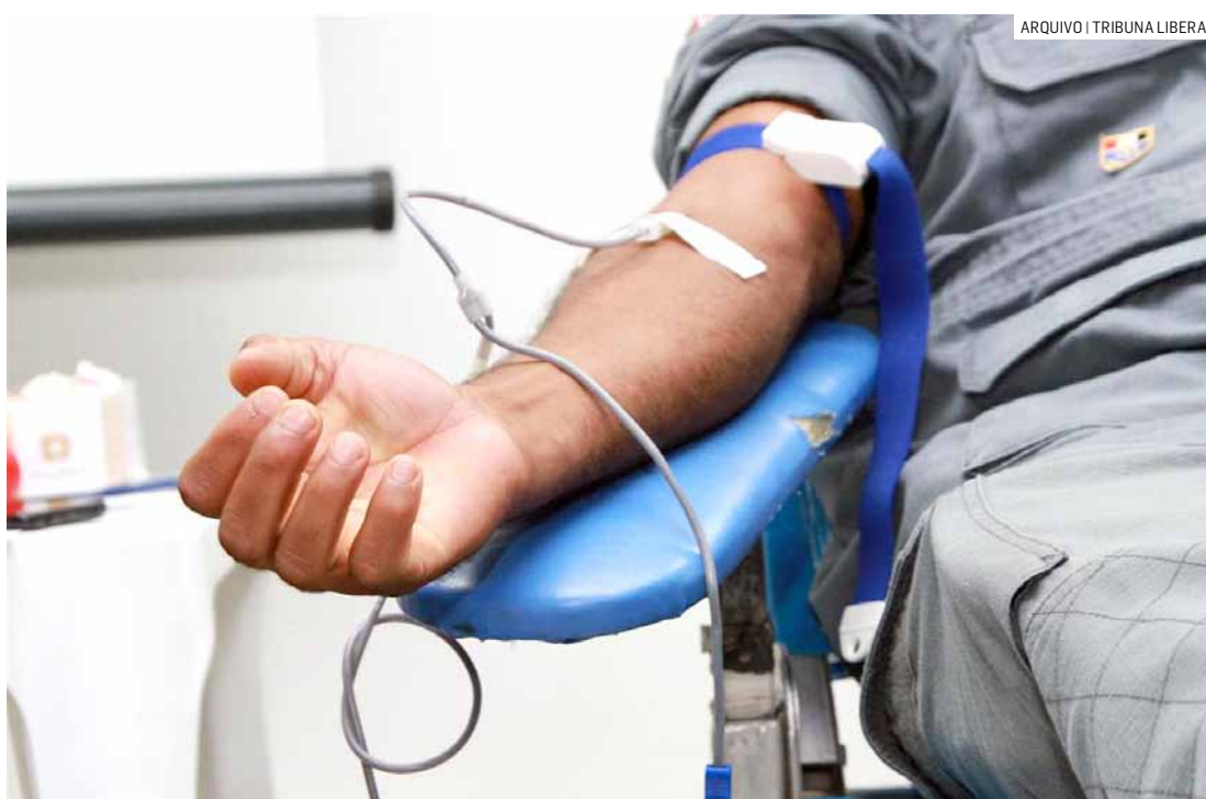
Coleta de amostras de sangue começa na segunda-feira (21), na UBS Dom Bruno Gamberini

O objetivo do projeto, criado pela startup gen-t, é mapear o genoma de cerca de 200 mil brasileiros. O mapeamento genético é feito pela coleta de uma amostra de sangue. Genoma é o conjunto de todos os genes que integram o organismo humano. Cada gene é formado por uma sequência específica de DNA (ácido desoxirribonucleico). Isso significa que cada pessoa é única, uma vez que a sequência do DNA de cada indivíduo é diferente da dos outros.