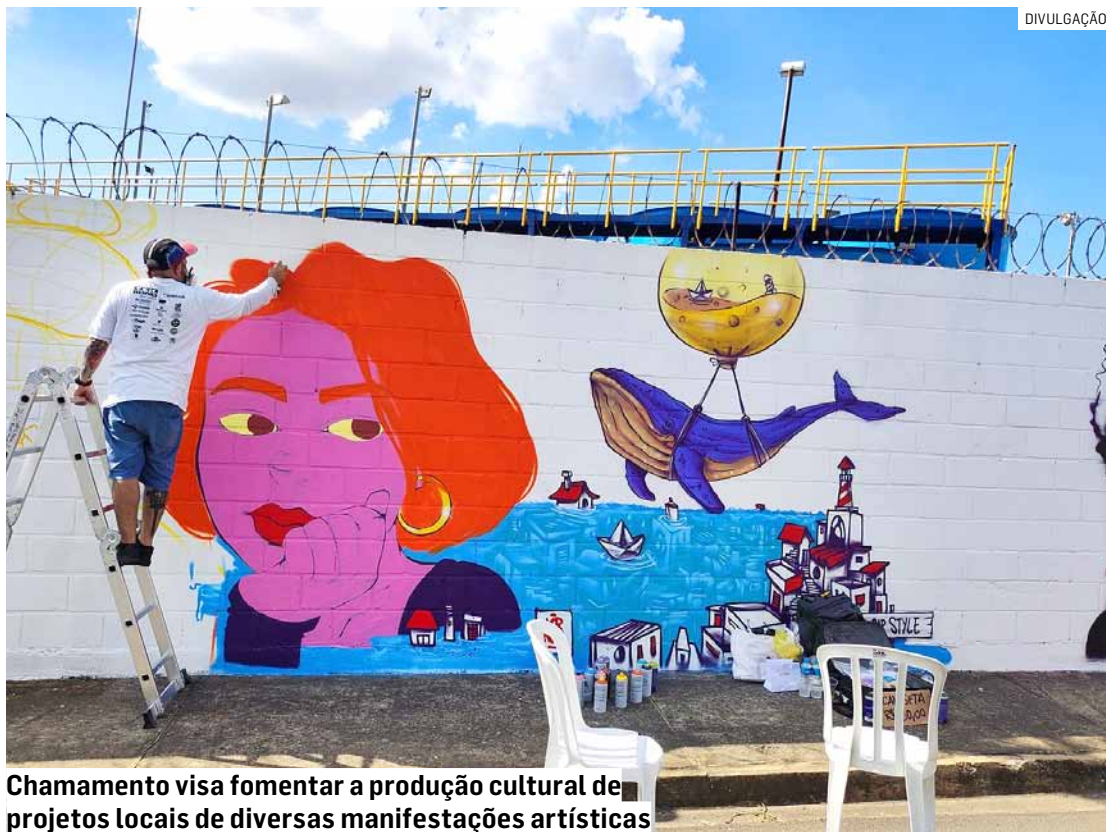
Chamamento visa fomentar a produção cultural de projetos locais de diversas manifestações artísticas

Promovido com recursos do Governo Federal, o chamamento público tem por objetivo fomentar a produ-