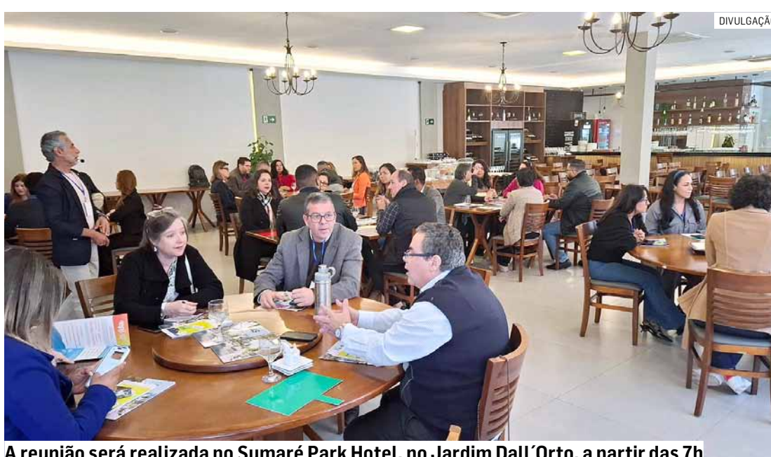
A reunião será realizada no Sumaré Park Hotel, no Jardim Dall'Orto, a partir das 7h

Esta é a segunda vez que o grupo Acias Ion se reúne na região do Jardim Dall'Orto. A ideia é faci-