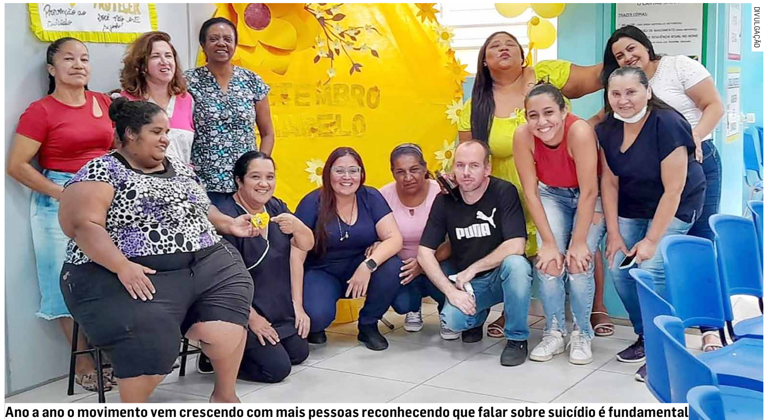
Ano a ano o movimento vem crescendo com mais pessoas reconhecendo que falar sobre suicídio é fundamental

Ao longo do mês, palestras, orientações e rodas de conversas acontecem nas unidades de saúde, que contam com uma decoração toda especial. Além disso, no dia 19 de setembro, haverá o I Seminário Municipal de Prevenção ao Suicídio na Infância e Adolescência, realizado pelo Programa de Fortale-