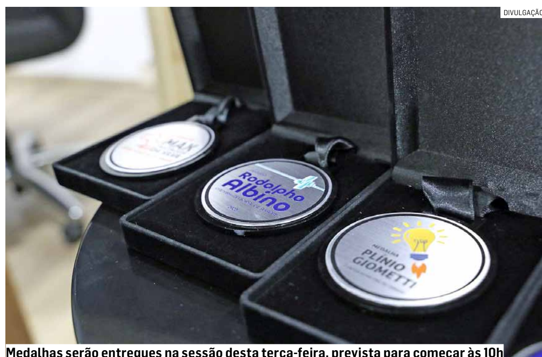
Medalhas serão entregues na sessão desta terça-feira, prevista para começar às 10h