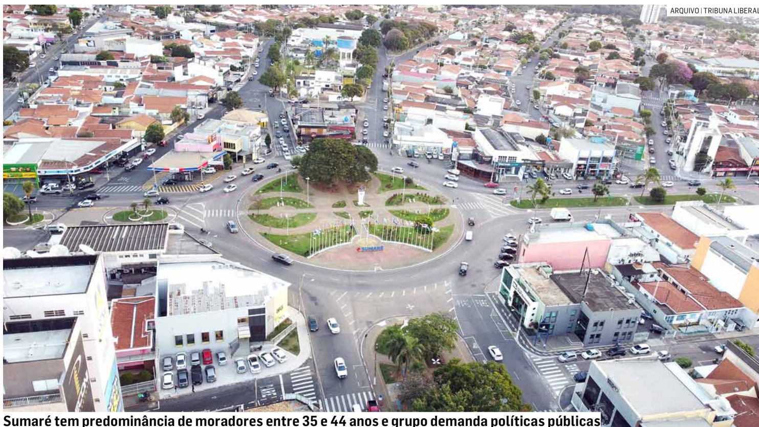
Sumaré tem predominância de moradores entre 35 e 44 anos e grupo demanda políticas públicas

O estudo detalha que há 12.131 homens e 12.523 mulheres entre 40 e 44 anos em Sumaré. Na faixa dos 35 aos 39 anos, são 12.055 homens e 12.787 mulheres. Esses números refletem um equilíbrio demográfico entre os gêneros nesta faixa etária específica. A comparação com Nova Odessa e Monte Mor destaca a relevância des-