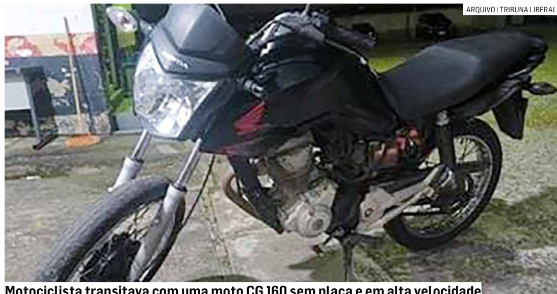
Motociclista transitava com uma moto CG 160 sem placa e em alta velocidade

Em vistoria no veículo, foi constatado que os números do motor e do chassi foram suprimidos. O suspeito foi conduzido inicialmente à UPA (Unidade de Pronto Atendimento) Jardim Rosolém e posteriormente ao Plantão Policial de Hortolândia, onde permaneceu preso.