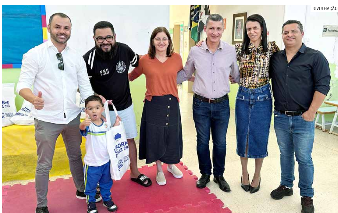
Alunos estão recebendo uniformes gratuitos da prefeitura pelo segundo ano consecutivo