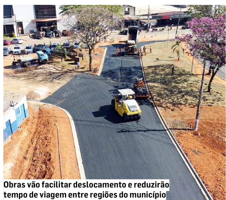
Obras vão facilitar deslocamento e reduzir tempo de viagem entre regiões do município

Sumaré está prestes a concluir uma das obras mais relevantes para a infraestrutura urbana da cidade: a nova ponte sobre o Ribeirão Quilombo. Esta estrutura, que liga o Centro à região de Nova Veneza, representa um marco na modernização e melhoria da mobilidade urbana municipal. As obras, que estão na reta final, vão facilitar o deslocamento e reduzir o tempo de viagem entre essas importantes áreas do município.