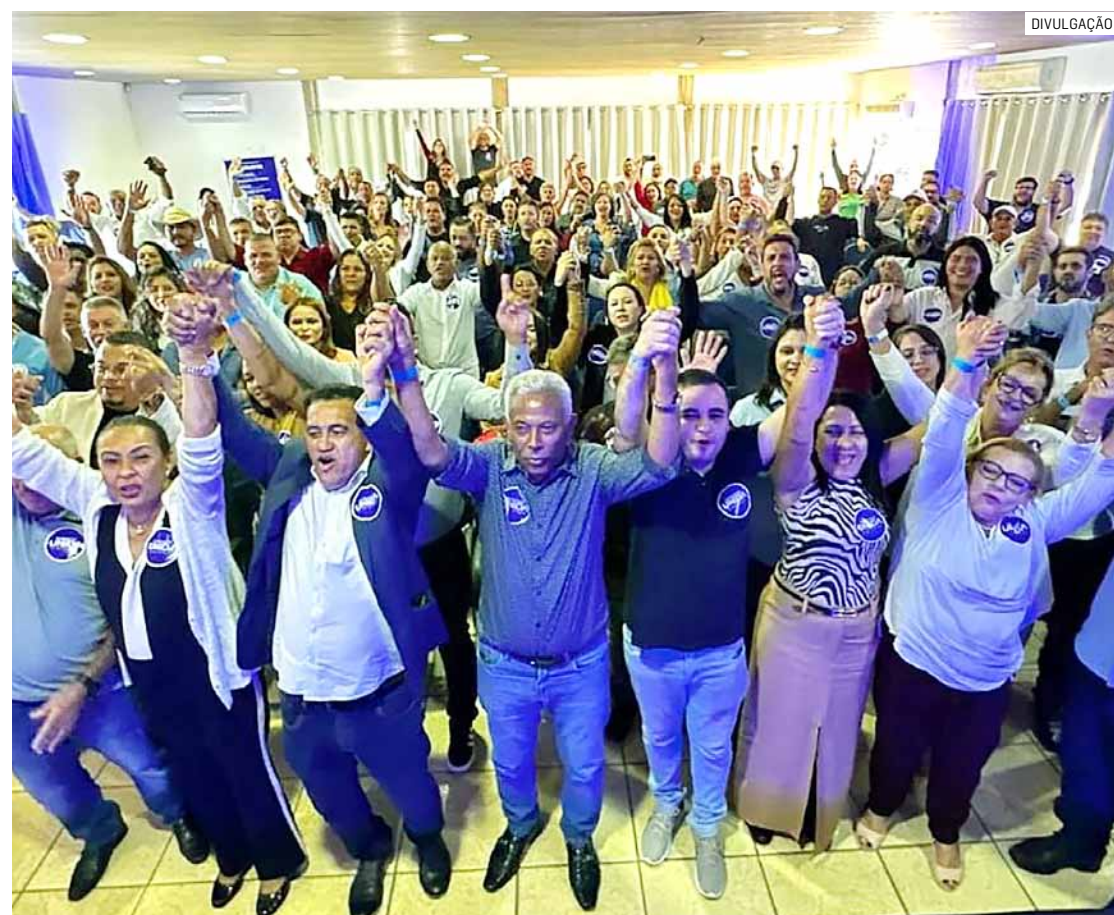
Evento aconteceu na Estância Árvore da Vida e reuniu pré-candidatos a vereador da coligação

O evento, realizado na Estância Árvore da Vida, foi um marco para o pré-