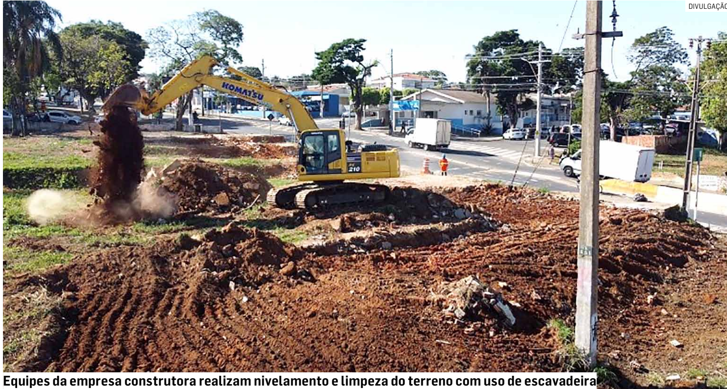
Equipes da empresa construtora realizam nivelamento e limpeza do terreno com uso de escavadeira