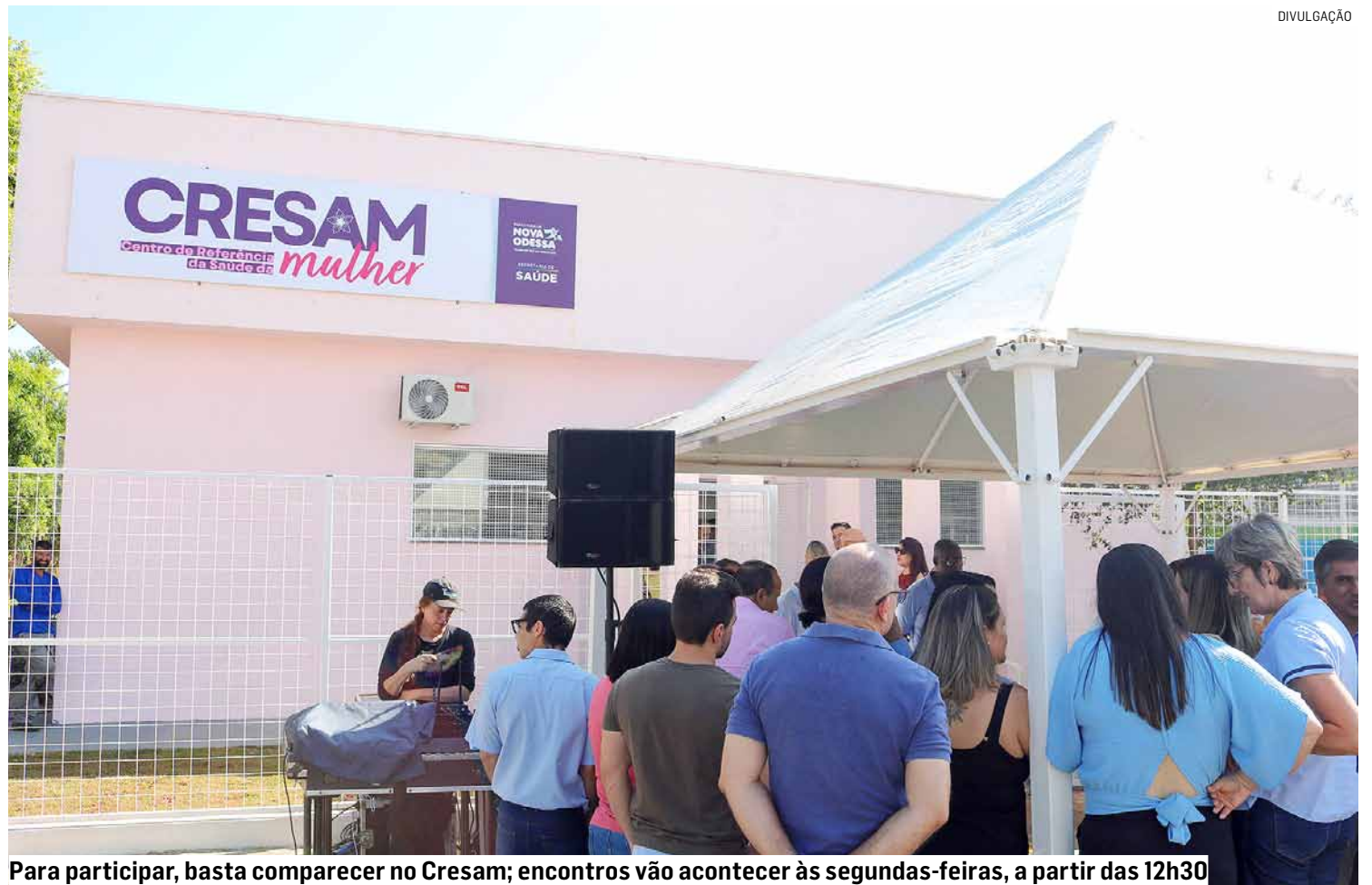
Para participar, basta comparecer no Cresam; encontros vão acontecer às segundas-feiras, a partir das 12h30

Os encontros do Grupo Reviver serão conduzidos por uma equipe multiprofissional altamente qualificada, preparada para oferecer um acompanhamento integral às participantes. Nestes encontros, as inscritas terão acesso a uma equipe médica especializada em Ginecologia, que será responsável por avaliar as mudanças no corpo da mulher e fornecer informações detalha-