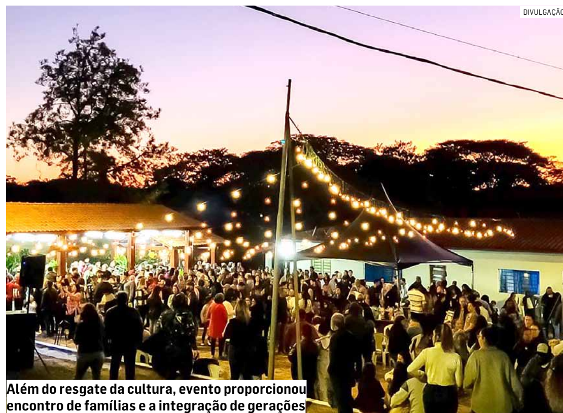
Além do resgate da cultura, evento proporcionou encontro de famílias e a integração de gerações

“Eu amei o evento. Não tinha ido nos outros anos,