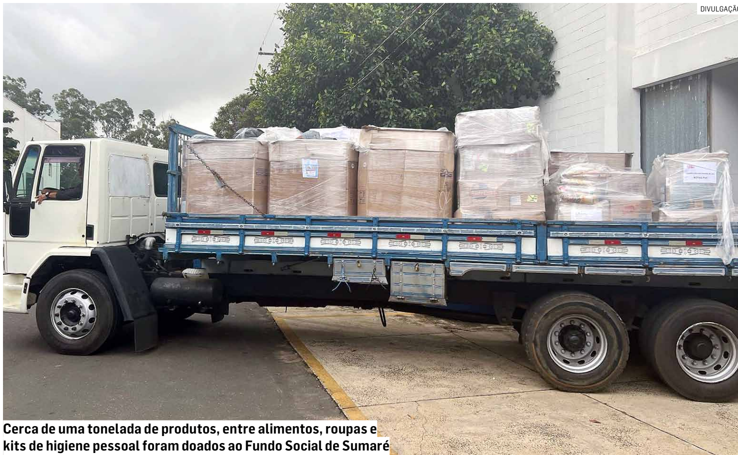
Cerca de uma tonelada de produtos, entre alimentos, roupas e kits de higiene pessoal foram doados ao Fundo Social de Sumaré

“Mais uma vez contamos com a solidariedade da Coca-Cola Femsa Brasil, grande parceira da prefeitura. Agradecemos imensamente pelas doações, que são de grande ajuda para nossas campanhas e ações de auxílio e