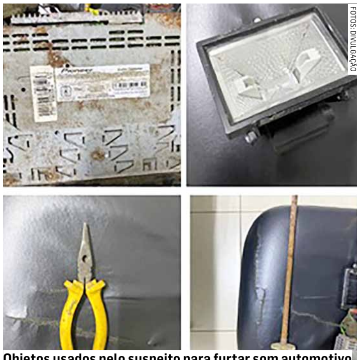
Objetos usados pelo suspeito para furto de som automotivo

A equipe da PM, em patrulhamento, deparou com um açougue com as portas semiabertas e de imediato fizeram a averiguação. No local, ao levantar a porta visualizaram um homem deitado no chão, mexendo em um aparelho Cd player automotivo, usando um alicate e um amolador de facas. O suspeito, ao ser questionado, informou que entrou para dormir no local sem autorização do dono, e encontrou o aparelho de som em uma mesa.