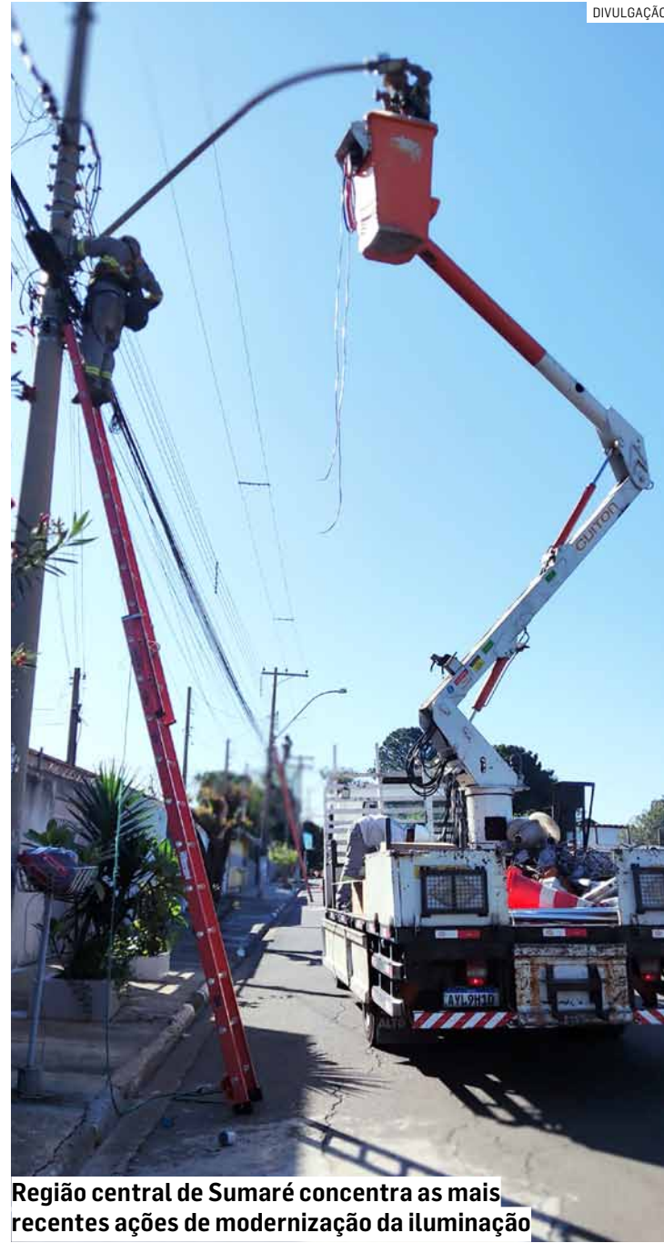
Região central de Sumaré concentra as mais recentes ações de modernização da iluminação

O prefeito Luiz Dalben reafirmou o compromisso de continuar investindo em melhorias para Sumaré. “Não vamos parar por aqui. Nosso objetivo é continuar avançando, garantindo que todos os bairros e regiões de Sumaré recebam os benefícios de uma infraestrutura moderna e eficiente. Agradeço a todos os envolvidos por esse progresso e ao deputado Dirceu Dalben pelo apoio constante”, disse.