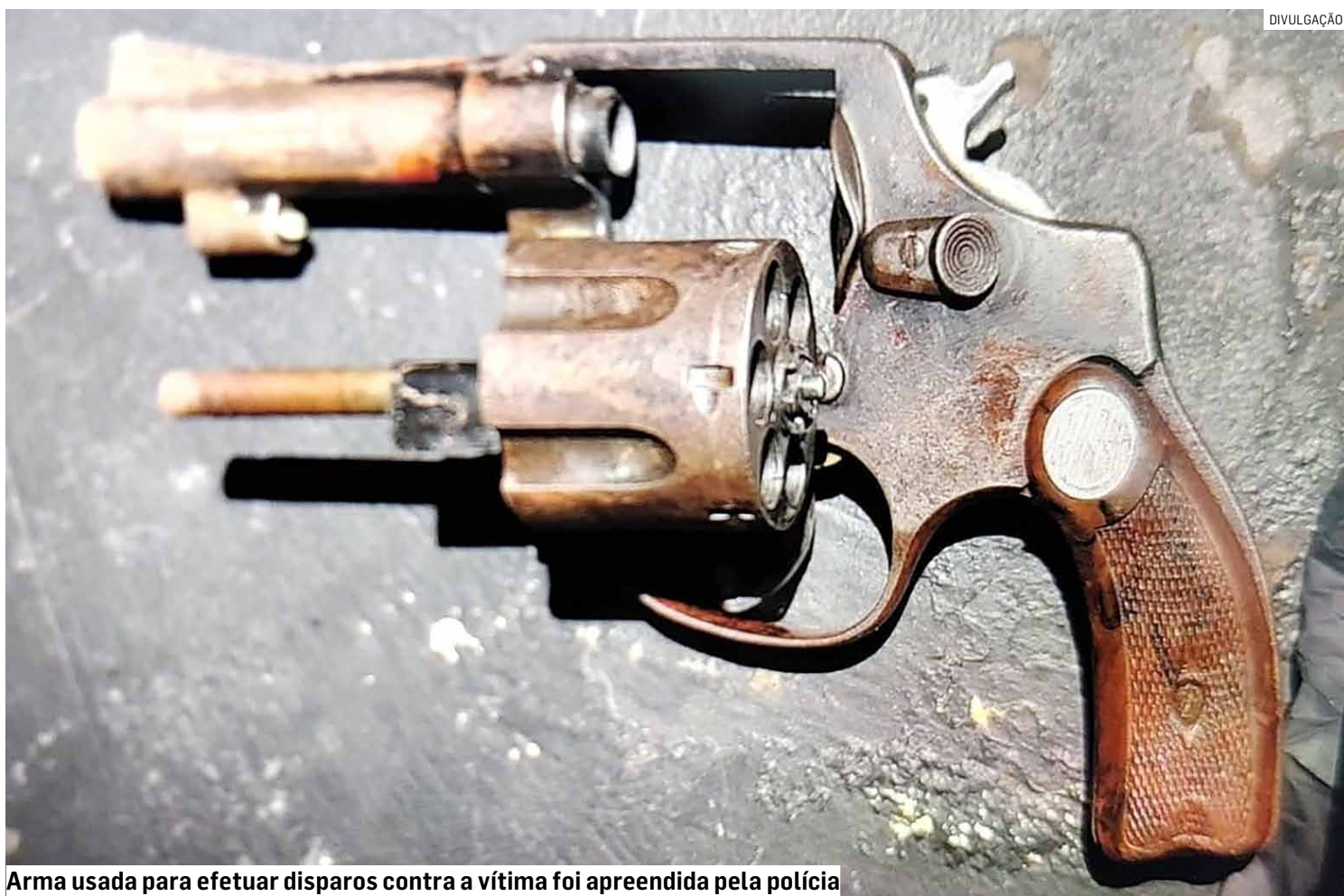
Arma usada para efetuar disparos contra a vítima foi apreendida pela polícia

A vítima dos disparos é um haitiano, que foi atingido por tiros no ombro, abdômen e perna. Ele foi encaminhado ao Hospital Estadual de Sumaré.