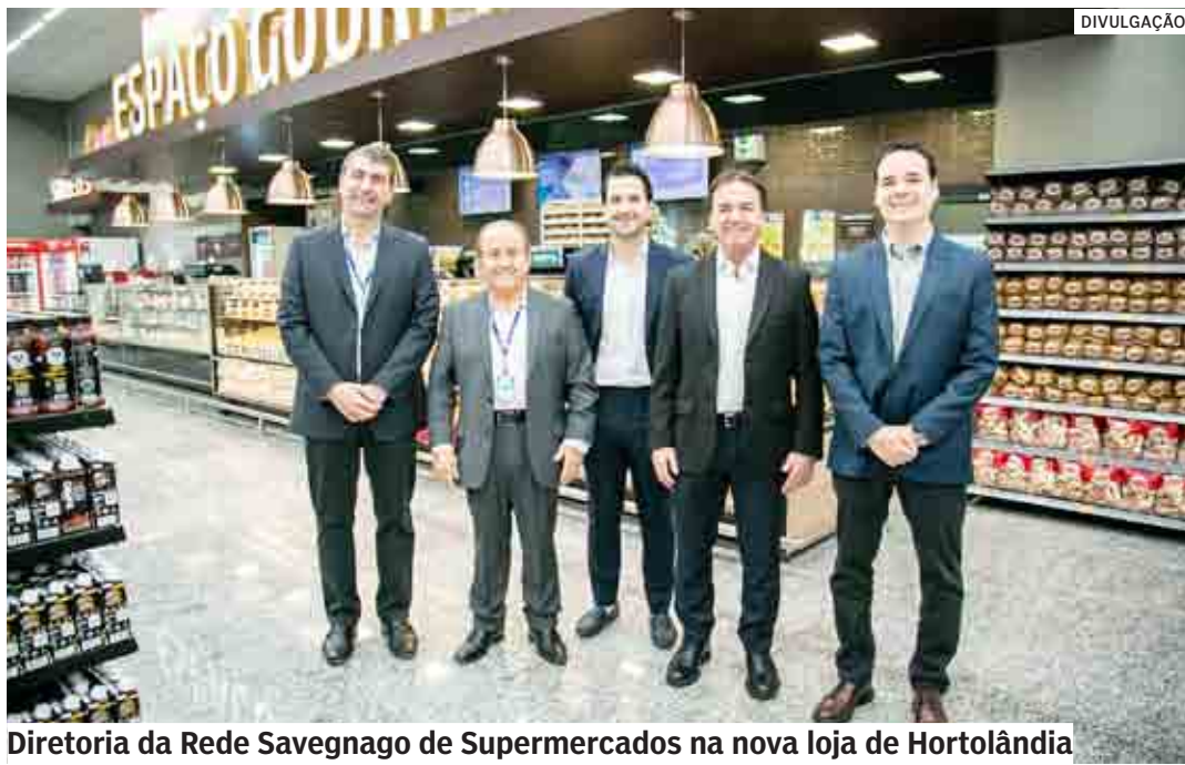
Diretoria da Rede Savegnago de Supermercados na nova loja de Hortolândia

A Rede Savegnago de Supermercados inaugurou, na manhã desta quinta-feira (16), a sua primeira unidade em Hortolândia. A loja 55 está localizada na Rua Luiz Camilo de Camargo, 332, na Vila São Francisco, e gerou 180 novas oportunidades de emprego na cidade. O novo supermercado da rede tem como diferencial uma estrutura moderna, em um espaço com 1.530 m² de área de vendas. PÁGINA 04