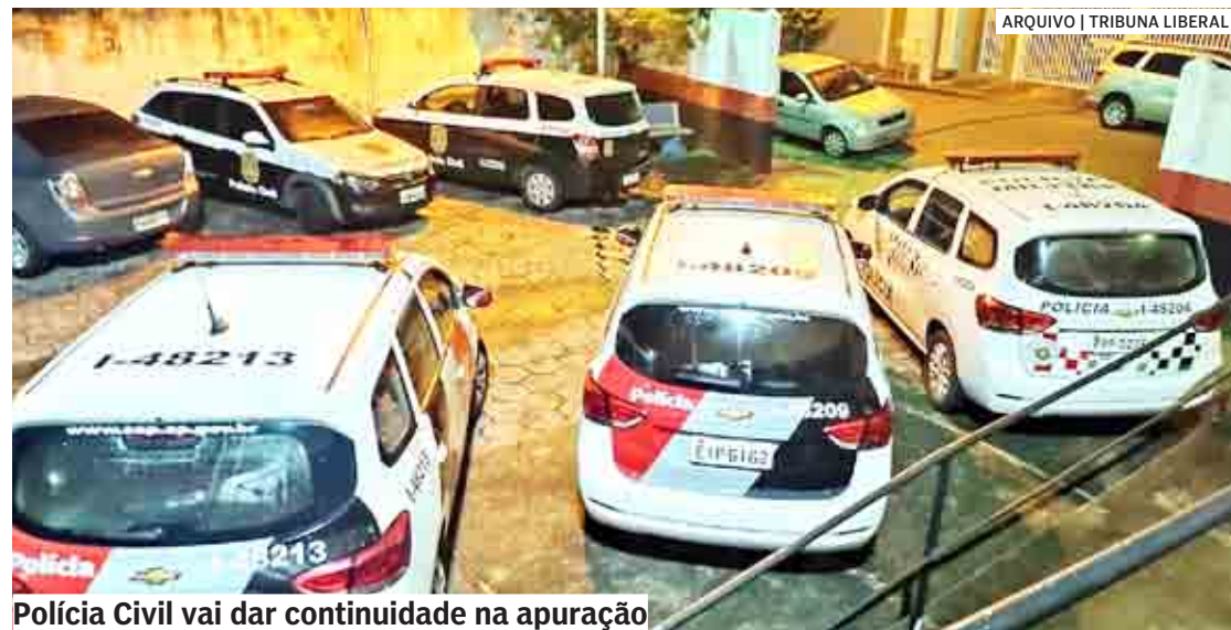
Polícia Civil vai dar continuidade na apuração

Cristiani Azanha | SUMARÉ cris@tribunaliberal.com.br