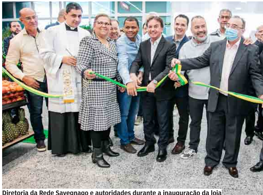
Diretoria da Rede Savegnago e autoridades durante a inauguração da loja