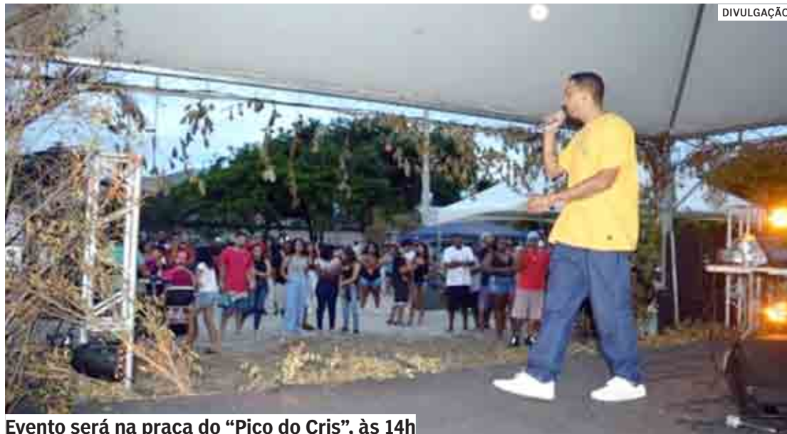
Evento será na praça do “Pico do Cris”, às 14h

De acordo com o coletivo, o evento terá ambientação temática de ringue de luta, com participação de MCs (mestres de cerimônia) da cidade e região. Os três melhores ganharão troféus e brindes. O vencedor da “batalha” receberá ainda um cinturão de campeão, numa brin-