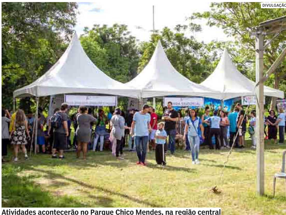
Atividades acontecerão no Parque Chico Mendes, na região central