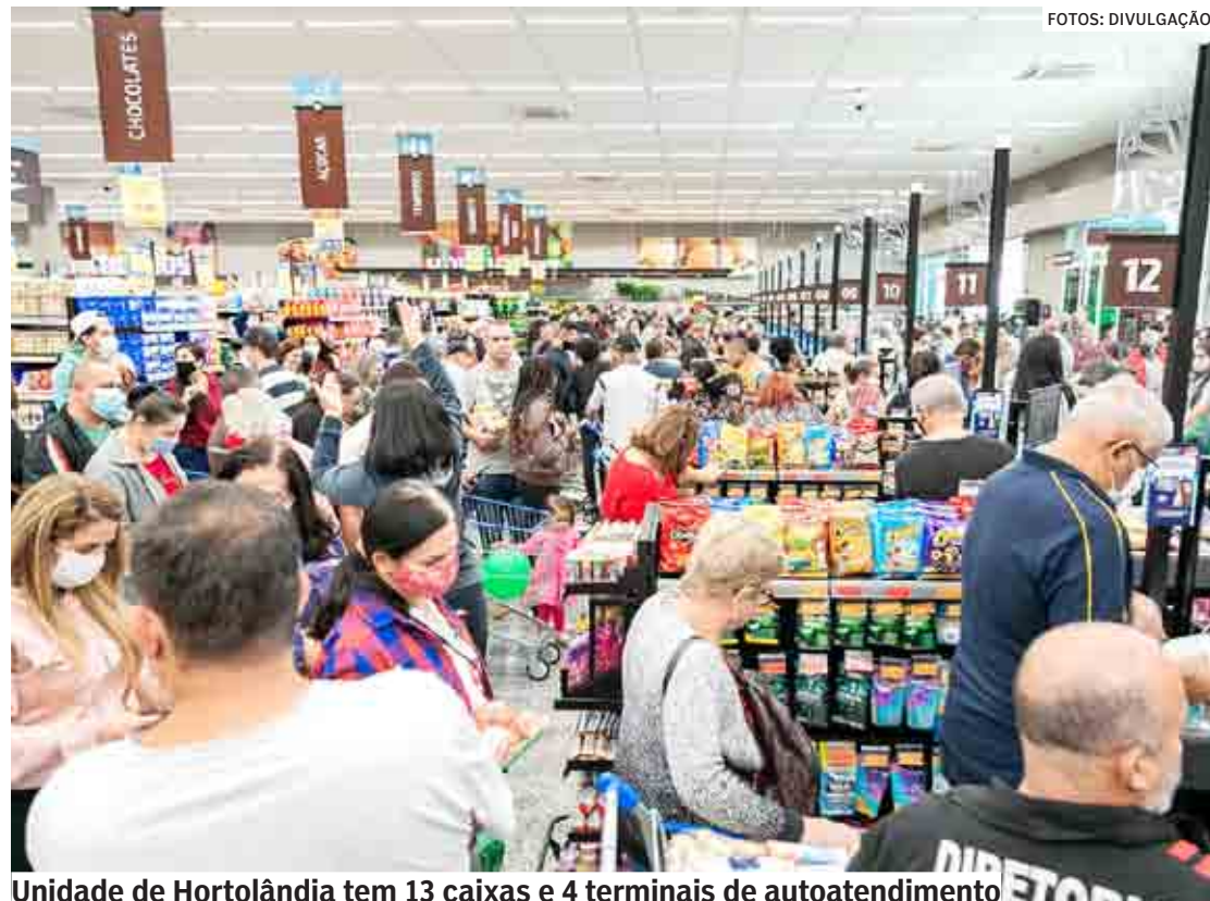
Unidade de Hortolândia tem 13 caixas e 4 terminais de autoatendimento

Loja está localizada na Rua Luiz Camilo de Camargo, 332, na Vila São Francisco, e gerou 180 novas vagas de emprego na cidade