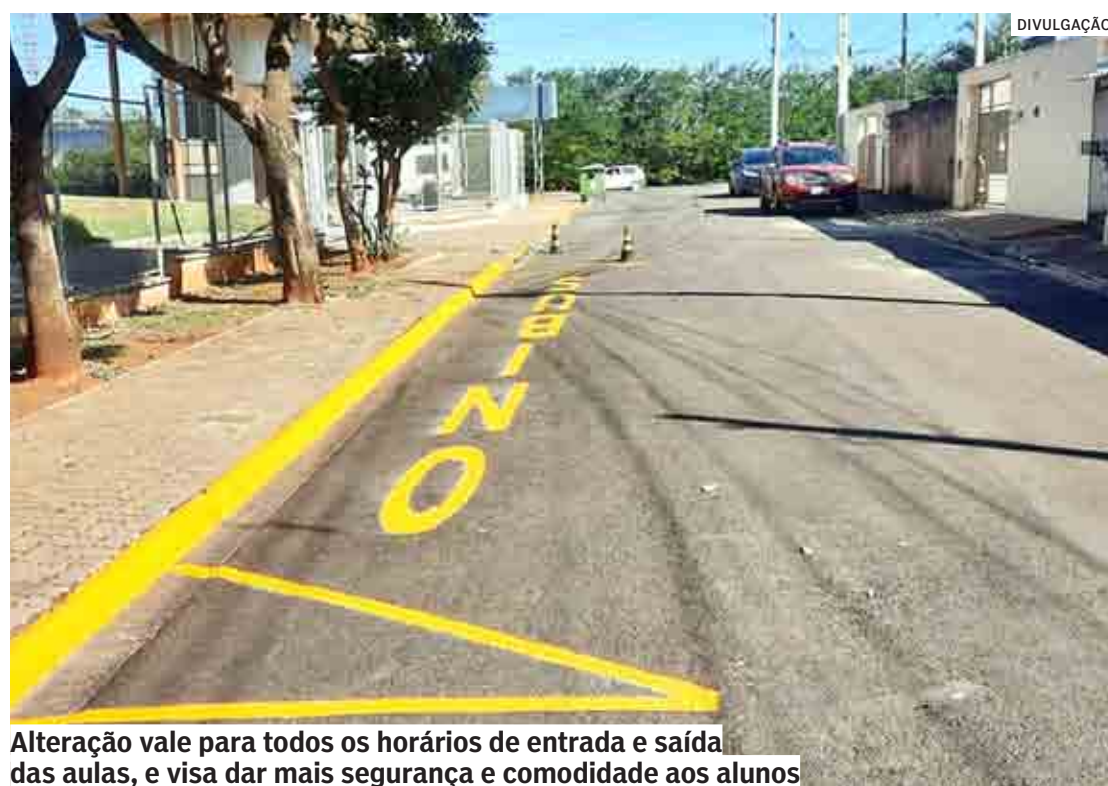
Alteração vale para todos os horários de entrada e saída das aulas, e visa dar mais segurança e comodidade aos alunos