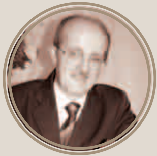
Francisco Antonio de Toledo