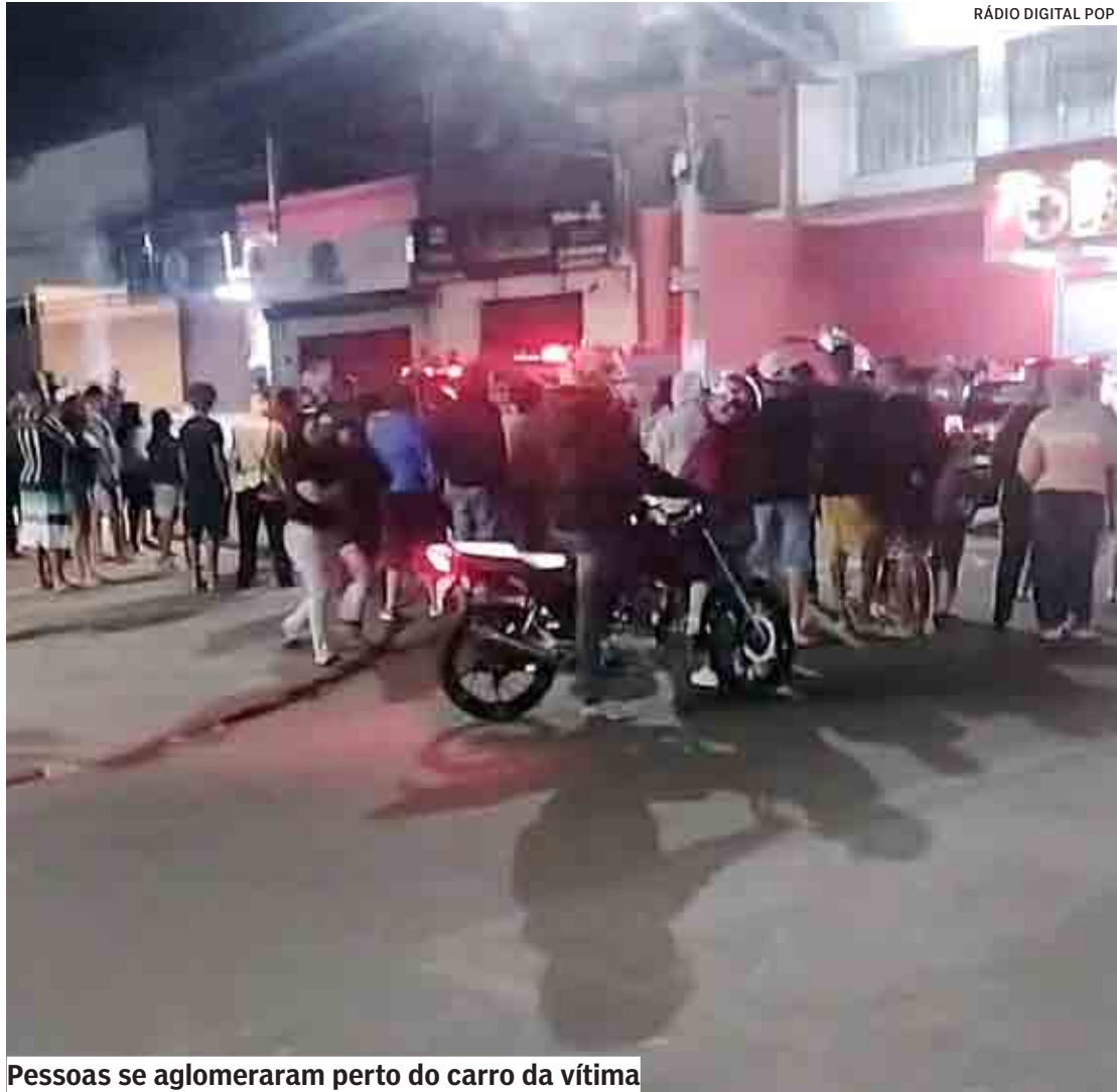
Pessoas se aglomeraram perto do carro da vítima

Nos próximos dias, a Polícia Civil vai tentar confirmar se alguma câ-