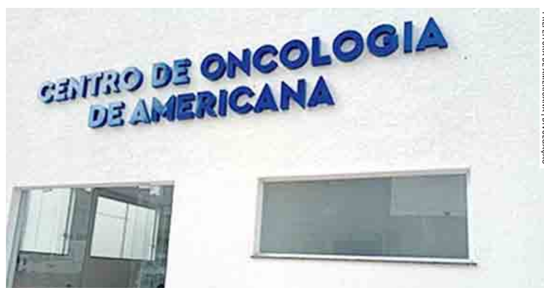
Estimativa é de que sejam realizados 5.300 procedimentos e 650 cirurgias, anualmente

A Secretaria de Saúde de Nova Odessa informou, através da assessoria, que não tem como prever o número de pacientes que serão atendidos na cidade vizinha, porque quem regula as vagas e os pacientes a ser encaminhados é a Rede Hebe Camargo, em São Paulo. Segundo a prefeitura, esta é uma unidade adicional, que se soma aos atendimentos às unidades já existentes. A pasta também informou que alguns pacientes já estão sendo encaminhados à Unacon, mas não soube informar o número exato de atendimentos. O horário da visita do