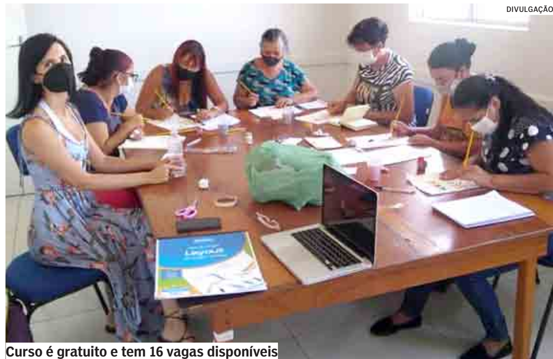
Curso é gratuito e tem 16 vagas disponíveis

Da Redação | HORTOLÂNDIA tribunaliberal@tribunaliberal.com.br