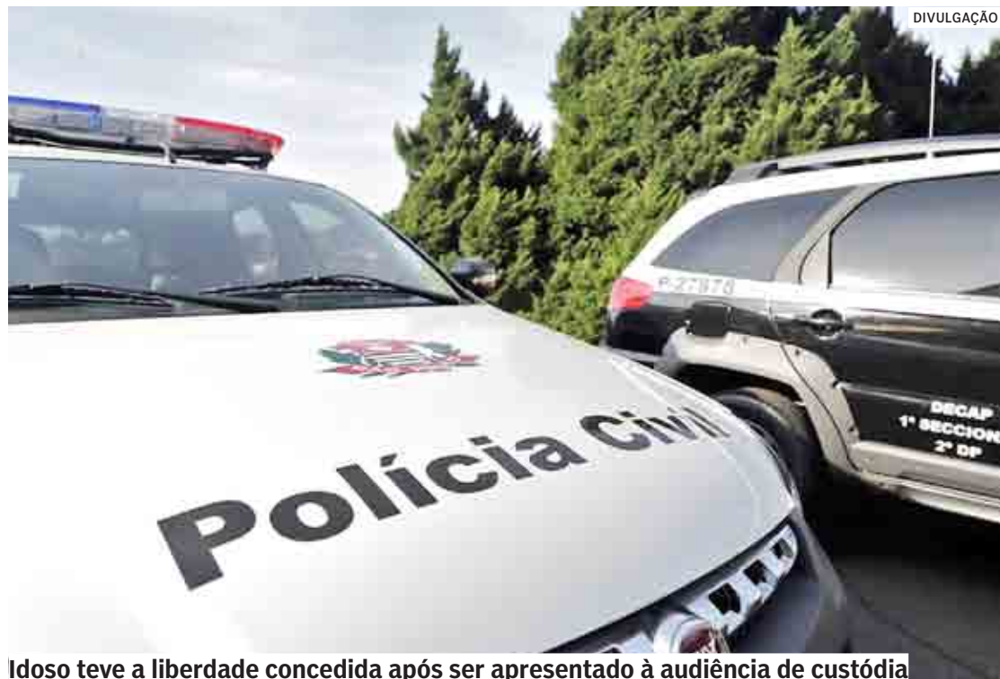
Idoso teve a liberdade concedida após ser apresentado à audiência de custódia