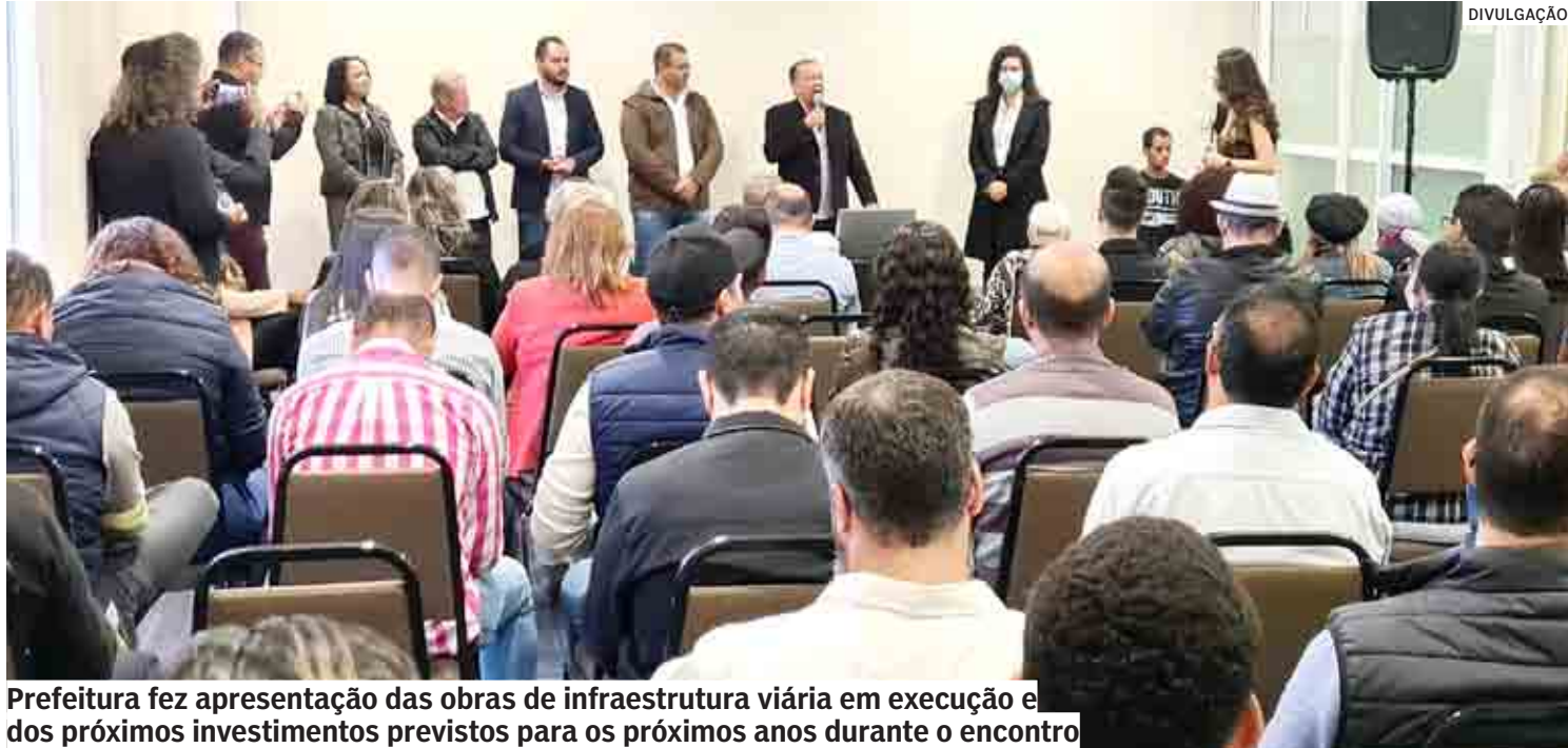
Prefeitura fez apresentação das obras de infraestrutura viária em execução e dos próximos investimentos previstos para os próximos anos durante o encontro

“Vamos falar sobre o avanço da cidade. E mostrar o que a Prefeitura está planejando para o futuro, com o objetivo de conseguir trazer mais grandes empresas para o município. Desta forma, estamos dando prosseguimento ao legado do falecido ex-prefeito Angelo Perugini”, destacou o secretário de Desenvolvimento Econômico, Trabalho, Turismo e Inova-