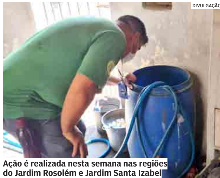
Ação é realizada nesta semana nas regiões do Jardim Rosolém e Jardim Santa Izabel

A Prefeitura também se mantém vigilante e prossegue com a ação de busca ativa em diferentes regiões do município. Nesta semana, a UVZ realiza busca ativa nas regiões do Jardim Rosolém e Jardim Santa Izabel. A ação é feita em regiões onde foram no-