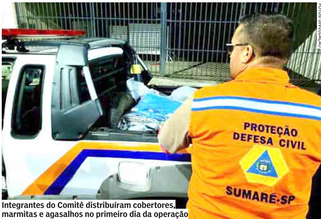
Integrantes do Comitê distribuíram cobertores, marmitas e agasalhos no primeiro dia da operação