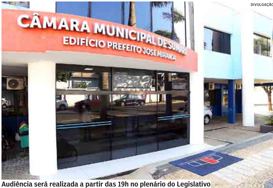
Audiência será realizada a partir das 19h no plenário do Legislativo

Criada pela Resolução nº 325, de 13 de abril de 2022, a comissão busca soluções para temas ligados a regularizações fundiárias, como aplicação de taxas de juros em loteamentos particulares; ligações de água e energia em núcleos irregula-