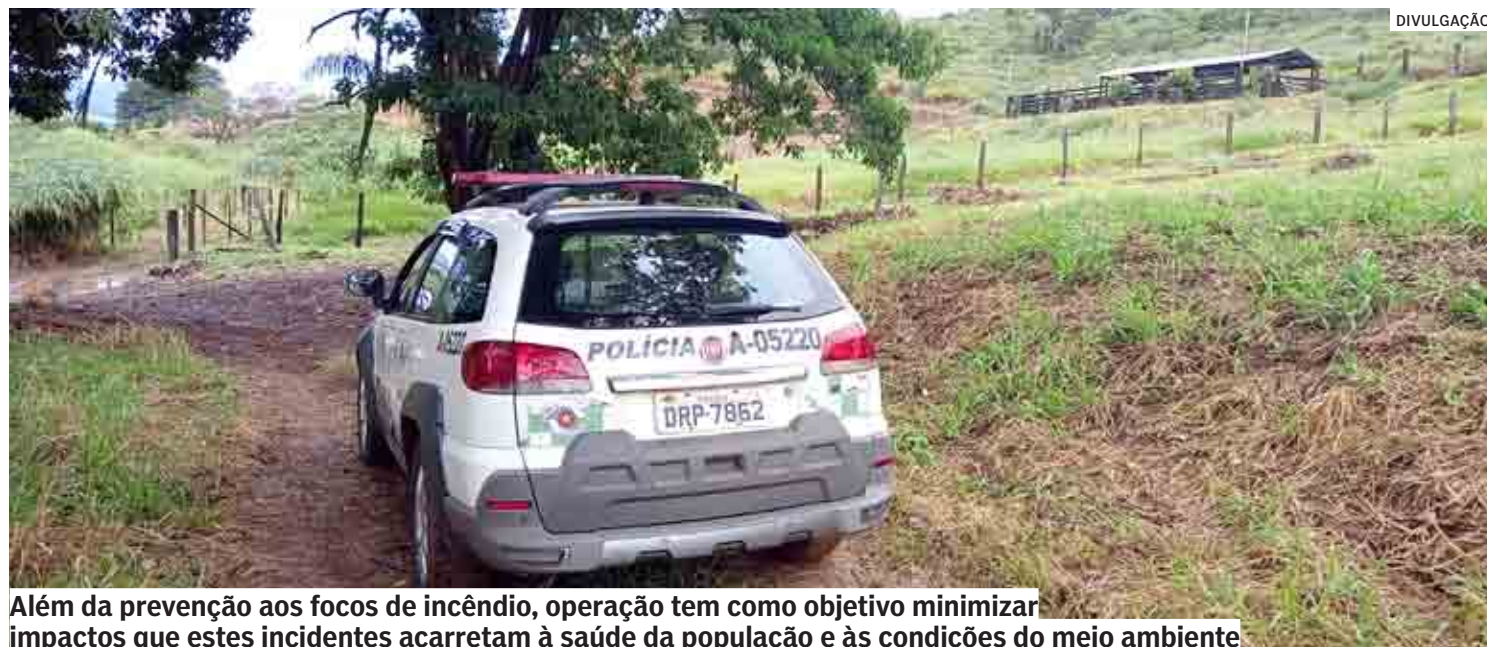
Além da prevenção aos focos de incêndio, operação tem como objetivo minimizar impactos que estes incidentes acarretam à saúde da população e às condições do meio ambiente

Cristiani Azanha | REGIÃO cris@tribunaliberal.com.br