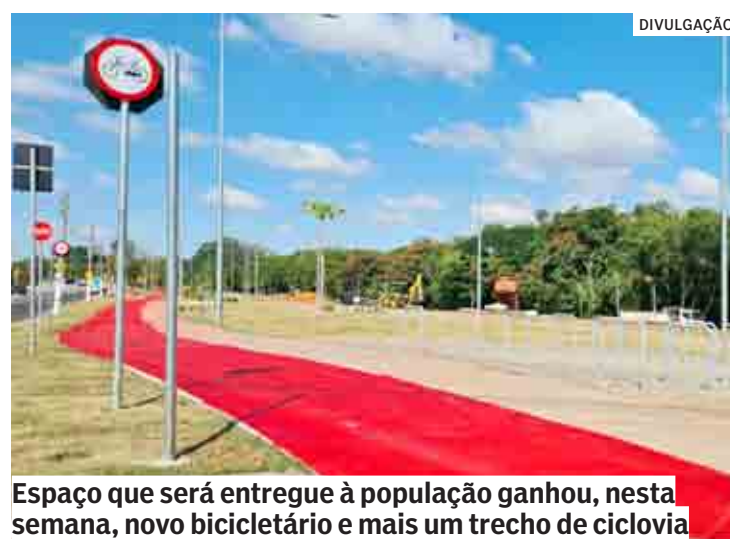
Espaço que será entregue à população ganhou, nesta semana, novo bicicletário e mais um trecho de ciclovia

Nos últimos anos, o Parque Lago da Fé passou por diversas intervenções para ampliar o espaço disponível à população. A mais recente delas foi feita no local onde havia o PEV (Ponto de Entrega Voluntária de entulho e outros ma-