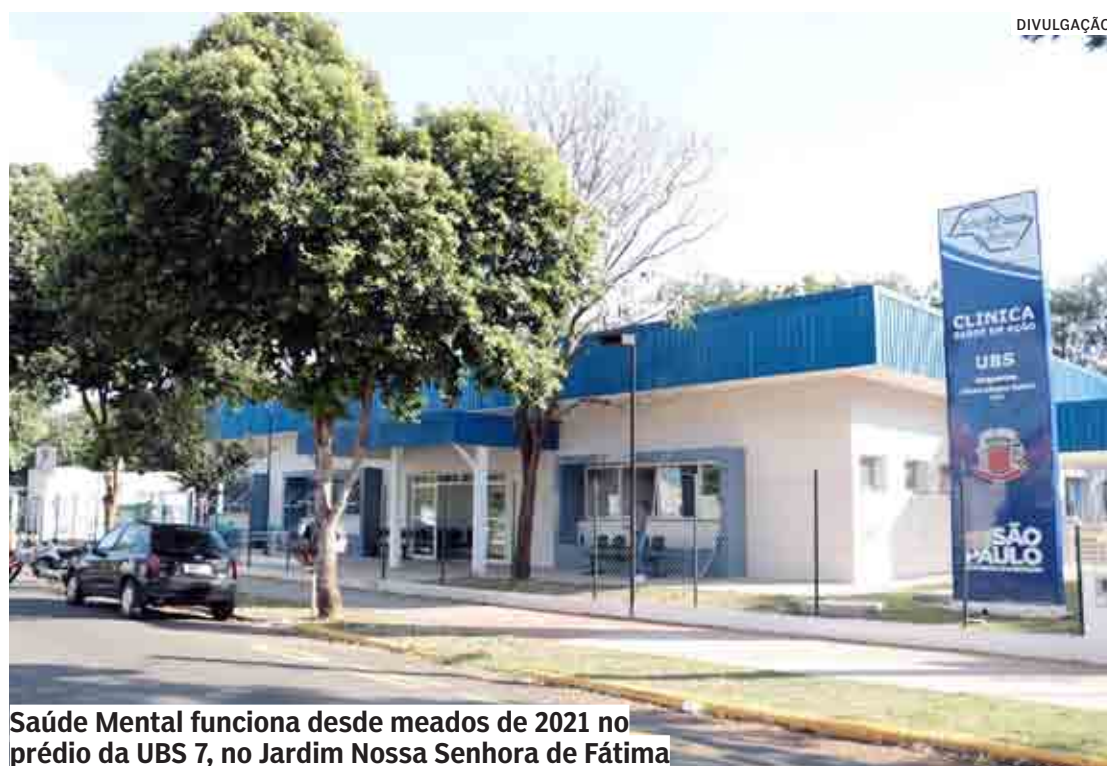
Saúde Mental funciona desde meados de 2021 no prédio da UBS 7, no Jardim Nossa Senhora de Fátima

“Estamos realizando intervenções semanais, sempre utilizando material educativo e lúdico apropriados da Odontologia a fim de garantir uma motivação e incentivo a