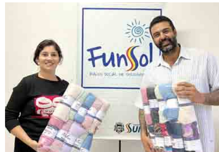
Fundo Social intensificou ações distribuindo agasalhos, roupas e cobertores para moradores em situação de rua

O Fundo Social de Solidariedade realizou ainda a doação de cobertores para os animais abrigados pelo Departamento de Proteção e Bem-estar. Atualmente o Bem-Estar animal possui 40 animais disponíveis para adoção.