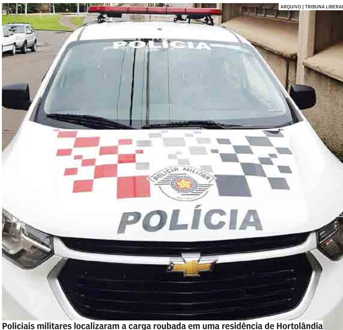
Policiais militares localizaram a carga roubada em uma residência de Hortolândia

O restante das mercadorias estava dentro