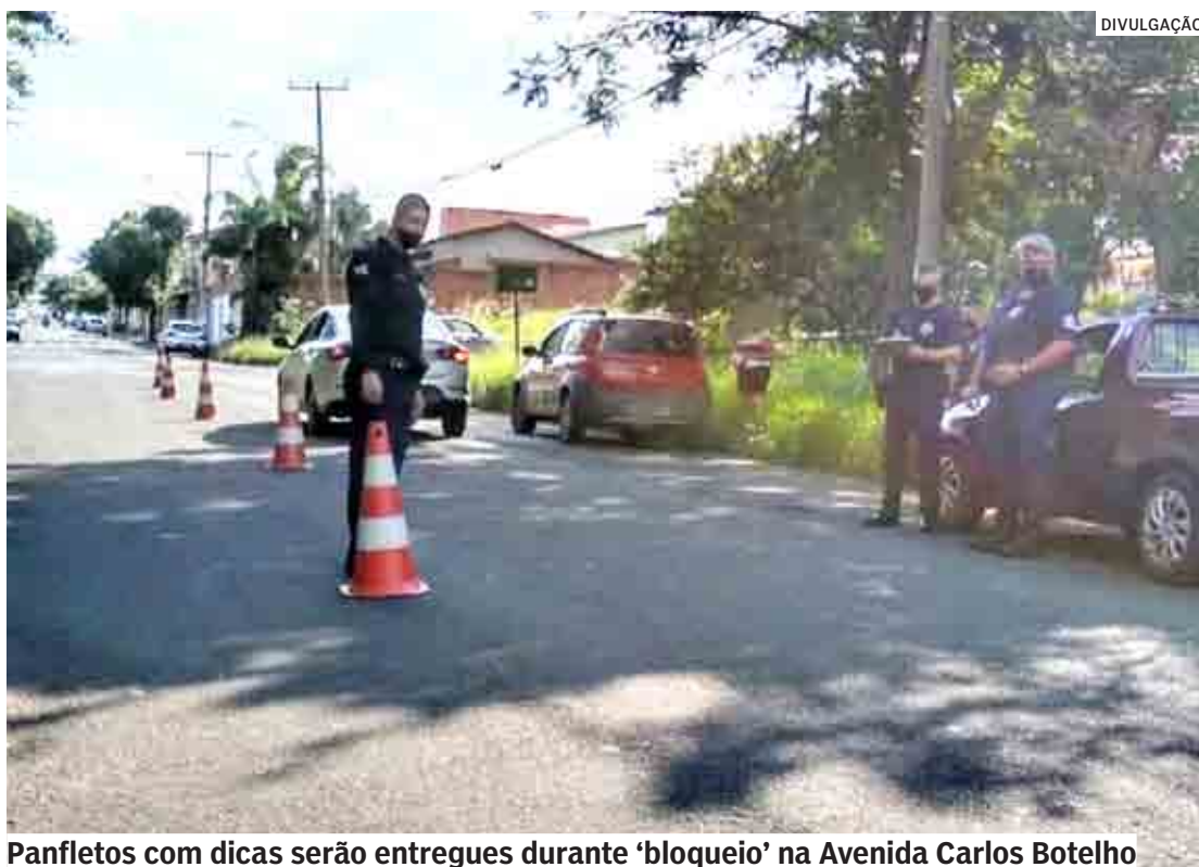
Panfletos com dicas serão entregues durante ‘bloqueio’ na Avenida Carlos Botelho

Chamar a atenção da sociedade para o alto índice de mortes e feridos no trânsito. Essa é a proposta da Campanha “Maio Amarelo – Atenção Pela Vida”, que a Prefeitura de Nova Odessa realiza nos dias 19 e 24 deste mês, visando conscientizar a população sobre o tema e difundir o movimento. A atividade especial ocorrerá das 8h às 11h, na Avenida Carlos Botelho, em frente à Delegacia do Município, e contará com profissionais do Setor de Trânsito, Secretaria de Saúde e GCM (Guarda Civil Municipal). “Faremos o ‘bloqueio’ em uma via da pista e vamos parar os motoristas, mas em vez de pedir o documento, vamos entregar panfletos com dicas e orientações, ou seja, com as regras da Segurança no Trânsito, já que a finalidade é de pura conscientização”, explicou o GCM