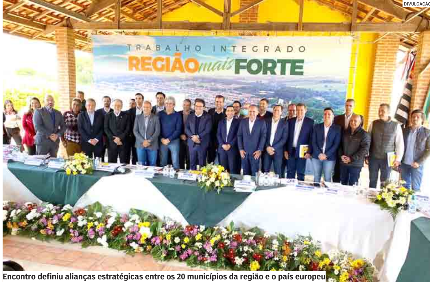
Encontro definiu alianças estratégicas entre os 20 municípios da região e o país europeu

Memorando com a Promo Brasile Italia foi assinado na reunião do Conselho de Prefeitos, realizada nesta terça-feira, em Holambra