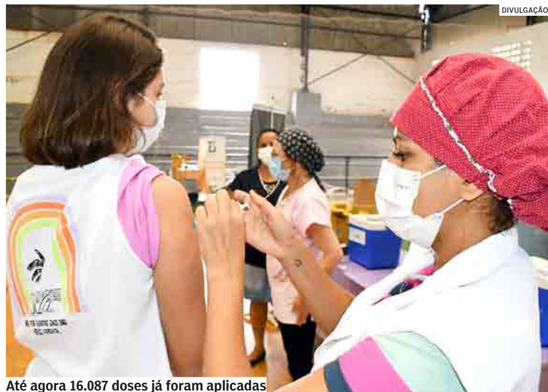
Até agora 16.087 doses já foram aplicadas

Para receber a dose, basta apresentar a Carteira de Vacinação ou documento de identifi-