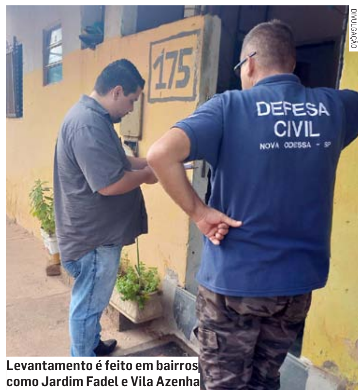
Levantamento é feito em bairros como Jardim Fadel e Vila Azenha

A Habitação também levanta as condições habitacionais das famílias para identificar eventual demanda e traçar as prioridades nos próximos projetos habitacionais de interesse social de Nova Odessa.