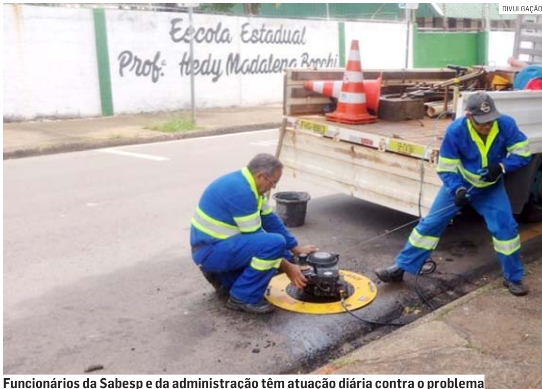
Funcionários da Sabesp e da administração têm atuação diária contra o problema

A parceria entre a Sabesp (Companhia de Saneamento Básico do Estado de São Paulo) e a Prefeitura de Hortolândia vive uma nova etapa de ações contra o descarte irregular de esgoto no município. As equipes realizam as fiscalizações nos sistemas subterrâneos localizados no Jardim Everest. A técnica utilizada é a da fumaça, que consiste em injetar nas redes de esgoto uma fumaça não tóxica e que dispersa no ar em segundos. O trabalho