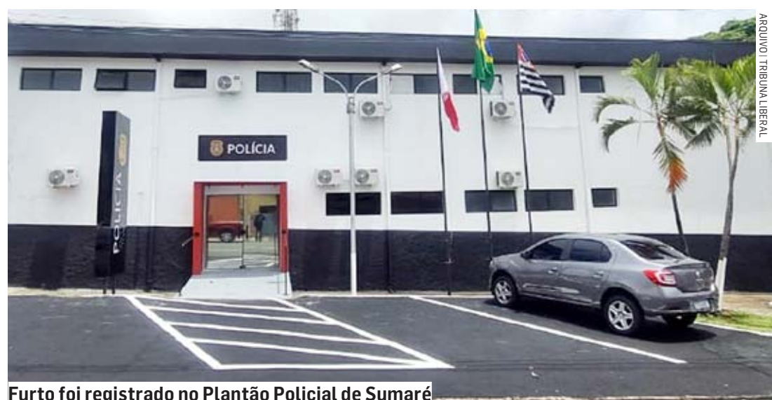
Furto foi registrado no Plantão Policial de Sumaré

A equipe conseguiu localizar e abordar os suspeitos, que confessaram o crime ao serem questionados pela polícia. A dupla foi conduzida ao 1º DP (Distrito Policial) de Sumaré, onde a autoridade policial tomou ciência do ocorrido e determinou a elaboração do boletim de ocorrência. Os bandidos foram presos em flagrante por furto e ficaram à disposição da justiça.