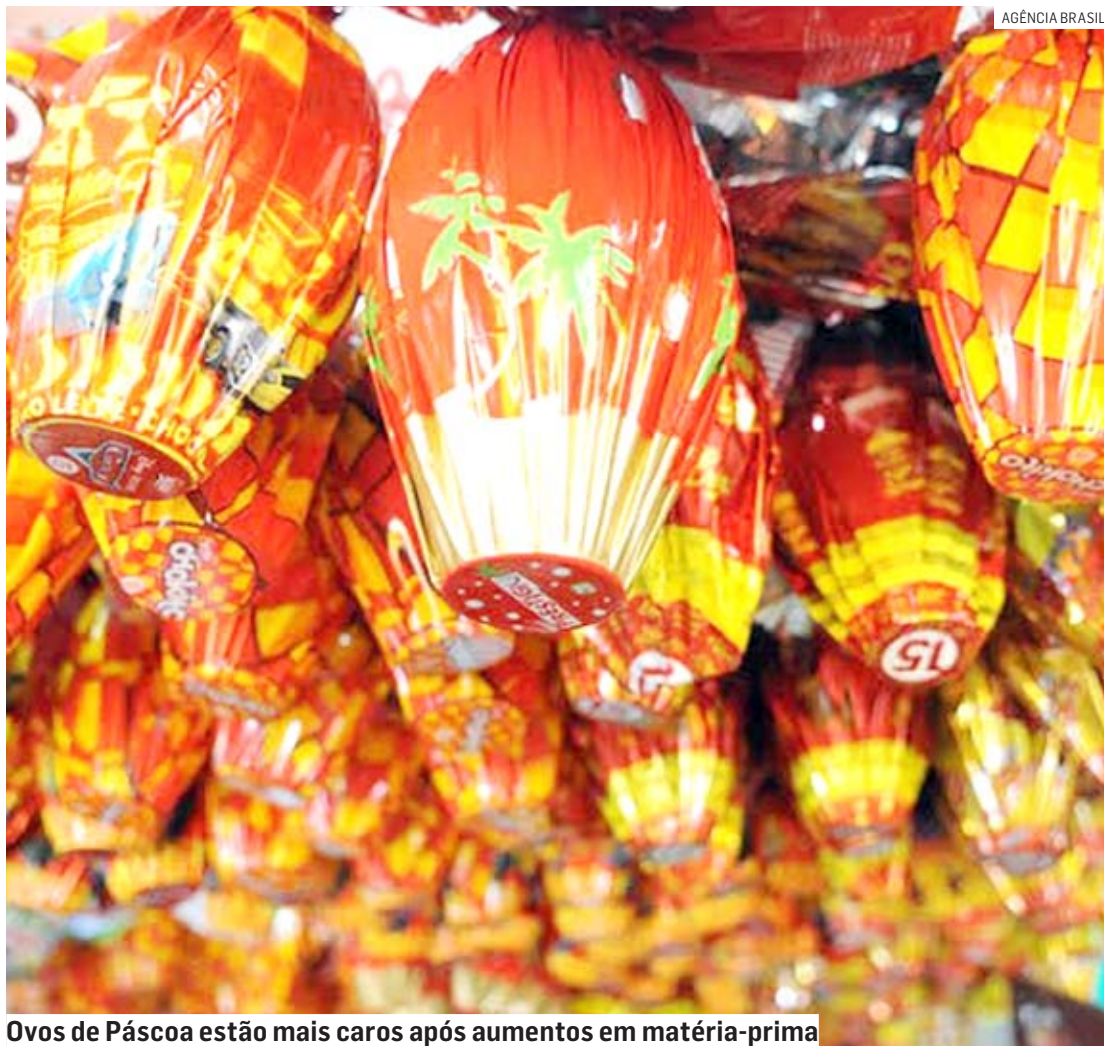
Ovos de Páscoa estão mais caros após aumentos em matéria-prima

De acordo com estudo feito pela associação, as vendas devem subir de R$ 300,2 milhões para R$ 318,5 milhões. Aumento de 6,1% sobre 2022. Os dados também apontam que o comércio regional deve contratar 698