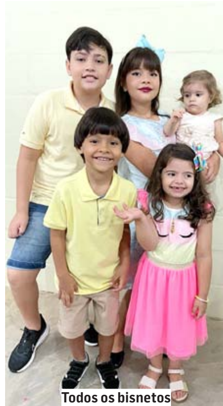
Todos os bisnetos