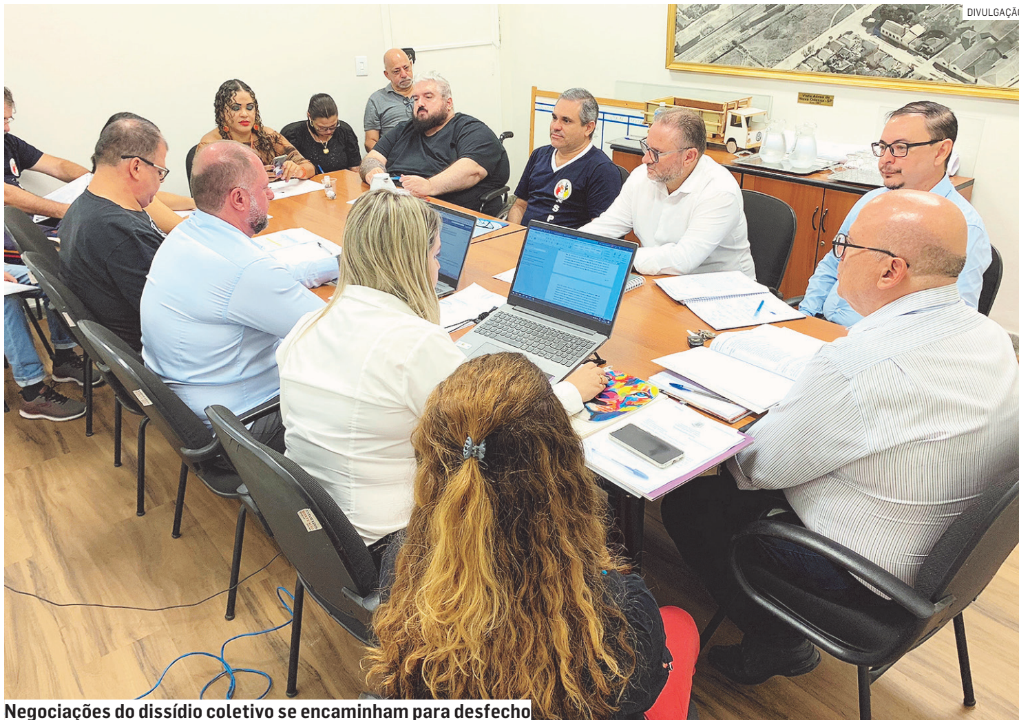
Negociações do dissídio coletivo se encaminham para desfecho

A comissão também elevou de 10% para 13% os aumentos nos valores dos benefícios do cartão da cesta básica mensal, de R$ 700 para R$ 791, e não mais para R$ 770,00, e da Cesta de Natal, passando de R$ 616,58 para R$ 696,74, e não R$ 678,24, como se previa anterior-