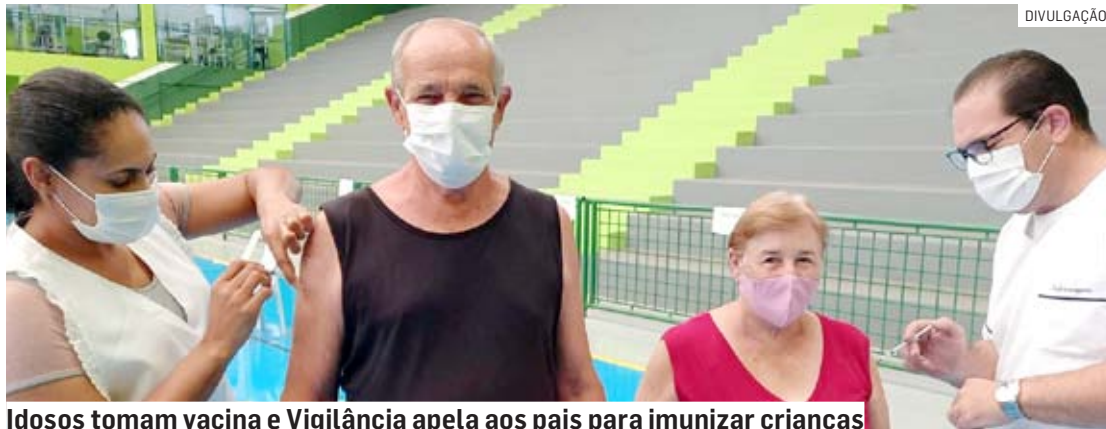
Idosos tomam vacina e Vigilância apela aos pais para imunizar crianças

A dose de reforço com vacina bivalente para estes grupos pode ser tomada nas sete UBS