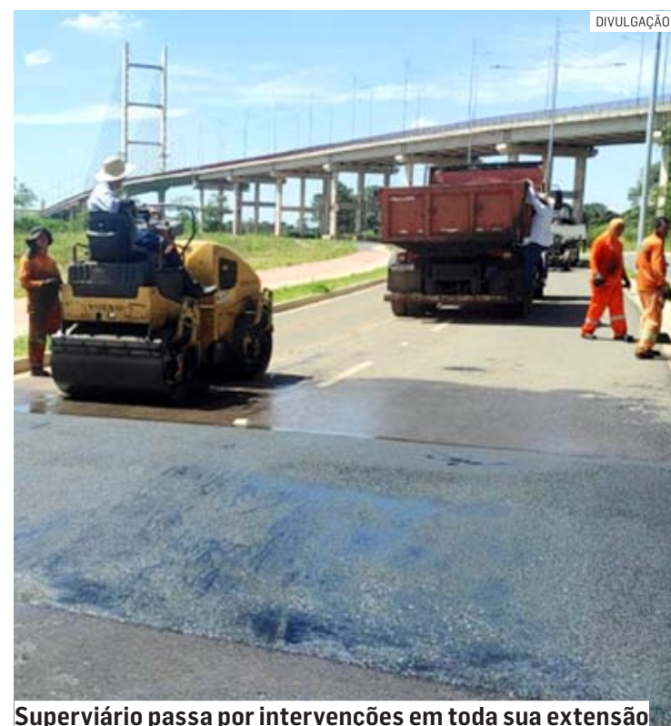
Superviário passa por intervenções em toda sua extensão

Segundo a Secretaria de Serviços Urbanos, a ação também é preventiva contra o surgimento