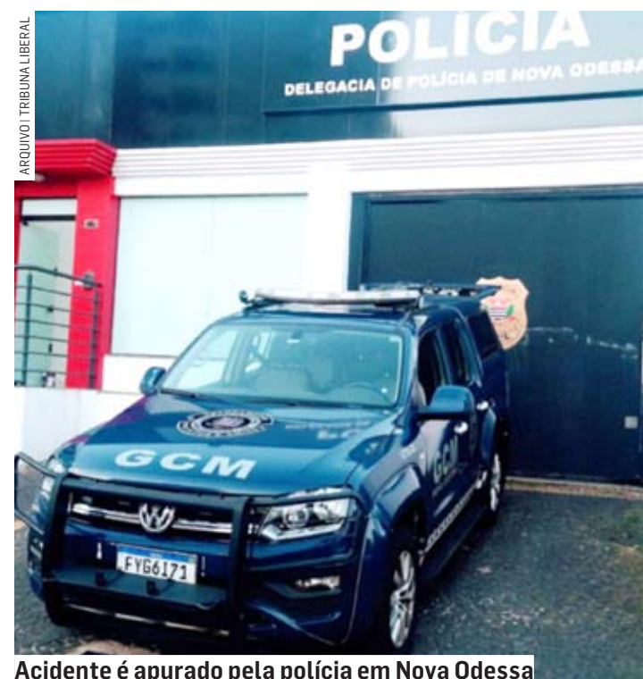
Acidente é apurado pela polícia em Nova Odessa

A motorista do carro, que não sofreu ferimentos, alegou que sinalizou com a seta indicando o lado que iria virar e que o motociclista tentou fa-