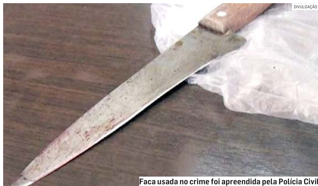
Faca usada no crime foi apreendida pela Polícia Civil

Cézar Oliveira | PAULÍNIA tribunaliberal@tribunaliberal.com.br