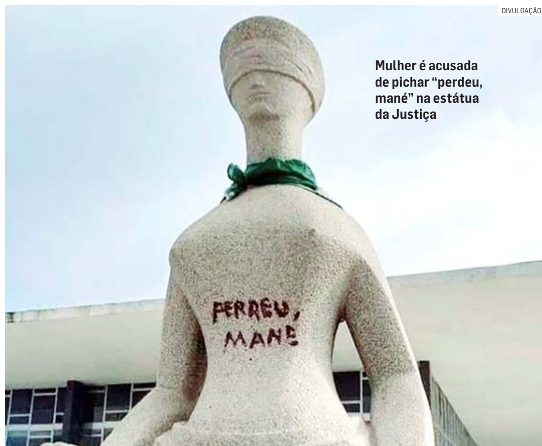
Mulher é acusada de pichar "perdeu, mané" na estátua da Justiça

Ao todo, foram cumpridos 46 mandados de busca e apreensão e 32 mandados de prisão em todo o país, sendo 13 mandados de busca e apreensão em São Paulo. A operação tem como objetivo identificar e responsabilizar os suspeitos de participação nos atos golpistas. A reportagem não localizou a defesa da mulher.