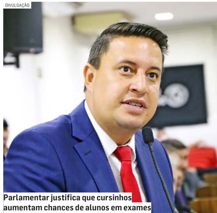
Parlamentar justifica que cursinhos aumentam chances de alunos em exames