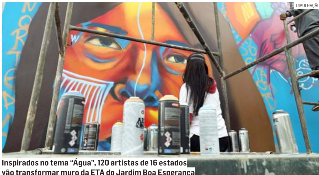
Inspirados no tema “Água”, 120 artistas de 16 estados vão transformar muro da ETA do Jardim Boa Esperança

Cento e vinte artistas, 240 mãos talentosas e, pelo menos, 1.200 tubos de tinta spray para transformar um muro de 1,5 mil m 2 em obra de arte, com inspiração no tema “Água”. Esse será o 6º Jacuba Festival de Graffiti, que acontece neste sábado (18) e domingo (19), em Hortolândia, das 9h às 17h, na ETA (Estação de Tratamento de Água) do Jardim Boa Esperança. O evento é uma realização da Secretaria de Cultura de Hortolândia em parceria com a Sabesp (Companhia de Saneamento Básico do Estado de São Paulo), com idealização e produção da Equipe Jacuba