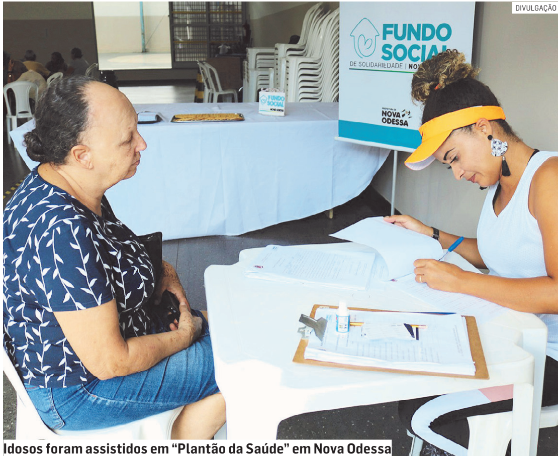
Idosos foram assistidos em “Plantão da Saúde” em Nova Odessa

Da Redação | NOVA ODESSA tribunaliberal@tribunaliberal.com.br