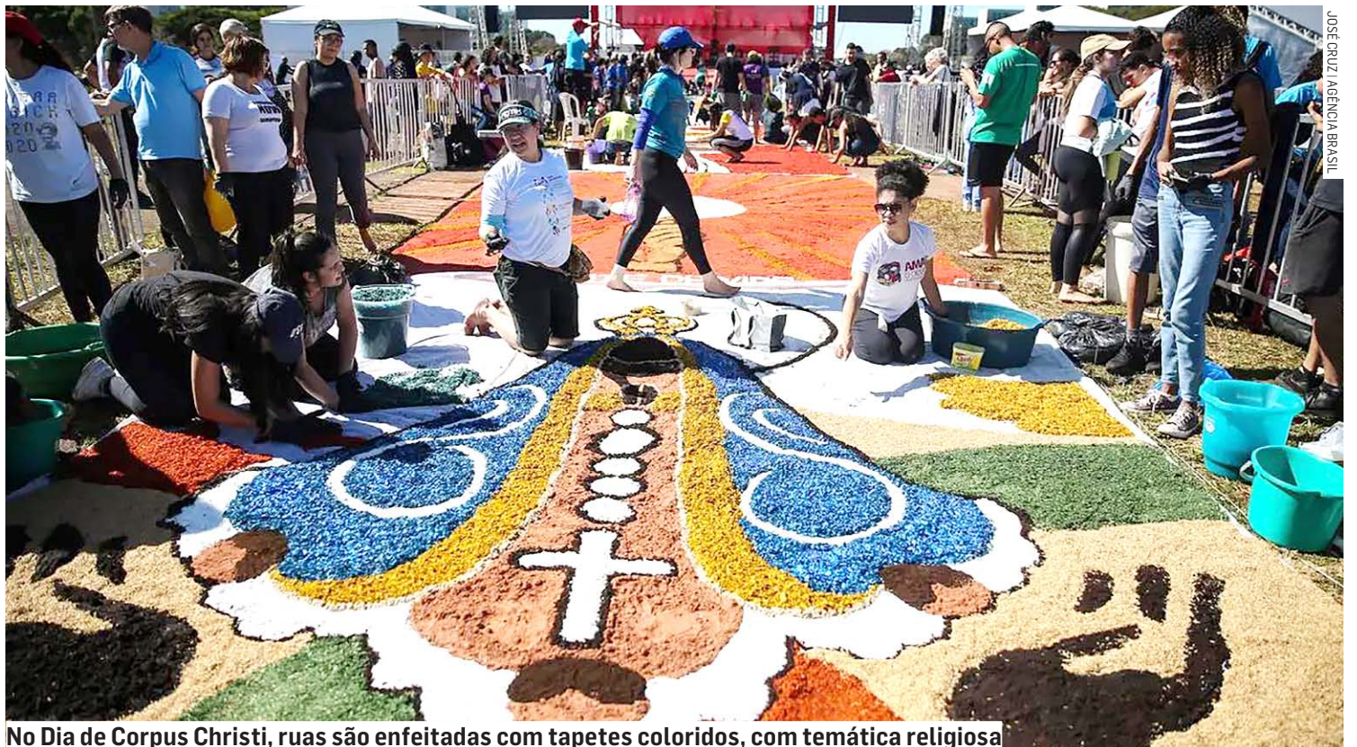
No Dia de Corpus Christi, ruas são enfeitadas com tapetes coloridos, com temática religiosa

Segundo a CNBB (Conferência Nacional dos Bispos do Brasil), "a palavra Corpus Christi vem da língua latina e tem como significado: Corpo de Cristo". "É uma festa que celebra a presença real de Cristo na Eucaristia. É realizada na quinta-feira seguinte ao domingo da Santíssima Trindade que, por sua vez, acontece no domingo seguinte de Pentecostes", afirma a CNBB. Na data, celebrada 60 dias após a Páscoa, são tradicionais