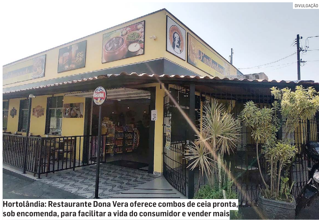
Hortolândia: Restaurante Dona Vera oferece combos de ceia pronta, sob encomenda, para facilitar a vida do consumidor e vender mais

A pesquisa também abordou a questão do pagamento do 13º salário dos funcionários. A boa notícia é que a ampla maioria (87%) dos bares e restaurantes afirma que vai pagar o salário extra sem atraso, ou em duas parcelas (63%) ou em parcela única (8%). Apenas 8% terão alguma dificuldade para pagar o 13º no prazo, abaixo da média nacional, que é de 14%.