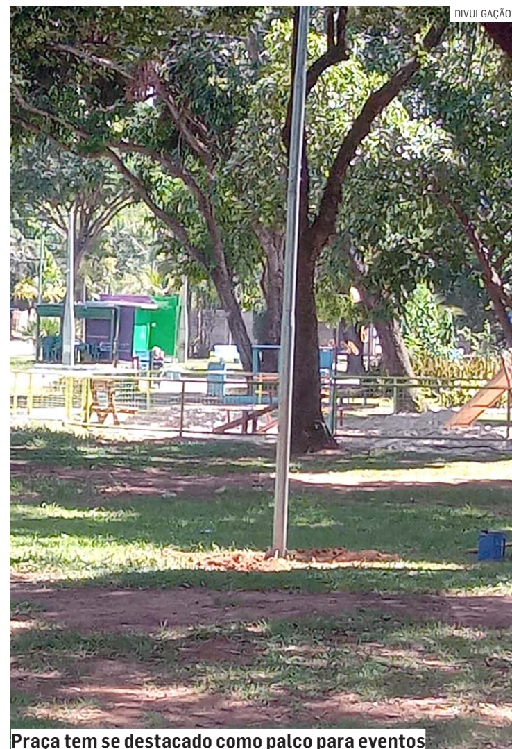
Praça tem se destacado como palco para eventos

“Esses serviços deve levar cerca de 10 dias, e visa garantir o bom funcionamento da iluminação da praça, bem como a segurança das famílias que usufruem desse espaço no início das manhãs, para suas caminhadas e exercícios,