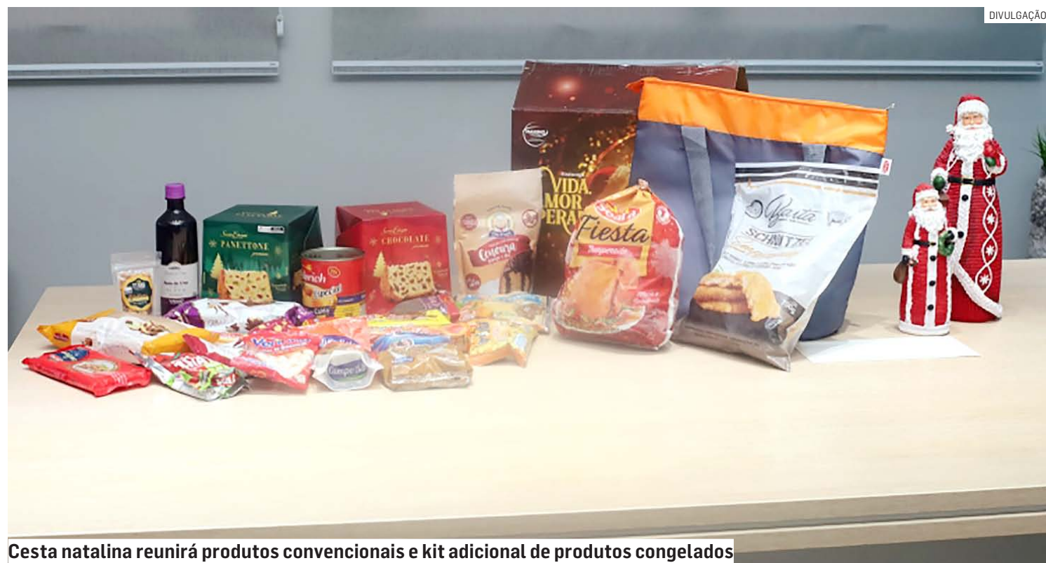
Cesta natalina reunirá produtos convencionais e kit adicional de produtos congelados

Kit de congelados contará com frango temperado e lombo suíno empanado de 700 g; retirada das cestas será realizada por leitura de QR Code em sistema drive-thru