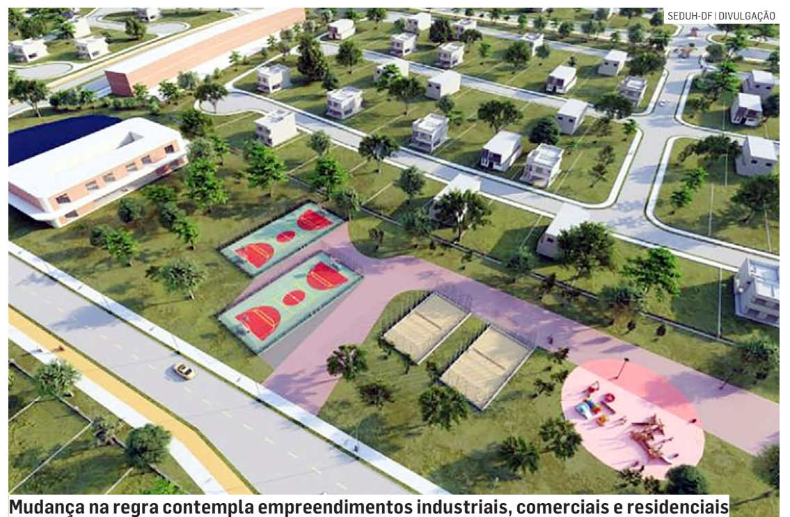
Mudança na regra contempla empreendimentos industriais, comerciais e residenciais

Da Redação • MONTE MOR tribunaliberal@tribunaliberal.com.br