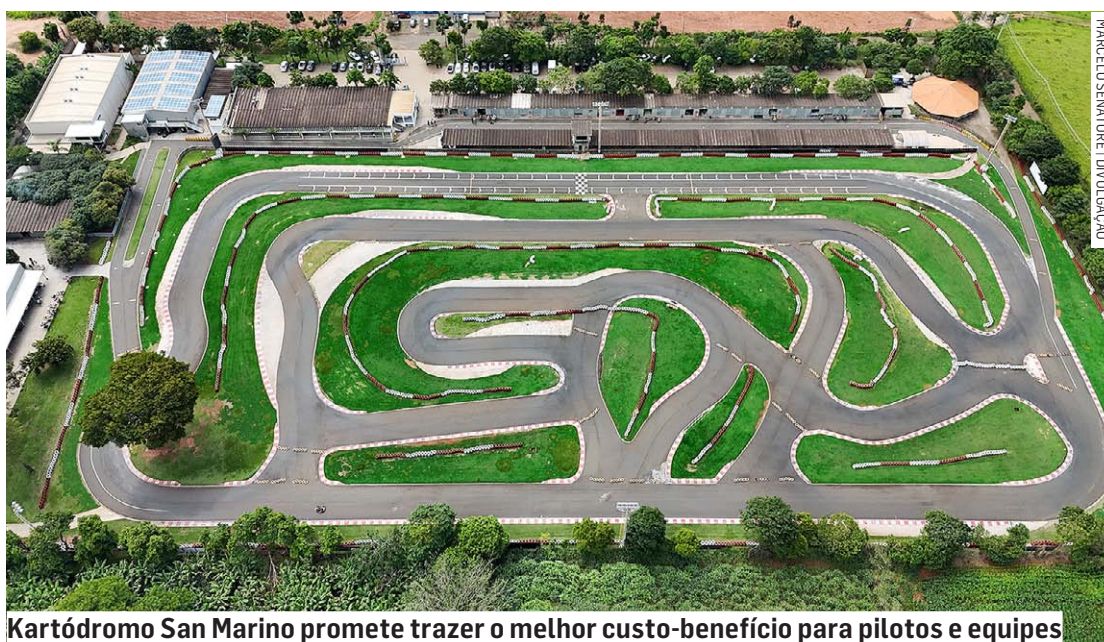
Kartódromo San Marino promete trazer o melhor custo-benefício para pilotos e equipes

A competição será dividida em dois turnos: primeiro turno, da 1ª a 5ª etapa, e segundo turno, da 6ª a 9ª etapa, com um descarte obrigatório em cada um dos turnos e pontuação dobrada na etapa final. O regulamento completo e os valores serão divulgados em breve.