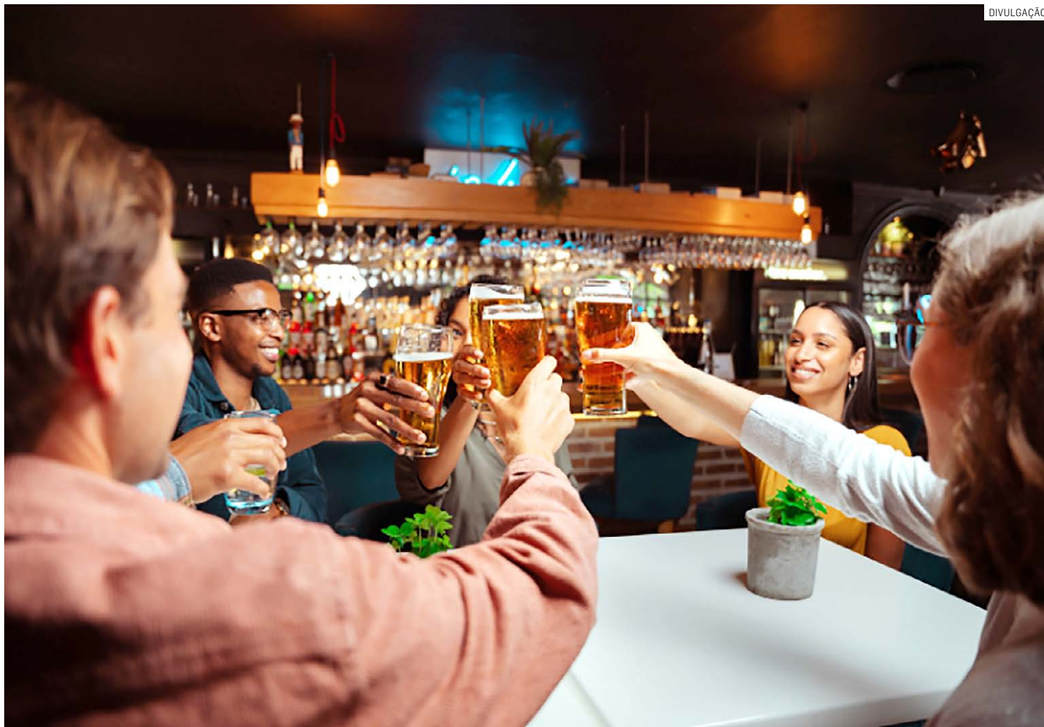
OTIMISMO: empresários do setor gastronômico da região esperam faturar mais neste mês por causa das festas de final de ano

“São características muito específicas deste período que geram um movimento adicional. Neste ano, a expectativa é de um