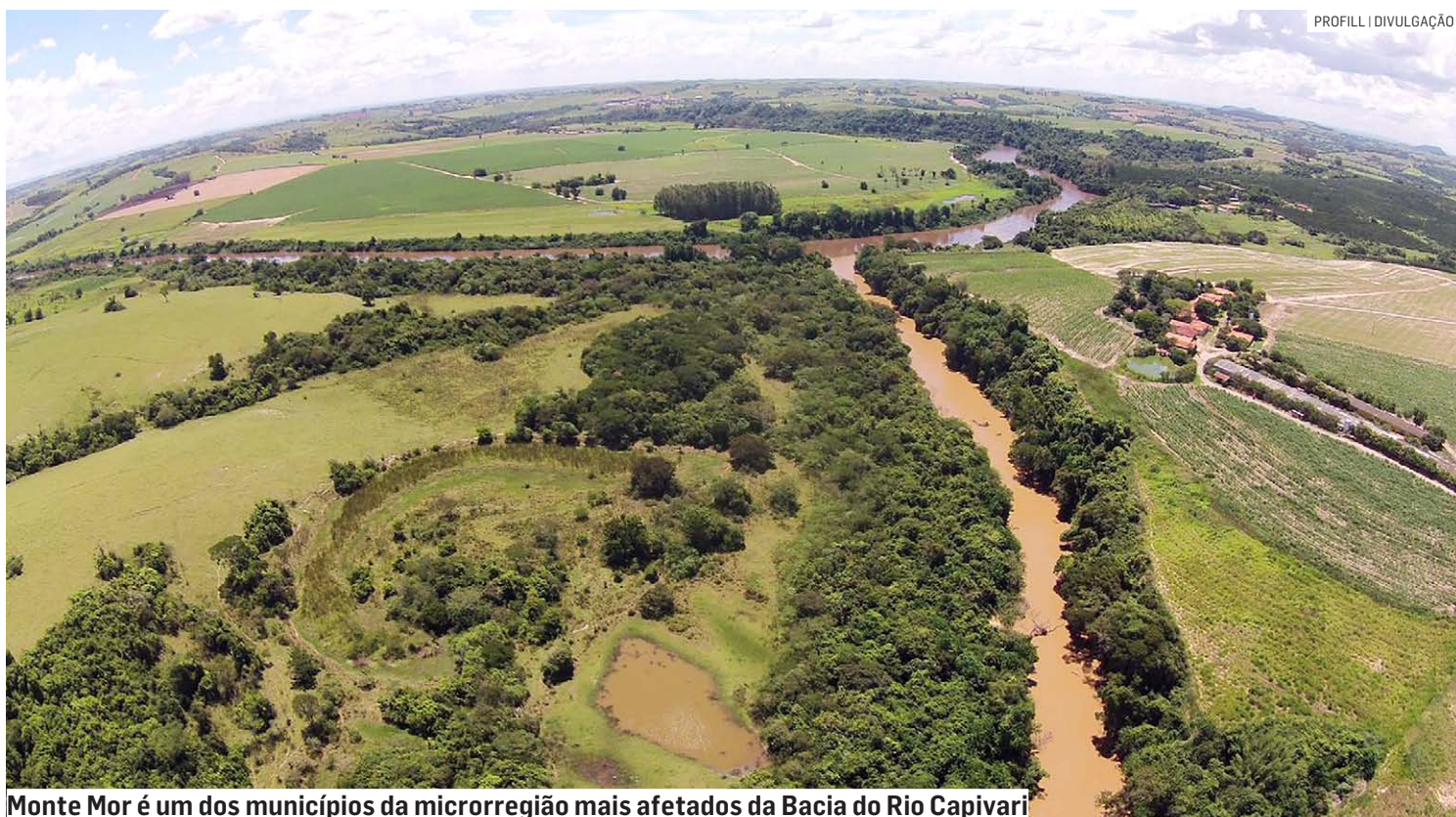
Monte Mor é um dos municípios da microrregião mais afetados da Bacia do Rio Capivari