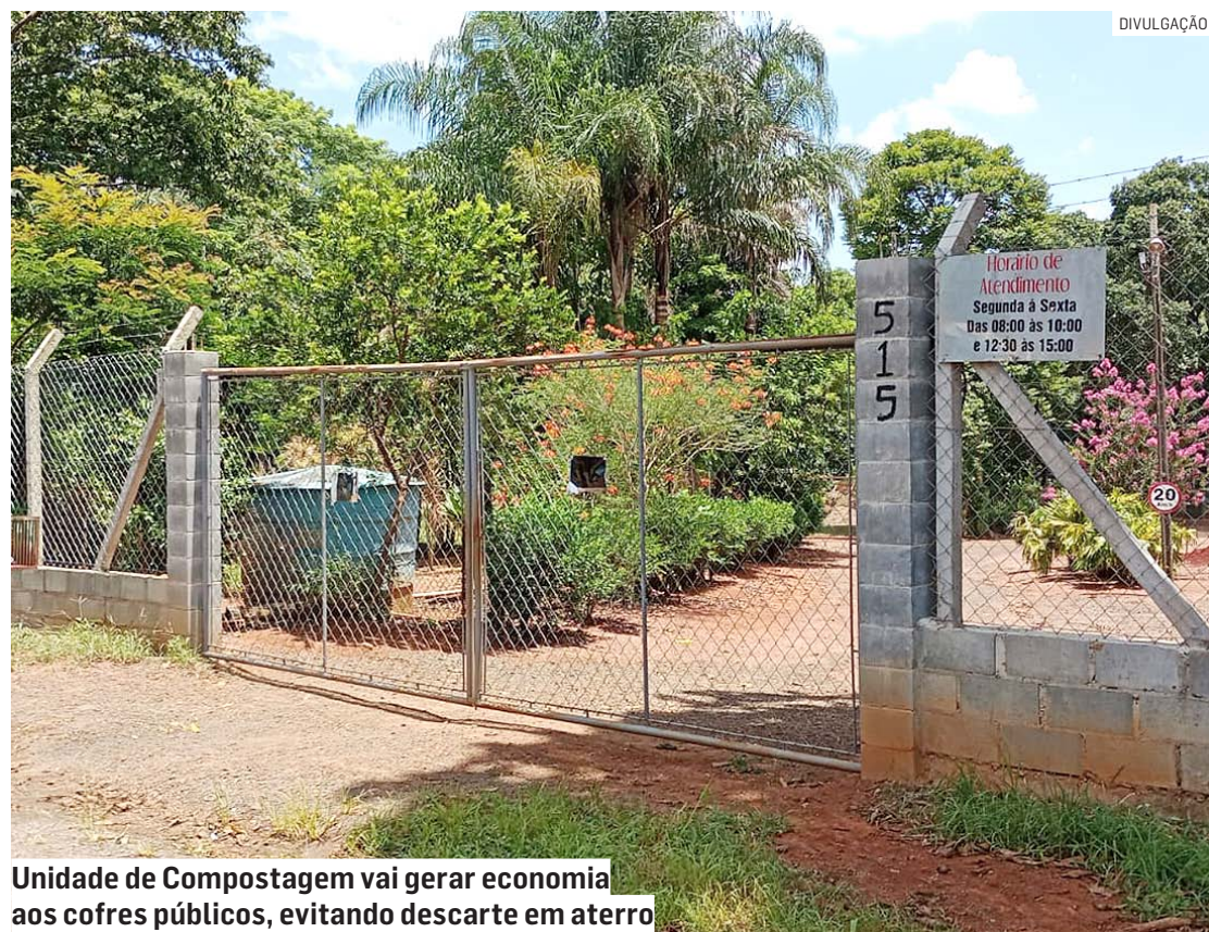
Unidade de Compostagem vai gerar economia aos cofres públicos, evitando descarte em aterro

O Viveiro do Guarapari foi selecionado pela equipe técnica da Secretaria de Meio Ambiente para receber a futura Unidade de Compostagem por se tratar de uma área municipal, pública, já totalmente cercada, com vigilância 24h por dia e infraestrutura mínima. Além disso, o adubo resultando do processo de compostagem tam-