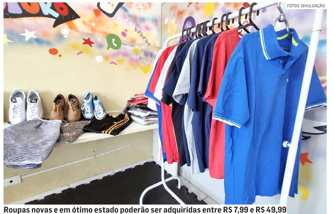
Roupas novas e em ótimo estado poderão ser adquiridas entre R$ 7,99 e R$ 49,99

Da Redação • SUMARÉ tribunaliberal@tribunaliberal.com.br